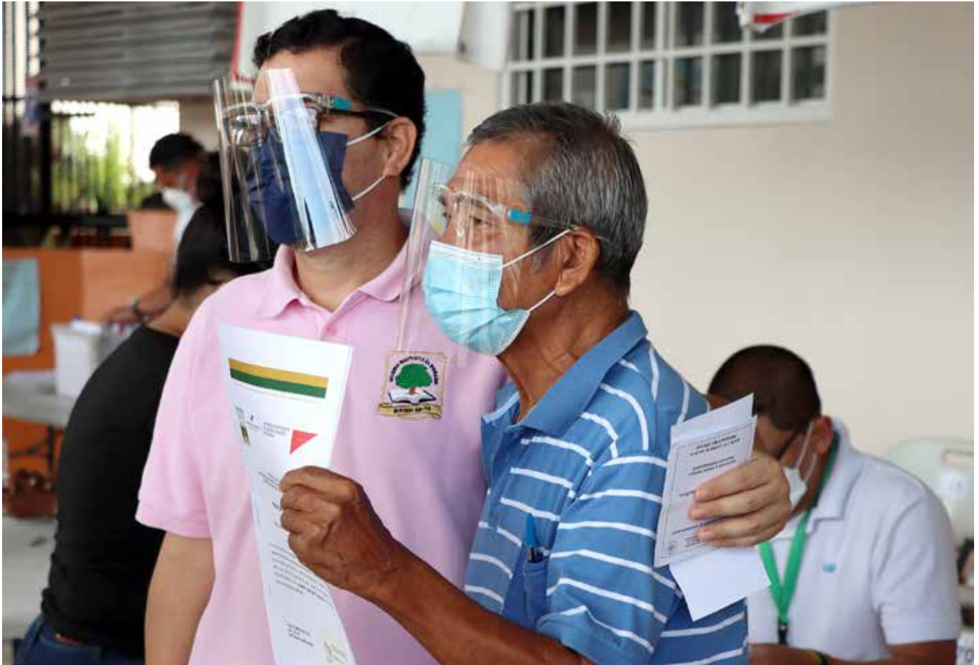
Padre e hijo, que esperaron por 40 años este documento, acudieron al llamado para recibir el título de propiedad.

Panamá sale adelante y, junto a esta reactivación, la Autoridad Nacional de Administración de Tierras (Anati) llevó a 6,603 familias de todo el país los títulos de propiedad de sus tierras, incorporándolas a la economía nacional y otorgándoles seguridad jurídica sobre sus predios. El martes 28 de diciembre culminó la jornada de entregas anuales beneficiando a 350 familias de San Miguelito en un acto donde se implementó el nuevo mecanismo que será utilizado