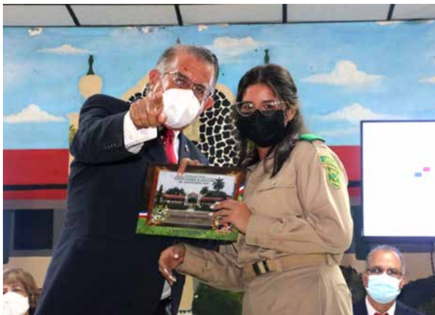
Valderrama felicitó al grupo de estudiantes y los exhortó a trazarse una meta.

El 8 de octubre de 2020, el presidente de la República, Laurentino Cortizo Cohen, sancionó la ley que reestructuró y modernizó el INA transformándolo en el ITSAA.