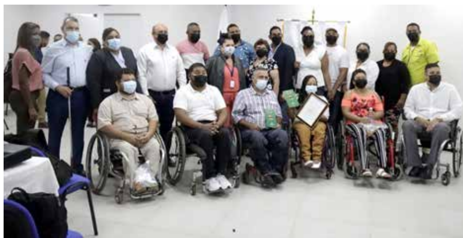
La entidad rectora del cooperativismo abrirá en enero una oficina de enlace en La Chorrera, que atenderá a las cooperativas de Panamá Oeste.