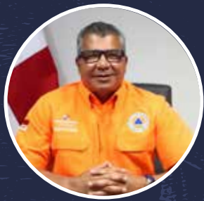
Carlos Rumbo Director general del Sistema Nacional de Protección Civil (Sinaproc)