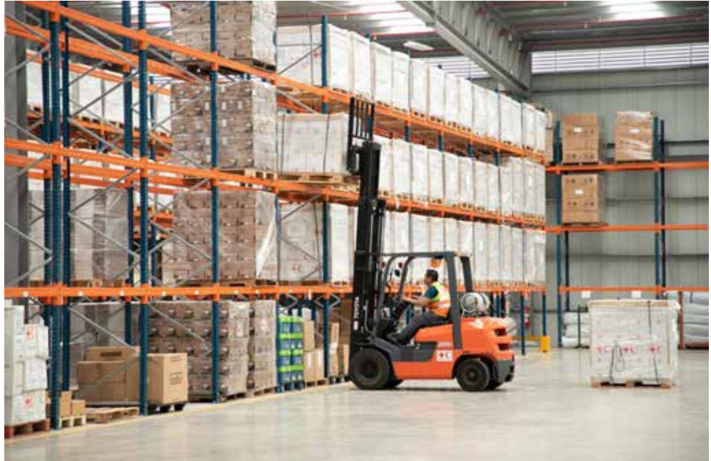
Centro de acopio del Hub Humanitario.

El Centro Logístico Regional de Asistencia Humanitaria (CLRAH) cumple la misión para la que fue creado y en estos últimos dos años ha enviado 3,438 toneladas de ayudas a diversos países del continente, aseguró la ministra de Gobierno, Janaina Tewaney Mencomo. En estos tiempos tan difíciles a nivel mundial, desde este Hub Humanitario se duplicó la carga al brindar al continente entero apoyo para enfrentar la pandemia generada por el Covid-19 y asistir a aquellas naciones afectadas por fenómenos naturales, como fueron los huracanes Eta e Iota. Según informes del CLRAH, en el 2018 la entidad manejó 886 toneladas de asistencia valorada en B/.8 millones; en el 2019 fueron 603 toneladas por un valor de B/.4 millones; en el 2020, se trabajó con 1,492 toneladas por un valor de B/.24.1 millones. De enero a noviembre de este 2021, se enviaron 1,946 toneladas de insumos, entre ellos equipos de protección personal, medicamentos, mantas, carpas, pruebas de Covid-19, unidades de almacenamiento móvil (MSU); kits de higiene, de cocina, de limpieza; mosquiteros, lonas plásticas, bidones colapsables (contenedores de agua que se pueden compactar) con un valor de B/.26.9 millones, a 38 naciones del continente.