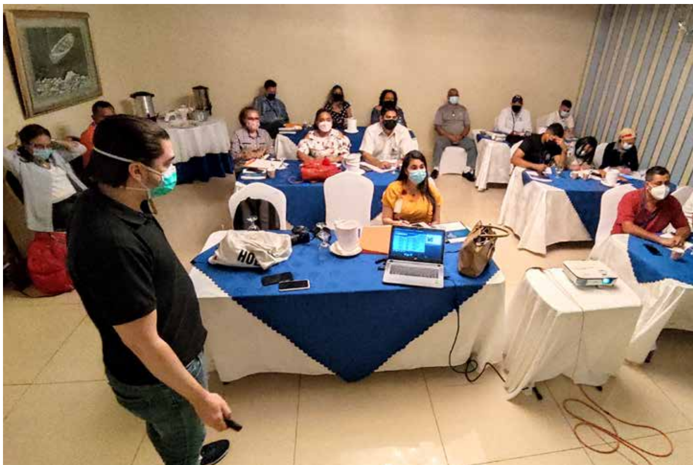
Participaron profesionales especializados en salud y seguridad ocupacional de las provincias centrales.

El objetivo principal fue instruir a los higienistas industriales y ambientales sobre el uso de los contadores de partículas e instrumentos para pruebas rápidas de hongos y bacterias.