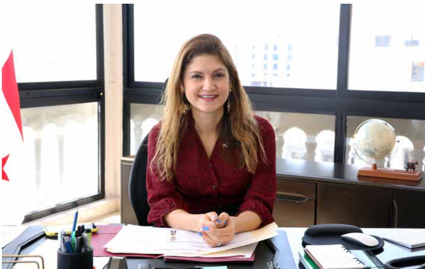
El Centro Adrienne Arsht para América Latina hizo entrega del reconocimiento a la canciller Erika Mouynes.

que impulsa el liderazgo y la participación de Estados Unidos, en asociación con aliados y socios, para dar forma a soluciones a los desafíos globales, promover el desarrollo y la gobernabilidad, la prosperidad, la estabilidad y la cooperación.