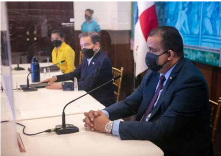
La primera sesión del grupo se acordó para el martes 11 de enero de 2022.

El presidente de la República, Laurentino Cortizo Cohen, en compañía de dirigentes transportistas y usuarios, instaló, el martes 28 de diciembre, una mesa permanente de trabajo con el objetivo de mejorar la calidad del servicio de transporte público en el país. La instalación de esta mesa de trabajo, integrada por representantes de la Cámara Nacional del Transporte (Canatra), el Consejo de Transporte del Interior (Cotradin), usuarios y representantes del Gobierno, se da tras un acuerdo pactado el pasado 9 de noviembre, entre el Gobierno Nacional y los dirigentes transportistas. “En un país democrático como Panamá, es importante cuando como panameños podemos sentarnos, escucharnos y buscar la manera viable de ir resolviendo los problemas. Esta es una decisión inteligente”, destacó el presidente Cortizo Cohen. Durante el acto, que tuvo lugar en el Salón Paz de la Presidencia de la República, el mandatario sostuvo que esta mesa del diálogo también ayuda al proceso de recuperación económica del país, que en la región ha sido el más exitoso en 2021. En tanto, Abel Obando, presidente de la Canatra, agradeció que el Gobierno Nacional, liderado por el presidente Cortizo Cohen, haya mirado hacia el transporte. “Usted nos abrió las puertas para que en una mesa del diálogo podamos presentar nuestras inquietudes y problemas; y no necesariamente hacerlo en las calles cerrando vías”, precisó Obando.