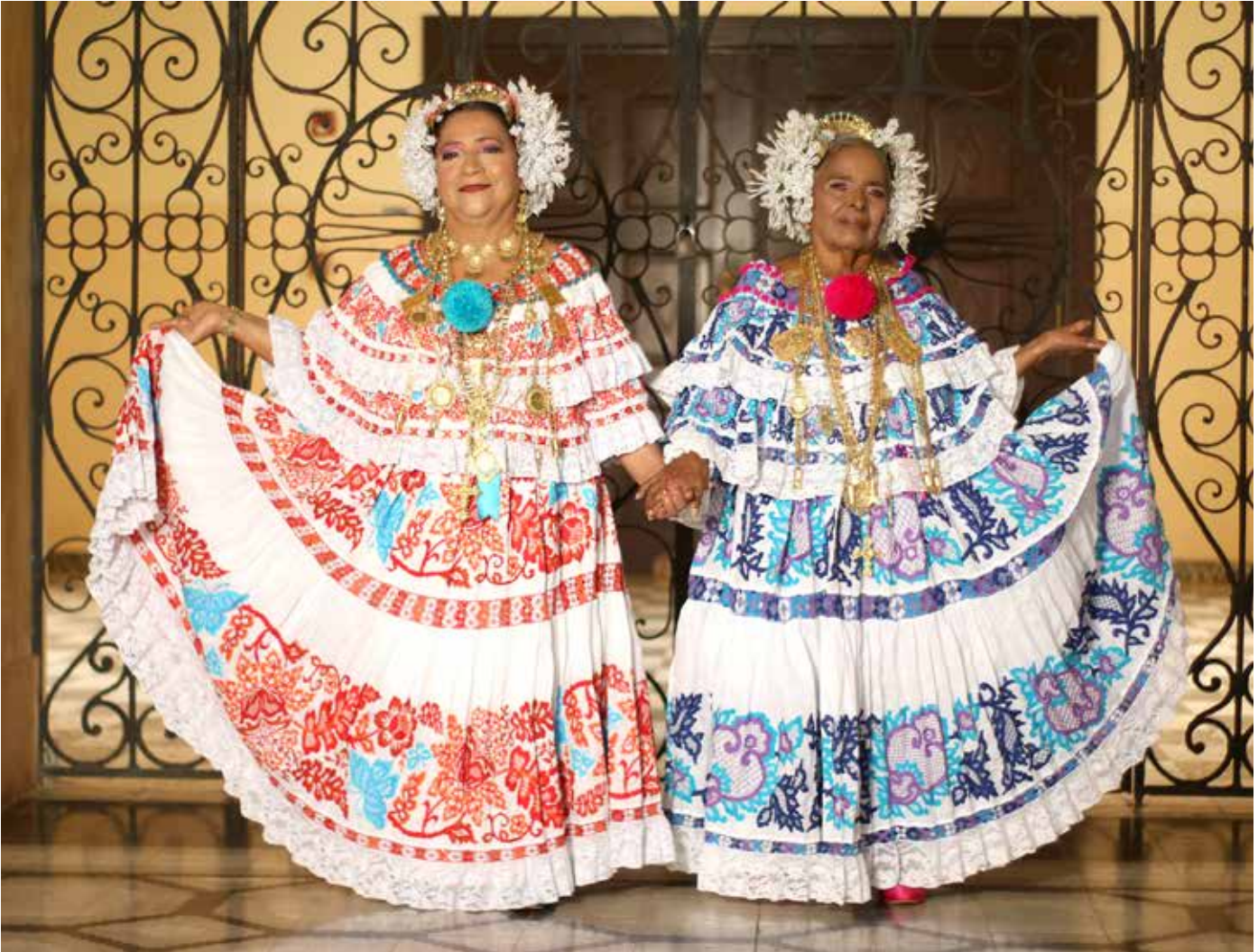
Damas veragüenses visten el traje típico nacional.

Entre las actividades que se desarrollan para promover la cultura en diversas partes del país, la Dirección Regional de MiCultura en la provincia de Veraguas desarrolló la iniciativa "Entre sueños y arandela", cuya convocatoria estaba dirigida a damas desde los quince años con el deseo de ataviarse con la pollera, la cual estaría acompañada de una hermosa sesión de fotos.