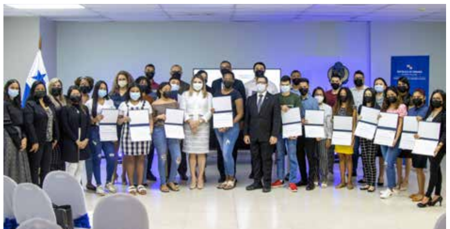
Participantes de las capacitaciones en habilidades socioemocionales para la vida y el trabajo.