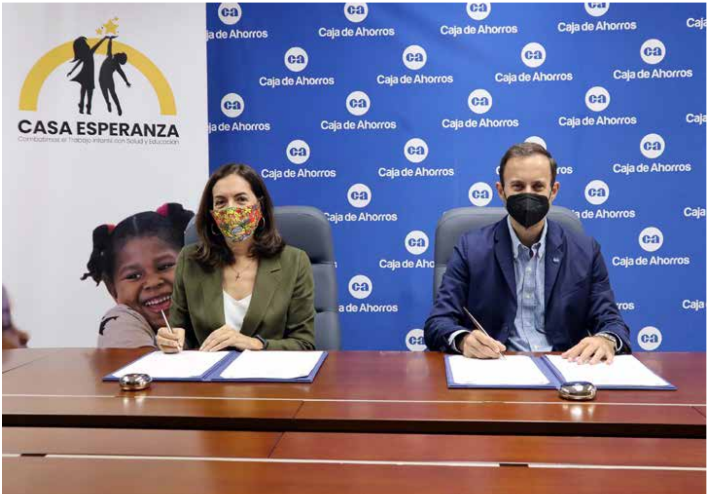
La Caja de Ahorros suscribió este acuerdo con la fundación Casa Esperanza.

Como organización comprometida con la educación de los niños panameños, Caja de Ahorros, a través del convenio con la fundación Casa Esperanza, busca fortalecer la implementación del programa “Casa Esperanza en tu Hogar”,