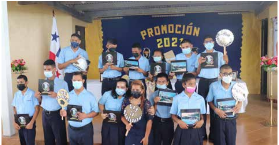
Los estudiantes tienen garantizado su derecho a una educación de calidad y en igualdad de oportunidades, de acuerdo con la Ley 25 de 10 de julio de 2007.

El objetivo de la educación especial es potenciar al máximo el desarrollo social, educativo y laboral para los niños, jóvenes y adolescentes que tienen necesidades educativas especiales.