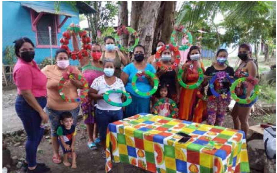
Para las flores, utilizan botellas plásticas y de latas.