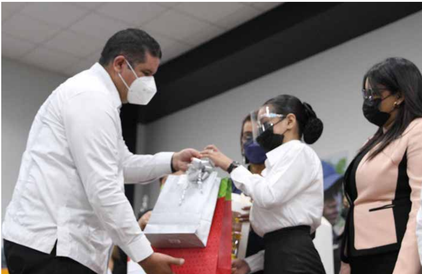
El ministro de Seguridad Pública, Juan Manuel Pino, entrega reconocimiento a la estudiante que ocupó el primer puesto de honor.

alto en esta promoción. Correspondió al ministro de Seguridad Pública, Juan Manuel Pino, felicitarlos en nombre del presidente de la República, Laurentino Cortizo Cohen, y exhortó a los 72 graduados a aprovechar la oportunidad de formarse y educarse, “mirando hacia el frente y con fe en el futuro”. La Academia Encontrando el Camino Correcto es un proyecto cuyo objetivo es minimizar la deserción escolar y darles a los jóvenes la posibilidad de educarse y evitar que terminen en manos de grupos delincuenciales.