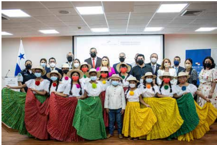
Representantes de la alianza público-privada de la red de empresas para la prevención y erradicación del trabajo infantil.