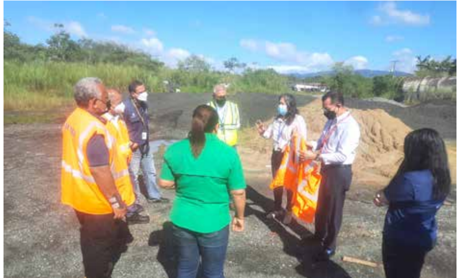
Personal del MIDA, Salud, MiAmbiente, Aeronáutica Civil y Tocumen, S.A. inspecciona el terreno.