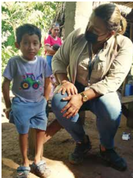
Una familia con tres menores que padecen la enfermedad conocida como "niños de cristal" también recibió asistencia.

Las ayudas incluyen, entre otros, enseres de cocina, máquinas de coser, congeladores, camas con sus respectivos colchones, kit de aseo y artículos personales, estufas, cortagramas, refrigeradoras, bolsas de alimentos, leche, pañales desechables y férulas.