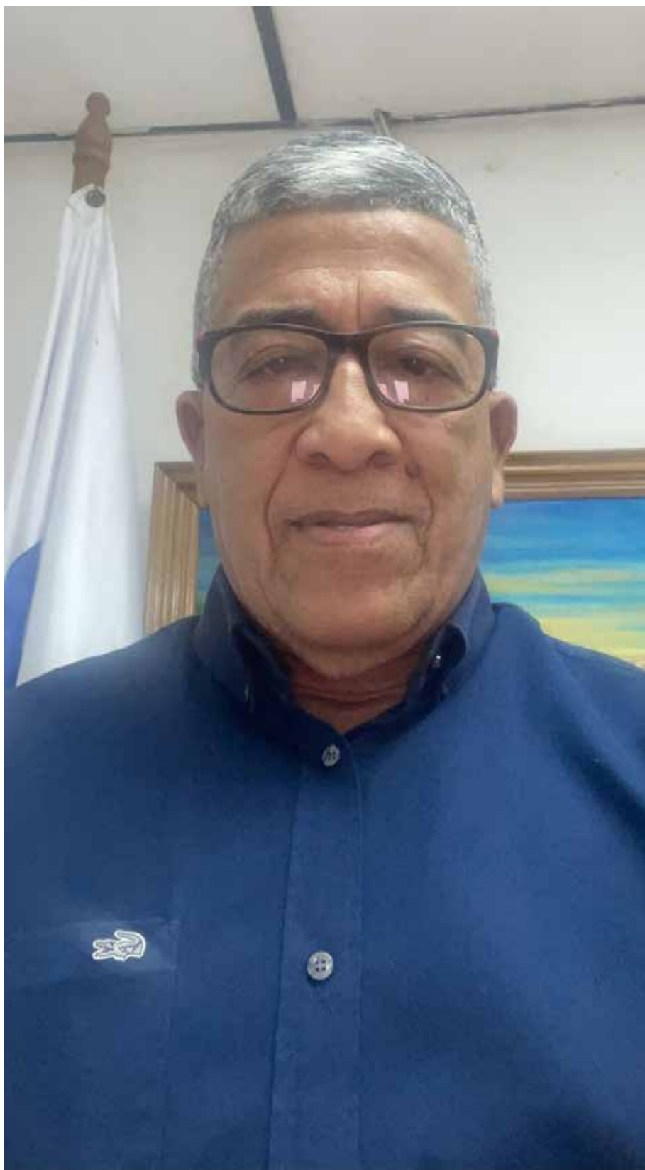
Avelino Ureña, director Nacional de Ganadería del Ministerio de Desarrollo Agropecuario (MIDA)

Con este programa buscamos solventar la necesidad de los pequeños ganaderos que, debido a problemas económicos y a la falta de orientación en el cruzamiento dirigido, no obtienen sementales de alto valor genético ni adoptan tecnologías de punta. También buscamos aprovechar la disponibilidad de material genético nacional de alta calidad, poco aprovechado, por la demanda de sementales, como resultado de la falta de recursos económicos de los pequeños productores con bajos recursos. Entre las razas de ganado de carne que hemos entregado están las cebuinas (Brahman, Nelore, Guzerat, sardo negro); las razas europeas de carne (angus rojo, brangus, beefmaster), y para el ganado de leche (Holstein, pardo suizo, gyr lechero, gilorando 5/8, 3/4 y jersey). Adicional a los sementales, hemos apoyado a los ganaderos con la distribución de 22,907 kilos de semilla gámica, por un valor de B/.197,161.50, para ayudarlos con la buena nutrición de los animales, a fin de que obtengan mejores rendimientos.