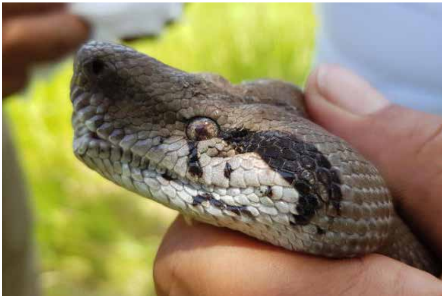
Las principales causas de estos incendios son: limpieza de terreno, caza y siembra agrícola.