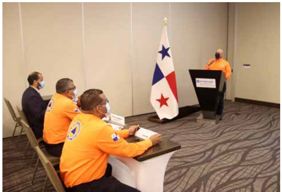
Seminario taller sobre la reducción de riesgos de desastres.