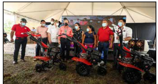
Tres organizaciones agrícolas del circuito 5-2 recibieron motozadas, a fin de hacer más eficiente su labor.