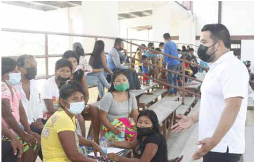
Gira de trabajo de la Onpar a Darién para atender solicitudes de refugiados.