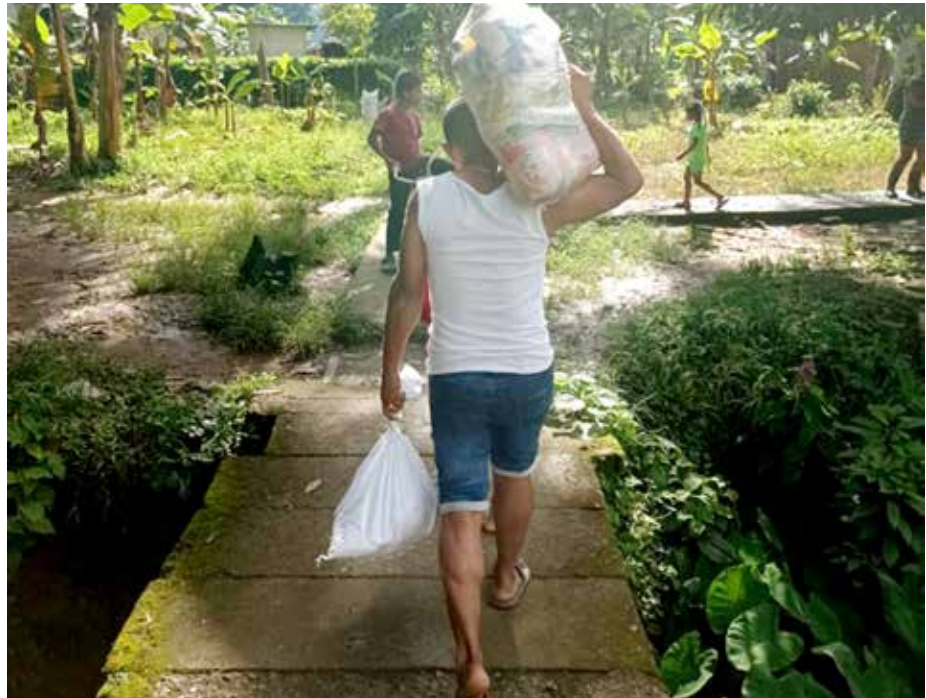
La Oficina de Enlace del Despacho de la Primera Dama en Veraguas lleva ayuda a hermanitos con enfermedad degenerativa.