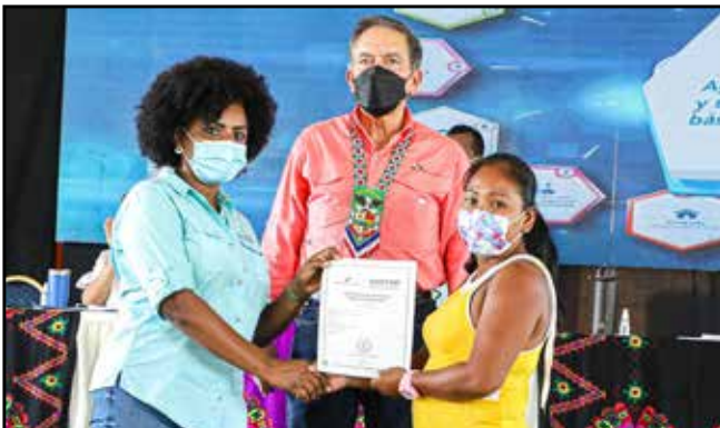
Ocho emprendedores recibieron certificados de registro empresarial para poner en marcha su pequeño negocio.