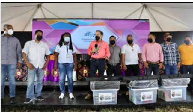
Seis centros de Lectura Colmena se entregaron a representantes de los corregimientos de Yapé, Cirilo Guainora, Lajas Blancas, Manuel Ortega, Jingurudó y Río Sábalo.