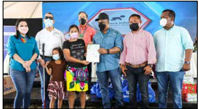
Para iniciar sus negocios, 15 personas con discapacidad recibieron capital semilla del programa FamiEmpresas por un monto total de B/.13,100.13.