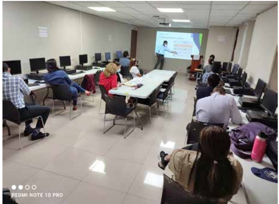
A partir de diciembre se impartieron capacitaciones a equipos técnicos y formuladores de proyectos sobre etiquetadores de cambio climático (ECC).

El manual permitirá al MEF y otras instituciones evaluar proyectos de inversión e identificar aquellos que cumplen con los criterios.