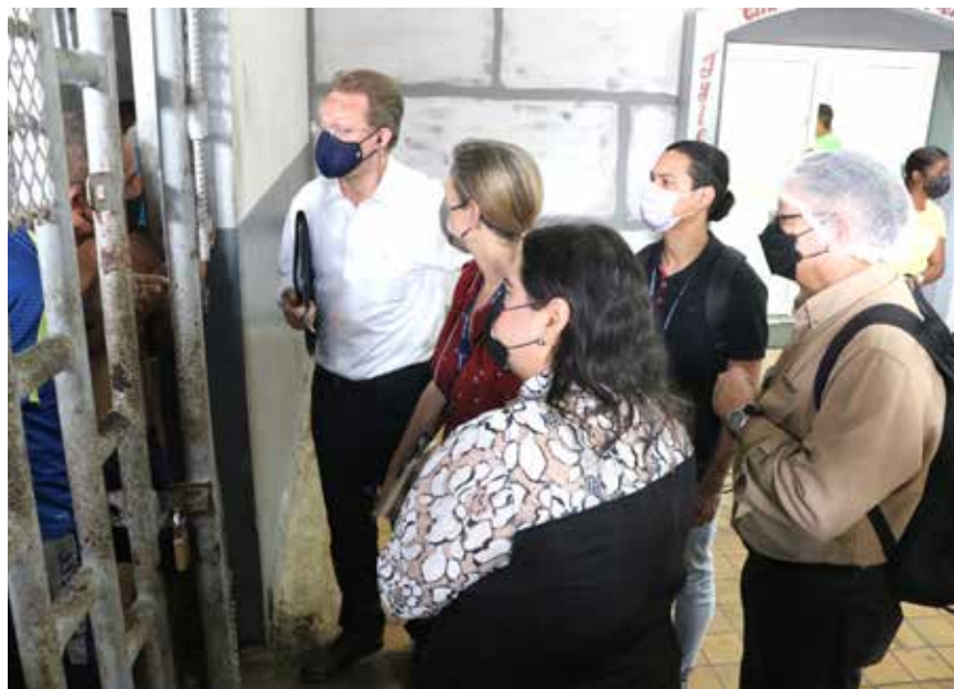
La jornada forma parte de la primera fase de entrevistas de expertos del John Jay College of Criminal Justice.

Esta iniciativa se lleva a cabo en El Salvador, Guatemala, Honduras y Panamá para contextualizar las experiencias de las personas privadas de libertad y proporcionar insumos para futuras políticas públicas.