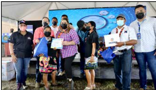
Del programa "Mujer Cambia Tu Vida", que impulsa el emprendimiento, se entregaron 25 kits de herramientas a mujeres.