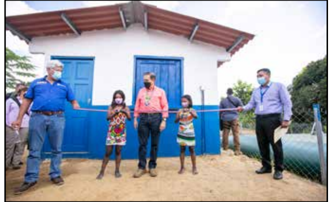
Se inauguró el sistema de cosecha de agua de lluvia del Centro de Educación Básica General El Salto de Chucunaque, a un de costo de B/.27,500.00.