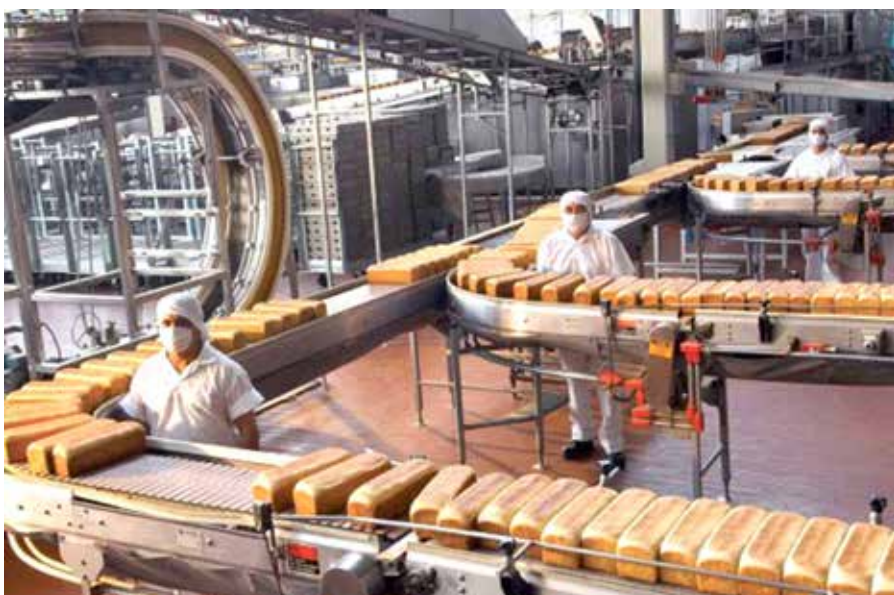
La modificación debe ser acordada y firmada por el empleador y la organización sindical o los trabajadores.

El Ministerio de Trabajo y Desarrollo Laboral (Mitradel), mediante el Decreto Ejecutivo No.73 del 28 de diciembre de 2021 sobre disposiciones relativas a los acuerdos de modificación temporal de la jornada de trabajo, establece que los empleadores que requieran aplicar la reducción de jornada de trabajo después del día 31 de diciembre de 2021, deben presentar de manera presencial los acuerdos de modificación ante la Dirección General de Trabajo de la sede o las Direcciones Regionales de la entidad. La modificación temporal de la jornada laboral debe ser acordada y firmada por el empleador y la organización sindical o los trabajadores donde no exista sindicato, y se aplicarán los mismos términos y condiciones para los trabajadores que realicen la misma función. Estos acuerdos tienen sustento en el artículo 159 del Código de Trabajo. Desde el 1 de enero, toda modificación de jornada que no cumpla con los requisitos contemplados en el Decreto vigente y con el registro en el Mitradel, será considerada nula para todos los efectos legales. La medida fue utilizada desde el inicio de la pandemia para preservar los empleos y su aplicación se ve reducida en la práctica conforme más actividades mejoran sus indicadores económicos.