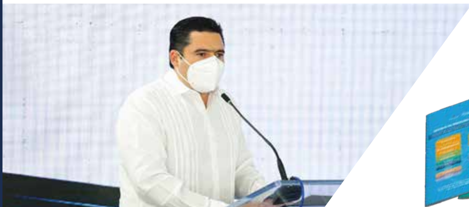
- S. E. José Gabriel Carrizo Jaén Vicepresidente de la República y Ministro de la Presidencia

88 INFORMES PUBLICADOS DE MANERA SEMANAL E ININTERRUMPIDA