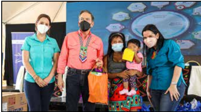
Con la finalidad de potenciar el desarrollo de la primera infancia, se otorgó cinco kits del programa "Tu Caipei en Casa" a niños de esta región indígena.