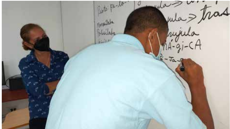
Jóvenes y adultos estudian dentro del programa de resocialización que lleva adelante el Sistema Penitenciario.

En base a los derechos humanos y el respeto a las normas establecidas por organismos internacionales, el Instituto de Estudios Interdisciplinarios (IEI) brindó la oferta académica con un total de 281 jóvenes estudiando en los diferentes centros de custodia y cumplimiento a nivel nacional, 10% en básica general, 54% premedia, 31% media y 5% en universidad. En cuanto a la población con medidas alternas a la privación de libertad, jóvenes y adultos, un grupo de 279 se encuentran estudiando: 53, en colegios oficiales; 40, en educación particular; 153 cursan el programa de jóvenes adultos; 25, en cursos vocacionales y 8, en universidades. El IEI, siendo la primera institución en administración de justicia de Centroamérica en implementar el Modelo de Intervención Integral para la resocialización de los adolescentes en conflicto con la Ley Penal, dio cumplimiento al Eje de Educación Formal aun en medio de la pandemia por Covid-19. Para fortalecer el proceso de enseñanza aprendizaje, se logró el establecimiento de alianzas estratégicas para la inserción educativa con el Centro de Educación laboral Buena Voluntad Panamá, Escuela de Cabuya, Centro Educativo de Jóvenes Adultos de La Chorrera, Centro Educativo Santa Isabel y el Instituto Panameño de Educación por Radio (IPER).