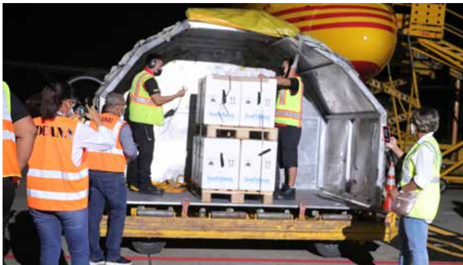
La viceministra Ivette Berrio recibió el primer cargamento de estas vacunas para inmunizar a la población entre 5 y 11 años.

El pasado domingo 2 de enero llegó a Panamá el primer lote de vacunas pediátricas de la farmacéutica Pfizer con un total de 60 mil dosis de vacunas. Con este lote, Panamá se convirtió en el primer país de la región en recibir dosis pediátricas contra la Covid-19. La jornada de vacunación pediátrica contra el virus dará prioridad a pacientes de entre 5 y 11 años con enfermedades crónicas e inmunosuprimidos, pacientes oncológicos, con diabetes crónica, VIH, con padecimientos cardiovasculares, entre otras enfermedades en los hospitales nacionales y regionales en las cabeceras de provincias y centros hospitalarios privados que apoyan la estrategia PanavaC-19. Dentro de poco, Panamá recibirá un segundo cargamento de dosis pediátricas contra la Covid-19 para seguir con la estrategia de vacunación y lograr tener un mayor número de niños y niñas inmunizados contra el virus antes del inicio del período escolar, en marzo próximo.