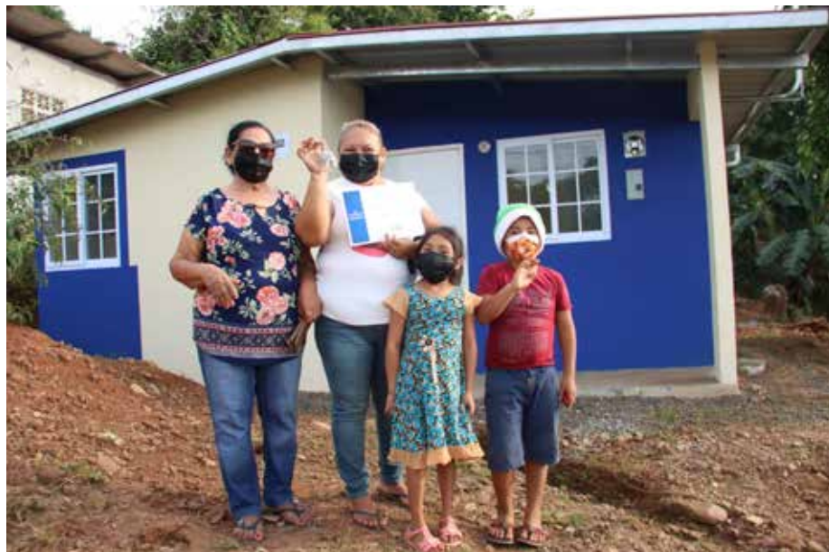
Las casas cuentan de sala-comedor, cocina, baño higiénico, lavandería y un portal.

Según el Departamento de Trabajo Social del Miviot, algunas familias vivían agregadas y en condiciones precarias.