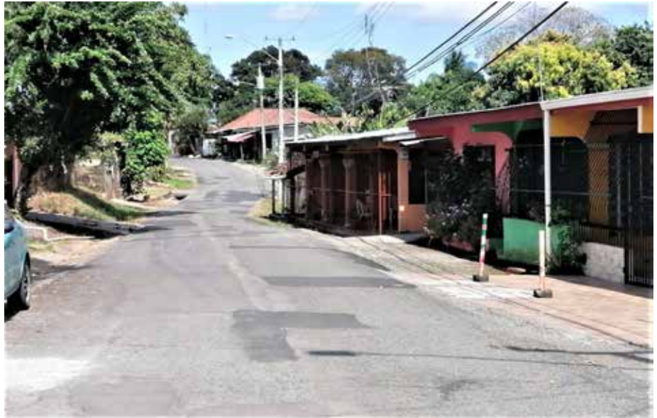
Los trabajos incluirán el diseño y construcción de la estructura de pavimento, cunetas pavimentadas, sistema de drenaje, aceras peatonales, entre otros.

Con la presencia del ministro y la viceministra de Obras Públicas, Rafael Sabonge y Librada De Frías, y autoridades locales de la provincia de Los Santos, se llevó a cabo el acto de licitación por mejor valor del proyecto “Diseño, construcción y financiamiento de calles y alcantarillado de Macaracas”, que contempla una longitud de 33.733 kilómetros. Este proyecto beneficiará a más de 2,500 habitantes del poblado de Macaracas y de las comunidades 11 de Octubre, Los Hatillos y Los Leales, cuyas actividades económicas se basan, principalmente, en brindar servicios a los sectores del comercio, la ganadería, la agricultura, porcicultura, avicultura; además, cuenta con centros de salud, escuelas, iglesias, bancos, instituciones gubernamentales, entre otras. Entre sus objetivos, este proyecto contempla realizar el estudio, diseño y construcción para el mejoramiento del sistema de agua potable y nuevo sistema de alcantarillado sanitario y tratamiento de las aguas residuales de Macaracas. También busca dar solución a la problemática del suministro de agua a través de un sistema de acueducto que les permita a todos sus habitantes mejorar su calidad de vida.