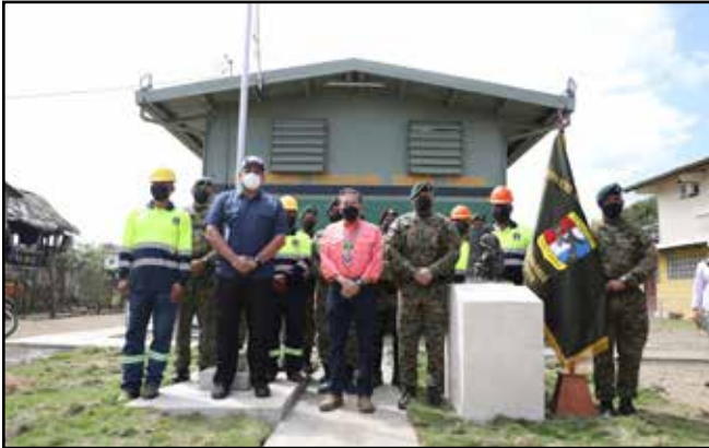
Con una inversión de B/.250,609.00, se entregó la nueva sede del puesto de vigilancia del Senafront en el corregimiento de Sambú, distrito de Chepigana.

Comunidades visitadas: Sambú, El Salto de Chucunaque, Cirilo Guainora.