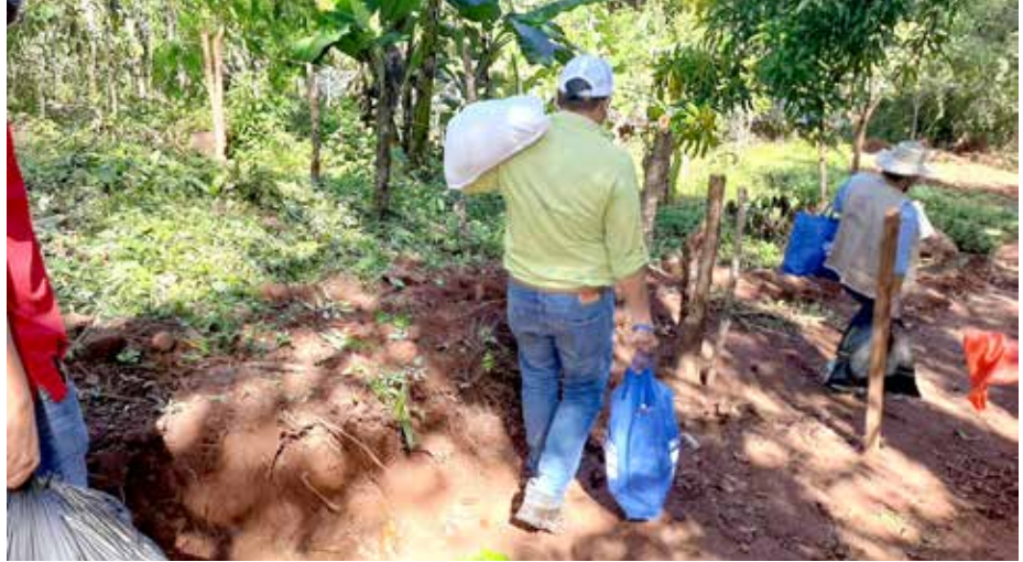
Se entregó alimentos, ropa y colchonetas a familia que lo perdió todo en un incendio.