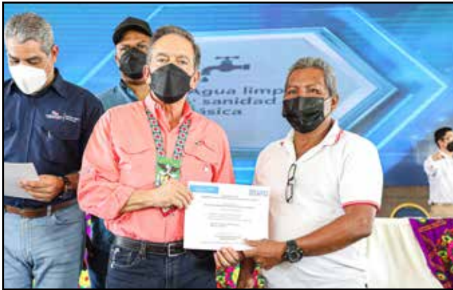
Las Juntas Administradoras de Acueductos Rurales de Lajas Blancas, Sambú y Unión Chocó recibieron bombas sumergibles de agua, clorinadores, filtros y pastillas de hipoclorito de sodio.