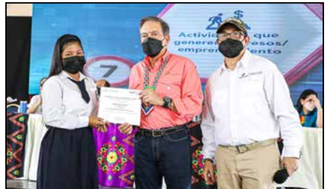
Diez participantes de los programas "Orienta Panamá" y "Género e Igualdad de Oportunidades" recibieron sus certificaciones tras culminar su adiestramiento laboral.