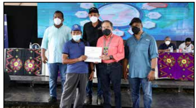
Se otorgó una lancha de 26 pies con motor fuera de borda a la Gobernación de la comarca Emberá Wounaan, cuyo costo es de B/.11,181.50.