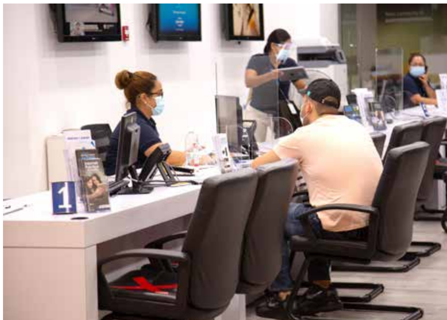
El Decreto Ejecutivo No.73 del 28 de diciembre de 2021 extiende la modificación de jornadas laborales.