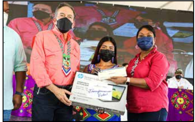
Estudiantes de la región recibieron becas, "laptops" y tabletas del programa Transformando Vidas, del Ministerio de la Presidencia.