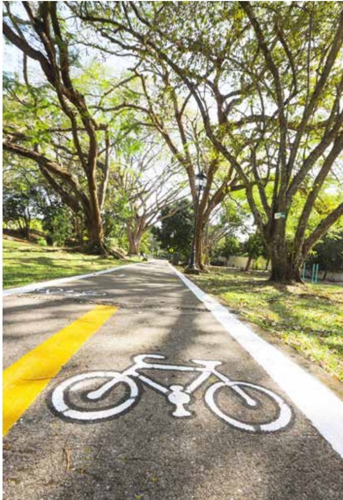
La nueva infraestructura vial infantil tiene una extensión de 1.1 kilómetros.