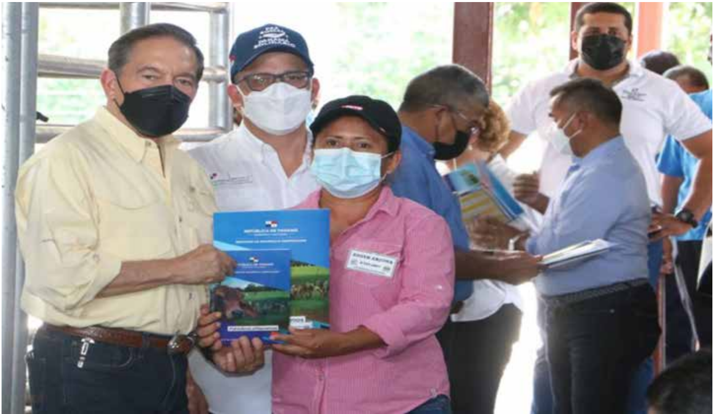
Los beneficiados son de David, San Juan, Potrerillos, Tolé, Las Lajas, San Andrés, Alanje y Gualaca.