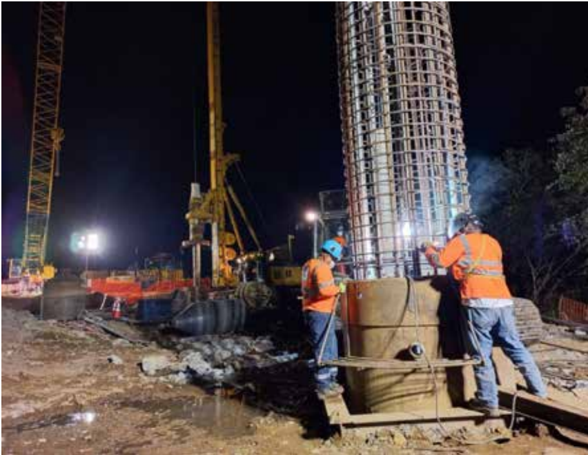
Con esta dinámica de trabajo se busca un mayor avance en el desarrollo de la obra.