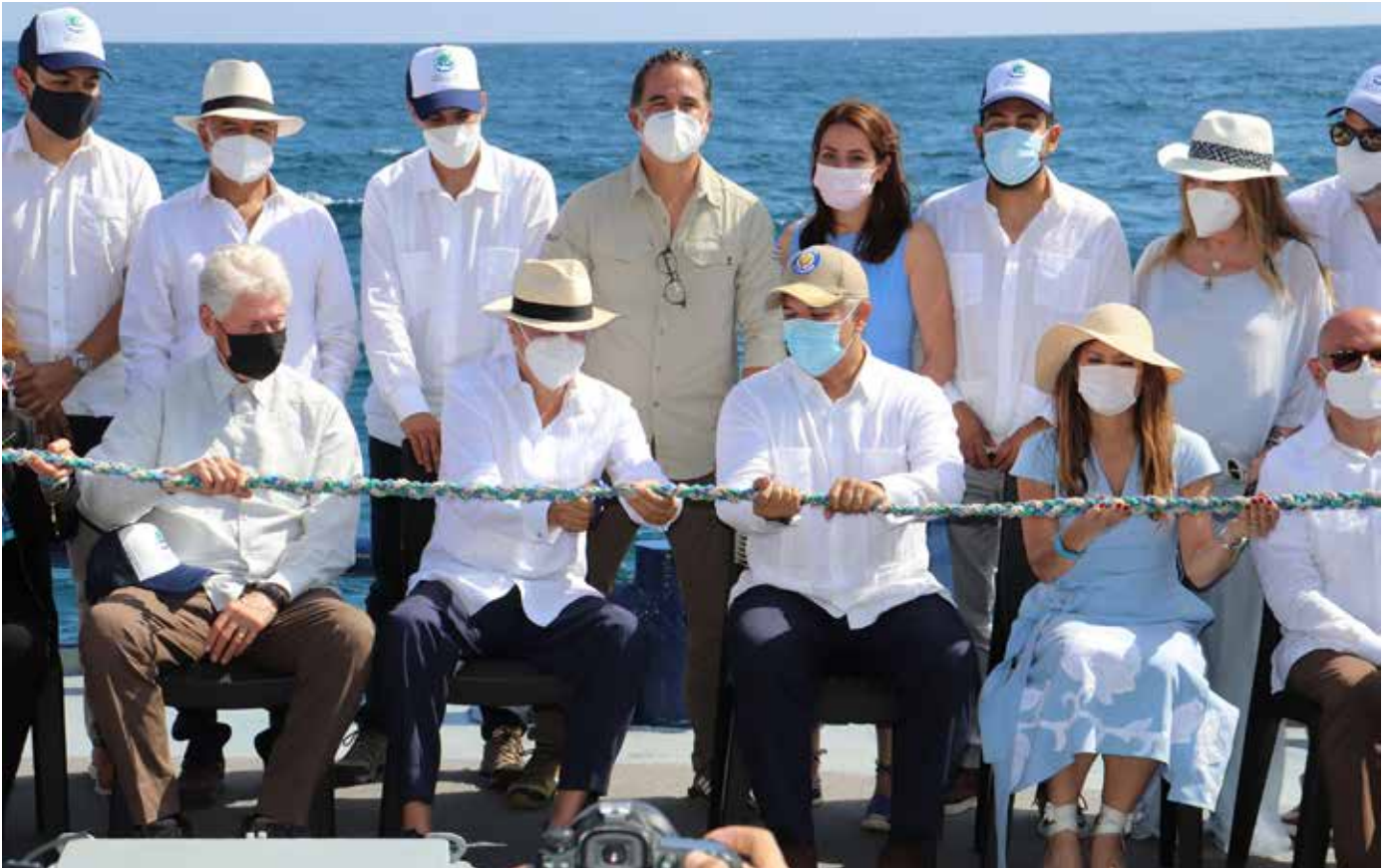
En representación del presidente Laurentino Cortizo Cohen, la canciller, Erika Mouynes, participó en la inauguración de la ampliación y nueva denominación de la reserva marina "Hermandad" en las islas Galápagos, Ecuador.

La ministra de Relaciones de Relaciones Exteriores, Erika Mouynes, participó en la inauguración de la ampliación y nueva denominación de la reserva marina "Hermandad" en las islas Galápagos, Ecuador, que se suma al compromiso de interconexión del Corredor Marino del Pacífico Este Tropical, impulsada por Panamá. La canciller reiteró el respaldo del Gobierno Nacional, que encabeza el presidente Laurentino Cortizo Cohen, a la ampliación de Galápagos que aumenta la protección del Corredor Marino del Pacífico Este Tropical, iniciada por Panamá con la cordillera de Coiba. El presidente Cortizo Cohen, junto