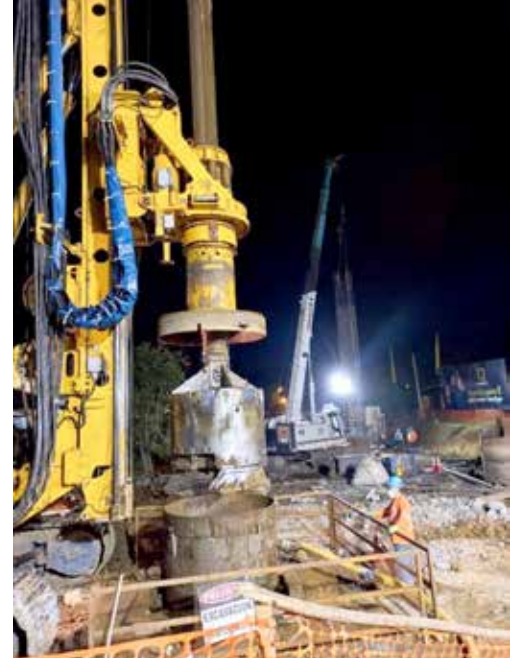
El pilotaje es uno de los trabajos que se continúa realizando en la estación.

La Estación Ciudad del Futuro es uno de los frentes de trabajo de la Línea 3 en la que se está laborando en horario diurno y nocturno para acelerar el cronograma de obra y materializar el sueño de más de 500 mil residentes de la provincia de Panamá Oeste, logrando elevar su calidad de vida y acortar el tiempo viaje. Durante las noches en esta estación se adelantan trabajos de pilotaje, acondicionamiento de terreno y movimiento de tierra. En cuanto al avance del proyecto, se han