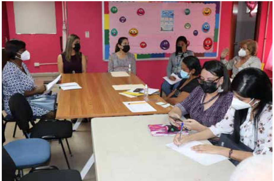
Equipos de trabajo de la Senniaf y del IPHE, junto a las directoras de ambas entidades, revisan las necesidades de los niños, niñas y jóvenes con discapacidad en el CAI de Tocumen.

Nueve niños con condición de discapacidad captados durante esta visita recibirán una evaluación y diagnóstico del equipo de psicología del IPHE.