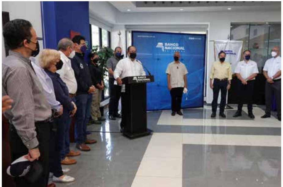
B/.1.1 millones se invirtió en la construcción y apertura de esta sucursal.

Enfocado en la optimización de los procesos y calidad de servicio a través de una mejor experiencia al cliente, Banco Nacional de Panamá inaugura oficialmente su sucursal 91 y lo hace en el distrito de Dolega, provincia de Chiriquí. Nuestro propósito es mantener activo el progreso de cada región, reforzando la actividad agropecuaria y el financiamiento empresarial. “La sucursal Dolega llega para resolver la alta demanda de clientes debido al impulso económico del área en los últimos meses, como nuevos comercios, proyectos de inversión y seguimiento al sector agropecuario”, expresó Javier Carrizo Esquivel, gerente general de Banco Nacional de Panamá. El acto inaugural contó con la participación del presidente de la República de Panamá, Laurentino Cortizo Cohen, quien destacó la labor de Banco Nacional de Panamá en el crecimiento de cada una de las regiones del país. “Para esta nueva sucursal se hizo una inversión de B/.1.1 millones, que incluye construcción y equipamiento con mobiliario, sistema de seguridad y tecnología”, agregó Carrizo Esquivel. La nueva sede se adapta a las tendencias operativas de la banca, con un moderno diseño arquitectónico y espacios creados para una mejor operatividad que permite ofertar sus productos y servicios a través de un modelo renovado de atención.