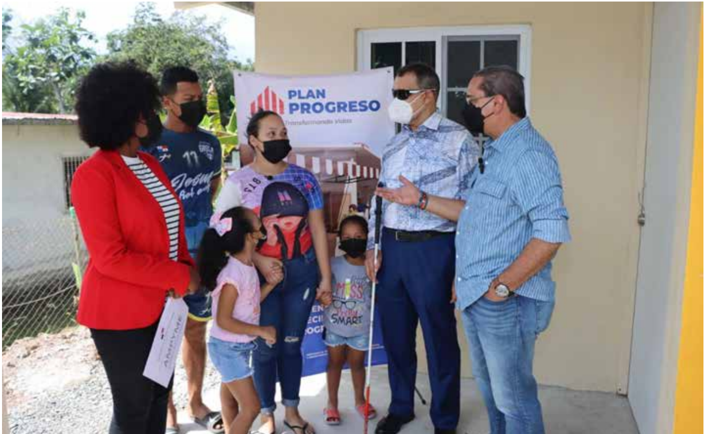
Los beneficiarios dispondrán de una vivienda con dos recámaras, sala-comedor, cocina y baño.

de recibir la vivienda, la familia habitaba de forma agregada en un anexo de la residencia de la madre de Falcón, ubicada en el sector No. 1 en Villa Grecia, en Las Cumbres.