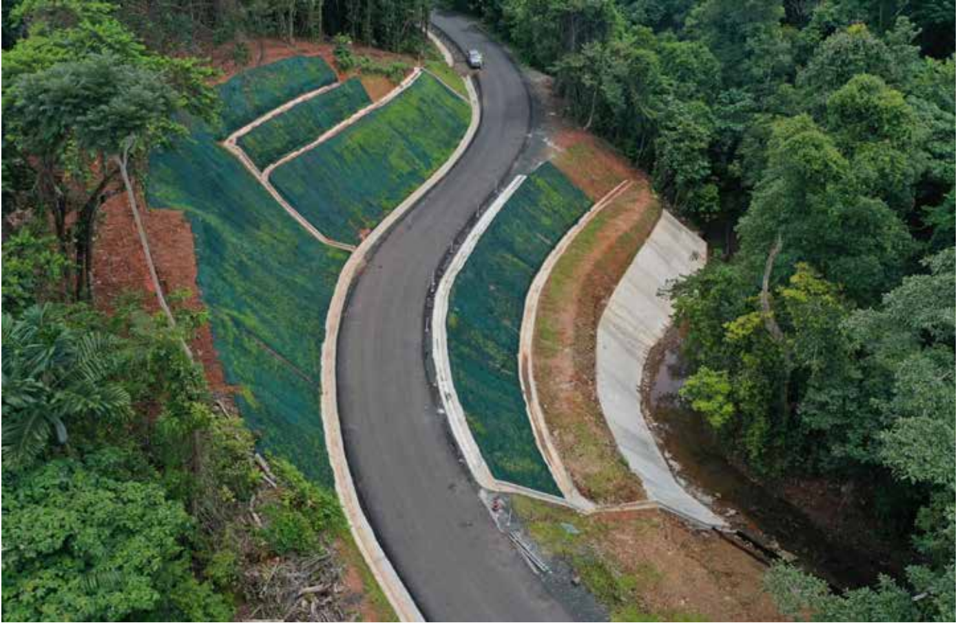
Rehabilitación del camino hacia el Fuerte de San Lorenzo.