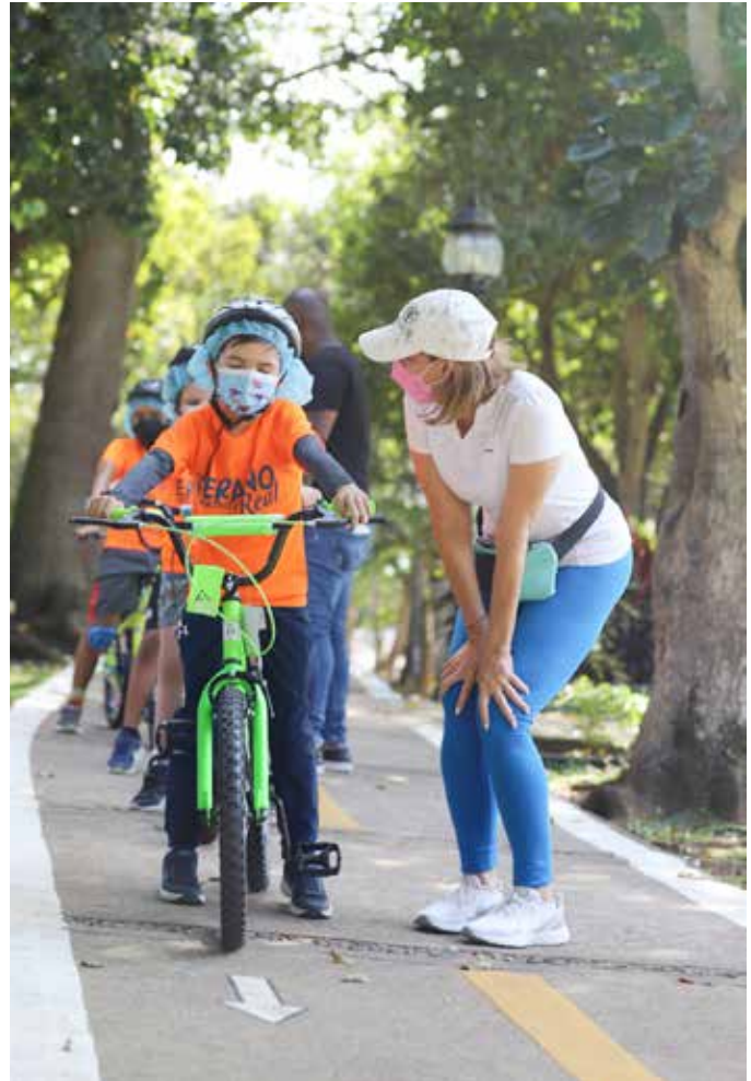
El evento fue inaugurado por la primera dama, Yasmín Colón de Cortizo.