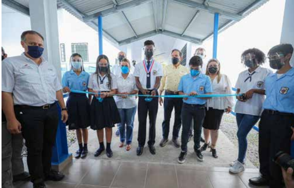
En este sector, el programa CON Escuelas tiene previsto rehabilitar 25 centros escolares para beneficiar a 1,370 estudiantes.