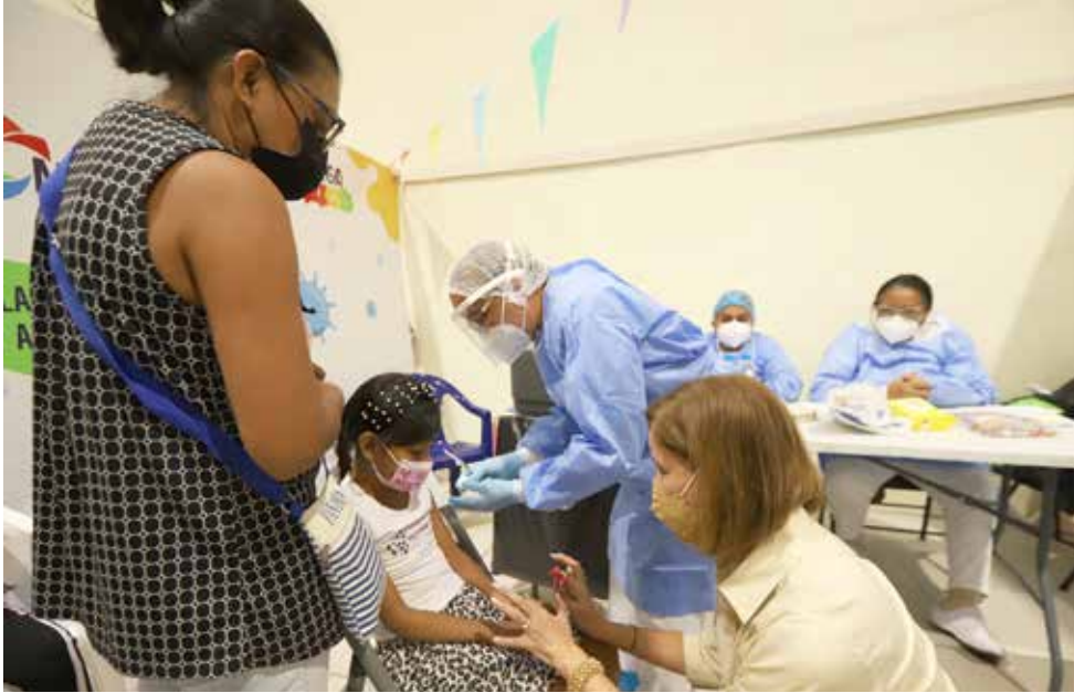
Niños de 5 a 11 años ya pueden recibir la vacuna pediátrica contra el Covid-19.