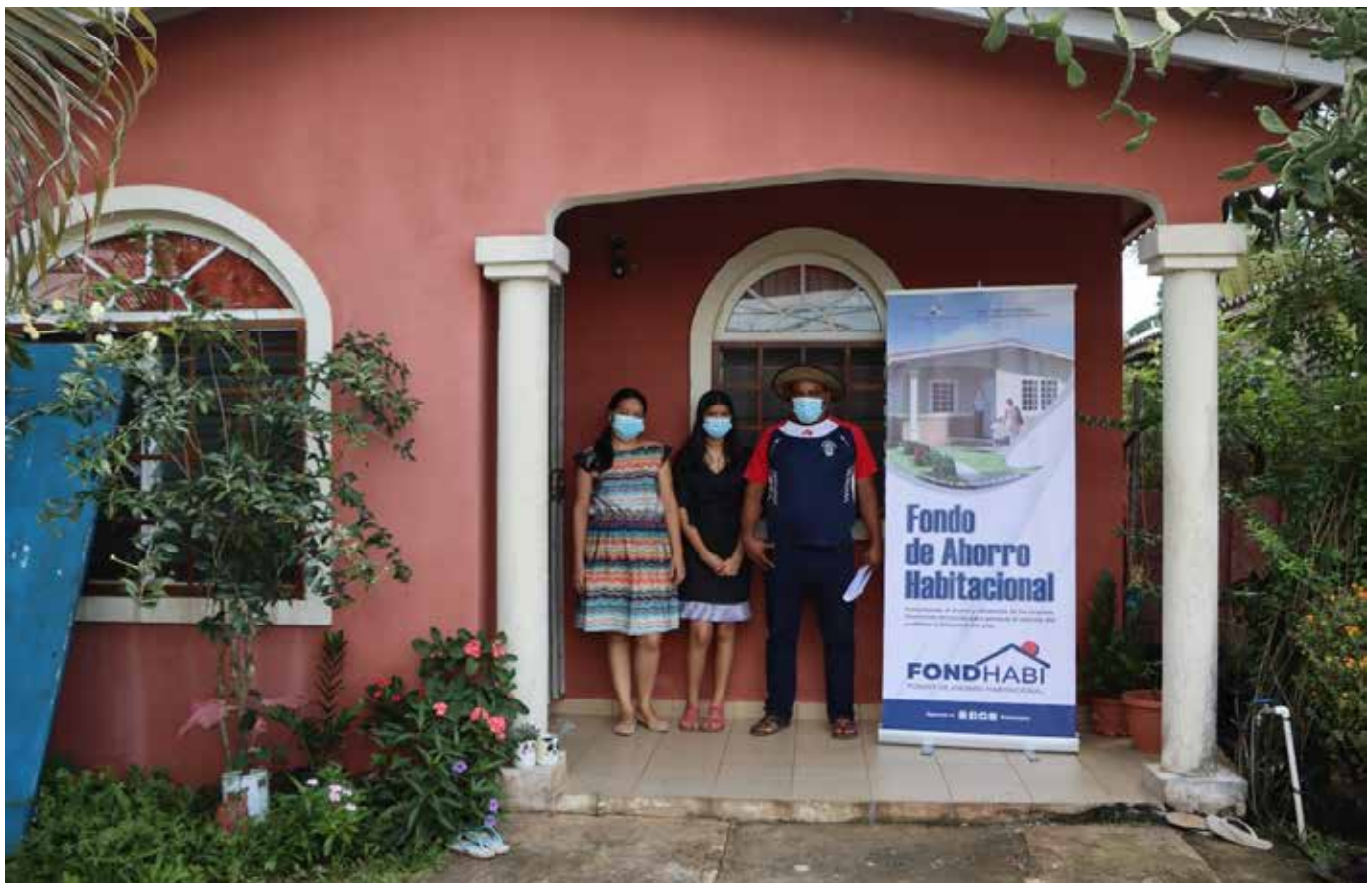
Las familias cubiertas con este programa forman parte del sector III, que incluye a personas de bajos ingresos.

de las viviendas para realizar la supervisión del buen uso de los fondos desembolsados.