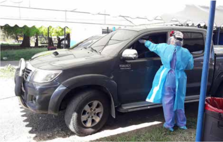
La Digesa redefinió los conceptos de contacto estrecho, cuarentena y aislamiento.