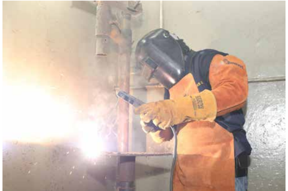
Este 17 de enero se inició el primer periodo de los cursos del Inadeh para el 2022.

El Instituto Nacional de Formación Profesional y Capacitación para el Desarrollo Humano (Inadeh) inició el 17 de enero su primer periodo de capacitaciones del 2022 con una programación de 2,100 cursos que responden a la demanda de personal calificado que requieren los sectores productivos. Cumpliendo con todas las medidas de bioseguridad, los 23 Centros de Formación Profesional del Inadeh empezarán a recibir en las tres jornadas a los participantes que cuenten con el esquema completo de vacunación, que de acuerdo con el Ministerio de Salud se establece en tres dosis. Para este primer periodo de formación, que se extiende hasta el 30 de marzo, se impartirán cursos de las áreas de Gastronomía, Tecnología de la Comunicación, Idiomas, Gestión Empresarial, Hotelería y Turismo, Agropecuaria, Mecánica Automotriz, Metalmecánica, Equipo Pesado, Logística, Portuario, entre otros. De acuerdo con Virgilio Sousa Valdés, director general del Inadeh, un número importante de capacitaciones se pondrán a disposición en la modalidad virtual para no detener el proceso de enseñanza y aprendizaje en medio de la pandemia Covid-19 y el proceso de reactivación económica que lleva adelante el Gobierno Nacional con el apoyo del sector privado y gremios empresariales.