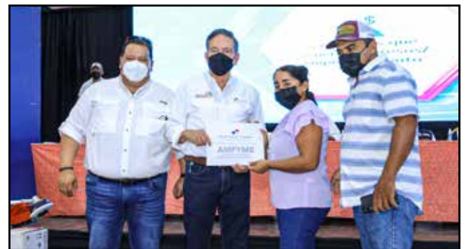
15 emprendedores de Mariato, Atalaya y San Antonio recibieron capital semilla por un monto de B/.30,000.00, para la puesta en marcha de sus negocios.