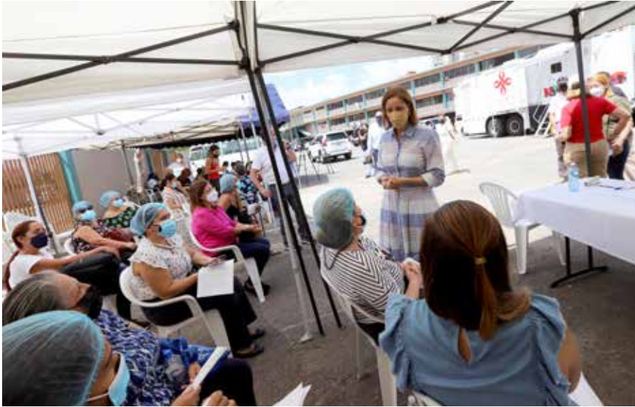
La primera dama de la República, Yazmín Colón de Cortizo, invita a las pacientes a acercarse al centro de salud más cercano e inscribirse.

Las Clínicas 'Salud Sobre Ruedas', del Despacho de la Primera Dama de la República, Yazmín Colón de Cortizo, iniciaron su recorrido 2022 y la primera parada fue en el corregimiento de Betania. Del 2 al 11 de febrero, dos de las clínicas móviles fueron instaladas en los predios del Instituto América, para brindar servicios de salud como mamografías, electrocardiogramas, exámenes de Papanicolaou, entre otros. En esta primera jornada en Betania, se realizaron 189 mamografías, 80 electrocardiogramas y 50 exámenes de Papanicolaou. Posteriormente, 'Salud Sobre Ruedas' se trasladó, del 14 al 18 de febrero, al Centro de Salud de San Martín de Pacora, en Panamá Este, donde se realizaron 73 mamografías, 115 electrocardiogramas, 51 pruebas de Papanicolaou y 13 pruebas de VIH. Del 21 al 24 de febrero, el programa llegará al Centro de Salud de Paraíso. Los pacientes que deseen recibir algún servicio deben acercarse al centro de salud de su comunidad e inscribirse; los exámenes son gratuitos.