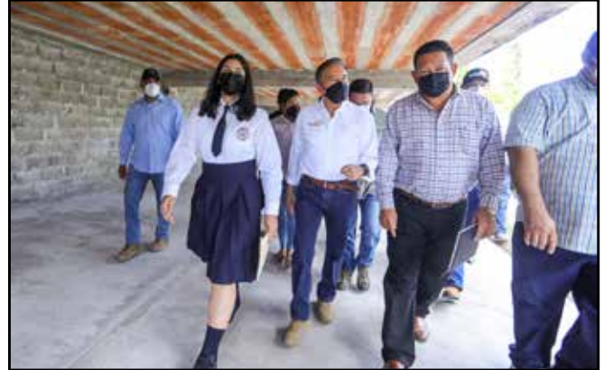
Se inspeccionaron los trabajos de adecuación en el Instituto Urracá, que incluyen estudio, diseño y desarrollo de planos, construcciones nuevas, adecuaciones y reparaciones.