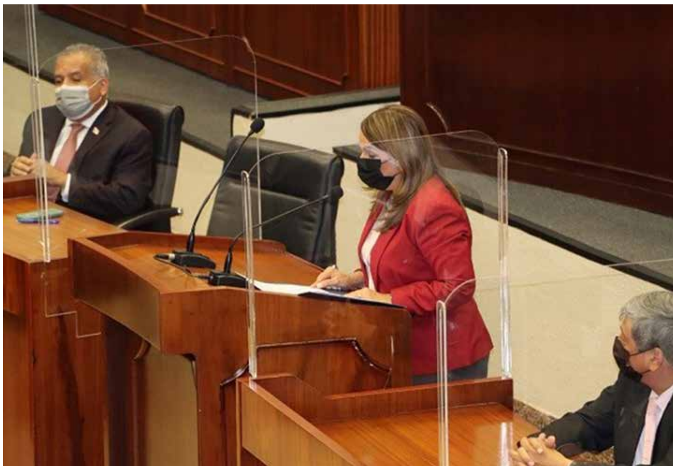
Las áreas de intervención están situadas en las comarcas Ngäbe Buglé, Naso Tjërdi, Bribí, Guna Yala, Emberá Wounaan y Bokotas.

El proyecto dará respuesta a las comunidades indígenas en sus demandas de educación superior; además, contribuye con el desarrollo profesional y la sostenibilidad en las distintas comarcas, territorios indígenas y regiones apartadas del país.