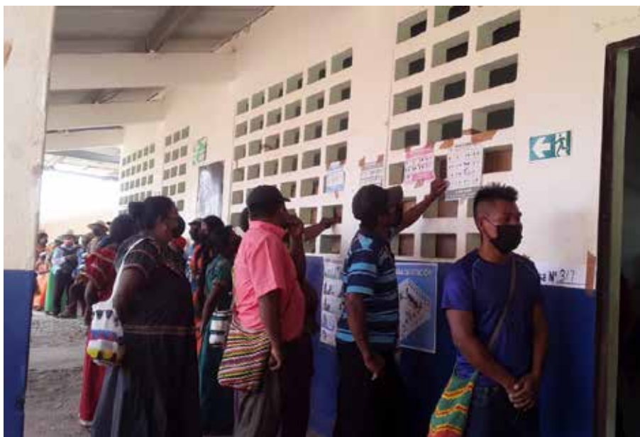
Fueron electos 384 delegados comarcales al Congreso General.

Con normalidad se desarrollaron las elecciones en la comarca Ngäbe Buglé para la escogencia de sus nuevas autoridades tradicionales, proceso en el que fueron electos 384 delegados comarcales al Congreso General, 192 mujeres y 192 hombres. Estos comicios son el resultado de un amplio diálogo con el Gobierno Nacional que se inició hace un año con todos los sectores de la comarca para llegar a un entendimiento y lograr sentar las bases del proceso. La mesa de diálogo arrojó como resultado la firma de un decreto por parte del presidente de la República, Laurentino Cortizo Cohen, para consolidar las normas que permitieran llevar a cabo una elección organizada y transparente. Según el Padrón Electoral Preliminar, estaban habilitados para ejercer el sufragio 78,491 mujeres y 82,477 hombres en la comarca más grande del país, en los 337 centros de votación y 493 mesas distribuidas en las tres regiones electorales, Ñö Kribo, Nidrini y Kadrini. El distrito con mayor población electoral es Müná, región Kadriri, en la provincia de Veraguas; en tanto, el corregimiento con más electores es Mancreek, distrito de Jironday, provincia de Bocas del Toro.