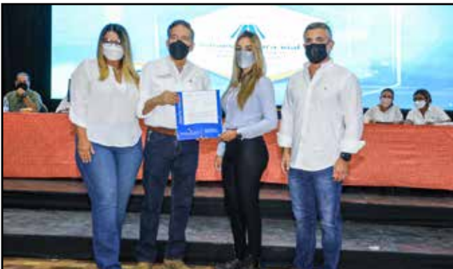
Se entregó orden de proceder para la rehabilitación de los caminos agropecuarios en esta provincia, con una inversión de B/.8,100,079.72.