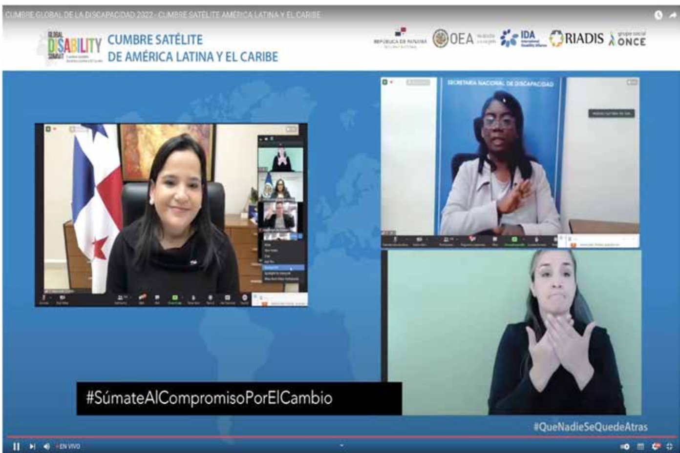
La cumbre virtual permitió reforzar los compromisos de los países de América Latina y el Caribe en temas de protección en favor de esta población.

organizaciones de la sociedad civil existentes con sostenibilidad y capacidad técnica. Además, hizo énfasis en que, desde antes de la pandemia, este grupo poblacional de la sociedad presentaba grandes desafíos que se han maximizado con la Covid-19, pero al mismo tiempo otras oportunidades se abren en estos tiempos y esta convocatoria ha permitido a los equipos técnicos vislumbrar un panorama real en el futuro.