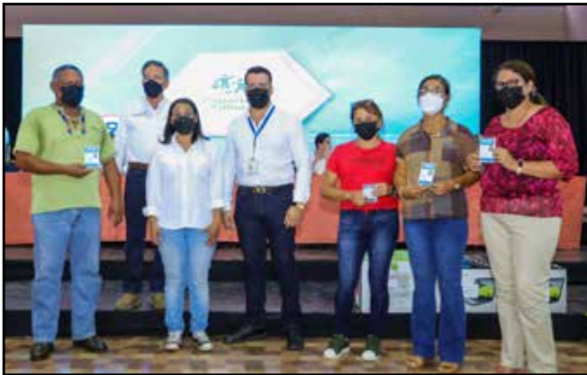
Se otorgaron 17 acreditaciones a artesanos y 2 reconocimientos de maestro artesano.