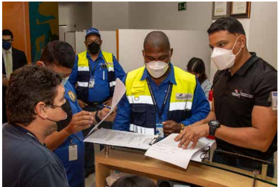
Es obligatoria la obtención de una licencia de operación emitida por el Mitradel.