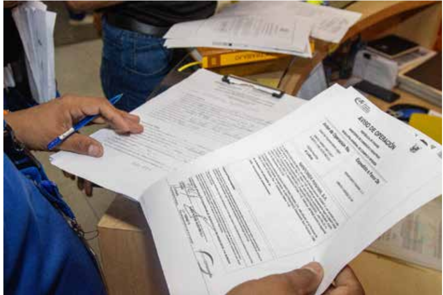
Se verificó el cumplimiento de las normas de regulación de estas empresas, establecidas en el Decreto No.32 del 15 de abril de 2016.