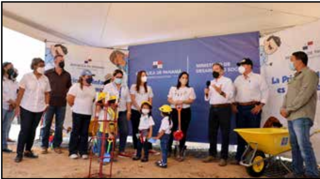
El mandatario presidió el acto protocolar de colocación de la primera palada para la construcción del CAIPI La Primavera, con una inversión de B/.335,311.88.