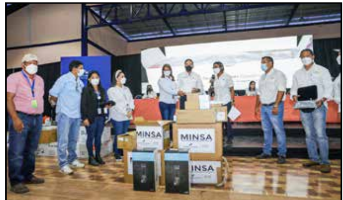
Las Juntas Administradoras de Acueductos Rurales de Atalaya y Río de Jesús recibieron clorinadores de línea, tuberías y pastillas de hipoclorito de sodio.