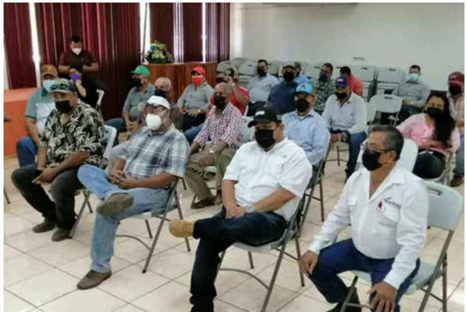
Productores de arroz y de frijol, durante el encuentro con las autoridades.