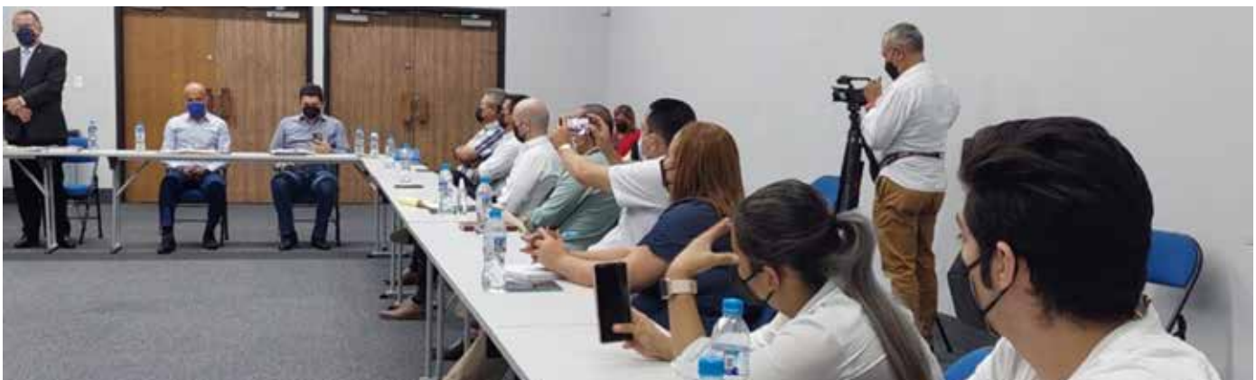
Los productores de cerdo se han visto afectados por importaciones de Estados Unidos contempladas en el tratado de promoción comercial.

del presidente Cortizo Cohen le lleva buenas noticias al sector agropecuario.