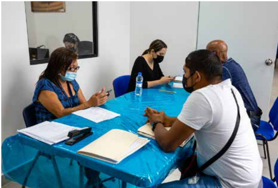
El Mitradel también cuenta con la opción digital Empleos Panamá.