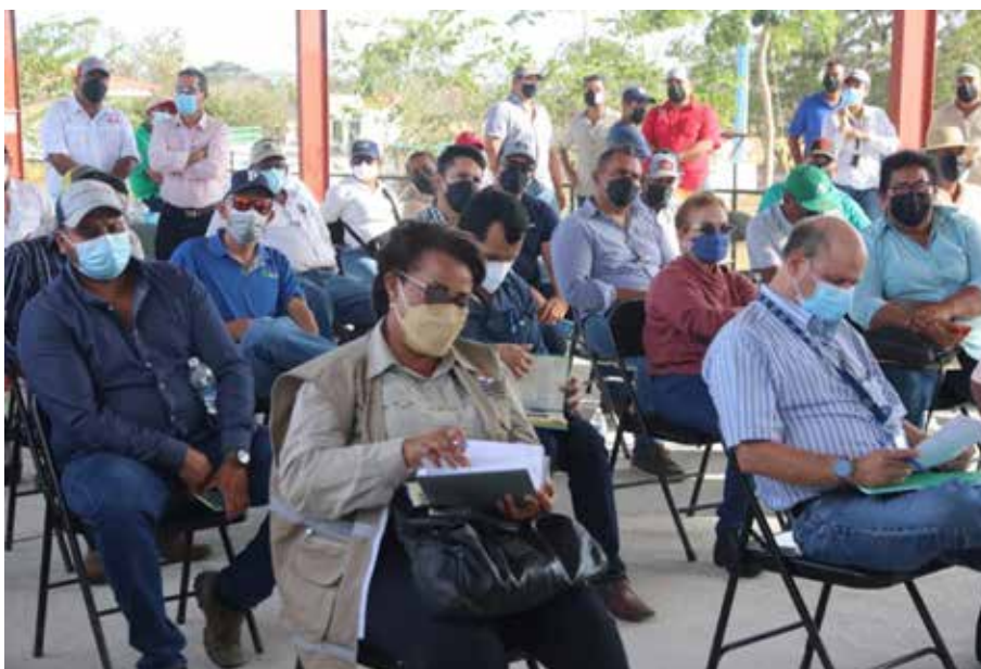
Los agricultores plantearon el encarecimiento de las labores de producción, debido al alza de los insumos, fertilizantes y transporte.