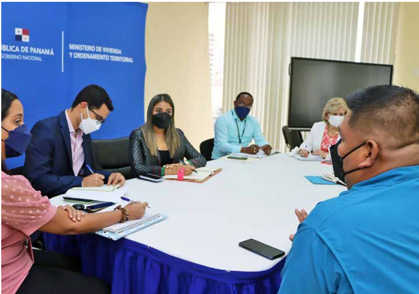
Las viviendas se construirán a través de los programas de Mejoramiento Habitacional, Plan Progreso, Vida y V-36, del Miviot.

municipales y locales de la comarca realizar una gira comunitaria de trabajo para observar en el campo la realidad y la necesidad de las familias de esa región.