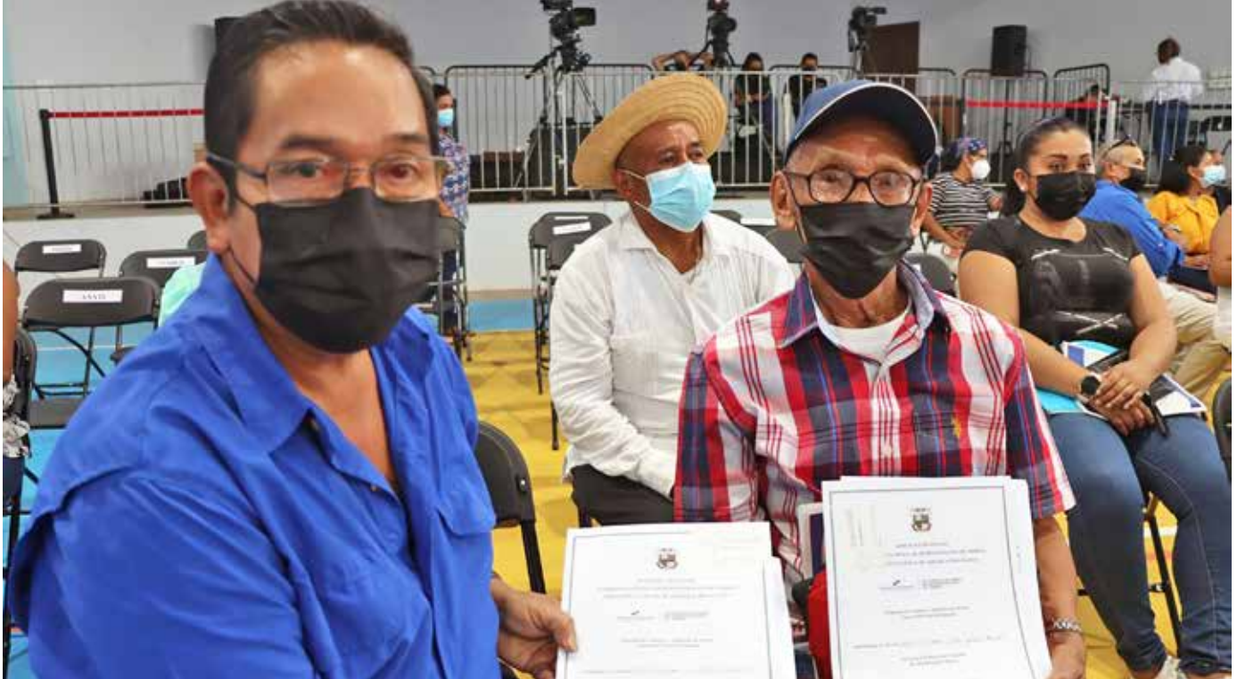
Padre e hijo acudieron a la Escuela República de Costa Rica para recibir sus escrituras.