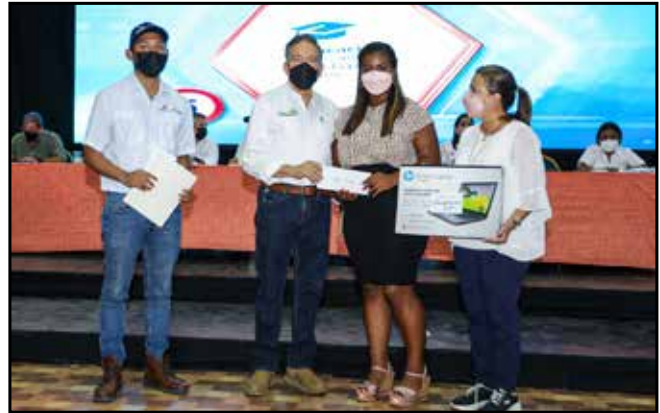
20 estudiantes universitarios del programa Transformando Vidas recibieron becas y "laptops".