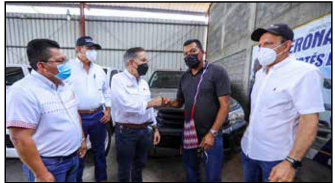
En la comarca Ngäbe Buglé, se entregaron vehículos a las juntas comunales de Bahía Azul, Bisira, Agua de Salud, Buenos Aires y Lajero.