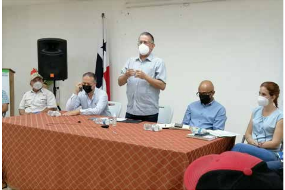
El ministro Valderrama, acompañado del gobernador de Chiriquí, Juan Carlos Muñoz; y la directora de Incentivos y Fideicomiso, Oriana Tack, entre otros.

Acuerdos como la compra de 20 mil quintales de frijol y agilizar los pagos de compensación de arroz, se lograron durante una reunión que sostuvo el ministro de Desarrollo Agropecuario, Augusto Valderrama, y su equipo de trabajo, con productores de arroz y frijol de la provincia de Chiriquí, luego de varias horas de negociaciones. Valderrama dijo que desde que inició esta administración se ha cumplido con el pago de compensación de precios de B/.7.50, y el primer año de la cosecha 2019-2020 se pagaron B/.54 millones; en la cosecha 2020-2021 fueron B/.67 millones y en la cosecha actual 2021-2022, ya se han pagado B/.13 millones. Agregó que se deben pagar B/.5 millones la próxima semana y prometió que, antes del 15 de abril, se debe haber pagado la totalidad de la deuda, porque los fondos existen, solo que hay que acelerar el trámite, porque el gobierno reconoce que los productores lo necesitan para seguir produciendo. En cuanto a la producción de frijoles, indicó que se ha incrementado y se han comprometido, a través del Instituto de Mercadeo Agropecuario (IMA), a adquirir unos 20 mil quintales a un precio de B/.75, por lo que el IMA negociará esta operación con las diferentes asociaciones para contribuir a que este producto salga y no se afecten los precios.