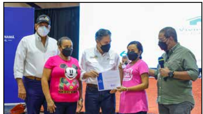
Por un total de B/.157,500.00, se entregó en los distritos Atalaya, Santa Fe, Cañazas y Santiago, 10 soluciones habitacionales, ocho viviendas y dos mejoras.