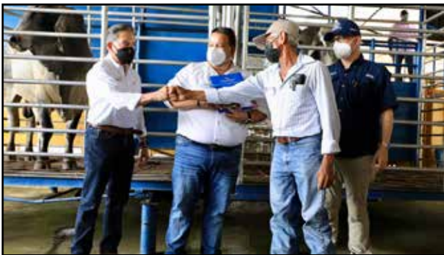
Pequeños productores de Montijo, Río de Jesús, Atalaya, La Mesa y Mariato recibieron 50 sementales de razas cebuinas, por un costo aproximado de B/.125,000.00.