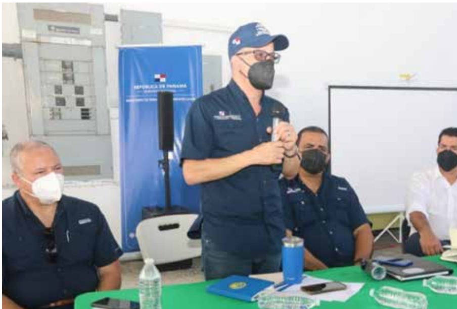
Por instrucciones del presidente Laurentino Cortizo Cohen, se organizaron giras para escuchar a los productores y buscar alternativas para contrarrestar el alza de los insumos.