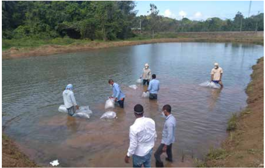
La siembra de tilapias es uno de los principales programas de resocialización que desarrolla el Sistema Penitenciario.

Se trabaja en una producción exitosa respetando los recursos naturales y preservando el medio ambiente, a la vez que se capacita a los adolescentes en la práctica de un oficio emprendedor enfocado en la resocialización.