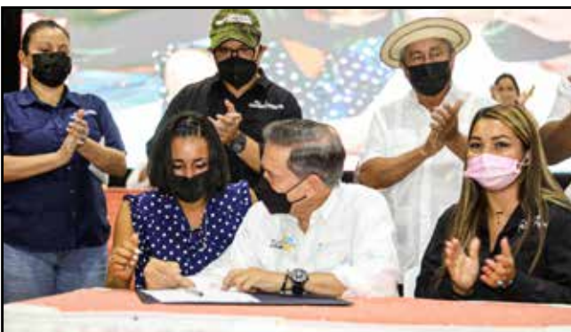
Se gestionó tres contratos de inserción laboral y, del programa de integración socioeconómica de las personas con discapacidad, se logró un nuevo contrato de trabajo.