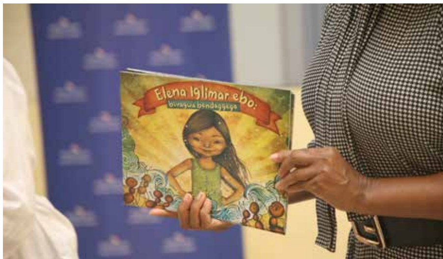
Primera edición del cuento “Elena y las hormigas: un equipo al rescate”.

La historia de “Elena y las hormigas”, traducida al ngäbere, dulegaya y emberá, recoge vivencias de los pueblos indígenas, las migraciones, el cuidado del medio ambiente y valores como la solidaridad y el respeto.