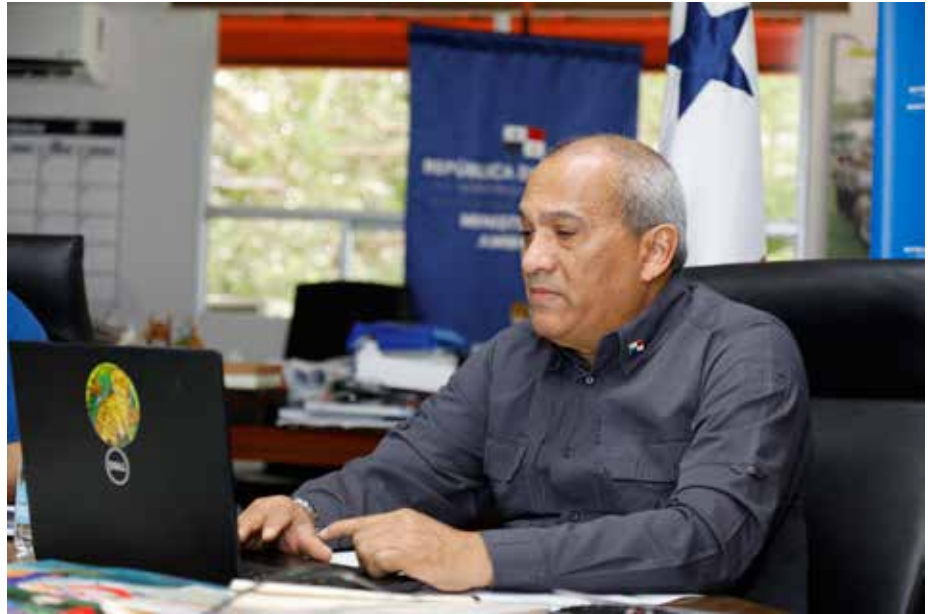
Milciades Concepción, ministro de Ambiente, presentó el estado de las políticas ambientales panameñas.

Los Estados miembros debaten la adopción de 17 resoluciones relacionadas al tema de la contaminación por plásticos.