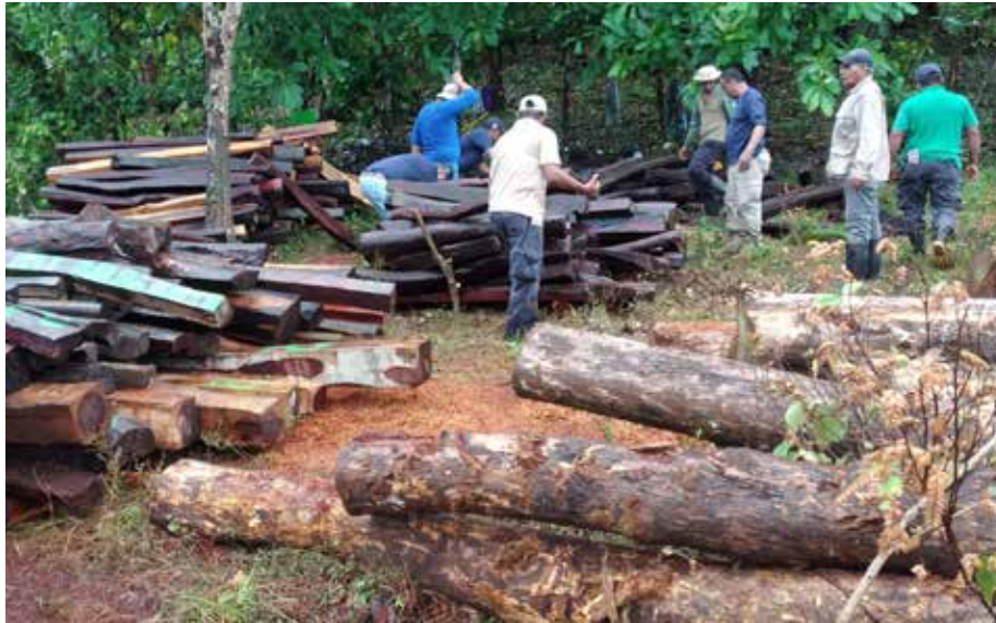
La venta de madera de esta especie en el mercado negro se ha incrementado ante el alza de su precio.