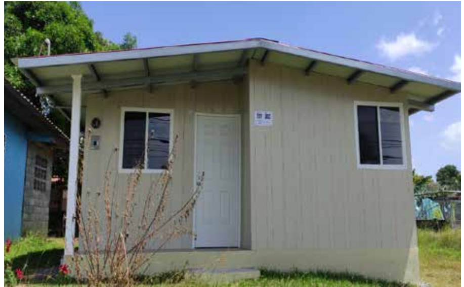
Las viviendas, de 40.96 metros cuadrados, constan de dos recámaras, sala-comedor, cocina, baño higiénico, área de lavandería y pequeño portal.

Se trata de un proyecto de construcción de 500 viviendas.