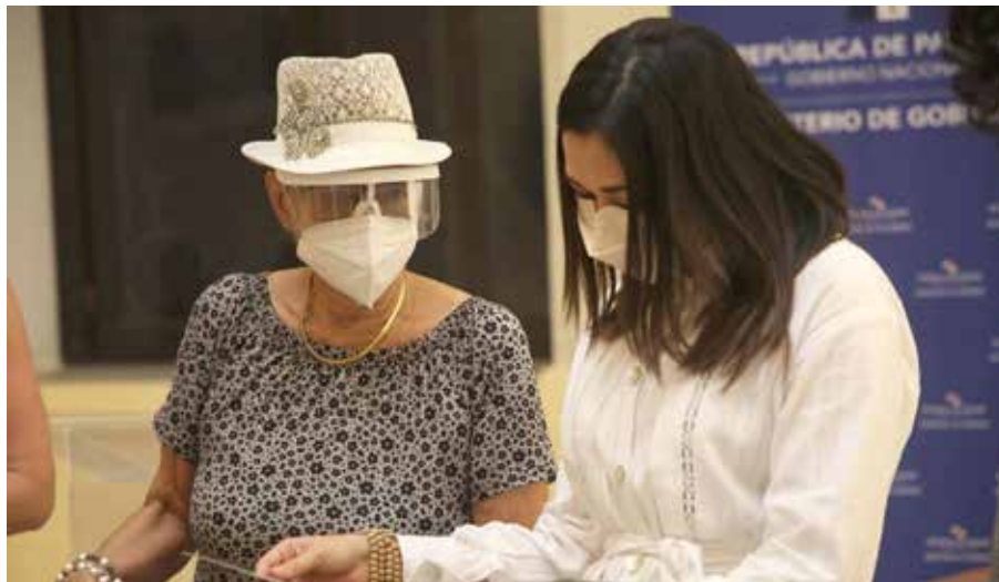
La ministra de Gobierno recibe la primera edición del cuento “Elena y las hormigas: un equipo al rescate”.

El Ministerio de Gobierno recibió la primera edición del cuento “Elena y las hormigas: un equipo al rescate” de manos de la Embajada de Canadá y el Foro Nacional de Mujeres de Partidos Políticos, en el marco de la celebración del Día Internacional de la Lengua Materna, y que ha sido traducido a las lenguas maternas indígenas ngäbere, dulegaya y emberá. La narración fomenta los principios y cuenta la historia de Elena, una niña de la comarca Ngäbe Buglé quien crea y lidera un movimiento para cuidar los ríos en su comunidad. La ministra de Gobierno, Janaina Tewaney Mencomo, resaltó que Panamá es un país pequeño y a la vez muy rico en sus etnias: “Hay mucho por hacer, el día de hoy estamos dando un pequeño paso en la dirección correcta”, acotó y ponderó los avances del Ministerio de Educación por el empeño, dedicación y, así mismo, el reconocimiento de que hay una deuda con los pueblos indígenas y la enseñanza de sus lenguas. Al referirse al cuento, la embajadora de Canadá, Kim Ursu, dijo que es importante que las niñas ngäbes puedan leer o escuchar esta historia en su lengua materna. “Creemos que la importancia de conservar y promover las lenguas maternas no puede ser subestimada, pues los