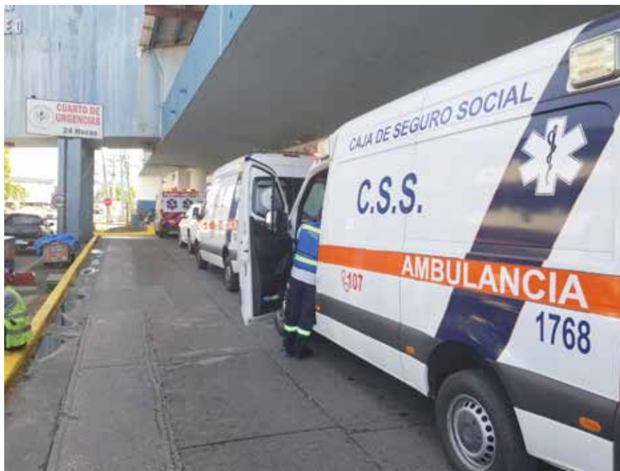
El servicio fue prestado tanto a pacientes asegurados como no asegurados.

En el operativo Kairos II laboraron 6,647 funcionarios de la entidad de seguridad social a nivel nacional, que prestaron servicios en las diferentes unidades ejecutoras y el Departamento Nacional de Gestión de Emergencias, Desastres y Transporte de Pacientes.