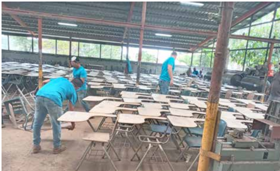
Se realizan trabajos de soldadura, pintura, confección del asiento y brazo de la silla, ensamblaje y aplicación del barniz.