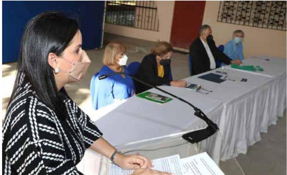
Se prevé que la construcción finalice en 200 días calendario.

La ministra de Desarrollo Social, María Inés Castillo, entregó la orden de proceder para la construcción del proyecto Casa de Día del Adulto Mayor "Rosario Salinero de Gago", ubicada en el corregimiento de Juan Díaz, que brindará espacios de recreación y cuidado a un centenar de adultos mayores, como parte de la hoja de ruta para instalar un Sistema Nacional de Cuidados en Panamá. La obra, que tendrá una inversión de B/.837,753.34, forma parte de un plan piloto que permitirá avanzar hacia la construcción de sistemas de cuidado, dijo la titular del Mides, tras señalar que la obra es una muestra del compromiso del Gobierno Nacional, liderado por el presidente Laurentino Cortizo Cohen, por defender los derechos de las personas de la tercera edad. Este proyecto ubicado en el sector de La Radial, de acuerdo con la ministra, se creó con el propósito de que los adultos mayores sean más felices, tengan acceso a una mejor calidad de vida, participando en actividades individuales y grupales que eviten el aburrimiento, y adquieran y refuercen sus habilidades. El