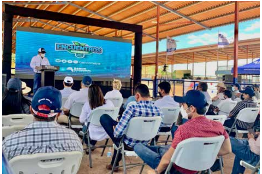
Es la segunda reunión que se realiza en lo que va de 2022.

El tema de la actividad se centró en las características y ventajas de la raza Senepol para la producción de carne en el trópico.