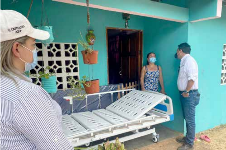
Dos familias de Herrera cuyos miembros presentan discapacidad también recibieron silla de ruedas y cama hospitalaria.

Como parte de las entregas sociales del Despacho de la Primera Dama de la República, liderado por Yasmín Colón de Cortizo, la Oficina de Enlace en la provincia de Los Santos acudió al corregimiento de Palmira, distrito de Las Tablas, a atender la solicitud de una madre de familia cuyo hijo es un joven de 24 años con discapacidad. El joven presenta parálisis cerebral desde los tres meses de nacido y tras una evaluación previa por parte de la Oficina de Enlace, se aprobó hacerle entrega de un coche especial para su movilidad, lo que mejorará su calidad de vida. Por otro lado, se hizo entrega de una cama hospitalaria para una adulta mayor de 81 años de edad residente en el corregimiento de Canto del Llano, distrito de Santiago, provincia de Veraguas. En tanto, en el corregimiento de Herrera Cabecera, distrito de Ocú, provincia de Herrera, se entregó una silla de ruedas y cama hospitalaria a dos familias con pacientes con discapacidad.