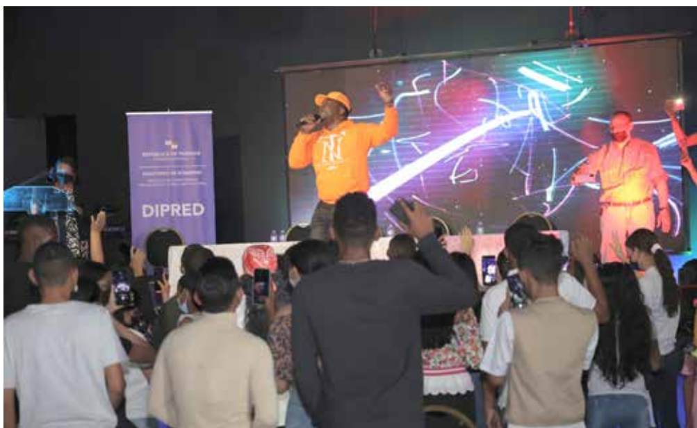
Principal, en su presentación de música urbana.