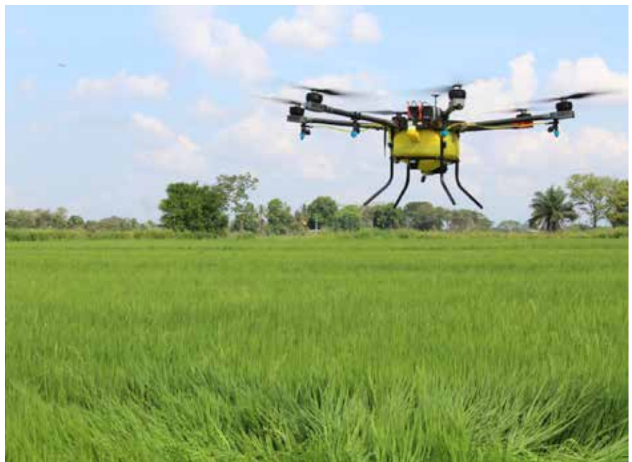
La aplicación de insumos agropecuarios a través de drones es novedosa en Panamá. Se espera una regulación para el uso de esta tecnología.