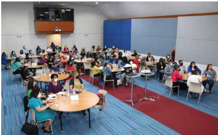
Las escuelas, programas y extensiones del IPHE cuentan con la Certificación Escuelas Seguras, de acuerdo con el Decreto N° 435 del 13 de abril de 2021.

Durante dos días consecutivos, supervisores nacionales, directores y subdirectores de las 14 extensiones, escuelas y programas del Instituto Panameño de Habilitación Especial (IPHE) se reunieron para conocer los lineamientos generales en cuanto a recursos, servicios y apoyos educativos que ofrece la institución para garantizar un buen año lectivo 2022, el cual se inicia de manera presencial. El IPHE cuenta con una matrícula de 16,185 estudiantes en las 4 escuelas, 3 programas, 14 extensiones y 380 centros educativos de inclusión, con el acompañamiento de un equipo docente integrado por 1,174 educadores, así como de 405 miembros del equipo técnico, quienes durante el año lectivo impartirán el Currículo de Enseñanza y Aprendizaje que rige por parte del Ministerio de Educación (Meduca). Durante esta reunión, se impartieron los Lineamientos para el Año Escolar 2022, Conceptos, Herramientas Prácticas y Estrategias Innovadoras para el Apoyo de los Estudiantes en el Proceso de Educación Inclusiva, así como la unificación de los criterios con respecto a la Alineación Curricular para la Educación Especial, con el objetivo de mantener la práctica de la especificidad. También se conversó sobre el trabajo que se