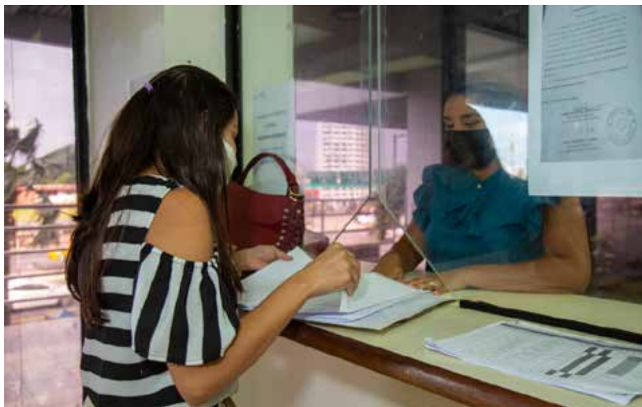
Esta dependencia llega a 47 años de creación.