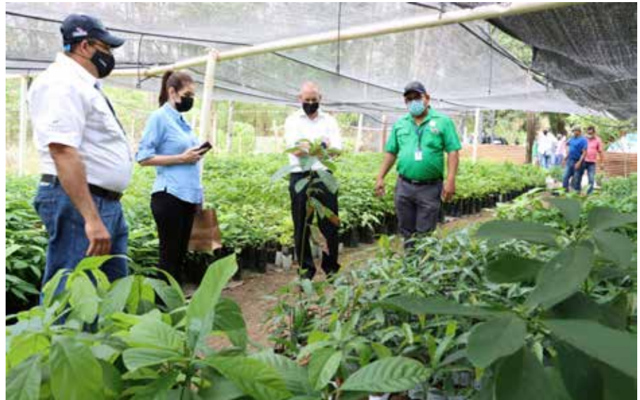
El diplomático israelí conoció los proyectos que adelanta MiAmbiente en alianza con grupos organizados.