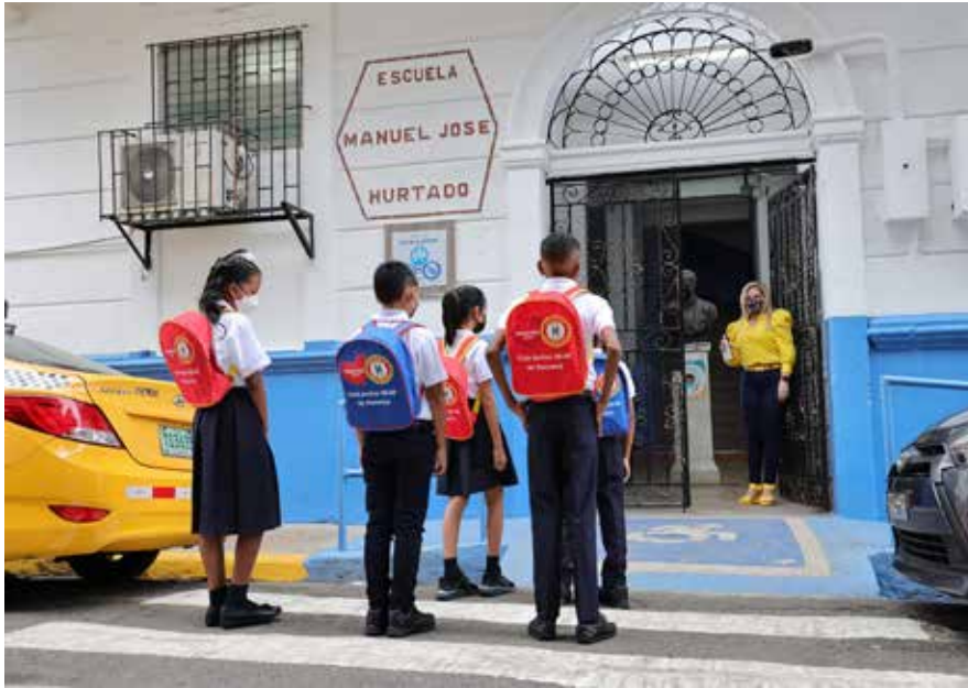
Un ambiente de alegría y sonrisas reinó en los pasillos y aulas de clases después de dos años de ausencia.