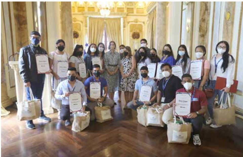
En el evento también participaron las ministras de Relaciones Exteriores y Educación, quienes, junto a la primera dama, entregaron certificados de reconocimiento a los estudiantes.

18 estudiantes panameños de educación media y universitarios viajaron a los Emiratos Árabes Unidos para participar, hasta el 16 de marzo, en la Expo Dubái, donde tendrán la oportunidad de experimentar y tener contacto con los avances de la ciencia, tecnología, innovación, arte y cultura, empresas y emprendimientos, entre otros. La primera dama de la República, Yazmín Colón de Cortizo, compartió con los estudiantes antes de su viaje y los instó, una vez retornen de Dubái, a desarrollar otros proyectos innovadores para elevar la educación "STEAM" en Panamá. En este evento también estuvieron presentes la canciller, Erika Mouynes; y la ministra de Educación, Maruja Gorday de Villalobos, quien resaltó la importancia y el alcance que tendrá esta experiencia en la vida de este grupo de jóvenes. Además, dio a conocer que este proyecto contó con una inversión de más de 100 mil balboas, entre los ministerios de Educación, de Relaciones Exteriores y de la Presidencia, a través del Despacho de la Primera Dama. Este viaje es auspiciado por el Ministerio de Relaciones Exteriores, el Ministerio de Educación y el Despacho de la Primera Dama de la República, liderado por Yazmín Colón de Cortizo, en calidad de Embajadora de las STEAM para las Américas.