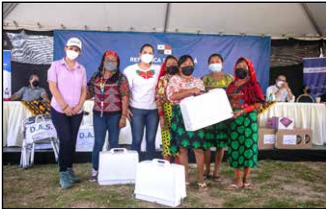
Para el inicio del Programa Redes de Familia en Guna Yala, se entregaron tres máquinas de coser a familias en condición de vulnerabilidad.