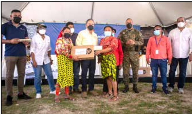
A 16 estudiantes universitarios del programa Transformando Vidas se les dio becas y "laptops" del Ifarhu.