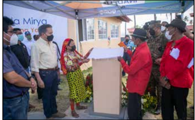
Se entregó la nueva sede del Inadeh en la isla Mirya, en la comunidad de San Ignacio de Tupile, rehabilitada por un monto total de B/.120,000.00.