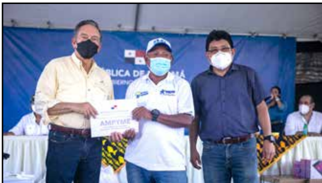
15 emprendedores recibieron capital semilla por un monto total de B/.22,300.00, para el inicio de sus pequeños negocios.