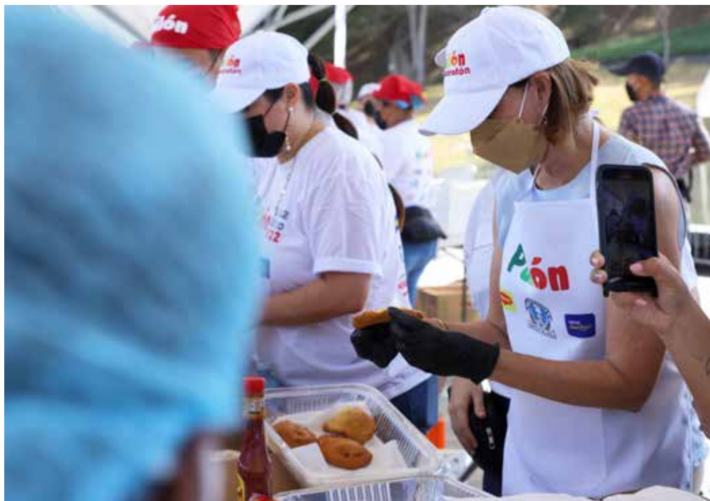
Se entregaron más de 10 mil hojaldres a cambio de donaciones de útiles escolares.

El Parque Recreativo y Cultural Omar fue escenario de "El Hojaldratón", como parte de la tercera cita de El Pailón, el viernes 11 y sábado 12 de marzo, donde se entregaron más de 10 mil hojaldres a beneficio de niños de áreas vulnerables. El Despacho de la Primera Dama de la República, Yasmín Colón de Cortizo, respaldó el proyecto con el espacio para realizar la actividad y además colaboró en la selección y coordinación de las escuelas para la distribución de las hojaldres y, posteriormente, de los útiles escolares. El Despacho de la Primera Dama también aportó bolsas con implementos escolares que fueron entregados en centros educativos, entre ellos la Escuela República de Haití. La producción de hojaldres del viernes 11 fue destinada en su totalidad a escuelas y comedores, en tanto que el sábado 12, la población donó útiles escolares a cambio de una hojaldre. Se recibieron: cuadernos, cajas de lápices, crayolas, lápices de colores, marcadores, resmas de papel, "blocks" de papel de construcción, caja de masilla, kits de témpera, goma blanca, cartucheras, kits de geometría, lanas y cartulinas de diferentes colores.