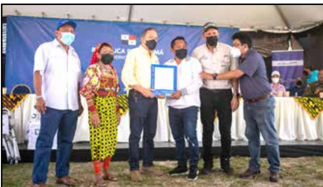
Se emitió la orden de proceder para la construcción de una cancha de fútbol y multiuso en Río Sidra.