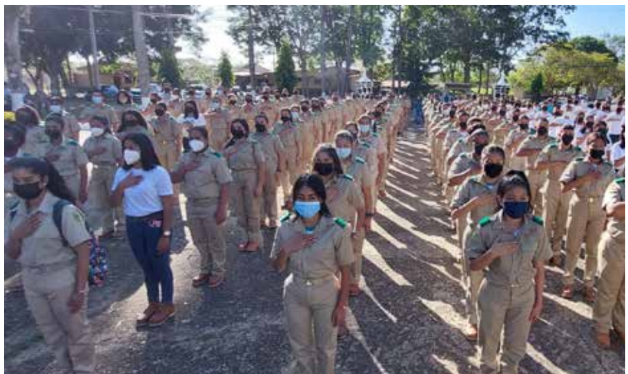
El lunes 7 de marzo, 189 estudiantes iniciaron clases en este centro educativo.

Junto a su equipo de trabajo, el ministro Valderrama acompañó en su primer día de clases al Centro de Atención Integral a la Primera Infancia (CAPI) del MIDA en Santiago, provincia de Veraguas.