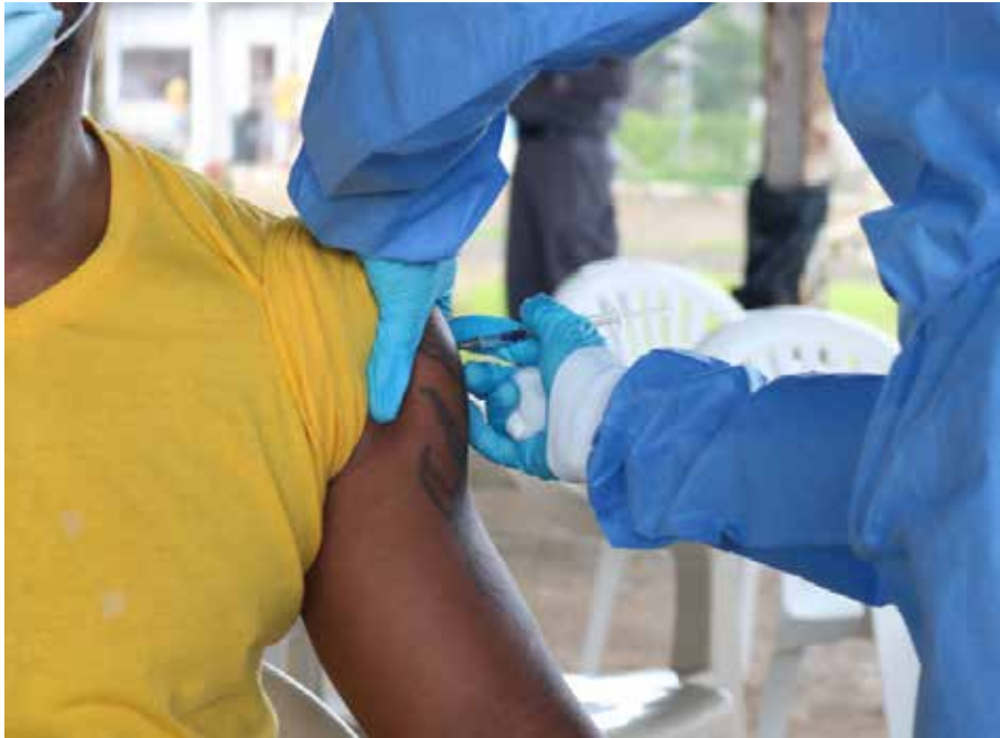
Dos mil personas privadas de libertad reciben la vacuna de refuerzo.

Como parte del proceso de vacunación contra la Covid-19 que adelanta el Gobierno Nacional, 2,407 privados de libertad ya han recibido sus tres dosis en los centros penitenciarios del país. El trabajo se realiza en conjunto entre los ministerios de Salud (Minsa) y de Gobierno (Mingob) en el Plan Nacional de Vacunación. Las autoridades resaltan que, en todo momento, la administración busca salvaguardar la vida y respetar los derechos humanos de los privados de libertad, por lo cual se realizan jornadas de vacunación voluntaria para completar la dosis de refuerzo, así como para los que quieran recibir la primera o segunda dosis. Del total de la población penitenciaria, 17,028 están vacunados con la primera dosis y 15,728, con la segunda. Por otro lado, para preservar la salud de las personas privadas de libertad, custodios y administrativos, se mantiene la medida de solicitar, a los familiares, la vacunación completa o prueba de antígeno negativa 72 horas antes de las visitas.