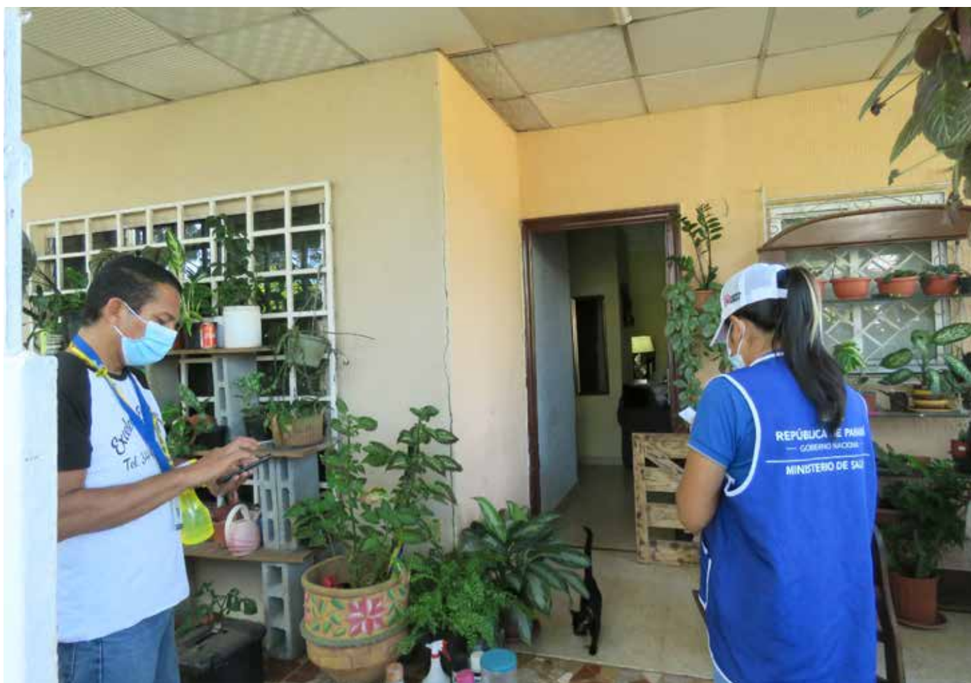
La trazabilidad y el trabajo con todos los actores sociales ha sido fundamental en la lucha contra la Covid-19.

indicadores, y destacó que el gran protagonista ha sido el pueblo panameño que, en su mayoría, ha cumplido con las medidas de bioseguridad. El 9 de marzo de 2020, Panamá reportó su primer caso de Covid-19. Desde esa fecha se activó un plan de acción para el control y trazabilidad, cuyo enfoque estuvo orientado en contener la transmisión y reducción de nuevos casos a través de la detección, ubicación y aislamiento.