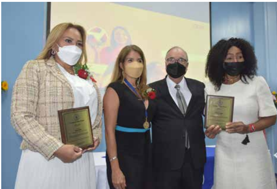
Fueron distinguidas en este acto, ministras y viceministras de Estado, así como funcionarias de la institución.