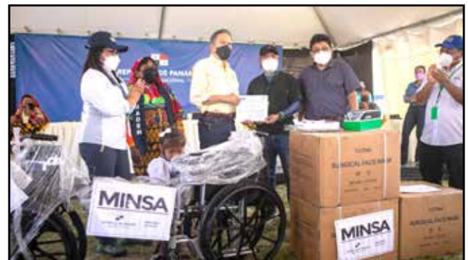
La administración de acueductos rurales de Ailigandí y Narganá recibió clorinadores de línea, tuberías y pastillas de hipoclorito de calcio.