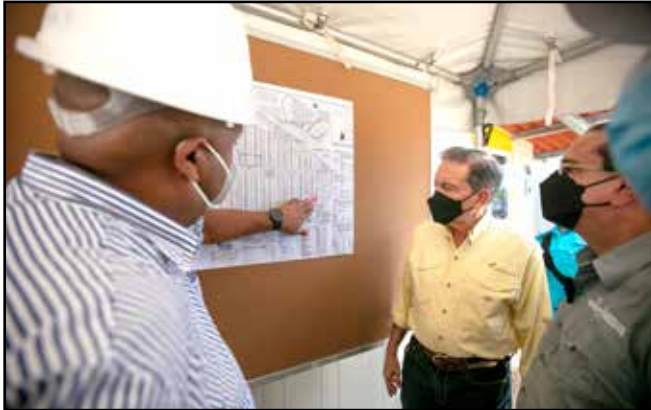
La comitiva oficial realizó una inspección al proyecto en construcción de Nuevo Cartí, con un avance del 48.39%, que ofrecerá solución habitacional a 300 familias.

Comunidades visitadas: Isla Mirya, Cartí y San Ignacio de Tupile.