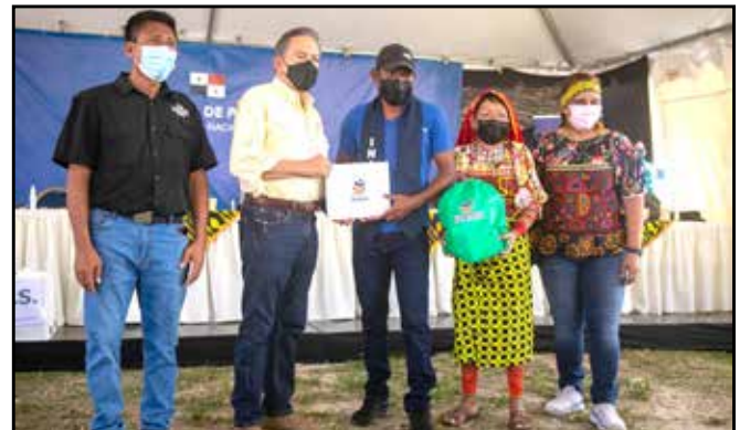
27 nuevos emprendedores obtuvieron su certificado de culminación de curso, lo que les permitirá poner en marcha diversos emprendimientos.