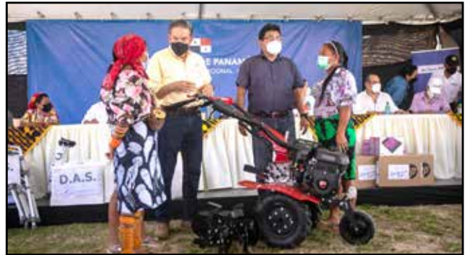
Como apoyo a la producción agrícola y pecuaria nacional, se entregó una motoazada a las Mujeres Rurales de Tigre.