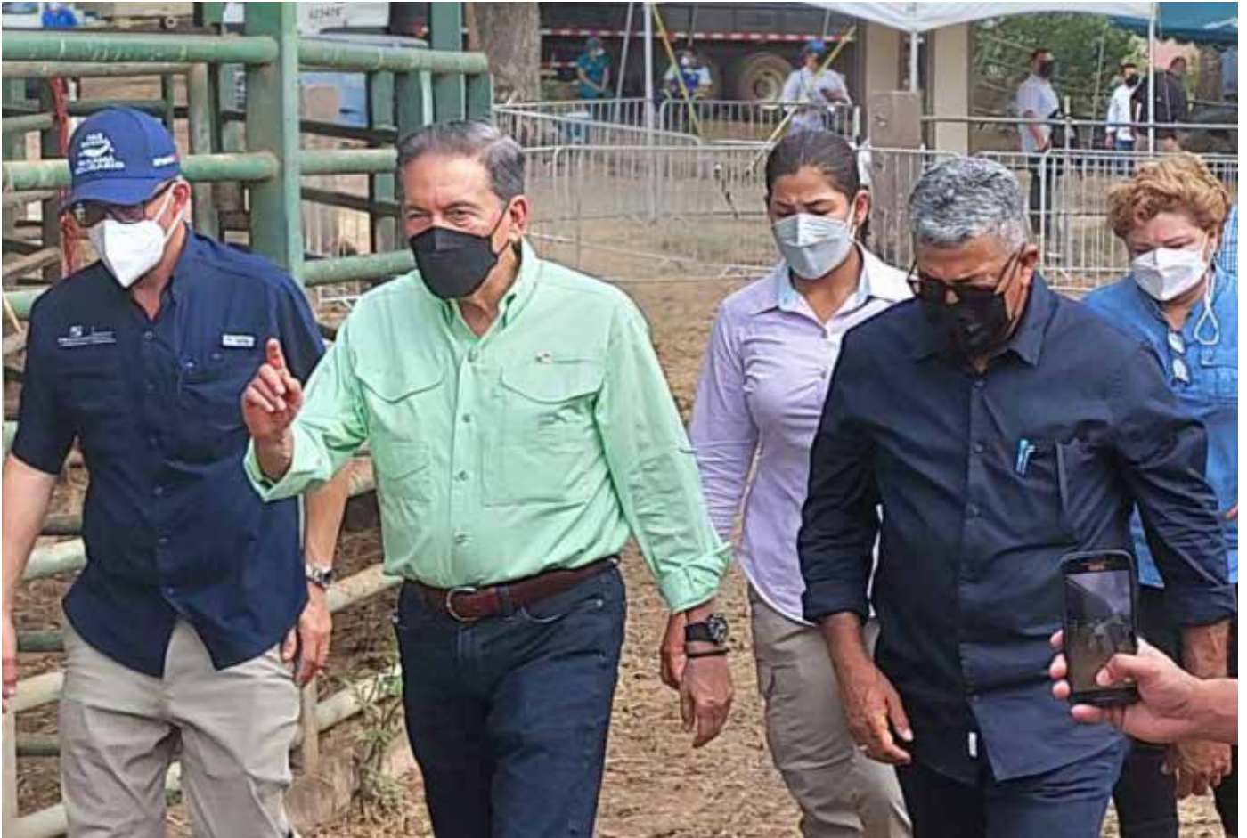
El presidente Laurentino Cortizo Cohen, acompañado del equipo del MIDA, encabezado por el ministro encargado, Carlo Rognoni, durante la inspección de los toros.

Para seguir robusteciendo el sector agrícola y pecuario de Panamá, el Gobierno Nacional entregó 50 sementales, con un valor aproximado de B/.125 mil; además, el programa Panamá Agro Solidario aportó B/.225,900 para incrementar la producción y se dieron insumos, valorados en más de B/.35 mil, a través del Ministerio de Desarrollo Agropecuario (MIDA), a pequeños y medianos productores, en el marco de la tradicional Gira de Trabajo Comunitario que lidera el presidente de la República, Laurentino Cortizo Cohen, en la provincia de Coclé. En