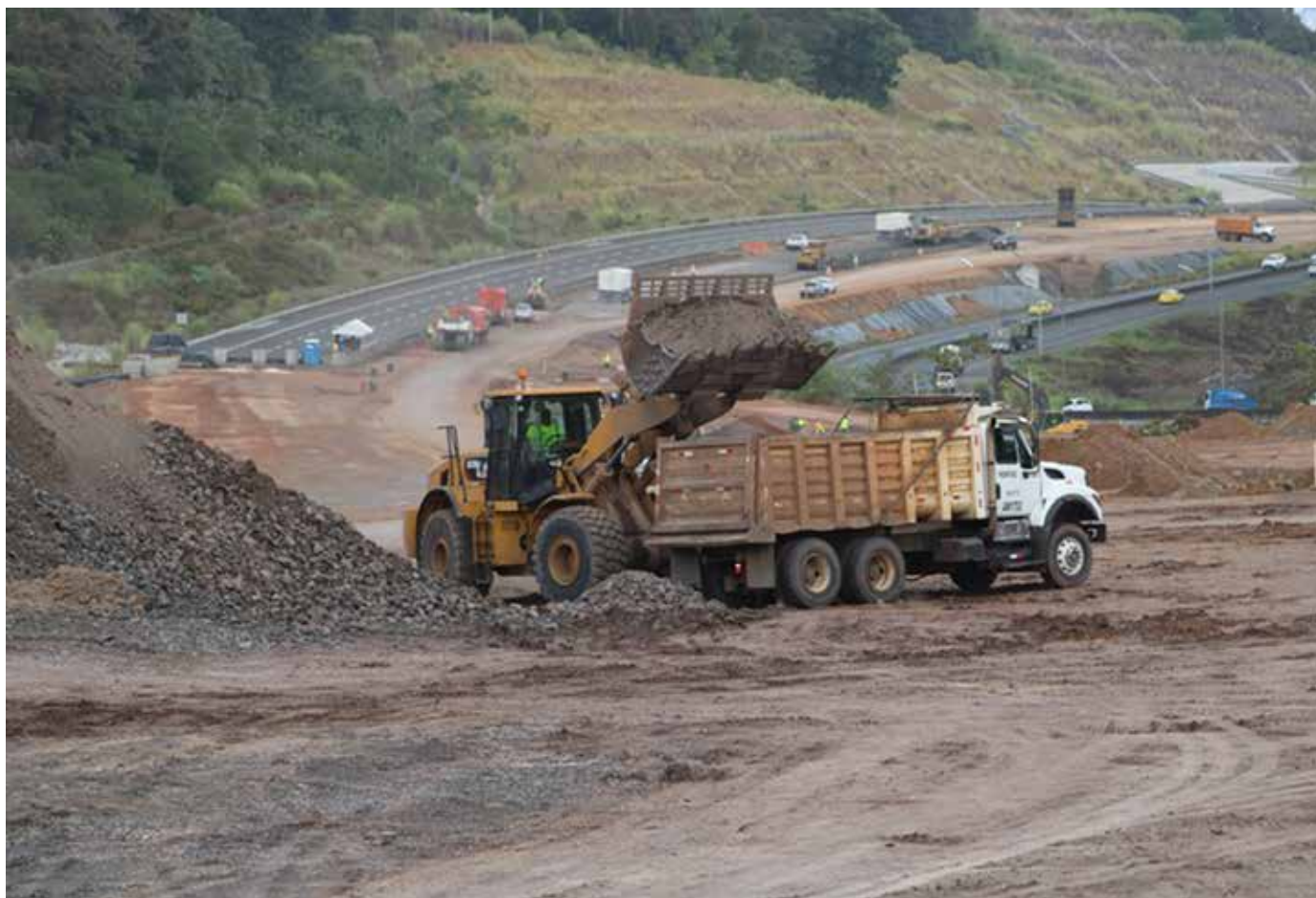
La ampliación y rehabilitación de la carretera Panamericana, tramo Puente de Las Américas-Arraiján, tiene un avance físico del 48%.