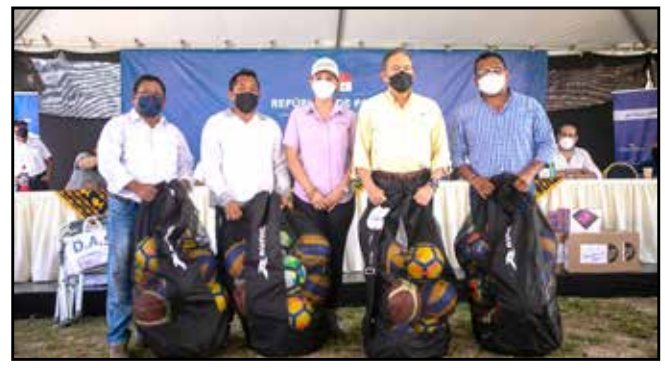
El programa Transformando Vidas, del Ministerio de la Presidencia, suministró bolsas con implementos deportivos a las tres juntas comunales del circuito 10-1.