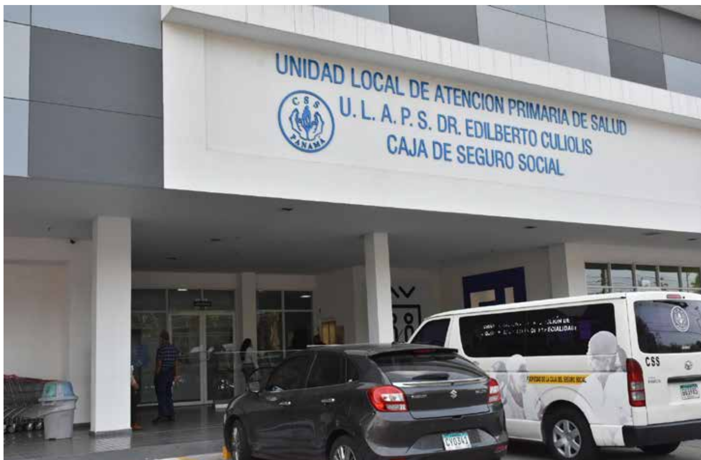
ULAPS Edilberto Culiolis, reubicada en el Centro Comercial Villa Zaíta.

Alcalde Díaz, Chilibre, Caimitillo, Ernesto Córdoba, Las Cumbres y áreas aledañas. Detalló que la atención se brinda de lunes a viernes, en horario de 7:00 a.m. a 3:00 p.m., y la componen los servicios de atención de medicina general con tres consultorios presenciales y dos consultorios virtuales, medicina familiar, Clínica de Diabetes, ginecología y pediatría.