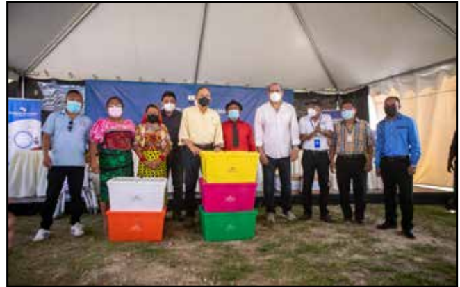
Para cinco escuelas de la comunidad, se distribuyeron cajas con libros del programa Biblioteca de Aulas, que fomenta la lectura desde el preescolar.