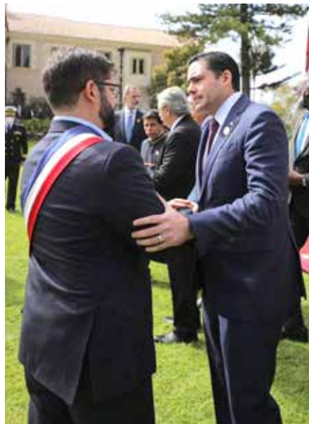
El nuevo presidente de Chile conversa con el Vicepresidente panameño.

En representación del Gobierno Nacional, el vicepresidente de la República y ministro de la Presidencia, José Gabriel Carrizo Jaén, participó este viernes 11 de marzo en los actos de toma de posesión de Gabriel Boric como el trigésimo cuarto presidente de la República de Chile por los próximos cuatro años. Carrizo Jaén participó en la ciudad de Valparaíso de los eventos que marcan el inicio oficial del gobierno de Boric, su Gabinete y la instalación del Congreso de la República de Chile, en representación del presidente panameño, Laurentino Cortizo Cohen. El vicepresidente de la República formó parte de la delegación de jefes de Estado y de Gobierno que asistieron al cambio de mando, en una ceremonia marcada por los simbolismos, las tradiciones republicanas de ese país, y los protocolos por la pandemia de Covid-19. Tras la