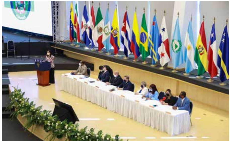
La titular del Mides reiteró el compromiso del Gobierno para continuar trabajando por la paridad entre hombres y mujeres.

Más de 44 empresas y 9 organizaciones se han unido a esta iniciativa que busca aumentar la participación laboral de las mujeres.