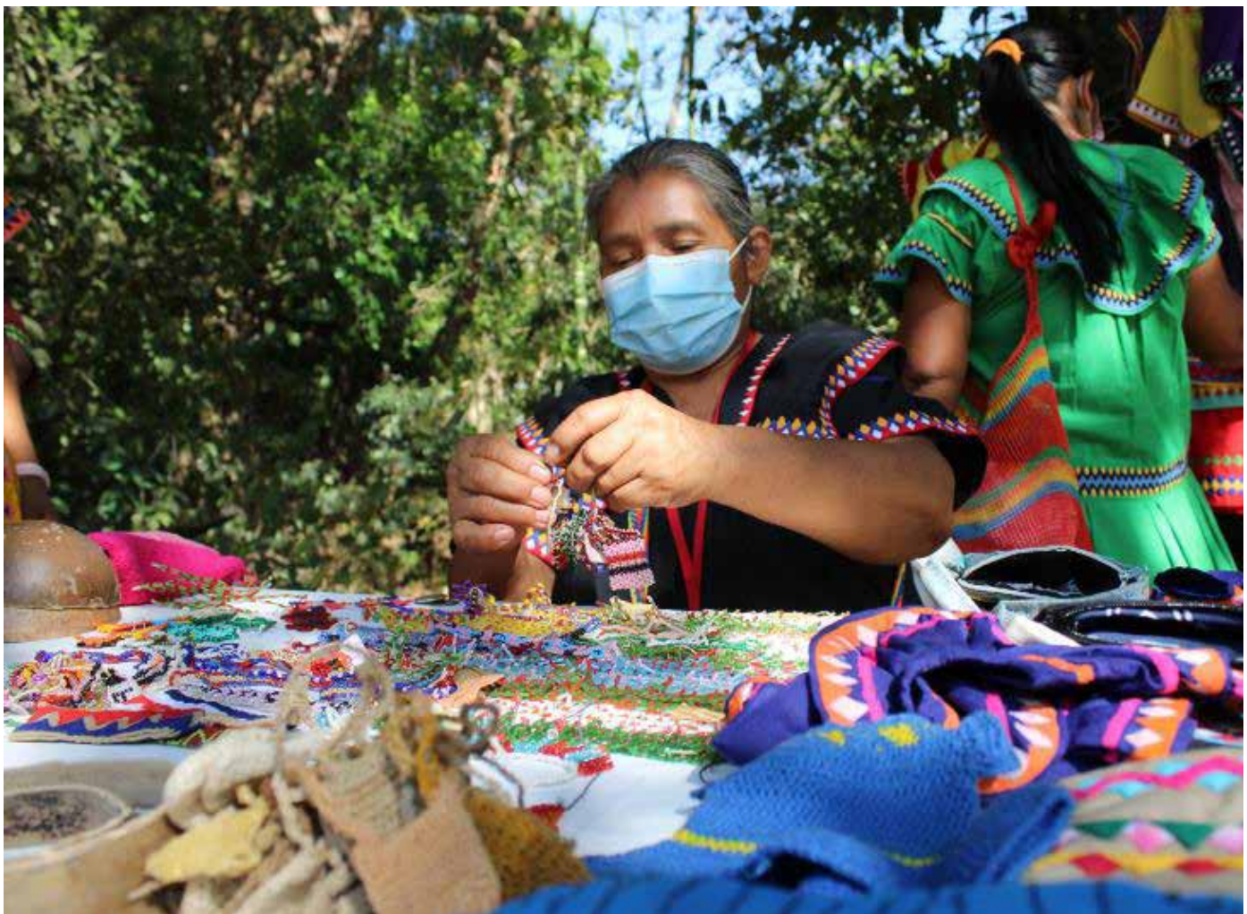
En cada exposición, los asistentes aprendieron a valorar las riquezas y bondades naturales del país.