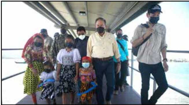
Se inauguró el puente peatonal marino que conecta isla Mirya con la comunidad de San Ignacio de Tupile.