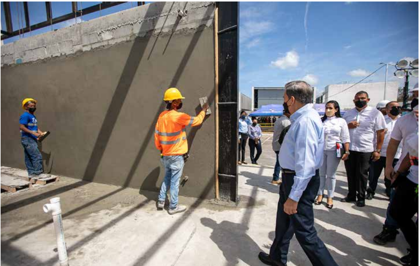
El próximo 12 de julio se espera inaugurar el Instituto Cardiovascular y Torácico.

trabajadores y, a medida que se implementen jornadas adicionales, se generarán cerca de 5 mil empleos directos y otros 3 mil puestos de trabajo indirectos. Aunque se está trabajando de manera simultánea en todo el proyecto, se ha planificado la entrega de las instalaciones en 5 fases, con sus respectivas fechas de vencimiento.