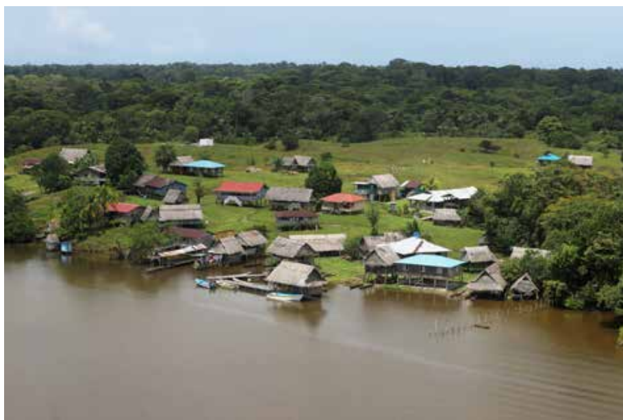
En esta apartada comunidad residen 260 familias, integradas por unas 750 personas.