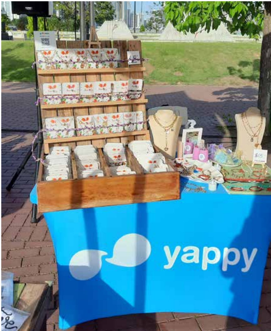
En esta vitrina de emprendimiento se expusieron varios productos.

Con el propósito de brindar nuevas actividades para el público en general, el Despacho de la Primera Dama de la República, liderado por Yazmín Colón de Cortizo, realizó el sábado 19 y domingo 20 de marzo en el Domo del Parque Recreativo y Cultural Omar un “Mercadito Yappy”, una iniciativa organizada por el Banco General. La primera dama señaló que el novedoso concepto es una herramienta fantástica que les brinda un espacio a los emprendedores registrados en esta plataforma de pago electrónico para que puedan ofrecer sus productos, gracias al apoyo del banco como una iniciativa de responsabilidad social. En esta vitrina de 48 emprendedores se expusieron productos diversos, como bisutería, artesanías, postres, artículos de belleza, fragancias, accesorios para mascotas y mucho más. En lo que va del 2022, se han realizado con éxito cuatro mercaditos: Dos en la Cinta Costera, en Town Center Costa del Este y en Market Plaza, en Costa Verde, distrito de La Chorrera.