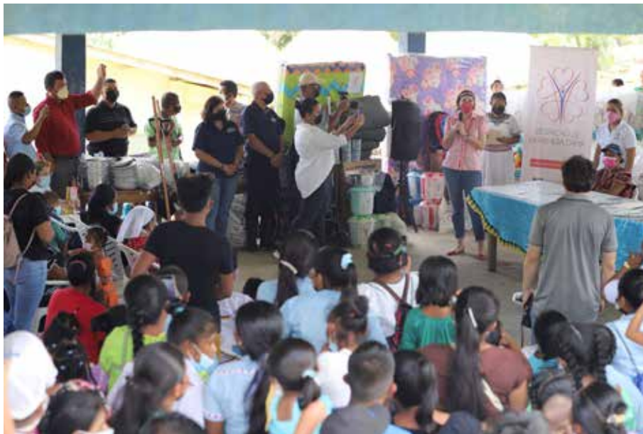
El Despacho de la Primera Dama y la Senniaf organizaron la actividad.