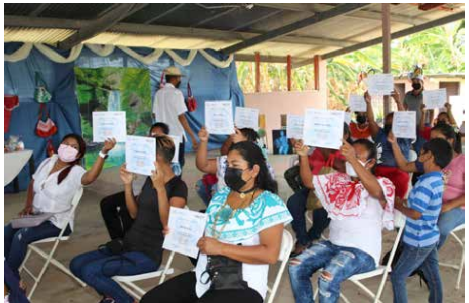
La Cooperativa de Servicios Múltiples Mujeres Agro Empresariales Comunidades Unidas R.L. la integran 31 mujeres de Río Hato.