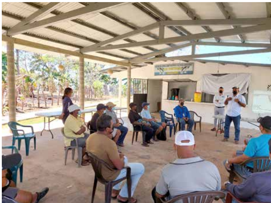
El proyecto piloto de monitoreo satelital ayudará a proteger a los pescadores en su faena diaria mediante el uso de la tecnología.