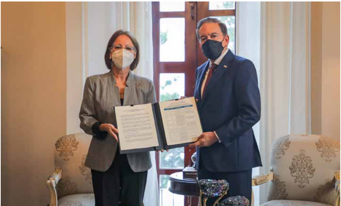
Son 40 los compromisos iniciales que ejecutará la actual administración.

“Cerrando Brechas” es una iniciativa del presidente Cortizo Cohen con la finalidad de lograr acuerdos nacionales en materia de salud, seguridad social, educación, economía, seguridad y servicios básicos, para sentar las bases de un mejor Panamá, contando con la participación de todos los sectores productivos del país.