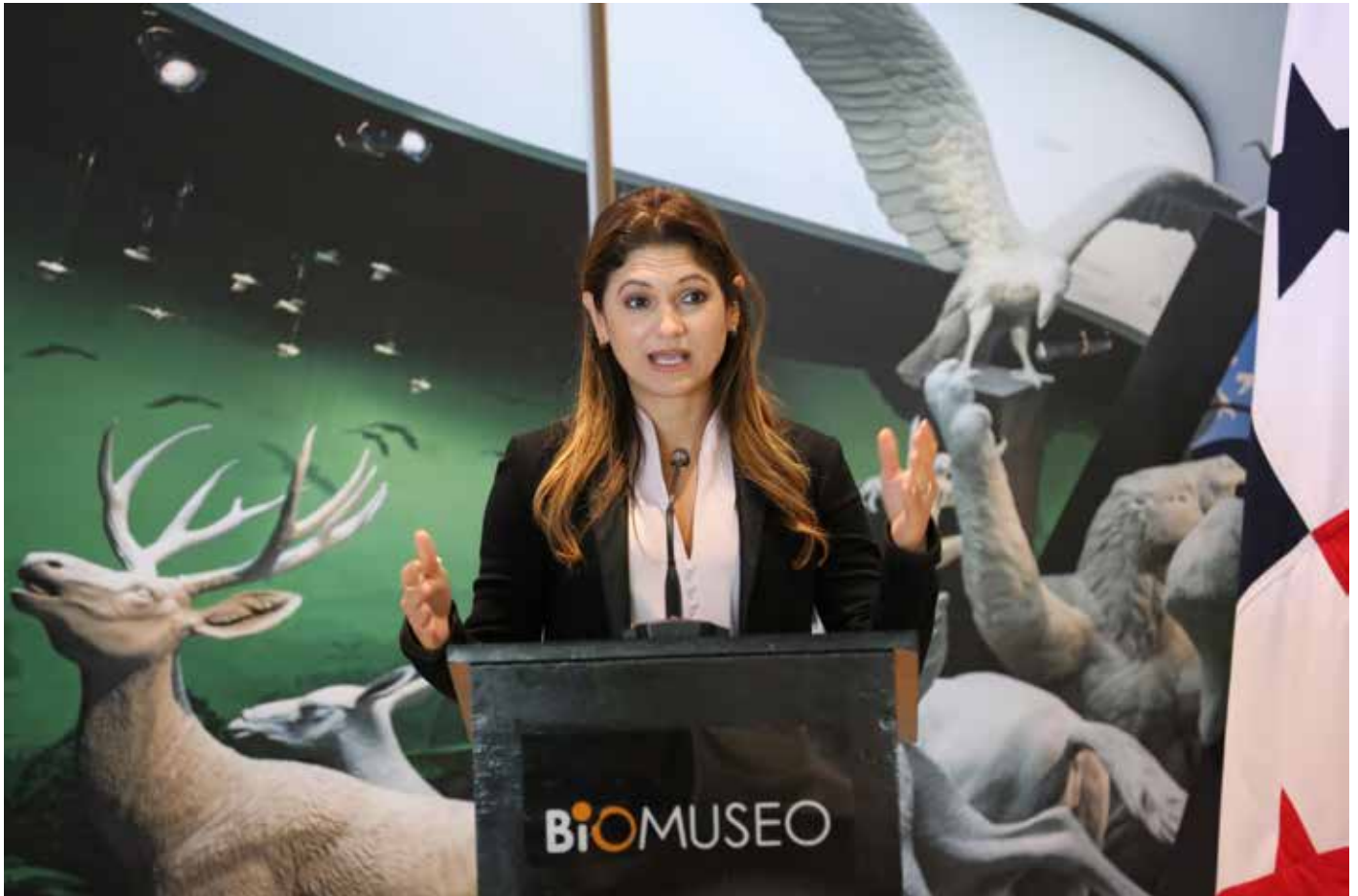
La canciller, Erika Mouynes, durante la conferencia "Camino al Our Ocean 2023", realizada en la sede del Biomuseo, en la Calzada de Amador.

En el marco de la conferencia "Camino al Our Ocean 2023", la jefa de la diplomacia panameña, Erika Mouynes, manifestó la importancia de seguir cuidando los recursos naturales con políticas de conservación y elevar un mensaje a seguir protegiendo los océanos. "Panamá tiene el Canal, una de las vías interoceánicas más importantes, la flota naviera más grande del mundo, es un país bañado por dos océanos. Tenemos que ser líder y asumir eso con responsabilidad", acotó la