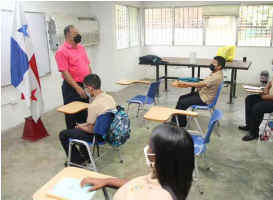
El estudiante de la EVE desarrolla habilidades para aprender de las experiencias de los otros.

La Escuela Vocacional Especial (EVE), del Instituto Panameño de Habilitación Especial (IPHE), dio inicio al nuevo año lectivo 2022 de conformidad con los lineamientos impartidos por el Ministerio de Educación (Meduca), en torno a la apertura de las clases presenciales en los planteles donde hay más densidad de estudiantes y docentes, en seis regiones educativas: Panamá Centro, Este, Norte y Panamá Oeste (distritos de Arraiján y La Chorrera), San Miguelito y Colón (cabecera). La EVE inició con una matrícula de 1,439 estudiantes, de los cuales 961 acuden a la sede, en los niveles de premedia y las carreras técnicas intermedias, mientras que 478 asisten a las escuelas inclusivas, en premedia y media, con el acompañamiento de 102 docentes especializados y seis profesionales del equipo técnico en las áreas de Psicología, Trabajo Social, Terapia Ocupacional, Psiquiatría y Consejería en Rehabilitación. Se imparten 13 carreras técnicas intermedias, a partir del décimo y undécimo grado, las cuales son: Construcción con énfasis en Albañilería, Ebanistería, Artes Gráficas con énfasis en Encuadernación, Chapistería, Manejo de Granjas Ecológicas, Jardinería, Peluquería, Belleza y Estética Integral, Prácticas de Oficina, Soldadura General, Diseño y Confección de Vestuario, Manejo de Granjas Ecológicas, Gastronomía y Servicios de Hotelería y Comercio y la Industria.