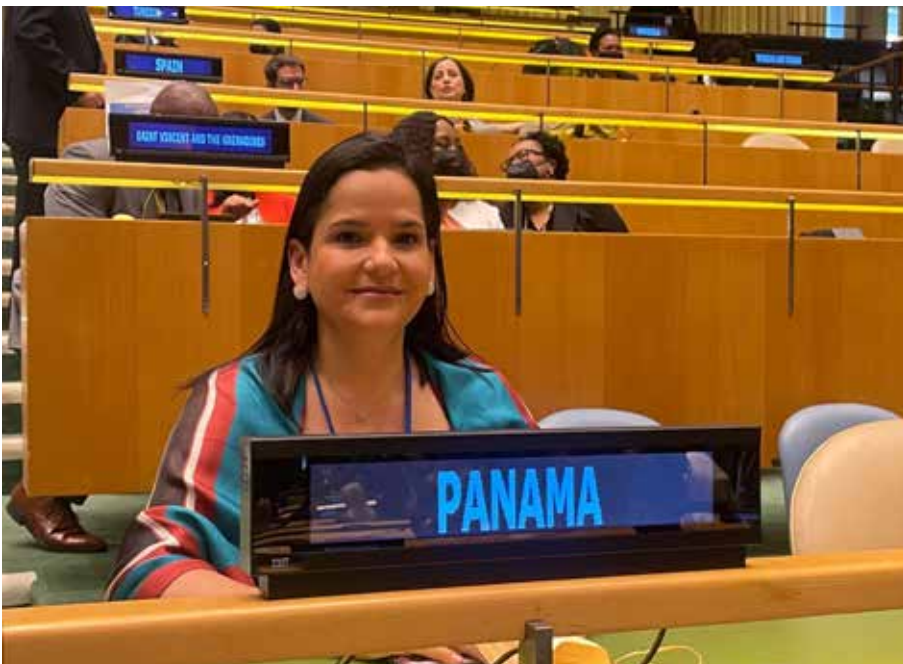
La titular del Mides participó en el 66° periodo de sesiones de la Comisión Jurídica y Social de la Mujer de las Naciones Unidas, en Nueva York.

Este año, la reunión se centró en “lograr la igualdad de género y el empoderamiento de todas las mujeres y niñas en el contexto de las políticas y programas de cambio climático, medio ambiente y reducción del riesgo de desastres”.