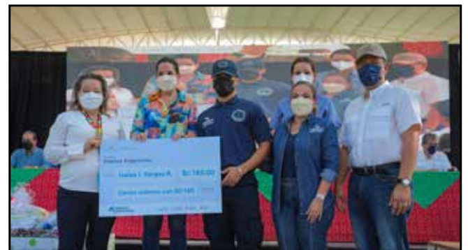
Se entregó beca laboral del programa Padrino Empresario, dirigido a adolescentes expuestos a situación de riesgo social.