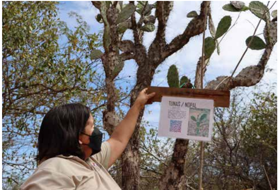
Los códigos serán instalados en el sendero hacia El Conchero, Las Dunas, el sitio arqueológico y en el Bosque de Manglar.

La flora del Parque Nacional Sarigua podrá ser identificada a través de códigos QR.