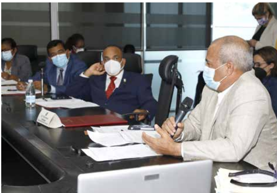
Esta entidad tendrá la responsabilidad de monitorear y vigilar la evolución del tiempo atmosférico las 24 horas del día.