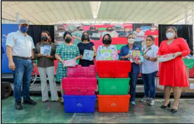
Docentes de las escuelas Bilingüe Doleguita, Bilingüe La Primavera, Bilingüe Los Abanicos, Bilingüe Loma Colorada y Medalla Milagrosa recibieron Bibliotecas de Aulas.