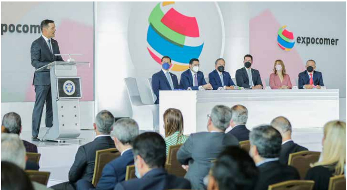
El buen desempeño de la economía panameña ha sido reconocido por organismos internacionales como el Banco Interamericano de Desarrollo y el Fondo Monetario Internacional.

como son Mujer Emprendexport y Agroindustria Competitiva. También dijo que la plataforma del régimen de Sede de Empresas Multinacionales (SEM), se expandió con 14 nuevas empresas en 2021 y en el primer bimestre del año 2022 se registraron dos nuevas, que invertirán inicialmente un total de B/.2.4 millones en Panamá. En el sector turístico, destacó que se realizan inversiones de B/.800 millones a nivel nacional.