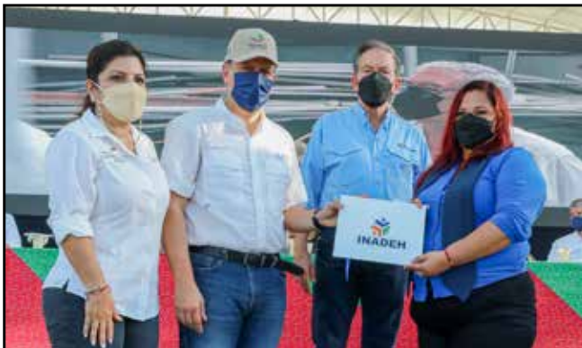
15 participantes de los diversos cursos que se dictan en el Inadeh recibieron sus certificados de culminación.