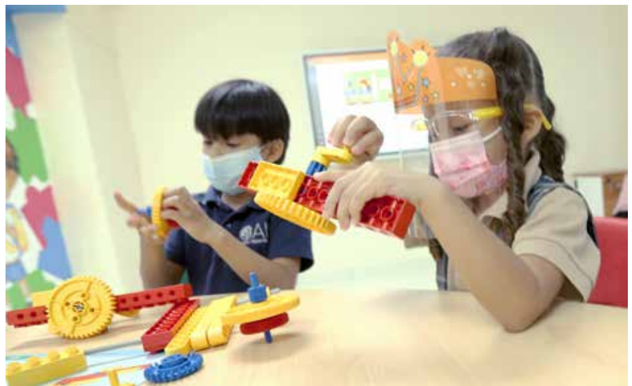
Este acuerdo impactará de manera directa a 10,000 estudiantes, 1,500 docentes y 200 centros educativos.