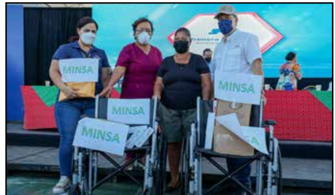
Se distribuyeron suministros e insumos a las Juntas Administradoras de Acueductos Rurales de la región de Salud del distrito de David.