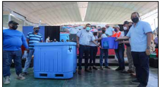
Se le hizo entrega de una tina, kit de pesca y sus respectivos permisos de pesca artesanal a miembros de la Organización de Pescadores Artesanales de Chiriquí.