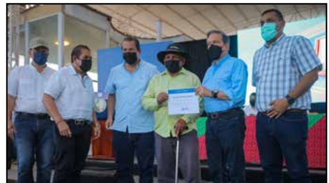
19 residentes de esta provincia recibieron soluciones habitacionales del Plan Progreso y del Fondo Solidario, con el objetivo primordial de mejorar su calidad de vida.