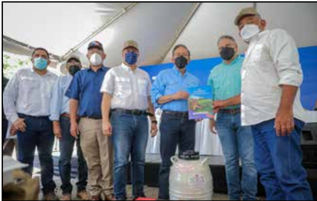
En Boquerón se entregaron 75 sementales de alta genética de las razas Brahman y zardo a pequeños productores, por B/.190 mil.