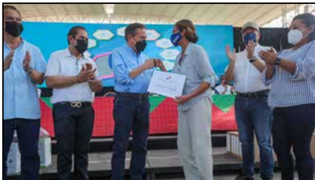
25 microempresarios recibieron capital semilla por un monto total de B/.20,000, para iniciar sus emprendimientos.