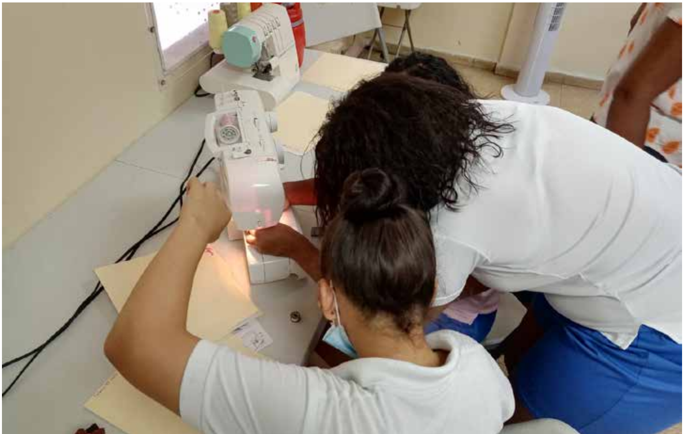
Jóvenes trabajan arduamente en el taller de confección como parte de los programas de resocialización que desarrolla el Ministerio de Gobierno.