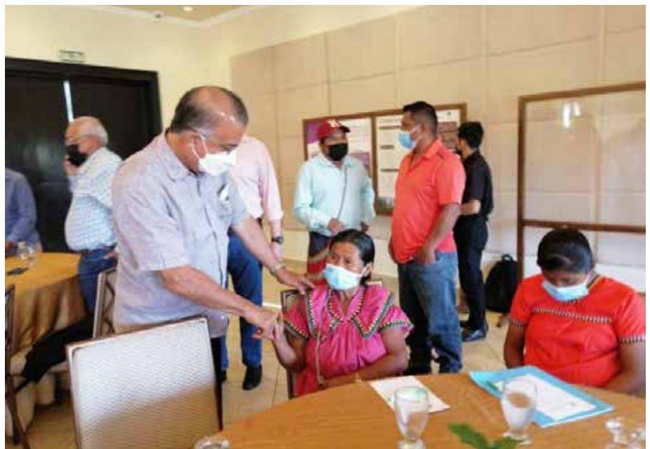
En la actividad participaron productores de diversos puntos del país, incluidas las comarcas Ngäbe-Buglé y Guna de Madugandí, y representantes de la Asociación de Cafés Especiales de Panamá.