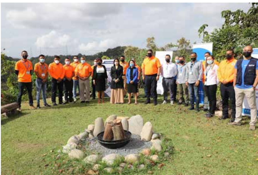
El Ministerio de Gobierno, con el apoyo del Programa Mundial de Alimentos, realizó un taller sobre la utilidad de drones en labores de preparación y respuestas a emergencias.