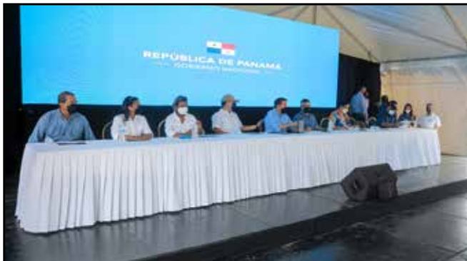
Se procedió a la apertura oficial de 80.3 kilómetros de calles y caminos rehabilitados en David, con una inversión de B/.48,193,353.