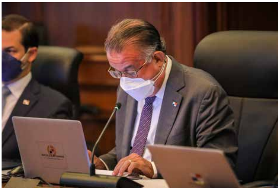
El consejo de ministros aprobó un crédito adicional a favor del Instituto Técnico Superior Especializado (ITSE).