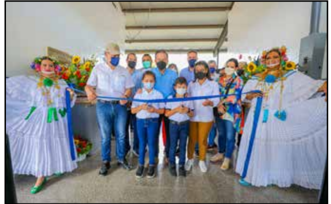
Se inauguró el Centro de Estudios Superiores de Bellas Artes, tras concluir las obras de rehabilitación y mantenimiento por un monto de B/.294,237.