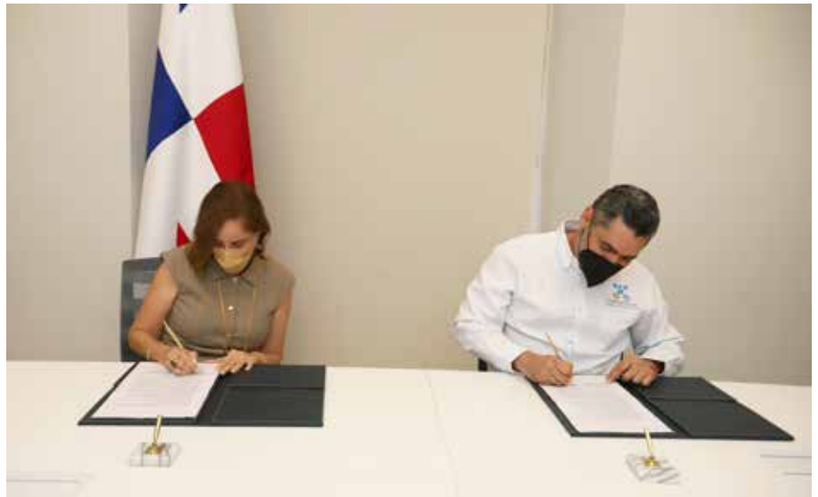
El Despacho de la Primera Dama y Fundesteam firman un convenio de cooperación.

La primera dama de la República y embajadora de la educación "steam" para Latinoamérica, Yasmín Colón de Cortizo, suscribió un Convenio de Cooperación y Asistencia Técnica con la Fundación Nacional para el Desarrollo de las STEAM (Fundesteam) en el que acuerdan colaborar en la ejecución de una Agenda de Implementación de la educación "steam" en Panamá que les permita desarrollar diferentes programas y actividades de ciencia, tecnología, ingeniería, artes y matemáticas. Las partes se comprometen a desarrollar acciones conjuntas dirigidas, entre otras cosas, a impulsar alianzas que fortalezcan las acciones en materia de educación. Como parte de la Agenda de Implementación de la educación "steam" en Panamá, se han acordado las siguientes iniciativas y actividades: Steam Girls 360, Steam Aeroespacial, Samsung Innovation Campus, WRO Panamá 2022, WRO Alemania 2022, WRO Panamá 2023 (mundial), Rincón Steam, Diplomado Steam con énfasis en Olimpiadas de Robótica, Steam Pre-Escolar y muchos más. El convenio impactará de manera directa a unos 10,000 estudiantes, 1,500 docentes y 200 centros educativos.