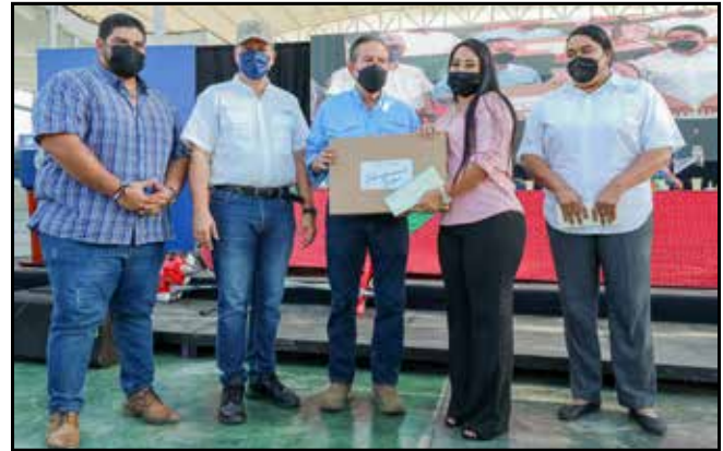
Estudiantes del Colegio Francisco Morazán y del Instituto David recibieron becas y "laptops" del programa Transformando Vidas.