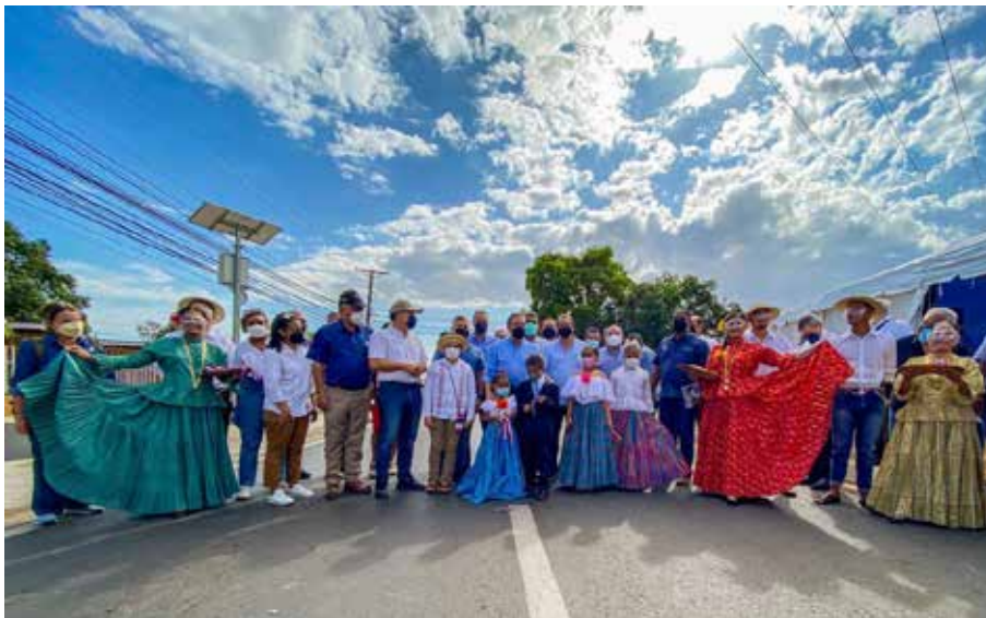
En la gira, liderada por el presidente Laurentino Cortizo Cohen, también se hizo entrega a productores organizados de Gualaca y Breñón de tanques de inseminación artificial bovina con sus kits completos.