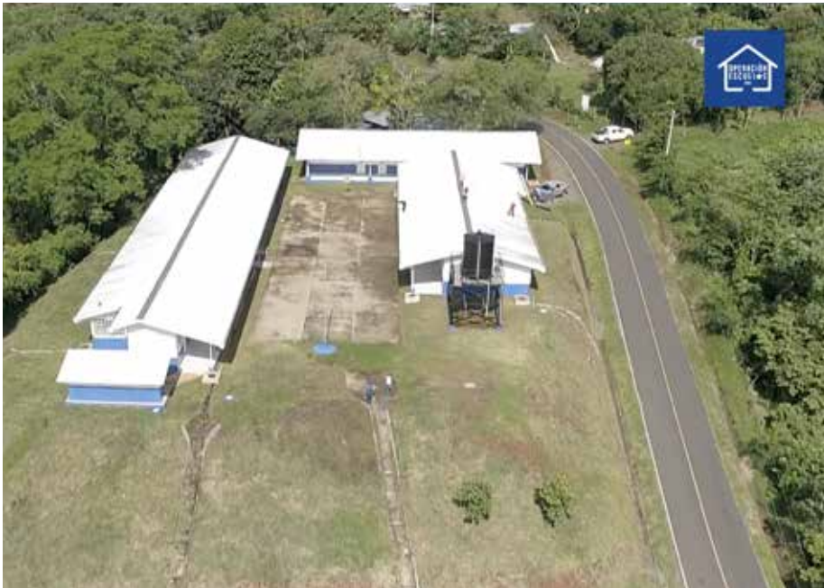
En el corregimiento de Cerro Iglesias, distrito de Nole Duima, se construyen los centros educativos Olá y Guari, en los que se invierten B/.3.7 millones y registran un avance de 99% en los trabajos.