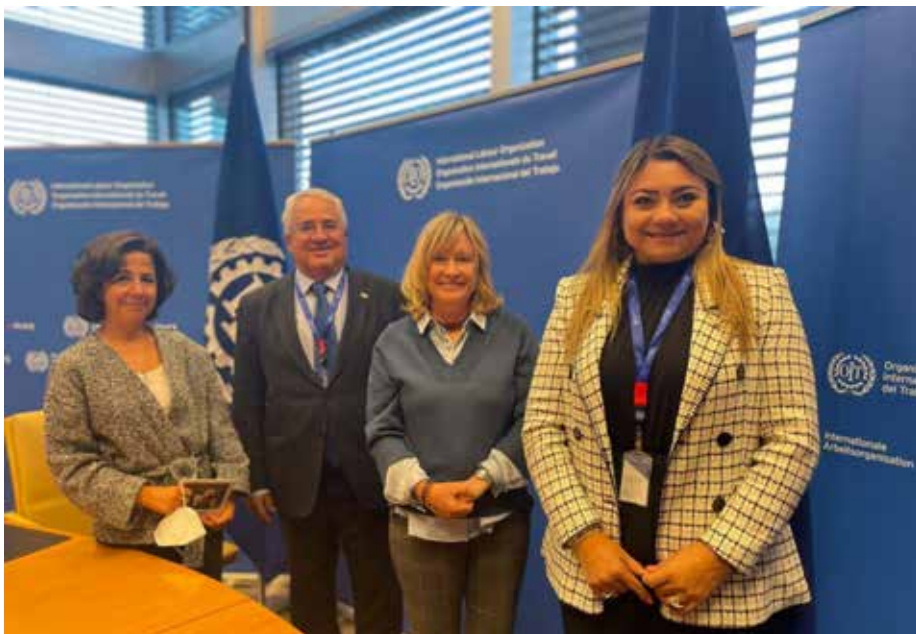
Sesión 334 del Consejo de Administración de la OIT en Ginebra, Suiza.