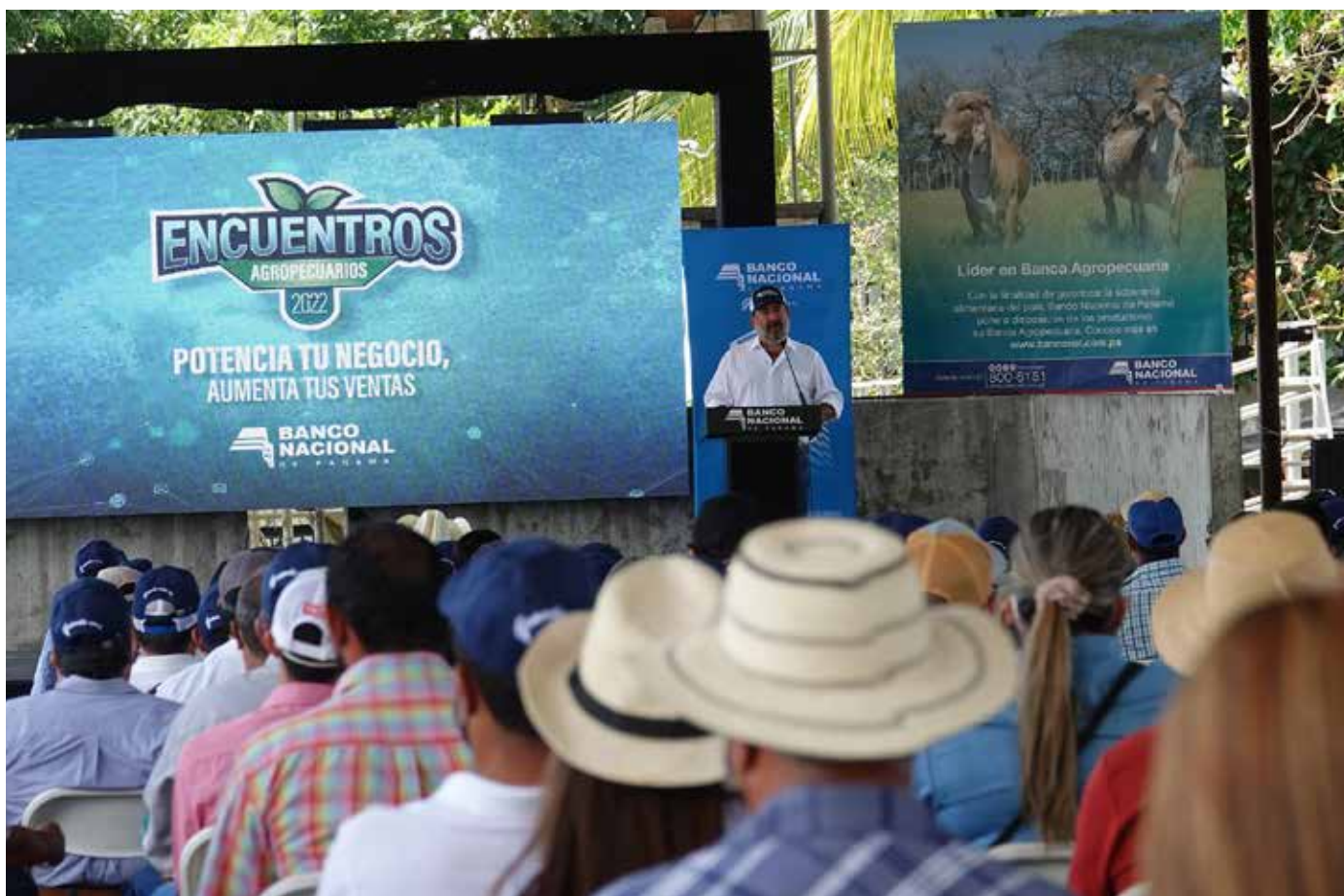
En el distrito de Boquerón, el Banco Nacional de Panamá desarrolló el Encuentro Agropecuario “Potencia tu negocio, aumenta tus ventas”, con más de 200 productores del área.