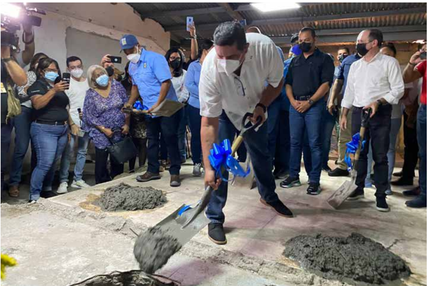
Este punto contará con 600 cámaras en diferentes sectores de ese distrito.

tendrá equipos para monitoreo y despacho, reconocimiento facial, placas, botones de pánico (ubicados estratégicamente), megáfonos dentro de las zonas de cobertura y el sistema 104.