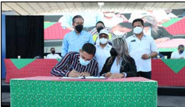
15 personas realizaron la firma de contratos para inserción laboral a través de los diversos programas que ejecuta el Gobierno Nacional.