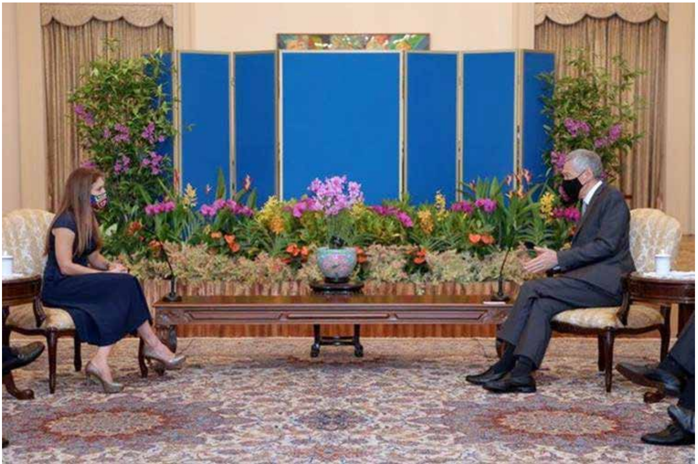
La canciller, Erika Mouynes, y el primer ministro de Singapur, Lee Hsien Loong, en audiencia oficial en el Palacio Istana.

Nacional de Ciencia, Tecnología e Innovación (Senacyt), el Instituto de Investigaciones Científicas y Servicios de Alta Tecnología (Indicatsat) y el Instituto Gorgas.