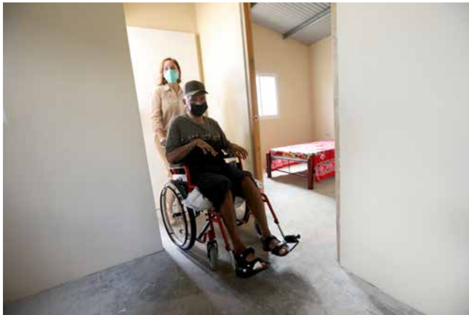
El Despacho de la Primera Dama y el Miviot entregan vivienda en el distrito de Guararé.

Junto al ministro de Vivienda y Ordenamiento Territorial (Miviot), Rogelio Paredes, el Despacho de la Primera Dama de la República, liderado por Yazmín Colón de Cortizo, entregó una residencia en el distrito de Guararé, provincia de Los Santos, a una familia en cuya composición familiar hay un adulto con discapacidad. La vivienda fue gestionada por el Miviot y equipada por el Despacho de la Primera Dama. Colón de Cortizo señaló que el Despacho a su cargo sigue atendiendo las peticiones de ayuda que a diario llegan y que este nuevo hogar mejorará la calidad de vida de esta familia panameña. Además, la primera dama visitó el Centro de Educación Básica General (CEBG) Bolívar Antonio De Gracia, en La Tiza, donde entregó computadoras, comedores, útiles escolares, cajas de jugos, balones y juguetes para los alumnos. Asimismo, la Dirección de Asistencia Social del Despacho de la Primera Dama organizó una feria interinstitucional donde el Ministerio de Salud, el Ministerio de Educación, el Instituto Nacional de la Mujer, la Secretaría Nacional de Niñez, Adolescencia y Familia, entre otras instituciones, brindaron capacitación, productos y servicios a la población de La Tiza, que se estima en alrededor de 2,000 habitantes. También se llevó ayuda social a unas 100 familias del área, consistente en leche fortificada, pañales, kits escolares y de aseo; zapatos escolares, juguetes y balones.