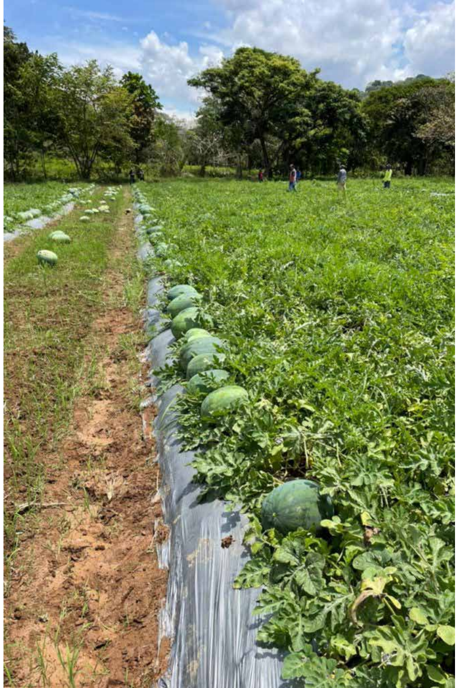
Esta actividad genera más de 400 empleos en esta zona del país.

La empresa Potuga Fruit lleva unos 200 contenedores y espera superar los 300, en tanto Agroexport Pacific tiene 140 contenedores exportados y prevé cerrar con 200 en la temporada.