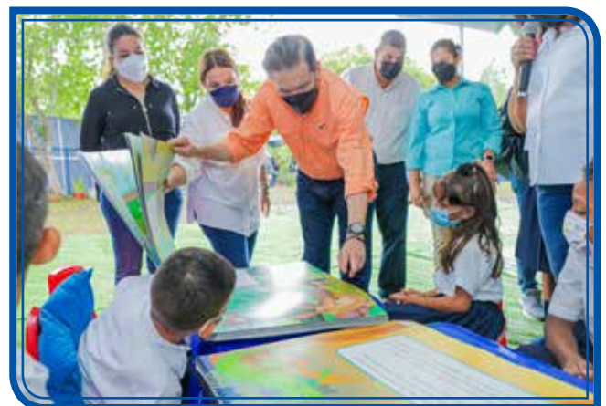
LANZAMIENTO DEL PLAN NACIONAL DE LECTURA