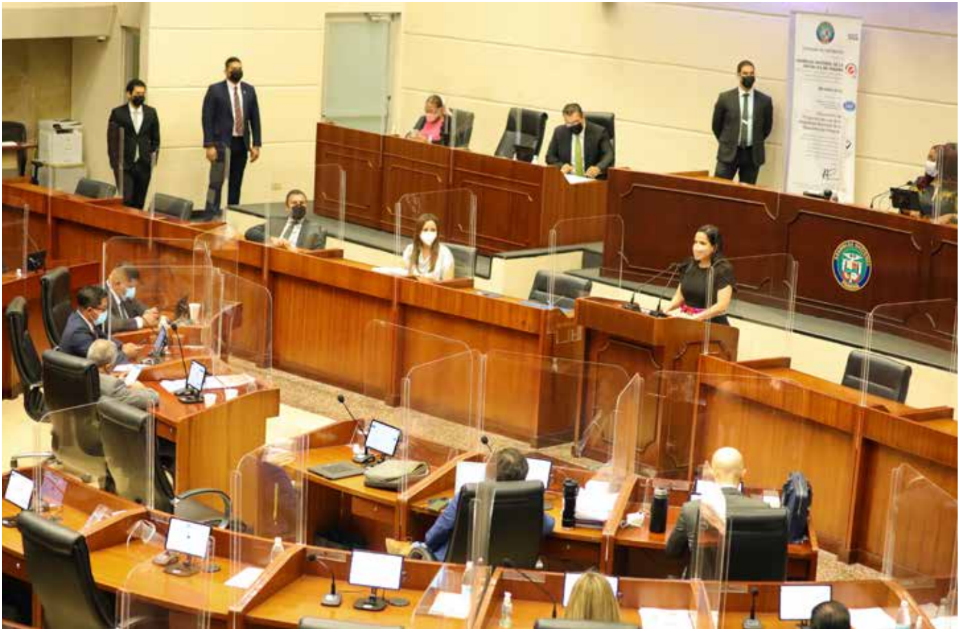
La iniciativa permitirá desarrollar políticas públicas integrales con el fin de que impere la igualdad de oportunidades en todo el territorio nacional.