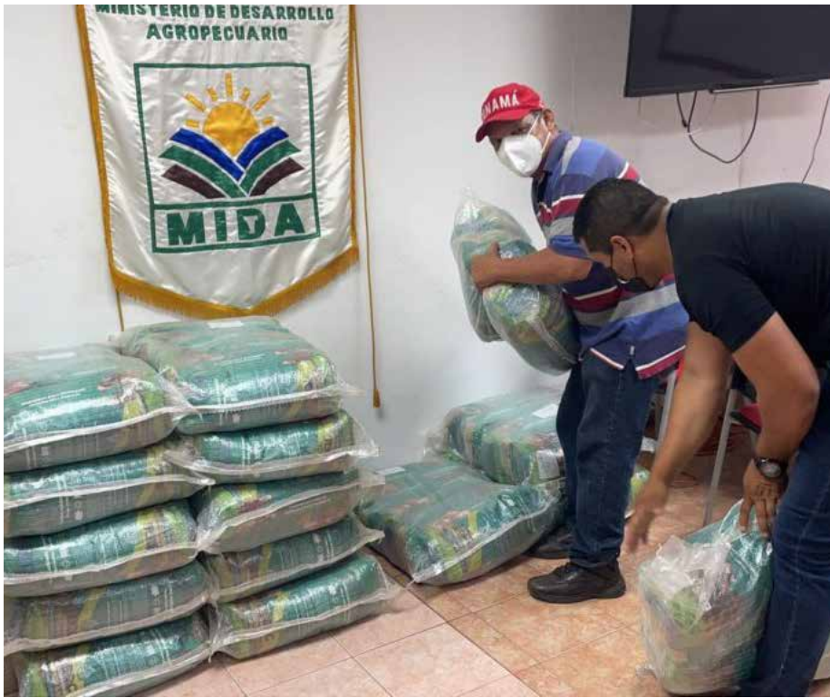
Esta semilla se utiliza para la nutrición de los sementales.

Un lote de semillas de pasto mejorado "Brachiaria decumbes" y "Basilisk" recibió el director nacional de Ganadería del Ministerio de Desarrollo Agropecuario (MIDA), Avelino Ureña, que serán entregadas durante las próximas Giras de Trabajo Comunitario (GTC) que realiza el presidente de la República, Laurentino Cortizo Cohen. Productores de diversas áreas del país reciben las bolsas con semillas de pasto durante la entrega de toros del programa Un Mejor Semental, con la finalidad de contribuir al mejoramiento nutricional de los hatos. Esta acción obedece a lineamientos del presidente Cortizo Cohen y el ministro del MIDA, Augusto Valderrama, para que los ganaderos cuenten con pasturas mejoradas en el inicio de la época lluviosa. Ureña destacó que estas semillas son muy susceptibles al estrés calórico, por lo que se mantendrán en un buen ambiente hasta entregarlas durante las próximas GTC.