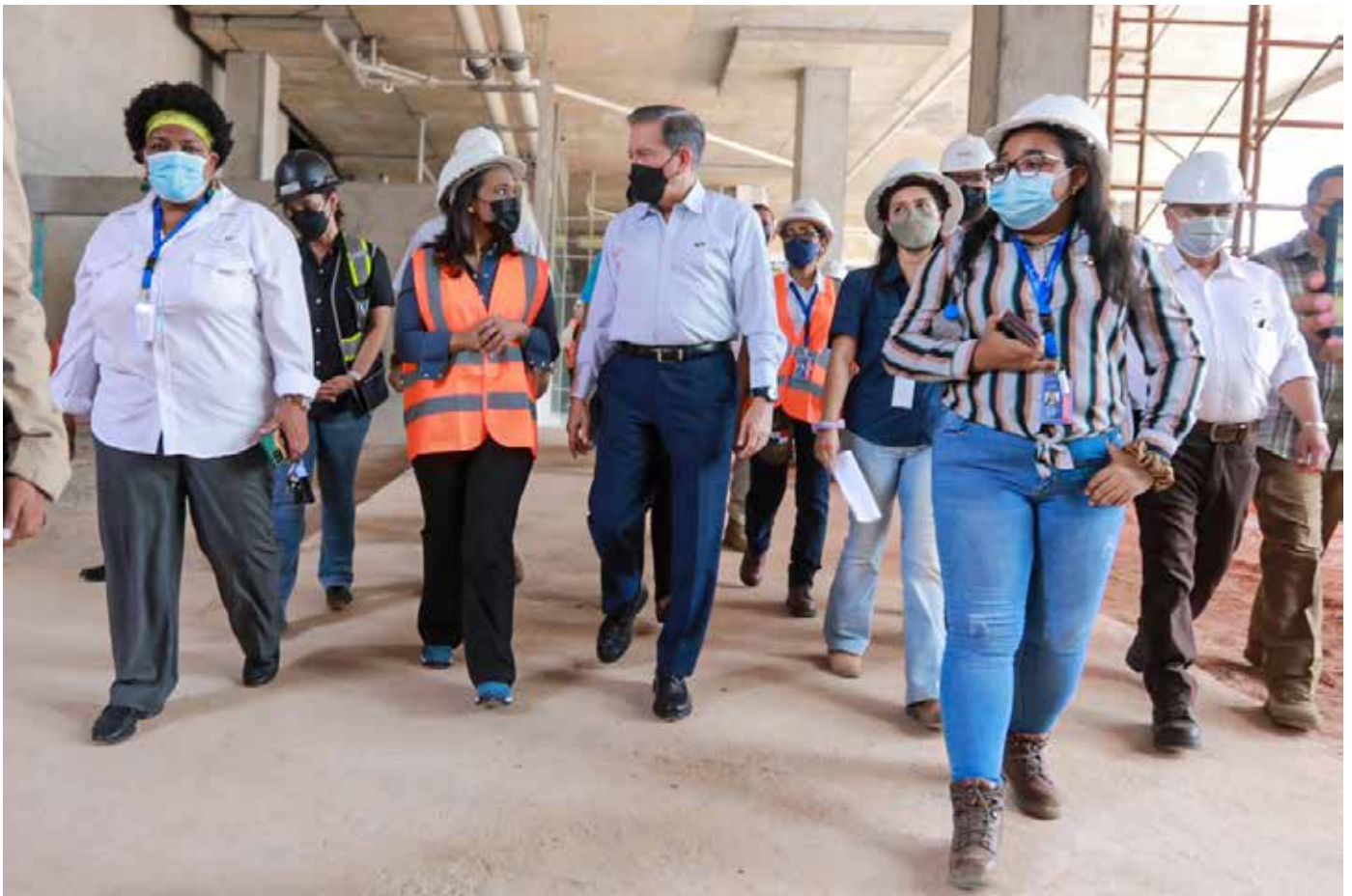
El presidente de la República, Laurentino Cortizo Cohen, hizo un recorrido por la obra que presenta un avance del 84%.

exhibiciones, biblioteca, un teatro multifuncional y albergará la sede del Círculo de Escritores y Escritoras de Panamá.