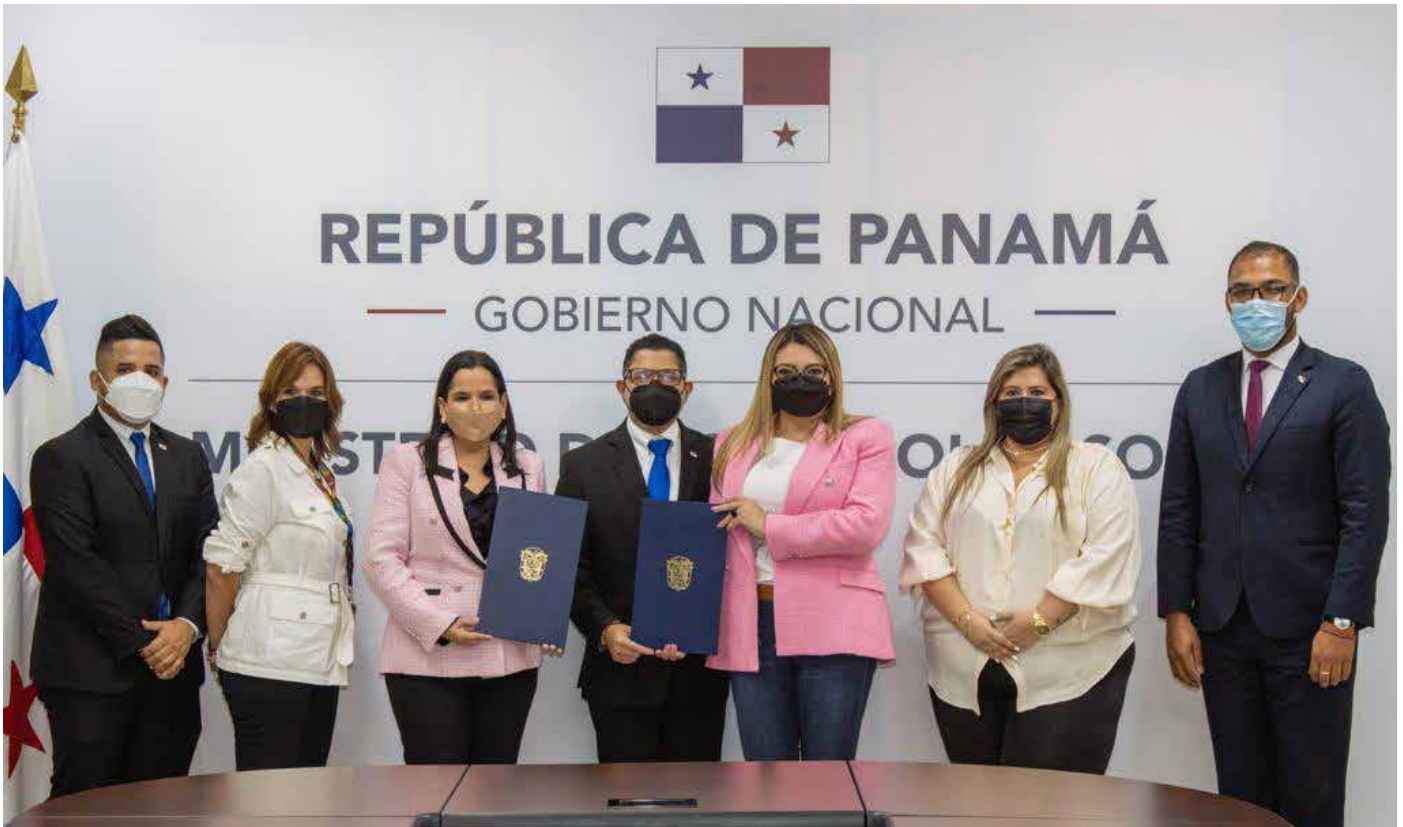
En este período se realizarán 10,000 inserciones laborales.