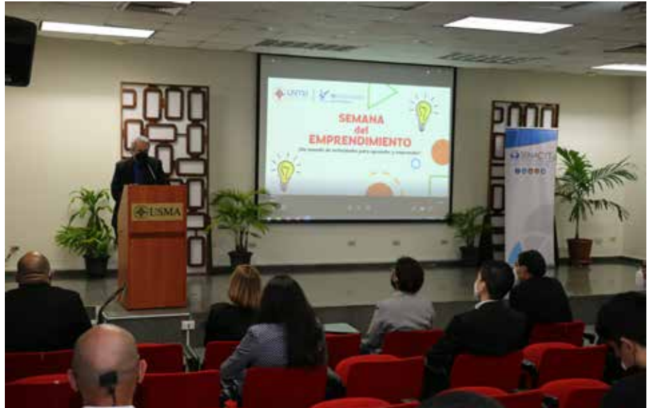
Las colaboradoras de la Senacyt compartieron información sobre las convocatorias de fomento del emprendimiento e innovación de la institución.

La Secretaría Nacional de Ciencia, Tecnología e Innovación (Senacyt) formó parte de la Semana del Emprendimiento USMA 2022, iniciativa en la que la institución compartió información sobre la Convocatoria Pública para Proyectos de Innovación Empresarial 2022. La Semana del Emprendimiento USMA 2022 contó con la participación de unos 50 emprendedores con sus proyectos e incluyó una programación de conferencias virtuales abiertas a todo público, el pasado 11 y 12 de abril. En el pabellón de la Senacyt también estuvieron presentes representantes de Vitae Health y Geoazul, dos de los ganadores del Premio Nacional a la Innovación Empresarial 2021, organizado por la Senacyt y la Cámara de Comercio, Industrias y Agricultura de Panamá (CCIAP). La meta de la actividad fue fomentar la cultura del emprendimiento, motivar el desarrollo de proyectos innovadores en la comunidad universitaria e impulsar la participación de los distintos actores de la sociedad en programas de emprendimiento.