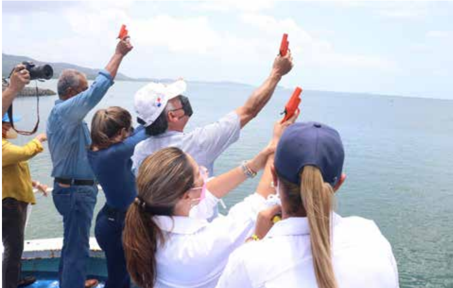
Con el disparo de luces de bengala por parte de las principales autoridades del MIDA y de la ARAP, finalizó el primer período de veda del camarón.

Con el disparo de luces de bengala y el zarpe de 100 barcos industriales camaroneros y 329 barcos artesanales con más de 1,487 tripulantes, concluyó el lunes 11 de abril el primer periodo de veda del camarón. Como parte de la reactivación económica y una apuesta a la apertura de mercados, con lo cual se benefician miles de hogares panameños, en esta ocasión salen a faena 20 embarcaciones más. Con el acto protocolar, que se realizó en el Muelle Internacional del Puerto de Vacamonte, provincia de Panamá Oeste, encabezado por el ministro de Desarrollo Agropecuario, Augusto Valderrama; la administradora de la Autoridad de los Recursos Acuáticos de Panamá (ARAP), Flor Torrijos; y la vicepresidenta de la Cámara Marítima de Panamá, Wendy Sagel, concluye el período de veda del camarón que se inició el pasado 1 de febrero y terminó el 11 de abril, según lo establecido en el Decreto 1 del 19 de enero de 1977 y en el Decreto Ejecutivo 158 del 31 diciembre de 2003. El jueves 7 de abril, el ministro Valderrama, la administradora Torrijos y sus respectivos equipos de trabajo, inspeccionaron las embarcaciones camaroneras para verificar que contaban con el dispositivo excluidor de tortugas como parte de las normas internacionales que dan fe de una pesquería certificada y una pesca responsable y sostenible.