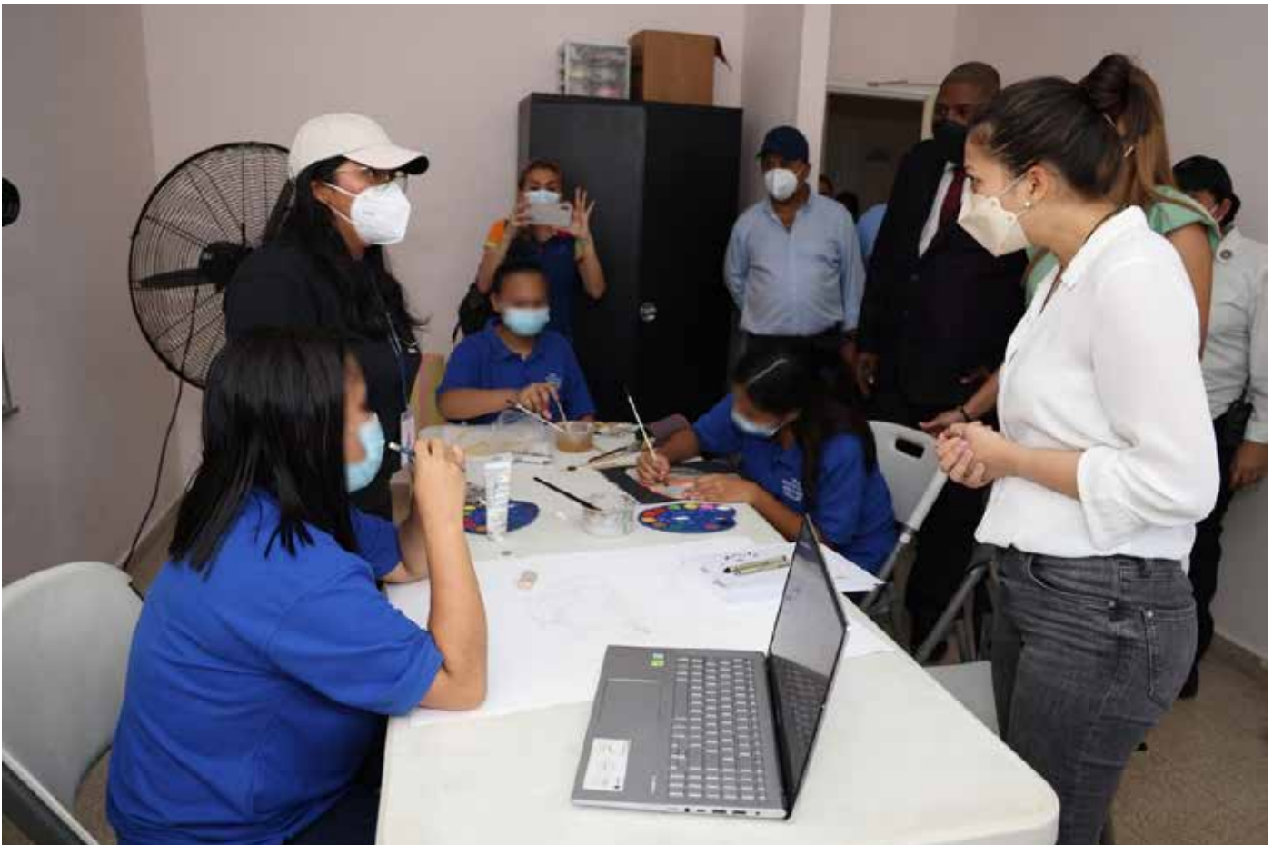
La ministra Janaina Tewaney Mencomo conversa con los profesores del Ministerio de Educación que imparten las clases a las jóvenes.

de Estudios Interdisciplinarios, con lo cual se brinda mayor comodidad y seguridad para que puedan ejercer sus labores en un ambiente más adecuado y seguro. Durante su visita, la ministra de Gobierno habló con las jóvenes, visitó los talleres de pintura, costura, área de recreación, estudios y los dormitorios. Así mismo, conversó con el grupo de profesores del Ministerio de Educación que imparten clases en los centros.