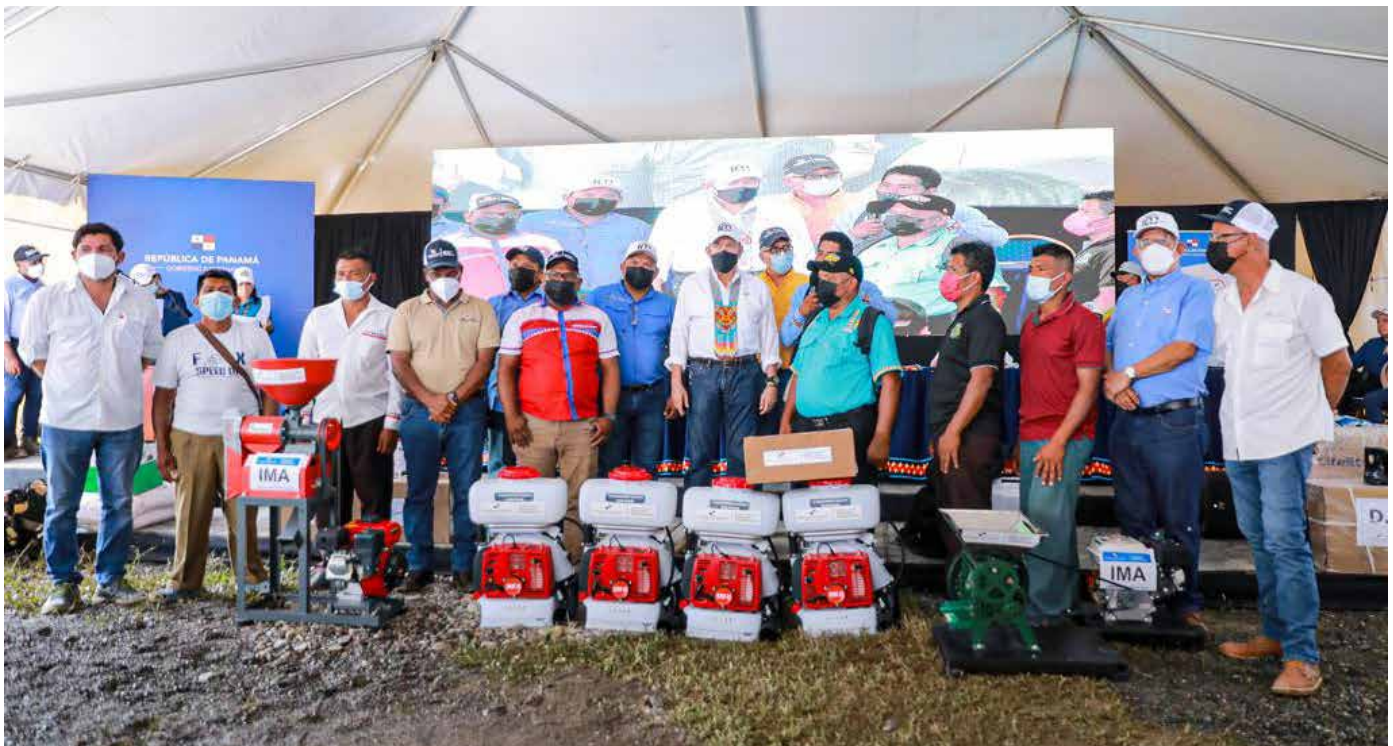
Productores de la comarca Ngäbe Buglé recibieron kits de herramientas.