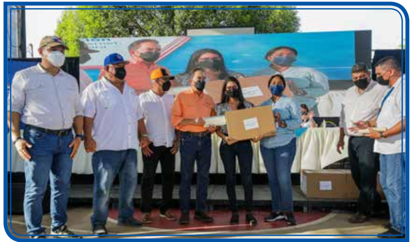
BECAS, LAPTOPS Y TABLETS