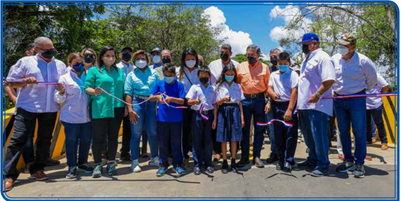
INAUGURACIÓN DEL PUENTE VEHICULAR SOBRE QUEBRADA LA HONDA EN LOS ÁNGELES

En la Gira de Trabajo Comunitario (CTG) realizada este viernes 22 de abril en la provincia de Los Santos, liderada por el presidente, Laurentino Cortizo Cohen, se entregaron obras por B/.7,188,881.10. Como parte de la actividad, se inauguró el puente vehicular sobre Quebrada Honda, que beneficia a unos 5 mil habitantes de las comunidades de Los Ángeles de Botello, La Espigadilla, Santa Ana y Sabana Grande; se entregaron sementales de razas Brahman y zardo y pasto mejorado a 92 pequeños productores de esta provincia, y se hizo el lanzamiento oficial del Plan Nacional de Lectura en la Escuela Las Guabas, una iniciativa orientada a formar lectores desde la educación inicial. Como parte de las actividades, el gobernante sancionó la ley que incentiva la movilidad eléctrica en el transporte terrestre y promueve la transición del transporte de combustión interna a eléctrico. Además, 13 participantes recibieron su certificación del programa de Alfabetización, 22 estudiantes universitarios del programa Transformando Vidas recibieron becas, tabletas y "laptops"; y se entregaron 20 certificados de culminación de cursos del Inadeh. Por un monto de B/.5,069,520.00, se emitió la orden de proceder para la rehabilitación de 36.64 kilómetros de caminos de producción en la provincia de Los Santos. También se gestionó la firma de 16 contratos de inserción laboral, se entregaron 37 soluciones habitacionales, vehículo a la Junta Comunal de Cañas e insumos a la región de Salud de Los Santos.