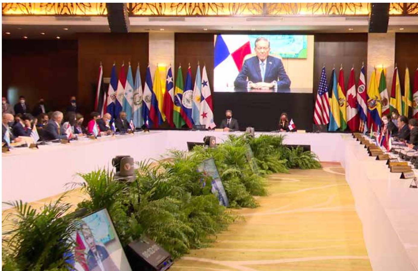
La canciller Erika Mouynes y el secretario de Estado de los Estados Unidos, Antony Blinken, en la reunión ministerial sobre migración celebrada en Panamá.