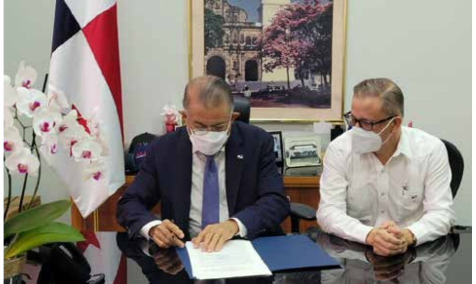
El ministro Valderrama y el viceministro Rognoni, durante la firma de la resolución.

De esta manera se reafirma el reconocimiento del presidente de la República, del Gobierno Nacional y del sector agropecuario, a los productores de arroz.