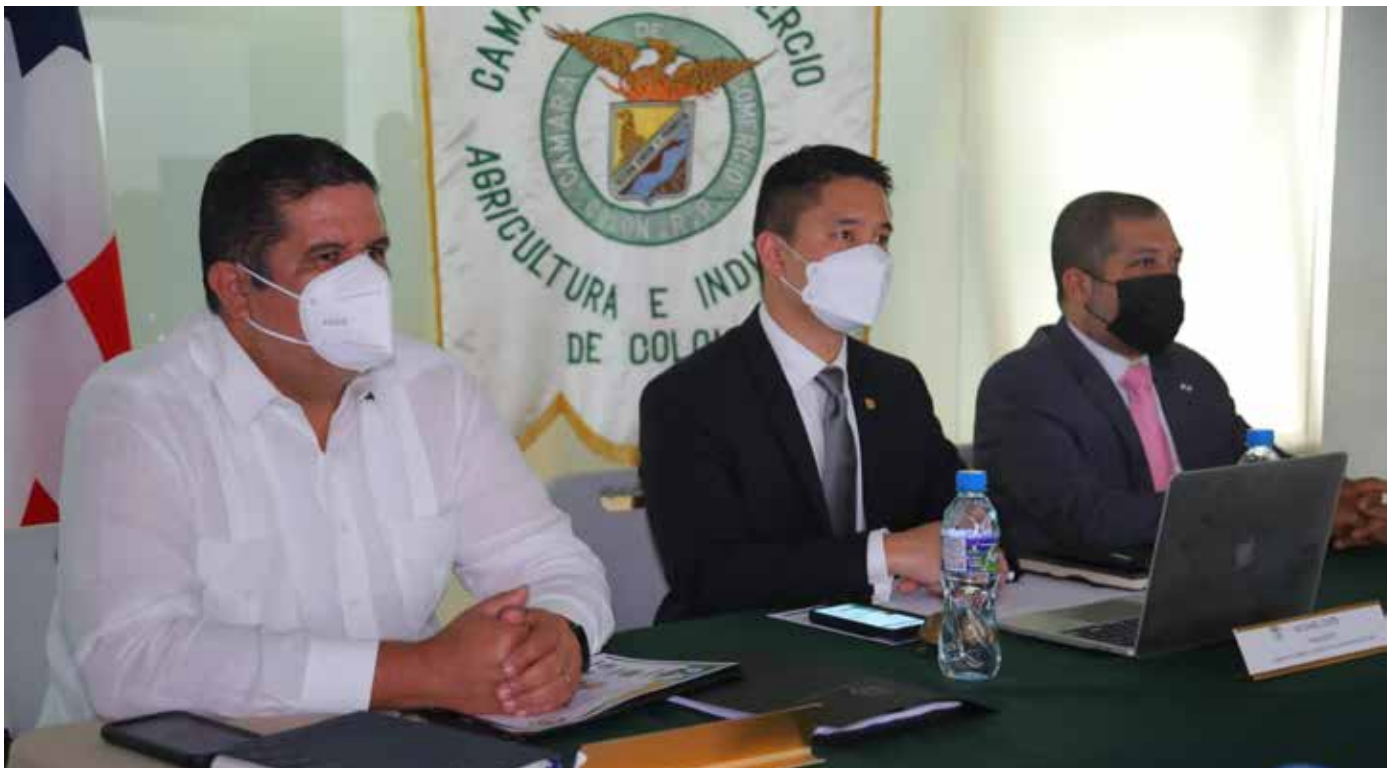
El ministro Pino presentó a los empresarios programas preventivos y resultados efectivos contra la delincuencia.

sociedad civil en general, para enviarle a la comunidad nacional e internacional el mensaje de que "todos somos parte de un solo equipo que se llama Colón".