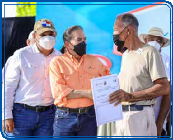
TÍTULOS DE PROPIEDAD