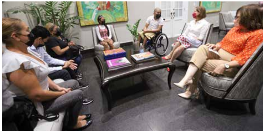
El Despacho de la Primera Dama brinda apoyo a jóvenes con osteogénesis imperfecta.