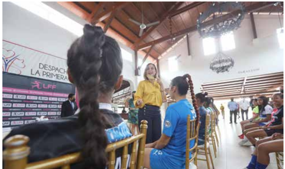
En el torneo 2022 participan 16 clubes y 400 jugadoras.

El Despacho de la Primera Dama de la República, liderado por Yasmín Colón de Cortizo, será patrocinador oficial de la Liga de Fútbol Femenino torneo 2022. El anuncio se hizo en conferencia de prensa realizada en la Casa Club del Parque Recreativo y Cultural Omar, en presencia de algunas jugadoras y parte de la directiva. La primera dama indicó que es un orgullo para el Despacho ser patrocinador oficial en esta temporada de esta Liga que busca “profesionalizar la rama femenina”. Además, destacó que es un compromiso del Gobierno apoyar el deporte, no solo con implementos y creando espacios para que se practiquen distintas disciplinas, sino también dando soporte emocional y lograr el trato equitativo para los equipos masculinos y femeninos. El torneo 2022 de la Liga de Fútbol Femenino se inició el pasado 14 de abril, con 16 clubes participantes y 2,000 jugadoras inscritas. Actualmente participan 400 jugadoras en el torneo.