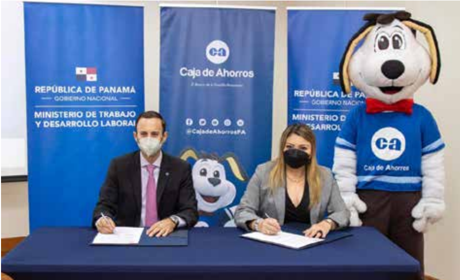
El acuerdo facilitará a los becarios la apertura de cuentas simplificadas.