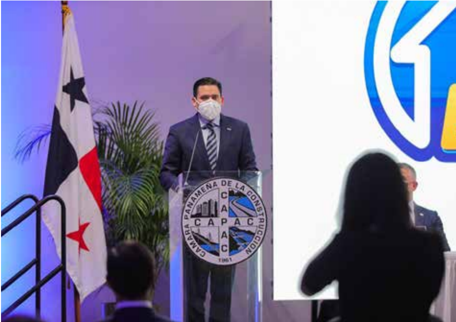
El vicepresidente de la República y ministro de la Presidencia, José Gabriel Carrizo Jaén, presentó un informe durante su participación en la inauguración de Expo Vivienda Capac 2022.