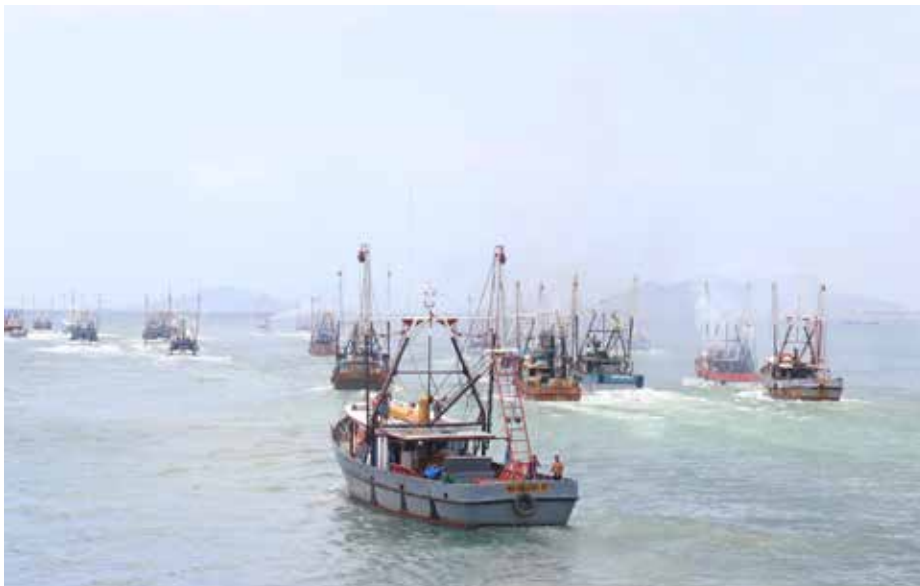
Cien barcos industriales y 329 artesanales emprendieron, el pasado lunes 11 de abril, su faena de pesca de camarón.

Con el disparo de luces de bengala y el zarpe de 100 barcos industriales camaroneros y 329 barcos artesanales con más de 1,487 tripulantes, concluyó el lunes 11 de abril el primer periodo de veda del camarón. Como parte de la reactivación económica y una apuesta a la apertura de mercados, con lo cual se benefician miles de hogares panameños, en esta ocasión salen a faena 20 embarcaciones más. Con el acto protocolar, que se realizó en el Muelle Internacional del Puerto de Vacamonte, provincia de Panamá Oeste, encabezado por el ministro de Desarrollo Agropecuario, Augusto Valderrama; la administradora de la Autoridad de los Recursos Acuáticos de Panamá (ARAP), Flor Torrijos; y la vicepresidenta de la Cámara Marítima de Panamá, Wendy Sagel, concluye el período de veda del camarón que se inició el pasado 1 de febrero y terminó el 11 de abril, según lo establecido en el Decreto 1 del 19 de enero de 1977 y en el Decreto Ejecutivo 158 del 31 diciembre de 2003. El jueves 7 de abril, el ministro Valderrama, la administradora Torrijos y sus respectivos equipos de trabajo, inspeccionaron las embarcaciones camaroneras para verificar que contaban con el dispositivo excluidor de tortugas como parte de las normas internacionales que dan fe de una pesquería certificada y una pesca responsable y sostenible.