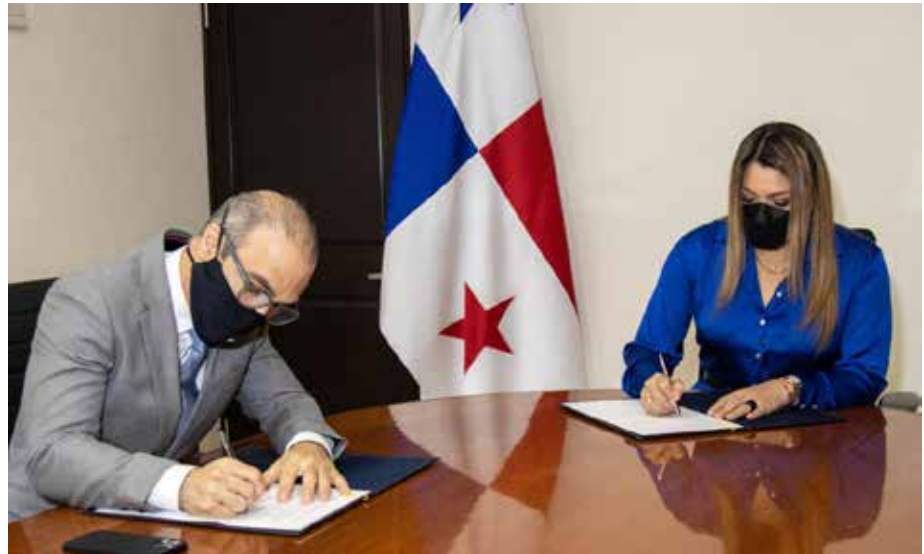
El Mitradel y ARPA firman memorando de entendimiento.

A través de la firma de un memorando de entendimiento, el Ministerio de Trabajo y Desarrollo Laboral (Mitradel) y la Asociación Armadores de Panamá (ARPA) formalizaron una alianza estratégica con miras a brindarles a los jóvenes panameños nuevas oportunidades de formación y capacitación para promover la empleabilidad en el área marítima. Los miembros de ARPA desarrollarán programas y capacitaciones relacionadas al transporte marítimo, maquinaria naval y navegación, así como procurar la organización conjunta de eventos y actividades como congresos, simposios, talleres, conferencias y ferias científicas y académicas. La titular del Mitradel, Doris Zapata Acevedo, afirmó que se capacitará a jóvenes en aspectos teóricos y prácticos en el área marítima, buscando brindarles nuevas oportunidades de empleo y con esto, preservar la paz laboral mediante el respeto a los derechos fundamentales y laborales, gestionando las políticas públicas de empleo y trabajo decente, promoviendo el progreso de los empleadores y el mejoramiento de la calidad de vida de los trabajadores, en este caso, del sector marítimo.