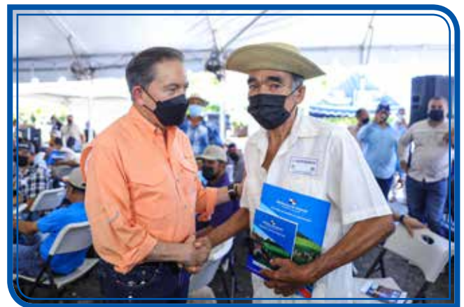
ENTREGA DE SEMENTALES

En la Gira de Trabajo Comunitario (CTG) realizada este viernes 22 de abril en la provincia de Los Santos, liderada por el presidente, Laurentino Cortizo Cohen, se entregaron obras por B/.7,188,881.10. Como parte de la actividad, se inauguró el puente vehicular sobre Quebrada Honda, que beneficia a unos 5 mil habitantes de las comunidades de Los Ángeles de Botello, La Espigadilla, Santa Ana y Sabana Grande; se entregaron sementales de razas Brahman y zardo y pasto mejorado a 92 pequeños productores de esta provincia, y se hizo el lanzamiento oficial del Plan Nacional de Lectura en la Escuela Las Guabas, una iniciativa orientada a formar lectores desde la educación inicial. Como parte de las actividades, el gobernante sancionó la ley que incentiva la movilidad eléctrica en el transporte terrestre y promueve la transición del transporte de combustión interna a eléctrico. Además, 13 participantes recibieron su certificación del programa de Alfabetización, 22 estudiantes universitarios del programa Transformando Vidas recibieron becas, tabletas y "laptops"; y se entregaron 20 certificados de culminación de cursos del Inadeh. Por un monto de B/.5,069,520.00, se emitió la orden de proceder para la rehabilitación de 36.64 kilómetros de caminos de producción en la provincia de Los Santos. También se gestionó la firma de 16 contratos de inserción laboral, se entregaron 37 soluciones habitacionales, vehículo a la Junta Comunal de Cañas e insumos a la región de Salud de Los Santos.