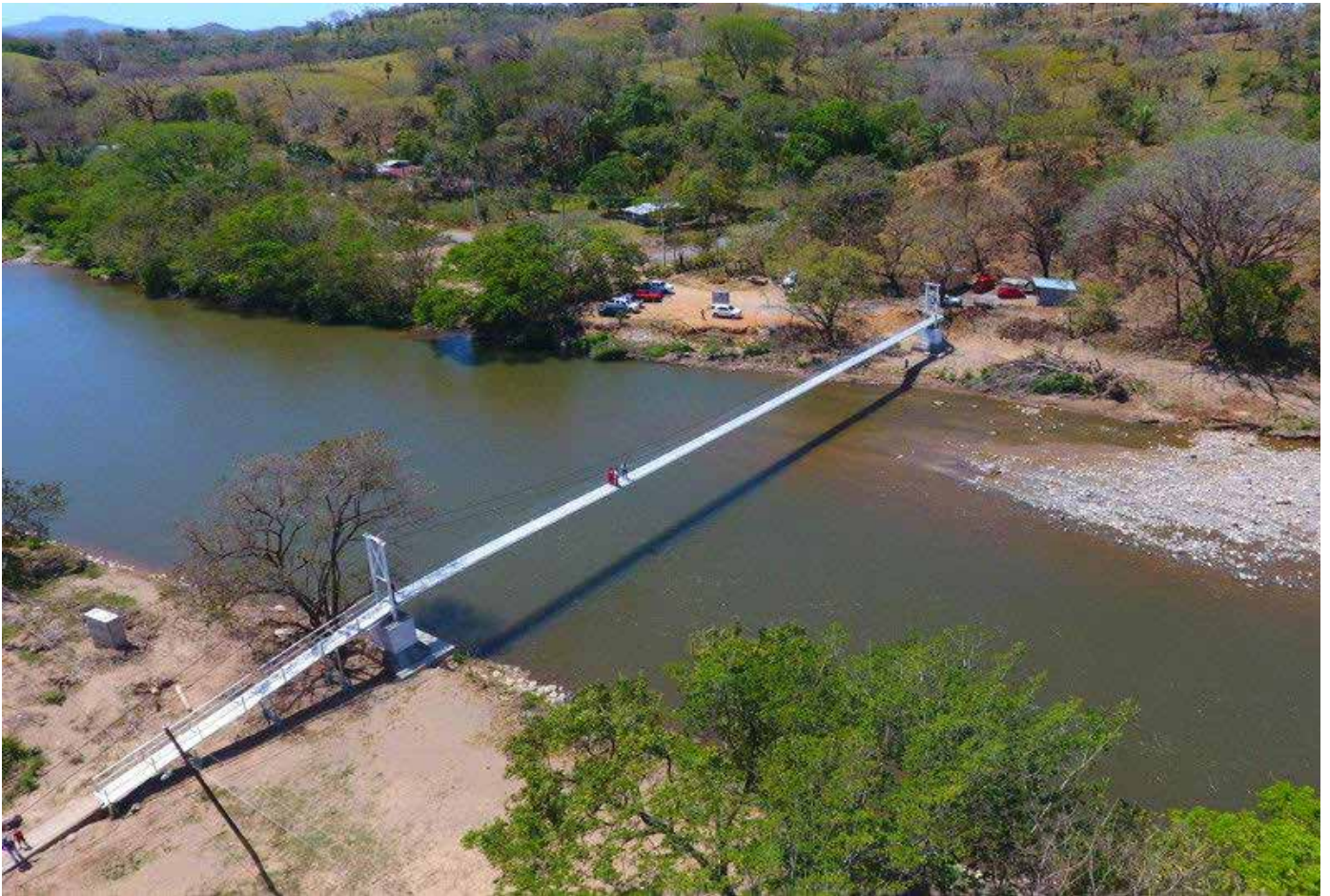
Puente peatonal sobre el río Fonseca, en el corregimiento de Boca del Monte, distrito de San Lorenzo, provincia de Chiriquí.