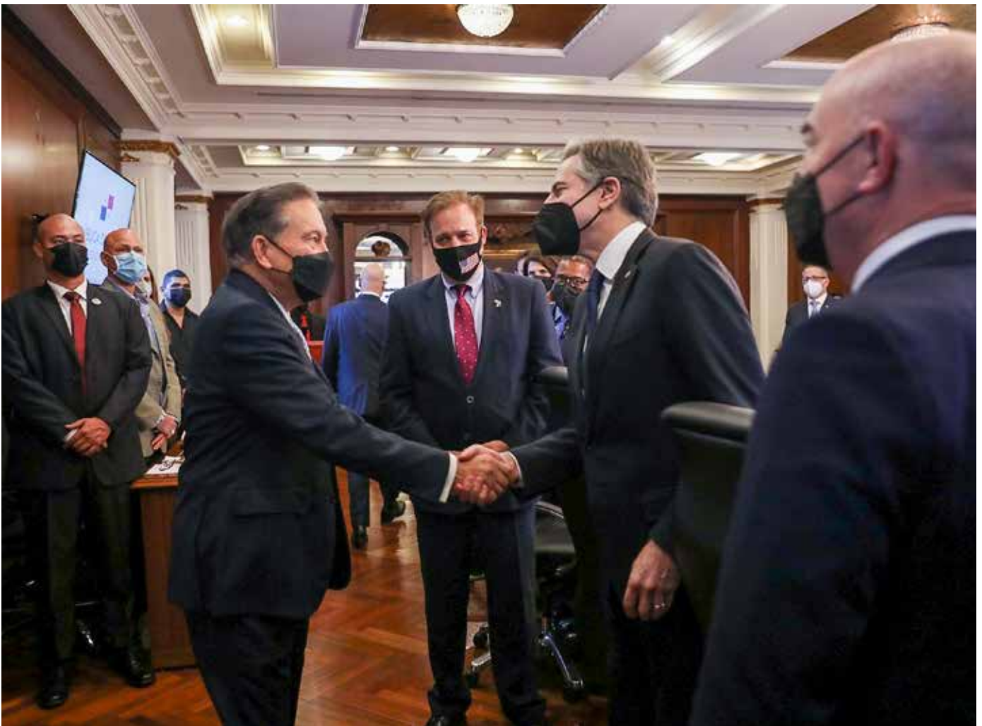
El secretario de Estado de Estados Unidos, Antony Blinken, participó en el país, entre el martes 19 y miércoles 20, en la Reunión Ministerial sobre Migración convocada por la cancillería panameña.

en que Panamá y Estados Unidos deben fortalecer los vínculos de cooperación ambiental para abordar la emergencia climática y reforzar estrategias globales de mitigación. El secretario Blinken estuvo en Panamá para participar, entre el martes 19 y miércoles 20, en la Reunión Ministerial sobre Migración que da continuidad a la primera conversación sobre el tema que propuso la canciller Erika Mouynes en agosto del año pasado, en esa ocasión de forma virtual.