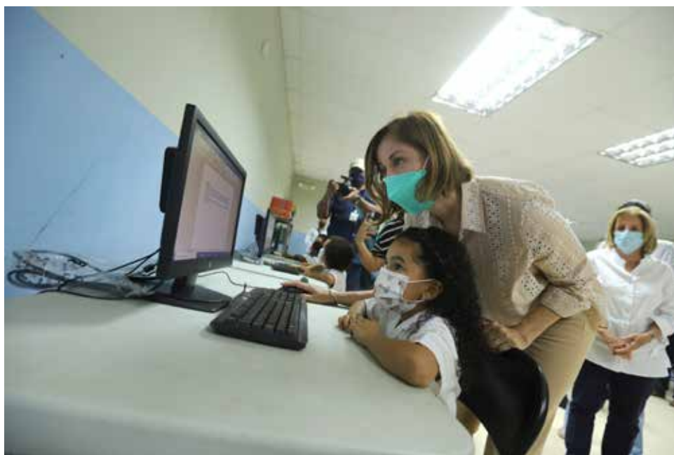
La primera dama visitó el CEBG Bolívar Antonio De Gracia, en La Tiza, donde entregó computadoras para el salón de informática.