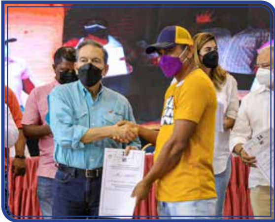
TÍTULOS DE PROPIEDAD