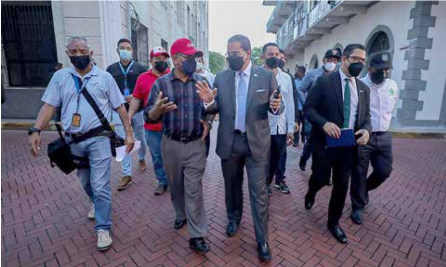
La comitiva designada por el presidente Laurentino Cortizo Cohen atendió en el Palacio Presidencial a representantes de Conusi y de Frenadeso.