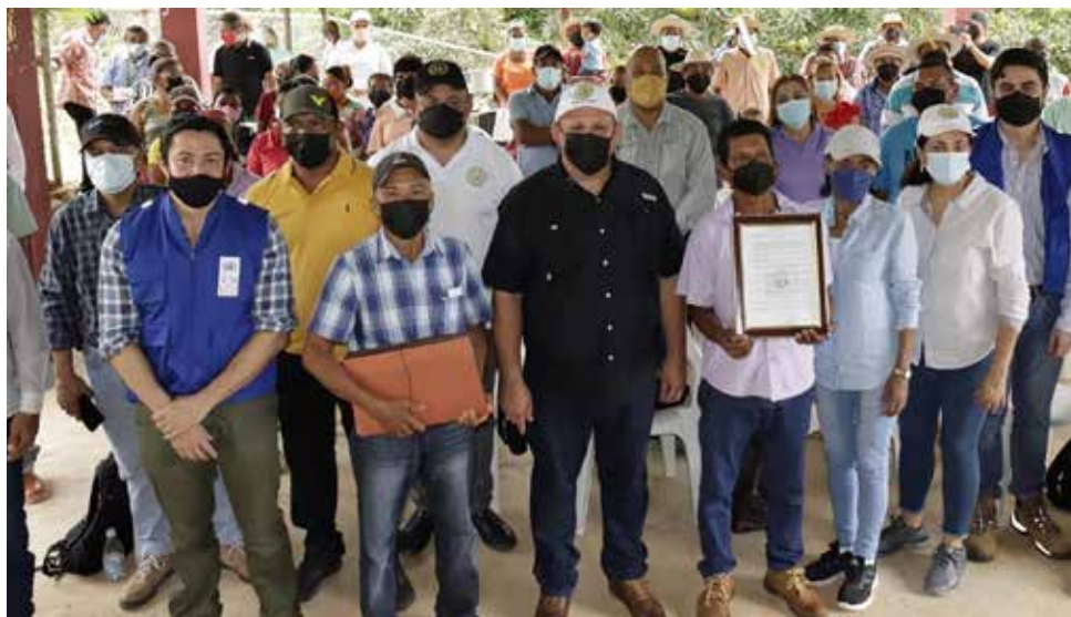
Asociados de la Cooperativa de Servicios Múltiples Dos Aguas Progresá, R.L. junto a representantes de las entidades que participan en este importante proyecto.

El Ipacoop facilitará un capital semilla de B/.3,000.00 para la adquisición de electrodomésticos.