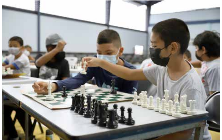
Tres colegios oficiales iniciarán este programa.