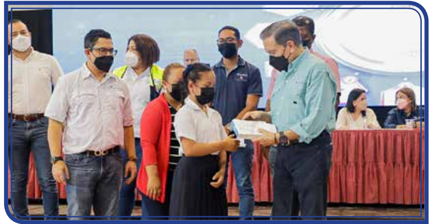
BECAS, LAPTOPS Y TABLETS