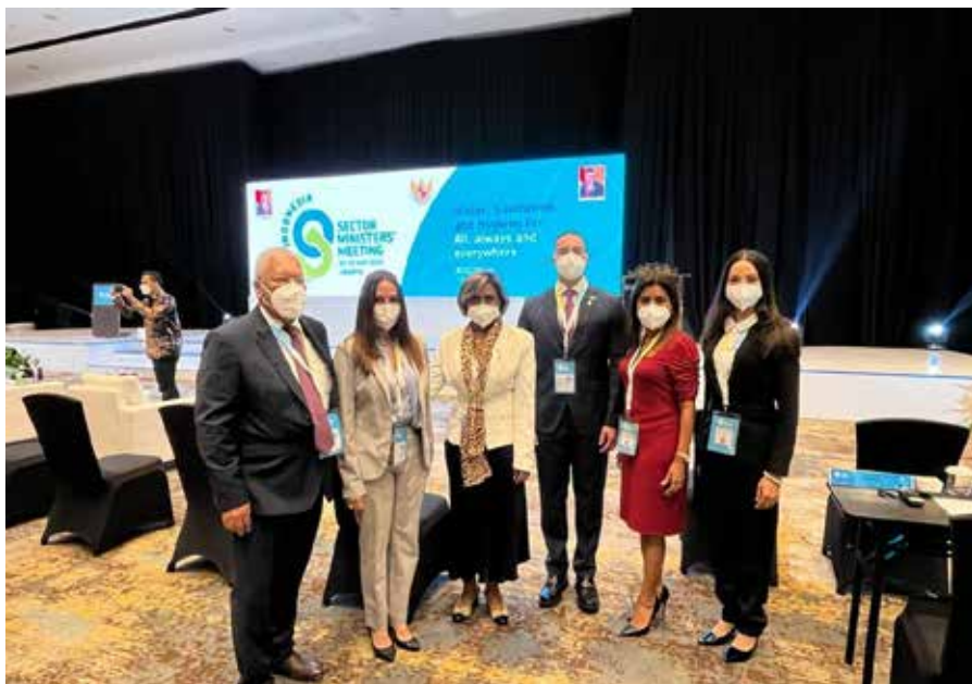
Panamá expuso sus avances en materia de acceso al agua potable en las comunidades rurales.

El evento fue organizado por el Gobierno de Indonesia y convocado por la Alianza Mundial de Saneamiento y Agua para Todos (SWA), Unicef y auspiciado por Naciones Unidas.