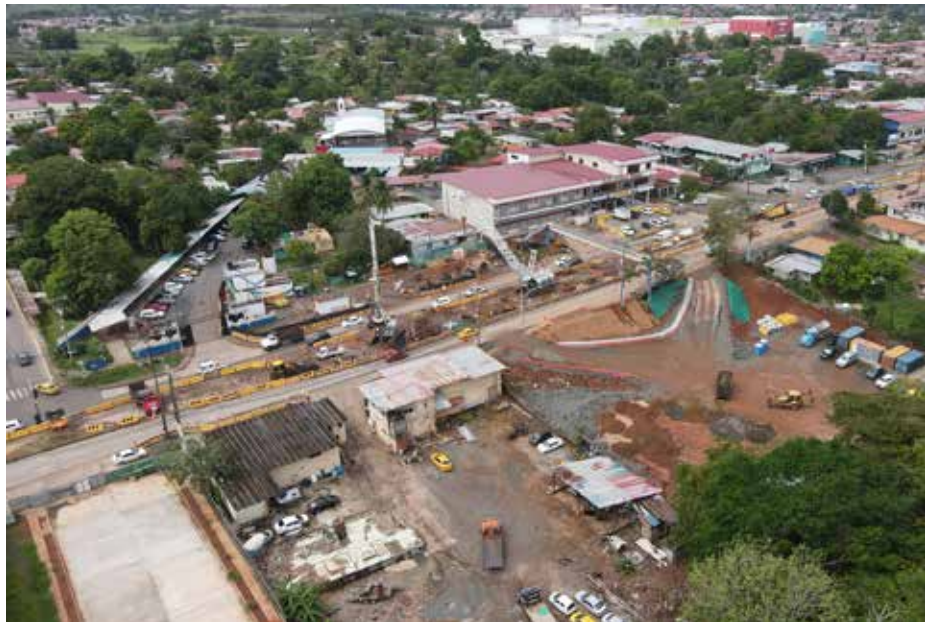
Ya se inició la fase de pilotaje de esta estructura.

Esta estación medirá 34 metros de ancho y 100 de longitud, mientras que las demás tienen un aproximado de 24 metros de ancho y la misma longitud.