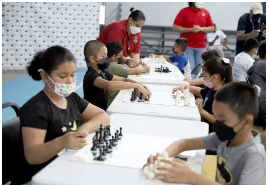
El ajedrez es un juego motivador y desarrollador mental que permite en su práctica constante que los niños mejoren distintas habilidades.