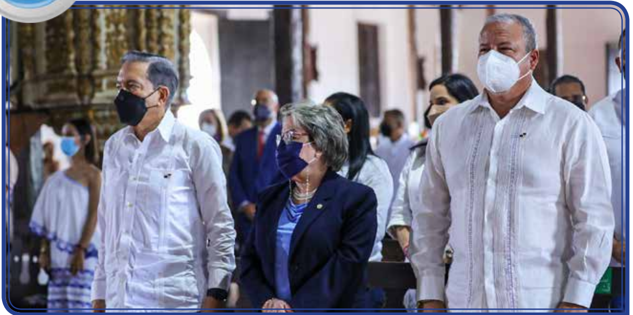
CELEBRACIÓN DE FUNDACIÓN DE NATÁ

Como parte de la Gira de Trabajo Comunitario (GTC) de esta semana, que se llevó a cabo en el circuito 2-1, el presidente de la República, Laurentino Cortizo Cohen, sancionó la ley que crea el Área Económica Especial de Aguadulce y la terminal portuaria multipropósito, ubicada en la comunidad de El Salado, y entregó beneficios por B/.1,719,690. Durante la gira 104, el Presidente participó en los actos de celebración de los 500 años de fundación de la ciudad de Natá de los Caballeros, además se entregaron 20 sementales de alta genética a pequeños productores coclesanos, 4 certificados de alfabetización; 18 productores recibieron indemnizaciones por B/.22,599.00 y herramientas agrícolas; y se proporcionó capital semilla a 25 emprendedores por B/.49,550.00. En materia educativa, se entregaron dos tableros digitales, 10 "tablets" y cinco Bibliotecas de Aulas a estudiantes y docentes de escuelas públicas. A través del programa Transformando Vidas, se proporcionaron becas y "laptops" a 20 estudiantes universitarios; además, se dieron 15 certificados de culminación de curso. También se entregó la cancha deportiva multiuso del Centro de Educación Básica General Sofía Quirós de Tejeira y la de la Escuela Pablo Alzamora Vargas. La región de Salud de Coclé recibió 5 sillas de ruedas, insumos y medicamentos; se gestionó la firma de 8 contratos laborales y se otorgaron 10 becas del programa Acción Directa Gubernamental, y 12 soluciones habitacionales.