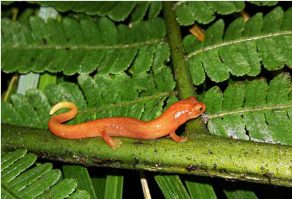
El nombre común es salamandra de fuego chiricana.