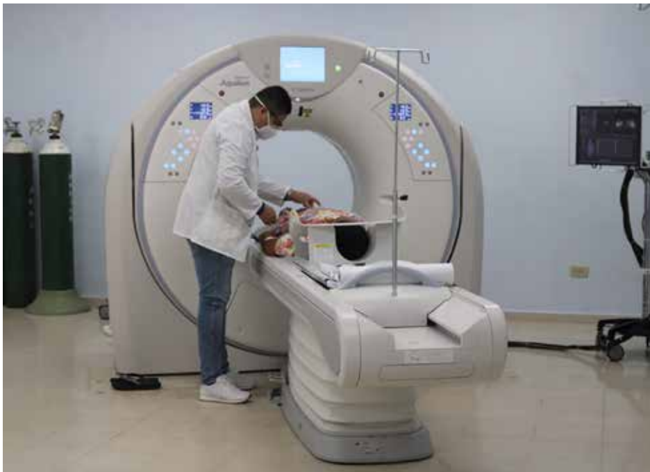
El tomógrafo posee una capacidad de 80 y 160 cortes que aseguran la obtención rutinaria de imágenes de alta calidad para realizar un mejor diagnóstico.