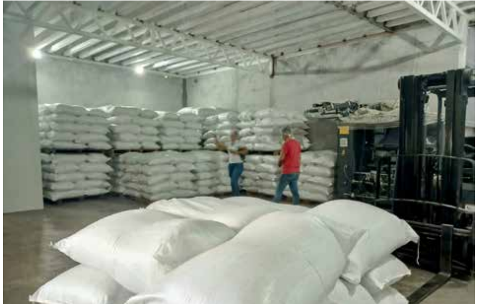
Técnicos del IMA verifican la presentación y calidad de todos los productos.

Con el propósito de apoyar al productor nacional, el Ministerio de Desarrollo Agropecuario (MIDA) y el Instituto de Mercadeo Agropecuario (IMA) han efectuado acuerdos con productores de cebolla, frijol chiricano y porcicultores, para adquirir parte de su producción. En ese sentido, se acordó con la Asociación Nacional de Porcicultores (Anapor) y la Asociación de Porcicultores Unidos de Panamá (APUP) la adquisición de 5 mil cerdos, de los cuales ya se ha recibido un 75% para abastecer los programas de Solidaridad Alimentaria que ejecuta el IMA. Del mismo modo, autoridades del MIDA y el IMA se reunieron con productores de cebolla de Tierras Altas de Chiriquí; Los Santos, Herrera y Natá, acordándose adquirir un total de 90 mil quintales del rubro, a un precio de B/.42.00 por quintal, lo que representa B/.3,780,000.00. La producción de cebollas es distribuida para programas sociales del Gobierno Nacional dirigidas a la población vulnerable; también se han donado a comedores, instituciones públicas y organizaciones no gubernamentales. Mientras que, con productores de frijol chiricano, se determinó la compra de 20 mil quintales del grano, a un precio de B/.75.00 por quintal, los cuales son destinados a programas de solidaridad alimentaria que lleva a cabo el IMA, como las agroferias, agrotiendas y bolsas de comida. La inversión de esta producción es de B/.1,500,000.00.