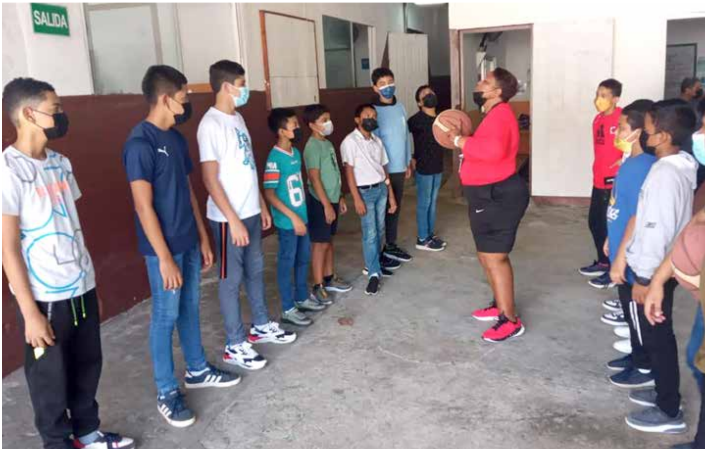
Con el deporte se busca captar la mayor cantidad de niños y jóvenes para alejarlos de la delincuencia.

“Ultimate frisbee” es una disciplina deportiva sin contacto, que combina el juego rápido del balonmano, la parte física del fútbol, la estrategia del baloncesto, el juego de pies del tenis y un sistema de puntuación similar al “rugby” o fútbol americano.