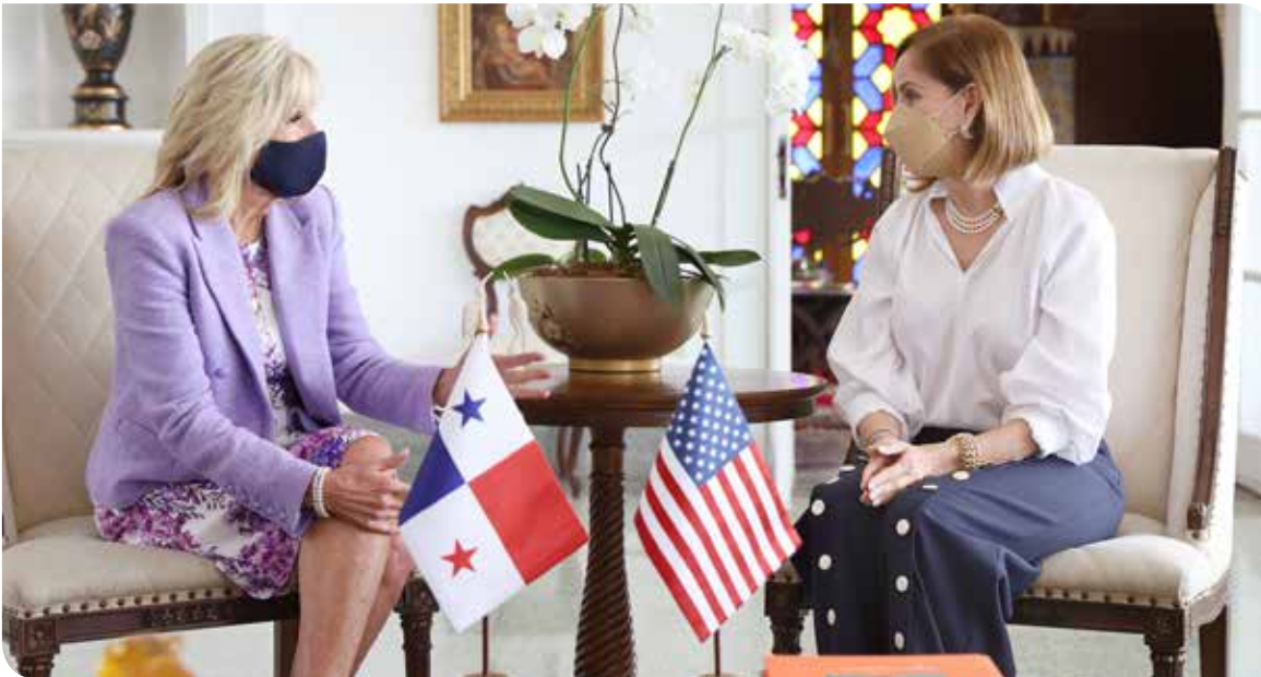
El encuentro tuvo lugar en la Presidencia de la República.

La primera dama de la República, Yasmín Colón de Cortizo, recibió el viernes 20 de mayo a su homóloga estadounidense, Jill Biden, en el marco de una gira de misión social que realiza en Latinoamérica. Como parte de la agenda en el país, la primera dama panameña invitó a la esposa del presidente de Estados Unidos a conocer el Programa Ver y Oír para Aprender en la Escuela Hogar de la Infancia, ubicada en la avenida Pablo Arosemena, corregimiento de San Felipe, distrito y provincia de Panamá, con el que se busca mejorar la calidad de vida y el rendimiento escolar de miles de estudiantes de áreas vulnerables, ofreciéndoles exámenes visuales y auditivos, así como lentes y audífonos de acuerdo con los diagnósticos que emiten los especialistas. Jill Biden presenció la realización