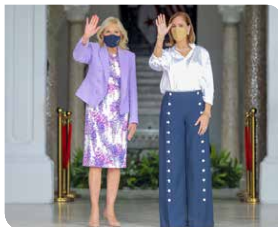
Biden y Colón de Cortizo sostuvieron una reunión bilateral para hablar de los programas sociales y educativos que ejecutan ambas administraciones.