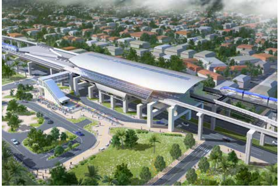
Imagen conceptual de la Estación Vista Alegre.

La Estación Vista Alegre es, de todas las estaciones de la Línea 3, la más grande. Ubicada entre el margen central y sur de la carretera Panamericana, contigua a la Escuela Roberto Francisco Chiari, será la única estación que cuente con tres vías y tres andenes (área de espera de los monorraíles), dos centrales y uno lateral. Vista Alegre es el corregimiento del distrito de Arraiján con mayor población, más de 60,400 habitantes, por lo que contar con una estación es de gran beneficio para los moradores de las comunidades que conforman este sector. Las características diferenciadoras de la Estación Vista Alegre se deben a que, al igual que la Estación Corredor Sur, de la Línea 2, se operará el circuito corto (Albrook - Vista Alegre 21km) y largo (Albrook - Ciudad del Futuro 24.5km), donde los usuarios podrán iniciar desde este punto su recorrido, beneficiando así con mayor capacidad para los trenes. Como parte del urbanismo y siendo otro beneficio para los usuarios, esta estación contará con un edificio de estacionamientos semisoterrados, donde el primer piso estará destinado a la integración con los demás sistemas de transportes.