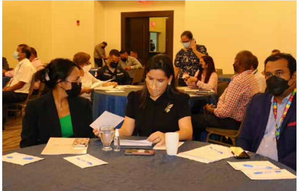
El Gobierno Nacional se prepara para la construcción del Informe Nacional Voluntario.

La titular de la cartera social hizo un llamado a fortalecer los instrumentos de recolección de información que le permitirán al Gobierno Nacional realizar intervenciones oportunas.