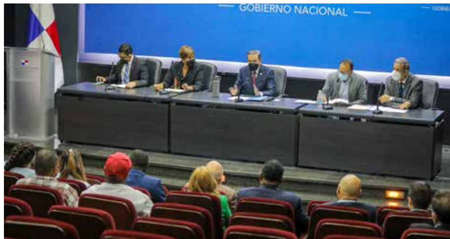
Durante una reunión con dirigentes sindicales y empresarios de la provincia de Colón, se siguió abordando las alternativas para mejorar la calidad de vida de los colonenses y soluciones al alza de empleo.

El gobernante Laurentino Cortizo Cohen y la dirigencia de Colón acordaron presentar un plan de capacitación para el empleo.