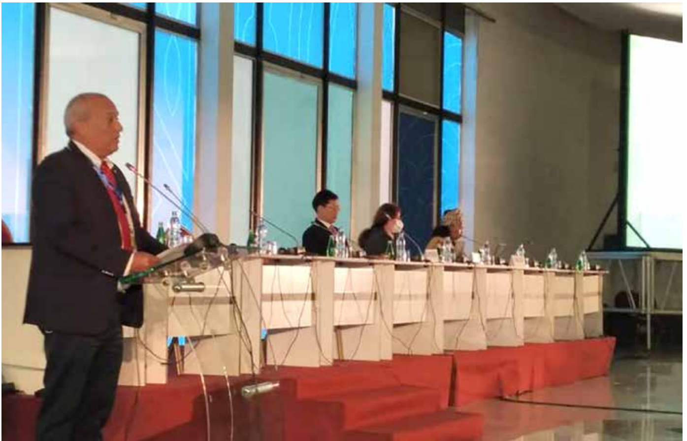
La Convención de las Naciones Unidas de Lucha contra la Desertificación (UNCCD) dio inicio el lunes 9 de mayo en Costa de Marfil, África.