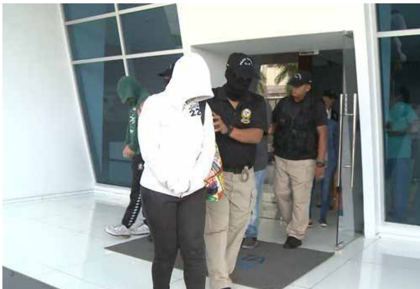
Este es considerado el tercer delito más lucrativo en el mundo.

Las menores de edad fueron rescatadas mediante la Operación Luz de Esperanza en el cordón fronterizo entre Panamá y Costa Rica.