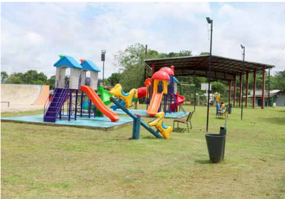
El parque consta de dos juegos infantiles, una pista de patinetas, máquinas para hacer ejercicios y un gazebo.