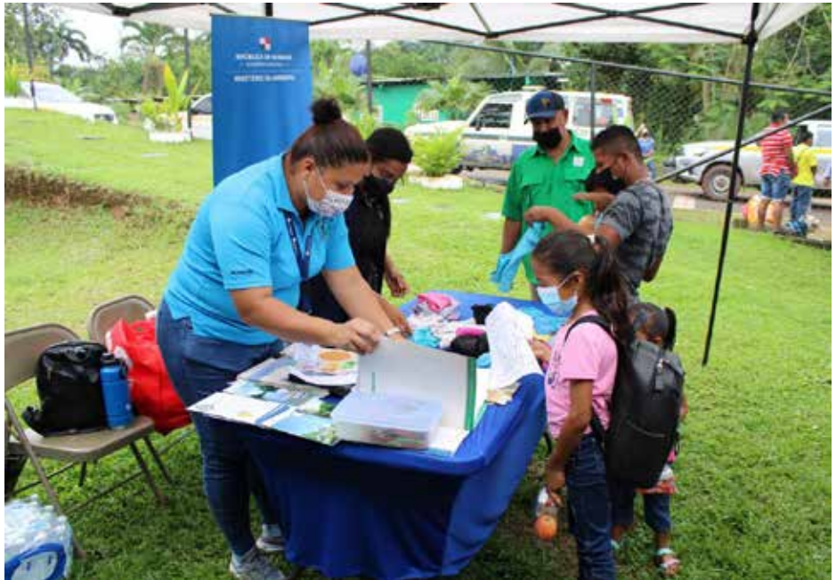
Niños y adultos escucharon charlas sobre la importancia de la conservación de la flora y fauna.

Se logró la sensibilización en temas ambientales y divulgación de los proyectos que ejecuta la institución.