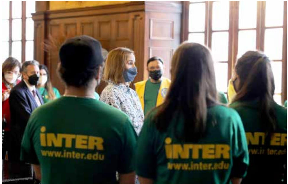
Profesionales de la optometría de Panamá y Puerto Rico realizan esta investigación en conjunto con el Club de Leones.

Al menos 7 profesores y 15 estudiantes de la facultad de optometría de la Universidad Interamericana de Puerto Rico unen esfuerzos con sus pares panameños de la Universidad Especializada de las Américas (UDELAS) y el Club de Leones de Panamá como parte de una investigación sobre el perfil epidemiológico en salud visual de los albinos que residen en la comunidad de Guna Nega, distrito y provincia de Panamá. Fueron cuatro días que estos profesionales estuvieron en Panamá haciendo las evaluaciones. En una primera fase se espera atender a unas 800 personas y en total a 1,500 de forma aleatoria, entre adultos y niños; a todos se les entregará lentes según el diagnóstico. Este trabajo, una vez finalizado, en un año aproximadamente, se presentará en la Academia Americana de Optometría, por lo que será un gran aporte para la región. Los profesionales en optometría de Puerto Rico a su llegada a Panamá visitaron el Palacio Presidencial y fueron recibidos por la primera dama, Yazmín Colón de Cortizo, quien les auguró éxitos en esta investigación.