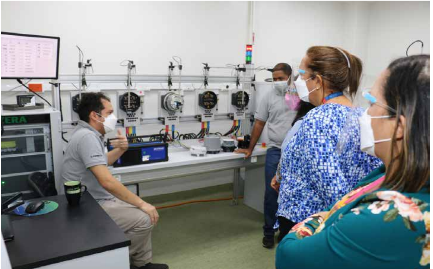
Un colaborador del Cenamep junto a un instrumento de medición.

El 20 de mayo se celebra el Día Mundial de la Metrología (World Metrology Day), un evento anual en el cual la comunidad metrológica internacional busca crear conciencia sobre la importancia e impacto de la metrología en la vida diaria y para garantizar que se puedan realizar mediciones precisas en todo el mundo. Esta fecha fue elegida en reconocimiento a la firma de la Convención del Metro, realizada el 20 de mayo de 1875, norma que proporcionó la base para un sistema mundial de medición coherente y que determinó el inicio de la colaboración