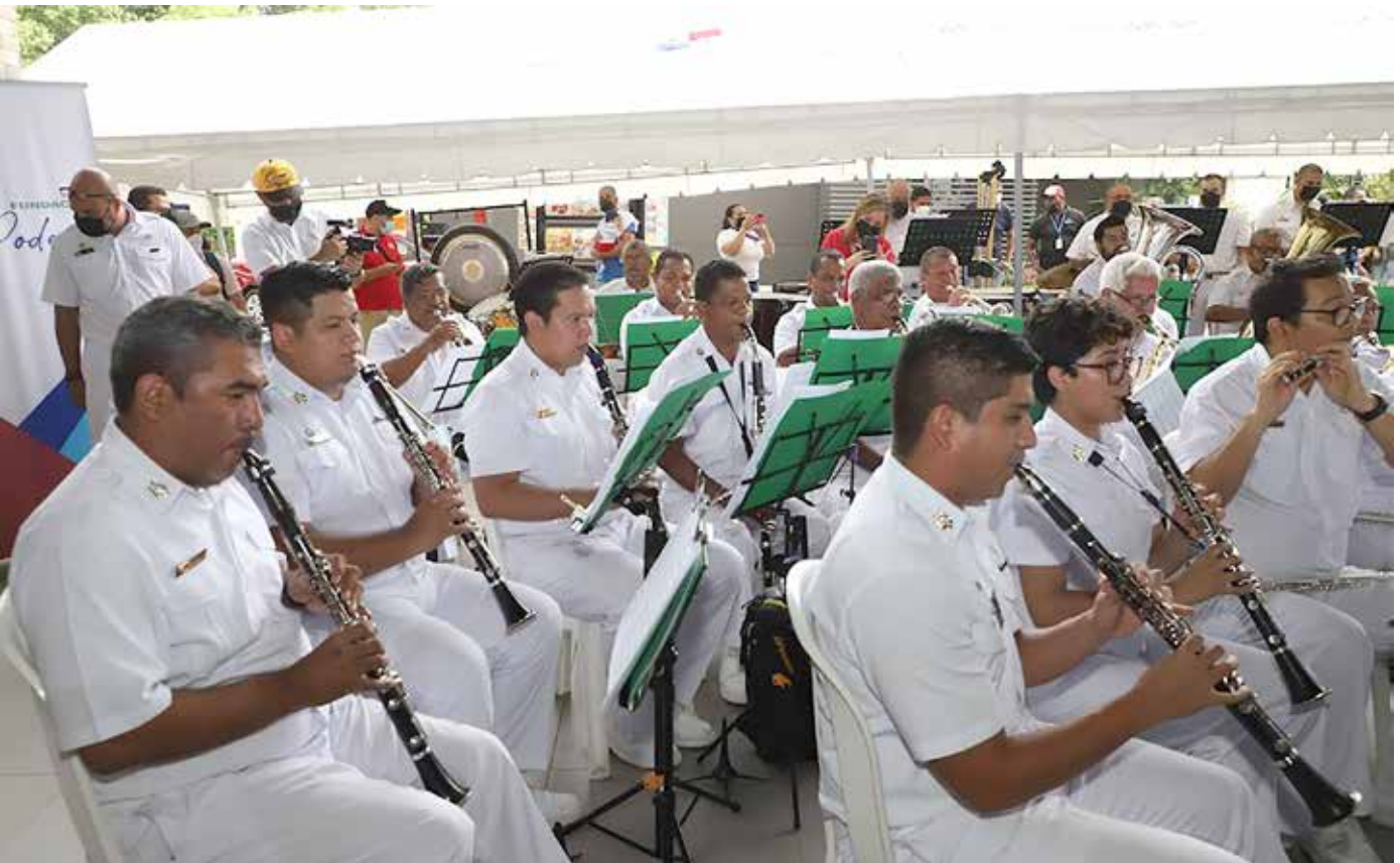
Concierto de la Banda Republicana en la provincia de Panamá Oeste, donde además participaron miembros de la Policía Nacional y del Benemérito Cuerpo de Bomberos de la República de Panamá como invitados especiales.