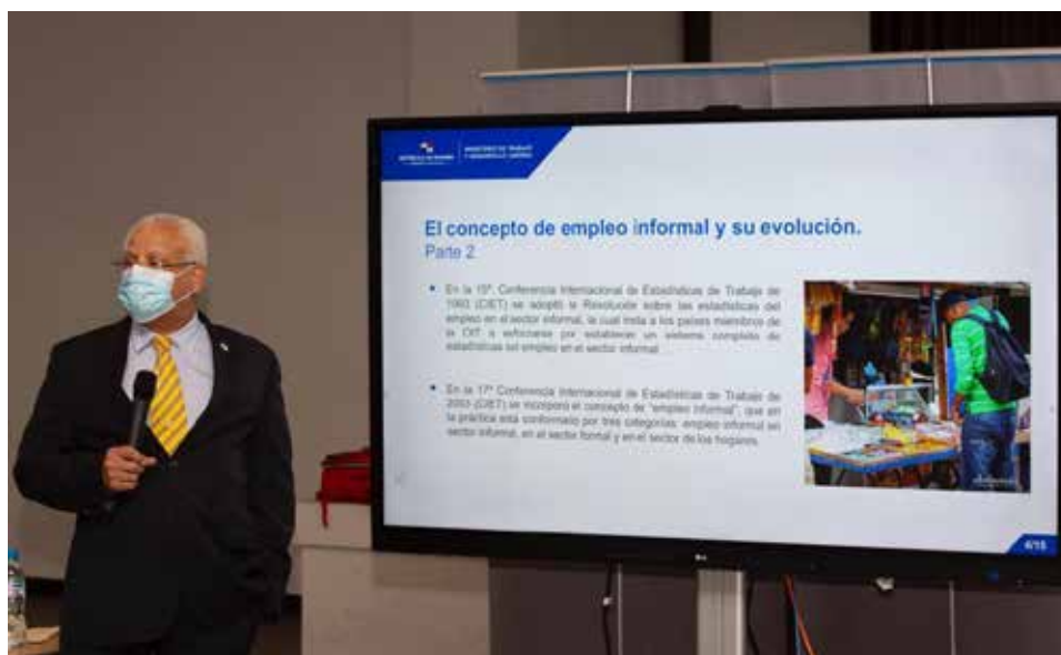
Entre los beneficios se dispone otorgar seguro social a los emprendedores.