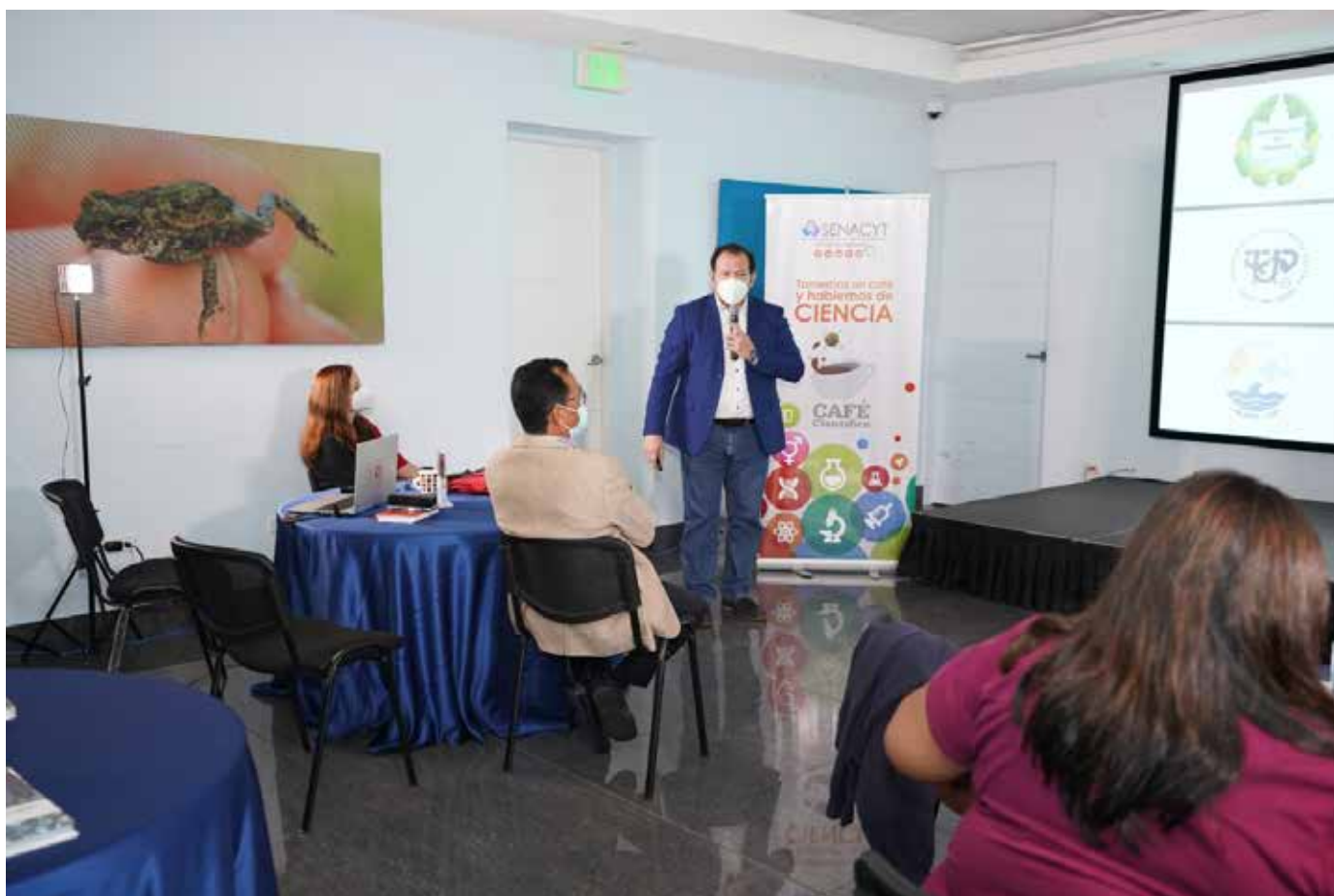
El evento contó con la participación de especialistas inmersos en este campo de estudio.

que trabajan actividades agrícolas. En la región, se ha investigado sobre la enfermedad renal crónica de origen no tradicional a través del Programa Salud, Trabajo y Ambiente en América Central (SALTRA).