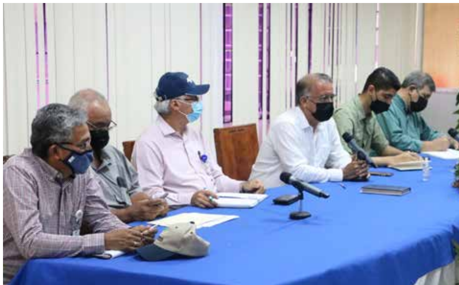
El ministro Valderrama y su equipo durante el conversatorio con arroceros de todo el país.

Para dar seguimiento al incremento del costo de los insumos agropecuarios y garantizar la producción de arroz en el país, se reunió en Santiago, provincia de Veraguas, la comisión de alto nivel integrada por productores, molineros, distribuidores de insumos, banca estatal e instituciones del sector. Entre las respuestas brindadas en este encuentro, el ministro de Desarrollo Agropecuario, Augusto Valderrama, quien lidera la comisión, anunció la llegada de los barcos con fertilizantes y dijo que se está garantizando las compras con las importadoras, que agradecen la acción del presidente de la República, Laurentino Cortizo Cohen, al firmar el decreto para eliminar todos los procedimientos burocráticos, lo que garantiza el abastecimiento. Igualmente, se destacó la aprobación de otra norma mediante la que se acelera de manera expedita la compra de otros insumos del sector agropecuario, como fungicidas, insecticidas y productos químicos. El secretario Ejecutivo de la Asociación Nacional de Distribuidores de Insumos (ANDIA), Lucas Sánchez, recibió de parte del ministro Valderrama los decretos firmados por el presidente Cortizo Cohen y que están publicados en Gaceta Oficial. Aprovechó para agradecer que estas medidas buscan agilizar los trámites de importación de fertilizantes y de