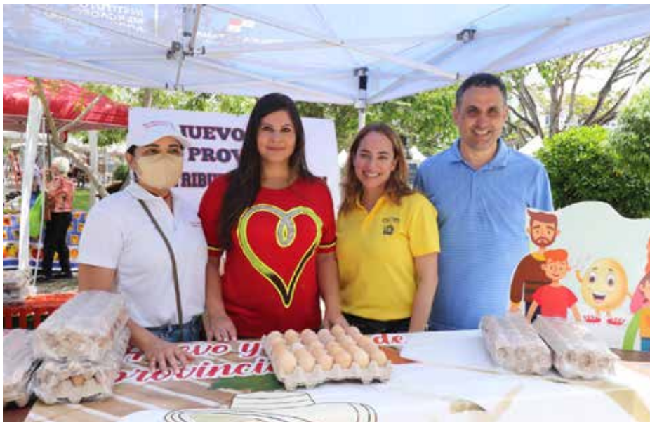
El 10 y 24 de junio próximo, la actividad se llevará a cabo en el corregimiento de Caimitillo.