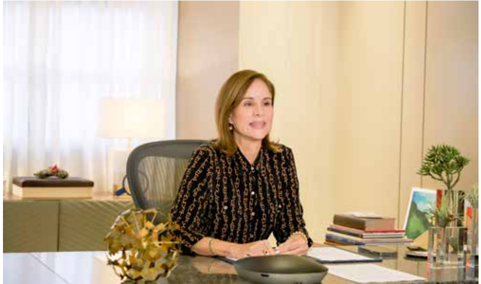
La primera dama, Yasmín Colón de Cortizo, intercambia con sus homólogas de la Alianza de Cónyuges de Jefes de Estado y Representantes - ALMA, los planes y programas en esta materia.

La primera dama de la República, Yasmín Colón de Cortizo, participó en una reunión virtual de la Alianza de Cónyuges de Jefes de Estado y Representantes - ALMA, para intercambiar los avances en sus respectivos países en cuanto al tema de la primera infancia. Colón de Cortizo destacó que Panamá cuenta con la Ley 171 del 2020, de Protección Integral a la Primera Infancia y al Desarrollo Infantil Temprano, donde se garantiza que los niños y niñas de 0 a 8 años, que constituyen cerca del 18% de la población, sean incluidos y protegidos de forma especial en los planes de desarrollo de esta administración y en adelante. La primera dama aprovechó la ocasión para compartir algunos avances en la Implementación de la Ruta de Atención Integral para la Primera Infancia en Panamá, entre ellos el desarrollo de los lineamientos estratégicos para guiar las atenciones y brindar servicios de calidad que se ofrecen en los CAIPI. Señaló que son muchas las acciones que han beneficiado a miles de niños y niñas entre 0 a 4 años que no cuentan con CAIPI y que viven en localidades del denominado Plan Colmena, iniciativa del Gobierno Nacional para hacer frente a los mayores retos sociales de Panamá. El encuentro virtual fue dirigido por la primera dama de Brasil, Michelle Bolsonaro, coordinadora de ALMA.