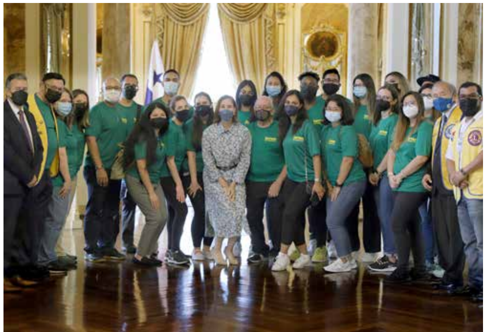
El estudio aborda el perfil epidemiológico en salud visual de los albinos que residen en Guna Nega.