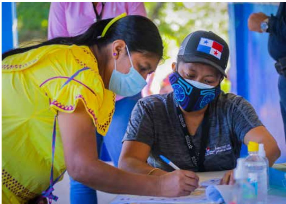
Los pagos a los beneficiarios por Tarjeta Clave Social se realizarán del lunes 6 al viernes 17 de junio.

Del 23 al 27 de mayo, el Mides realizó los desembolsos en las áreas de difícil acceso.