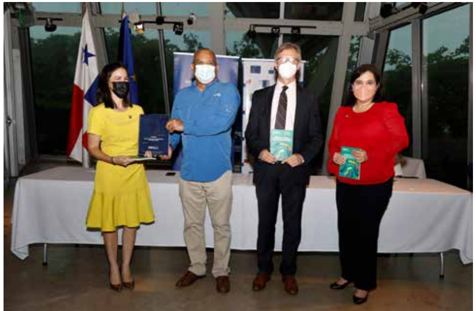
La Policía, la Fiscalía y el Ministerio de Ambiente buscan fortalecer las investigaciones de delitos medioambientales.

Un catálogo de especies de fauna y flora protegidas más traficadas en Panamá fue presentado por el Ministerio del Ambiente de Panamá junto a la iniciativa Europa Latinoamérica Programa de Asistencia contra el Crimen Transnacional Organizado (EL PACCTO) de la Unión Europea, y el Equipo Multidisciplinario Especializado (EME - Ambiental), como una herramienta para combatir los crímenes ambientales, especialmente el trasiego de flora y fauna en el país. El catálogo, que incluye fotografías y datos técnicos que permitirán la identificación de las especies más traficadas, será compartido con autoridades competentes en seguridad, fronteras y aduanas en el país: Policía Nacional, Servicio Nacional de Fronteras y Aduanas. El ministro de Ambiente, Milciades Concepción, dijo que la presentación de estas herramientas busca fortalecer el trabajo que realiza la entidad junto al EME-Ambiental para perseguir estos delitos y dar con la red criminal transfronteriza que trafica especies de flora y fauna desde Panamá. Según datos de MiAmbiente, entre las especies amenazadas y que son rescatadas con más frecuencia están: ocelote/manigordo ("Leopardus pardalis"), jaguarundi ("Puma yagouaroundi"), venado colablanca ("Odocoileus virginianus"), mono aullador ("Alouatta palliata"), mono araña negra ("Ateles fusciceps"), babillo ("Caiman crocodilus"), guacamayas y loros.