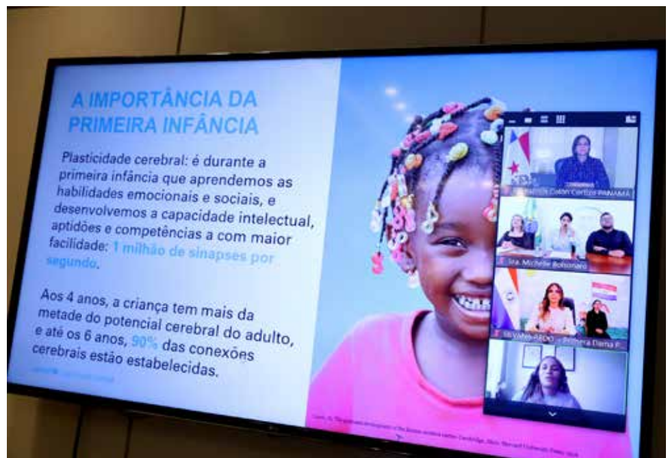
Colón de Cortizo compartió detalles sobre la Implementación de la Ruta de Atención Integral para la Primera Infancia en Panamá.