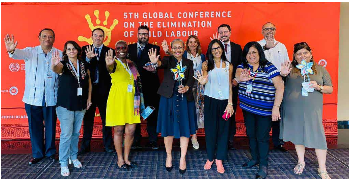
V Conferencia Mundial para la Eliminación del Trabajo Infantil en Durban, Sudáfrica.