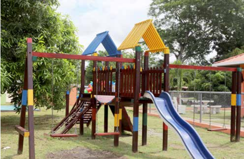
Este centro de diversión fue gestionado por el Despacho de la Primera Dama.