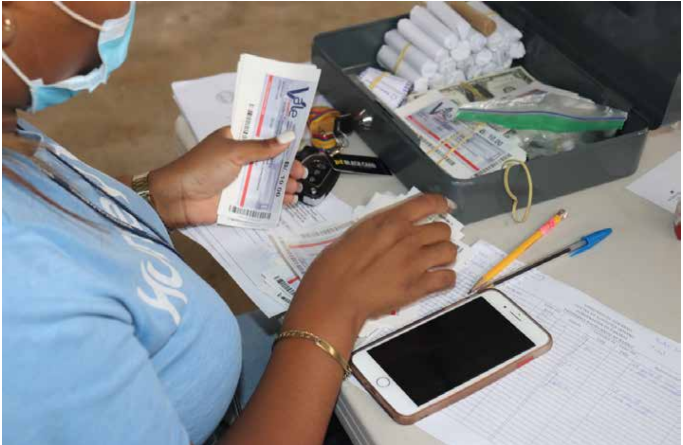
El programa 'Armas por Comida' ha permitido sacar de las calles cientos de armas ilegales.

el proyecto de construcción de la nueva subestación policial de la provincia de Colón, que tiene un avance del 60% y se prevé que esté lista para finales del mes de diciembre de 2022.