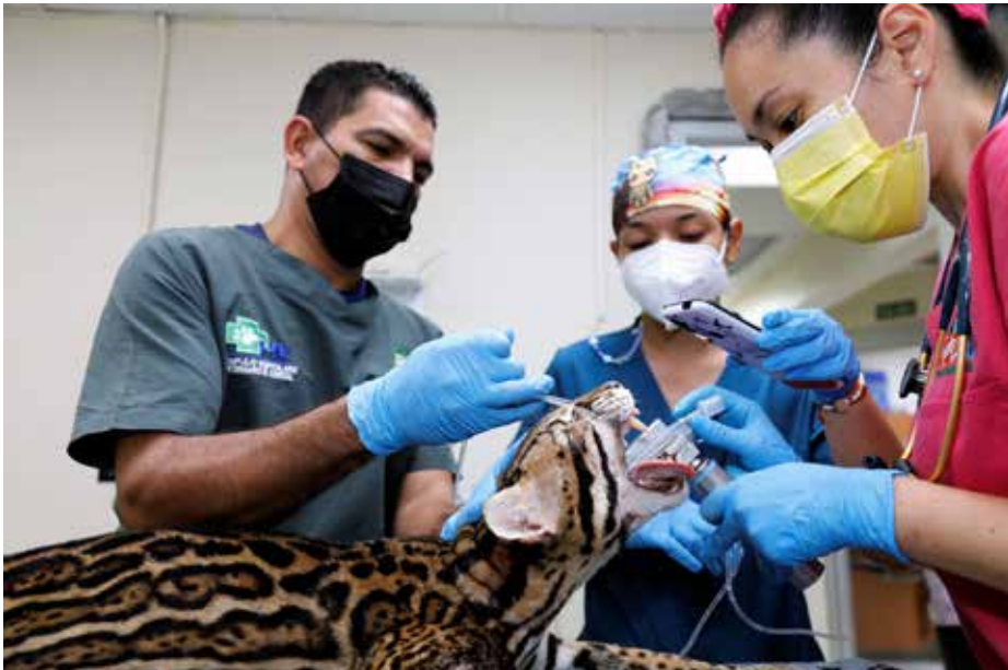
Actualmente no se cuenta con un espacio óptimo para atención de animales silvestres.

Dentro de un año estará listo el primer hospital veterinario de vida silvestre a nivel gubernamental. El ministro de Ambiente, Milciades Concepción, entregó la orden de proceder para la construcción de esta obra cuyo objetivo es contar con una unidad de atención veterinaria y rehabilitación de fauna silvestre y brindar cuidados especializados exclusivamente a los animales provenientes de rescates y decomisos, promoviendo la reintroducción a su medio natural. La creación de este espacio es vital, tomando en cuenta la creciente demanda. Actualmente no se cuenta con un espacio óptimo para atención de animales silvestres. Datos de la Dirección de Áreas Protegidas y Biodiversidad precisan que en el 2019 se registraron 319 rescates; 508 en el 2020; y 723 en el 2021. En tanto, en lo que va del 2022 se han reportado 264. Concepción expresó que este es un proyecto insignia para esta administración que impulsa el desarrollo sostenible, y es punta de lanza para desarrollar iniciativas para la conservación y protección de la biodiversidad. El hospital estará ubicado en el Parque Nacional Camino de Cruces; la primera fase del proyecto de estudio, diseño y construcción de clínica veterinaria para fauna silvestre es de B/.840,697.81.