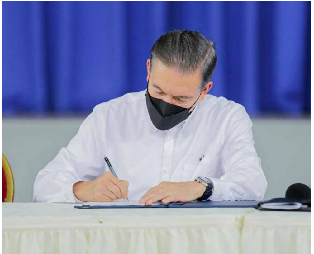
La medida de tres meses representa un aporte del Estado por B/.100,000,000.00.

de un vale digital mensual consumible en combustible (vale de combustible), como medida de alivio. La Autoridad del Tránsito y Transporte Terrestre establecerá el monto del vale de combustible para estas categorías de beneficiarios. La medida que se adopta considerando que Panamá es un país importador de los productos derivados del petróleo y está sujeto a la volatilidad de los precios que determinen los mercados internacionales establece que la vigencia de este decreto ejecutivo será por un periodo de tres meses y con cargo al Presupuesto General del Estado. Explica además que los acontecimientos internacionales han incidido en el incremento sostenido de los precios de los combustibles afectando de manera directa el costo de la movilidad y en general de todos los productos y servicios. El artículo 2 del decreto indica que cuando el precio máximo de venta al público de la gasolina de 91 y de 95 octanos y el diésel bajo azufre supere el precio solidario, el Estado asumirá la diferencia u otorgará un vale digital de combustible, a favor de los beneficiarios definidos en la Resolución de Gabinete No. 60 de 19 de mayo de 2022, en los momentos y a través de las modalidades que se establecen en este Decreto Ejecutivo. De acuerdo al Decreto Ejecutivo, este vale de combustible caduca en el mes en que se acredita, es intransferible, no es negociable y su saldo no es acumulable para meses siguientes.