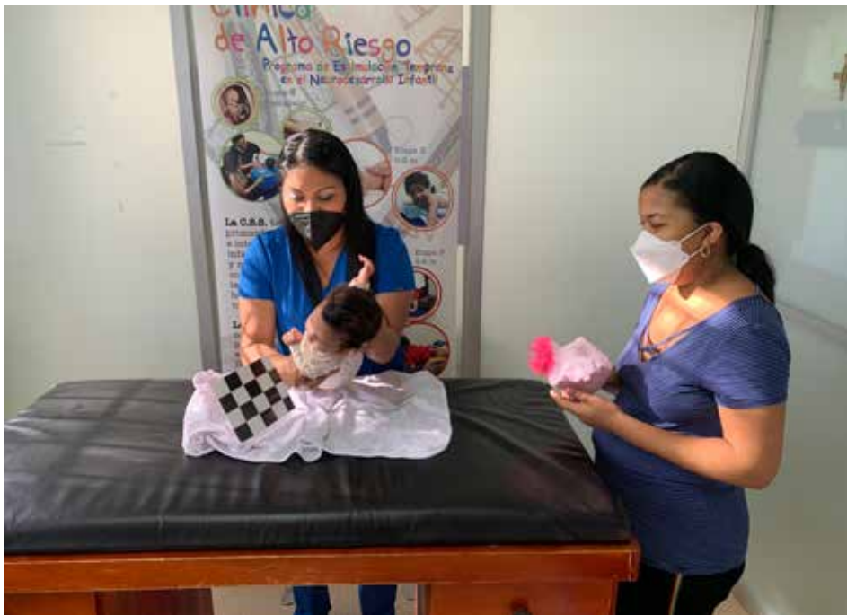
Los niños entre los seis meses y siete años son beneficiados con esta terapia.

El Programa de Alto Riesgo Neonatal, bajo la Subdirección Nacional de Atención Primaria en Salud, de la Caja de Seguro Social (CSS), tiene entre sus funciones captar, evaluar, intervenir y dar un seguimiento temprano a los niños que forman parte de dicho plan. Un ejemplo de ello fueron los servicios prestados a infantes en Veraguas. Durante el primer cuatrimestre de 2022, el personal de Estimulación Temprana de esta provincia efectuó 1,306 consultas, de las cuales 659 fueron destinadas a niños y 647 a niñas. En una atención exhaustiva, las estimuladoras llevan el control del neurodesarrollo del pequeño, explican a las madres sobre la importancia de la lactancia materna y del desarrollo óptimo según las diferentes etapas de la niñez, explicó la doctora Heysi Martínez, coordinadora del programa en Veraguas. Los resultados son importantes. De acuerdo a su edad, los niños presentan avances en la capacidad de concentración, memoria y creatividad; mayor facilidad en la articulación del habla, comprensión y expresión oral; mejoras en las habilidades sociales y refuerzo en su autoestima.