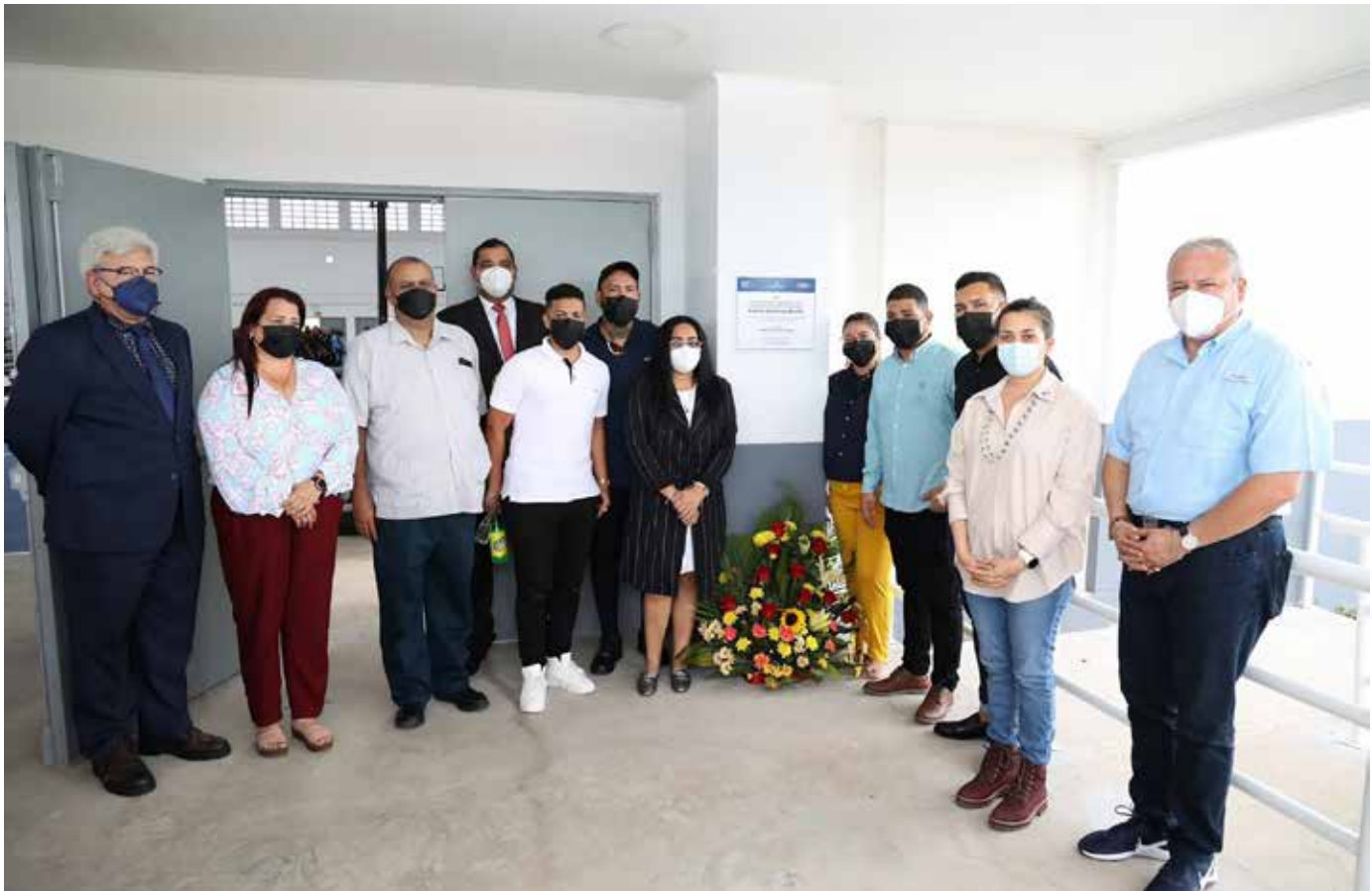
La Academia de Formación Penitenciaria está ubicada en El Roble de Aguadulce, provincia de Coclé.