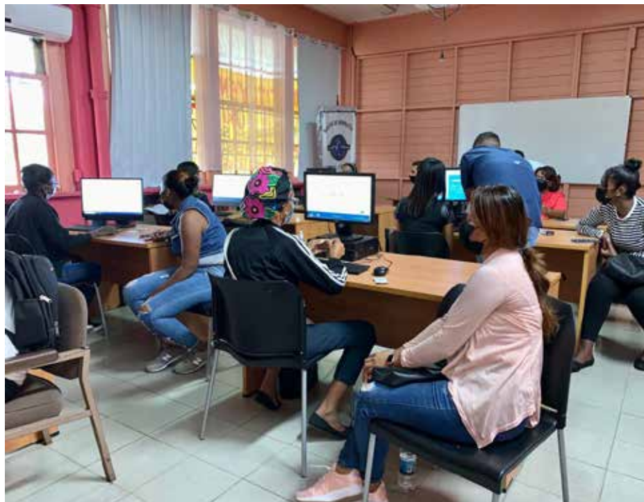
Trámite "MITRADEL - Registro Nacional de Desempleo (Colón)".

El Ministerio de Trabajo y Desarrollo Laboral (Mitradel), en conjunto con la Autoridad de Innovación Gubernamental (AIG) y el Inadeh, habilitó el formulario en el Portal Único del Ciudadano www.panamadigital.gob.pa para registrarse en el Plan Capacítate para el Empleo Colón. El registro se puede hacer de forma individual desde cualquier computadora o dispositivo móvil, y para los que se les dificulte el acceso tecnológico se habilitaron infoplazas en la provincia. Uno de estos centros estará instalado desde el martes a las 9:00 a.m. en el Auditorio Humberto Zárate del Centro Regional Universitario de la Universidad de Panamá en Colón. También se habilitarán 12 infoplazas distribuidas en toda la provincia.