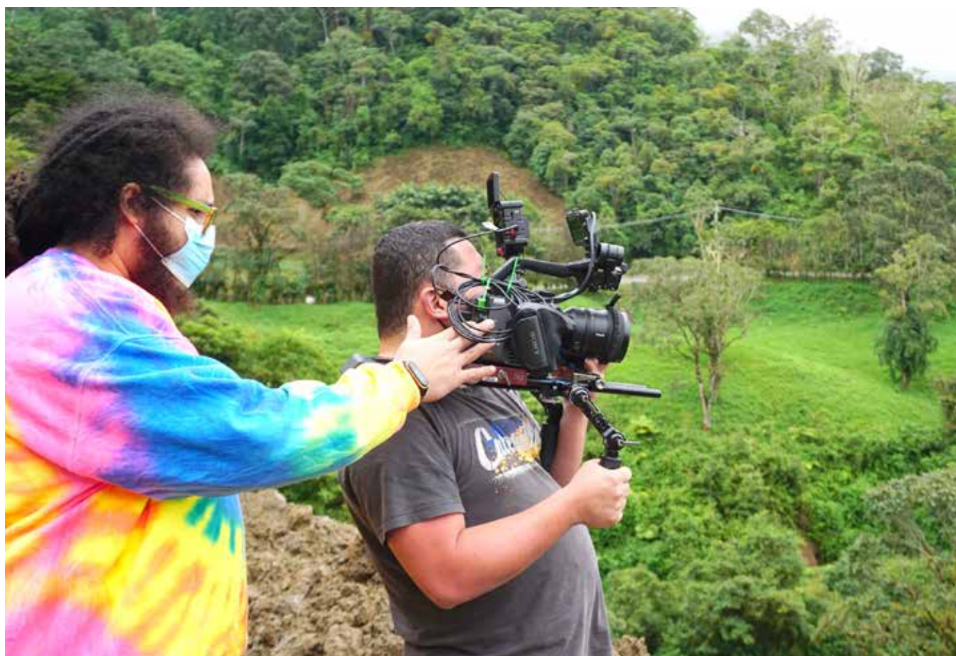
Grabaciones del documental "Cotito".

del Audiovisual es considerado un hecho histórico para el país, dado que es la primera vez que estas dos organizaciones otorgan este apoyo a América Central como un nuevo mercado por explorar.