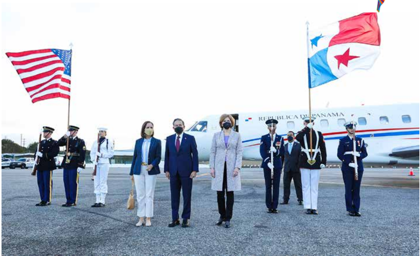
El presidente Cortizo Cohen estuvo acompañado por la primera dama, Yasmín Colón de Cortizo, y otros funcionarios.