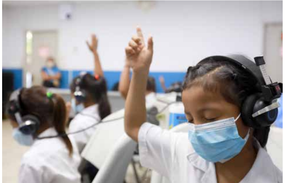
Los alumnos pertenecen a 15 centros educativos oficiales de Cañazas Cabecera.

El Despacho de la Primera Dama de la República, liderado por Yasmín Colón de Cortizo, inició a través de la Dirección de Proyección Social la primera fase del programa “Ver y Oír para Aprender” en centros educativos del distrito de Cañazas, en la provincia de Veraguas. En esta ocasión, 1,280 estudiantes de 15 centros educativos oficiales de Cañazas Cabecera fueron evaluados por profesionales de la Universidad Especializada de las Américas (Udelas), quienes les realizaron tamizajes visuales y auditivos para determinar si requieren anteojos y audífonos. Mientras que, en las jornadas de entrega, el Ministerio de Salud (Minsa) brinda atención en vacunación, nutrición, promoción de la salud y odontología. Se desarrollan Ferias Integrales de Salud y Bienestar, donde diversas instituciones enfocan su apoyo en niños y adultos. También a los adultos mayores de 40 años se les practica exámenes visuales y se les entregan lentes de lectura. Las clínicas móviles “Salud sobre Ruedas” del Despacho de la Primera Dama realizan diversos exámenes. También hay atención veterinaria para las mascotas. En las próximas semanas se hará la entrega de los lentes y audífonos a los niños que fueron evaluados y que lo requieran.