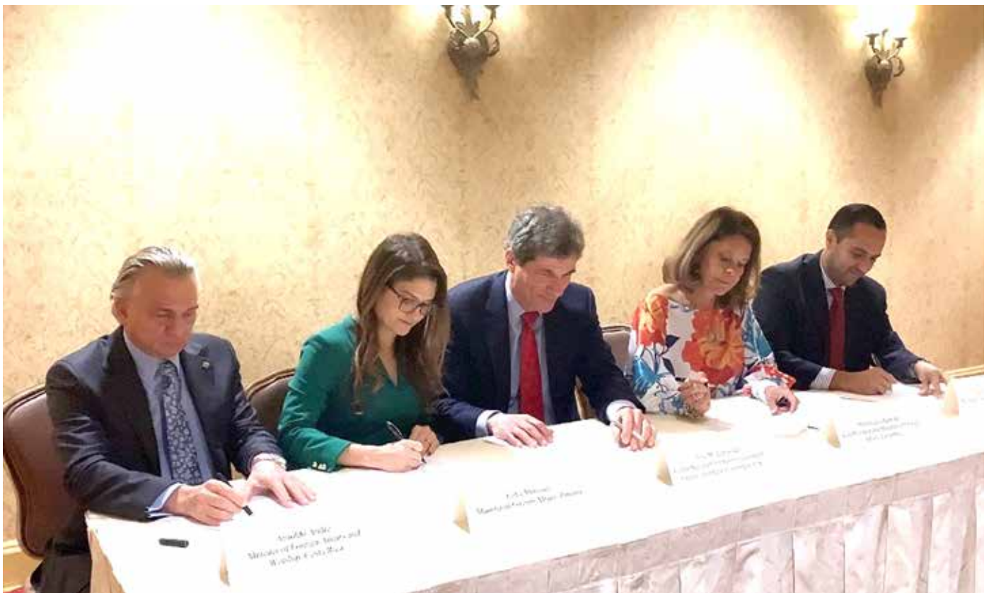
El país norteamericano apoyará a Costa Rica, Colombia, Ecuador y Panamá en el logro de sus objetivos de conservación, gestión de biodiversidad marina y el uso sostenible de recursos marinos.

las Américas (EHA), con el respaldo del secretario de Estado Antony Blinken, y en presencia del secretario general de la Organización de Estados Americanos (OEA), Luis Almagro, y la directora de la Organización Panamericana de la Salud (OPS), Carissa Etienne.