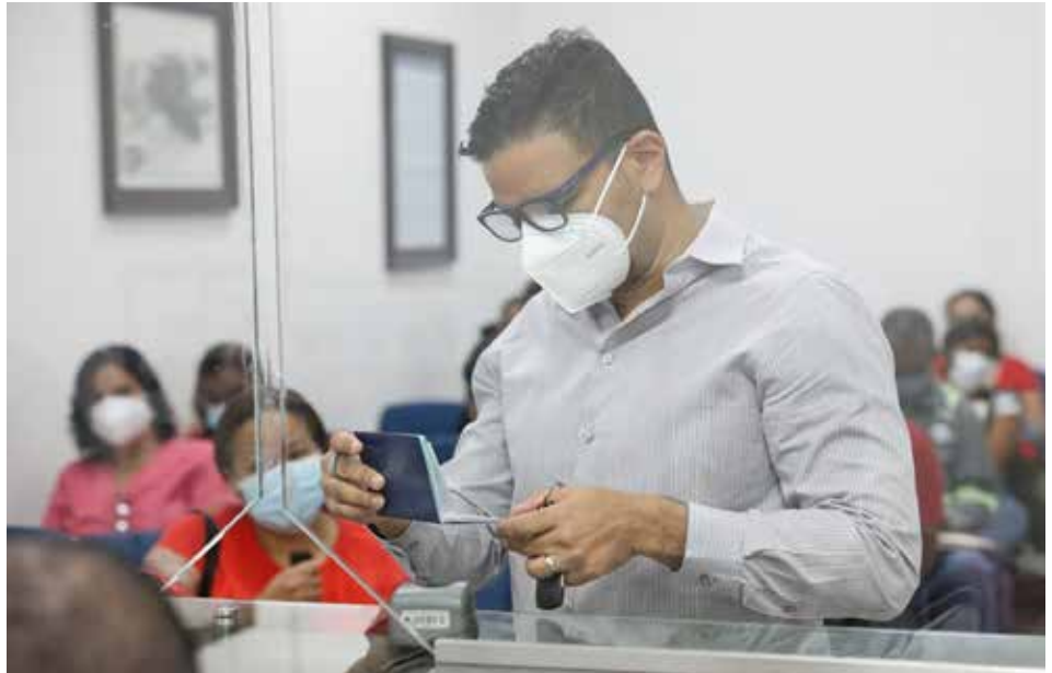
La Autoridad de Pasaportes de Panamá cuenta con oficinas en Bocas del Toro, Chiriquí, Veraguas, Herrera, Coclé, Colón y Panamá.

Desde que opera la alternativa electrónica, la entidad ha efectuado 1,088 transacciones.