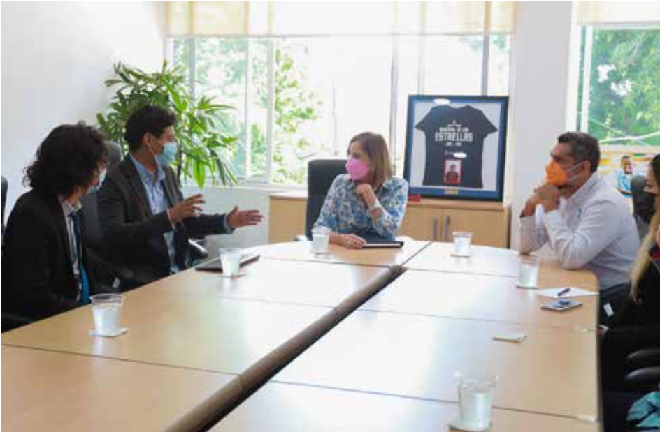
CIPSELA presenta el proyecto AVES a la primera dama, Yazmín Colón de Cortizo.