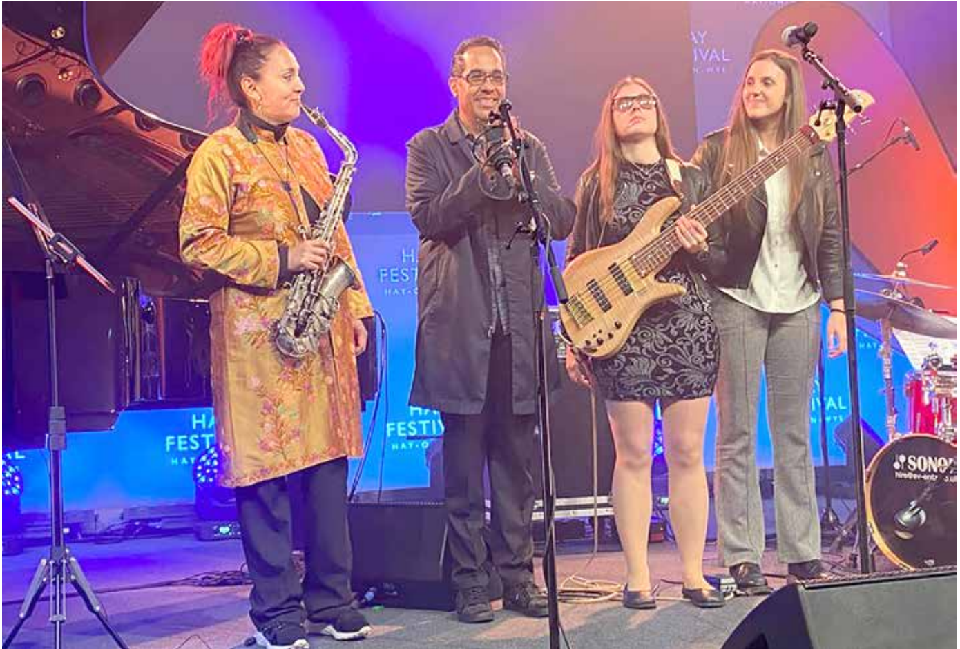
Danilo Pérez y sus músicos durante su participación en el encuentro cultural y artístico.

Los asistentes al Hay Festival en Gales, en Reino Unido, disfrutaron de la música y artesanías de Panamá con la presentación del jazzista Danilo Pérez y el pabellón en el que se exhibieron trabajos de los pueblos indígenas panameños. Durante su participación, Pérez cautivó por hora y media a los espectadores