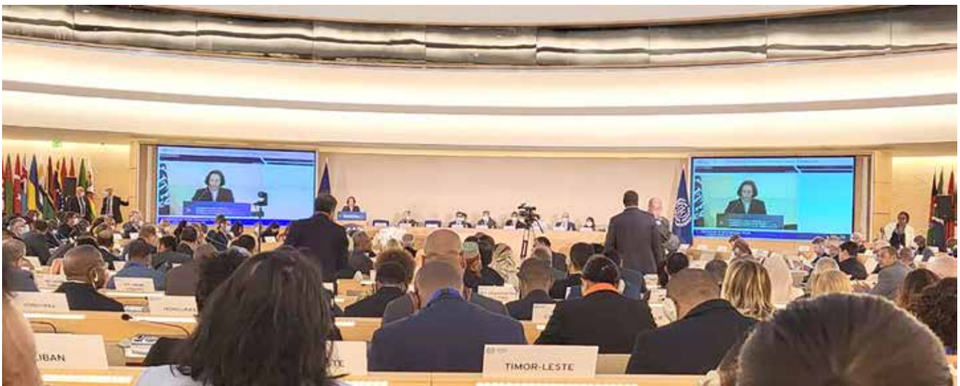
El trabajo decente, más justicia social, acoso laboral y el diálogo social y tripartismo fueron temas de debate.

de Empleo para promover el Trabajo Decente con programas y proyectos que se desarrollan en Panamá. En el marco de la pospandemia, se analizan ante las delegaciones tripartitas de los 187 países miembros de la OIT temas como el trabajo decente, más justicia social, mayores y mejores políticas laborales, acoso laboral y el diálogo social y el tripartismo.