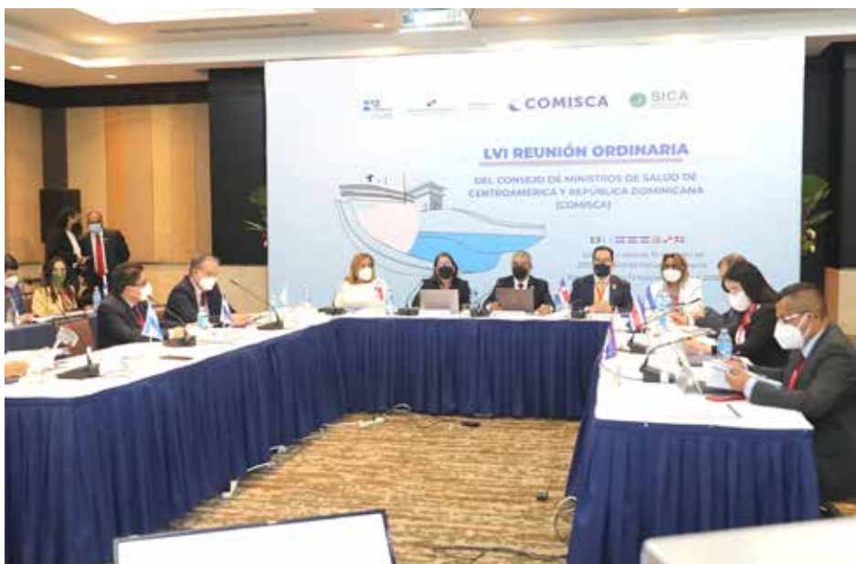
En la LVI Reunión Ordinaria del COMISCA participaron los 8 Estados miembros del SICA.