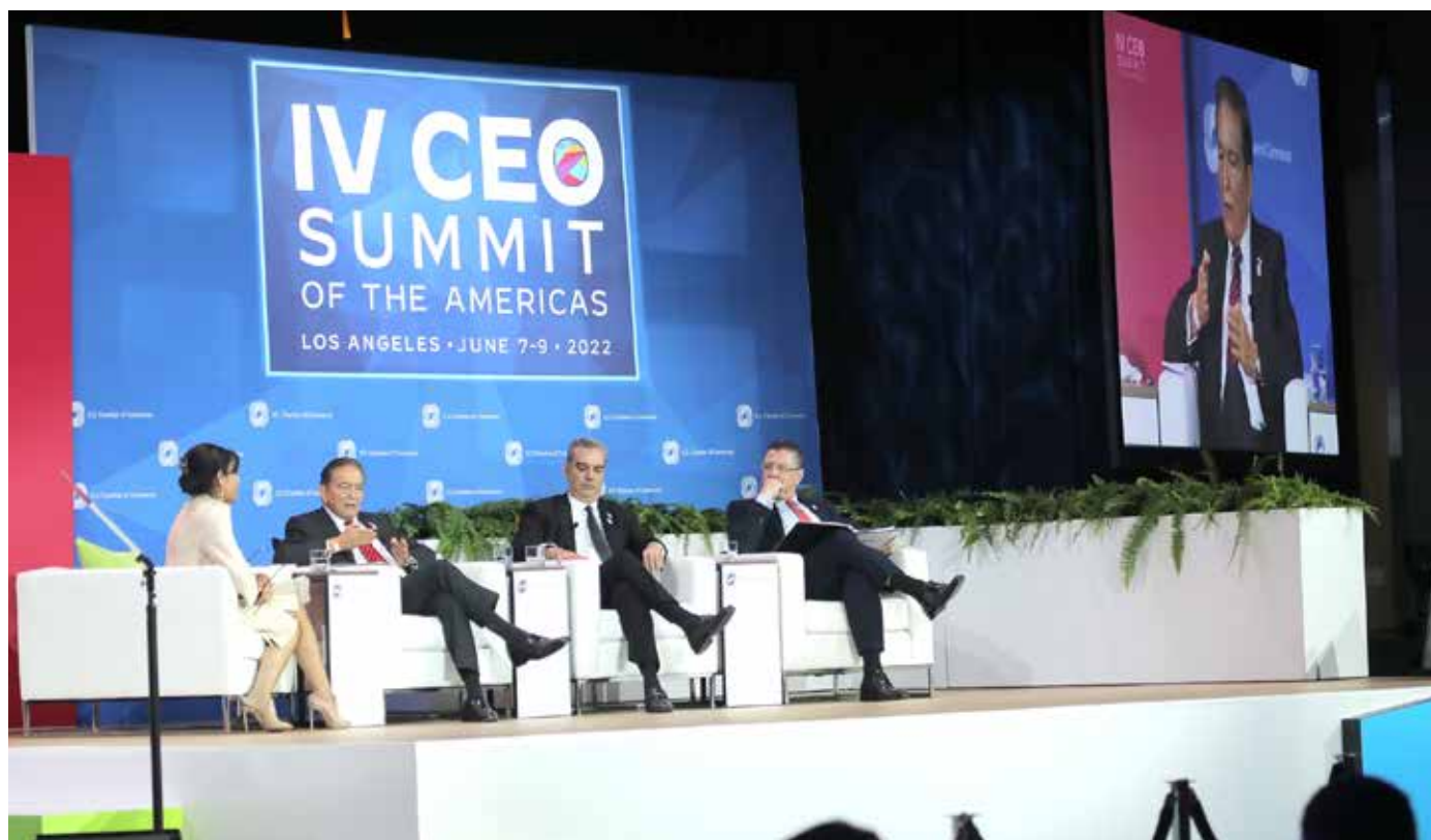
El jefe del Ejecutivo participó en el panel sobre la Alianza para el Desarrollo en Democracia, dentro del Foro CEO Summit.

privado para garantizar un desarrollo inclusivo y sostenible. “Queremos aprovechar nuestra capacidad logística, nuestro sólido sistema financiero, nuevas regulaciones y conectividad sin precedentes para hacer nuestra parte en este nuevo esfuerzo regional”, manifestó.