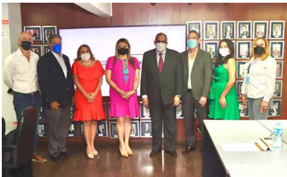
Los interesados en unirse al grupo lo pueden hacer ingresando a www.conep.org.pa/red-de-empresas-contra-el-trabajo-infantil-de-panama/ .