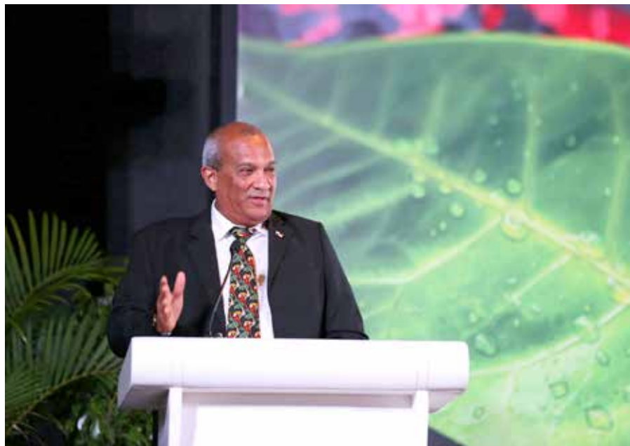
Estos planes involucran el desarrollo de actividades en tres provincias, con un alcance de población total de 239 mil habitantes

El Plan Indicativo de Ordenamiento Territorial Ambiental (PIOTA) para la cuenca del Canal promueve una acción integrada con todos los que trabajan alrededor de esta importante zona del país.