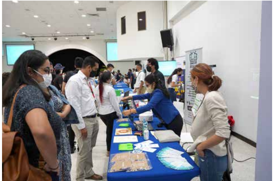
Durante la actividad, los jóvenes universitarios interactuaron e intercambiaron información con líderes y expertos nacionales dedicados a la investigación científica en Panamá.