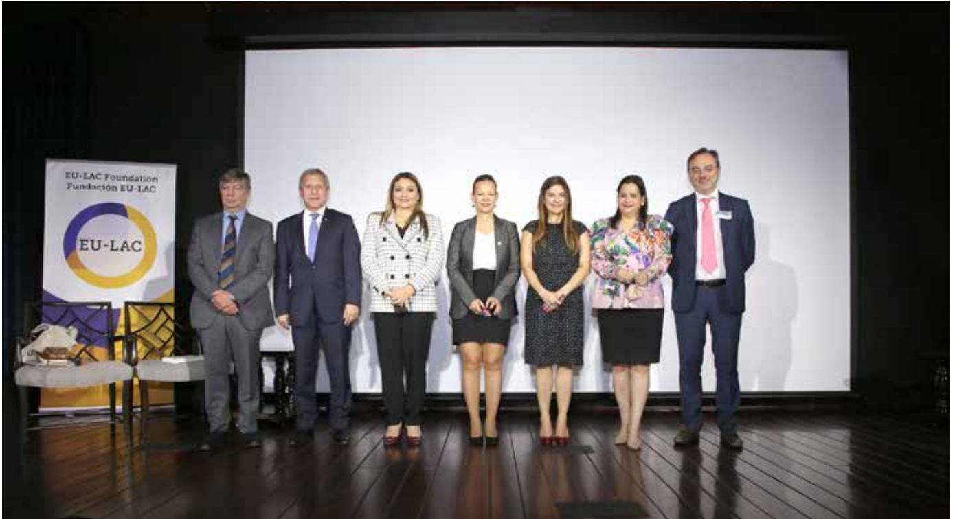
La canciller Erika Mouynes, junto a las ministras de Trabajo y Desarrollo Laboral, Doris Zapata; y de Desarrollo Social, María Inés Castillo, respectivamente, inauguró las Jornadas de Diálogo “Nuevas Alianzas al Desarrollo” entre la Unión Europea y Centroamérica.