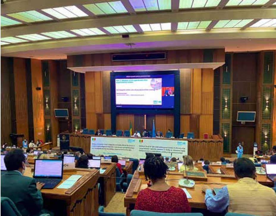
Este evento internacional sobre la reducción de los impactos negativos generados por el uso de plásticos se llevó a cabo en Dakar, Senegal.