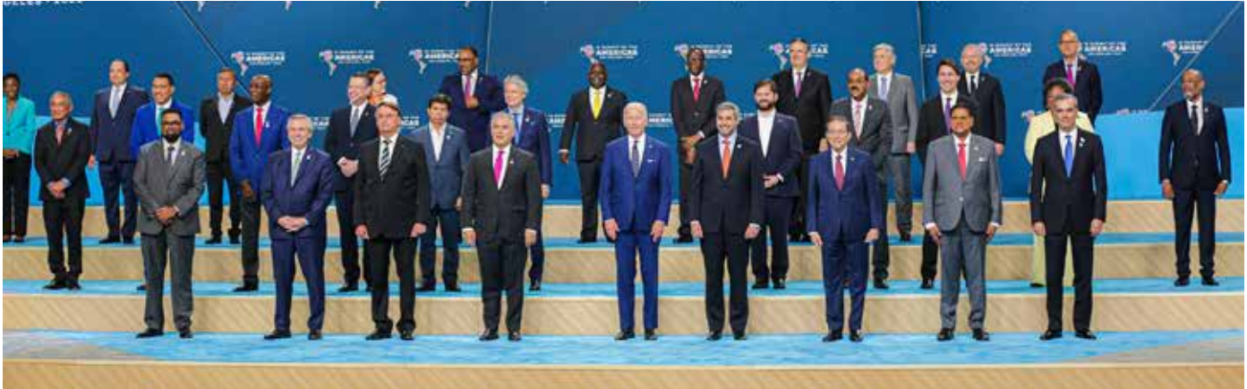
El presidente Laurentino Cortizo Cohen participó de la segunda y tercera sesión plenaria de la IX Cumbre de las Américas.