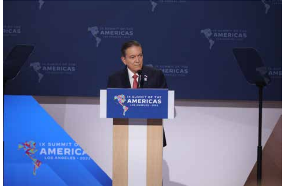
Destacó que la región tiene fortalezas únicas que pueden aportar a un gran esfuerzo conjunto para superar los retos de hoy y del futuro.

Panamá puede contribuir a la recuperación económica con sus capacidades logísticas: mejor conectividad marítima, aérea y digital de la región y “la convicción de los panameños en el valor de la paz, la convivencia y la unión de nuestros pueblos”.