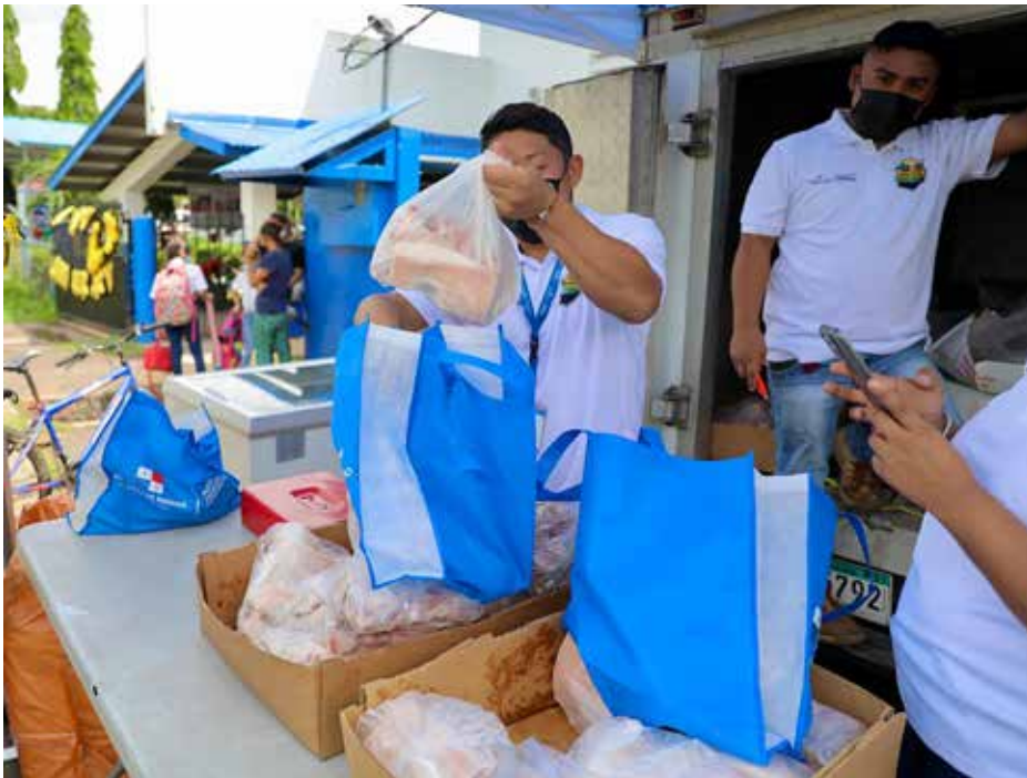
En las agroferias del IMA se han ofertado, hasta el momento, 1,130 libras de carne de cerdo.