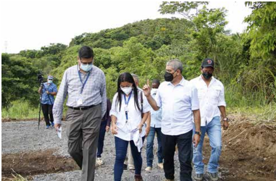
Este nuevo centro médico tiene un costo de B/.434,806,107.59.

El ministro de Salud, Luis Francisco Sucre, hizo este miércoles 8 de junio un recorrido por los terrenos del nuevo Instituto Oncológico Nacional, ubicados en Clayton, corregimiento de Ancón, distrito de Panamá. El área la componen dos globos de terreno donados por la Unidad Administrativa de Bienes Revertidos y según el cronograma del proyecto, el nuevo Hospital Oncológico -que tiene un costo de B/.434,806,107.59- debe estar listo en 549 días calendario. Sucre dijo que se hace realidad el sueño de la población desde hace muchos años, de contar con el nuevo Instituto Oncológico Nacional. Como medida para descongestionar la cantidad de pacientes en el actual ION, el ministro Sucre anunció el proyecto de Red Oncológica Nacional, que busca mejorar la calidad de vida del paciente con cáncer a nivel nacional y aumentar la calidad de los servicios. Está conformado por clínicas especializadas ubicadas en el Hospital Regional Anita Moreno, en Azuero, con 85% de avance; Hospital Rafael Hernández, en Chiriquí, con 100%; Hospital Luis "Chicho" Fábrega, en Veraguas, con un 50%, y en el Hospital Nicolás Solano, en Panamá Oeste, ya terminada.