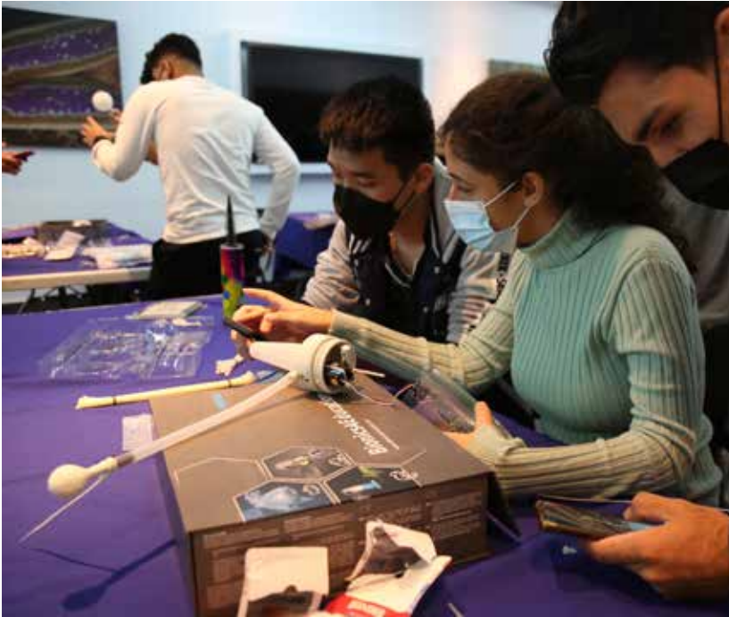
Estudiantes de la Facultad de Ingeniería en Sistemas Computacionales de la UTP, regional de Azuero, participaron en el acto.

La Secretaría Nacional de Ciencia, Tecnología e Innovación (Senacyt), a través de la Dirección de Innovación en el Aprendizaje de la Ciencia y la Tecnología, y en colaboración con la compañía Festo CO, realizó el taller Festo Bionics 4 Education, el pasado 1 de junio. En la actividad, participaron estudiantes de segundo año de la Facultad de Ingeniería en Sistemas de la Universidad Tecnológica de Panamá (UTP), regional de Azuero. En el taller se utilizó el kit Festo Bionics 4 Education, con el objetivo de que los universitarios fomenten en estudiantes de secundaria los principios de diseño de robots que simulan los movimientos del ser humano y la naturaleza. La Senacyt adquirió un total de 10 kits para este fin. El kit incluye "soft robots" que utilizan el poder mecánico y la flexibilidad para moverse, creando nuevos sistemas de mecanismo basados en ligas hidráulicas y presión de aire. Bionic es una herramienta del sector de gestión que enseña cómo la tecnología puede utilizar los conceptos de biología como fuente de inspiración para el desarrollo de nuevas tecnologías.