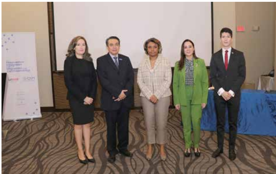
Los organismos internacionales apoyan al Minsa en las diversas intervenciones que se ejecutan en los puntos de entrada de los migrantes al país.