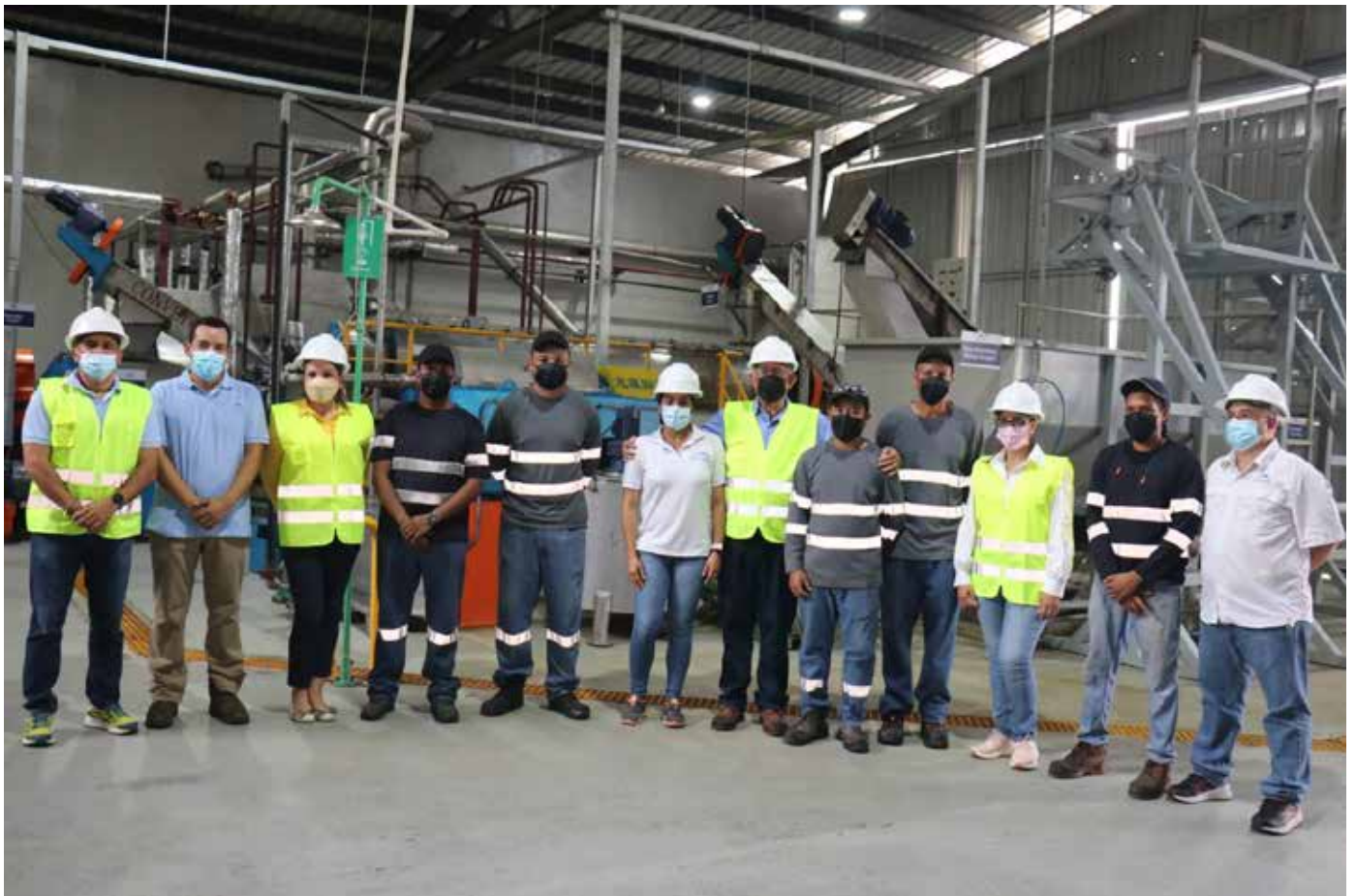
La inversión asciende a B/.1.5 millones.

agroalimentaria, además de que se realiza un trabajo de capacitación y de respaldo a los productores nacionales. En tanto, la administradora de la ARAP afirmó que la labor de Open Blue va en línea con los Objetivos de Desarrollo Sostenible (ODS) de cero desperdicios, sobre todo en estos momentos en que más se necesita asegurar la alimentación, logrando producir harina de pescado y aceite de pescado de gran calibre con cuatro potenciales compradores.