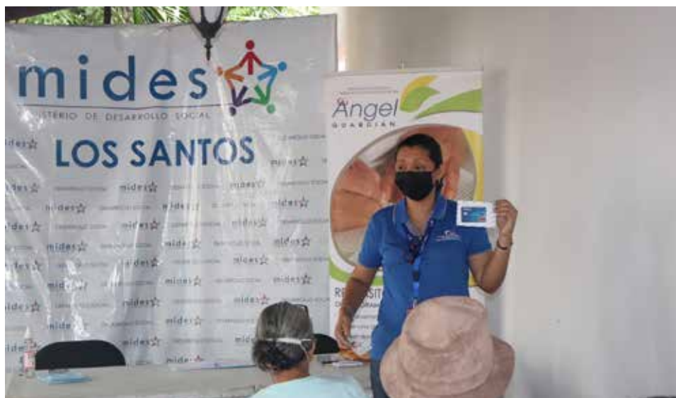
El Mides contactó vía telefónica a cada uno de los beneficiarios de los PTMC, con el objetivo de validar la información suministrada.

El Ministerio de Desarrollo Social (Mides) realizó, por vía telefónica y a través de la página web, la actualización de datos digitalizados de los beneficiarios de los Programas de Transferencias Monetarias Condicionadas (PTMC). Durante el proceso se han actualizado 127,439 beneficiarios en la modalidad de Tarjeta Clave Social (TCS), que representan un 82% de avance. Además, se efectuó una Evaluación de Impacto a los beneficiarios de los pagos de difícil de acceso, logrando un 100%; mientras que, de los beneficiarios de TCS, se logró un avance del 44%. El objetivo de este proceso es validar la información suministrada por los beneficiarios y conocer cómo las transferencias monetarias condicionadas han contribuido en la mejora de su condición de vida y la de su familia. Esta actualización fue realizada por personal debidamente identificado y no se solicitó información relacionada con pagos o de la TCS. Este proceso forma parte de las corresponsabilidades de los beneficiarios y se encuentra debidamente establecido en los Manuales Operativos de los PTMC, y en la carta de compromiso firmada al ingreso de los programas.