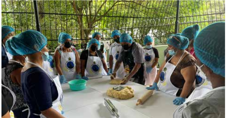
Con una inversión de B/3,152,824.29, el programa Redes de Familias atiende a 7,121 familias de áreas indígenas y rurales con proyectos sostenibles.

A través del programa Redes de Familias, el Ministerio de Desarrollo Social (Mides) incorpora a procesos productivos y en actividades de emprendimiento sostenible a familias beneficiarias de los programas de Protección Social que se encuentran en situación de pobreza, con el objetivo de que logren su movilidad social. El Mides y la empresa Harinera Oro del Norte, en la provincia de Veraguas, han establecido una alianza estratégica a favor de las beneficiarias del programa Redes de Familias, que consiste en el desarrollo de cursos de panadería y repostería, en busca de fomentar emprendimientos sostenibles. Esta alianza ha permitido que más de 70 mujeres veragüenses de corregimientos Colmena como Las Huacas, Cerro de Casas y Santiago Cabecera se capaciten en recetas de panes artesanales, como pan de sal, moña, flauta y biscocho. También están aprendiendo a preparar pizzas, a fin de que puedan emprender en este rubro y aportar a la economía de su hogar. A través de hornos, equipos de