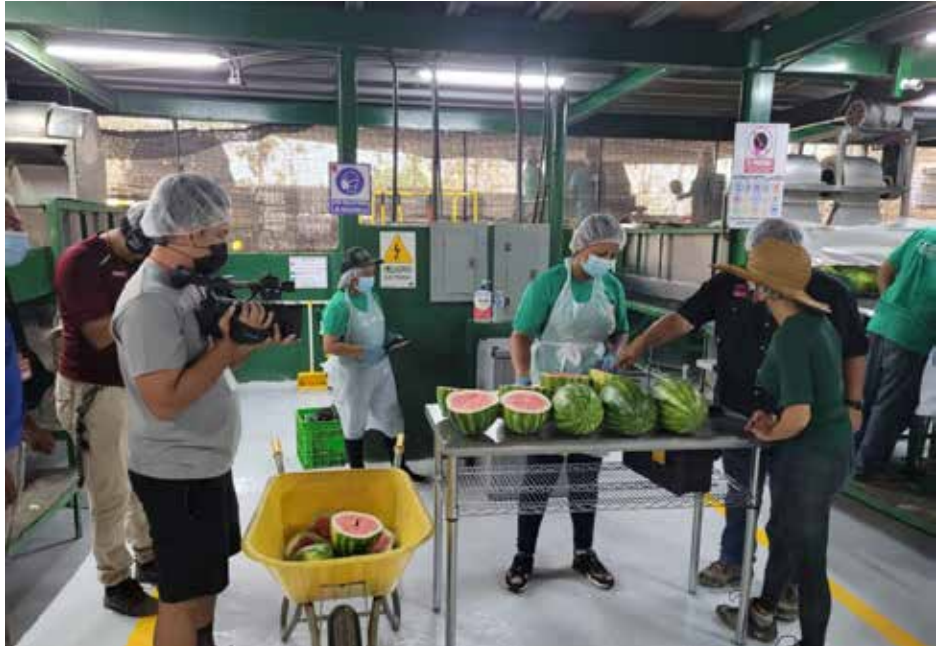
La cifra representa un incremento de B/.14.4 millones, en comparación con el mismo periodo del año 2021.

Entre los rubros que han incrementado sus exportaciones está el banano, con un aumento de más de B/.6.6 millones respecto al mismo periodo del 2021, lo que representa un 12% de incremento. Las agroexportaciones alcanzaron los B/.120 millones en los cinco primeros meses del año 2022, según un informe elaborado por la Dirección Nacional de Agronegocios (Dinagron), del Ministerio de Desarrollo Agropecuario (MIDA), que lidera Augusto Valderrama. La cifra representa un incremento en las agroexportaciones de B/.14.4 millones, en comparación con el mismo periodo del 2021, en los rubros de banano, aceite de palma, sandía, papaya, tabaco, entre otros, pese al alza del combustible, escasez de insumos, la pandemia y la guerra entre Rusia y Ucrania. América del Norte y Europa son los principales destinos de estas exportaciones, destacó Tomás Solís, director nacional de Agronegocios del MIDA sobre las regiones a las que se envían los productos panameños. Solís resaltó que el sector agropecuario panameño se ha venido fortaleciendo en esta administración, por instrucciones del presidente Laurentino Cortizo Cohen y el ministro Valderrama, como uno de objetivos del Gobierno para eliminar la sexta frontera del hambre, la pobreza y las desigualdades.