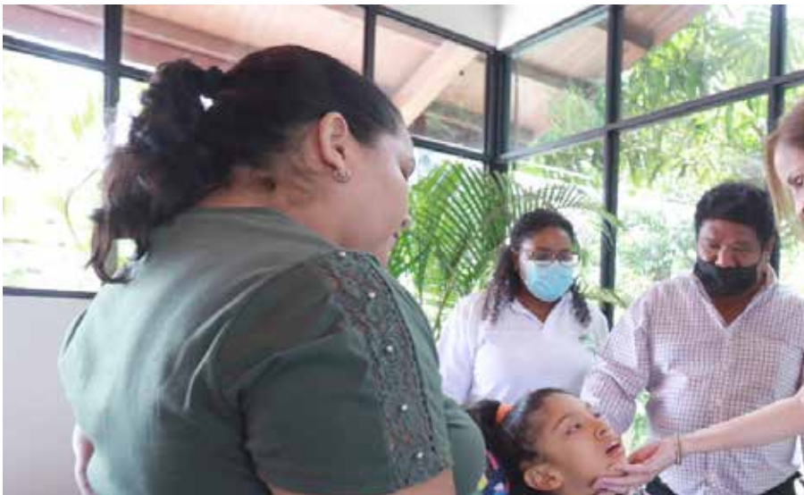
El convenio entre Mapfre, Aprob y Senadis alcanzó a 38 panameños y a sus familias.

La primera dama de la República, Yazmín Colón de Cortizo, participó en la última entrega de implementos para mejorar la calidad de vida de personas con discapacidad, dentro del convenio suscrito entre la Fundación Mapfre, la Asociación Pro Obras de Beneficencia (APROB) y la Secretaría Nacional de Discapacidad (Senadis), que benefició en esta ocasión a seis panameños. Se entregaron cinco coches ortopédicos para menores con distintos diagnósticos (parálisis cerebral, parálisis cerebral espástica, síndrome de West y parálisis cerebral cuadriparesia espástica) y una silla de ruedas especial para una adulta mayor con parálisis cerebral infantil. Colón de Cortizo detalló que se realizaron tres entregas en total, gracias al convenio entre Mapfre, APROB y Senadis, que ha ayudado a mejorar la calidad de vida de 38 panameñas y panameños y sus familias. El contrato de donación con la Fundación Mapfre fue por un monto de B/.75,000.00. Las donaciones entregadas incluyeron audífonos, camas hospitalarias, sillas de ruedas con especificaciones de acuerdo con la condición de cada paciente y coches ortopédicos. El objetivo del convenio es brindar apoyo a la población con discapacidad que se vio afectada por la crisis provocada por el Covid-19.