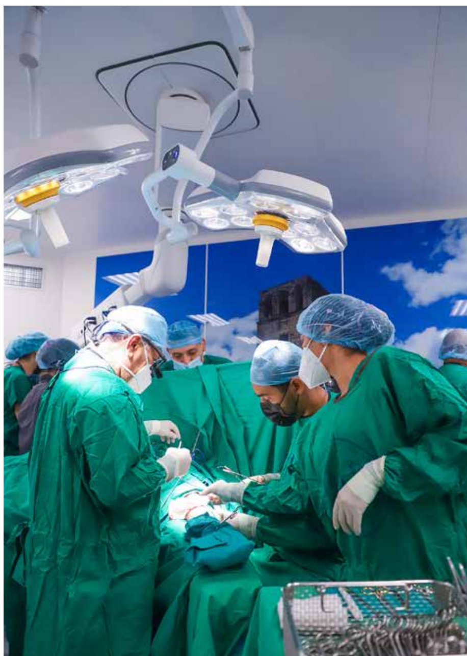
Parte del equipo que participó el 12 de julio en las primeras intervenciones de este innovador centro.

Este Instituto cuenta con cuatro quirófanos, dos híbridos, dos salones de hemodinámica, un salón de reserva de angiografía, central de esterilización, áreas de apoyo y 300 camas de hospitalización.