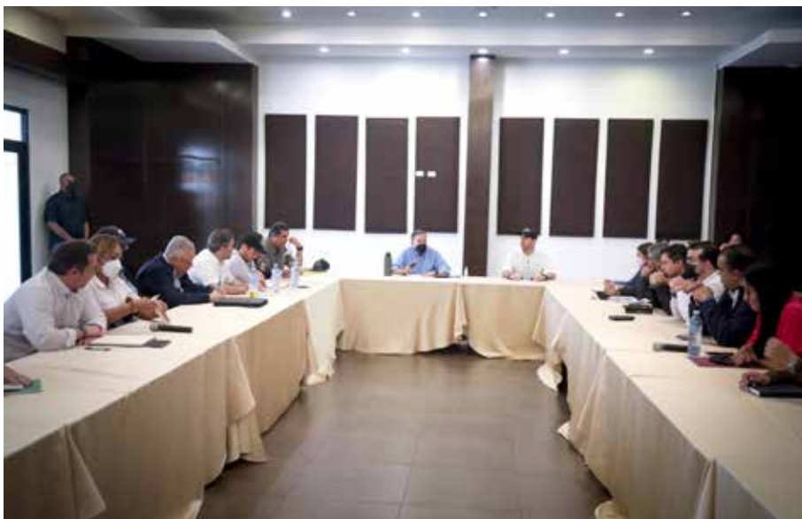
El vicepresidente de la República es el enlace entre el Ejecutivo y la Mesa del Diálogo por Panamá.

“El vandalismo y acciones contrarias a las leyes van a ser sancionadas; no podemos permitir el oportunismo de una minoría”,