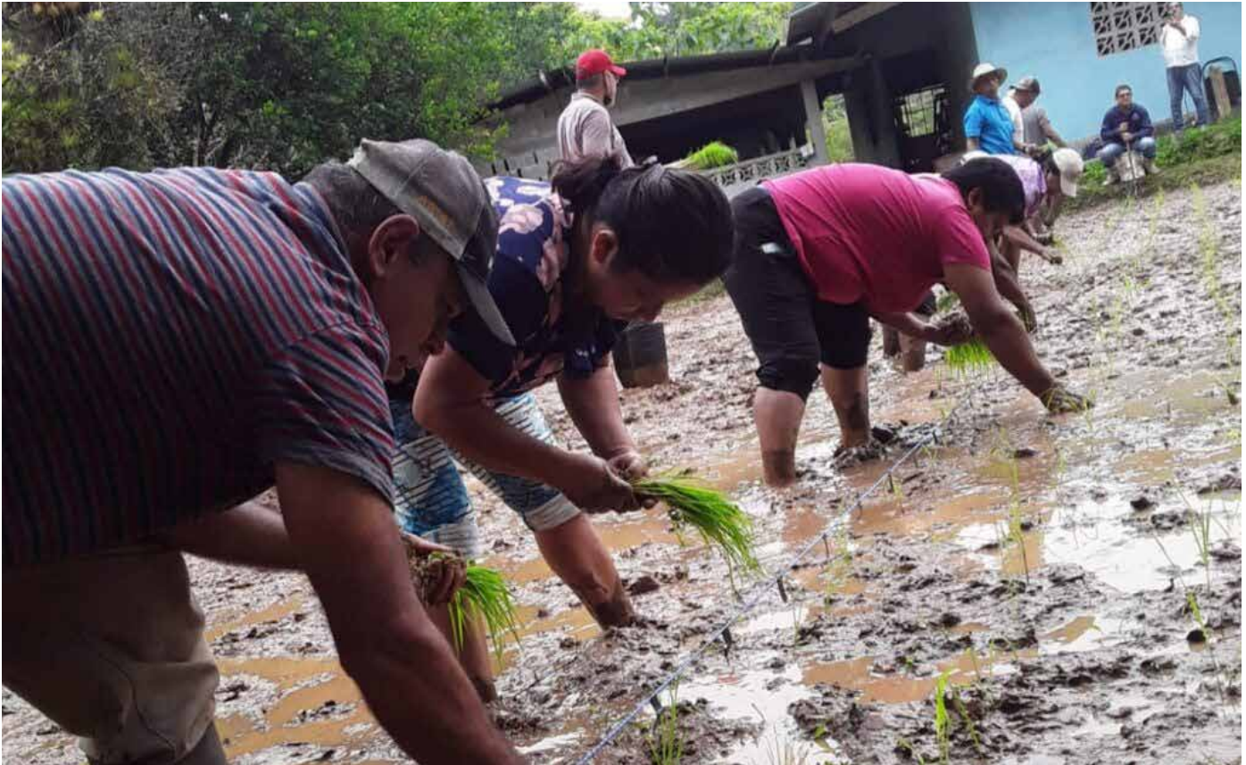
Familias beneficiadas con el programa realizan la siembra de arroz.

El Programa de Agroturismo del Ministerio de Desarrollo Agropecuario (MIDA) llevó a cabo la cuarta sesión de capacitación de la Escuela de Campo en rizipiscicultura con un manejo orgánico en la finca de la Cooperativa de Productores Agropecuarios Monseñor Crestar Durán, ubicada en la comunidad de Tres Hermanas, distrito de Capira, en Panamá Oeste. Durante esta etapa de la Escuela de Campo se desarrolló la siembra de arroz con la participación activa de 20 productores; la coordinadora nacional del Programa de Agroturismo,