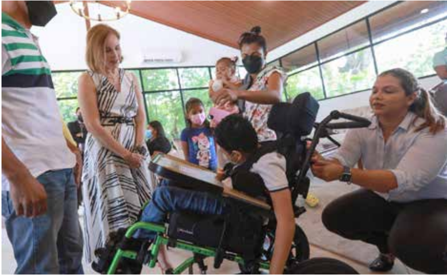
Se entregaron cinco coches ortopédicos para menores con distintos diagnósticos y una silla de ruedas especial para una adulta mayor.