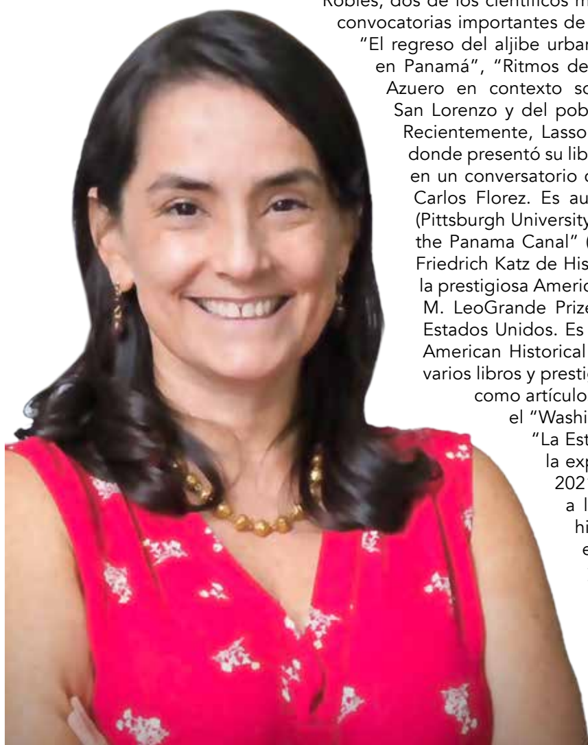
MARIXA A. LASSO, Directora del Centro de Investigaciones Históricas, Antropológicas y Culturales (CIHAC-AIP).

Lasso recomienda a los historiadores que se animen a plasmar por escrito el resultado de sus investigaciones y conocimientos para que la historia no se pierda y perdure por generaciones. Fue profesora en universidades en Estados Unidos y Colombia; miembro del Sistema Nacional de Investigación de Panamá e investigadora asociada del Instituto Smithsonian de Investigaciones Tropicales (STRI, por sus siglas en inglés). Su trabajo ha sido publicado en español, inglés y portugués y su libro “Erased” fue publicado en español por Critica/Planeta y en chino por Guangdong People’s Press.