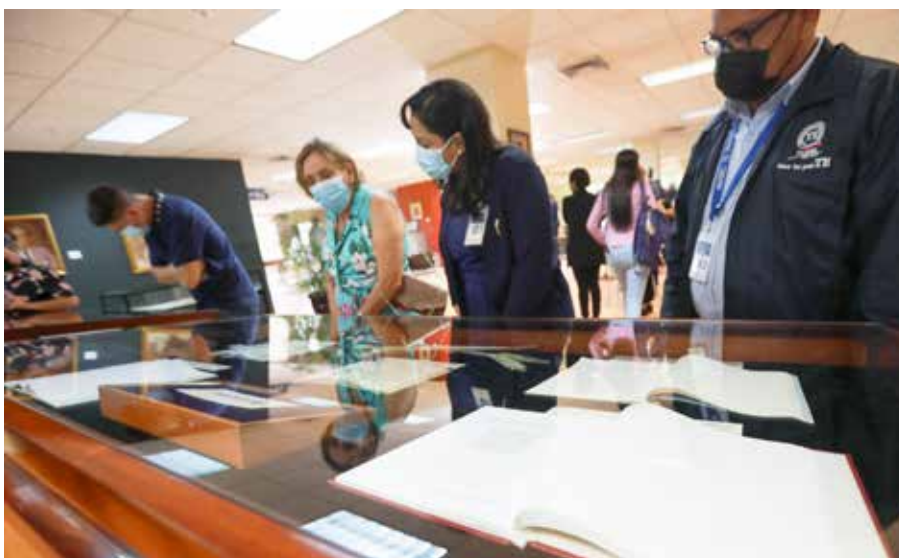
Los asistentes apreciaron la nueva exposición con motivo de los 80 años de la Biblioteca Nacional.