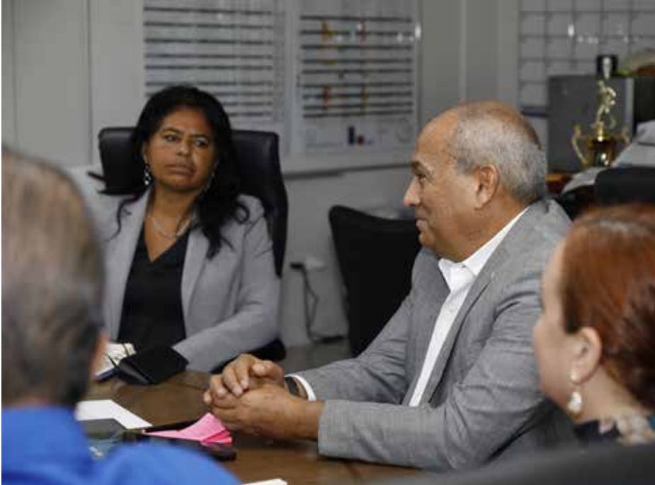
El ministro Concepción hizo la solicitud de extensión del préstamo financiado por este organismo internacional, a diciembre del 2025.