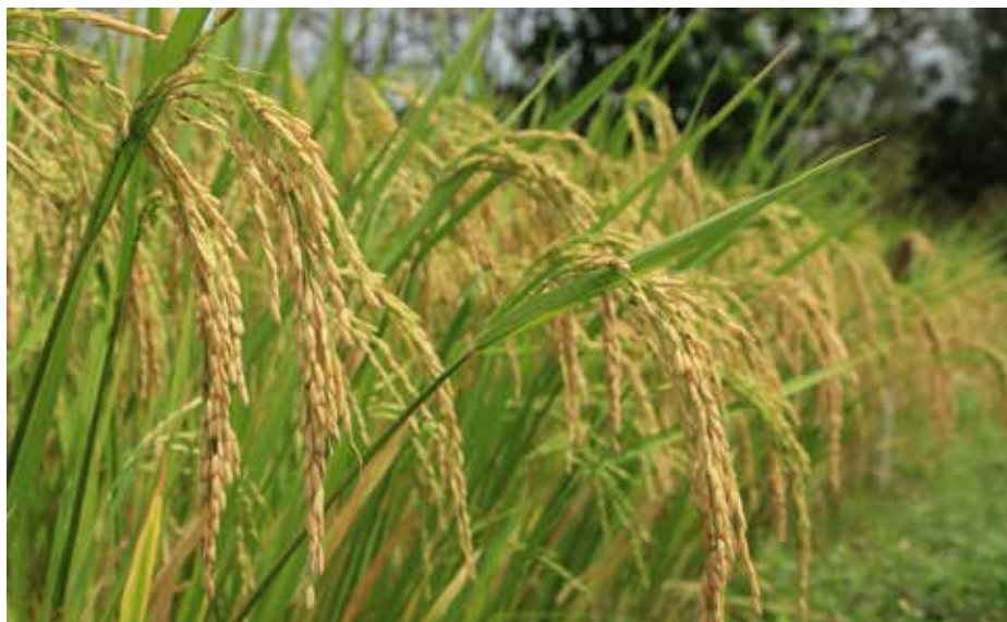
El promedio semanal de hectáreas de arroz sembradas se mantiene entre 2,500 a 3,500.

La extensión al 10 de agosto de la llegada de un contingente de 600 mil quintales de arroz que estaba previsto entrar al país el 1 de agosto se aprobó en una reunión extraordinaria del Comité de Cadena Agroalimentaria de Arroz, la cual se realizó de manera virtual con la participación del viceministro de Desarrollo Agropecuario, Carlo Rognoni. Durante la reunión, se informó que la empresa a la que se le adjudicó la importación, TRC Trading Corporation, hizo la petición debido al congestionamiento de barcos en el puerto de carga para la traída del grano a Panamá. El viceministro agradeció al Comité por aprobar la solicitud, ya que, según dijo, se pusieron los intereses del país por delante, con lo cual "se sigue construyendo patria". Añadió que espera seguir logrando consensos como este, por el bien del país y de todos los involucrados en esta actividad. Desde que inició este gobierno, indicó Rognoni, se han fortalecido las decisiones de la Cadena y dijo que para el MIDA es importante contar con el aval de todos los integrantes en la toma de decisiones como esta. Alexander Araúz, presidente del Comité, dijo que esta fue una