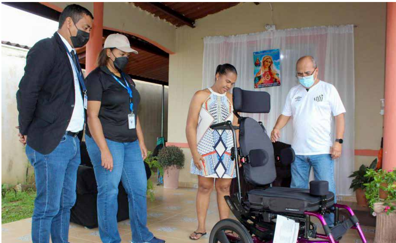
En Arraiján se entregó una silla de ruedas especial a una joven con encefalopatía epileptogénica.