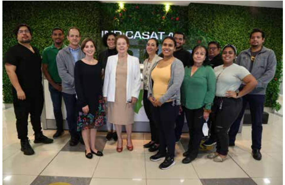
Miembros de la comisión evaluadora, investigadores y técnicos en la entrega de la certificación.