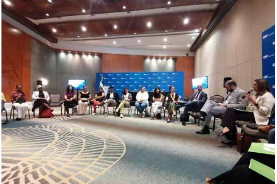
Esta iniciativa tuvo como marco la CLXXV Reunión del Directorio de CAF en Panamá.

El encuentro fue propicio para discutir los desafíos de la política nacional del medio ambiente y la protección, mitigación y adaptación al cambio climático.