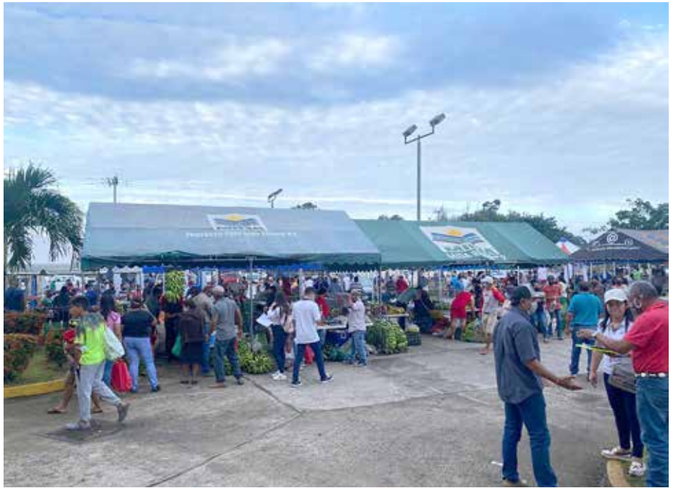
La actividad se llevó a cabo en los estacionamientos del Estadio Omar Torrijos Herrera, en la ciudad de Santiago, donde los productores vendieron con éxito todos sus productos.