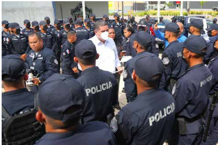
Noventa nuevas unidades de la Policía Nacional fueron asignadas a la Décima Sexta Zona Policial de Pacora.

Se entregaron cuatro vehículos doble cabina para patrullaje en las áreas de difícil acceso en esta zona de la capital.