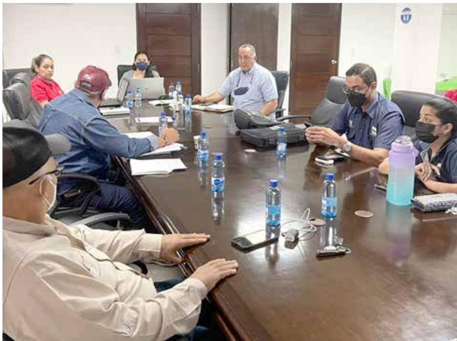
Veterinarios del MIDA y del Minsa coordinan el cronograma de esta etapa de formación profesional.