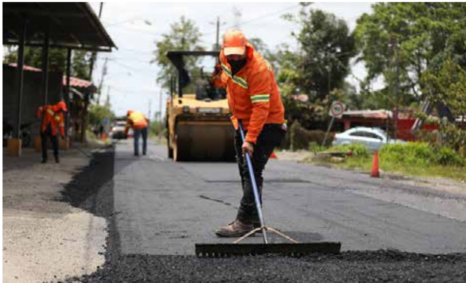
Rehabilitación de calles internas del distrito de Changuinola.

El Ministerio de Obras Públicas avanza con la ejecución de proyectos que contribuirán a reactivar la economía, generar empleos e impulsar el turismo en la provincia de Bocas del Toro. Durante una gira de inspección, se pudo constatar que el proyecto de diseño y construcción de caminos: Chiriquí Grande-Quebrada Bajo y Chiriquí Grande-Ballena, de unos 9.21 kilómetros, avanza en un 70%. Esta obra contempla la construcción de cuatro puentes vehiculares de dos carriles de circulación con paso peatonal. También se visitó el proyecto de diseño, construcción, rehabilitación y financiamiento de calles y caminos del distrito de Changuinola, que abarca una longitud de unos 42.30 kilómetros. En un 25.62% avanzan los trabajos del proyecto de diseño, construcción y rehabilitación de calles y caminos del distrito de Almirante, que contempla la construcción de cinco puentes vehiculares y 14 cajones pluviales. La gira de inspección incluyó el proyecto de rehabilitación de la carretera Las Tablas-Las Delicias Arriba, situado en Changuinola, el cual avanza en un 52.97%.