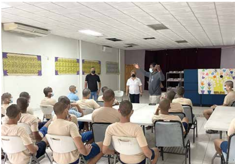
Entre las actividades organizadas destacan charlas motivacionales, alabanzas y talleres de fútbol.