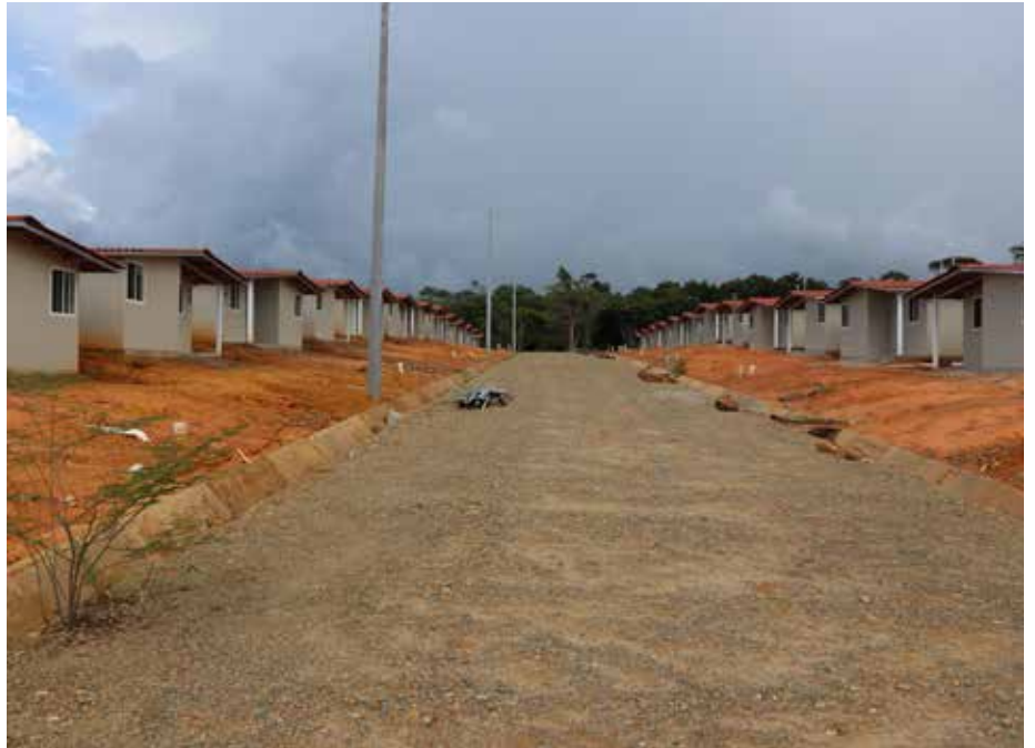
El complejo de residencias lo desarrolla la empresa HOS, a un costo de B/.12.2 millones.

La Casa de la Chicha y la sede del Congreso serán edificadas por los propios indígenas con materiales autóctonos, con la finalidad de guardar sus tradiciones y costumbres culturales.