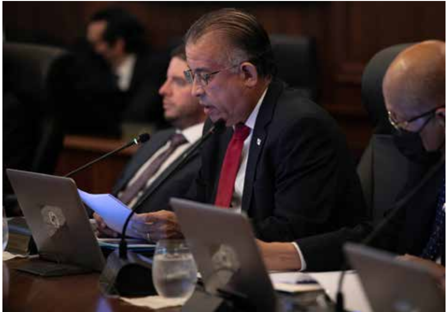
Con esta iniciativa, surgida en el Consejo de Gabinete, la administración del presidente Cortizo Cohen cumple compromiso con el sector agro.

El Consejo de Gabinete realizado el 10 de agosto autorizó al ministro de Desarrollo Agropecuario, Augusto Valderrama, a presentar ante la Asamblea Nacional el proyecto de ley 1422, que establece la Política Agroalimentaria del Estado y otras disposiciones. El ministro Valderrama manifestó su satisfacción con la iniciativa, porque fue una promesa expresada por el presidente Laurentino Cortizo Cohen en Tierras Altas en el 2019, que define una política de Estado que determinará el desarrollo del sector agro. Valderrama indicó que esta es una de las acciones plasmadas en el Plan de Gobierno para blindar al sector de los vaivenes de la política. “En estos tres años de gobierno hemos visto un sector agropecuario fortalecido, cuando anteriormente estaba prácticamente dismantelado”, afirmó el ministro. Por su parte, Carlo Rognoni, viceministro de Desarrollo Agropecuario, expuso ante el consejo de ministros los objetivos de la normativa. Rognoni explicó que se busca transformar el sector agropecuario, que sea inclusivo, eficiente, sostenible e innovador, así como garantizar la seguridad jurídica y la adecuación institucional. El consejo de ministros también aprobó el Proyecto de Resolución de Gabinete 89-22 que aprueba la contratación, mediante procedimiento excepcional a celebrarse entre el Ministerio de Educación y la empresa