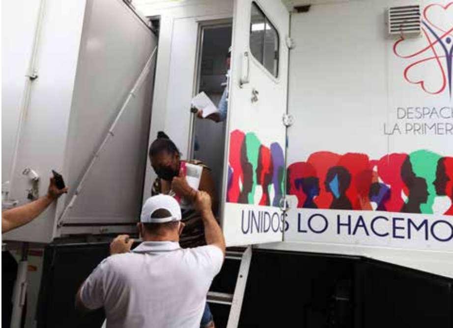
Las jornadas de atención médica se llevaron a cabo del 9 al 12 de agosto.