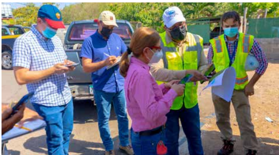
Las redes de alcantarillado serán interconectadas al sistema para llevar las aguas residuales de los sectores a la Planta de Tratamiento ubicada en Juan Díaz.

El proyecto beneficiará a 43,770 panameños residentes de los corregimientos de Ernesto Córdoba Campos, Amelia Denis de Icaza, Belisario Porras, Omar Torrijos y Belisario Frías.