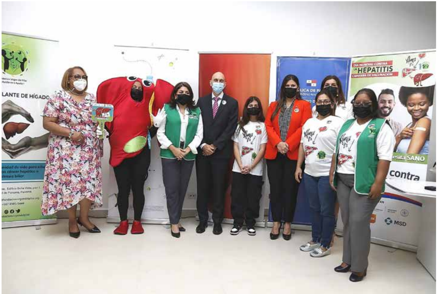
La jornada de vacunación contra la hepatitis A y B busca prevenir los trasplantes de hígado por afecciones de cirrosis.