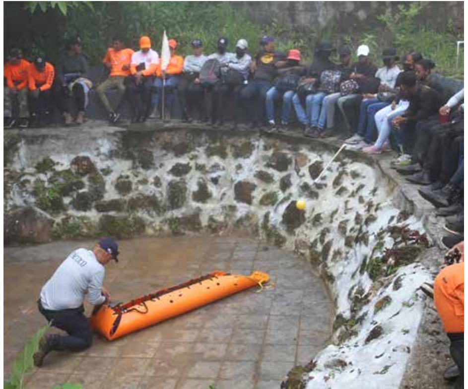
El curso de primeros auxilios forma parte de las actividades de prevención.