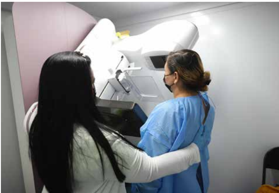
Estas unidades móviles han realizado más de 14,000 atenciones en lo que va del año.

Las clínicas móviles "Salud sobre Ruedas", del Despacho de la Primera Dama, liderado por Yazmín Colón de Cortizo, brindaron sus servicios médicos en la jornada de atención a la mujer que se realizó del 9 al 12 de agosto en el Centro de Salud de Tocumen. La unidad móvil "Salud sobre Ruedas" brindó los siguientes servicios: Papanicolaou, mamografía, electrocardiograma e implantes anticonceptivos. Además, se brindó atención en medicina general y vacunación. Otros puntos donde atendieron las unidades móviles de "Salud Sobre Ruedas" fueron: Hospital Santo Tomás y en la comunidad de Lajero, comarca Ngäbe Buglé. Del 16 al 19 de agosto, estas clínicas móviles brindarán atención a la población que se acerque al Centro Comercial Los Pueblos, a un costado del Mercado del Calzado, donde ofrecerán los servicios de Papanicolaou, mamografía, electrocardiograma y colocación de implantes anticonceptivos (las mujeres que deseen colocarse este método de planificación familiar, deberán presentar una prueba de embarazo negativa). Desde febrero hasta la fecha, las clínicas móviles "Salud sobre Ruedas" han realizado más de 14,000 atenciones, con servicios como Papanicolaou, mamografía, electrocardiograma, ultrasonidos y pruebas de VIH, entre otros. Las atenciones se brindan agendando una cita previa en el centro de salud de su comunidad.