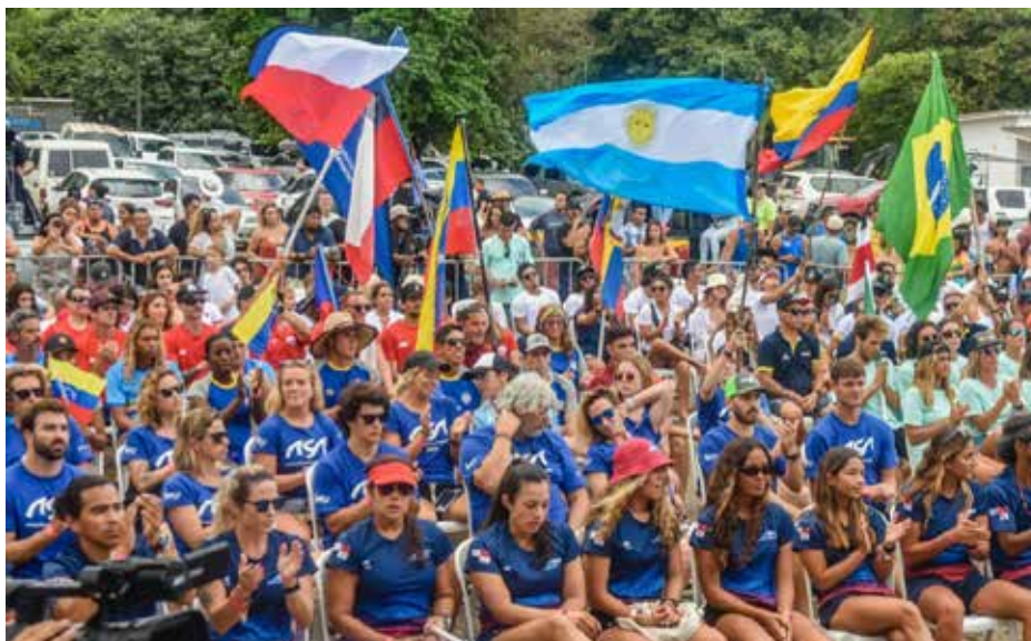
El impacto directo solo en hospedaje de los competidores superó los B/.250 mil, y más de B/.100 mil en turistas nacionales