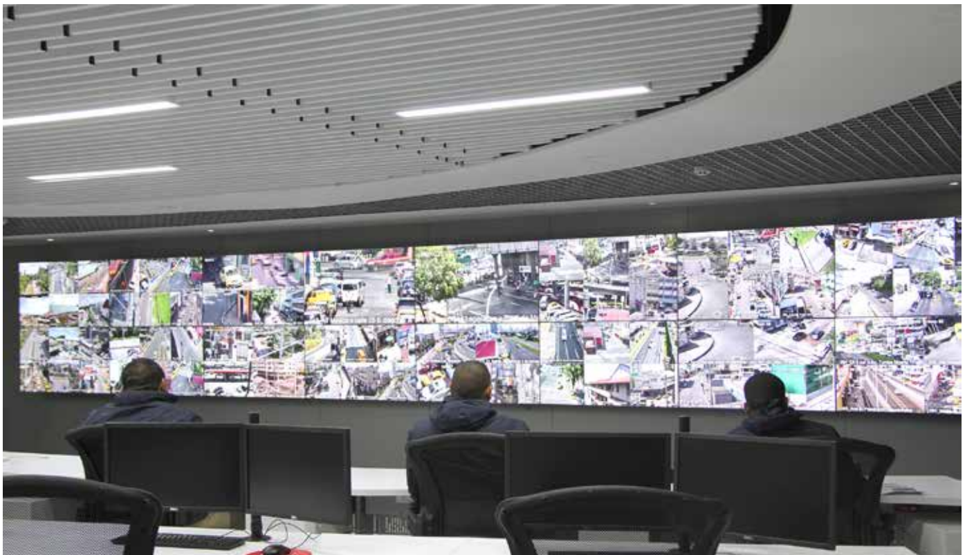
La medida busca prevenir la delincuencia.

educación secundaria, es llevarlos a que logren desarrollar un proyecto de vida y no sean presas de las organizaciones delincuenciales que tratan de reclutarlos para sus actividades ilícitas”, puntualizó el ministro Pino.