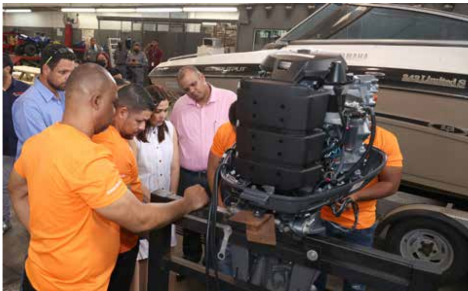
Los detenidos fueron certificados en mantenimiento de motores fuera de borda.