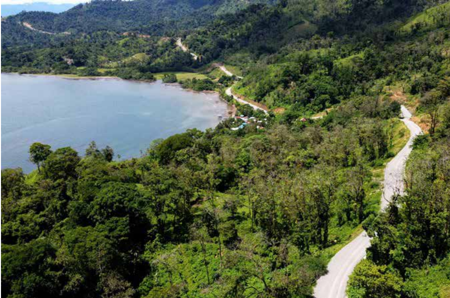
Diseño y construcción de caminos: Chiriquí Grande-Quebrada Bajo y Chiriquí Grande-Ballena.