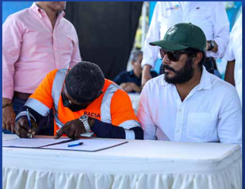
FIRMA DE CONTRATO MEDIANTE EL PROGRAMA INSERCIÓN LABORAL DIRECTA (DILA)