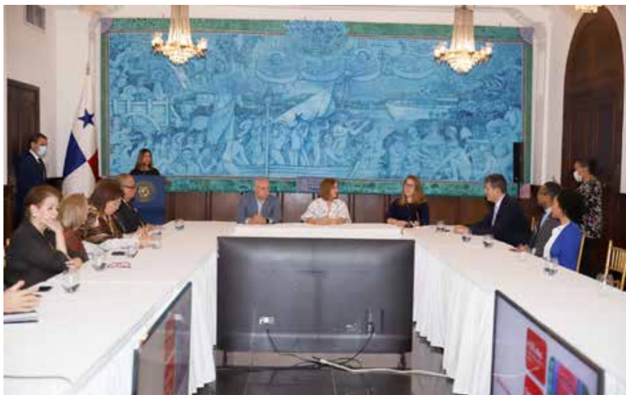
La primera dama, Yasmín Colón de Cortizo, fue testigo de honor de la firma de estos convenios que promueven la salud y el emprendimiento en niños y jóvenes.