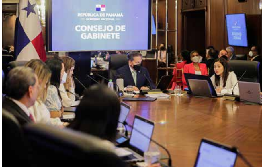
La AIG hizo la presentación del proyecto de modernización de las Casas de Justicia Comunitaria de Paz.

Se incorporarán nuevos requisitos para ser juez comunitario y secretario, con el fin de mejorar el perfil profesional de estos operadores de justicia.