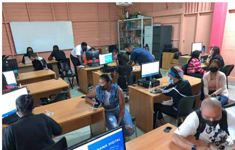
Hay más de 500 vacantes de empleo a espera de personal calificado.