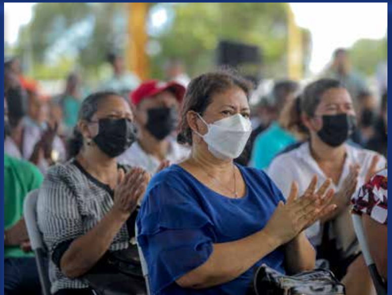
El puente vehicular de dos vías en Bique, Arraiján, será de 170 pies y beneficiará a 3,500 personas.

El Gobierno Nacional, a través del Ministerio de Obras Públicas (MOP), entregó la orden de proceder para la construcción de un puente vehicular con pasarela peatonal de "Puentes para el Progreso" en el corregimiento de Bique, en la comunidad de La Playita, a un