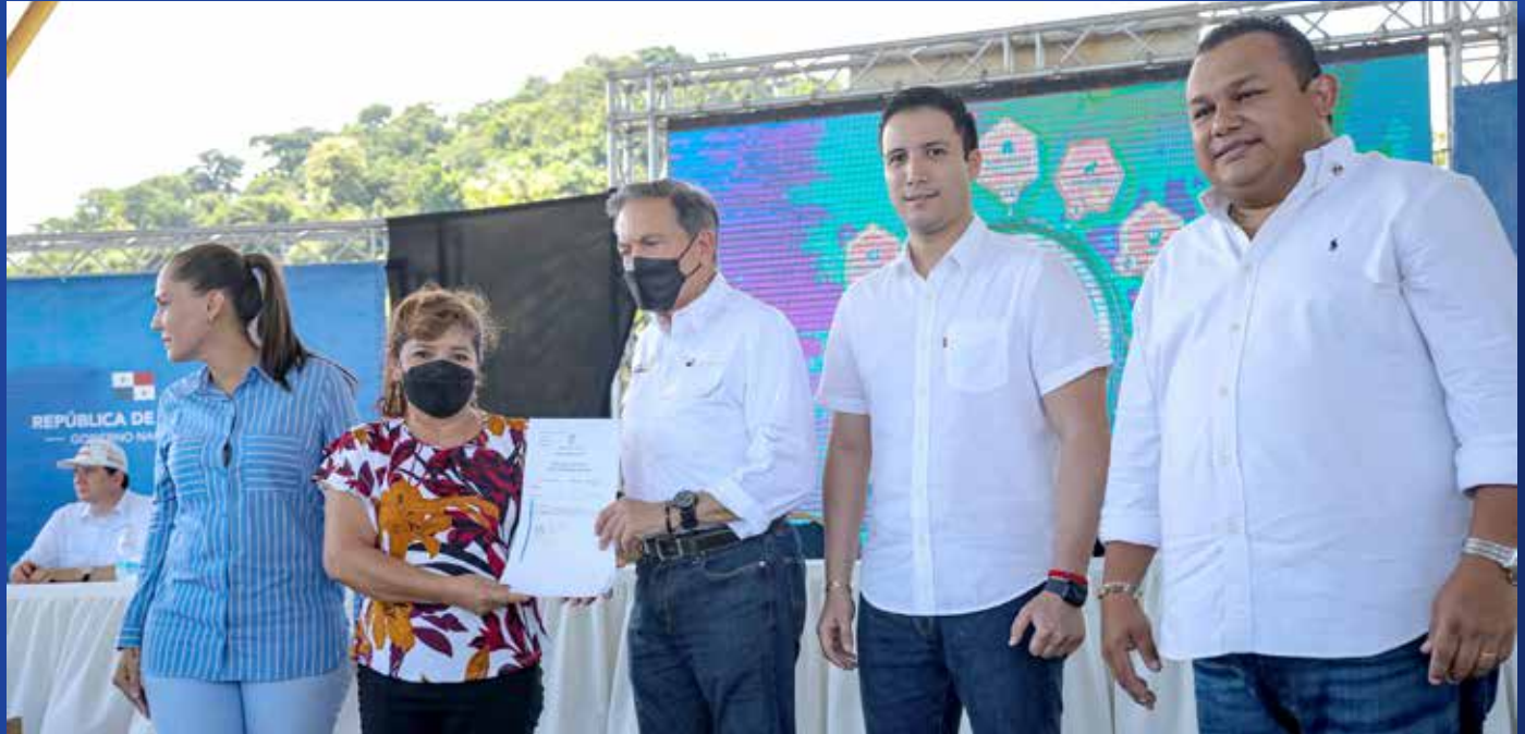
ENTREGA DE ESCRITURAS PÚBLICAS POR EL BANCO HIPOTECARIO NACIONAL