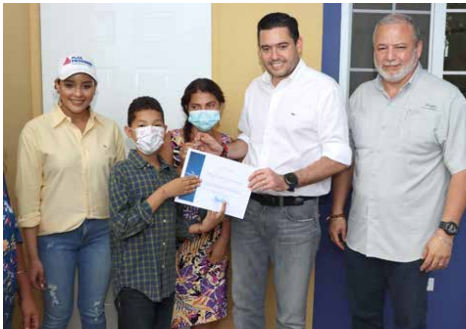
Una de las familias beneficiadas vivía en hacinamiento, compartiendo espacio con ocho personas.

Las otras familias impactadas con unidades básicas y el Plan Progreso son de Penonomé, La Pintada y Olá.