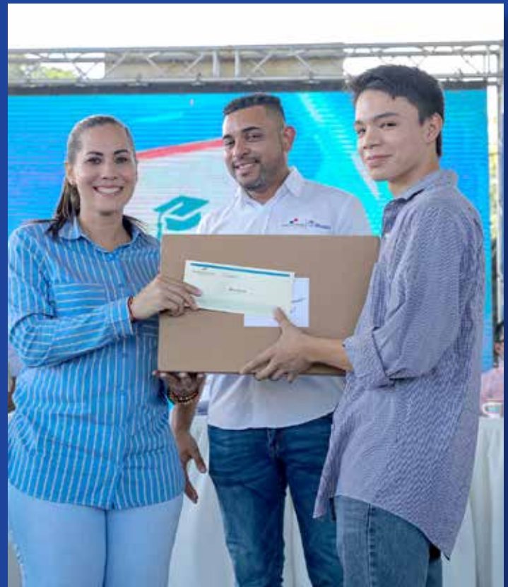
ENTREGA DE BECAS

El presidente de la República, Laurentino Cortizo Cohen, llevó a cabo, el viernes 9 de septiembre, la Gira de Trabajo Comunitario (GTC) 112 'Tierra Adentro' en la provincia de Panamá Oeste, en el distrito de Arraiján, entregando obras y beneficios por un monto de B/.9,534,209.99. Durante la GTC, el mandatario participó en la inauguración del Centro de Operaciones de Videovigilancia Municipal de Arraiján (primera etapa), con una inversión de B/.7,000,000. Además, entregó la orden de proceder para la construcción del puente vehicular con pasarela peatonal de "Puentes para el Progreso" en el corregimiento de Bique, en la comunidad de La Playita, a un costo de B/.1,117,558.94, y la orden de proceder para el estudio, diseño y equipamiento para el nuevo Centro de Atención Integral a la Primera Infancia (CAIPI) en Veracruz, cuyo costo asciende a B/.564,142.40. En beneficios se entregó B/.40,000 en capital semilla a emprendedores, 31 becas a estudiantes, orden de proceder para el suministro de 6 motores fuera de borda para pescadores de Veracruz, un bus de 30 pasajeros al Municipio de Arraiján (B/.78,300.00) y equipos de desinfección, medicamentos y equipos médicos a la Región de Salud de Panamá Oeste. También se procedió con la firma de 30 contratos del Programa de Inserción Laboral y se entregaron 17 mejoras habitacionales.