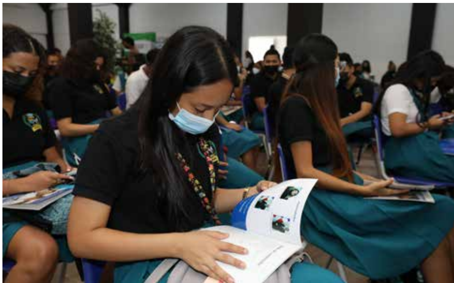
Estudiantes de la Escuela Profesional Isabel Herrera Obaldía.