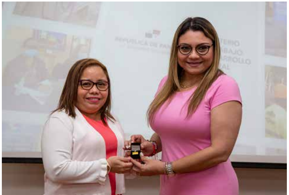
Conmemoran Día del Trabajador Social en Panamá.