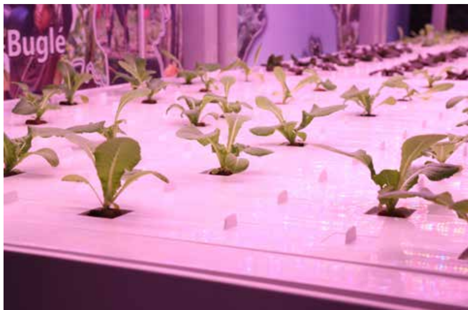
Módulo demostrativo instalado en el IICA en Panamá.

Un módulo de agricultura vertical para demostrar el funcionamiento de este sistema que incorpora alta tecnología, y que se implementará a futuro en el Centro de Investigación y Producción en Ambiente Controlado (Cipac AIP), fue presentado por la Secretaría Nacional de Ciencia, Tecnología e Innovación (Senacyt) y el Instituto Interamericano de Cooperación para la Agricultura (IICA). El Cipac AIP será un centro de excelencia de investigación, de producción, de capacitación y transferencia de conocimientos a los productores, instituciones y centros de investigación. Estará ubicado en Tocumen, en terrenos de la Facultad de Ciencias Agropecuarias de la Universidad de Panamá (UP), y contará con dos centros regionales, en occidente (Chiriquí) y en Azuero (Guararé). “Este centro abordará varios ejes estratégicos para el país: la transformación productiva, el uso de tecnología para mejorar la competitividad y el desarrollo social, la seguridad alimentaria y nos confirma el compromiso del Gobierno Nacional y de la Senacyt de promover la ciencia y la tecnología como herramienta de desarrollo sostenible”, dijo Eduardo Ortega-Barría, secretario nacional de la Senacyt.