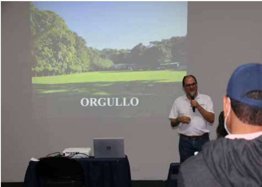
Para el mes de octubre, la ATP programa una jornada especializada en turismo de aventura para guías residentes en El Valle de Antón.