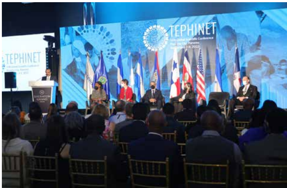
Epidemiólogos y científicos de diversos países se reunieron en Panamá durante la Conferencia Científica Global de Epidemiología.

Hasta el viernes 9 de septiembre, Panamá fue la sede de la 11ª Conferencia Científica Global TEPHINET, evento que se realizó por segunda vez en un país miembro del Consejo de Ministros de Salud de Centroamérica y República Dominicana (Comisca). Este encuentro, que fue inaugurado en representación del Gobierno Nacional por el ministro de Salud, Luis Francisco Sucre, acogió a científicos de todo el mundo que abordaron diversos temas epidemiológicos. “Este evento es importante para Panamá porque como país ha demostrado los avances en materia de epidemiología de campo y, además, el intercambio de información y conocimientos entre epidemiólogos de otros países para abordar temas tales como la Covid-19 y la viruela símica, y para trabajar a nivel regional y mundial”, mencionó Sucre ante un auditorio de más de 400 profesionales de la salud pública. TEPHINET es la red global de Programas de Capacitación en Epidemiología de Campo (FETP, por sus siglas en inglés) que crea una fuerza mundial para proteger a todas las personas de las amenazas que podrían afectar la salud pública.