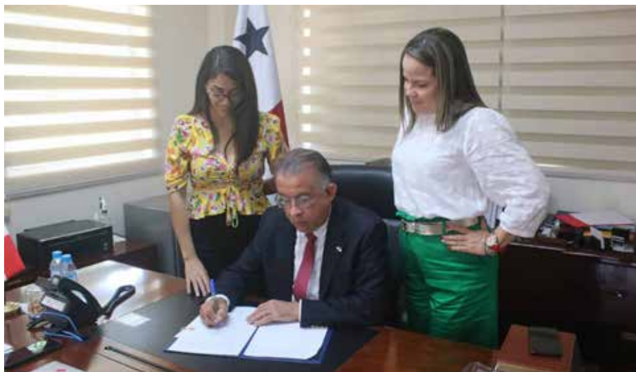
El ministro Valderrama, durante la firma de la resolución.

El cultivo de la pitahaya fue declarado "prioritario y de importancia" en Panamá, luego de la firma de una resolución ministerial por parte del ministro de Desarrollo Agropecuario, Augusto Valderrama, en respuesta a una solicitud de productores que incursionan en este rubro de gran impacto en el mercado internacional. Valderrama señaló que el presidente de la República, Laurentino Cortizo Cohen, y el equipo del MIDA cumplen con esta solicitud que apoyará a más de 30 productores que hay actualmente en el país y que producen más de 100 toneladas en unas 35 hectáreas, para que puedan incorporarse a las ferias internacionales que se están promoviendo a través de ProPanamá y el Ministerio de Comercio e Industrias (MICI). Agregó que con este documento podrán ser considerados para beneficiarse con programas de instituciones como el Instituto de Seguro Agropecuario (ISA), el Instituto de Innovación Agropecuaria de Panamá (IDIAP), la banca nacional y entes comerciales para continuar impulsando la producción de pitahaya que fue introducida en Panamá, especialmente en Panamá Oeste, hace más de 20 años por la Misión Técnica de Taiwán. El ministro