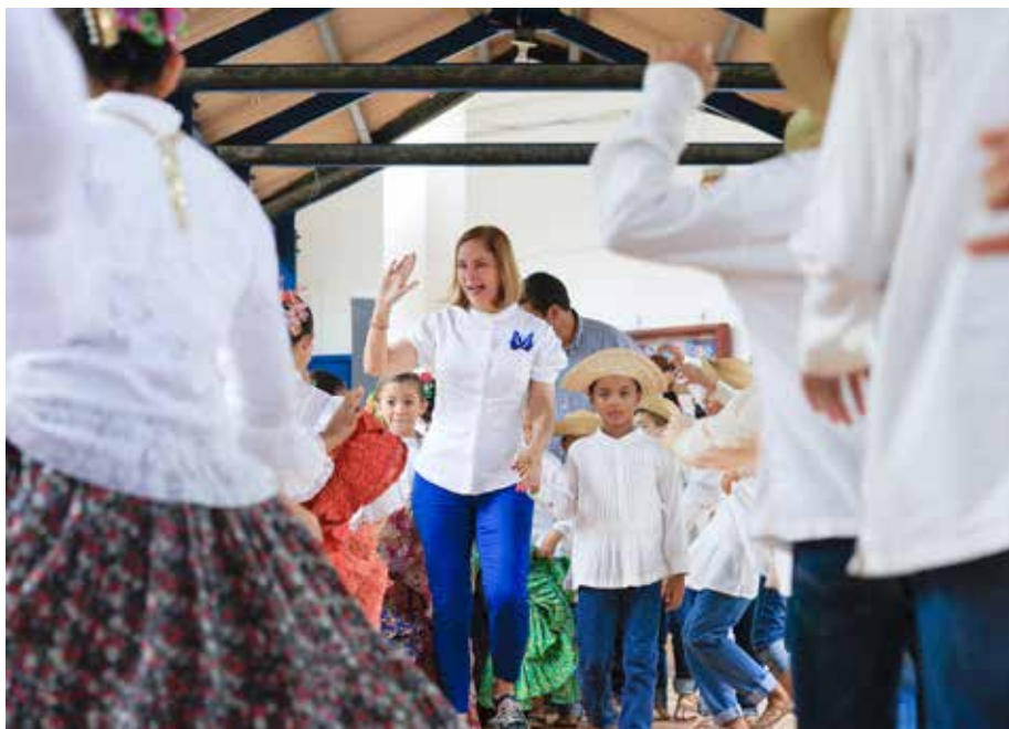
La primera dama participó en la jornada de atención del programa “Ver y Oír para Aprender” en Guararé.

Una nueva jornada de atención del programa “Ver y Oír para Aprender”, esta vez en la provincia de Los Santos, realizó el Despacho de la Primera Dama de la República, encabezado por Yasmín Colón de Cortizo. La jornada, que se llevó a cabo el miércoles 7 y jueves 8 de septiembre, evaluó a 1,319 estudiantes de 19 centros educativos oficiales de los distritos de Macaracas y Guararé. Colón de Cortizo mostró su satisfacción porque en lo que va del año se ha logrado impactar a 3,679 estudiantes en diferentes puntos del país. A la fecha, se han entregado 221 lentes a niños con problemas visuales, mejorando su calidad de vida y contribuyendo a su rendimiento escolar. En esta jornada, además de las revisiones oftalmológicas y auditivas, el equipo del Despacho de la Primera Dama ofreció otros servicios médicos, como peso y talla, nutrición, atención odontológica, vacunación, consultas de medicina general, entre otros. También hubo espacio para atención veterinaria a las mascotas, con vacunación y desparasitación. La próxima parada de “Ver y Oír para Aprender” será en la provincia de Chiriquí y el objetivo es atender y evaluar a más de 2 mil estudiantes de escuelas oficiales en comunidades menos favorecidas.