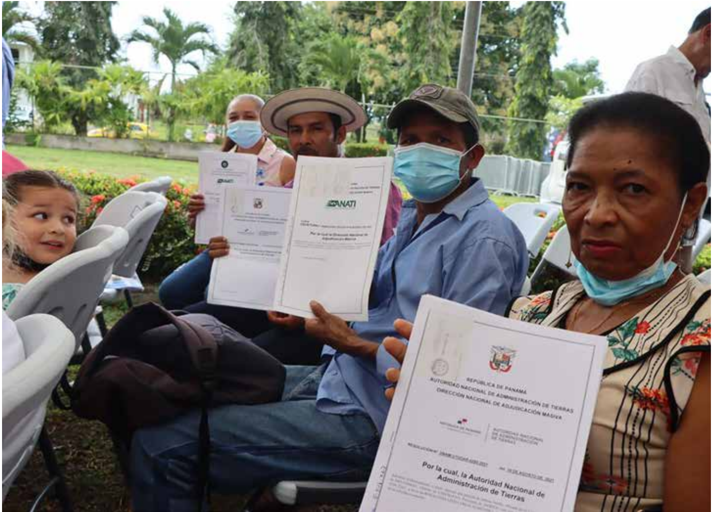
El 54% de las escrituras fueron entregadas a mujeres productoras y cabezas de familia.