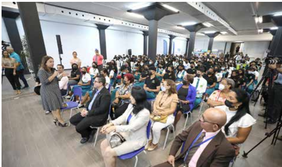
La demanda de carreras en el mercado laboral se ha dinamizado tras la pandemia.