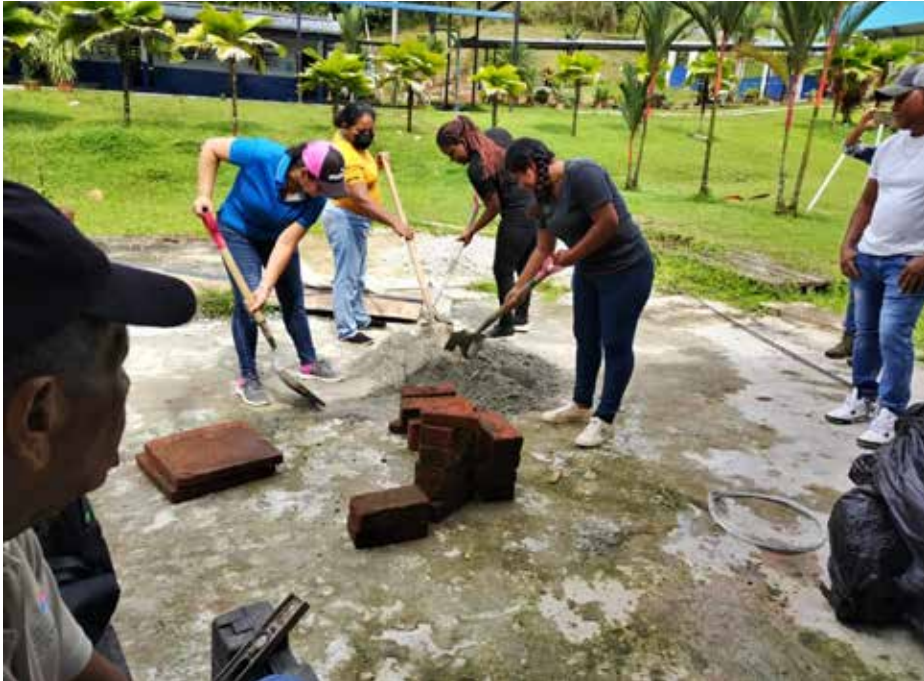
Las estufas ecológicas implican la reducción en el uso de leña hasta un 70% y menos tiempo en la cocción de los alimentos.