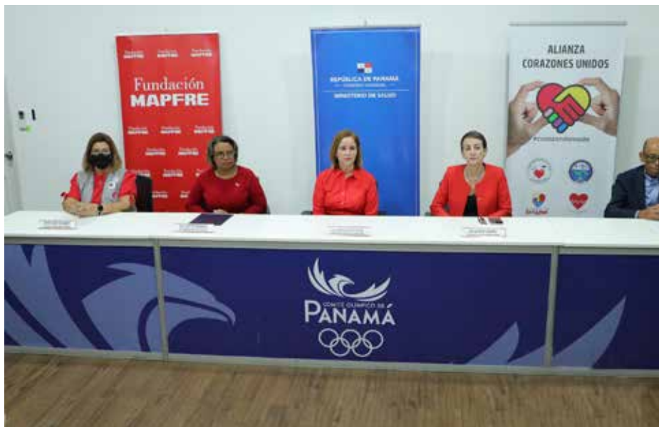
El Minsa y la Alianza Corazones Unidos presentaron la campaña “Corazón de Moda 2022”, en el marco de la celebración del Día Mundial del Corazón, el 29 de septiembre próximo.

Con motivo de la celebración, el próximo 29 de septiembre, del Día Mundial del Corazón, el Ministerio de Salud (Minsa), en conjunto con la Alianza Corazones Unidos, hizo el lanzamiento de la campaña “Corazón de Moda 2022”, que busca cada año concientizar a las personas sobre la práctica de hábitos de alimentación saludable para reducir factores de riesgo asociados a las enfermedades cardiovasculares. El evento contó con la participación de la primera dama de la República, Yazmín Colón de Cortizo, quien hizo un llamado a las personas a practicar actividades físicas, realizarse controles de salud, tomarse los medicamentos y, principalmente, no fumar; que contribuyen a cuidar el corazón de cualquier tipo de enfermedades. Por su parte, Ivette Berrío, viceministra de Salud, manifestó que las enfermedades cardiovasculares son la primera causa de muerte en el mundo. Los infartos de miocardio y los accidentes cerebrovasculares cobran más de 17 millones de vidas al año y se estima que la cifra ascenderá a 23 millones para el año 2030. Durante todo el mes de septiembre, la Alianza Corazones Unidos, integrada por fundaciones vinculadas a enfermedades cardiovasculares, programa actividades para promover, prevenir y cuidar el corazón.