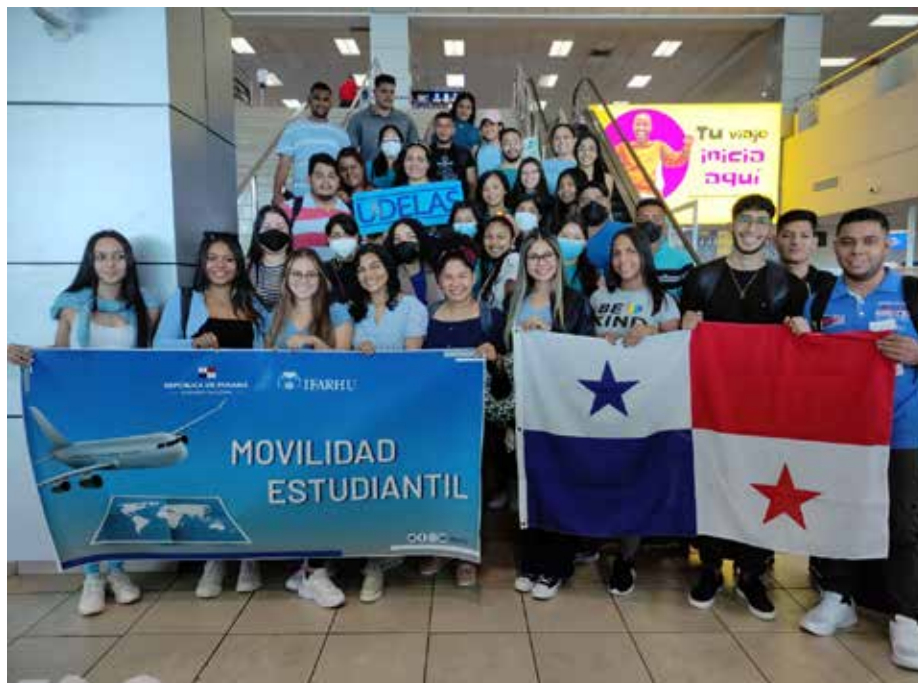
Los jóvenes forman parte del Subprograma de Movilidad Estudiantil Internacional que desarrolla el Instituto para la Formación y Aprovechamiento de Recursos Humanos (IFARHU).

Un grupo de 42 estudiantes de tercer y cuarto año de la Facultad de Ciencias Médicas y Clínicas de la Universidad Especializada de las Américas (UDELAS) viajaron a Madrid, España, para realizar una pasantía internacional de dos semanas. Se trata de estudiantes que forman parte del Subprograma de Movilidad Estudiantil Internacional que desarrolla el Instituto para la Formación y Aprovechamiento de Recursos Humanos (IFARHU), mediante el cual se enfocarán en las "Nuevas tendencias en dirección y gestión sanitaria". La capacitación en European Business School permitirá a los estudiantes panameños intercambiar experiencias con sus similares de España, además de docentes y profesionales que les ofrecerán una visión global para dirigir organizaciones del sistema sanitario y ser líderes en la toma de decisiones. Este es el segundo grupo de estudiantes de Udelas que forma parte del Subprograma de Movilidad Estudiantil Internacional, que agrupa a jóvenes de la Universidad de Panamá, Universidad Tecnológica de Panamá y la Universidad Autónoma de Chiriquí, quienes ya han realizado su pasantía en España y México.