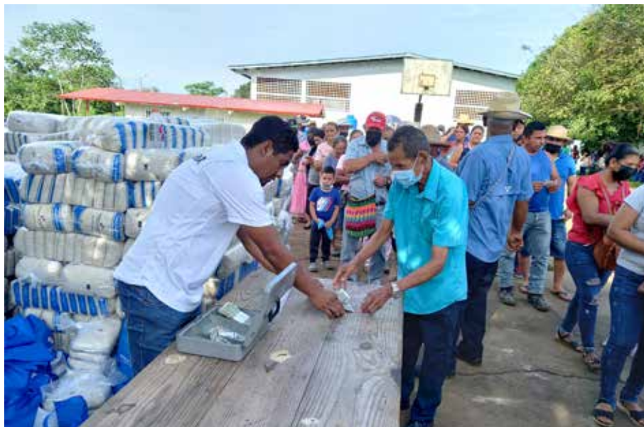
Agromercado realizado el jueves 8 de septiembre en El Piro No. 1, comarca Ngäbe Buglé.

Un total de 20 agroferias realizó el Gobierno Nacional a través del Instituto de Mercadeo Agropecuario (IMA), del 6 al 11 de septiembre, en diferentes partes del país, donde se ofrecieron alimentos de la canasta básica a precios económicos. Entre los productos que se ofertaron hubo arroz, aceite, azúcar, sal, espaguetis, pasta de tomate, crema de maíz, frijoles, café y tuna. En estas agroferias, realizadas en conjunto con instituciones gubernamentales y autoridades locales, se ofrecieron diferentes servicios, como atención médica y entrega de beneficios. También contaron con la participación de agricultores locales y emprendedores que