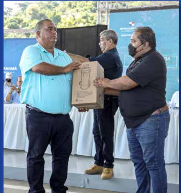
SUMINISTRO DE EQUIPOS DE DESINFECCIÓN, MEDICAMENTOS Y EQUIPOS MÉDICOS