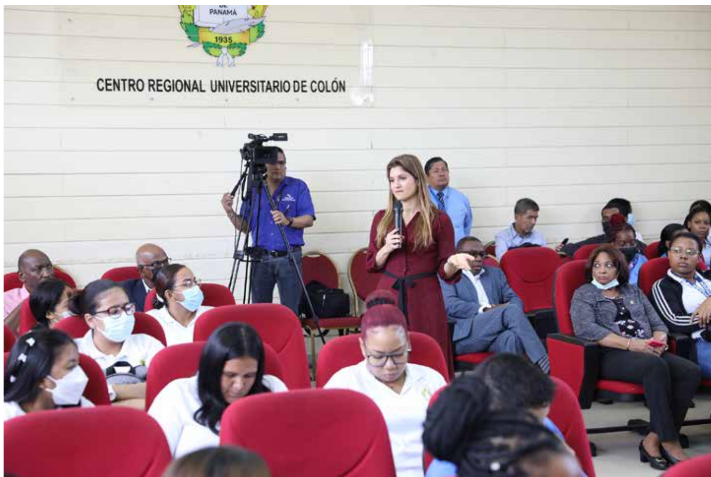
La canciller Erika Mouynes en Tribuna Abierta con estudiantes universitarios de la provincia de Colón.