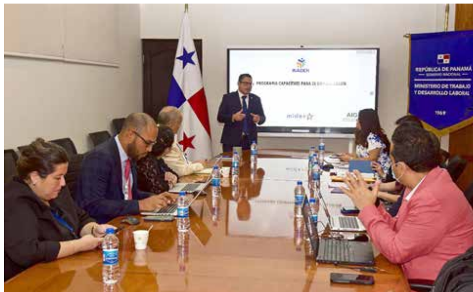
380 residentes de la provincia de Colón son capacitados actualmente.