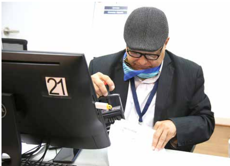
Los registros oficiales revelan crecimiento de la empleabilidad.

Cerca de 158 mil nuevos contratos de trabajo se han registrado en diversas actividades económicas en el Ministerio de Trabajo y Desarrollo Laboral (Mitradel), entre enero y agosto de 2022, dijo la titular de la cartera laboral, Doris Zapata Acevedo. “Esta cifra se da a razón de 21 mil contratos por mes, lo que indica un crecimiento de la actividad económica en el país con una proyección para que, en 2024, estemos como estuvimos en 2019”, señaló la ministra Zapata. Como parte del proceso de reactivación económica, la tasa de desempleo se ubica hoy en 9.9%. “Estamos evolucionando, registrando nuevos contratos y continuamos trabajando no solo en la disminución del desempleo, sino también en el otro reto importante, que es formalizar a los trabajadores por cuenta propia, para garantizarles que tengan acceso a la seguridad social”, precisó la ministra. Añadió que hay una gran oportunidad en el sector logístico y tecnológico, que se incrementan cuando se manejan otros idiomas que requieren sectores importantes de la economía en áreas especializadas como Panamá Pacífico, por lo que es necesario seguir capacitando a nuestro recurso humano. “Tenemos que diversificar las capacidades de nuestros jóvenes para garantizar que vayan a poder acceder a esos espacios en el mercado laboral”, acotó.