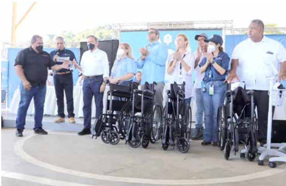
El Ministerio de Salud también entregó insumos y tuberías para el mejoramiento y rehabilitación de acueductos rurales en Panamá Oeste.

Un vehículo 4x4 con su respectivo juego de llantas adicionales, 5 sillas de ruedas, un electrocardiógrafo y esfigmomanómetros de base rodante por un valor de B/.36,579 son parte de los insumos entregados por el Ministerio de Salud (Minsa) en Veracruz, provincia de Panamá Oeste. Esta entrega se dio durante la Gira de Trabajo Comunitario (GTC) 112 en Veracruz, Arraiján en Panamá Oeste, donde el Minsa también entregó B/.1,806,482.54 en medicamentos, material médico-quirúrgico, de laboratorio, para salud bucal y de imagenología. El ministro Luis F. Sucre llevó, además, suministros para desinfección, insumos y tuberías para el mejoramiento y rehabilitación de acueductos rurales por una inversión de B/.12,453.17, con lo que se beneficiará a más de 1,500 habitantes. El acto tuvo lugar en presencia del presidente de la República, Laurentino Cortizo Cohen, y los insumos fueron recibidos por los doctores María Guadalupe Mayora, directora médica en Veracruz; Kevin Cedeño, director médico de la Región de Salud de Panamá Oeste; e Israel Cedeño, director de la Región Metropolitana de Salud.