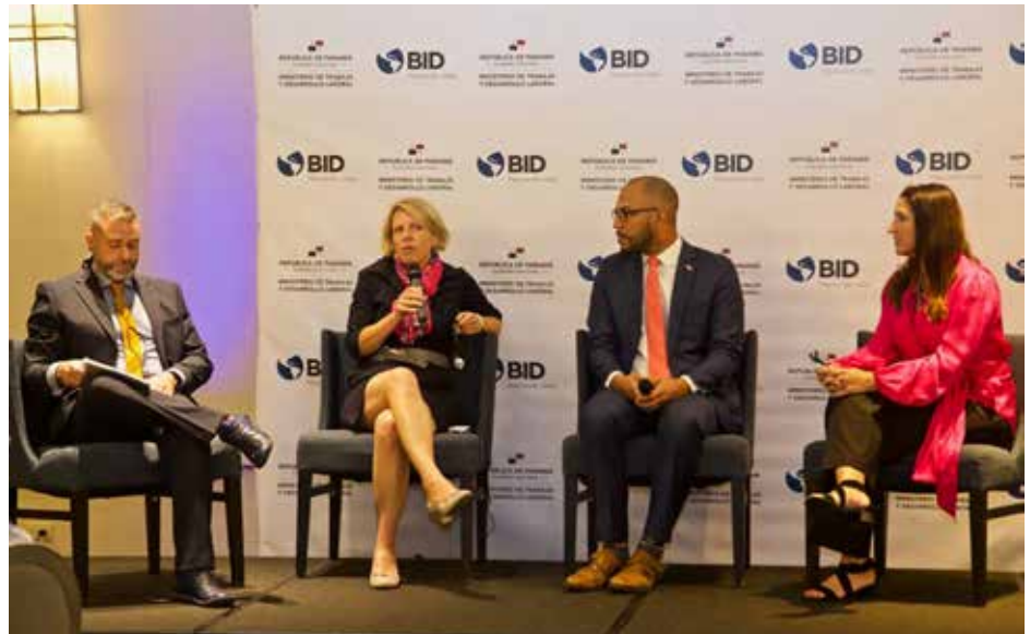
Se coordinan acciones para el fortalecimiento de servicios de empleabilidad.