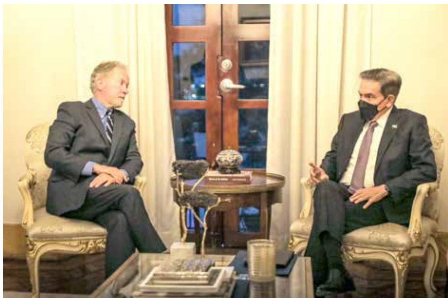
El presidente Laurentino Cortizo Cohen se reunió con el director ejecutivo del Programa Mundial de Alimentos de las Naciones Unidas, David Beasley.