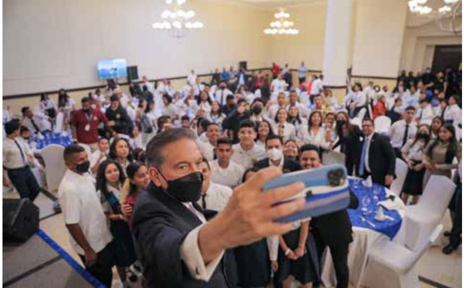
Cortizo Cohen asistió a un encuentro con los estudiantes que fueron electos diputados de la XV Asamblea Juvenil, un programa de la Oficina de Participación Ciudadana de la Asamblea Nacional.