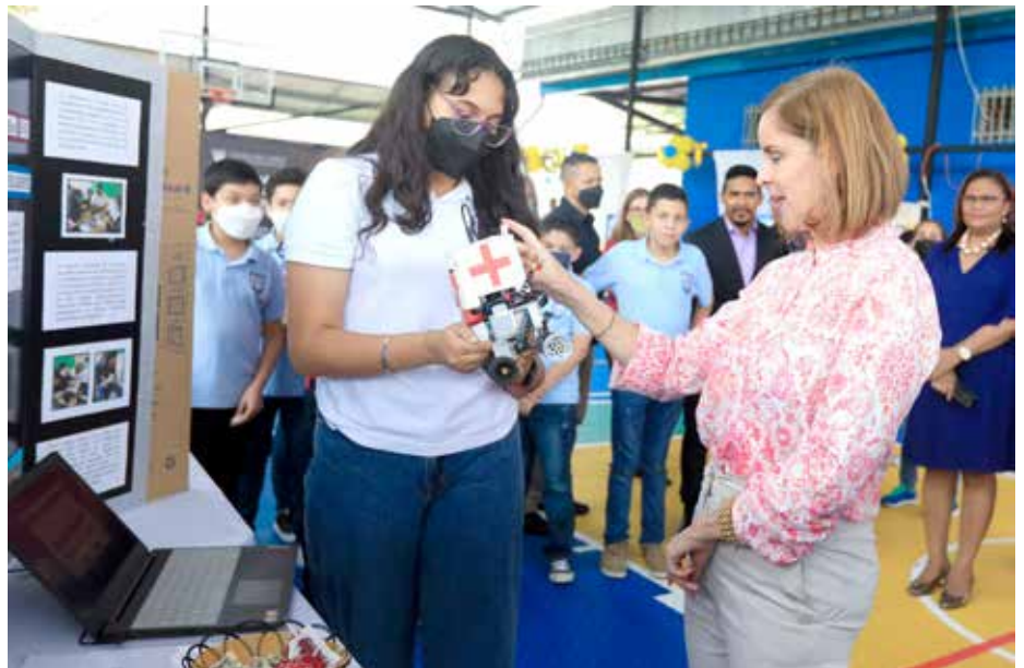
La quinta Olimpiada Regional de Robótica tuvo como sede el Colegio Bilingüe de Panamá; y la sexta, el Centro Educativo Bilingüe Visión del Saber, en Arraiján.