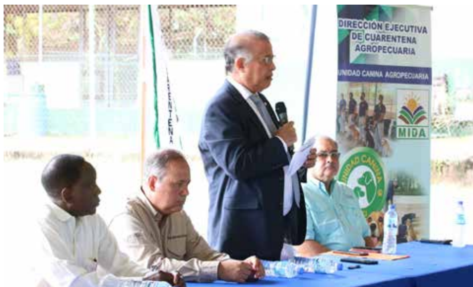
Los especialistas serán adiestrados en el Centro de Capacitación de Manejo Canino, para Centroamérica y el Caribe, ubicado en el Aeropuerto de Tocumen.

En la actividad se hizo una demostración de las destrezas de la perrita Mili, que forma parte de la Unidad Canina y realiza su trabajo detectando productos ilegales en la terminal aérea de Tocumen.