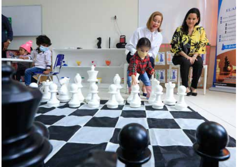
Los estudiantes del CAIPI demuestran sus conocimientos en el ajedrez.