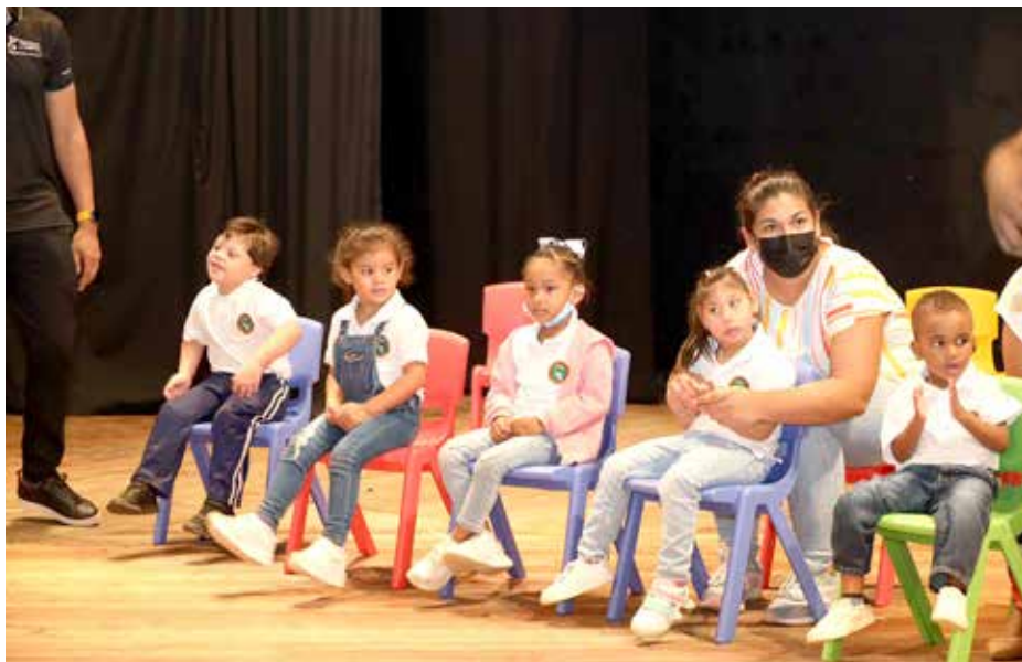
Los pequeños artistas estuvieron acompañados de sus padres.

Dos emotivos conciertos reunieron a niños de los programas de Educación Especial y de Estimulación Precoz que desarrollan proyectos con La Red.