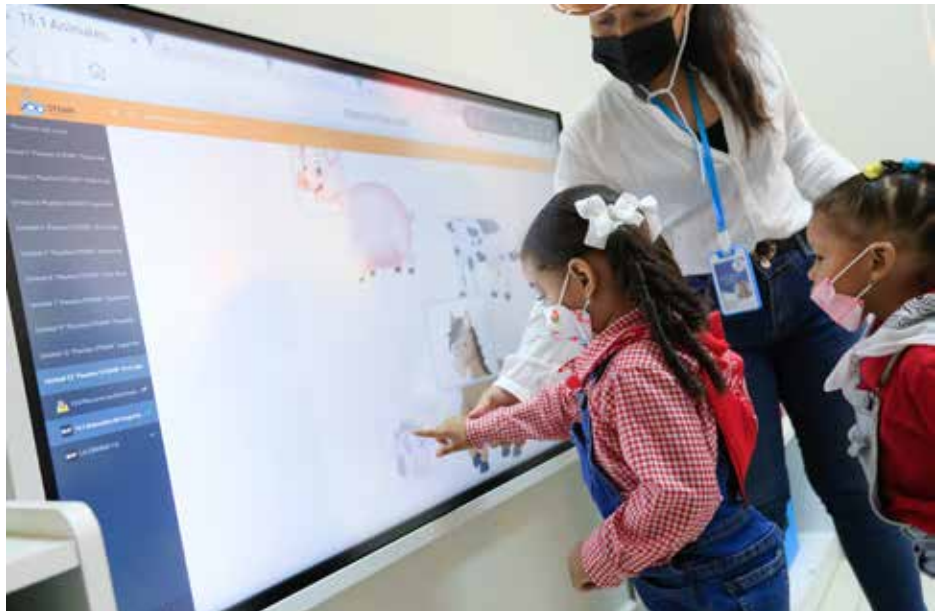
Las estrategias de enseñanza optimizan el análisis, toma de decisiones y la estimulación del desarrollo de las inteligencias múltiples.