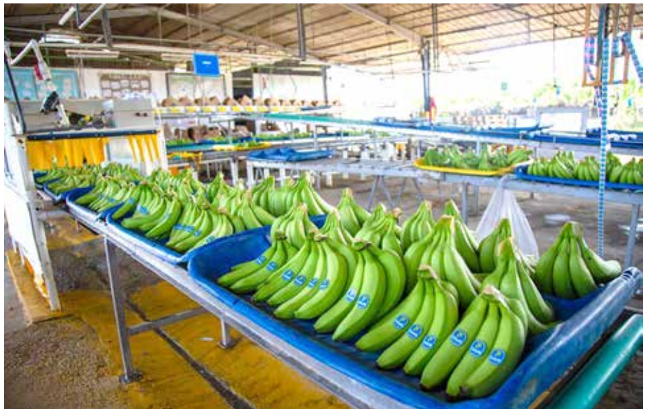
Se inspeccionaron las fincas bananeras 45, 87 y 89 en Changuinola.