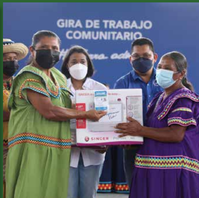
CERTIFICADOS PARA ARTESANOS