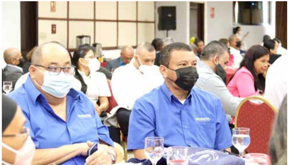
Asociados de diferentes regiones se dieron cita en este importante evento.

Es la primera vez que cooperativistas de todo el país se reúnen de forma presencial tras la declaratoria de la pandemia del Covid-19.