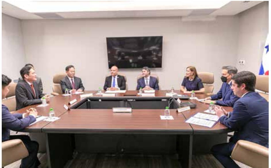
El presidente Laurentino Cortizo Cohen agradeció a los directivos del consorcio internacional la confianza depositada en el país a través de sus inversiones.

El presidente de la República, Laurentino Cortizo Cohen, en compañía de la primera dama de la República, Yazmín Colón de Cortizo, recibió el martes 13 de septiembre a directivos de Samsung, empresa patrocinadora de las Olimpiadas Mundiales de Robótica que se desarrollarán en Panamá el próximo año, y que contará con la participación de más de 5,000 visitantes, entre estudiantes, docentes y tutores de más de 90 países. Cortizo Cohen agradeció a los directivos por la confianza depositada en el país a través de sus inversiones y aprovechó la oportunidad para resaltar el apoyo como patrocinador en las próximas Olimpiadas de Robótica. “Me gustaría reiterar mi gratitud por el apoyo al proyecto nacional del Despacho de la Primera Dama en las Olimpiadas Mundiales de Robótica; todo lo que Samsung pueda hacer es bienvenido”, dijo el mandatario Cortizo Cohen. Durante la reunión también se resaltaron los beneficios que ofrece Panamá a través de la ley de servicios relacionados con manufactura para empresas multinacionales como Samsung, así como la posición geográfica del país. El ministro de Comercio e Industrias, Federico Alfaro, destacó que esta ley ofrece una excelente oportunidad para que Samsung expanda sus operaciones en nuestro país. Por su parte, Jae-Yong Lee, líder de Samsung Electronics a nivel global, se mostró complacido de las ventajas que ofrece Panamá en materia