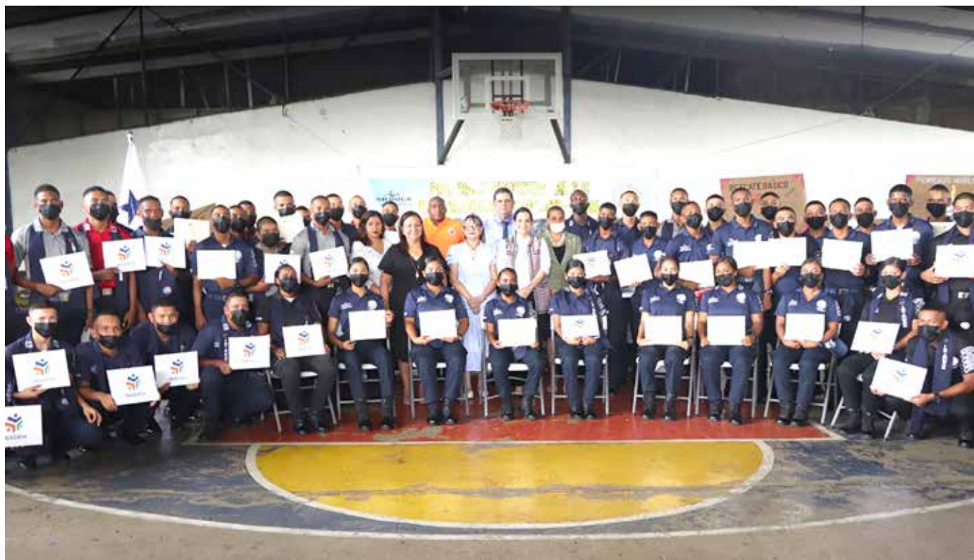
Actualmente más de 200 jóvenes del internado de Veracruz reciben sus clases de forma virtual.