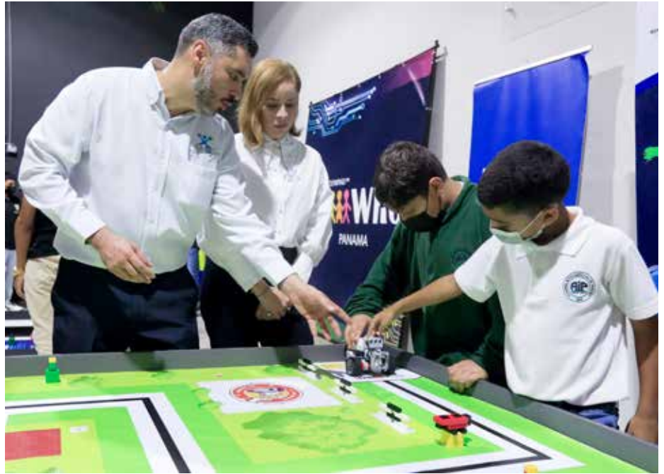
La primera dama visitó los planteles en los que se desarrollaron estas jornadas educativas.

La primera dama de la República, Yasmín Colón de Cortizo, realizó un recorrido en distintas sedes de las Olimpiadas Regionales de Robótica 2022, en las que participaron más de 50 equipos de escuelas oficiales y particulares, entre los 8 y 19 años. La quinta Olimpiada Regional de Robótica desarrollada a nivel nacional tomó sede en el Colegio Bilingüe de Panamá; y la sexta, en el Centro Educativo Bilingüe Visión del Saber, en Arraiján. Para la Región Educativa de Panamá Oeste, esta es una de las tres regionales organizadas en esta provincia, dada la cantidad de estudiantes que abarca. Las Olimpiadas Regionales de Robótica cuentan con ocho categorías enfocadas en aportar soluciones para la salud, medio ambiente, rescate, y apoyo en el hogar, todo a través del uso de robots. La World Robot Olympiad Association, por medio de su organizador nacional, Fundesteam, representado por su director, Marvin Castillo, concedió al Colegio Bilingüe de Panamá y al Centro Educativo Bilingüe Visión del Saber, el reconocimiento oficial como Sede Regional de la Olimpiada Mundial de Robotica (WRO) en Panamá. Durante estas regionales, los estudiantes trabajan por alcanzar la clasificación para ser parte de la Olimpiada Nacional de Robótica, por celebrarse del 5 al 7 de octubre del presente año, evento en que se seleccionará a los representantes de Panamá en la Olimpiada Mundial de Robótica 2022 (WRO 2022), que se llevará a cabo en noviembre en Dortmund, Alemania.