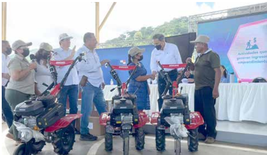
El equipo fue entregado en el sector de Veracruz, en Panamá Oeste, a familias de las Escuelas de Campo.

Estas máquinas beneficiarán a Escuelas de Campo - Huertas Agroecológicas Familias Unidas, en las comunidades de Cirí de los Sotos y Cirí Grande, incluidas en los corregimientos del Plan Colmena.