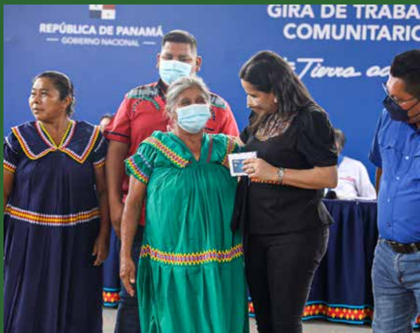
PROGRAMAS DE TRANSFERENCIAS MONETARIAS CONDICIONADAS