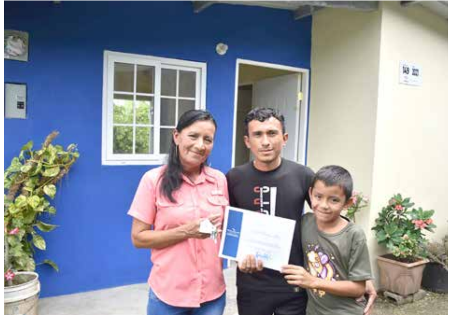
Las familias obtuvieron sus certificados y las llaves para ocupar su nuevo hogar de dos recámaras.

Según los expedientes sociales, se trata de personas de bajos ingresos económicos que viven en hacinamiento, agregadas o en condiciones complicadas.