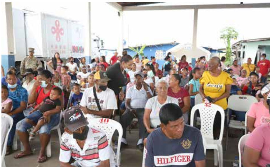
Se entregaron enseres y herramientas de trabajo a los moradores.