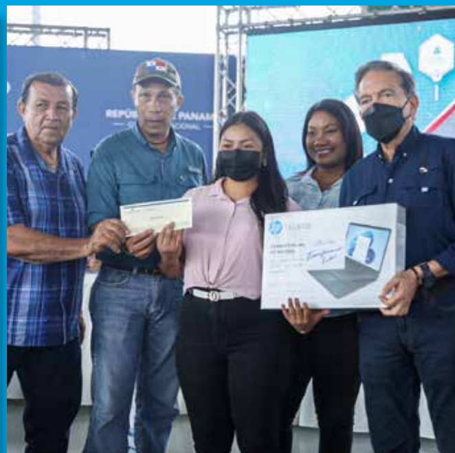
ENTREGA DE BECAS