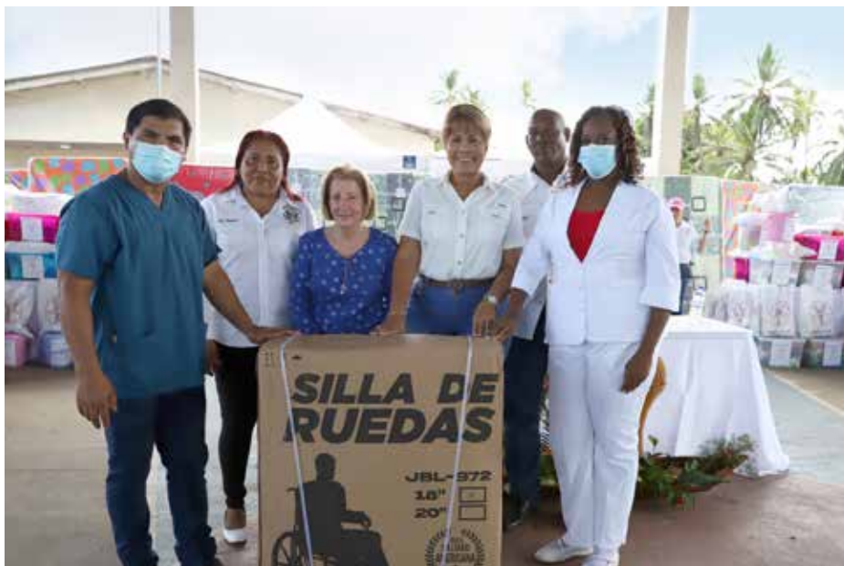
Se beneficiaron a más de 500 personas.

El Despacho de la Primera Dama liderado por Yazmín Colón de Cortizo realizó el pasado 27 y 28 de septiembre una gira de asistencia social y salud en el corregimiento de Gobeia, distrito de Donoso en la Provincia de Colón que benefició a más de 500 personas. A 21 familias se les entregó colchonetas, estufas, kit de aseo y limpieza, kits escolares, camarotes con colchón, mini refrigerador, pañales desechables, calzados entre otros artículos; Además se distribuyeron cinco sillas de ruedas, una al Centro de Salud de Miguel de la Borda; siete bastones, ocho tabletas para estudiantes y 160 bolsas de leche fortificada. Previo a esta importante gira, trabajadoras sociales de diversas instituciones y del Despacho de la Primera Dama visitaron casa por casa a los moradores de la comunidad para verificar cuáles eran sus necesidades más apremiantes. Los pobladores de Gobeia en su mayoría son pescadores artesanales, que se dedican a la agricultura de subsistencia y algunos al turismo. En materia de salud se brindaron los servicios de: medicina general, odontología, laboratorio, nutrición, enfermería (vacunas), peso y talla, toma de presión, farmacia; se realizó optometría con la entrega de lentes de lectura. Las unidades móviles "Salud sobre Ruedas" realizaron exámenes de electrocardiograma, mamografías y colocación de implantes anticonceptivos. Esta gira del Despacho de la Primera Dama tuvo el apoyo de diversas instituciones a nivel nacional y de la provincia.