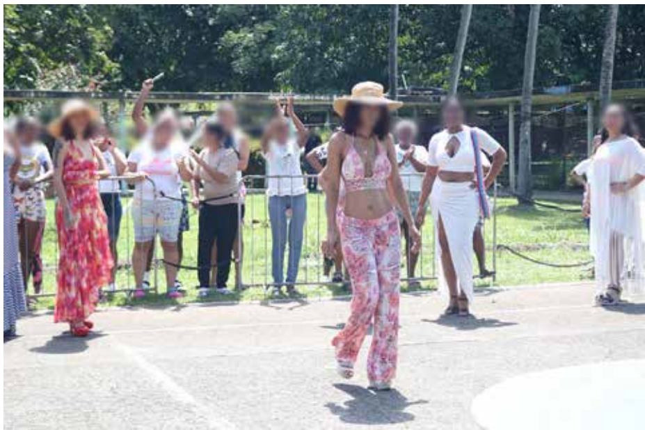
El desfile de moda se realizó en el patio central del Cefere.

La creatividad y talento de las internas del CEFERE quedó demostrado con la organización de este evento.