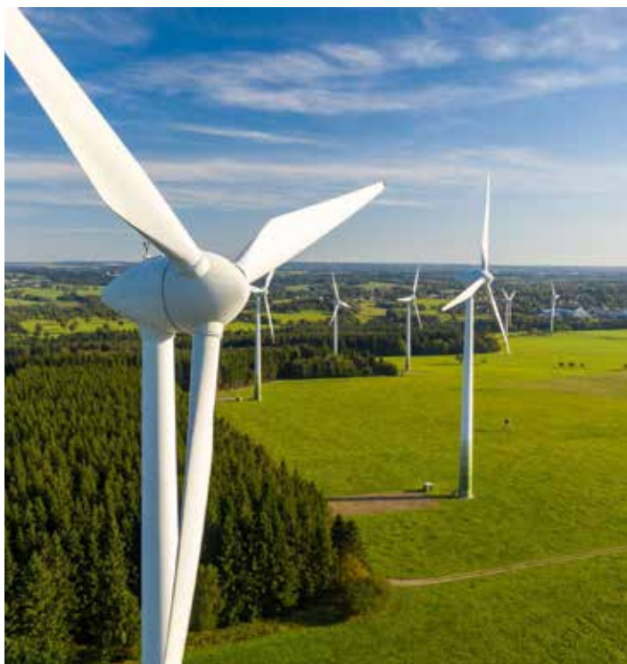
Parque Eólico Laudato Si, ubicado en Penonomé, provincia de Coclé.

estrategia específica para convertirse en un nodo o “hub de almacenamiento, comercialización, transformación” de hidrógeno verde que sea producido en la región latinoamericana, dijo Rivera.