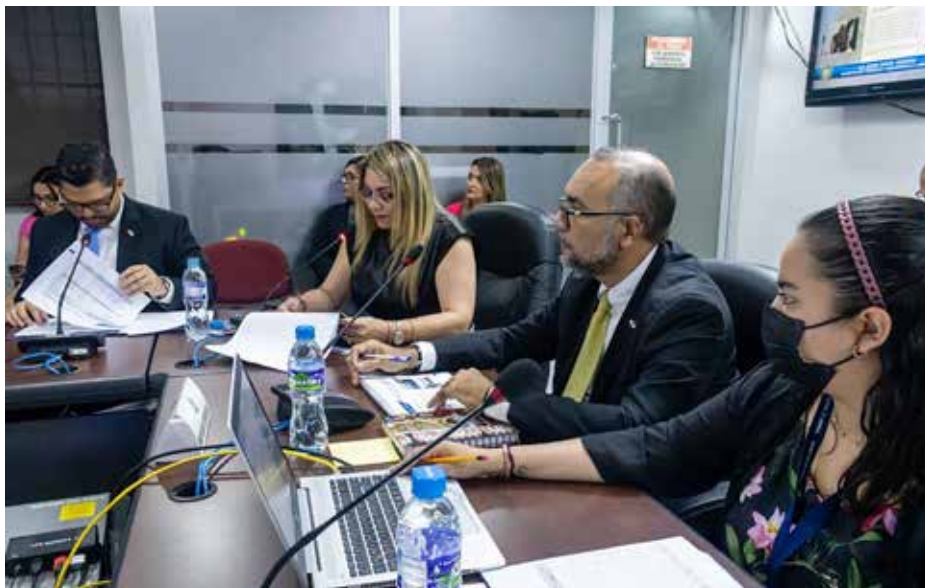
La ministra de Trabajo y Desarrollo Laboral, Doris Zapata, durante la presentación de la vista presupuestaria de esa entidad para la vigencia fiscal 2023.

El presupuesto recomendado del Mitradel para 2023 asciende a B/. 39,241.630 millones.