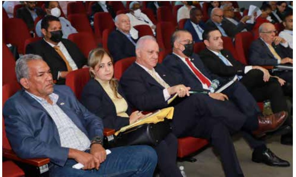
Los ministros Valderrama y Salcedo durante la aprobación en primer debate de este importante proyecto de Ley.

Con esta Ley se declara como prioridad del Estado la producción agropecuaria nacional como instrumento para asegurar el derecho humano a la alimentación adecuada de la población.