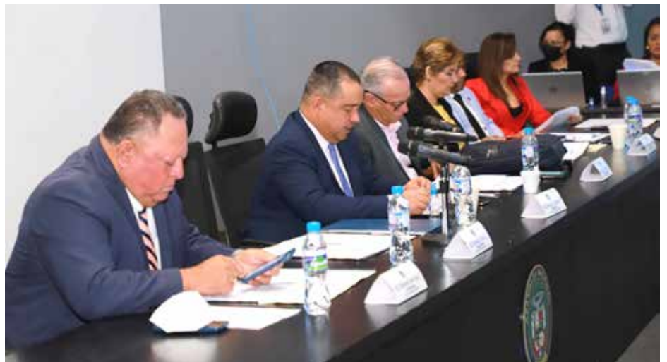
Comisión de Asuntos Agropecuarios de la Asamblea Nacional.

se espera que prontamente esta Ley sea aprobada en tercer debate y sancionada por el presidente Cortizo