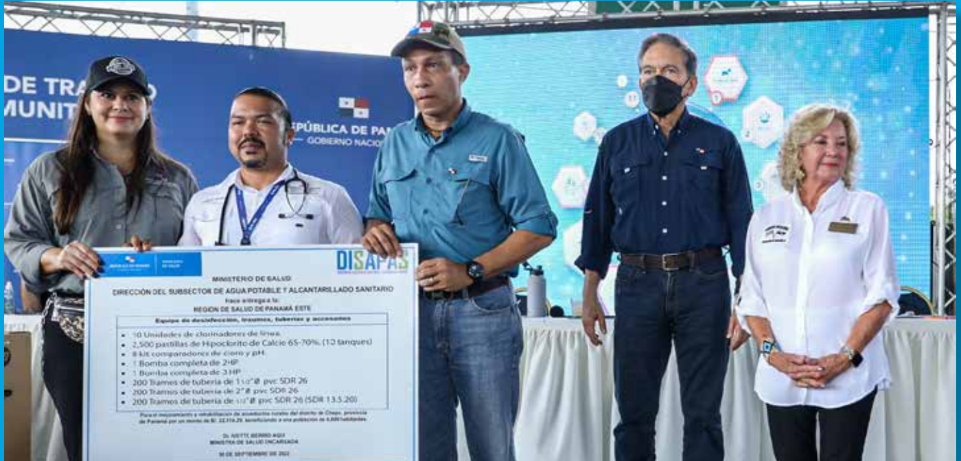
SUMINISTROS DE DESINFECCIÓN, MEDICAMENTOS Y EQUIPOS MÉDICOS