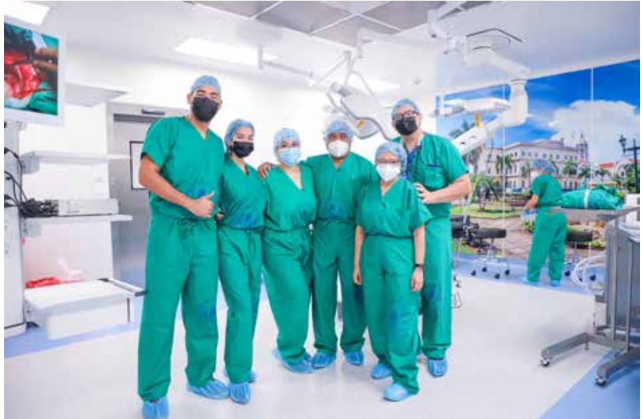
Los quirófanos están decorados con imágenes de locaciones turísticas de Panamá.

La Ciudad de la Salud aplica metodologías de diseño utilizadas en los hospitales del primer mundo para hacer más amigable la estancia hospitalaria.