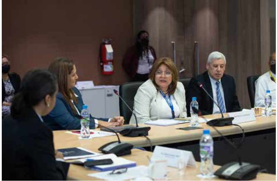
La ministra de Cultura, Giselle Gonzalez Villarrué lideró la reunión interinstitucional

El Gobierno Nacional, a través del liderazgo del Ministerio de Cultura (MiCultura) mantiene el compromiso de reforzar las estrategias para lograr la inscripción de la "Ruta Colonial Transístmica de Panamá" en la lista de Patrimonio Mundial de la Unesco según se dio a conocer en una reunión interinstitucional en la participaron representantes de diversas entidades. La Ruta Colonial Transístmica está formada por un conjunto de monumentos, que incluyen el sitio arqueológico de Panamá Viejo y distrito histórico (Patrimonio Mundial desde 1997), las fortificaciones de la costa caribeña: Portobelo y San Lorenzo (en la lista del Patrimonio en Peligro desde 2012), y los caminos coloniales que los unen: el Camino de Cruces y el Camino Real. Panamá ya cuenta con cinco sitios declarados Patrimonio Mundial por la Unesco: las fortificaciones Portobelo y San Lorenzo, el Parque Nacional de Coiba y su zona especial de protección marina, el Parque Nacional del Darién, las reservas de la Cordillera de Talamanca- La Amistad y el sitio arqueológico de Panamá Viejo y distrito histórico de Panamá. En la reunión participaron representantes del Ministerio de Ambiente, Autoridad del Canal de Panamá, Autoridad de Turismo, Municipio de Panamá, Municipio de Colón, Patronato de Panamá