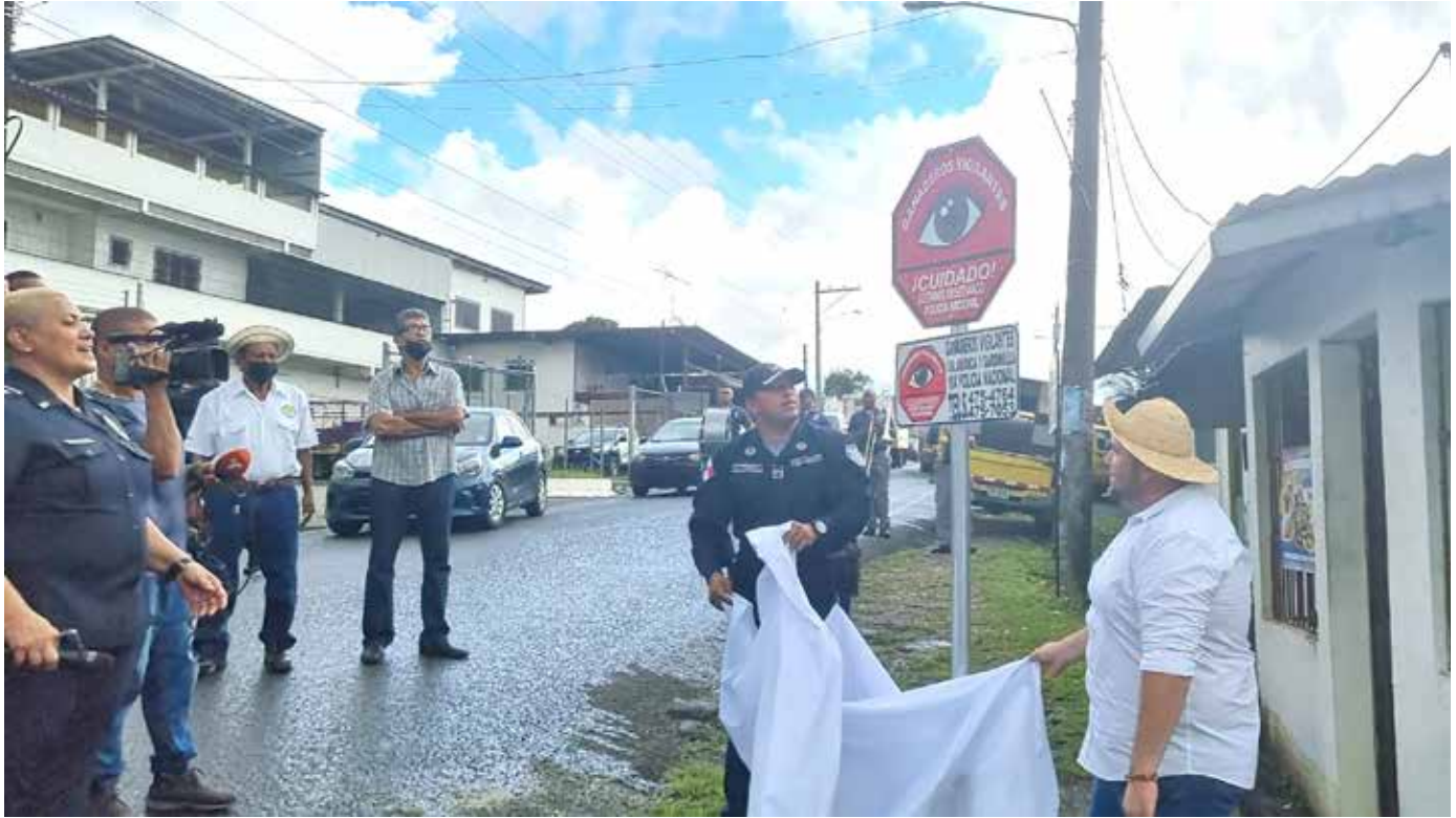
A la fecha se han recuperado 691 reses hurtadas.