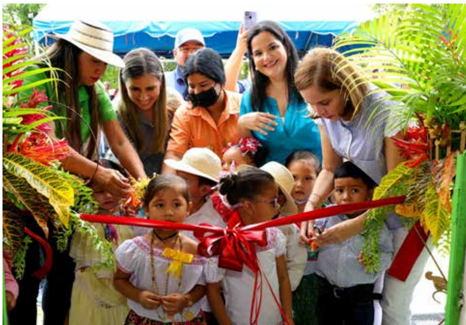
El Mides reinauguró el CAIPI de La Raya en Veraguas, con más de 40 años de no recibir mantenimiento.

Estos centros brindan atención integral a la primera infancia por medio de una Cartera Integral de Servicios (CIS), entre los que destacan; educación, salud, y nutrición.