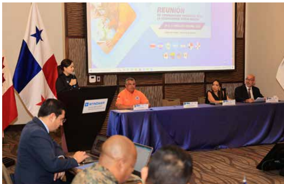
Inauguración de reunión preparatoria del III Simulacro Regional de Desastre y Asistencia Humanitaria 2023.

En la coordinación participaron Estados Unidos, El Salvador, México, Colombia, Canadá, Honduras, Nicaragua, Guatemala, República Dominicana, Costa Rica y Panamá.