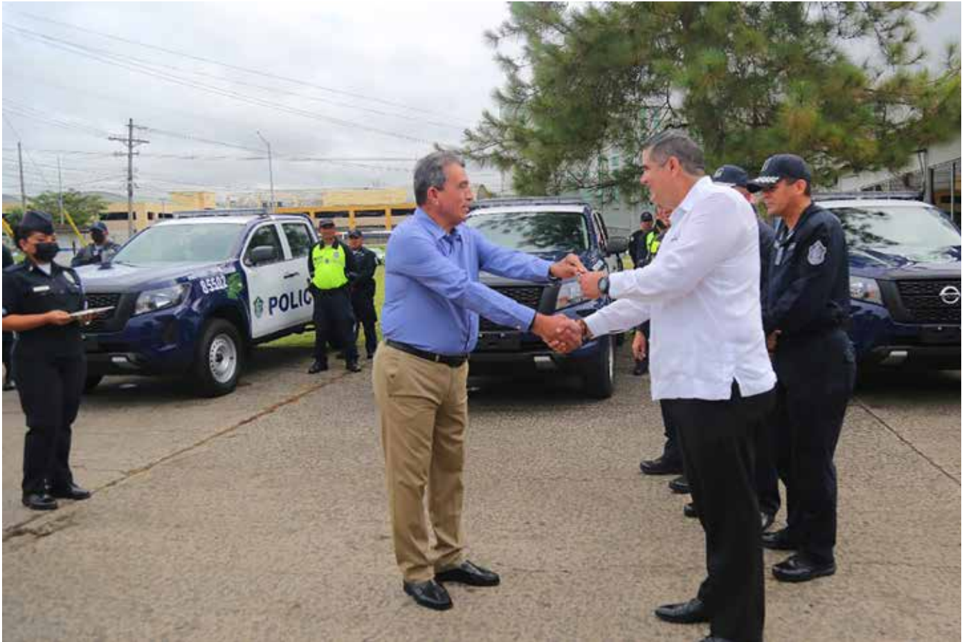
La Policía Nacional recibió equipos rodantes para reforzar las 24 horas al día la seguridad en estas transitadas vías.

fortalecerán las capacidades para el rápido desplazamiento de las unidades policiales, ante cualquier situación que enfrenten panameños y extranjeros que utilizan estas transitadas vías, que son monitoreadas 24/7, por un robusto y moderno sistema de videovigilancia del Centro de Operación Nacional (CON).