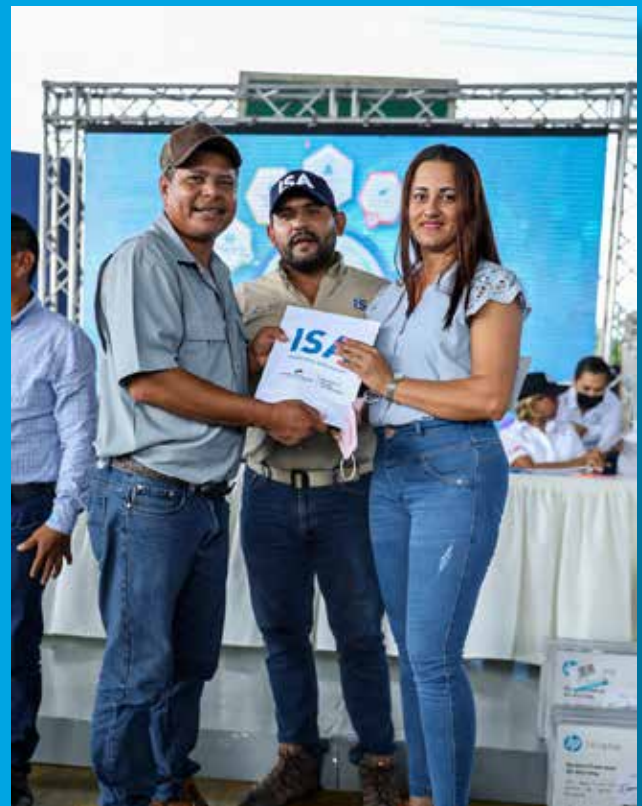
PAGO DE INDEMNIZACIONES