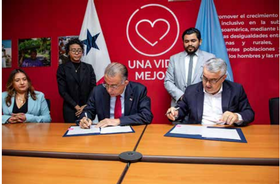
El ministro Augusto Valderrama y el representante de FAO, Adoniram Sanches, durante la firma del acuerdo.

Para contribuir a que las instituciones públicas del agro panameño adopten e implementen mecanismos de innovación digital, el ministro de Desarrollo Agropecuario, Augusto Valderrama, y el coordinador de la Organización de las Naciones Unidas para la Alimentación y la Agricultura (FAO), Adoniram Sanches, firmaron el proyecto denominado “Crisis alimentaria y digitalización de la agricultura: modernización del MIDA en Panamá”. Esta iniciativa, prevista a implementarse en los próximos 17 meses, busca modernizar y digitalizar los servicios del MIDA, y otras entidades del sector agropecuario, contribuyendo así a afianzar la efectividad de los mecanismos de recuperación económica y resiliencia del sector agroalimentario, en el contexto post pandemia y de inflación. Valderrama agradeció el apoyo que brinda la FAO en el proceso de digitalización y modernización de todas las actividades que desarrolla el sector agropecuario panameño. Además, destacó que la firma de este proyecto, da camino a la creación de la Dirección de Tecnología y Digitalización del MIDA, que suministrará la información necesaria para beneficio de todos los sectores. Sanches dijo que esta