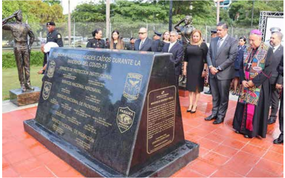
Como símbolo de respeto hay cinco esculturas en posición de saludo, que representan los cinco estamentos de seguridad del país.

Un monumento en honor a las unidades de la Fuerza Pública, que perdieron la vida en el cumplimiento del deber, a causa de la pandemia del covid-19, fue develado en la sede central del Ministerio de Seguridad Pública (Minseg), ubicado en Amador, en el corregimiento de Ancón. El monumento, ubicado en la plazoleta central frente a la entrada principal del Minseg, es una obra llena de simbolismo patriótico, compuesta por un monolito revestido de granito, en el que se encuentran grabados los logos de los estamentos de seguridad del país, y los nombres de los hombres y mujeres que fallecieron por la mortal enfermedad. El acto solemne se hizo en presencia de los familiares de las víctimas de la Fuerza Pública y fue presidido por el ministro de Seguridad Pública, Juan Manuel Pino quien estuvo acompañado del ministro de Salud, Luis Francisco Sucre, de la ministra Consejera, Eyra Ruíz, del Director de la CSS, Enrique Lao Cortés, de los directores de los estamentos de seguridad y de monseñor José Domingo Ulloa, quien estuvo a cargo de la invocación religiosa. Tras señalar que era