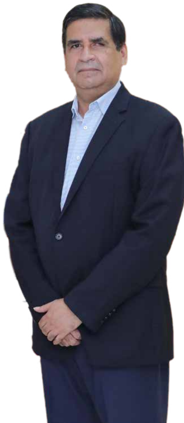
JUAN CARLOS ALCEDO VELARDE, director general del Instituto Oncológico Nacional (IÓN)