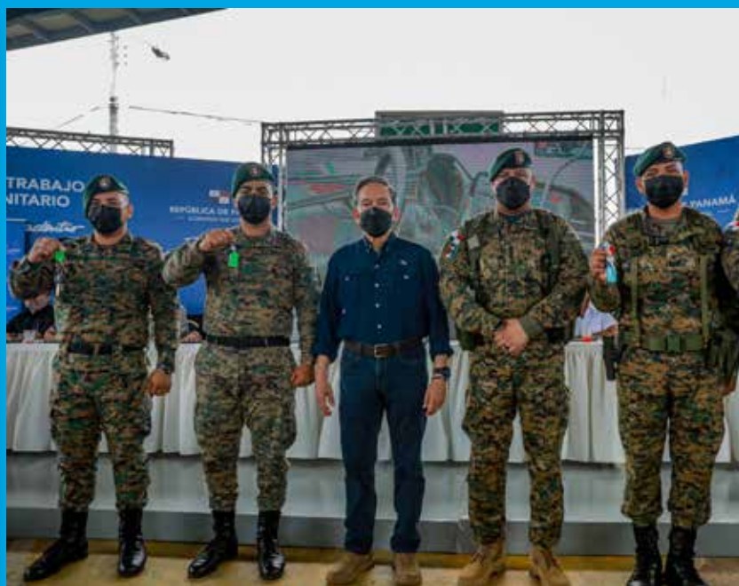
VEHÍCULOS POLICIALES AL SENAFRONT