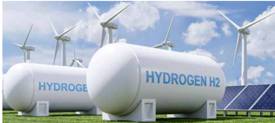
Centro de almacenamiento de hidrógeno.

El país ocupa la posición 8° en generación verde.