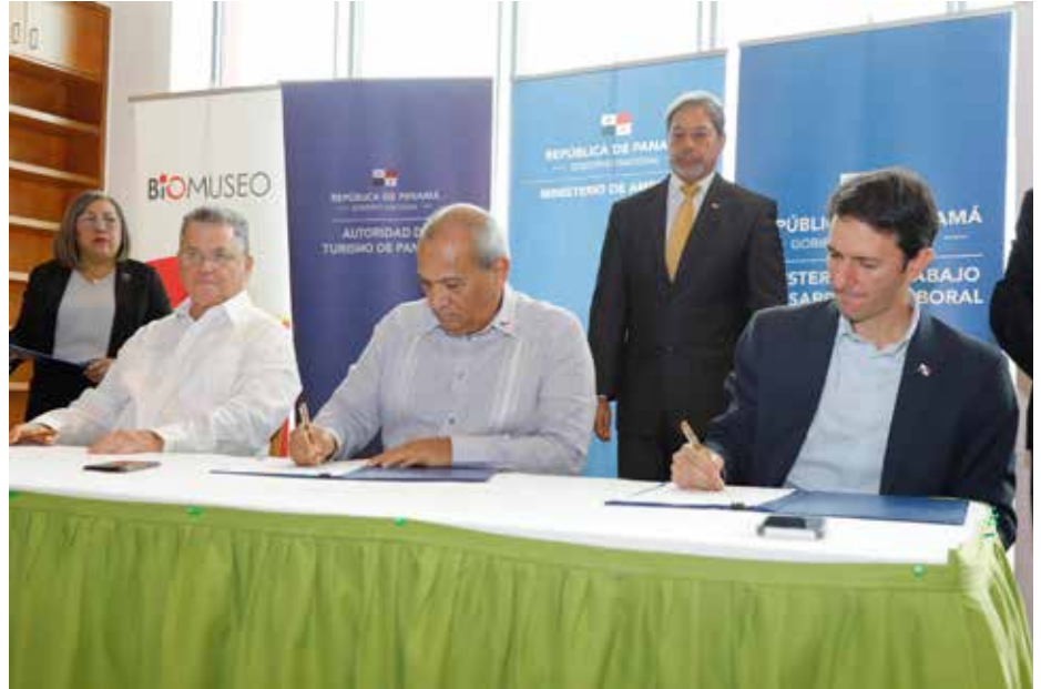
Esta iniciativa de cooperación impulsará programas, planes, proyectos y actividades conjuntas en temas relacionados con desarrollo turístico.

El Ministerio de Ambiente (MiAMBIENTE) y la Cámara Nacional del Turismo (CAMTUR) firmaron un convenio para promover el ecoturismo en áreas protegidas y brindar capacidades a visitantes que recuperen los valores de la naturaleza en las provincias del país. En este acuerdo se procura desarrollar acciones y actividades conjuntas encaminadas a fortalecer el trabajo que se realiza en lo relativo a la promoción y desarrollo de mecanismos de participación, establecer alianzas estratégicas e impulsar el ecoturismo en las áreas protegidas de Panamá, agruparse los diferentes sectores o gremios de la actividad turística integrándolos en el logro de las metas comunes. El ministro Milciades Concepción ponderó las capacidades turísticas y ambientales del país y dijo que tenemos que empoderar a las comunidades y operadoras turísticas en las tareas relacionadas con la naturaleza. Tenemos el 33 % de áreas protegidas y están allí como en vitrinas. Este convenio fue firmado por el ministro de Ambiente, Milciades Concepción y Ovidio Díaz, presidente de CAMTUR en un acto que tuvo lugar en el Biomuseo, situado en la calzada de Amador este jueves. Asistió como testigo el ministro de Turismo, Iván Skildsen y estuvo presente la ministra de Trabajo y Desarrollo Laboral, Doris Zapata.