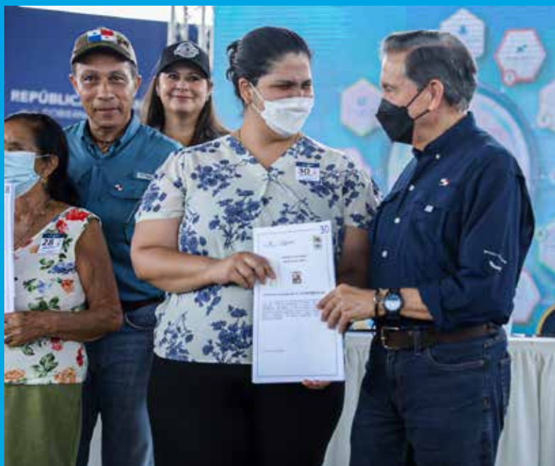
TÍTULOS DE PROPIEDAD