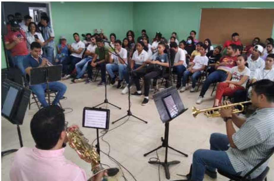
Integrantes de Panama Brass Ensemble con jóvenes de la banda de música del colegio Moisés Castillo Ocaña.

Cerca de 150 jóvenes integrantes de las bandas de música de los colegios Moisés Castillo Ocaña de La Chorrera, Gabriela Mistral en Arraiján y el Colegio Bilingüe de Cerro Viento en Panamá Centro, fueron beneficiados con los talleres y conciertos didácticos que forman parte de la programación contemplada para la segunda versión del Festival de Grupo de Cámara que se desarrolla entre el 14 y el 30 de octubre, organizado por el Ministerio de Cultura (MiCultura). Los cursos formativos iniciaron el sábado 15 de octubre con la participación de los cuartetos Panama Brass Ensemble, Cerrud y Okama, quienes estuvieron en cada uno de los colegios favorecidos con estas actividades para intercambiar parte de sus experiencias y conocimientos con los jóvenes músicos y los directores de cada una de estas bandas musicales. El Festival de Grupo de Cámara 2022, promete ser no solo un encuentro para adentrarse a la dinámica de las agrupaciones que resaltan la música clásica a través de sus formaciones en dúos, tríos, cuartetos, quintetos, y demás, sino que es una manera de contribuir y motivar a la nueva generación de músicos para que puedan diseñar diversas formas de transmitir y desarrollar sus talentos musicales. Uno de los objetivos de estas actividades