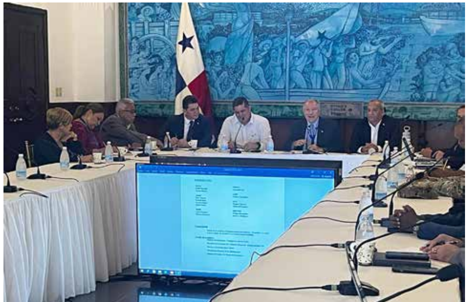
Panamá viene cumpliendo con los compromisos adquiridos de cara a la auditoría de la Unión Europea.

tecnología de punta y contratación de recurso humano para la vigilancia de las naves de pesca y apoyo a la misma, así como mesas de trabajo