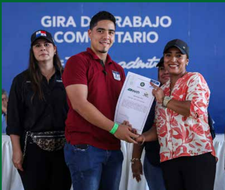
TÍTULOS DE PROPIEDAD