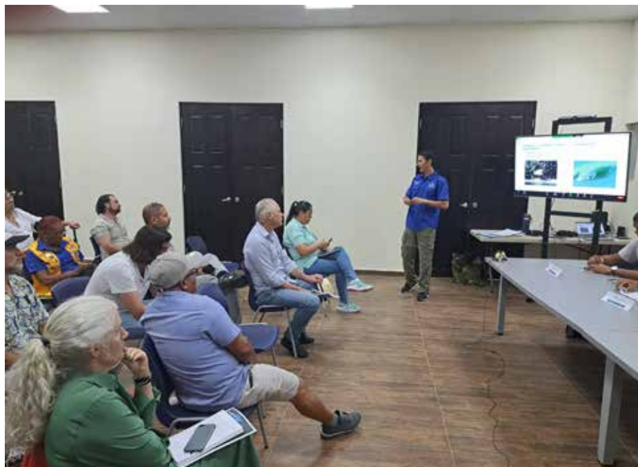
Se dará seguimiento a la ejecución de los proyectos, programas y estrategias del Plan Maestro de Turismo Sostenible (PMTS 2020-2025).

Bocas del Toro es refugio insular de naturaleza salvaje, crisol de cultura afrocaribeña e indígena y además un paraíso para la investigación marina.