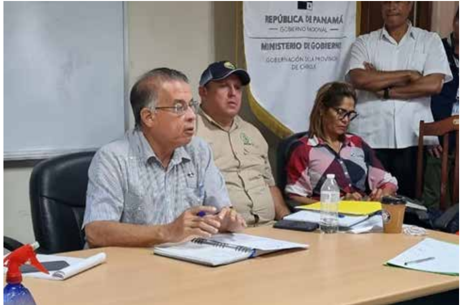
El gobernador de la provincia de Chiriquí, Juan Carlos Muñoz Franceschi, acompañó en la reunión al ministro Valderrama.

Por instrucciones del presidente de la República, Laurentino Cortizo Cohen, se llevó a cabo la gira de trabajo a fin de cumplir los compromisos adquiridos relacionados al contrato de Banapiña.