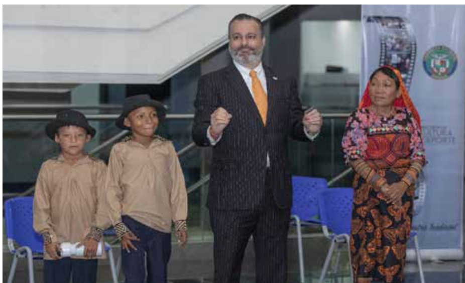
Gabriel González, viceministro de Cultura, respaldó las actividades realizadas para destacar la importancia de la inclusión de la población con discapacidad auditiva.

unidades administrativas desarrollan diversas acciones para promover la participación de las personas con discapacidad en las diversas disciplinas de la cultura.