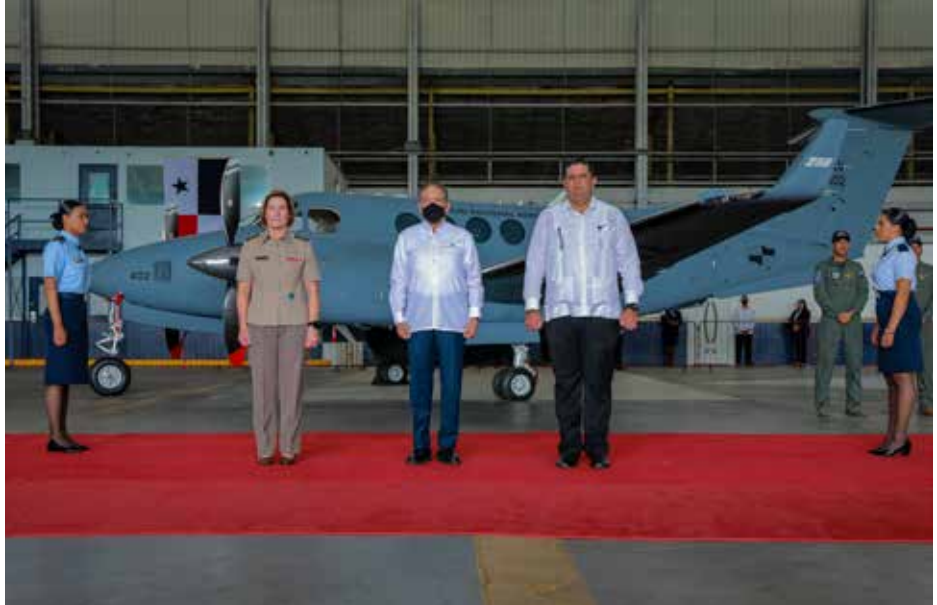
El presidente Laurentino Cortizo Cohen tomó parte de la sexta reunión del Diálogo de Seguridad de Alto Nivel con la general Laura J. Richardson, comandante del Comando Sur de los Estados Unidos.

El presidente de la República Laurentino Cortizo Cohen participó el 17 de octubre en la sexta reunión del Diálogo de Seguridad de Alto Nivel (DSAN) entre Panamá y EE.UU. con la general Laura J. Richardson, comandante del Comando Sur de los Estados Unidos, que aprovechó la ocasión para entregar en donación al Gobierno Nacional, la aeronave Beechcraft King Air 250 de patrullaje marítimo valorada en más de B/. 12 millones. La reunión bilateral se llevó a cabo en las instalaciones de la base aérea Teniente Octavio Rodríguez Garrido del Servicio Nacional Aeronaval (SENAN) en Howard, en la que también participaron la canciller de Panamá, Janaina Tewaney, y el ministro de Seguridad, Juan Manuel Pino. El encuentro busca concretar las iniciativas que ambos países han desarrollado en temas de migración irregular, la importancia de una ley de extinción de dominio, prevención del blanqueo de capitales, la pesca ilegal, la lucha contra el narcotráfico y el crimen organizado. Los cuatro pilares de la sexta reunión del Diálogo de Seguridad de Alto Nivel (DSAN) son: seguridad fronteriza, seguridad ciudadana, seguridad marítima y ciberseguridad. Como parte de la cooperación en seguridad, el Gobierno Nacional recibió en donación por parte de los Estados Unidos, la aeronave Beechcraft King Air 250 que será utilizada por los estamentos de seguridad para reforzar