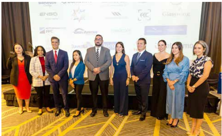
Resaltan labor de empresa Nestlé, que forma parte del programa Aprender Haciendo, que permite a jóvenes realizar pasantías laborales.