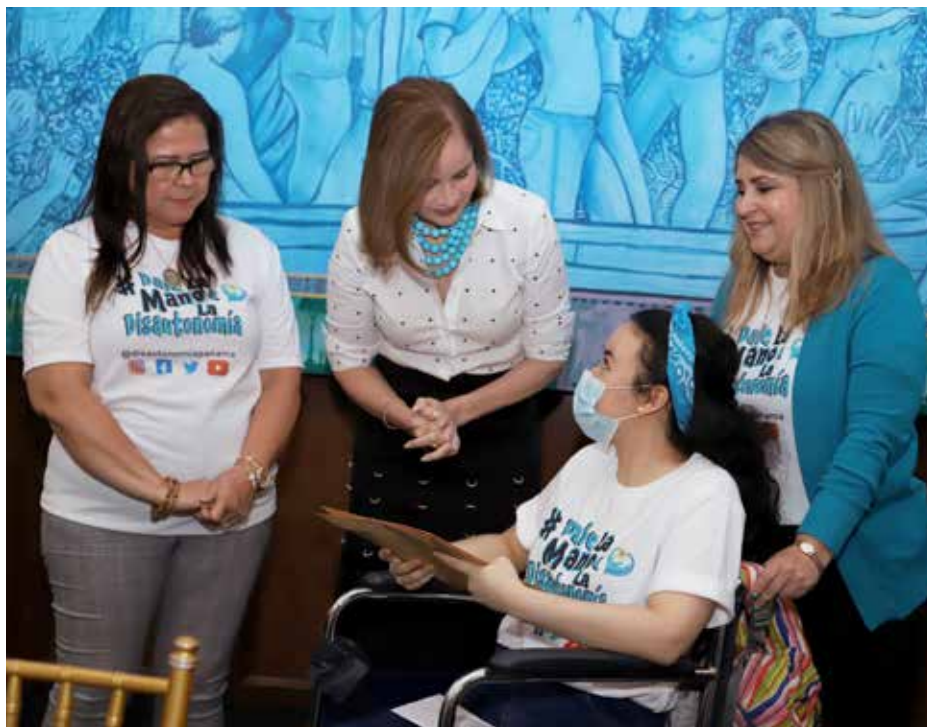
La Fundación Disautonomía Panamá aboga por visibilizar esta condición y mejorar la calidad de vida de las personas.