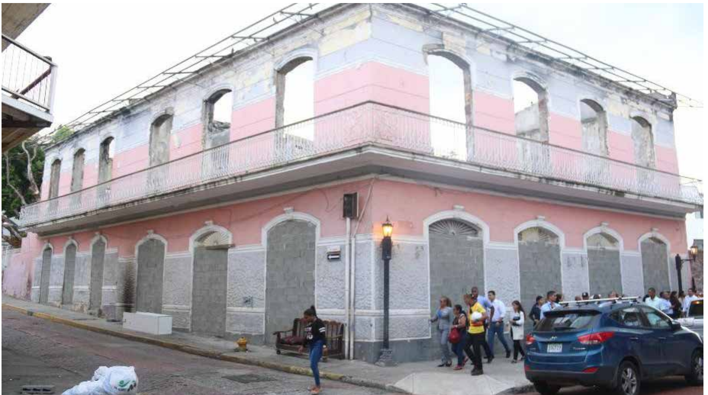
Los equipos técnicos interinstitucionales levantan los informes de los inmuebles, fincas y propietarios a fin de avanzar en esta labor.