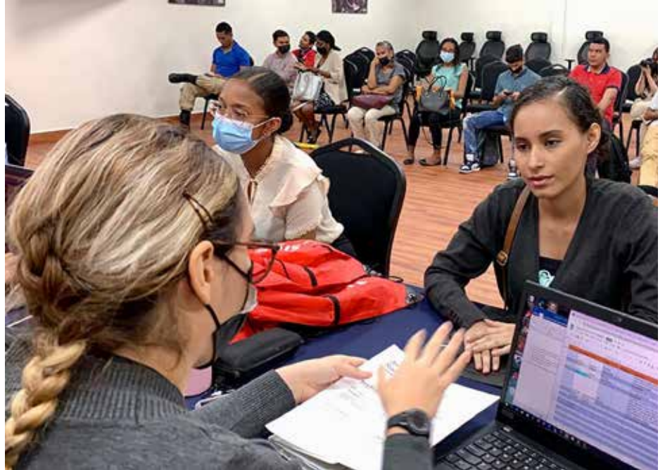
Más de 300 personas participaron de manera presencial y virtual en la convocatoria.