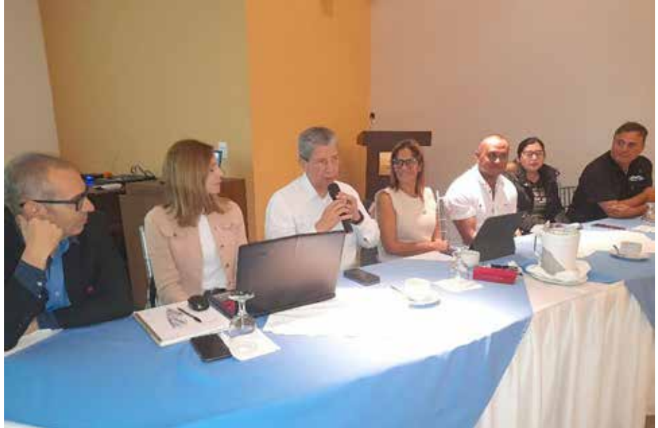
El Plan de Ordenamiento Territorial es el documento más importante para el desarrollo planificado del distrito.

Los seis municipios turísticos en los que se trabaja para la elaboración de estos programas son: Pedasí, Soná, Taboga, Bocas del Toro, Boquete y Tierras Altas.