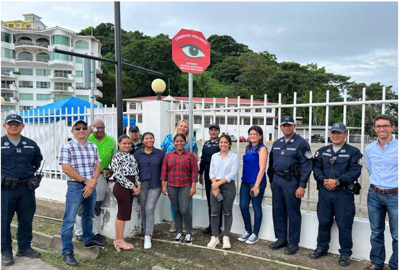
El Parque Logístico conformado por agencias navieras y otros negocios relacionados con la industria marítima, también se sumará a este programa.

directo con la Policía Nacional a fin de prevenir el delito, agregó Machazek. Finalmente se firmó un acta con el fin de conformar una alianza entre la Policía Nacional y el Parque Logístico Marino de Isla Perico, con el fin de disminuir los delitos que afectan la seguridad ciudadana y así de esta manera beneficiar a la población de usuarios de este sector comercial.