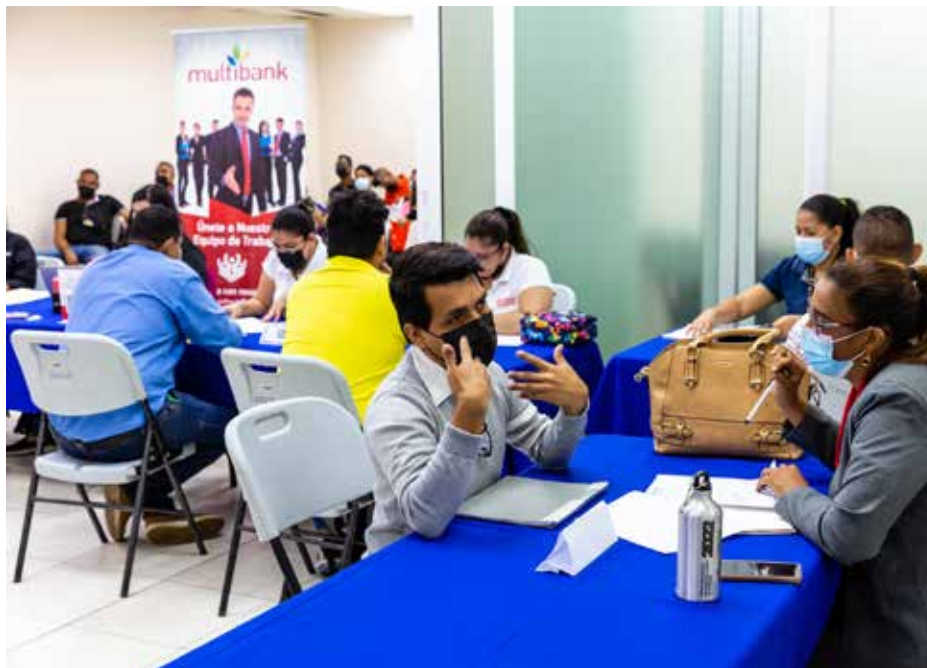
Ocho empresas ofertaron vacantes en reclutamiento focalizado.

A la fecha se han desarrollado 13 reclutamientos en los que se ha logrado insertar al mercado laboral a 300 personas con algún tipo de discapacidad.