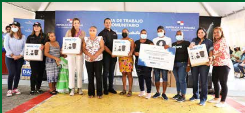
CON UNA INVERSIÓN DE B/.40,044.99, SE ENTREGARON ENSERES A RESIDENTES DEL LUGAR.