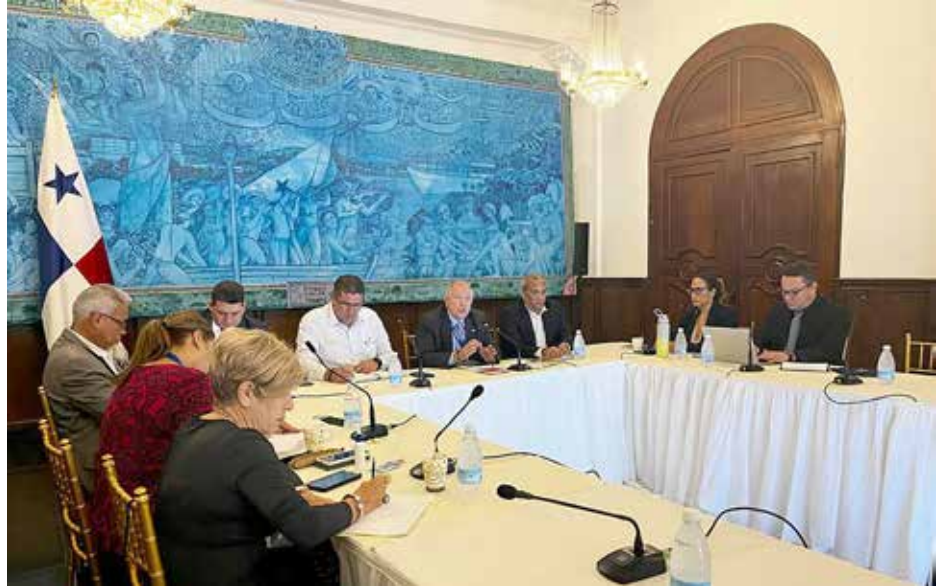
El Palacio Presidencial fue el escenario de este encuentro que busca mantener una lucha frontal contra la pesca ilegal.