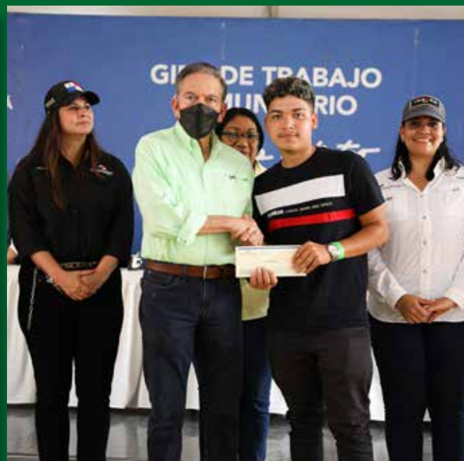
BECAS Y LAPTOPS