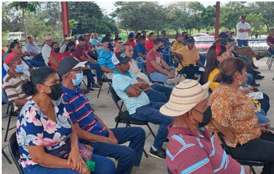
Cebolleros de la provincia de Coclé.

La entrega de cheques benefició a 148 productores de la Asociación Coclesana de Cebolleros (ACOCEB) y la Asociación de productores de Cebollas y otros rubros de Panamá (APROCYRPA).