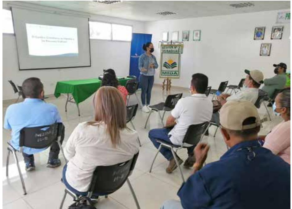
La iniciativa preservará y asegurará el uso sostenible de los recursos hídricos.

El Ministerio de Ambiente (MiAMBIENTE), a través de la Dirección de Cambio Climático, inició la cuantificación de la huella hídrica de cinco municipios pilotos localizados en Coclé, Chiriquí, Panamá Oeste, Veraguas y Herrera, siendo Océ el municipio modelo. Reduce tu Huella Municipal-Hídrico, impulsado por el MiAMBIENTE, busca cuantificar y reportar la huella hídrica generada dentro de los límites de un municipio, bajo un marco sólido y transparente, para posterior desarrollo de medidas de reducción de la huella hídrica como mecanismo de adaptación. Así mismo, se busca involucrar a las autoridades en el cálculo y gestión de la huella hídrica a nivel municipal, para trabajar en la inclusión de las recomendaciones producidas a corto, mediano y largo plazo, dependiendo de los escenarios que se vayan encontrando, de tal forma que se generen capacidades en los municipios y se logren replicar año tras año. El programa Reduce tu Huella Municipal-Hídrico es recurrente por lo que continuará expandiéndose en próximos años con la inclusión de más