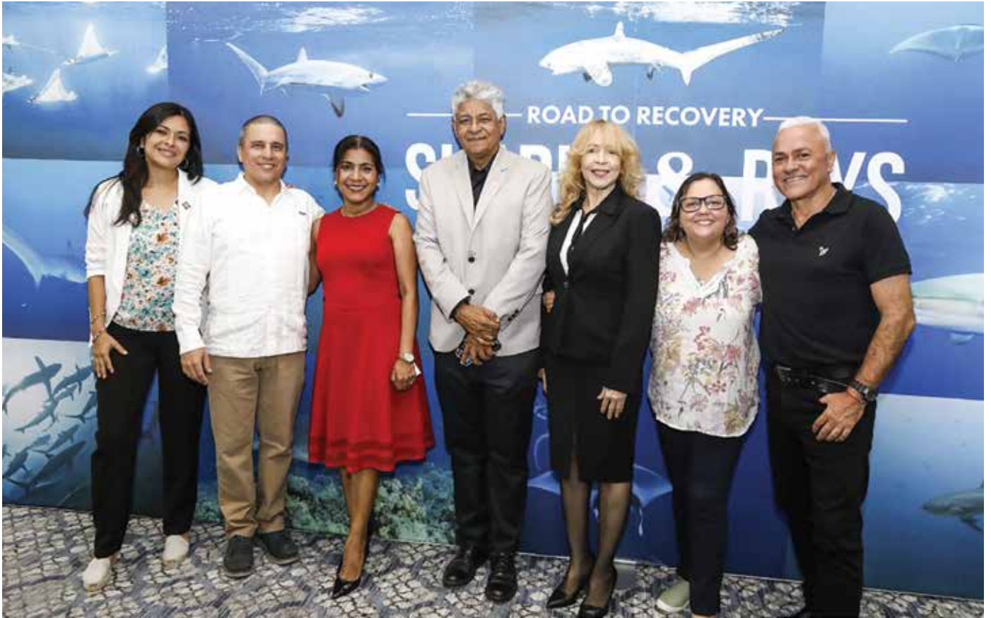
Panamá propuso incluir 19 especies de tiburones carcharinidos en la lista de especies protegidas debido a que se encuentran en peligro de extinción.