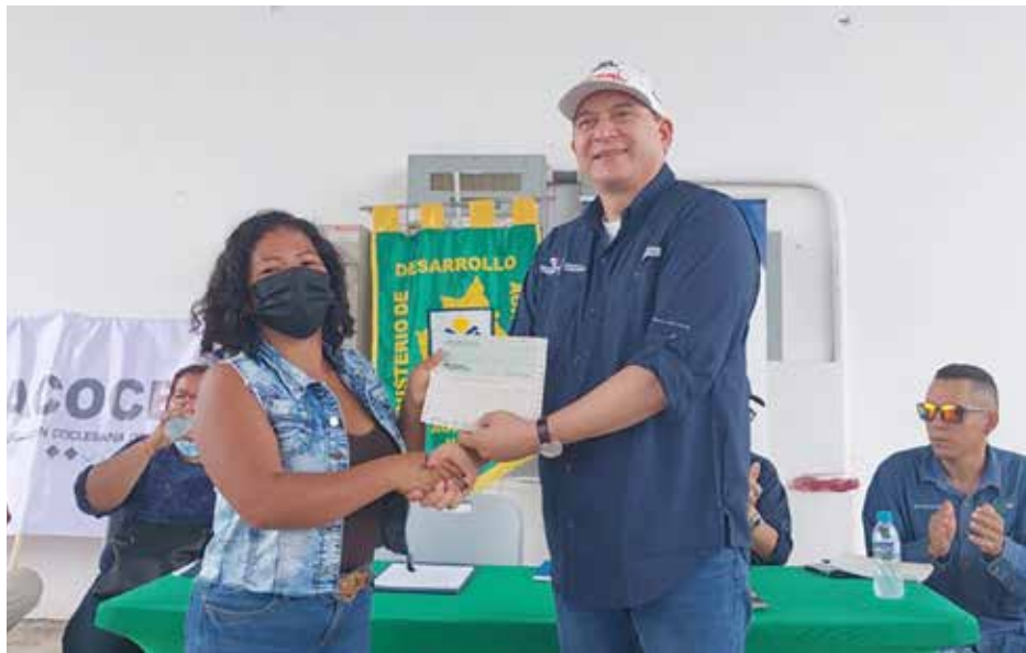
El ministro encargado, Alexis Pineda durante la entrega de cheques a cebolleros.

El ministro encargado de Desarrollo Agropecuario, Alexis Pineda, resaltó el trabajo y dedicación de los productores de cebolla de Coclé, en un acto en que se les hizo entrega de B/.1,103,335.20 en pagos por la compra de 26,270.60 quintales de este rubro, por parte del Gobierno Nacional. Esta actividad se desarrolló en las instalaciones de la Planta de Secado de Cebollas del MIDA en Coclé y contó con la participación del director del Instituto de Mercadeo Agropecuario (IMA), Carlo Rognoni; autoridades del sector agropecuario y productores de cebolla. A la ACOCEB se le hizo entrega un cheque por B/.539,447.40, por la compra de 12,844.70 quintales de cebollas, beneficiando a 84 productores; mientras que a Aprocyrpa, se le hizo entrega de un cheque por B/.563,887.80 como pago de 13,425.90 quintales de cebollas adquiridos por el Gobierno Nacional, beneficiando a 64 productores. Pineda les agradeció a los productores, en nombre del presidente de la República, Laurentino Cortizo Cohen, y del ministro Augusto Valderrama, por mantenerse produciendo comida para el pueblo panameño, pese a la pandemia y al alza de combustibles y fertilizantes e insumos. Novie Calderón