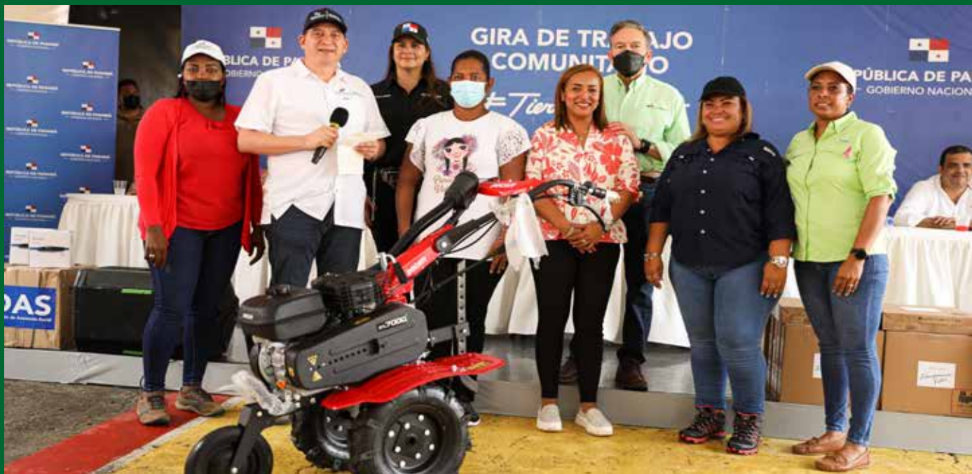
ENTREGA DE MOTOAZADAS