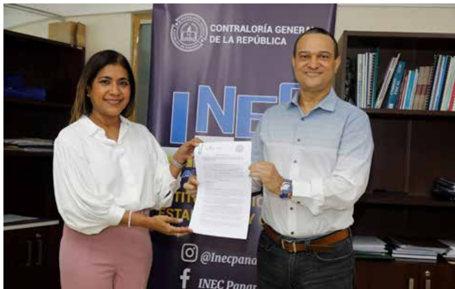
Autoridades de MiAmbiente recibieron de manos del director del INEC, el borrador de un acuerdo de participación que deberá ser revisado y firmado por el ministro de Ambiente, Milciades Concepción.

La herramienta busca aglutinar en un solo espacio la valiosa y amplia información de este sector dispersa en diversas instituciones.