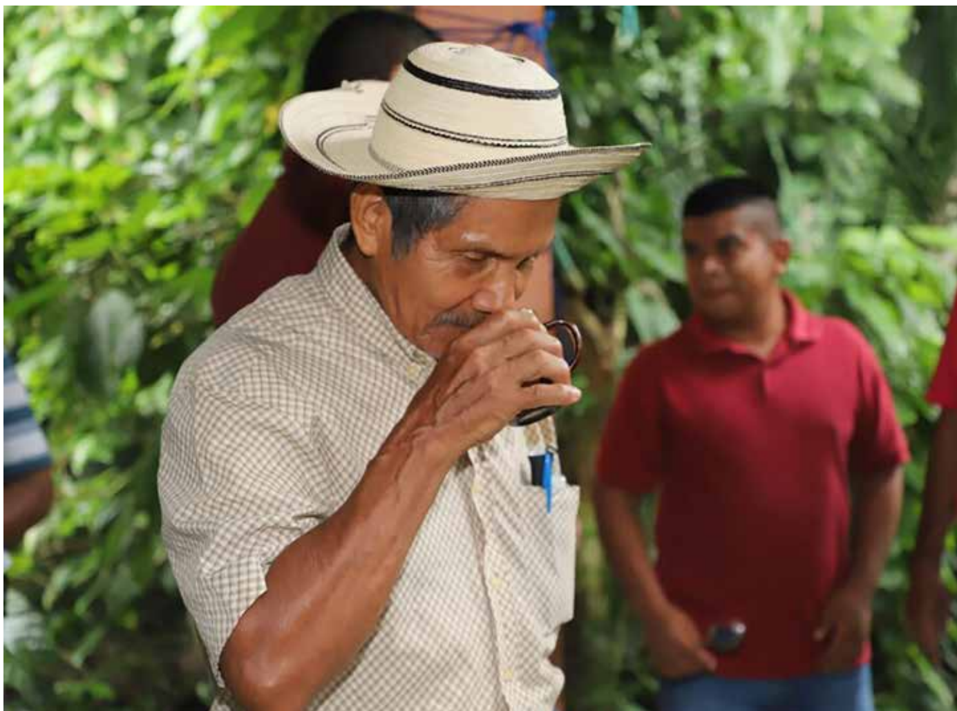
Productores de diversas asociaciones de Coclé y Colón participaron de la jornada.