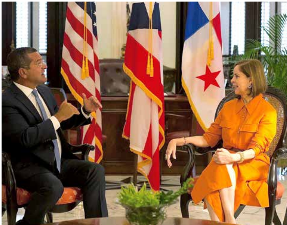
La primera dama, Yazmín Colón de Cortizo, comparte avances de Panamá en la educación STEAM.