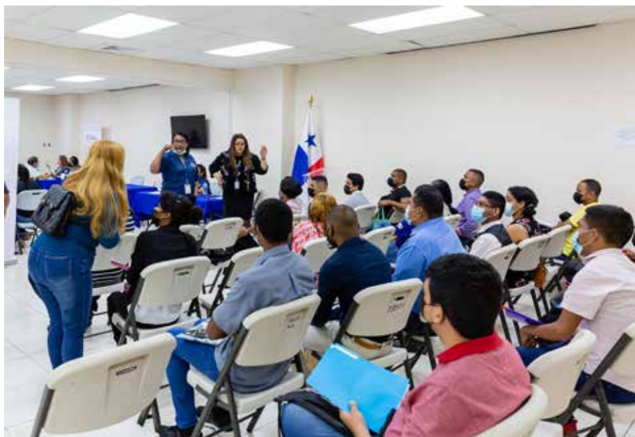
Las normas establecen que las empresas con más de 25 empleados deben tener una persona con discapacidad.