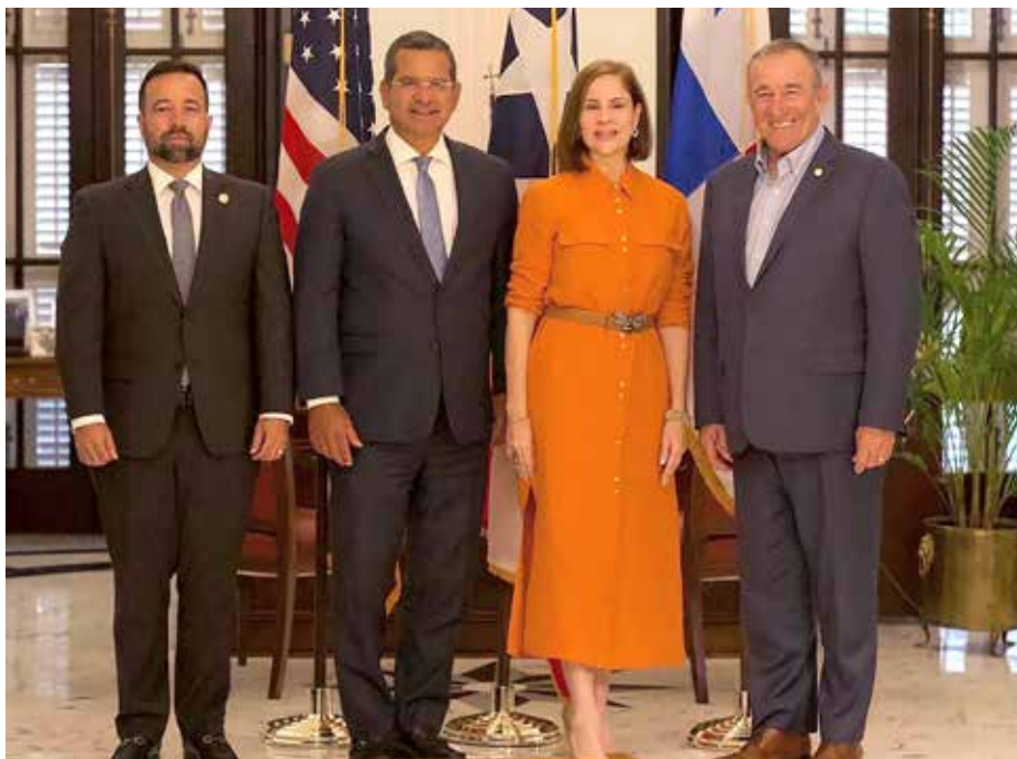
En su encuentro en La Fortaleza con el gobernador de Puerto Rico, Pedro Pierluisi, la primera dama destacó la importancia de la educación STEAM para la región.