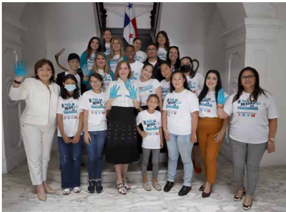
La primera dama pintó su mano de color turquesa, representativo de la enfermedad.