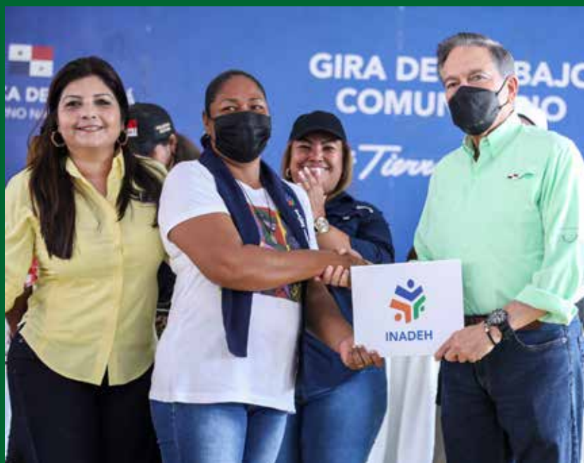
CERTIFICADOS DE CULMINACIÓN DE CURSOS