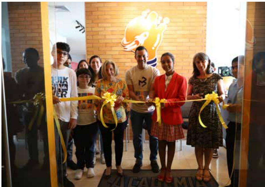
El Despacho de la Primera Dama participó en la inauguración del Rincón Clubhouse “Mentes Brillantes”.

La Dirección de Asistencia Social del Despacho de la Primera Dama participó en la inauguración del Rincón Clubhouse “Mentes Brillantes”, iniciativa coordinada entre la Secretaría Nacional de Ciencia, Tecnología e Innovación (Senacyt) y la Fundación Mentes Brillantes. Rincón Clubhouse “Mentes Brillantes” es un espacio inclusivo dirigido a fortalecer la formación académica y profesional de jóvenes en riesgo social. El objetivo principal es facilitar a la juventud el acceso al conocimiento, la utilización y el aprovechamiento de las tecnologías creativas, despertando el interés en la ciencia, tecnología, ingeniería, artes y las matemáticas (STEAM, por sus siglas en inglés). Este espacio recibirá a jóvenes de 12 a 18 años interesados en desarrollar diversas actividades y proyectos relacionados con el desarrollo de nuevas habilidades, reforzamiento de habilidades blandas y de liderazgo. Además, los jóvenes aprenderán a trabajar sobre fabricación digital y diseño 3D, desarrollo lógico y algoritmos, electrónica, robótica, digital, analógico, mecatrónica y programación, entre otras tecnologías. Los padres de familia que estén interesados en que sus hijos formen parte de Rincón Clubhouse de Mentes Brillantes pueden acercarse en un horario de lunes a miércoles, de 9:00 a.m. a 3:00 p.m., y viernes de 9:00 a.m. a 5:00 p.m. Para consultas escribir a: @rchmentesbrillantes.