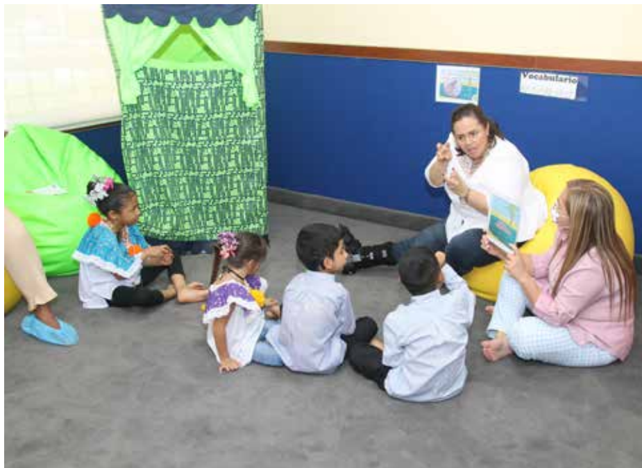
El objetivo del Aula de Recursos es desarrollar prácticas inclusivas y un modelo de atención para el cumplimiento del principio de equiparación de oportunidades

El Gobierno Nacional inauguró en el Instituto Panameño de Habilitación Especial (IPHE) un Aula de Recursos como parte de la gestión escolar de dotación de herramientas para que los estudiantes tengan mayores oportunidades de alcanzar su desarrollo educativo, por un valor de B/.15,000.00. El Aula de Recursos es una respuesta que concreta la actual administración del IPHE luego de 20 años de espera, y corresponde a la Escuela de Enseñanza Especial de la Dirección Nacional de Servicios y Apoyo para la Habilitación, ser la primera en cumplir con esta meta académica, teniendo presencia en 34 centros educativos inclusivos con una asistencia de 1,396 estudiantes. Este centro ha sido dotado con equipos tecnológicos, entre ellos: computadoras, impresoras, material para la elaboración de calendarios, tableros de alta y baja tecnología con el sistema de comunicación aumentativa y alternativa; un tablero digital, una mesa Smart, máquinas Perkins y el “software” Julis, además de materiales al alcance de todos los docentes de las sedes IPHE y escuelas inclusivas.