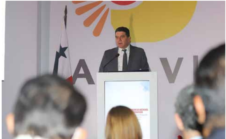
El ministro del MIDA encargado, durante la inauguración del congreso avícola.

Este sector genera unos 10,500 empleos directos y cerca de 75 mil trabajos indirectos que impactan en la economía panameña.