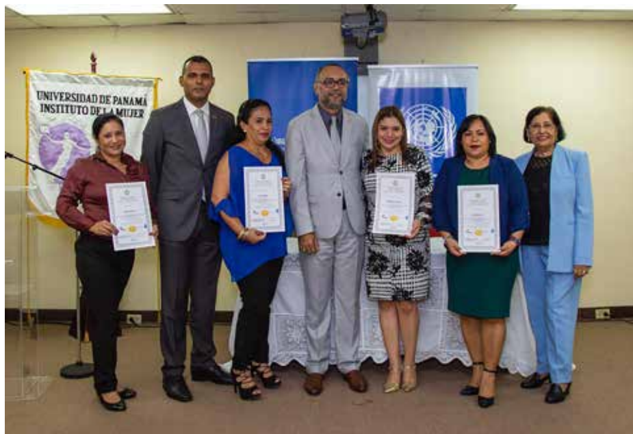
Con esta formación se avanza en el proceso de transformación de la cultura laboral.