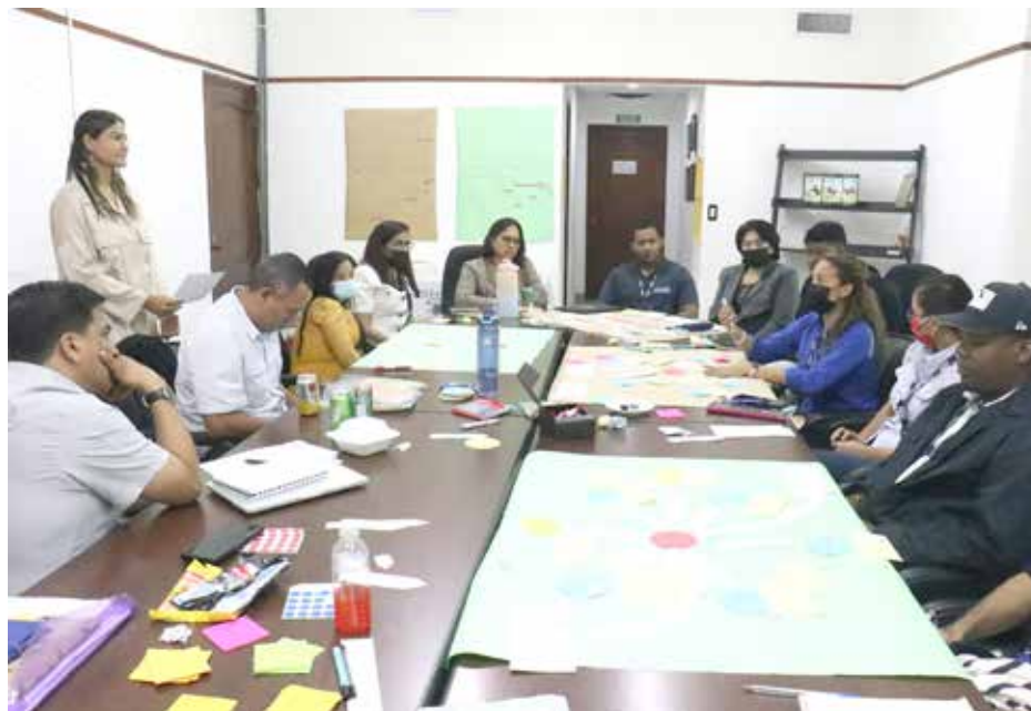
La representación de Global Fishing Watch reconoció los esfuerzos de Panamá en la lucha contra la pesca ilegal.

Expertos de Global Fishing Watch (GFW) participaron el pasado 11 de octubre en una jornada de capacitación con el equipo de monitoreo, control y vigilancia de la Autoridad de los Recursos Acuáticos de Panamá (ARAP), para reforzar el desarrollo de las capacidades, el fortalecimiento, control y vigilancia pesquera nacional e internacional, con miras a combatir la pesca ilegal no declarada y no reglamentada (INDNR). Los representantes de Global Fishing Watch, que estuvieron dos semanas en Panamá, vienen promoviendo, junto a entidades nacionales, la transparencia en los océanos desde el 2019 cuando se firmó un memorando de entendimiento para aprovechar la tecnología de punta de GFW y fortalecer el sistema de monitoreo de la flota pesquera internacional del país. Alrededor de 350 embarcaciones son monitoreadas, tanto de captura como de apoyo a la pesca, y se hicieron visibles en el mapa de Global Fishing Watch en octubre de 2019, marcando un hito de transparencia en uno de los países con mayor registro abierto a nivel mundial. Panamá se encuentra en una posición única en términos de geografía, sirviendo como un puente entre los océanos Pacífico y Atlántico y cuenta con más de 2,490 kilómetros (1,500 millas) de costa. Desempeña un papel importante en el trasbordo, proporcionando registros para los buques de apoyo que se utilizan para recibir capturas en el mar y transportarlas a puerto.