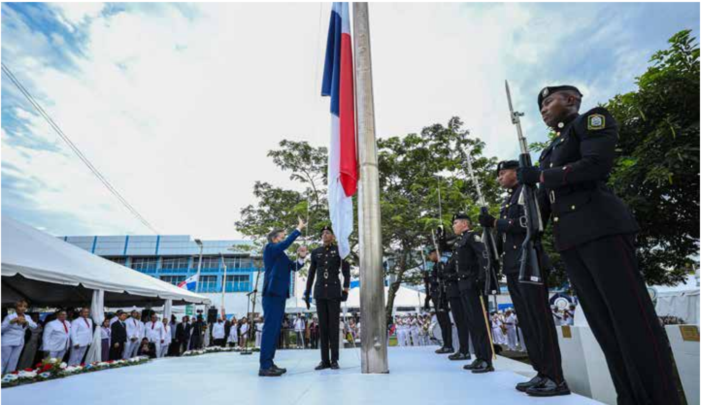
El gobernante Laurentino Cortizo Cohen, junto a su equipo de Gobierno, asistió a los actos protocolares en Colón, en conmemoración de los 119 años de la Separación de Panamá de Colombia.