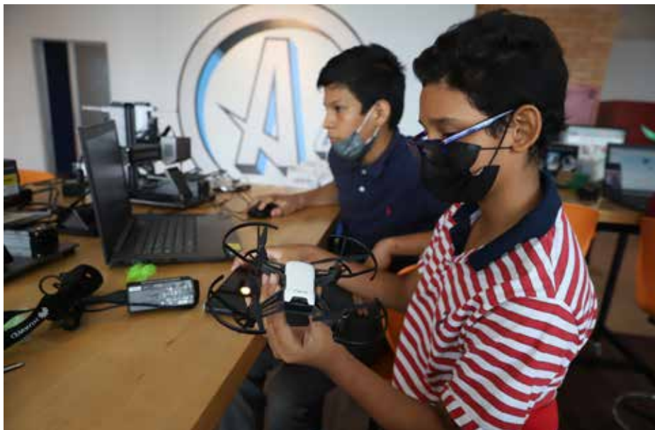
El centro recibirá a jóvenes de 12 a 18 años.