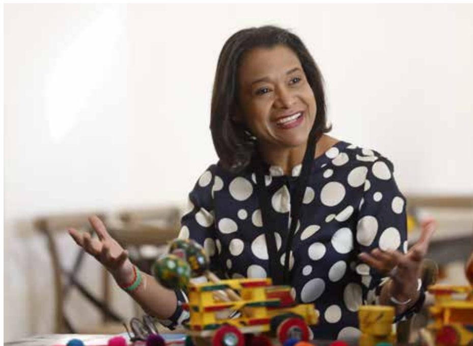
Giselle González Villarrué, ministra de Cultura.

La CIC es un órgano técnico-político de discusión en el área de cultura, conformado por representantes de los ministerios y altas autoridades de Cultura de las Américas.