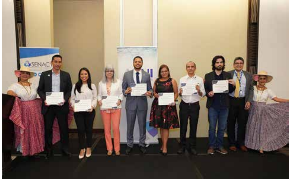
En el Encuentro de Intercambio Científico 2022 participaron los miembros del SNI de las categorías Investigador Nacional I, Investigador Nacional II, Investigadores Distinguidos, Estudiantes de Doctorado y Estudiantes de Maestría, de nuevo ingreso y de reingreso de 2020 a 2022.