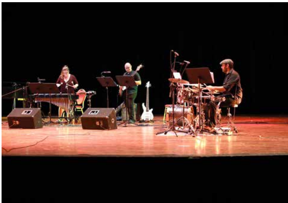
El Cuarteto Panamá realizó la apertura de este festival.

Cerca de quince grupos participaron en este gran encuentro musical.