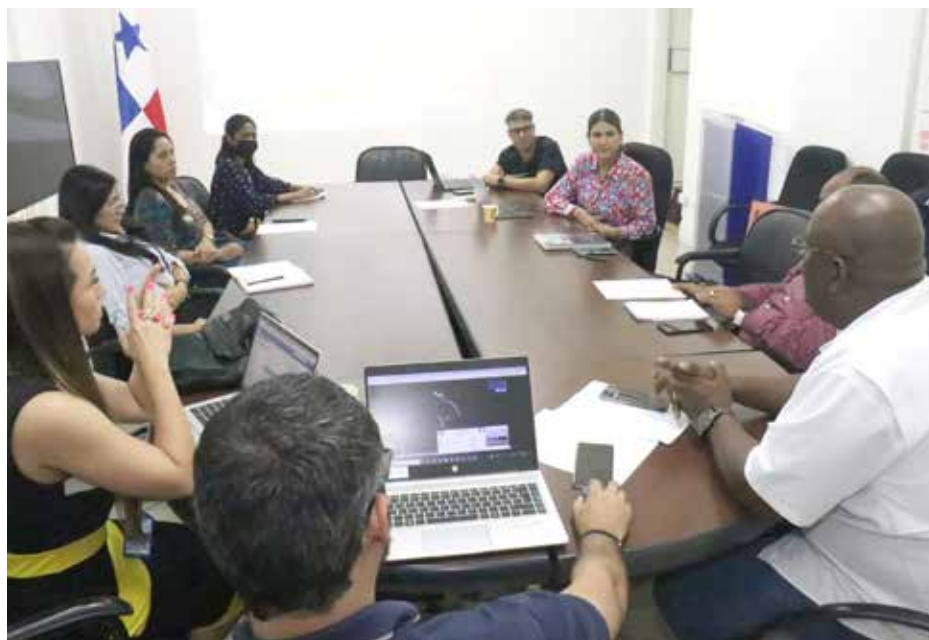
Los colaboradores de la ARAP participantes en los talleres refuerzan sus conocimientos y los ponen en práctica en sus labores diarias.