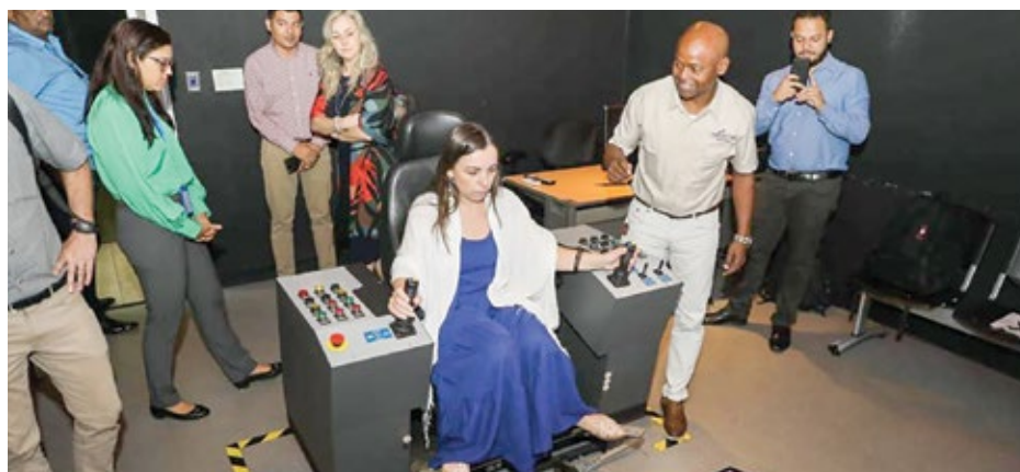
Personal del Inadeh y del Senai realizan gira diagnóstica para identificar los proyectos que desarrollarán.