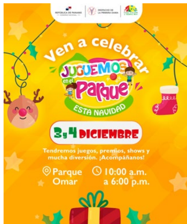
El 3 y 4 de diciembre se realizará la actividad 'Juguemos en el Parque esta Navidad'.