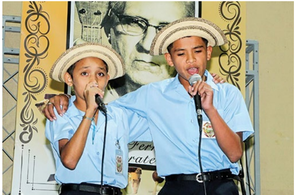
Los jóvenes compitieron en las modalidades de grito, canto religioso, saloma, mejorana, tambor y cumbia.

El Ministerio de Educación, a través del folclor, fortalece la identidad cultural de los pueblos y, a la vez, desarrolla y potencia las capacidades de los alumnos.