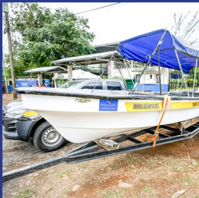
ENTREGA DE LANCHAS Y MOTORES FUERA DE BORDA.