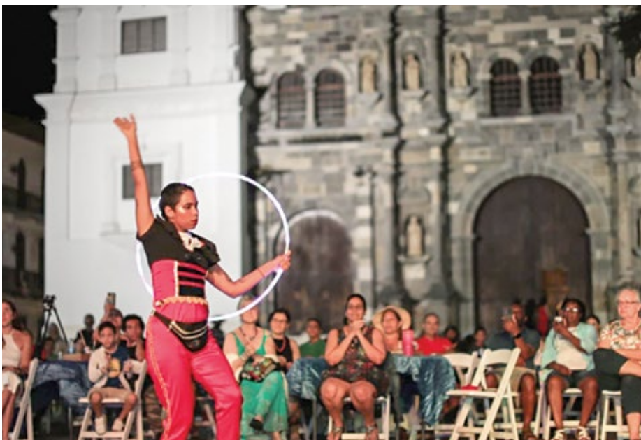
Los juegos malabares y las acrobacias fueron del agrado de los más pequeños.

La próxima actividad tendrá lugar el sábado 17 de diciembre a partir de las 7:00 p.m.