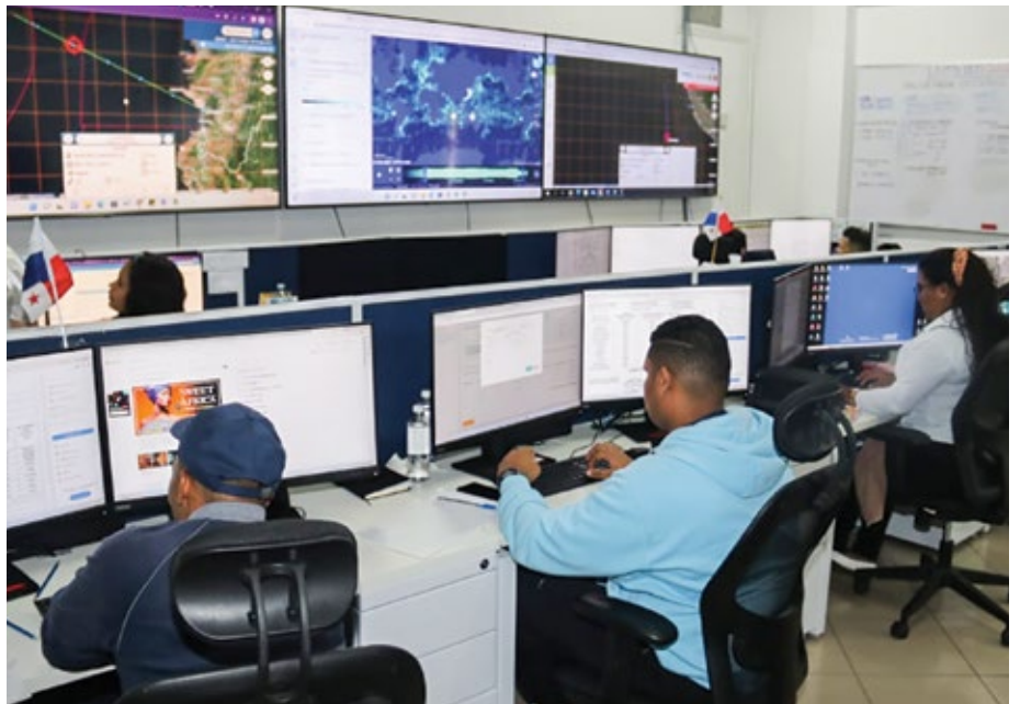
Personal idóneo supervisa a través de la tecnología el curso de las embarcaciones pesqueras.

Esta distinción ayudará a reforzar la lucha contra la pesca ilegal no declarada y no reglamentada.