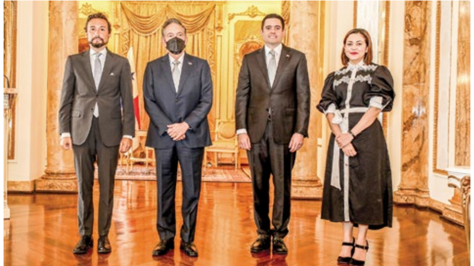
Guzmán Ignacio Palacios Fernández, embajador del Reino de España.