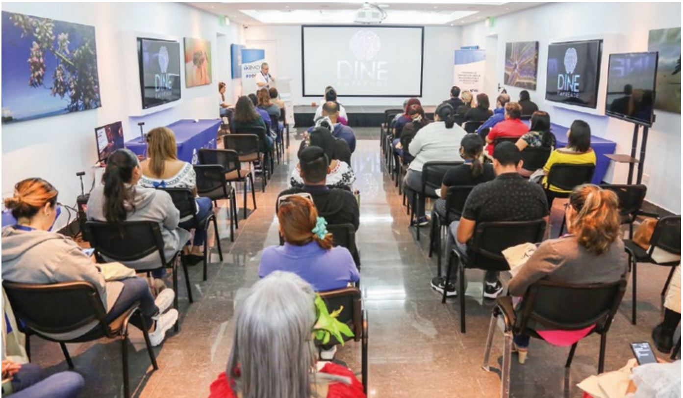
Esta jornada se realizó el viernes 18 de noviembre de 2022 en la Senacyt.

La Secretaría Nacional de Ciencia, Tecnología e Innovación (Senacyt), a través de la Dirección de Innovación Empresarial, en conjunto con el Banco Interamericano de Desarrollo (BID), realizó la Segunda Jornada de Sensibilización de la Semana Global del Emprendimiento 2022 en la que participaron colaboradores de la Senacyt y de las Asociaciones de Interés Público. El objetivo de la actividad fue inspirar, motivar, soñar, conectar, interactuar,