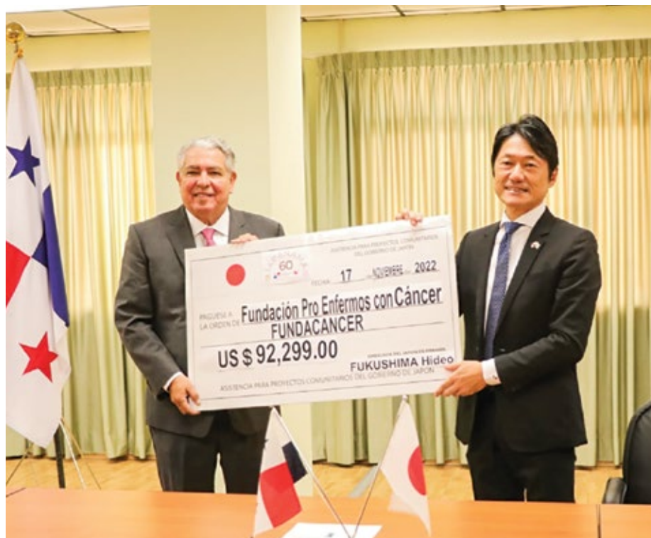
El equipo de electrocirugía es indispensable para la realización de cirugías y se utiliza para cortar tejidos y controlar el sangrado.

El ministro de Salud, Luis Francisco Sucre, participó en la firma de contrato y entrega de cheque por parte de la Embajada de Japón a Fundacáncer para la adquisición de tres equipos de electrocirugía para el Instituto Oncológico Nacional (ION), por un monto de B/.92,299.00. Este equipo es indispensable para la realización de cirugías y se utiliza para cortar tejidos y controlar el sangrado. El ministro de Salud indicó que la modalidad de cooperación entre países robustece los mecanismos de transparencia y que la donación de estos equipos a través de la Fundación Pro Enfermos con Cáncer (Fundacáncer) fortalece la amistad y solidaridad entre ambas naciones. En nombre del presidente de la República, Laurentino Cortizo Cohen, del Ministerio de Salud, del Instituto Oncológico Nacional y del pueblo panameño, el ministro Sucre agradeció a la Embajada de Japón esta valiosa contribución. El embajador de Japón en Panamá, Hideo Fukushima, manifestó que la donación forma parte de la Asistencia Financiera no Reembolsable para Proyectos Comunitarios de Seguridad Humana que realiza la Embajada de Japón en Panamá desde el año 1995, a través de la cual se han desarrollado 232 proyectos en beneficio de los panameños.