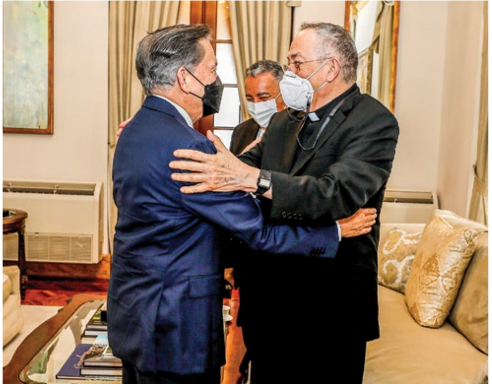
El cardenal hondureño realizó una visita de cortesía al presidente de la República, Laurentino Cortizo Cohen.

El cardenal hondureño Óscar Andrés Rodríguez Maradiaga, coordinador del Consejo de Cardenales del papa Francisco, expresó al presidente de la República, Laurentino Cortizo Cohen, su agradecimiento por el "trato humanitario" que ha ofrecido el Gobierno panameño a los miles de migrantes que ingresan al país. Rodríguez Maradiaga, acompañado del arzobispo de Panamá, monseñor José Domingo Ulloa, realizó la mañana del 22 de noviembre una visita de cortesía al presidente Cortizo Cohen en su despacho en palacio. El cardenal visitó Panamá con motivo de la Reunión de Obispos de Centroamérica. Durante el encuentro, el cardenal le hizo entrega al gobernante de un obsequio de parte del papa Francisco y le expresó la complacencia del santo padre y de su persona por la evolución satisfactoria del estado de salud del presidente tras sus últimos exámenes médicos realizados como parte del tratamiento que ha iniciado desde julio pasado debido a la mielodisplasia de bajo riesgo que le fue diagnosticada. Rodríguez Maradiaga destacó la importancia del rol que juega Panamá en los asuntos que afectan a la región, ya que está llamado a ser el puente de unidad, tanto en Centro como en Latinoamérica. El cardenal hondureño agradeció la hospitalidad con que siempre es recibido en Panamá y reiteró un mensaje de bendiciones al gobernante y al pueblo panameño.