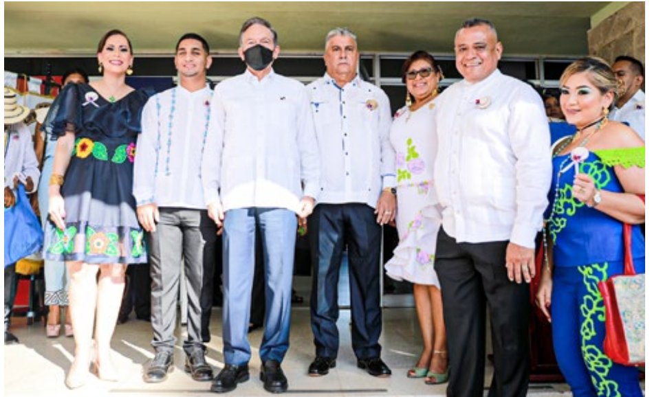
El gobernante resaltó en La Chorrera la virtud que distingue al pueblo panameño, que enfrenta los grandes desafíos con sentido de unidad y de nación.

Los actos en La Chorrera correspondieron a la celebración del 28 de noviembre de 1821, fecha de la Independencia de Panamá de España.