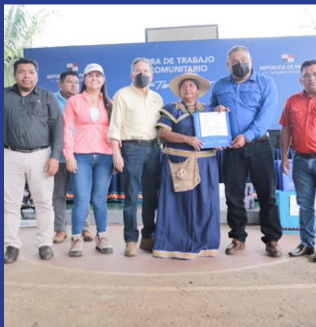
CONSTRUCCIÓN DE LA CARRETERA COCLESITO - KANKINTÚ.