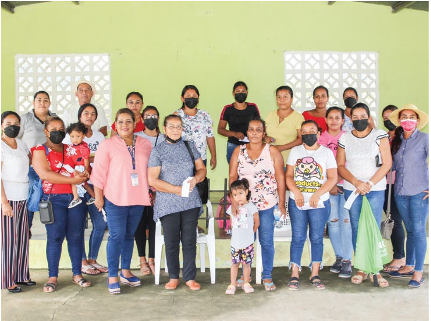
En la provincia de Coclé hay dos cooperativas creadas a través del Eje de Acción Cambiando Vidas, en Ventorrillo de El Copé y en La Mata de Río Hato.

donde se desarrollan. El primer grupo de mujeres residentes en Membrillo se dedica a la confección de artesanías fabricadas con piedra de jabón (material natural de esta región), la confección de sombreros y la agricultura, entre otras actividades, mientras que las de Nuestro Amo de Olá realizan labores de cocina, costura y agricultura.