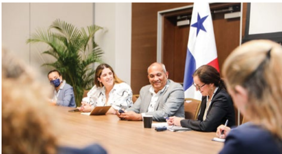
La seguridad de los océanos fue considerado el tema de mayor urgencia, de acuerdo con Mónica Medina, representante del Gobierno estadounidense.

Panamá y Estados Unidos revisan acciones para ejecutar medidas e intercambio de cooperación en el contexto del Tratado de Promoción Comercial.