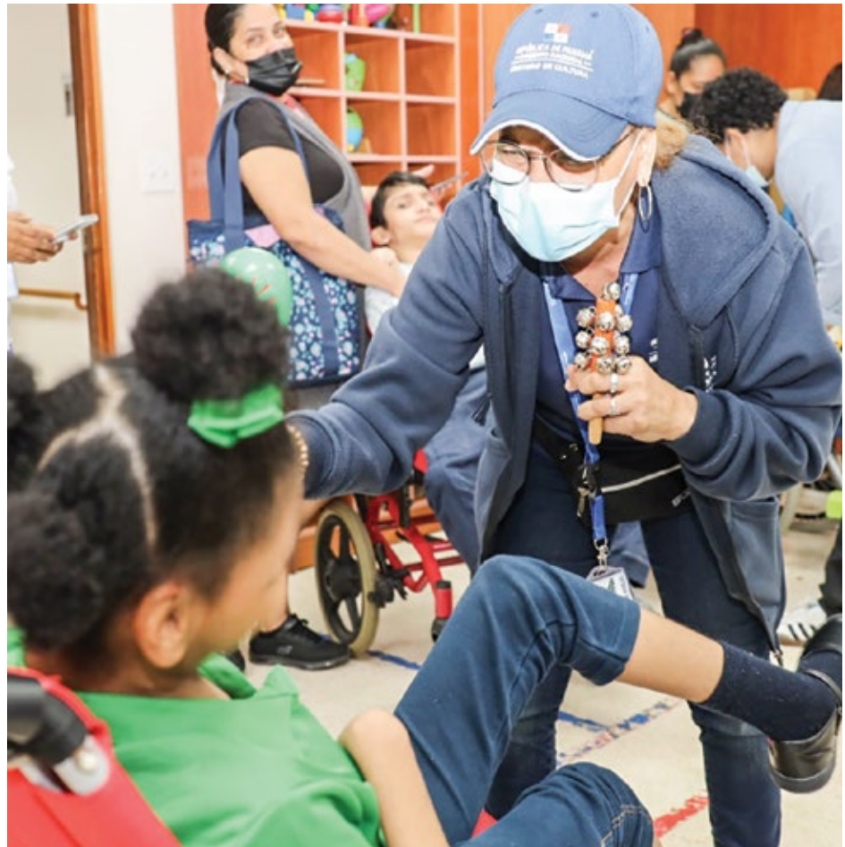
Colaboradores de la Dirección de Derechos Culturales y Ciudadanía interactúan con los niños del centro.

La dinámica, que se realizó en conjunto con el IPHE, tuvo una duración de cuatro meses y abarcó diversas poblaciones con discapacidad.