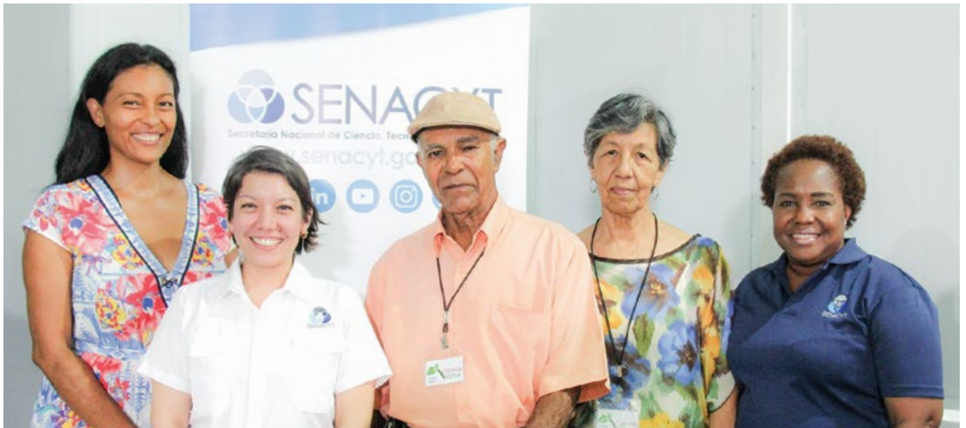
Representantes de la Senacyt y de Especies Valmar presentaron la planta de procesamiento con nuevos subproductos de derivados de especias cultivadas en fincas orgánicas certificadas en Panamá con miras al mercado internacional.