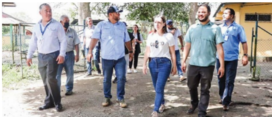
Una gira diagnóstica Inadeh-Senai incluyó la visita a la granja didáctica de Penonomé y una reunión con los directores provinciales.