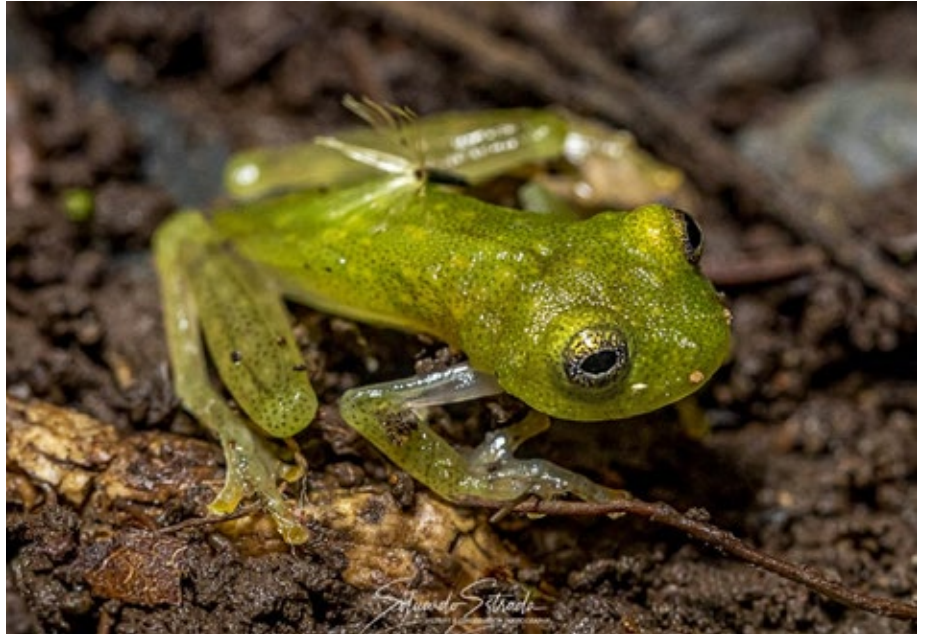
Las ranas cristal tienen una alta demanda en el mercado internacional de mascotas debido a su piel transparente que deja visibles sus órganos internos.

Dos hitos importantes para Latinoamérica se registraron durante la COP19 de la CITES, que garantizan la protección de la fauna. Uno de ellos es que se logró incluir, por consenso, a todas las especies de la familia Centrolenidae (rana cristal) en el Apéndice II de la Convención sobre el Comercio Internacional de Especies Amenazadas de Fauna y Flora Silvestres (CITES). De igual manera, se incluyó la "Agalychnis lemur" (rana lémur) en el Apéndice II. La Conferencia de las Partes de CITES, en su edición 19, celebrada en Panamá, ha sido un encuentro mundial con importantes logros en la protección y conservación de la fauna y flora mundial. En este caso, las ranas cristal tienen una alta demanda en el mercado internacional de mascotas debido a su tamaño diminuto y piel transparente (que deja visibles sus órganos internos). Estas características hacen que estas especies sean codiciadas por coleccionistas privados, vendedores y criaderos en todo el mundo. Panamá, como coproponente —al igual que Argentina, Brasil, Costa de Marfil, Estados Unidos, República Dominicana, Ecuador, El Salvador, Gabón, Guinea, Níger, Perú y Togo—, apoyó esta propuesta presentada por el Ministerio de Ambiente y Energía (Minae) de Costa Rica, con el objetivo