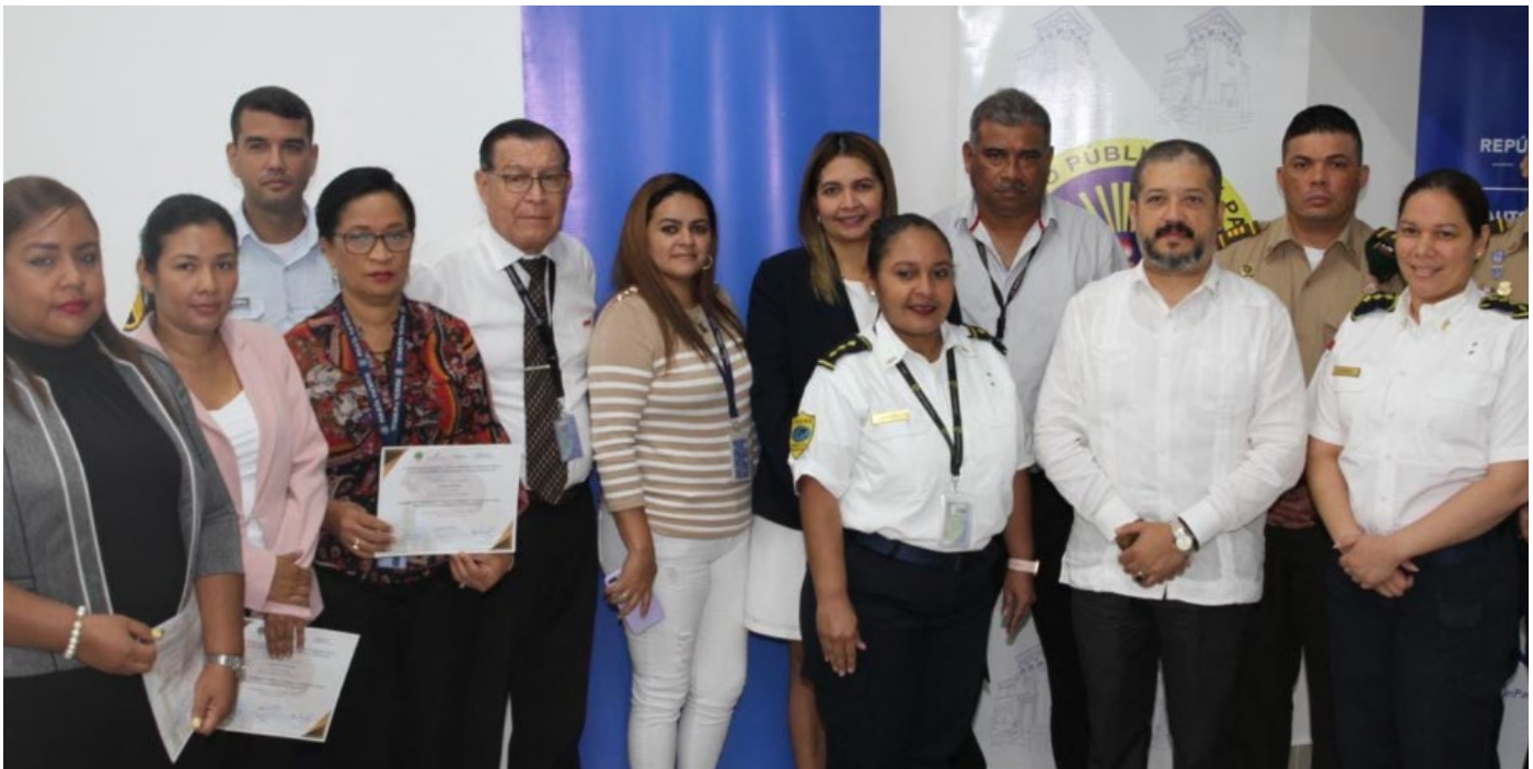
La jornada académica fue dirigida por personal de la Contraloría General de la República.