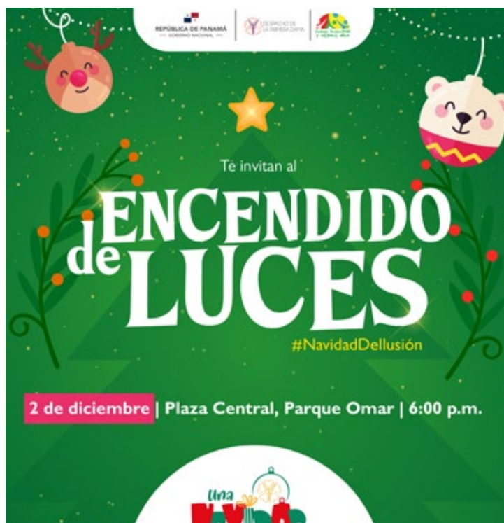
El viernes 2 de diciembre es el encendido de luces en el Parque Omar.

"Una Navidad de Ilusión" continúa su cartelera de actividades el 13 y 17 de diciembre, en horario de 5:00 p.m. a 8:00 p.m., con cuentacuentos, la presentación de la Orquesta Sinfónica Nacional y el cierre estará a cargo del Ballet Nacional de Panamá, presentando "El Quijote".