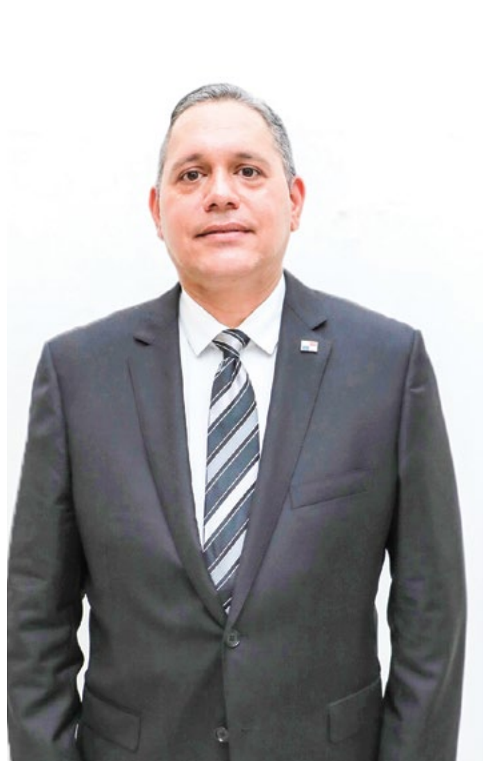
Vladimir A. Franco Sousa es el nuevo vicescanciller de Relaciones Exteriores.