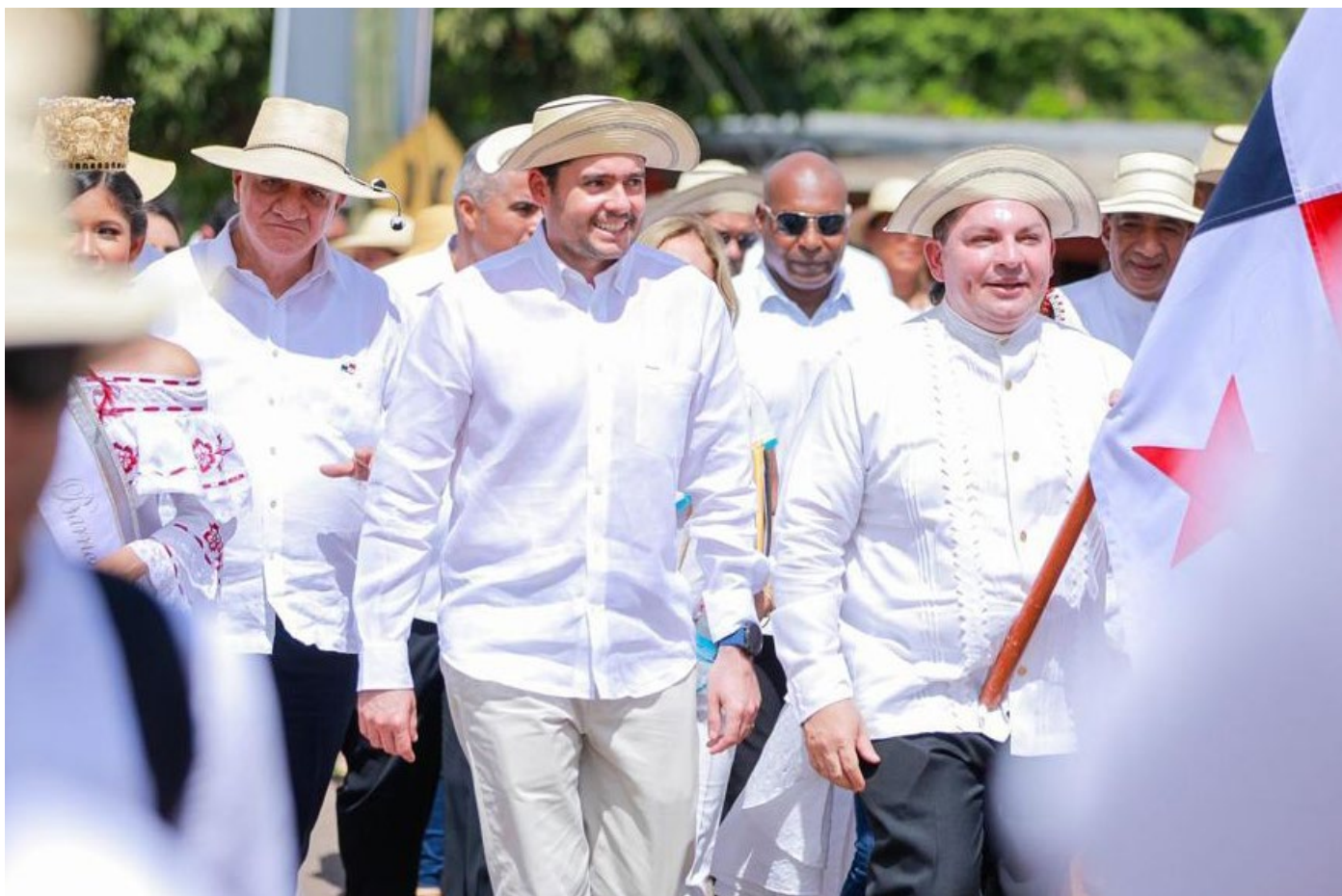
Los actos oficiales, presididos por el vicepresidente y ministro de la Presidencia, José Gabriel Carrizo, se llevaron a cabo en la Junta Comunal del corregimiento de Barrios Unidos.

En el acto se anunció la aprobación de más de B/18 millones para la construcción de la policlínica de la CSS de Aguadulce.