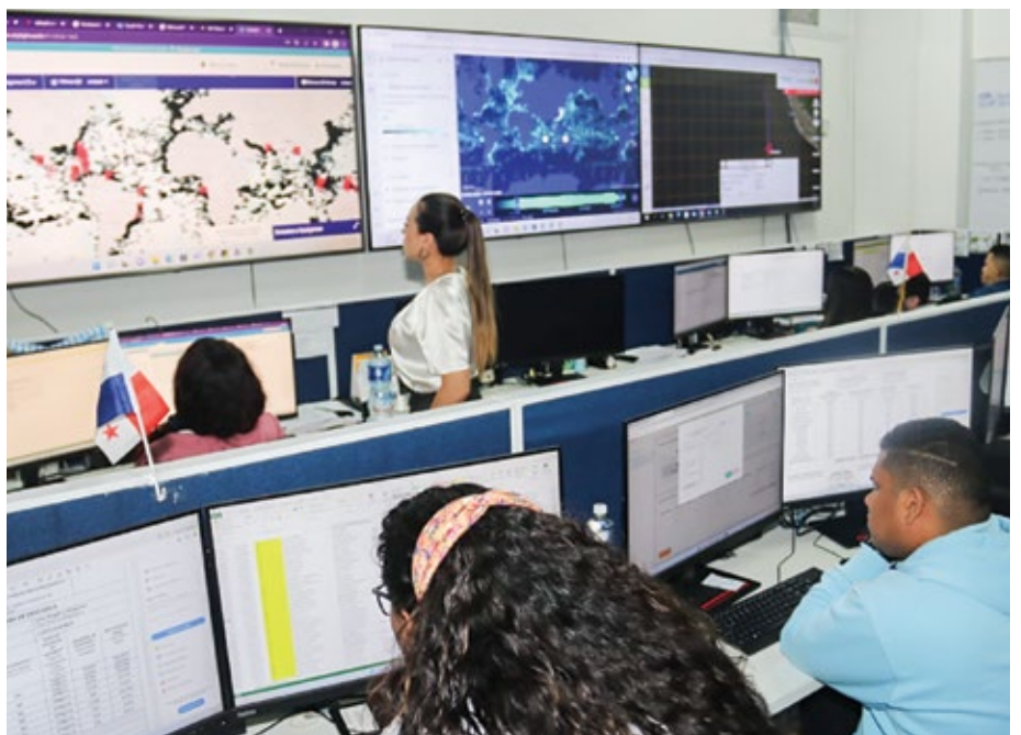
La vigilancia se realiza las 24 horas del día, los 7 días de la semana, y con este mecanismo se establecen controles contra la práctica ilegal.