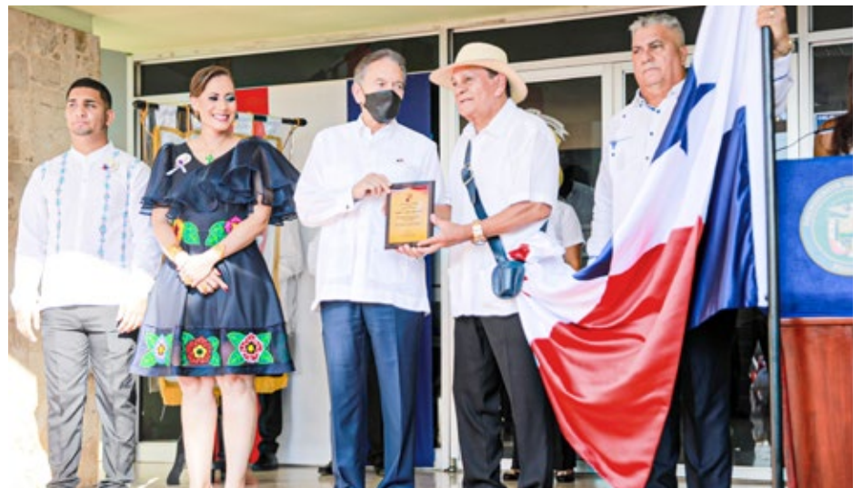
Roberto Durán, gloria del deporte nacional y mundial, fue el abanderado de las festividades.

de Oratoria 2022. Finalmente, el presidente Cortizo Cohen y la comitiva oficial presenciaron los desfiles en que participaron