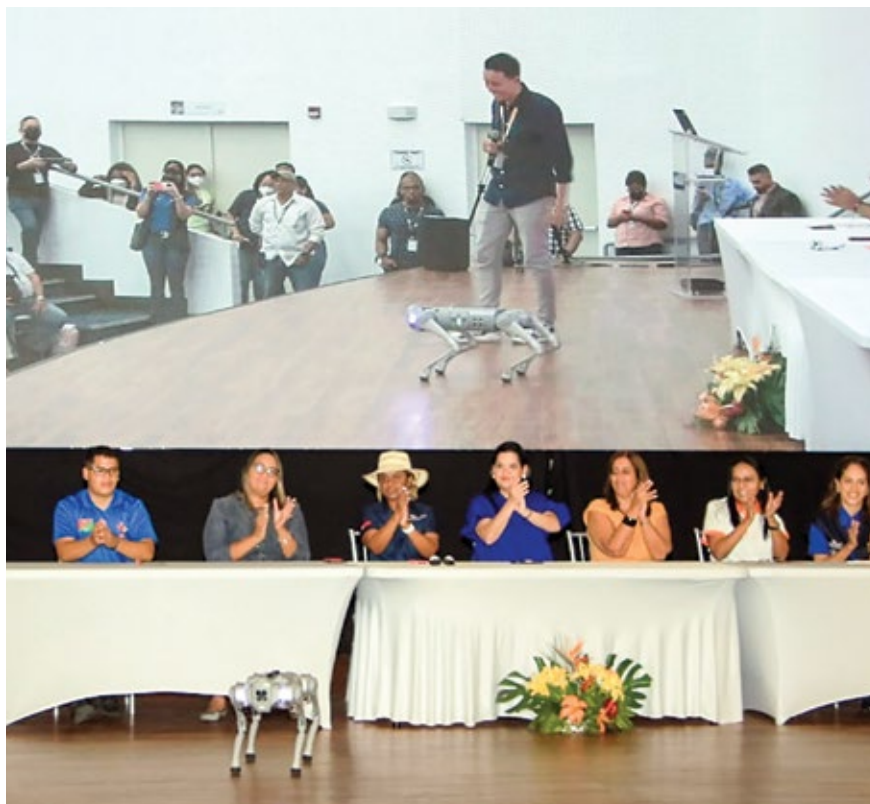
El Minsa cuenta con las clínicas amigables para atender a los adolescentes de todas las regiones.

Se busca preparar más profesionales para que brinden orientación a los jóvenes en diversos temas de salud.