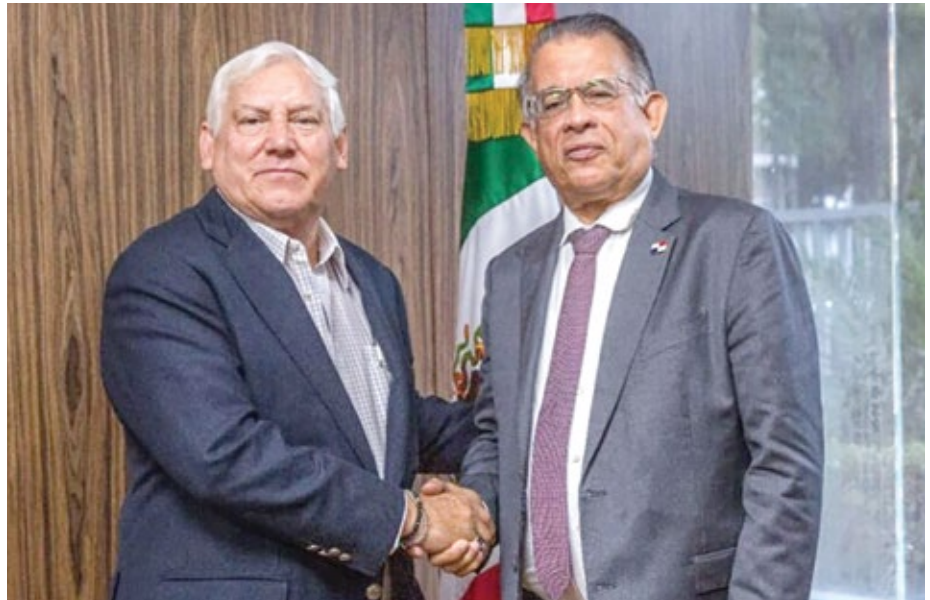
El ministro Augusto Valderrama y su homólogo de México, Víctor Manuel Villalobos.

En el encuentro se reafirmó el interés de ambos países por estrechar los lazos de amistad y cooperación en beneficio del sector agropecuario.