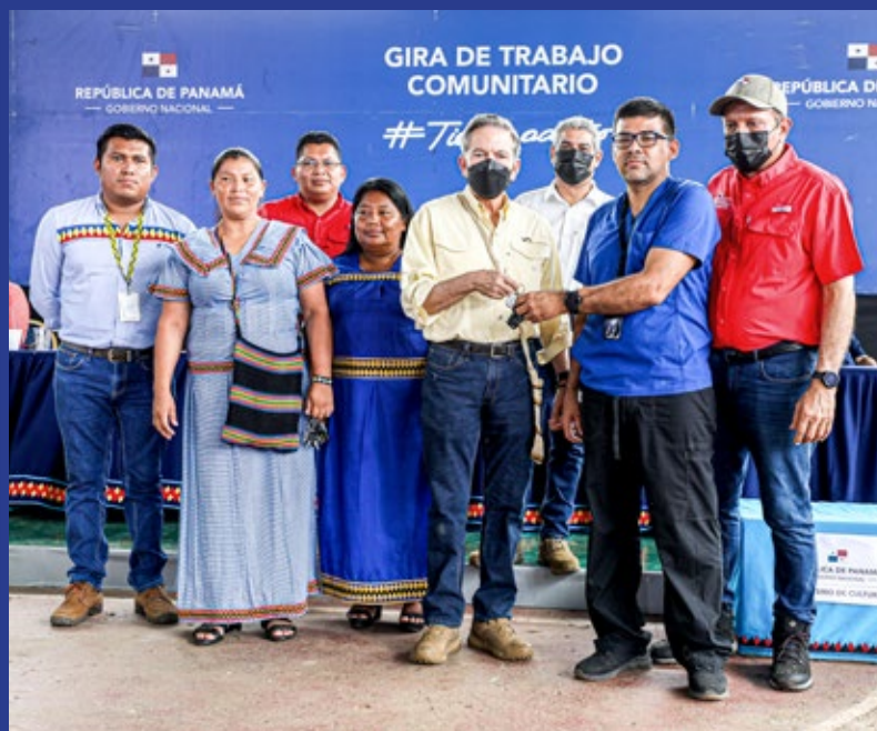
AMBULANCIAS PARA EL CENTRO DE SALUD DE QUEBRADA HACHA Y EL CENTRO DE SALUD DE SANTA CATALINA.

COMUNIDADES: BESIQUÉ, MIRONÓ, NOLE DUMA. INSTITUCIONES PARTICIPANTES: MIDES, INAMU, SENADIS, MIDA, ARAP, IMA, MINSA, IFARHU, MITRADEL, INADEH, AMPYME, IPACOO, PANDEPORTES, MICULTURA, CONADES, MOP Y DAS.