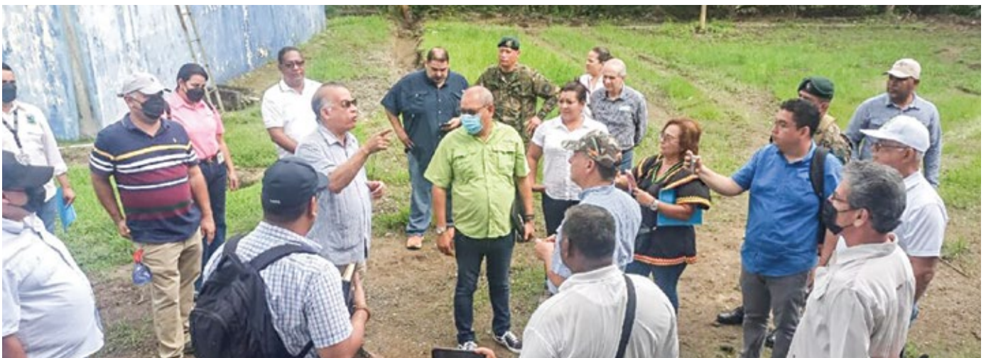
Visita a la planta de procesamiento y a la toma de agua del acueducto de San Bartolo, corregimiento de Puerto Armuelles.