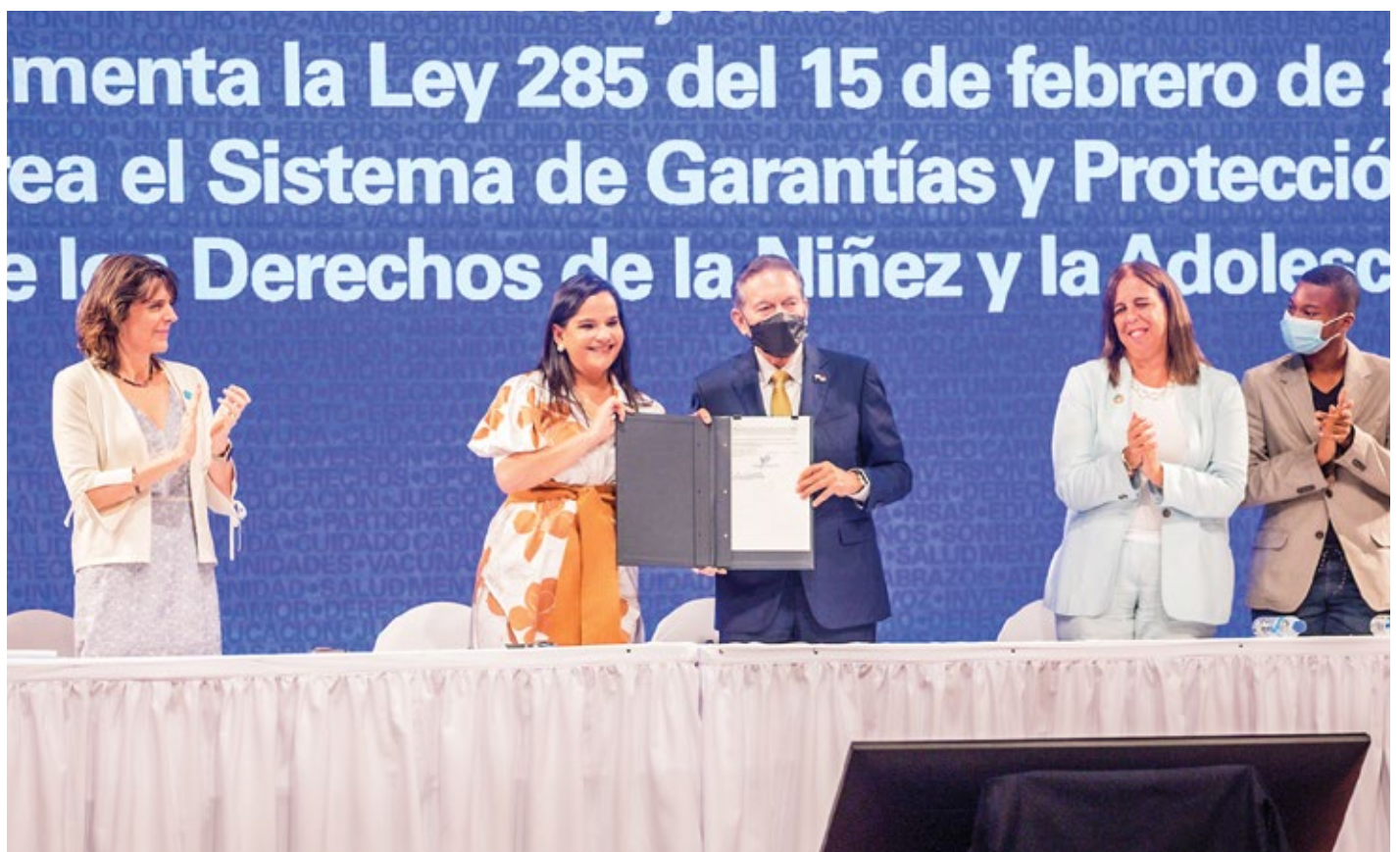
El presidente Cortizo Cohen firmó dos decretos, uno que adopta la nueva Ruta de Atención Integral a la Primera Infancia "Contigo en la Primera Infancia" y el que reglamenta la Ley 285 de 2022.

En el marco del Día Mundial de la Infancia, el Mides y Unicef resaltan los progresos y los retos que enfrentan los niños y adolescentes en el país.