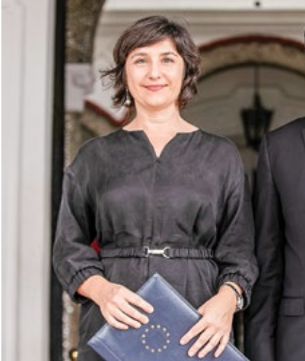
Izabela Matusz, embajadora de la Unión Europea.