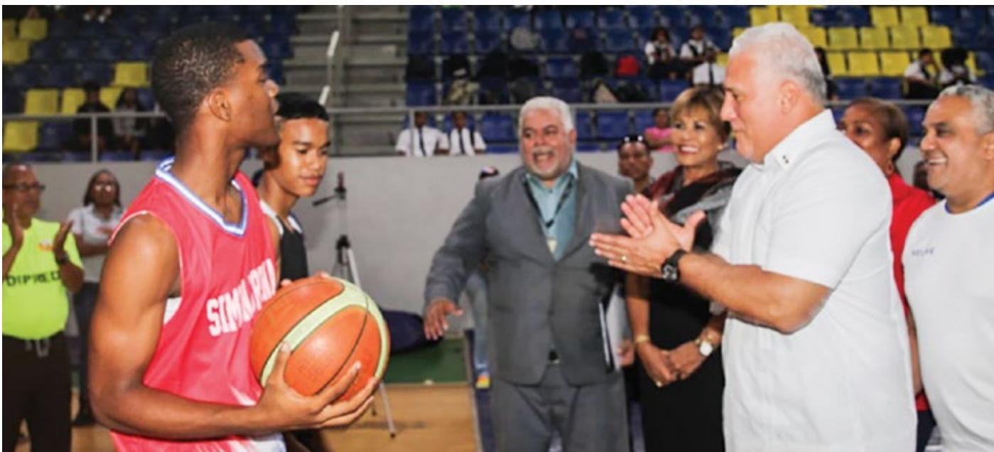
El Minseg ejecuta proyectos preventivos para alejar a los jóvenes del riesgo social.

Con la participación de 288 estudiantes, distribuidos en 24 equipos de 17 centros educativos, oficiales y particulares de la provincia de Colón, el viceministro de Seguridad Pública, Ivor Pitti, inauguró el Torneo Intercolegial de Baloncesto como parte de los proyectos de prevención que desarrolla el Ministerio de Seguridad Pública (Minseg). El viceministro Pitti explicó que esta iniciativa de prevención busca generar esparcimiento y sana diversión, además de fortalecer la formación de jóvenes y niños a través de la convivencia pacífica y los valores, alejándolos de la violencia para que sean buenos profesionales. “El Ministerio de Seguridad Pública realiza alianzas