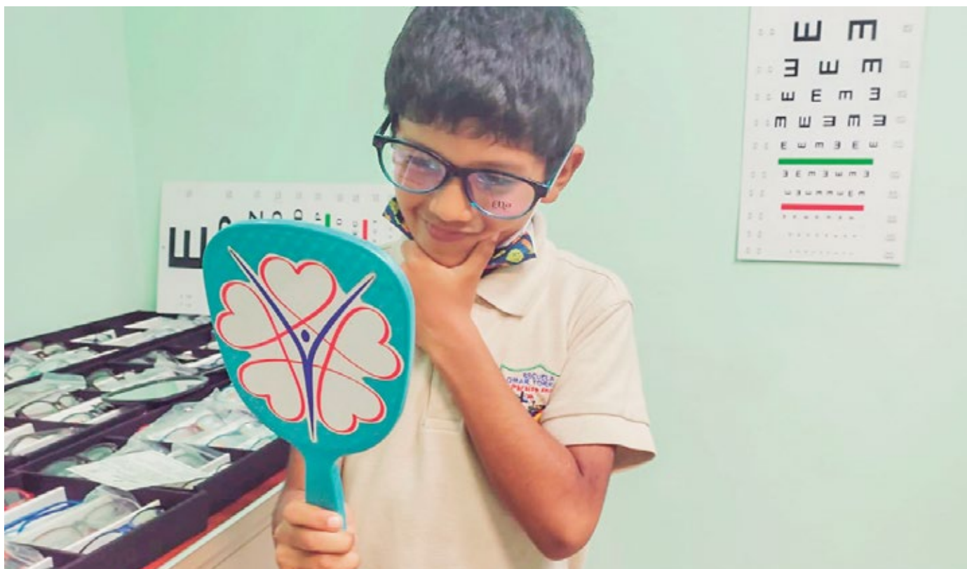
Programa 'Ver y Oír para Aprender' evalúa a más de 600 estudiantes de la Escuela Omar Torrijos Herrera, en Paraíso.

Uno de los programas insignia del Despacho de la Primera Dama de la República, liderado por Yazmín Colón de Cortizo, "Ver y Oír para Aprender", ha atendido en lo que va del 2022, a 9,249 personas, de las cuales 6,392 son estudiantes de escuelas oficiales del país y 2,857 adultos mayores de 40 años. A través de este programa, principalmente dirigido a estudiantes de centros educativos oficiales del país, se realizan tamizajes visuales y auditivos para determinar que no tengan ningún tipo de afecciones y puedan estudiar con las herramientas necesarias. El programa Ver y Oír para Aprender ha recorrido las provincias de Panamá, Herrera, Veraguas, Los Santos, Chiriquí, Darién, Panamá Oeste, Colón y la comarca Ngäbe Buglé. Actualmente, se está evaluando con atención visual a más de 600 estudiantes de la Escuela Omar Torrijos Herrera en