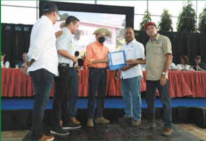
ORDEN PARA CONSTRUCCIÓN DE JUNTA COMUNAL DE SAN JOSÉ.