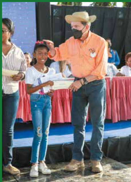
ENTREGA DE BECAS Y TABLETAS.

El presidente de la República, Laurentino Cortizo Cohen, llevó a cabo, el viernes 20 de enero, la Gira de Trabajo Comunitario (GTC) 'Tierra Adentro' 123 en la provincia de Los Santos, circuito 7-1, en la que participaron 20 instituciones, y entregó obras y beneficios por B/.2,850,605.33. En el distrito de Pocrí, el mandatario entregó el proyecto de rehabilitación de 18 calles del corregimiento de Lajamina, con una inversión de B/.1,316,694.91; y la orden de proceder del proyecto de rehabilitación Asfaltando Calles de Tonosí, por un monto de B/.9.160,243.01. Del programa Un Mejor Semental, pequeños productores recibieron 21 toros de raza cebuina por un monto de B/.52,500. Además se otorgaron 40 viviendas del Plan Progreso, con una inversión de B/.842,037.60, en los distritos de Macaracas y Tonosí, becas a estudiantes, equipo médico, de desinfección y medicamentos por un monto de B/.134,434.51 y un vehículo diésel doble cabina diésel a la Región de Salud de Los