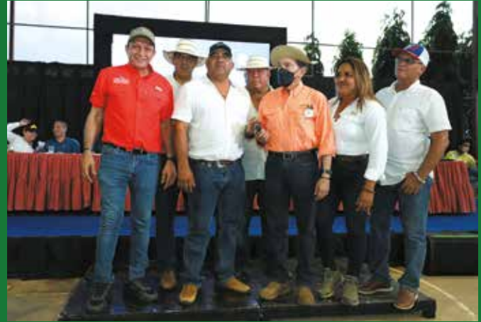
ENTREGA DE RETROEXCAVADORA PARA EL MUNICIPIO DE POCRÍ.