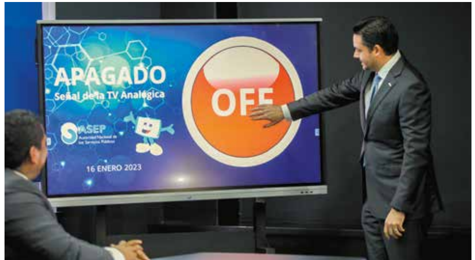
El vicepresidente de la República, José Gabriel Carrizo Jaén, presionó el botón que dio paso a la nueva era de la televisión digital en las provincias de Panamá, Panamá Oeste y Colón.

Las provincias de Panamá, Panamá Oeste y Colón inician la nueva era tecnológica con la emisión de la Televisión Digital Terrestre (TDT), luego de que el vicepresidente de la República y ministro de la Presidencia, José Gabriel Carrizo Jaén, oprimiera, el 16 de enero de 2023, el botón que dio paso a la televisión digital en estas tres provincias. En el año 1960 se dio la primera transmisión de un canal de televisión en Panamá y, transcurridos 63 años, se apaga la señal analógica para dar paso a la nueva etapa de la televisión digital en señal abierta, en un acto oficial que se llevó a cabo en el Anfiteatro del Palacio Presidencial. Los panameños podrán apreciar en sus hogares 22 canales en señal abierta y gratuita en formato TDT, con mejor calidad de imagen, sonido y datos en información digital, dejando atrás la escala de grises y colores mezclados. El vicepresidente Carrizo Jaén dijo que “el paso que hoy damos al ingresar plenamente