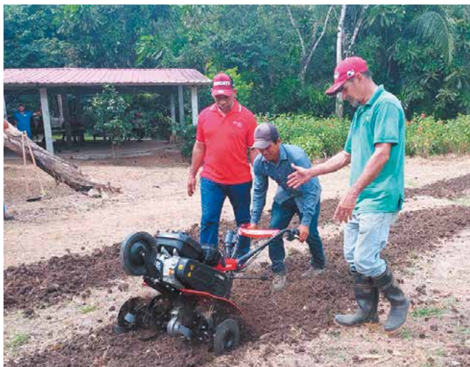
La agencia Hnos. Barria, distribuidora de este equipo, fue la responsable de dar la capacitación para el entrenamiento de los pequeños productores.