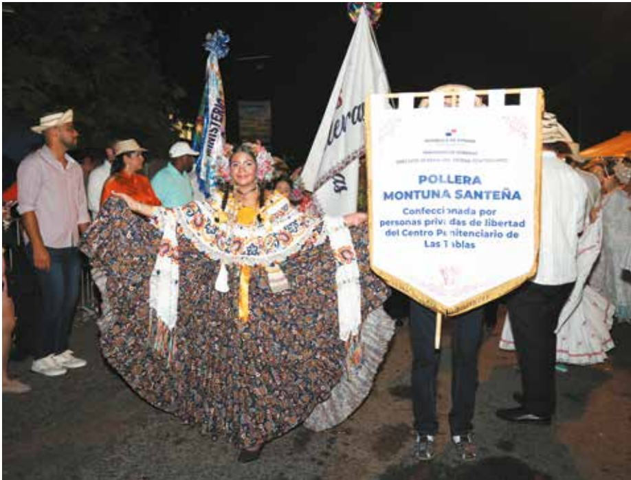
Al recibir la bandera del Desfile de las Mil Polleras, el ministro de Gobierno agradeció al pueblo santeño y al Gobierno Nacional la distinción.

La primera pollera montuna zurcida, bordada, calada y con mundillo confeccionada por privados de libertad del centro penitenciario de Las Tablas, provincia de Los