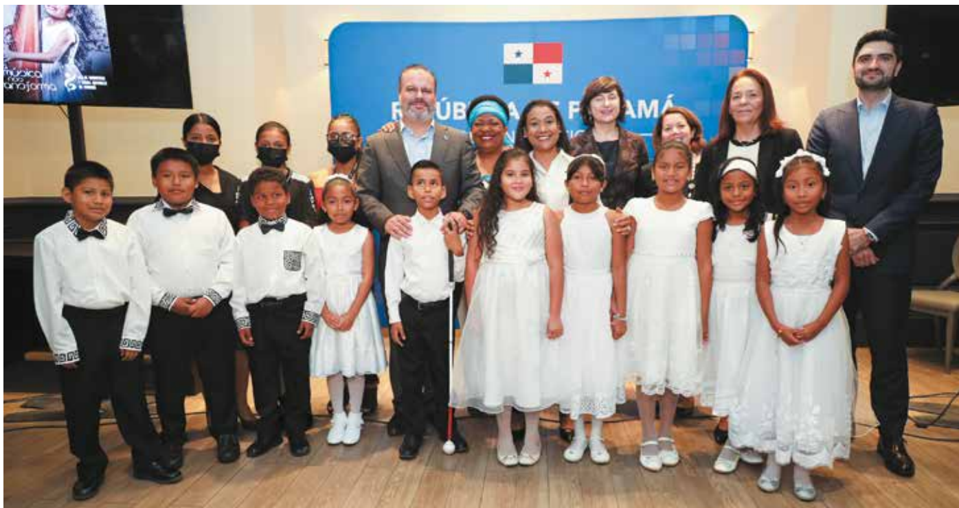
La Red cumplió seis años de existencia.