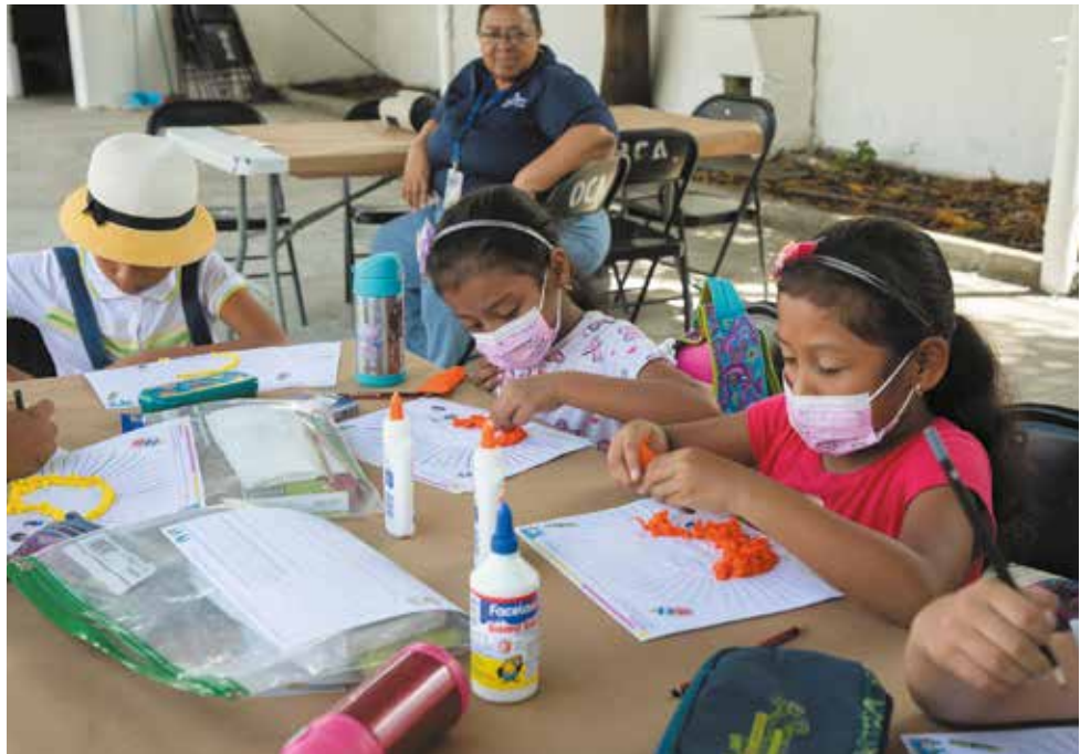
Estas capacitaciones se brindarán en dos jornadas: matutina y vespertina.

Las disciplinas artísticas están al alcance de niños, jóvenes y adultos desde el lunes 16 de enero en los talleres de verano gratuitos que organiza el Ministerio de Cultura (MiCultura) y que se desarrollarán en el Centro Cultural Metropolitano, de lunes a viernes de nueve de la mañana a cinco de la tarde, hasta el 24 de febrero. Residentes de sectores de Panamá Oeste, San Miguelito, Panamá Norte y el centro de la ciudad de Panamá se divertirán aprendiendo a través de diversas disciplinas como piano, guitarra, percusión, folklore, bailes populares, manualidades y reciclaje. Los adultos mayores también tendrán la oportunidad de recibir clases de guitarra y canto, lo cual les brindará la oportunidad de explorar y desarrollar sus talentos. La ministra de Cultura, Giselle González Villarrué, destacó la importancia