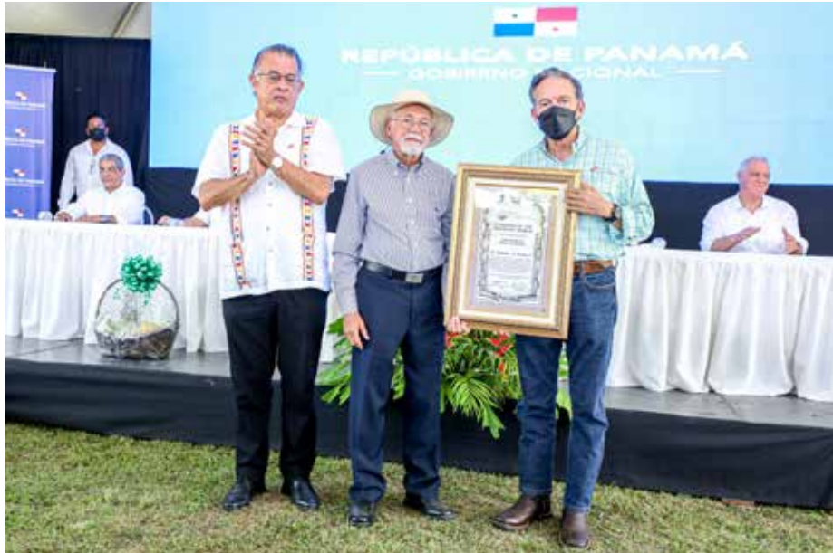
El mandatario recalzó que es un día histórico porque es la primera ley de Política Agroalimentaria de Estado en Panamá y en el continente.

Con esta Ley se busca proteger al sector productivo del país de las políticas importadoras con las que se ha visto afectado por anteriores administraciones.