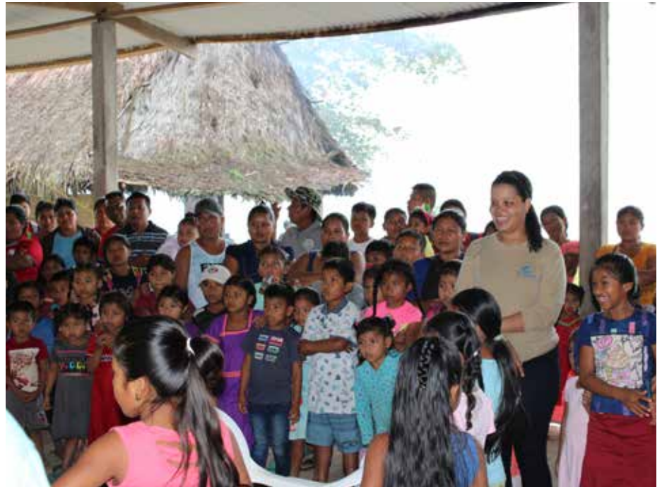
Se compartió con unas 400 personas, entre niños, padres de familia y líderes locales de las distintas comunidades.

Como parte de las actividades de responsabilidad social empresarial de, la Empresa de Transmisión Eléctrica, S.A. (Etesa) celebró en la comunidad de San Pedrito, corregimiento de Jiküi, distrito de Santa Catalina, comarca Ngäbe Buglé, la fiesta de Navidad junto a las comunidades aledañas de Mango, Guabo Arriba, Guabo Abajo, Palo Blanco y Quebrada Bonita. Se compartió con unas 400 personas, entre padres de familia, líderes locales de las distintas comunidades y unos 300 niños y niñas que recibieron sus juguetes, rompieron piñatas y participaron