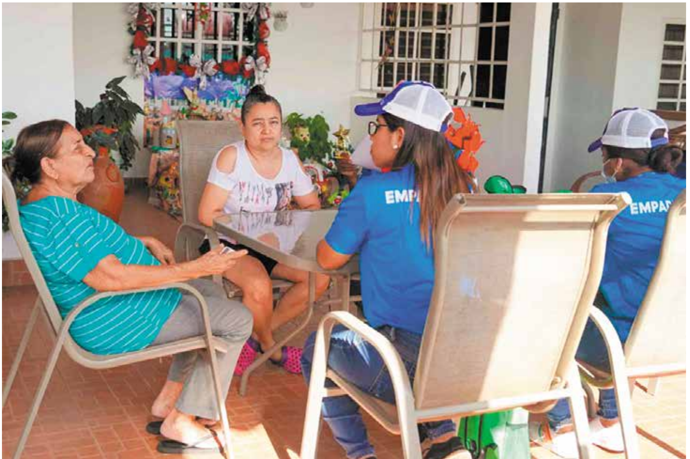
Los empadronadores están vestidos de azul y debidamente identificados con credenciales.