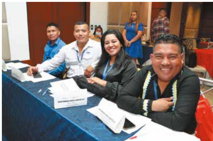
El curso impacta de manera directa a docentes de áreas de difícil acceso con un abordaje integral de los aspectos educativos.