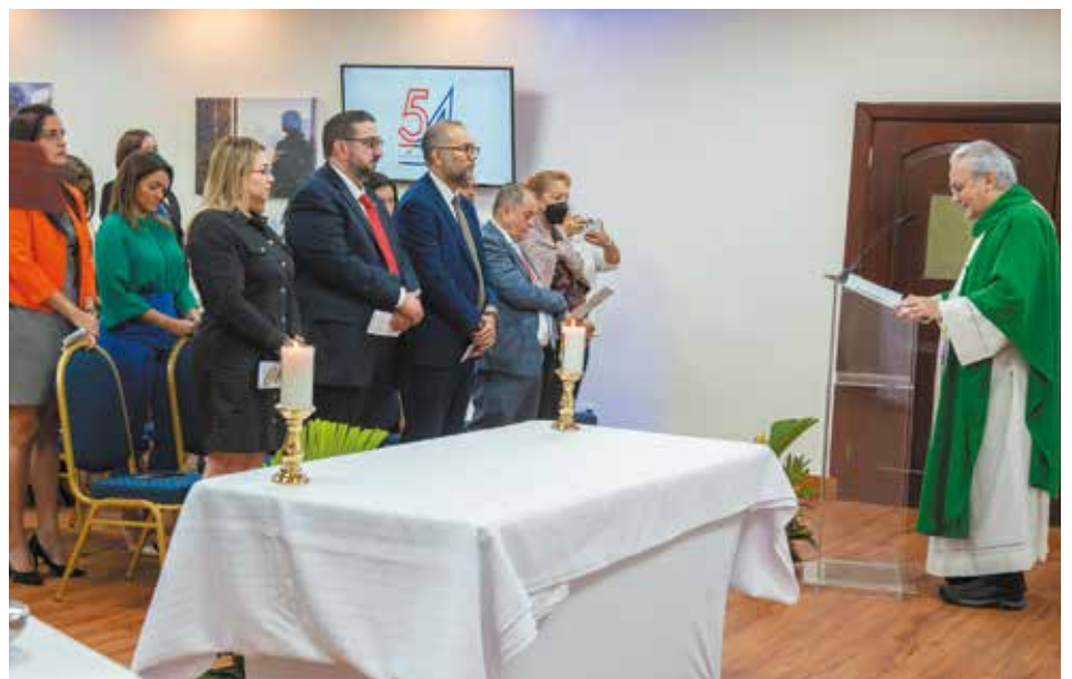
El Mitradel conmemoró sus 54 años con una misa de Acción de Gracias.