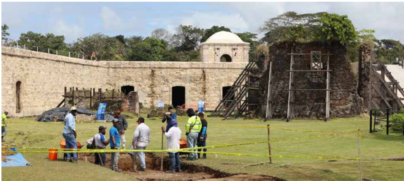
Los fuertes de San Lorenzo y Portobelo conforman las fortificaciones de la costa Caribe de Panamá donde MiCultura ejecuta un programa con fondos del Banco Interamericano de Desarrollo (BID) para lograr su conservación.