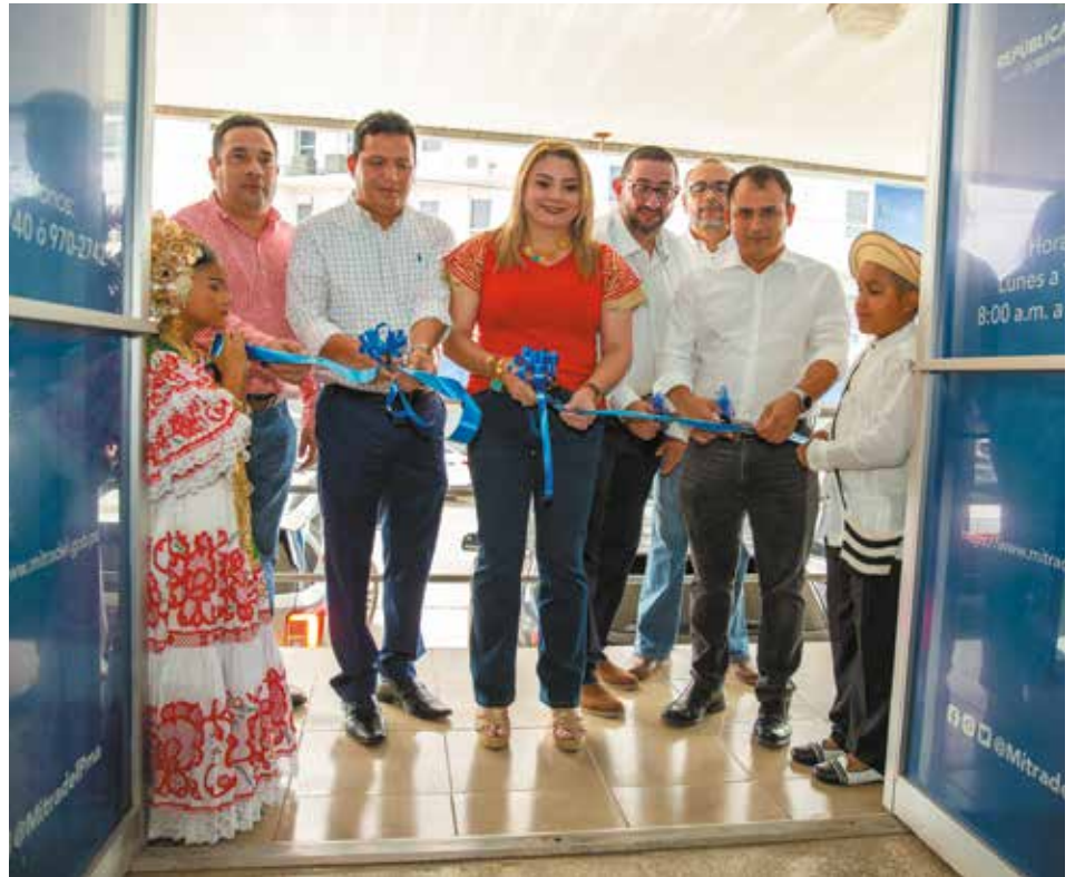
Con estas modernas oficinas se garantiza una buena atención a los usuarios.

En el marco de los 54 años del Ministerio de Trabajo y Desarrollo Laboral (Mitradel), la ministra, Doris Zapata Acevedo, junto a su equipo de trabajo y autoridades locales, inauguró las modernas adecuaciones de las Regionales de Trabajo en las provincias de Herrera y Los Santos. Zapata manifestó que con estas oficinas se garantiza una buena atención a los usuarios, que son el sector productivo del país, y los funcionarios del Mitradel cuentan con las herramientas necesarias para brindar un servicio de calidad. La Regional de Trabajo de Los Santos se ubica en la calle Ramón Mora, en el distrito de Las Tablas; y la Regional de Herrera, en la Plaza Don Fito, calle Belarmino Urriola, en el distrito de Chitré. El Mitradel igualmente conmemoró su aniversario con una misa de acción de gracias, en la que la ministra agradeció a todos los funcionarios por su dedicación y la nobleza de servir a la población. El Mitradel es el máximo regente de la política laboral y proponente de las políticas públicas de empleo, acciones que contribuyen a fortalecer el diálogo social tripartito entre los actores del sector productivo nacional, respetando y garantizando el cumplimiento de las normas contenidas en el Código de Trabajo de manera equitativa y transparente. Esta institución ha experimentado un continuo desarrollo en los componentes de capacitación del recurso humano, la promoción del trabajo decente y la garantía de promover empleos para los ciudadanos.