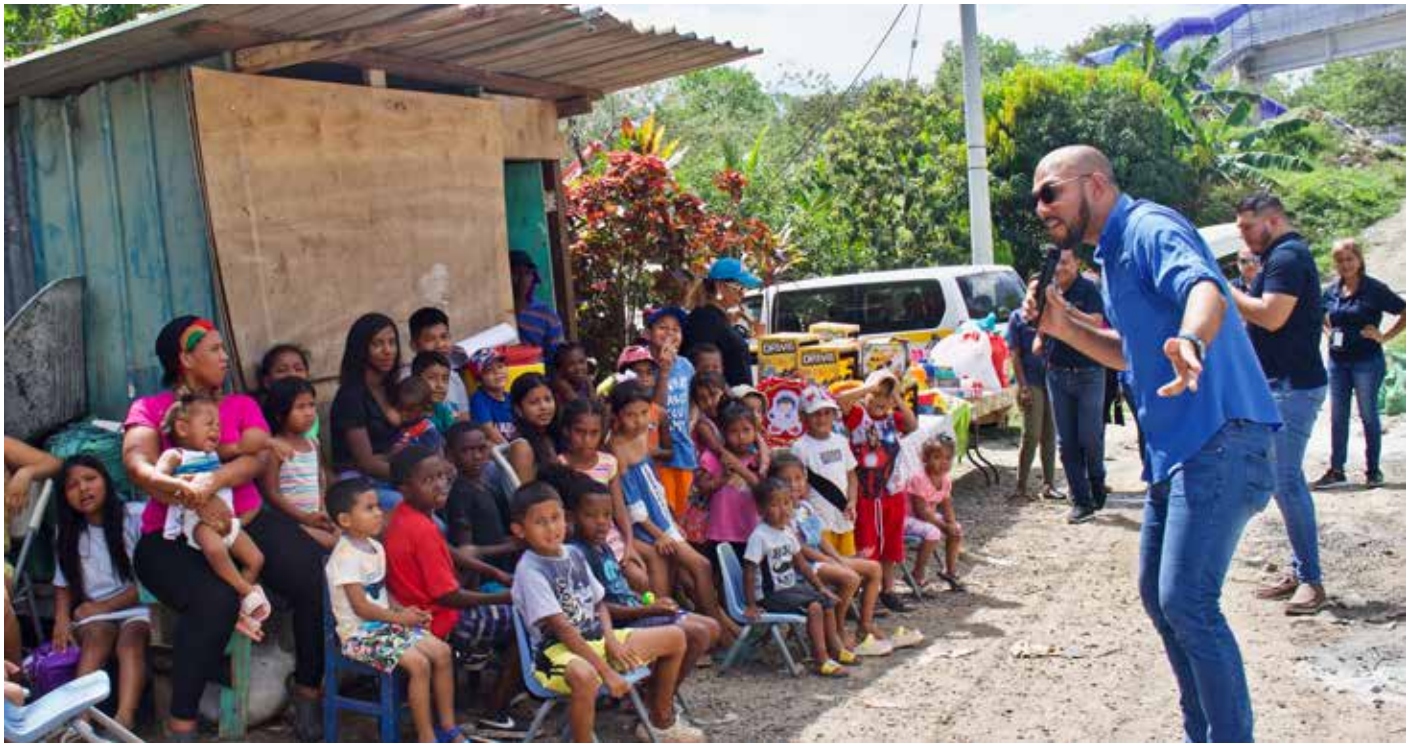
El Mitradel llevó a cabo una jornada de orientación y exposición de profesiones y oficios dirigida a niños de la comunidad La Esperanza, en Kuna Nega.