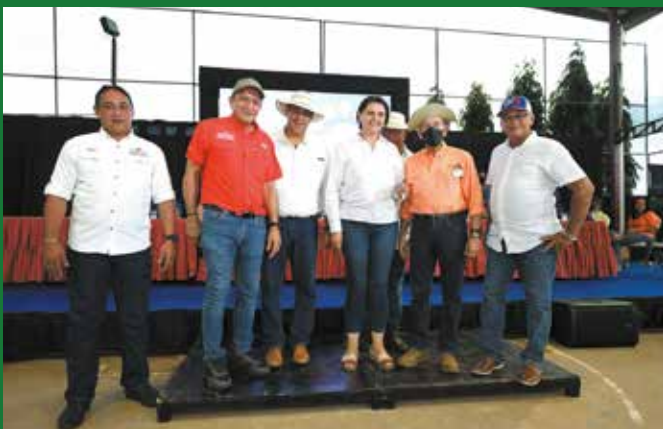
CAMIÓN A JUNTA COMUNAL DE ORIA ARRIBA.