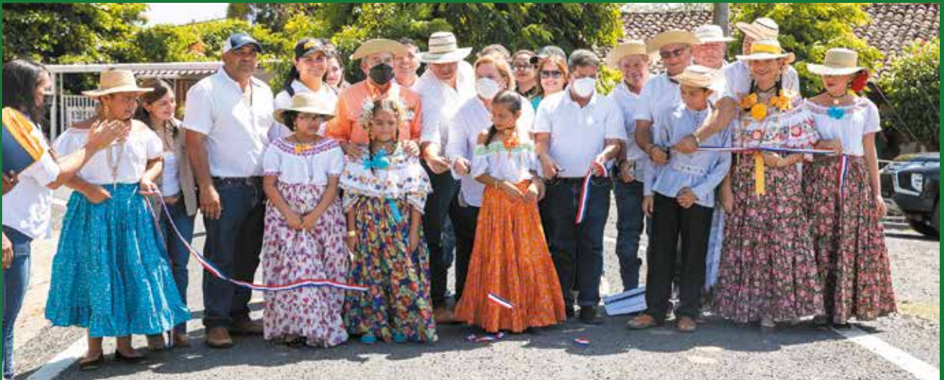
REHABILITACIÓN DE LAS CALLES EN EL CORREGIMIENTO DE LAJAMINA, DISTRITO DE POCRÍ, PROVINCIA DE LOS SANTOS.