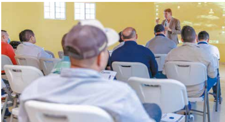
Conversatorio con los agroexportadores panameños.

Europeos interesados por nuestra producción agrícola, en particular por la pitahaya y frutos deshidratados.