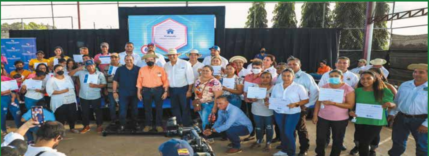
EL MIVIOT ENTREGÓ 40 VIVIENDAS DEL PLAN PROGRESO, 9 UNIDADES BÁSICAS Y UNA MEJORA.