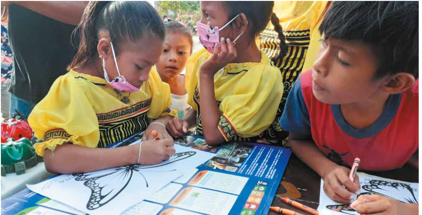
En las cinco ferias interregionales participaron unas 2,490 personas.