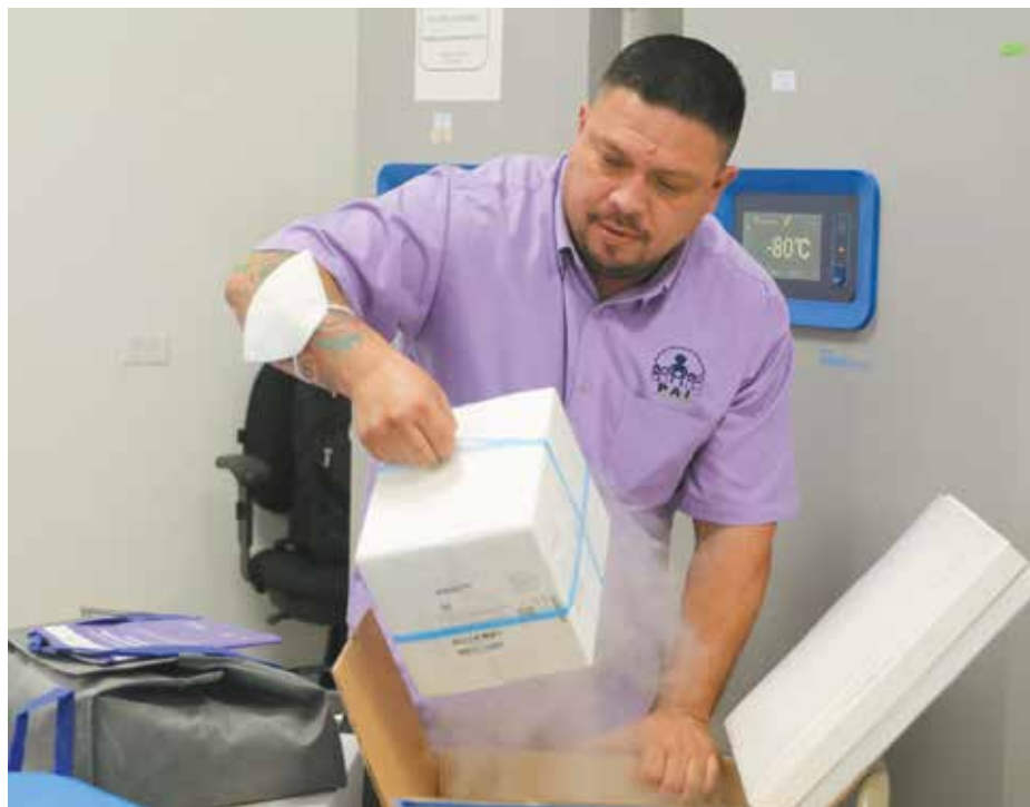
La vacuna bivalente protege contra las variantes del virus de la Covid-19 que circulan en Panamá.

A través de Pfizer, Panamá programa la adquisición de 1.7 millones de dosis de esta vacuna.