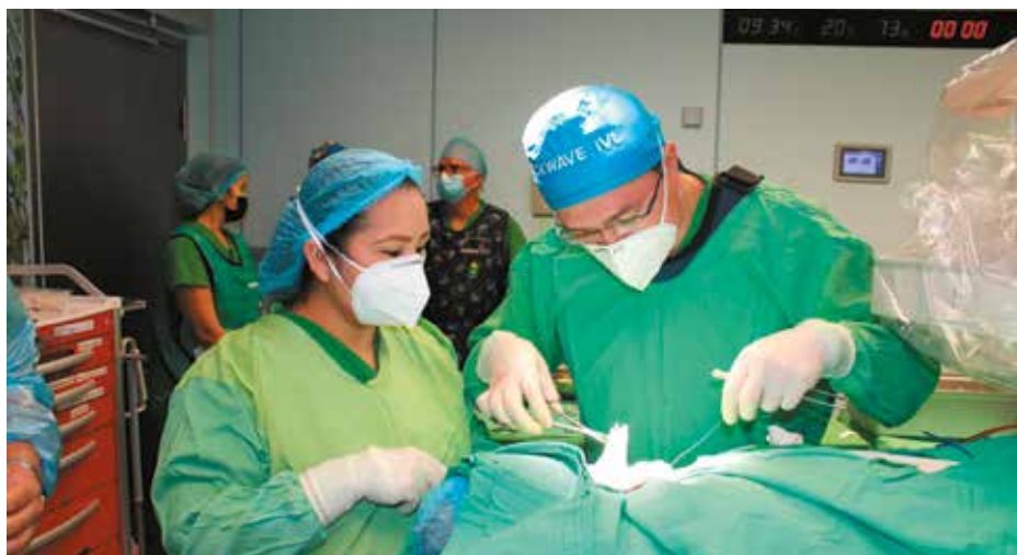
Este centro hospitalario atiende a pacientes asegurados y no asegurados de Veraguas y de otras provincias.