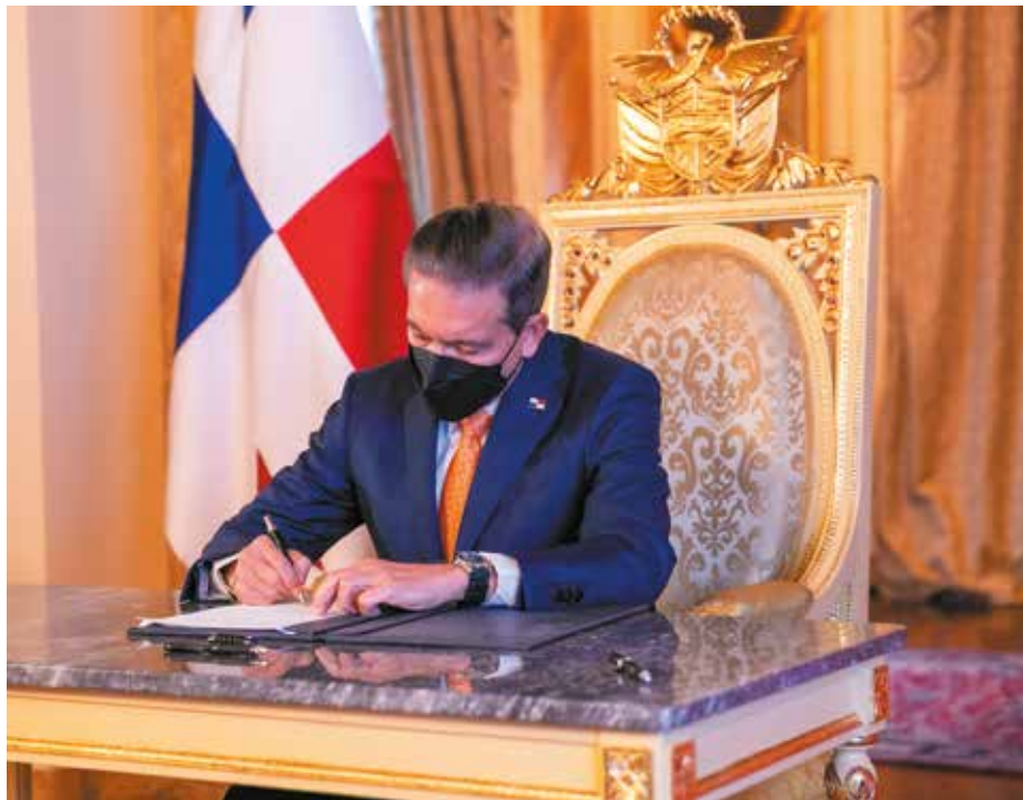
El presidente Laurentino Cortizo Cohen firmó el Decreto Ejecutivo No. 1 del 16 de enero de 2023, mediante el que se declara un listado de medicamentos de la CSS en desabastecimiento crítico, que permite adquirirlos a través de mecanismos expeditos.

El presidente de la República, Laurentino Cortizo Cohen, firmó este lunes el Decreto Ejecutivo No. 1 del 16 de enero de 2023, mediante el cual se declara un listado de 132 medicamentos de la Caja de Seguro Social (CSS) en desabastecimiento crítico, con el fin de que se puedan realizar las compras de estos a través de mecanismos expeditos. Junto con el ministro de Salud, Luis Francisco Sucre, el presidente también firmó el Decreto No. 2 del 16 de enero de 2023, mediante el cual se reglamenta el Observatorio Nacional de Medicamentos de Panamá. Ambos decretos contienen las recomendaciones sugeridas por la Comisión Técnica de Medicamentos, que dirige el vicepresidente y ministro de la Presidencia, José Gabriel Carrizo, y cuya función es buscar fórmulas que permitan que la población tenga acceso a medicamentos de calidad a un menor precio. El citado Decreto No.1 se basa en el Informe No. 6 de diciembre de 2022, en el que la Comisión para la Evaluación