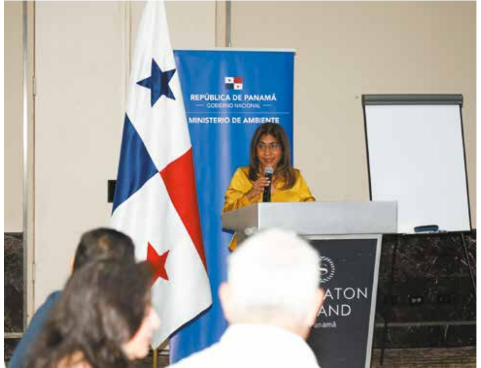
Los mercados de carbono representan una herramienta para que los gobiernos y el sector privado puedan afrontar la crisis climática.

La creación del MNCP ayuda a promover el desarrollo de una economía baja en emisiones, basada en la compra y venta de unidades de reducción de emisiones de gases de efecto invernadero.