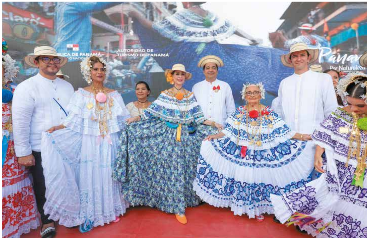
La primera dama, junto a artesanos distinguidos por su aporte a la conservación de la cultura panameña.