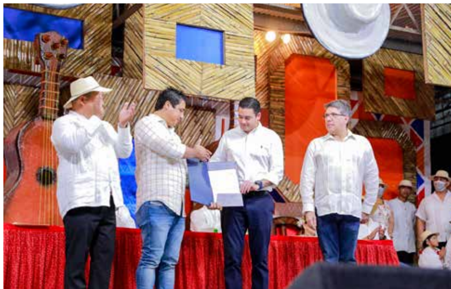
Durante la inauguración de la Feria de San Sebastián, el vicepresidente de la República y ministro de la Presidencia, José Gabriel Carrizo Jaén, entregó la orden de proceder para la ejecución de esta obra.

El vicepresidente de la República y ministro de la Presidencia, José Gabriel Carrizo Jaén, inauguró el 18 de enero la Feria de San Sebastián de Ocú en su edición número 62. Carrizo Jaén señaló que servir a los que más lo necesitan es el propósito que identifica a la actual administración y es lo que se dio en este mismo escenario cuando el presidente de la República, Laurentino Cortizo Cohen, sancionó la Ley de Política Agroalimentaria de Estado, que le dará a nuestros productores garantías de reglas claras que perdurarán en el tiempo. "Esta administración no se cansa de servir y me corresponde el honor de entregar la orden de proceder para la construcción del sistema de abastecimiento de agua potable, sistema de acueducto y alcantarillados de Ocú, en la provincia de Herrera, con un valor de B/.37,503,500", destacó Carrizo Jaén. Esta obra beneficia a 12 mil habitantes de Ocú Centro, y las barriadas El Hatillo, El Tamarindo, La Arañita, Altos del Lago, Bella Vista, El Mamey, El Paraíso, San Isidro, San José, San Sebastián, Santa Marta, Santa Rosa, Bella Esperanza, Guadalupe y Villa Raquel. Este proyecto, gestionado por el IDAAN, contempla la construcción de un sistema de acueducto que mejorará