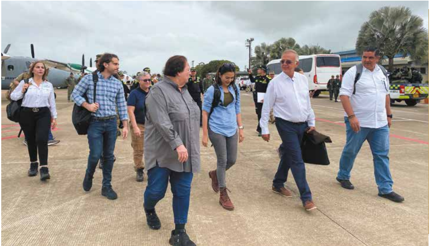
La canciller, Janaina Tewaney Mencomo, y el ministro de Seguridad Pública, Juan Pino, participaron en la Reunión Trilateral Regional (Panamá, Colombia, Estados Unidos) sobre migración.

Con el interés de unir esfuerzos y generar estrategias a nivel regional que aseguren una migración segura, ordenada y humanitaria, la canciller, Janaina Tewaney Mencomo, y el ministro de Seguridad, Juan Manuel Pino, participaron en la Reunión Trilateral Regional (Panamá, Colombia, Estados Unidos). A fin de ejecutar la política exterior y de seguridad nacional, dictada por el presidente, Laurentino Cortizo Cohen, la ministra de Relaciones Exteriores y el ministro de Seguridad