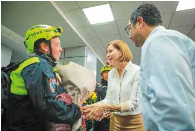
Los rescatistas panameños fueron recibidos en el Aeropuerto Internacional de Tocumen por la Primera Dama de la República Yasmín Colón de Cortizo y el ministro de Gobierno, Roger Tejada.