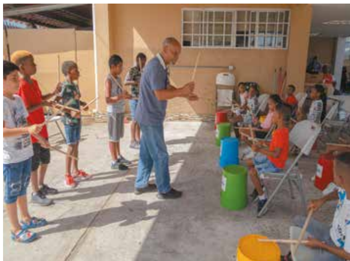
Los participantes se mostraron felices y muy animados con las clases que recibieron.