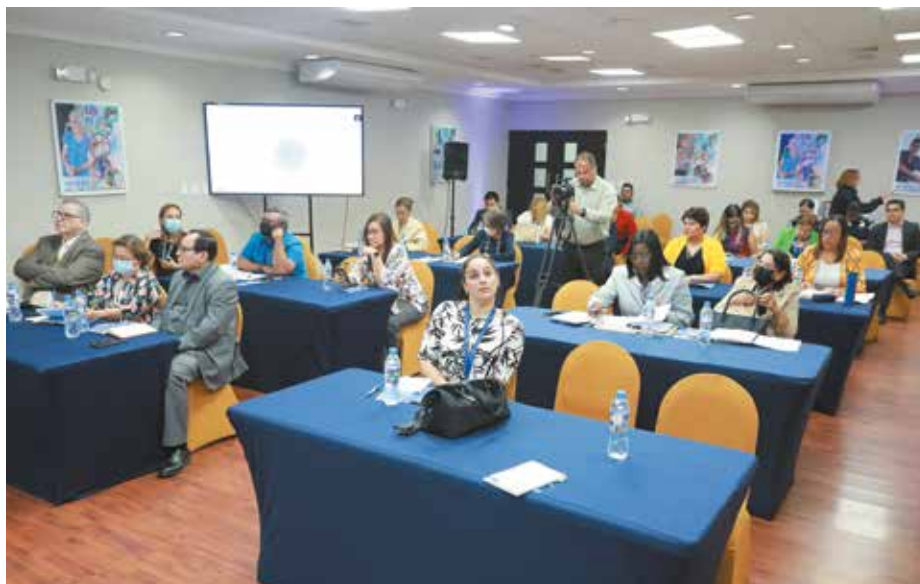
La Comisión de Capacitación y Divulgación de la Ley 285 de 2022 está integrada por 16 instituciones.

En Panamá se estableció una política pública para el reconocimiento y protección de los derechos humanos de los niños, niñas y adolescentes en todo el país.