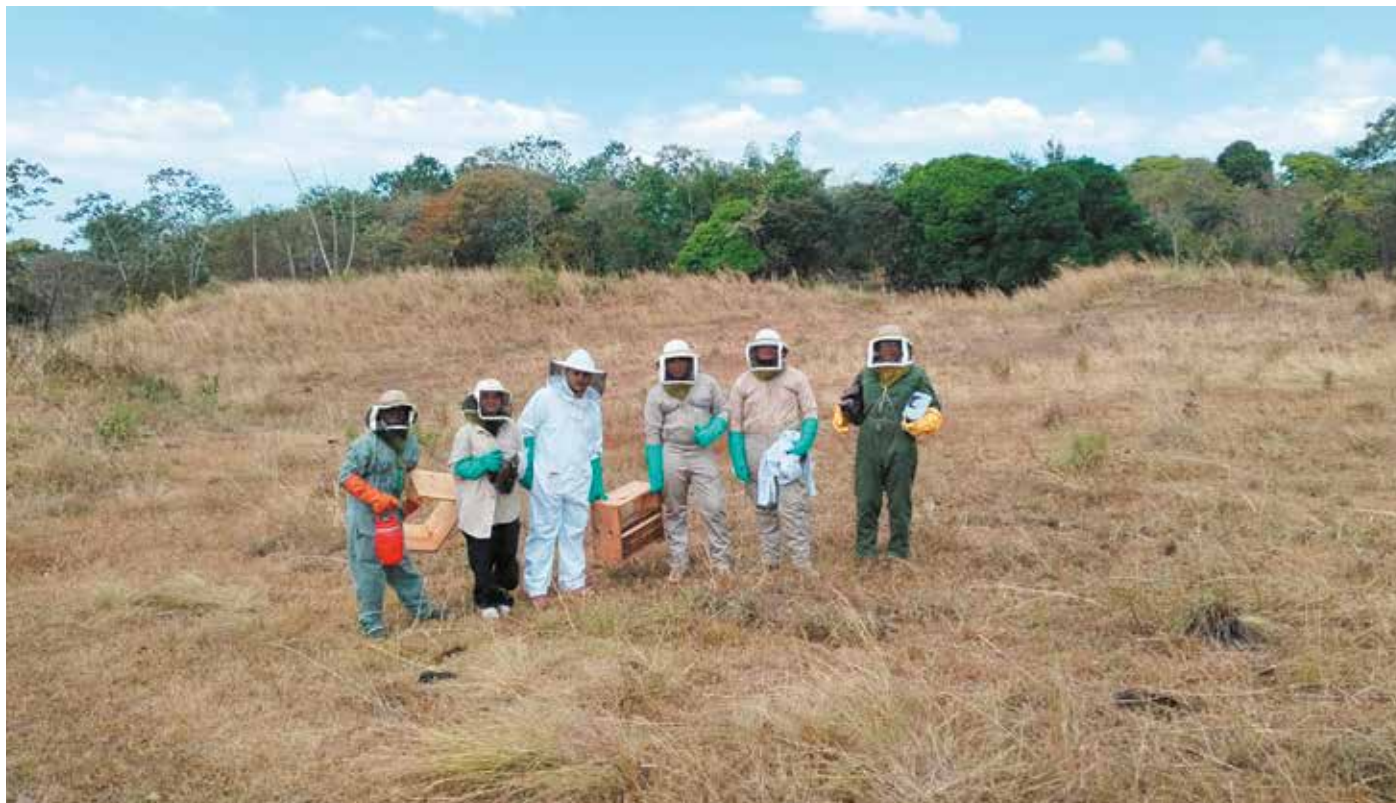
En el adiestramiento participaron 50 jóvenes líderes miembros del Programa Nacional de Juventud Rural (Pronajur) del MIDA.