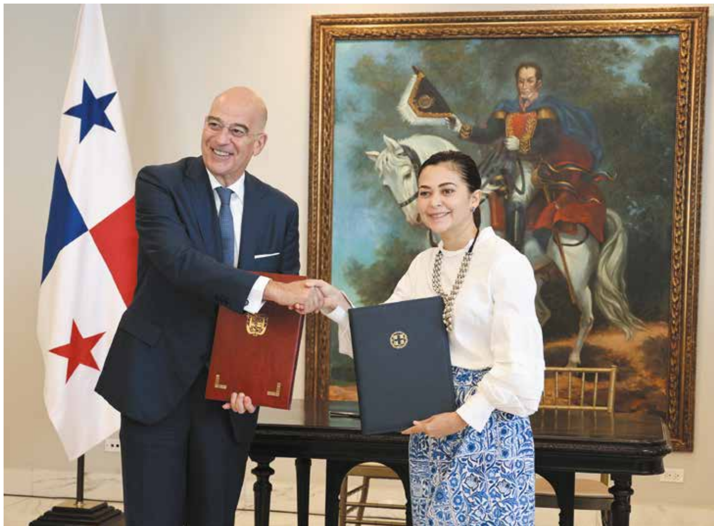
La canciller Janaina Tewaney Mencomo recibió en el Palacio Bolívar al ministro de Relaciones Exteriores de Grecia, Nikolaos - Georgios S. Dendias, de visita oficial en Panamá.