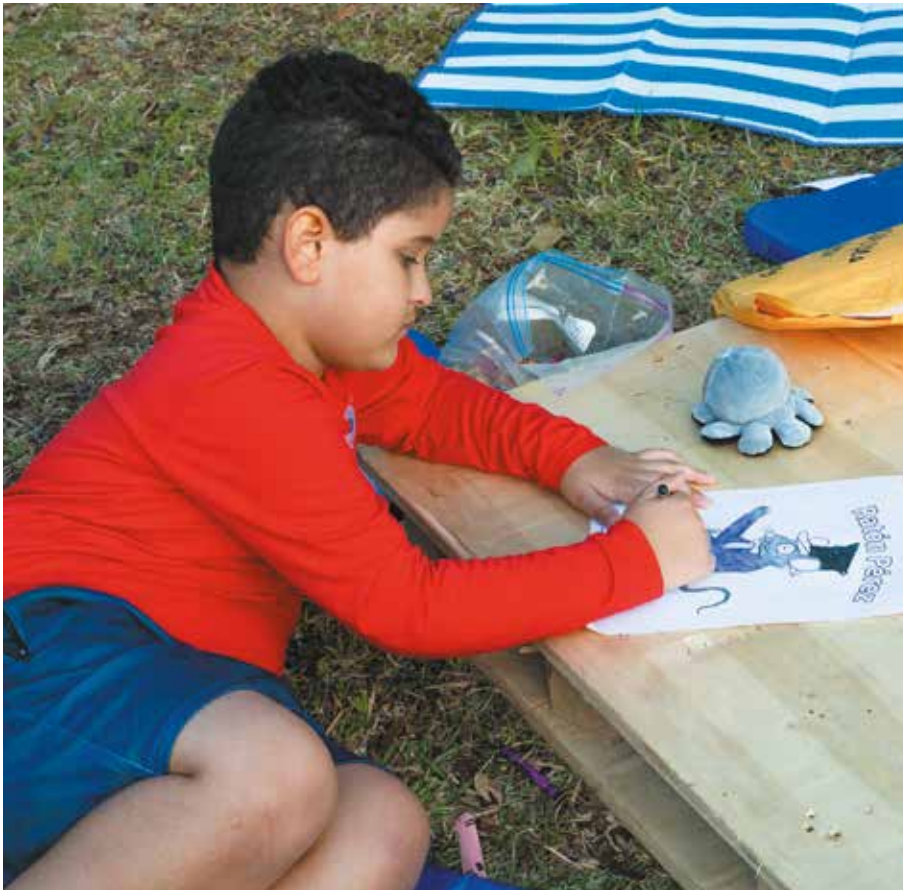
La creatividad y la diversión se apoderaron de la Zona MiCultura en el festival.

Una combinación de arte, música, danza, juegos didácticos, entre otras actividades, ofreció la Zona MiCultura del Ministerio de Cultura como parte de su participación en la décima versión del festival "Musicalion", que se desarrolló en el Parque Omar y se volcó al disfrute de la familia panameña. Los niños que visitaron la Zona MiCultura se divertieron coloreando y conociendo a los personajes de "La Cucarachita Mandinga", así como también personajes con atuendos folklóricos, mientras se tomaban fotos en la pequeña aldea que adornaba el sitio. Muy gustadas fueron también las clases de danza, donde junto a sus padres los niños aprendieron pasos básicos del género salsa, técnicas de musicoterapia y desarrollaron sus habilidades en la percusión con talleres de TanCubo. El viceministro de Cultura, Gabriel González, felicitó a la Fundación Aria, por el desarrollo de esta actividad gratuita y familiar, reiteró el apoyo de MiCultura a todas las iniciativas que resalten la cultura en todas sus manifestaciones y agradeció al público por asistir y apoyar estas actividades. Durante cuatro días, diversas temáticas como folklore, bandas sonoras, espacios para artistas emergentes y "rock" de la década de los 80 se apoderaron del Anfiteatro del Parque Omar, destacando una vez más a "Musicalion" como el evento veraniego familiar por excelencia.