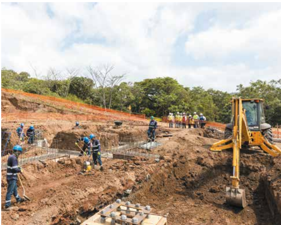
El proyecto tiene una longitud de poco más de 46 kilómetros y lleva un avance de más del 40%.