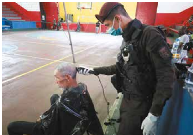
La jornada abarcó el área de la vía España, por la avenida Samuel Lewis y calle Ricardo Arias; además de Obarrio y vía Argentina.