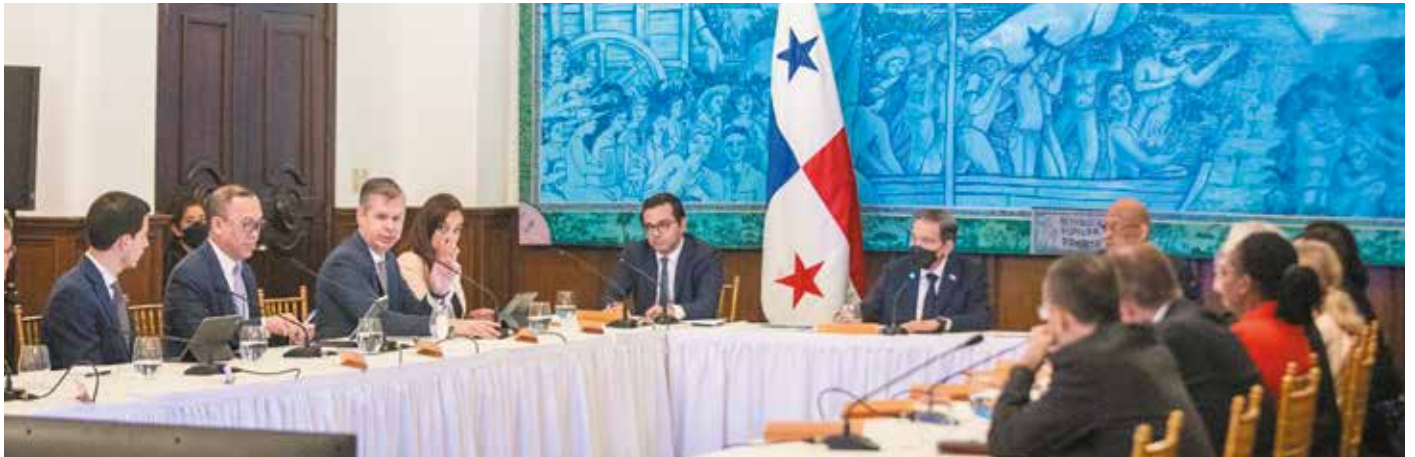
Los ejecutivos sostuvieron reuniones con autoridades, sector privado y financiero.