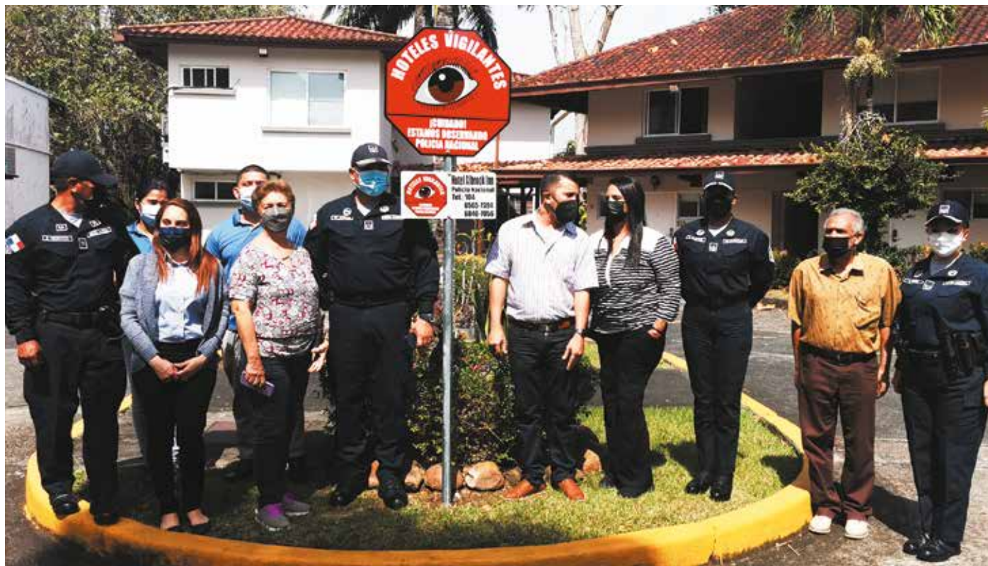
La Policía Nacional trabaja de la mano con 139 hoteles que forman parte del programa Hoteles Vigilantes.