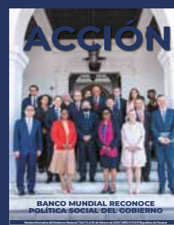
Foto de portada: Delegación del Banco Mundial se reunió con el presidente Laurentino Cortizo Cohen.

Revista informativa del Gobierno Nacional Órgano informativo digital interinstitucional Teléfono (507) 527-9537