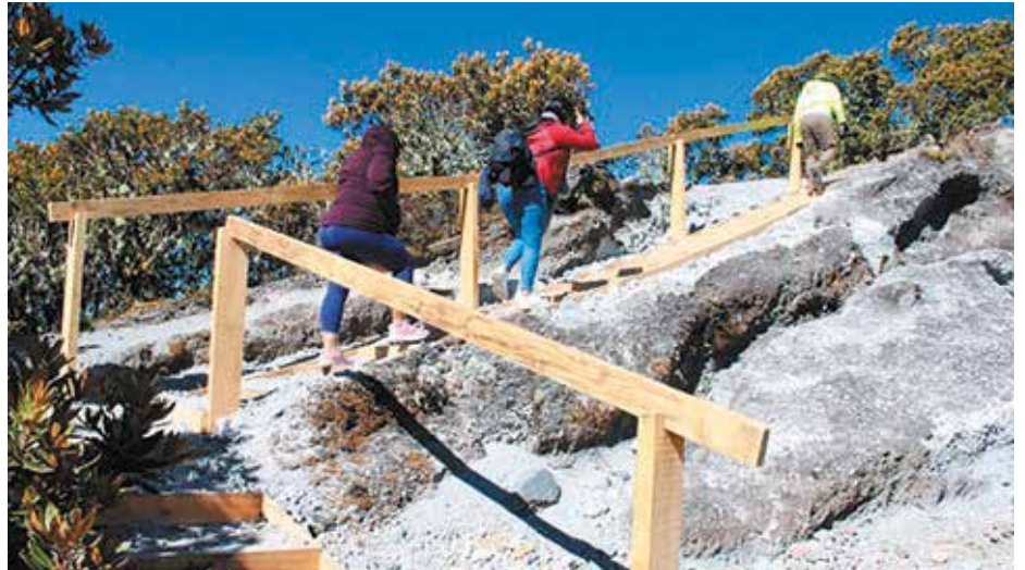
El sendero Los Llanos tiene una longitud de 7.4 kilómetros y un turista con buenas condiciones físicas demora entre 6 a 8 horas realizando el ascenso.