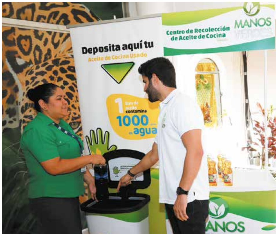
En el taller participaron los colaboradores de las diferentes secciones de la regional de MiAmbiente en esa provincia.

La iniciativa busca generar un cambio de actitud, a fin de que las personas hagan una correcta disposición de esta sustancia y evitar la contaminación de las fuentes hídricas y contaminación al ambiente.