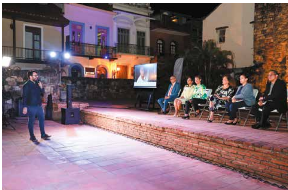
Acompañaron a la ministra de Cultura, los directores de Las Artes y de Economía Creativa, entre otros.

En la actividad participaron, entre otros, productores teatrales, músicos, bailarines y cantantes.