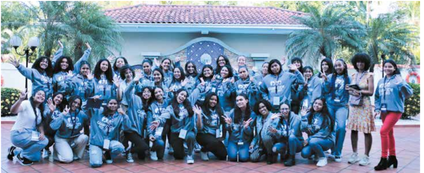
El programa Camptech contó con participantes de Bocas del Toro, Colón, Coclé, Chiriquí, comarca Ngäbe-Buglé, Darién, Herrera, Panamá Oeste, Panamá y Veraguas.