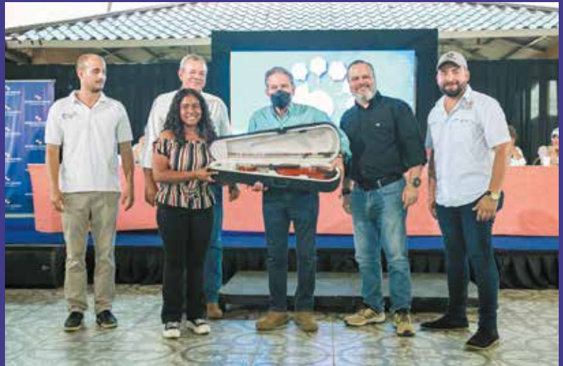
APOYO A JÓVENES TALENTOSOS.