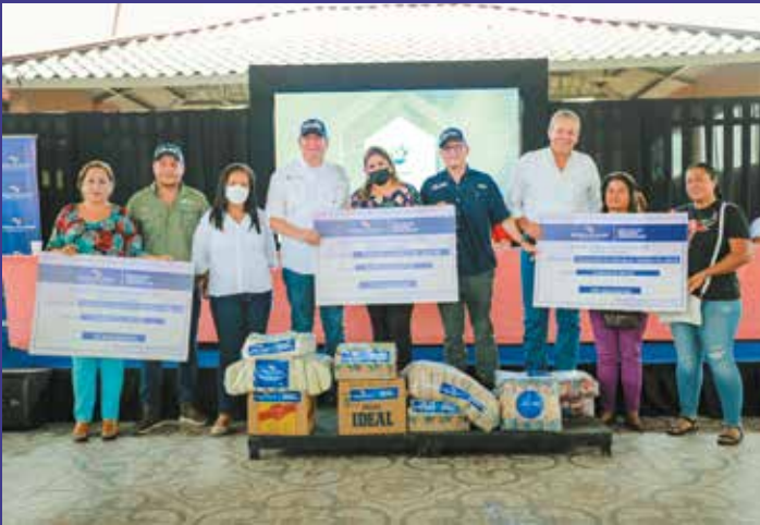
ALIMENTOS PARA ESCUELAS Y FUNDACIONES.