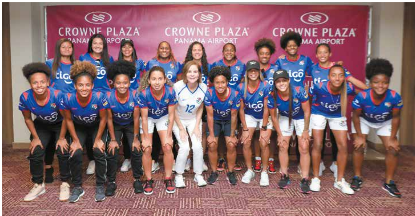
La primera dama de la República reconoció el esfuerzo de las futbolistas panameñas.

La primera dama de la República, Yasmín Colón de Cortizo, recibió a la Selección Femenina de Fútbol a su llegada al hotel, procedentes de Nueva Zelanda, tras clasificar al Mundial Femenino de Fútbol Australia - Nueva Zelanda 2023. Colón de Cortizo expresó su emoción al recibir a las jugadoras y reconoció el esfuerzo y espíritu de cada una de ellas. Las jugadoras agradecieron el apoyo a la primera dama y por acompañarlas en este momento memorable. La primera dama acompañó a las chicas en su desayuno de bienvenida y celebró junto a ellas la clasificación de Panamá al Mundial Femenino de Fútbol Australia - Nueva Zelanda 2023, un hecho histórico al ser la primera vez que se logra esta hazaña. Próximamente, las