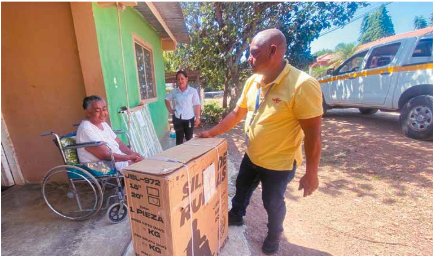
El Despacho de la Primera Dama realizó las entregas a personas con algún tipo de discapacidad en esas regiones del país.