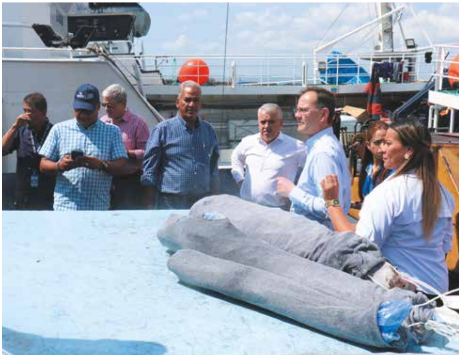
En el puerto de Vacamonte, la delegación de la FAO observó las descargas que se realizan de los productos del mar.