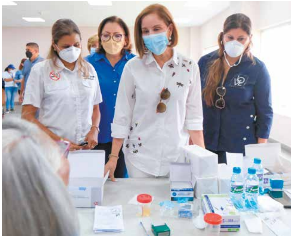
En esta actividad participaron 18 instituciones.

El Despacho de la Primera Dama de la República, liderado por Yasmín Colón de Cortizo, desarrolló, en conjunto con el Ministerio de Salud (Minsa), la Feria integral Salud y Bienestar en Tu Comunidad, en el Complejo Deportivo de Los Andes No.2, para beneficio de unas 2,000 personas del distrito de San Miguelito. El Minsa brindó servicios de medicina general, pediatría, laboratorio (pruebas de VIH y embarazo), nutrición (peso y talla), odontología (exámenes y promoción de salud bucal), enfermería (toma de presión arterial), vacunación a niños y adultos (esquema completo de vacunación). También hubo atención veterinaria con vacunación de mascotas y desparasitación. El Despacho de la Primera Dama llevó atención a la población del distrito de San Miguelito con dos de sus programas: "Salud Sobre Ruedas", con los servicios de mamografía, electrocardiograma, papanicolau e implante subdérmico anticonceptivo, y "Ver y Oír para Aprender", que realizó tamizaje visual a niños con posterior entrega de lentes medicados, y para adultos mayores de 40 años con entrega de lentes de lectura. La actividad contó con la participación de 18 instituciones, entre ellas, el Instituto de Mercadeo Agropecuario (IMA), que realizó venta de productos agropecuarios a través de su agroferia; la Autoridad del Tránsito y Transporte Terrestre (ATTT), que ofreció arreglos de pago de boletas arriba de B/.100.00 y cobro de boletas ya registradas.