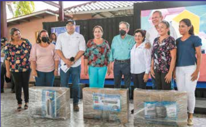
EQUIPOS PARA PLANTELES EDUCATIVOS.