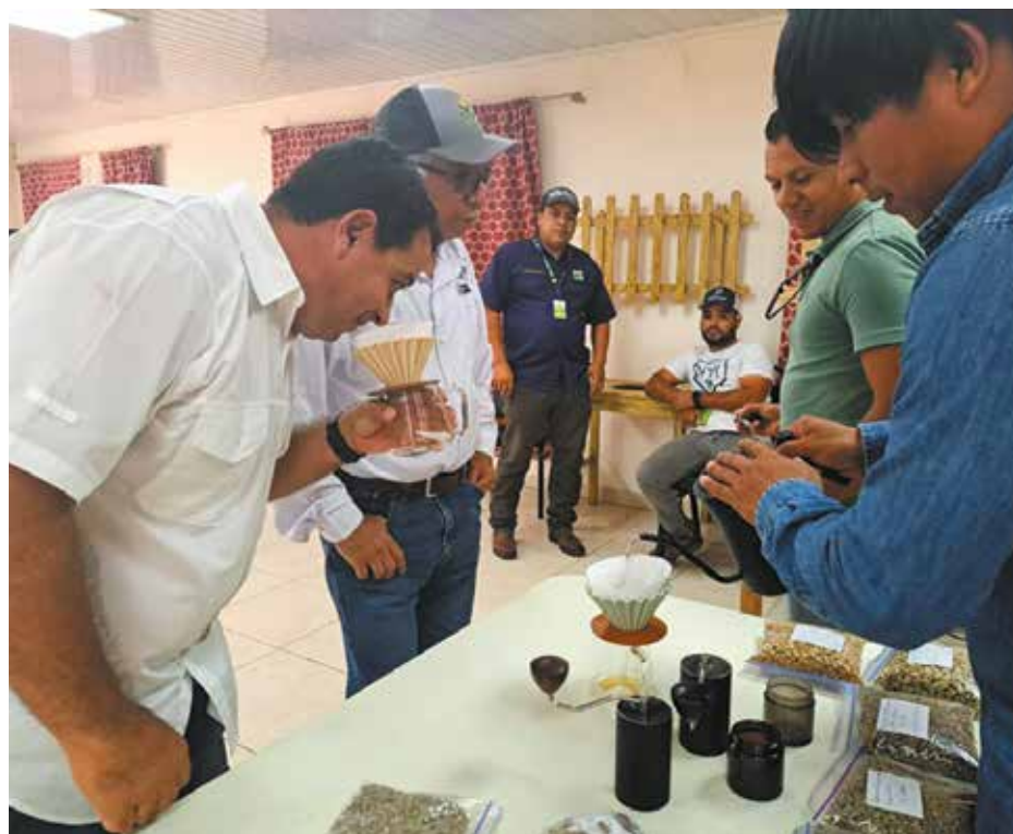
Aspectos de la catación de 11 muestras de café.

Como parte del plan estratégico para impulsar el desarrollo integral de la caficultura en la comarca Ngäbe Buglé, técnicos del Ministerio de Desarrollo Agropecuario (MIDA) realizaron un ciclo de reuniones con el interés de acercarse y tener mejor comunicación con las asociaciones y cooperativas de esta región del país. Los técnicos del MIDA se reunieron con miembros de la Asociación de Caficultores Orgánicos Ngäbe (ASCON), Asociación de Productores de Tierras Altas de Hato Chamí (APATACH), Asociación de Productores Agroartesanal Ngäbe de Besikó y Cooperativa de Servicios Múltiples Ngäbe Buglé, R.L. Uno de los puntos planteados fue el alto costo de producción que requiere una hectárea de café y la mitigación