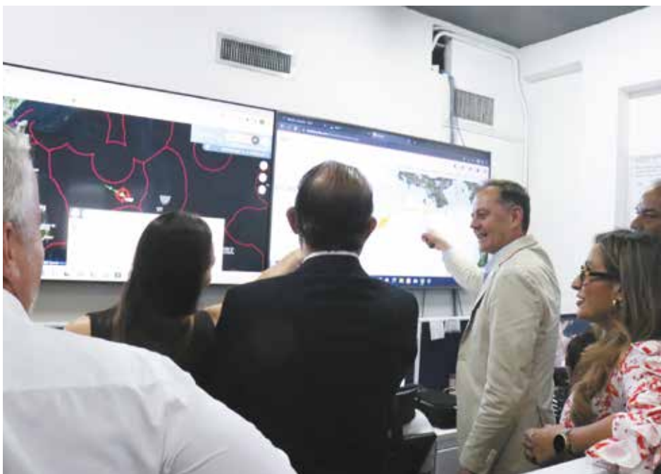
Los representantes del organismo de la ONU expresaron su satisfacción por los avances logrados por Panamá.