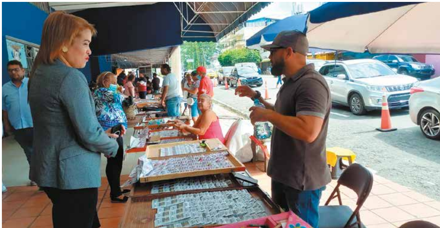
La comercialización de "Lotto" y "Pega 3" no suplantarán ni afectará la venta de la lotería tradicional de chances y billetes.