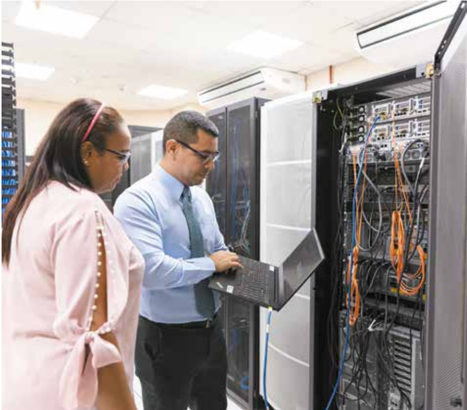
Se destacan los sistemas ERP, que es para la Gestión Financiera, y el Máximo, para la Gestión de Mantenimiento de activos eléctricos.

La estatal Empresa de Transmisión Eléctrica, S.A. (Etesa) se mantiene a la vanguardia en el manejo e intercambio de data y sistemas de alta disponibilidad con los cuales se garantiza la satisfacción al cliente a través de la confiabilidad, credibilidad, planificación y transparencia. Con un moderno centro de datos, mantiene la Red de Comunicaciones el Centro Virtual y equipos físicos siempre en línea, garantizando el acceso a los principales sistemas, como lo son el ERP, que es para la Gestión Financiera, y el Máximo, para la Gestión de Mantenimiento de activos eléctricos, entre otros gestores de bases de datos, con los cuales en el año 2022 se ejecutaron alrededor de 4,500 órdenes de trabajo. La implementación de esta tecnología garantiza la confiabilidad de la misión de Etesa. Este centro de datos cuenta con sistemas de seguridad de última generación, como el de acceso biométrico, de reconocimiento facial y de huellas dactilares, así como de cámaras con sensores de movimiento, sensores de humedad, detectores de humo y un moderno sistema antiincendio, piso falso y el más reciente proyecto, el cual reemplazó el equipo de respaldo eléctrico, que cuenta con nuevos arreglos de baterías, pantallas modernas de monitorización y más tiempo de sostenibilidad en caso de emergencias, además de la redundancia eléctrica, que es parte del propio sistema.