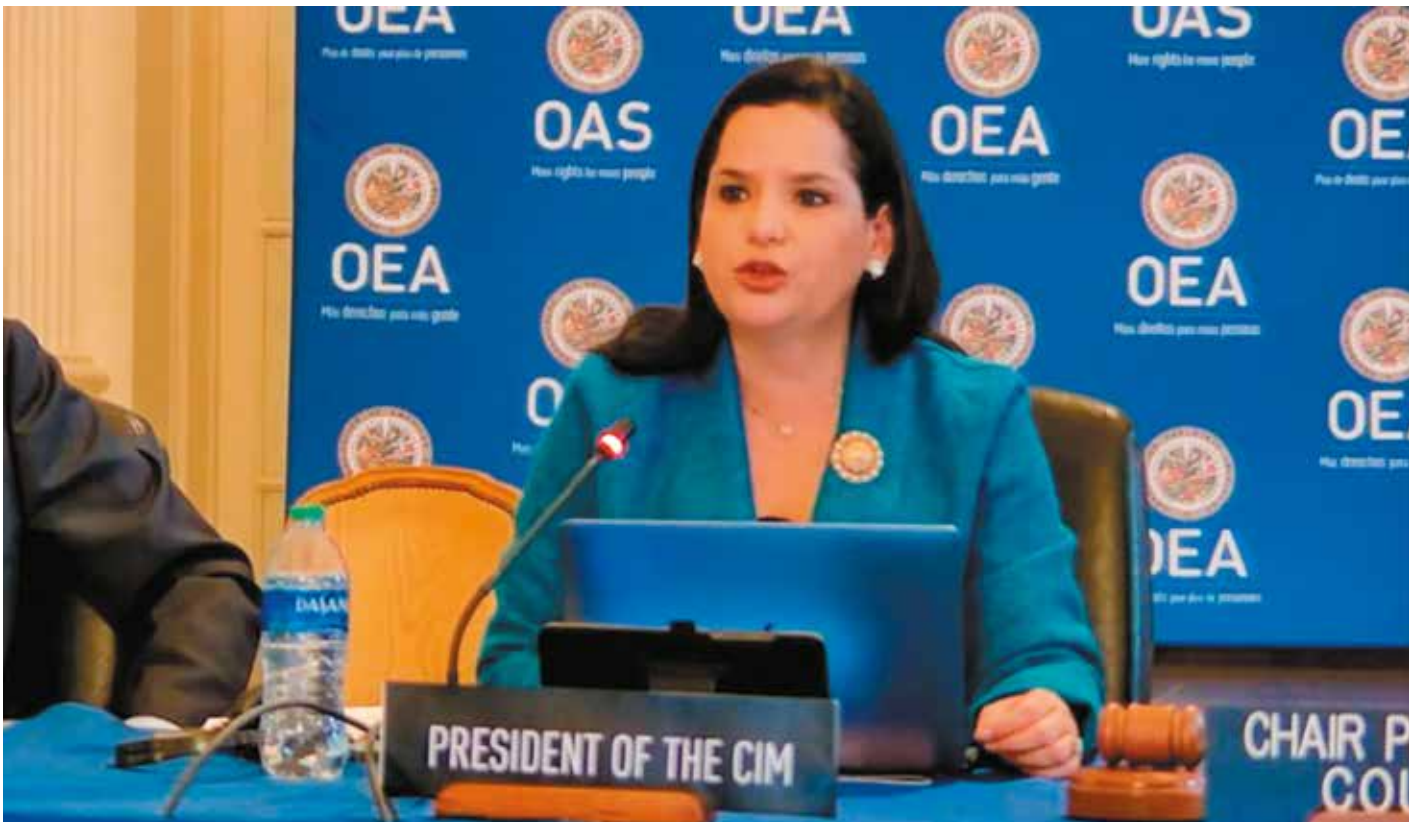
En calidad de presidenta de la CIM, la ministra María Inés Castillo dio las palabras de bienvenida y apertura del evento.