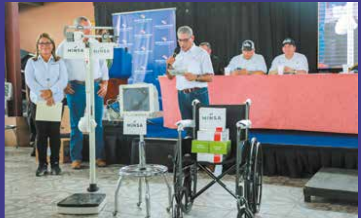
INSUMOS PARA CENTROS DE SALUD.

COMUNIDADES: SANTIAGO, MONTIJO, ATALAYA, MARIATO Y RÍO DE JESÚS.