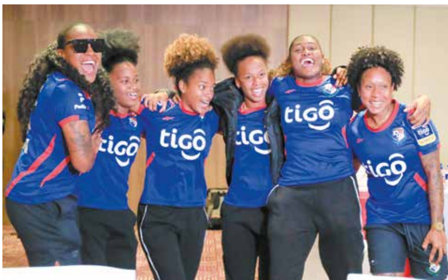
Las jugadoras agradecieron el reconocimiento tras su clasificación al Mundial Femenino de Fútbol Australia - Nueva Zelanda 2023.

La primera dama de la República, Yasmín Colón de Cortizo, recibió a la Selección Femenina de Fútbol a su llegada al hotel, procedentes de Nueva Zelanda, tras clasificar al Mundial Femenino de Fútbol Australia - Nueva Zelanda 2023. Colón de Cortizo expresó su emoción al recibir a las jugadoras y reconoció el esfuerzo y espíritu de cada una de ellas. Las jugadoras agradecieron el apoyo a la primera dama y por acompañarlas en este momento memorable. La primera dama acompañó a las chicas en su desayuno de bienvenida y celebró junto a ellas la clasificación de Panamá al Mundial Femenino de Fútbol Australia - Nueva Zelanda 2023, un hecho histórico al ser la primera vez que se logra esta hazaña. Próximamente, las