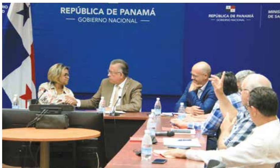
El Gobierno Nacional lleva a cabo las acciones, a fin de que los productores nacionales tengan acceso al mercado norteamericano.

Se busca el acuerdo entre todas las partes, para que luego de 47 años se logre exportar carne panameña al norteamericano país.