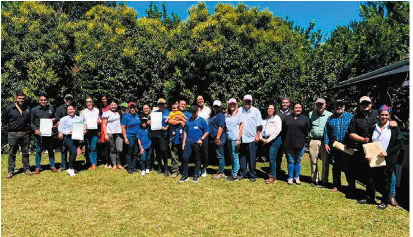
Dueños de fincas agroturísticas certificadas.