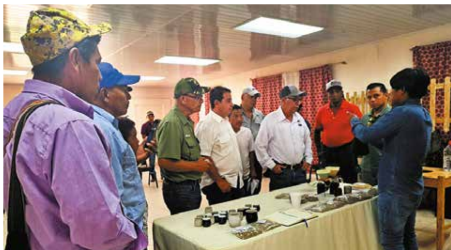
Las comercializadoras están interesadas en hacer negocios con los productores de café de la comarca Ngäbe Buglé.

manera autosostenible, por lo que es imprescindible incorporar insumos como fertilizantes, insecticidas y fungicidas orgánicos para nutrir y controlar de forma integrada las plagas y enfermedades con productos libres de químicos. Se dijo que se necesita renovar las plantaciones con variedades resistentes a plagas y enfermedades con un porcentaje importante de vejez, con bajo rendimiento, además de otras limitaciones, como lo son la susceptibilidad a plagas y enfermedades como la roya del café, ojo de gallo y algunos nematodos.