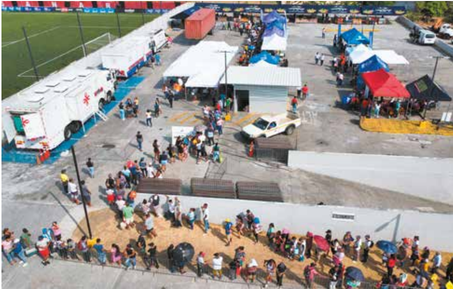
En la actividad se ofreció, entre otros, servicios de medicina general, pediatría y laboratorio.