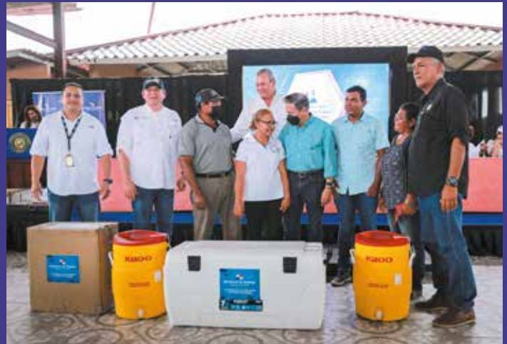
INSUMOS A PRODUCTORES Y PESCADORES.