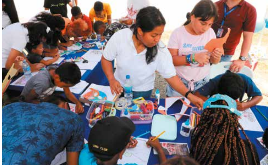
Hubo talleres de creatividad y manualidades.

Con una nutrida concurrencia, se realizó en el Centro Cultural Metropolitano el "Festival de las Artes", donde unos 200 niños y adolescentes mostraron lo aprendido en los talleres de diferentes disciplinas artísticas que ofreció el Ministerio de Cultura (MiCultura). Durante el festival, que marcó la clausura de los talleres de verano, participaron las diferentes direcciones nacionales de MiCultura, así como emprendedores que tuvieron la oportunidad de ofrecer sus artesanías y gastronomía. Hubo talleres de teatro, música con diferentes instrumentos, danza, ballet, folklore, bailes congo y pintura, entre otras disciplinas. Al evento asistieron estudiantes del Ministerio de Cultura de Penonomé, Colón y San Miguelito, entre otros. El festival cerró con la presentación de la Red de Orquestas del área metropolitana, que interpretó melodías como "Carmen" y "El suspiro de una fea".