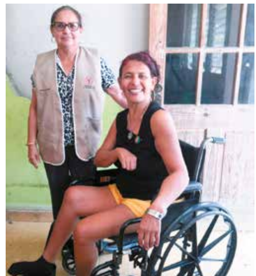
Entre los implementos se proporcionaron sillas de ruedas y enseres básicos.

Las oficinas de enlace del Despacho de la Primera Dama continúan brindando apoyo médico y social a familias de escasos recursos y a personas con discapacidad. Recientemente, en la comunidad La Concepción, corregimiento de Pocrí, provincia de Los Santos, se llevó beneficio a tres personas, dos de ellas con discapacidad. En el corregimiento de La Palma, se benefició a cuatro personas, dos con discapacidad. Mientras que, en el corregimiento de Llano de Piedras, Macaracas, recibieron asistencia otras tres personas, una con discapacidad. Por otro lado, en la provincia de Herrera se realizaron entregas en los distritos de Chitré, Las Minas y Océ, también a personas con alguna discapacidad y de bajos recursos. Asimismo, se equipó el comedor de la Escuela Sabino Figueroa, del corregimiento de Chepo, en Las Minas de Herrera. Entre las ayudas que recibieron todas estas familias, integradas por alrededor de 50 personas, están: sillas de ruedas, camas, colchones, estufas eléctricas y enseres básicos.