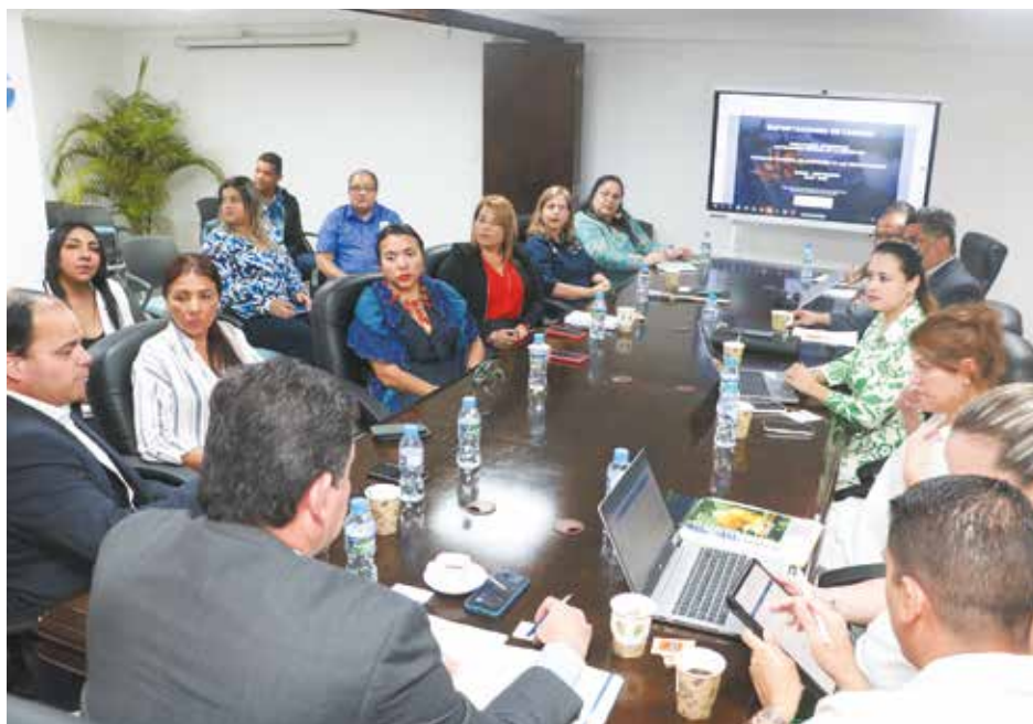
Representantes del gremio buscan que los trámites de exportación sean cada día más ágiles y efectivos.