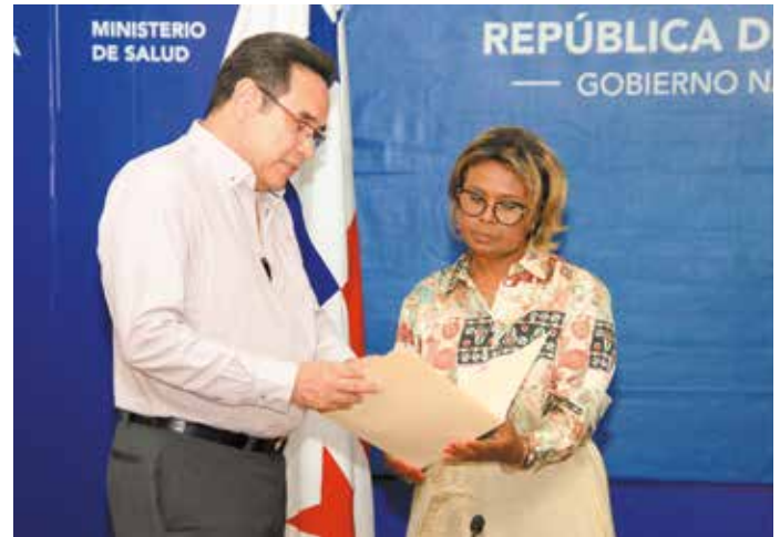
Los funcionarios reiteraron a los productores de carne nacional la intención del Gobierno del presidente Laurentino Cortizo Cohen, de lograr la aprobación de la exportación de carne a la unión americana.