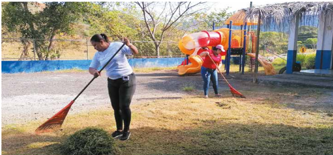
Se desarrollaron tareas de corte y barrido de césped, limpieza de salones y mobiliario.