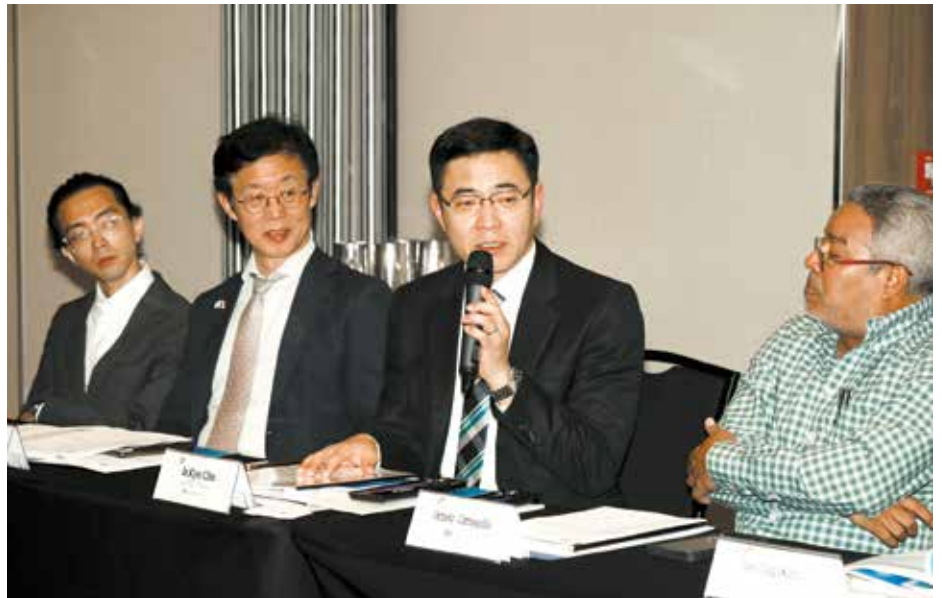
Este intercambio de conocimiento entre ambos países es una gran oportunidad para fortalecer el sector forestal productivo.

El programa posibilitará desarrollar y promover el sector forestal con criterios para incrementar la restauración de suelos degradados con una vocación forestal y manejo sostenible.