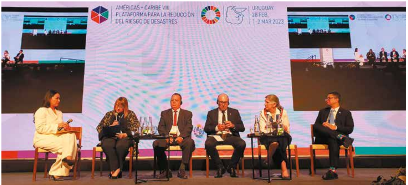
La VIII Plataforma Regional para la Reducción del Riesgo de Desastres fue organizada por el Gobierno de Uruguay.