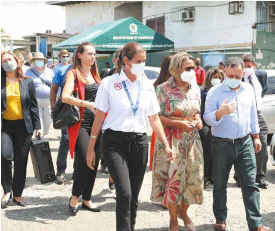
Las autoridades de Salud visitaron el Centro de Salud de Veranillo, donde les mostraron a delegados del Banco Mundial el beneficio de este sistema.