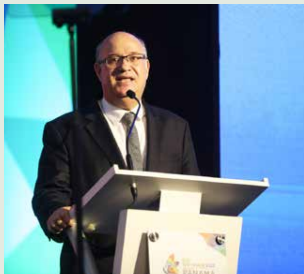
Ilan Goldfajn, presidente del BID.

Nacido en Haifa (Israel) y formado en Río de Janeiro y el MIT estadounidense, fue electo presidente del Banco Interamericano de Desarrollo (BID) el 20 de noviembre de 2022, cargo que asumió el 19 de diciembre del mismo año. Goldfajn, quien habla con fluidez inglés, portugués, español y hebreo, fue director del Departamento del Hemisferio Occidental del Fondo Monetario Internacional (FMI) en 2022. Además, fue gobernador del Banco Central de Brasil (BCB) de 2016 a 2019 y su director de 2000 a 2003. En 2017, fue nombrado “Banquero central del año” por la revista “The Banker”. El año siguiente, la revista “Global Finance” lo designó “Mejor banquero central”. Su experiencia en el sector privado incluye puestos clave en instituciones financieras de Brasil: economista jefe y socio de Itaú Unibanco, y presidente del Consejo Asesor de Credit Suisse Brasil. También ha desempeñado diversas funciones como consultor en instituciones públicas como el Banco Mundial, las Naciones Unidas y el FMI. Cuenta con un doctorado en Economía por el Massachusetts Institute of Technology (MIT), una maestría en Economía por la Pontificia Universidad Católica y licenciatura en Economía por la Universidad Federal, ambas en Río de Janeiro, Brasil.