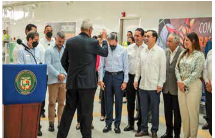
El presidente de la República, Laurentino Cortizo Cohen, y autoridades del Metro de Panamá participaron de la inauguración del nuevo ramal de 2 kilómetros de extensión y que comprende dos estaciones: una en el ITSE y otra en el Aeropuerto Internacional de Tocumen.