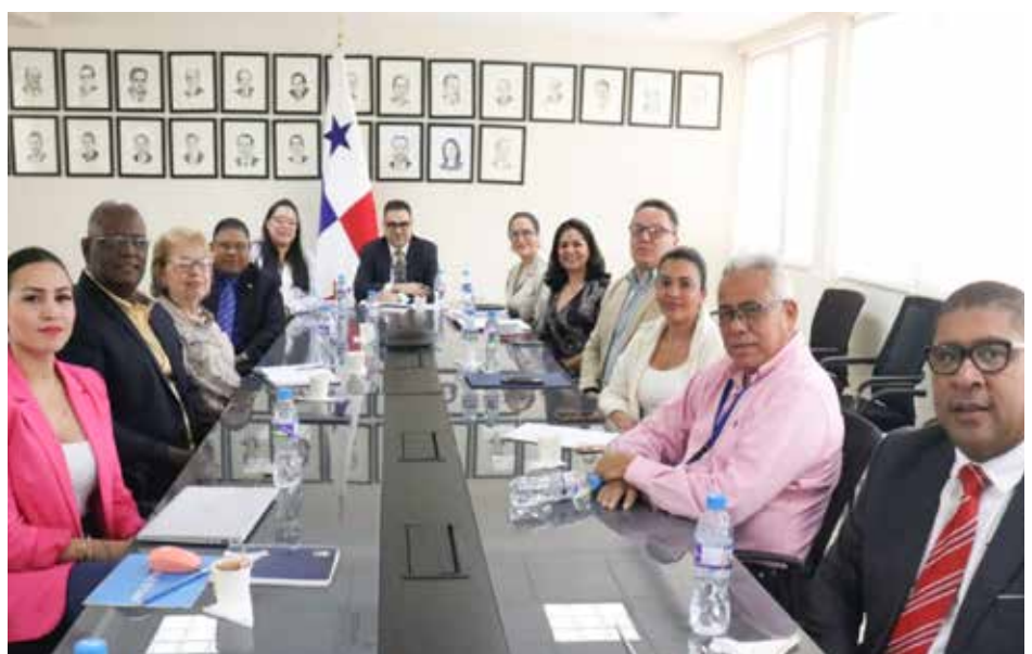
El trabajo del equipo interinstitucional, que se mantiene en permanente coordinación para enfrentar el delito, ha sido arduo pero gratificante.

que coincidieron en manifestar los importantes avances del país en la lucha contra esta mala práctica.