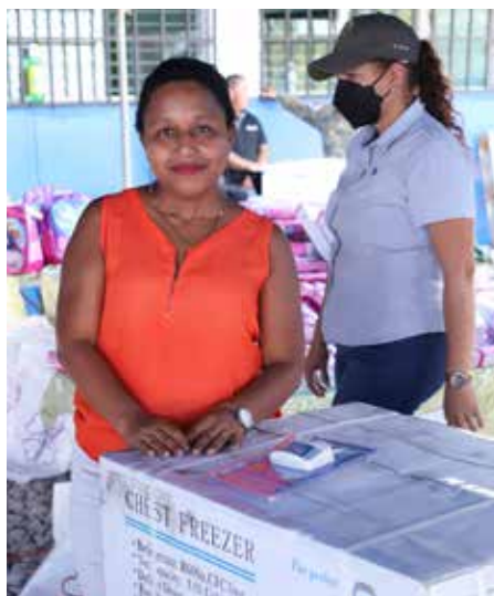
Unas 151 familias fueron beneficiadas con entregas de leche, pañales, congeladores para emprendimientos, mochilas y artículos escolares, entre otras donaciones.

El Despacho de la Primera Dama de la República, liderado por Yazmín Colón de Cortizo, realizó, el 14 de marzo, una gira de asistencia social en la comunidad de Bijagual, ubicada en el corregimiento cabecera de Antón, provincia de Coclé, beneficiando a más 500 personas. Durante la gira, se desarrolló una feria interinstitucional en el Centro de Educación Básica General de Bijagual, donde unas nueve entidades presentaron su oferta de productos y servicios, entre ellas el Ministerio de Salud, que brindó atención de vacunación, pediatría, medicina general, odontología, colocación de implante anticonceptivo, toma