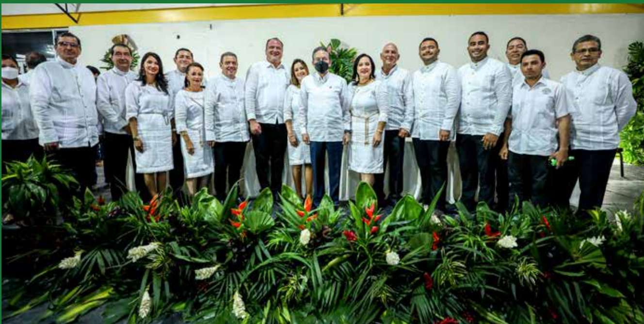
INAUGURAN FERIA INTERNACIONAL DE DAVID.