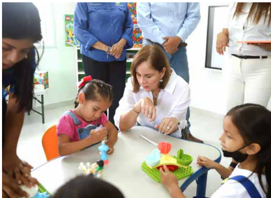
La primera dama compartió con los niños de los CAIPI de Bijagual y Guabas Abajo de Antón.