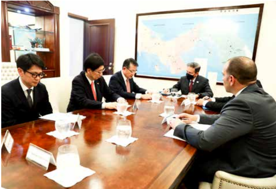
Japón es el tercer usuario del Canal de Panamá.