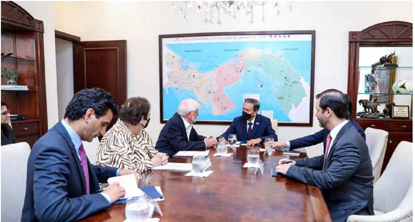
Dodd aprovechó su estancia en el país para reunirse también con líderes regionales de la banca y finanzas, así como con funcionarios panameños.