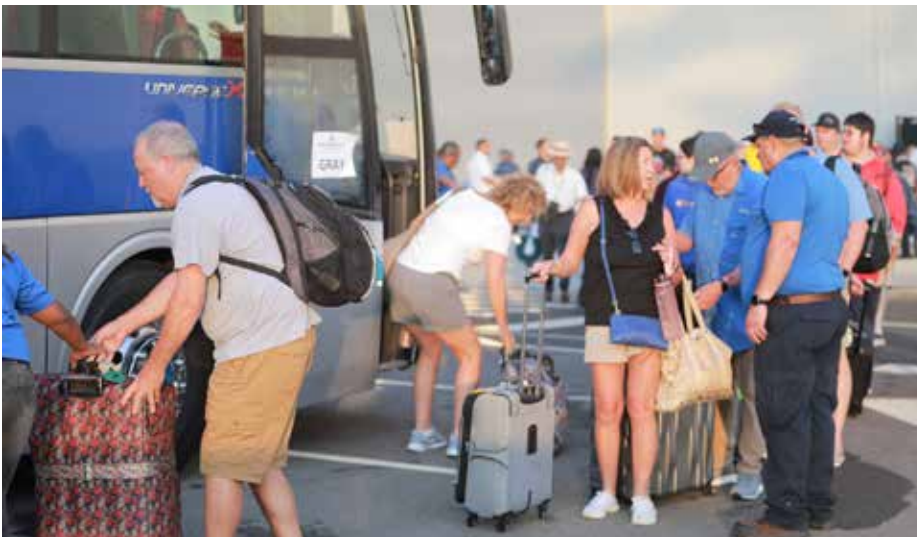
Los viajeros que visitan nuestro país durante la operación “puerto casa” del crucero, gastan en promedio por día unos B/.250.00.

Entre el sábado 11 y domingo 12 de marzo, llegaron al país 7,254 turistas nacionales y extranjeros en los cruceros Norwegian Jewel, Norwegian Sky y Celebrity