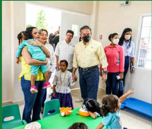
EL CENTRO ATENDERÁ A 35 NIÑOS Y NIÑAS.