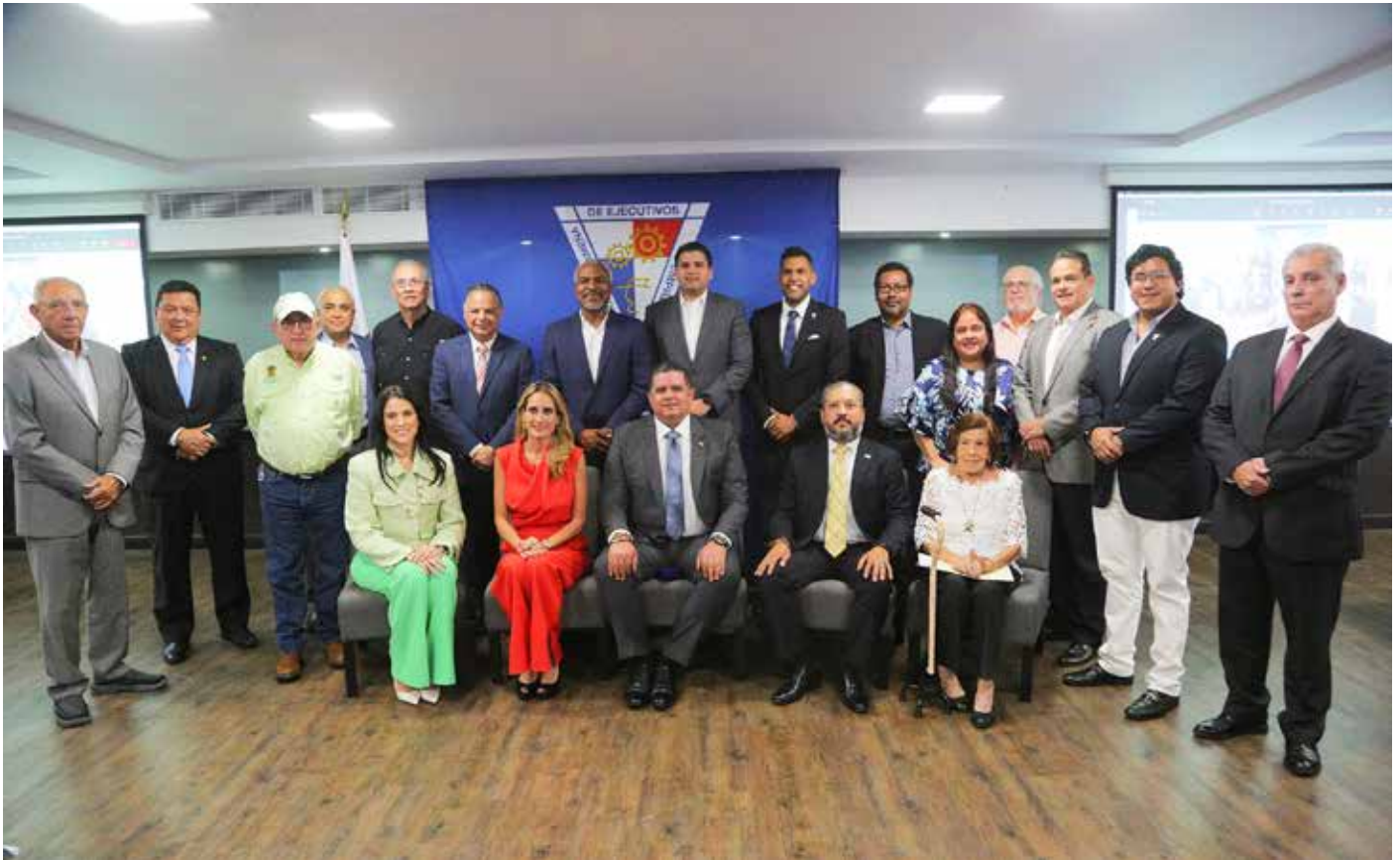
La propuesta de ley tiene más de un año de estar en la Asamblea Nacional de Diputados.