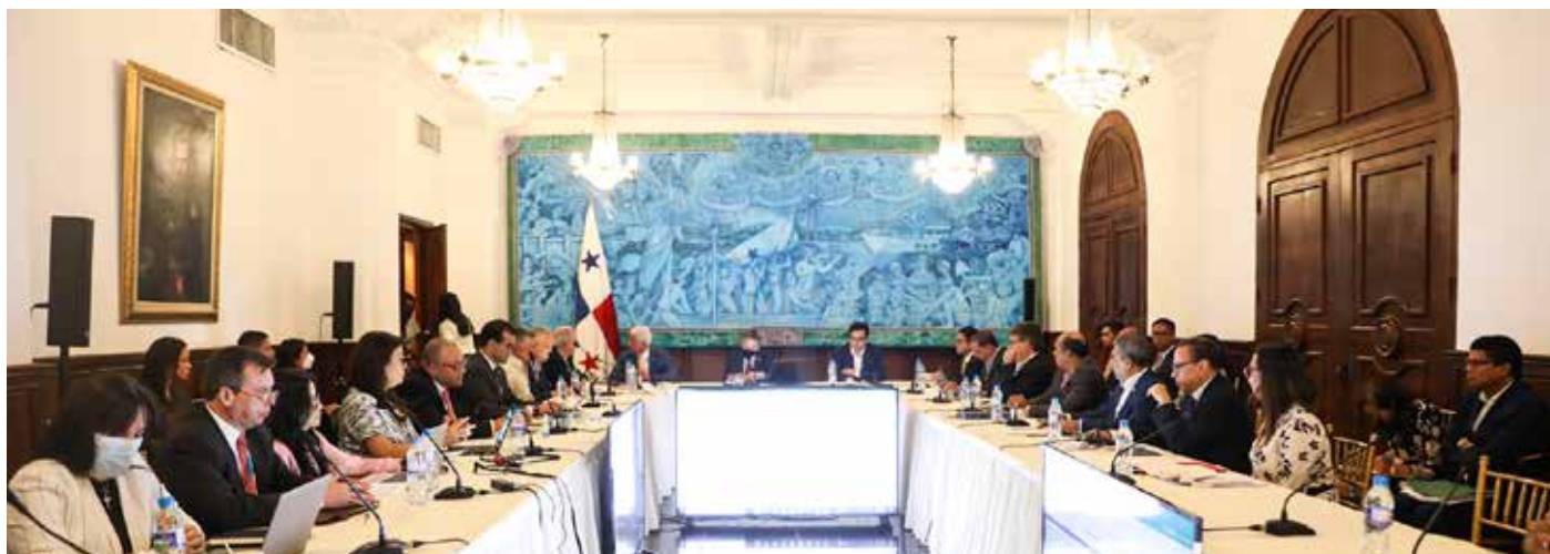
El presidente de la República, Laurentino Cortizo Cohen, presidió la reunión en la que participaron ministros y directores de entidades.