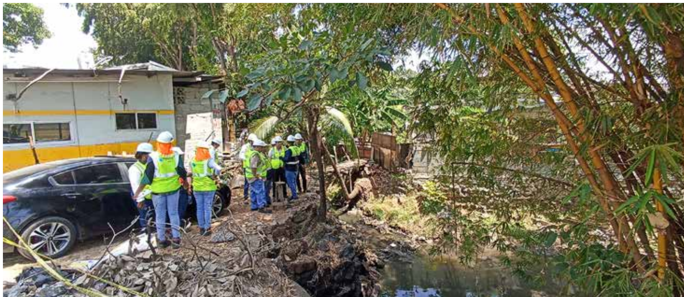
Se busca eliminar tanques sépticos, letrinas y vertidos ilegales en el sector de San Fernando, en Juan Díaz.