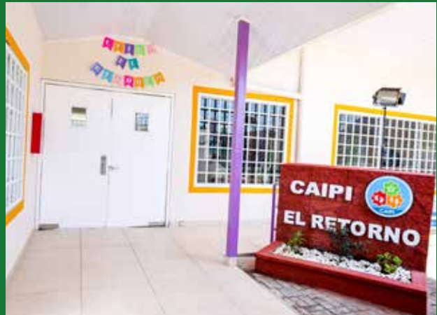
UN CENTRO QUE FAVORECERÁ A LA COMUNIDAD.