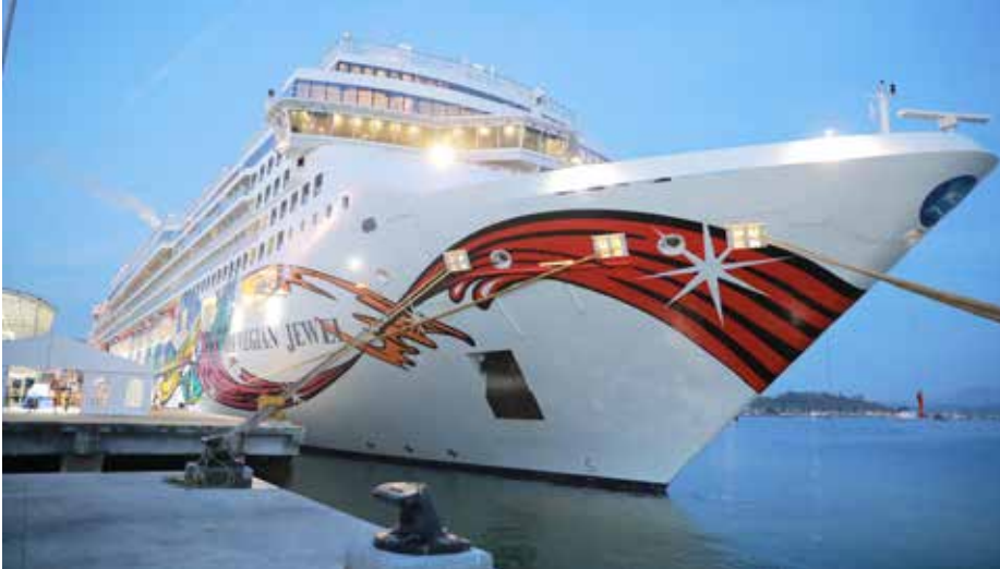
Los buques llegan al Puerto de Cruceros de Amador, de ciudad de Panamá, y a la Terminal de Cruceros Colón 2000.

La naviera Norwegian Cruise Line confirmó que el “home port” de Panamá sigue siendo uno de los favoritos de los cruceristas por la experiencia de transitar el Canal.