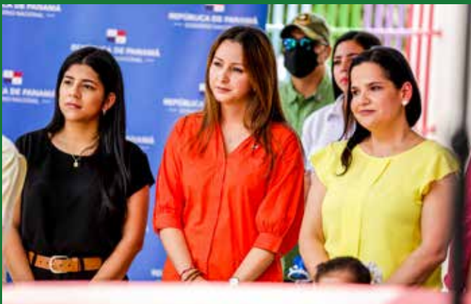
AUTORIDADES DEL MIDES.