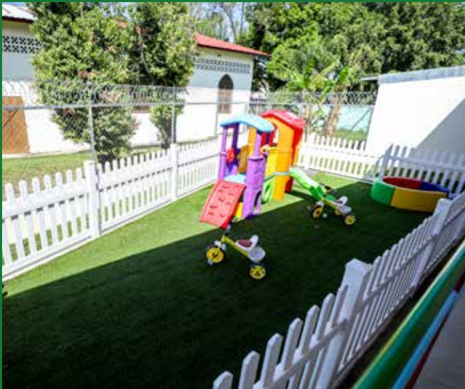
LA INVERSIÓN FUE DE B/.349,540.24