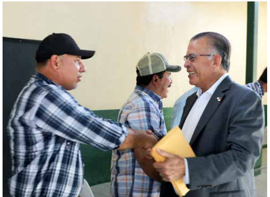
El ministro de Desarrollo Agropecuario, Augusto Valderrama, se reunió con los arroceros.

Un acuerdo para el inicio de la gestión de un desembolso de B/.25 millones para pagarle a los productores por la compensación de precio en la compra del arroz fue parte del compromiso durante una reunión que sostuvo el ministro de Desarrollo Agropecuario, Augusto Valderrama, con el sector arrocero de todo el país. En este encuentro, que se realizó en las instalaciones del Instituto Técnico Superior de Agrotecnología de las Américas (INAA), provincia de Veraguas, se dijo que ya se cuenta con B/.10 millones listos para el desembolso y B/.15 millones adicionales para los próximos días. El jefe del sector agropecuario, acompañado de su equipo de trabajo, agradeció al grupo de productores por participar en el diálogo antes que cerrar la vía, como se había anunciado, y agregó que se les tiene que pagar los millones pendientes porque es la forma de decirles que vale la pena producir y quedarse en el campo para garantizar la seguridad