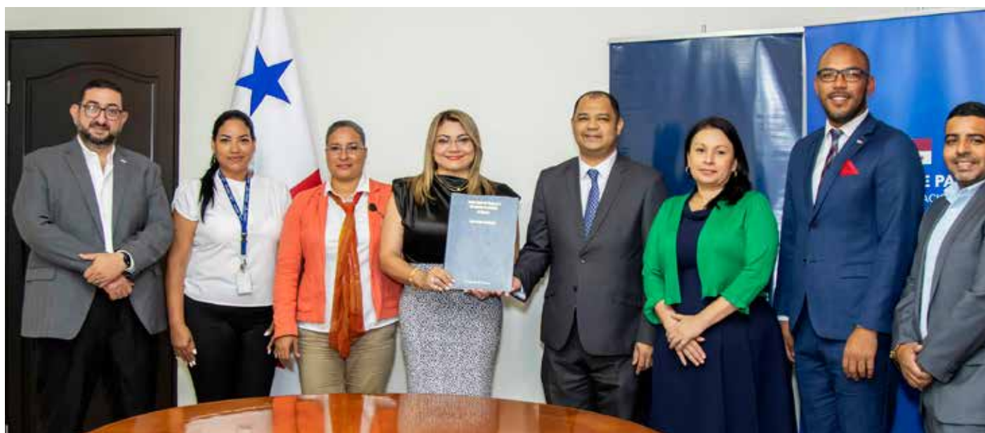
El Mitradel promueve la incorporación de los jóvenes al ámbito laboral mediante el proyecto Aprender Haciendo.

de entendimiento tiene una duración de un año, prorrogable automáticamente por periodos adicionales iguales y sucesivos.