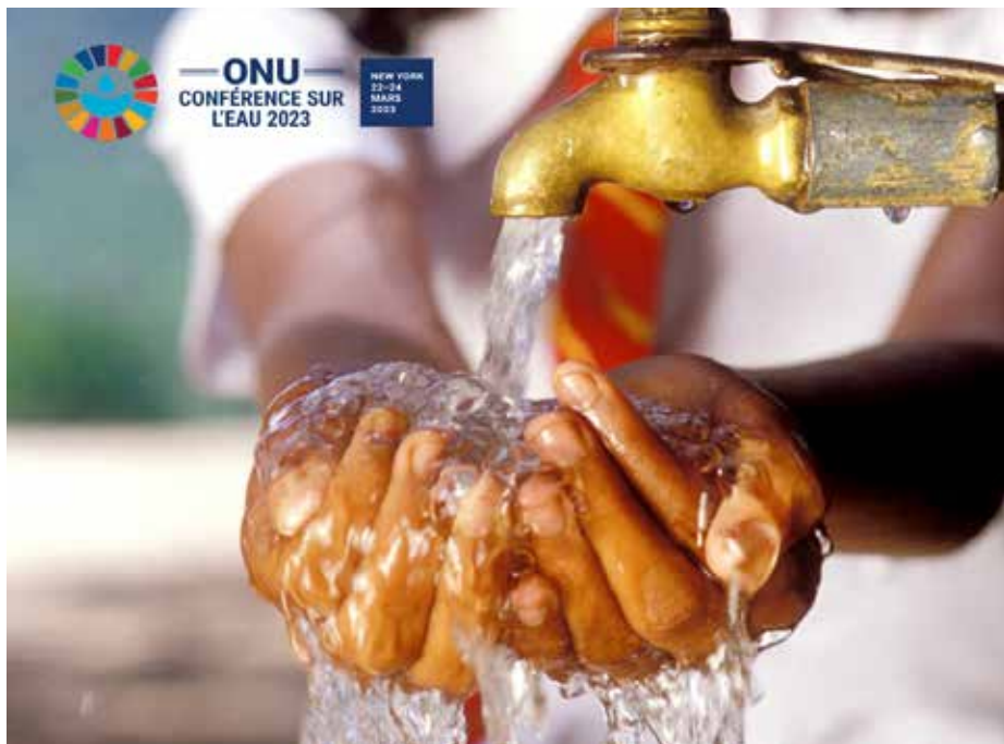
La Conferencia del Agua 2023 se celebrará en la ciudad de Nueva York, Estados Unidos, del 22 al 24 de marzo.

Una delegación del Gobierno panameño participará en la Conferencia del Agua 2023 de la Organización de las Naciones Unidas (ONU), que se celebra en la ciudad de Nueva York, Estados Unidos,