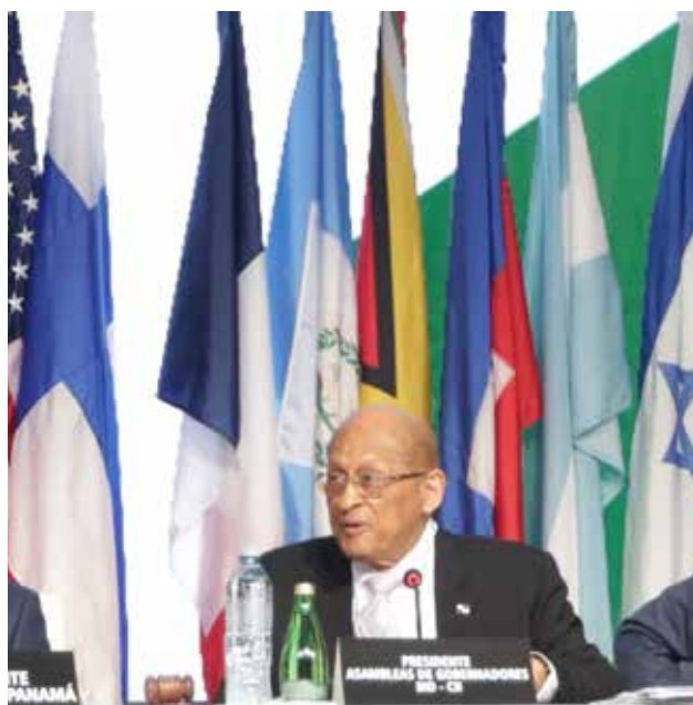
El ministro de Economía y Finanzas, Héctor Alexander, asumió por el período de un año la Presidencia de la Asamblea Anual de Gobernadores del BID y BID Invest.

El ministro de Economía y Finanzas, Héctor Alexander, se refirió a la estrategia de la administración Cortizo para la recuperación económica luego de la pandemia, y resaltó el crecimiento económico de Panamá, que alcanzó 15.8% en 2021, 10.8% en 2022 y que, para el 2023, se estima un incremento del 5%. El ministro Alexander también destacó la reducción importante del desempleo de 18.5% a menos del 10% en 2022, donde sobresale la generación de empleos formales.