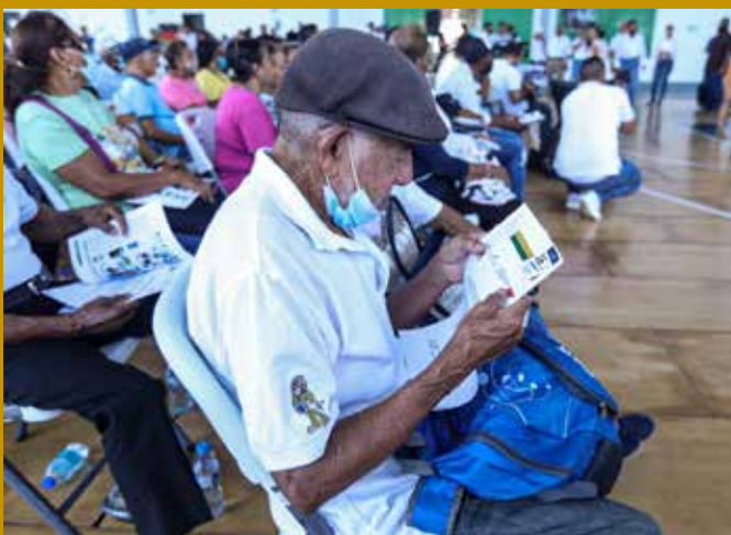
GOBIERNO CUMPLE COMPROMISO CON PANAMEÑOS.