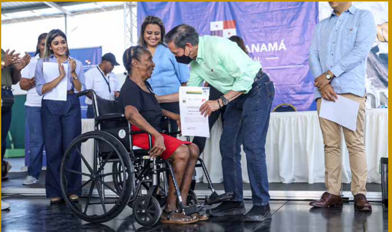
FAMILIAS DEL CORREGIMIENTO BELISARIO PORRAS RECIBIERON SUS TÍTULOS DE PROPIEDAD.