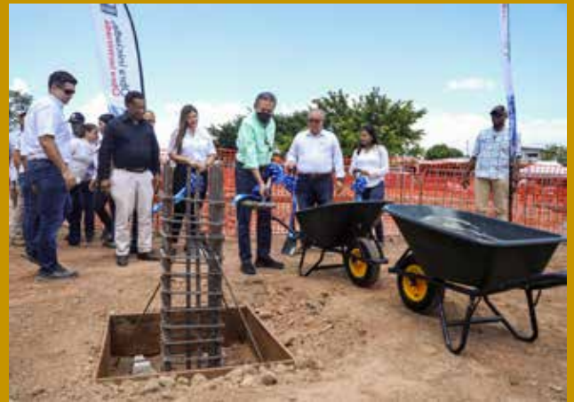
PRIMERA PALADA PARA ERIGIR POLICLÍNICA EN SAN ANTONIO.