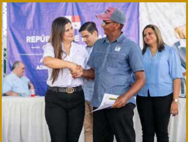
ENTREGA DE TÍTULOS DE PROPIEDAD.

COMUNIDADES: SAN ANTONIO (RUFINA ALFARO), MATEO ITURRALDE Y BELISARIO PORRAS.