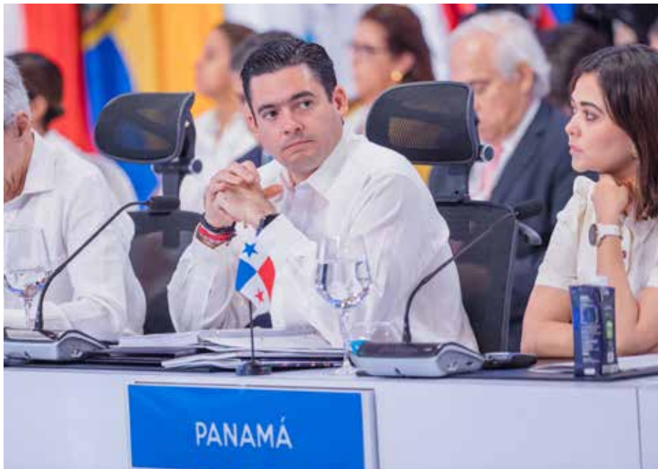
El vicepresidente de la República, José Gabriel Carrizo Jaén, por designación del presidente Laurentino Cortizo Cohen representó al país en la XXVIII Cumbre Iberoamericana de Jefes y Jefas de Estado y de Gobierno celebrada los días 24 y 25 de marzo en República Dominicana.