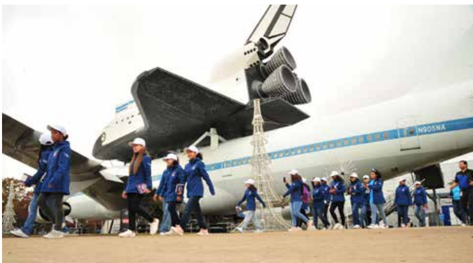
Las inscripciones estarán abiertas del 1 de abril al 1 de mayo, en www.she-is.org .

procesos de empoderamiento social y de liderazgo, detonar talentos y habilidades a través de la educación "STEAM". El programa tiene el respaldo del Despacho de la Primera Dama, Yasmín Colón de Cortizo, que como Embajadora de la Educación Steam para Las Américas, dijo sentirse orgullosa de que la Fundación She Is haya sumado a Panamá en este hermoso proyecto. El principal objetivo de "Ella es astronauta" es romper estereotipos de género, convertir a las niñas en agentes de cambio en sus comunidades, brindarles la posibilidad de vivir una experiencia inolvidable, transformar sus realidades y las de sus familias, e inspirarlas a hacer posible lo imposible. Las interesadas en vivir esta gran experiencia deberán cumplir con algunos requisitos e inscribirse, del 1 de abril al 1 de mayo, en www.she-is.org .