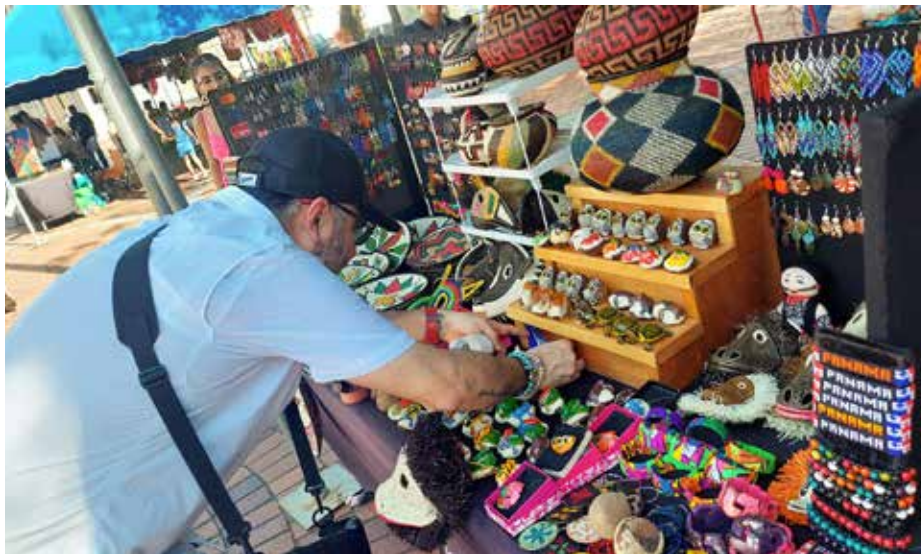
Las pulseras ("winis") que hacen las mujeres gunas son las más solicitadas.

En el Mercadito Artesanal Casco Antiguo, nacionales y extranjeros encuentran un recuerdo de su visita a la capital panameña.