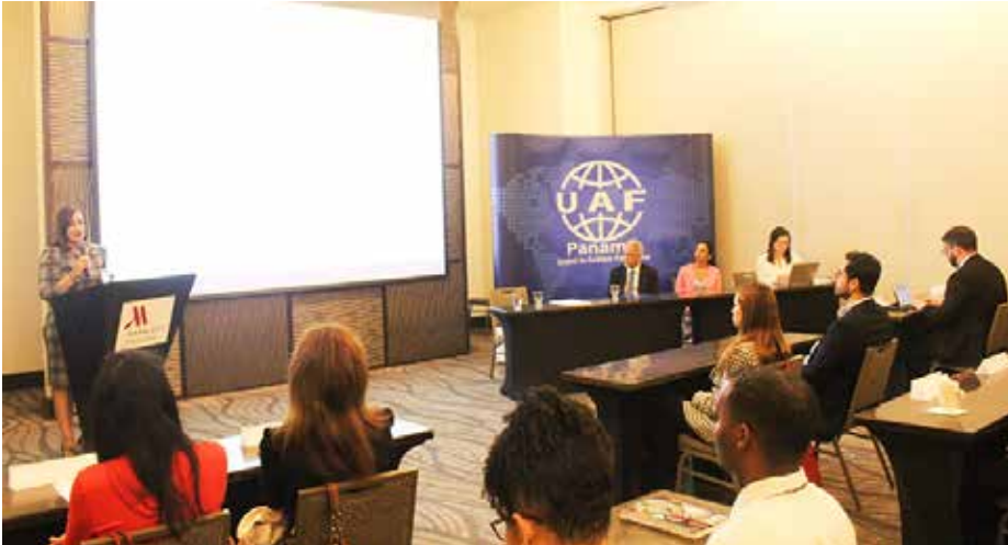
La jornada contó con la participación de expositores internacionales.

La capacitación estuvo dirigida a funcionarios y representantes de más de diez entidades judiciales y administrativas.