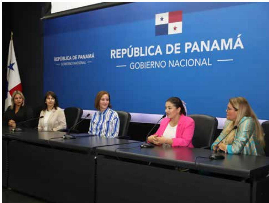
Panamá es el sexto país que se suma al programa "Ella es astronauta".

El principal objetivo de este programa es romper estereotipos de género y convertir a las niñas en agentes de cambio en sus comunidades.