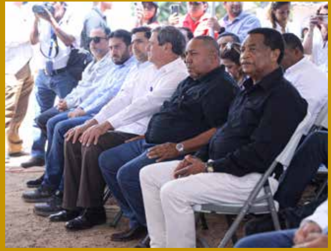
EMPRESARIOS Y AUTORIDADES TAMBIÉN ASISTIERON.