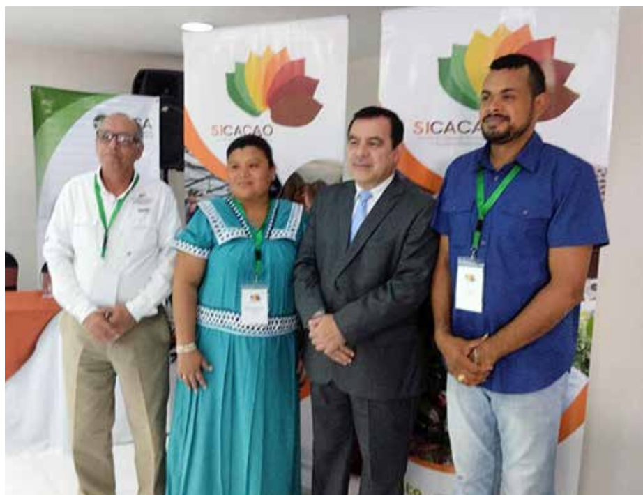
Representación panameña en el evento, que se desarrolló en Guatemala.

El objetivo de esta actividad fue asegurar la continuidad de la plataforma y estructurar la agenda de trabajo asociada a la Estrategia Regional de Cacao, aprobada por el Consejo Agropecuario Centroamericano (CAC) en 2020.