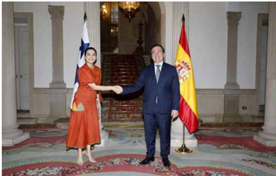
La canciller, Janaina Tewaney Mencomo; y José Manuel Albares, ministro de Asuntos Exteriores, Unión Europea y Cooperación del Reino de España.

Party Parliamentary Group Latin America y sus miembros, compartió los avances de Panamá a nivel ambiental, económico, educativo y tecnológico. Mientras en Canning House, se reunió con Jeremy Browne, director ejecutivo, y Lord Mountevans, presidente honorario, para impulsar el diálogo político y económico entre Latinoamérica y el Reino Unido, y la Alianza para el Desarrollo en Democracia. En España, abordó con el ministro de Asuntos Exteriores, Unión Europea y Cooperación, José Manuel Albares, las oportunidades de ampliar la cooperación bilateral. En un encuentro en Casa de América, la canciller Tewaney conversó sobre temas de política exterior, migración y cooperación y manifestó su confianza en que se produzca un “acercamiento” entre América Latina y la Unión Europea bajo la presidencia española del bloque para el segundo semestre de este año.