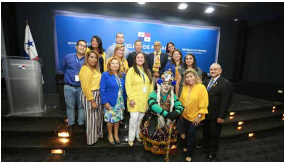
El Gobierno Nacional adopta los mecanismos y/o herramientas para garantizar el cumplimiento de estos derechos que son inalienables e irrenunciables.

La igualdad y la no discriminación por raza, etnia o por cualquier otro motivo es un derecho fundamental reconocido en la Constitución Política de la República de Panamá.