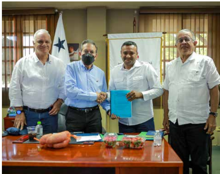
En el encuentro se presentó una propuesta para la modernización del sistema sanitario y fitosanitario de Panamá.