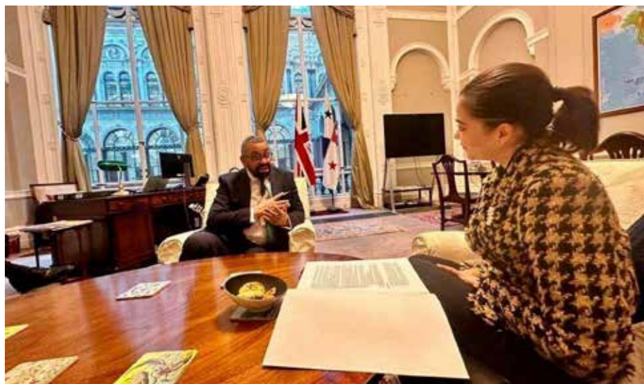
Encuentro entre la canciller Janaina Tewaney Mencomo y James Cleverly, secretario de Estado para las Relaciones Exteriores del Reino Unido y de la Mancomunidad de Naciones.