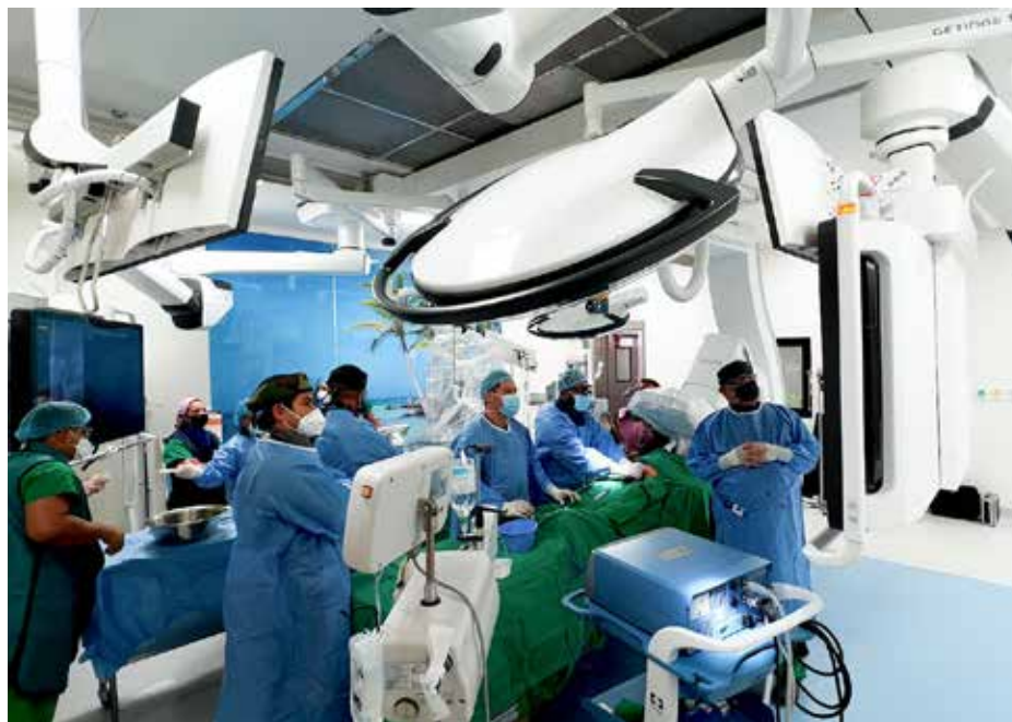
El centro quirúrgico atenderá cirugías de alta complejidad.

Pacientes con enfermedades complejas que requieran atención especializada serán atendidos en el Hospital Quirúrgico de Alta Complejidad.