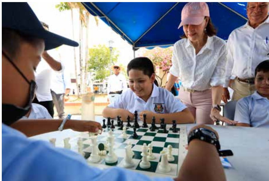
Unos 150 estudiantes de cinco escuelas de Veraguas participaron en una mañana de preajedrez y ajedrez.

El Despacho de la Primera Dama de la República, liderado por Yazmín Colón de Cortizo, en conjunto con la Gobernación de Veraguas, el Ministerio de Educación y los clubes de ajedrez de esta provincia, organizó una mañana de aprendizaje para unos 150 estudiantes. El escenario fue el Parque Juan Demóstenes Arosemena, en Santiago de Veraguas, donde los estudiantes del Instituto Urracá, Centro de Educación Básica General (CEBG) La Primavera, CEBG San Martín de Porres, Colegio San Vicente de Paul y CEBG José Santos Puga, aprendieron este juego que mejora las habilidades mentales e intercambiaron conocimientos con los más experimentados. Muchos de estos estudiantes ya participan en clubes de ajedrez de la provincia, como Liga de Ajedrez de Veraguas, Club de Ajedrez Artchess, Club de Ajedrez Álef Cero y Sexi Batido Chess Club. También hubo aprendizaje para los más pequeños, pues los estudiantes de preescolar del CEBG La Primavera conocieron los nombres de cada pieza y cómo deben moverse. En la actividad, se entregó la donación de un juego de ajedrez a estudiantes del Instituto Educativo Integra INEISA de Buenos Aires de Ñürüm, para que sigan aprendiendo y que esto los ayude en la toma de decisiones y fortalezcan el valor de la determinación. El ajedrez es un eje transversal de la metodología STEAM (ciencia, tecnología, ingeniería, artes y matemáticas) que facilita los procesos de aprendizaje desde edades tempranas.