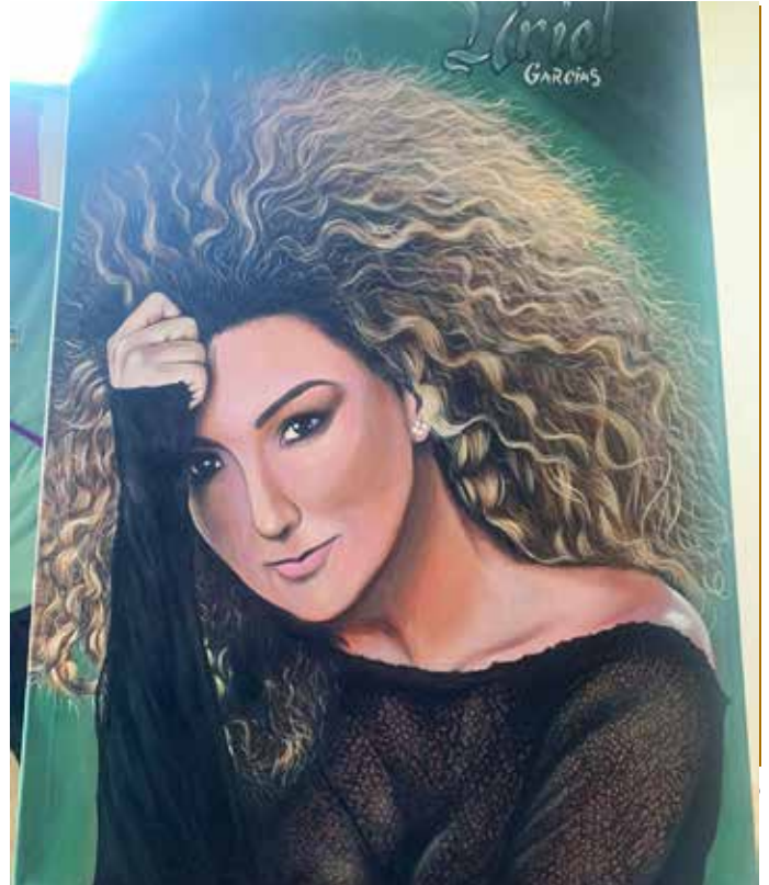
El homenaje a la destacada artista panameña se dio en el marco de la conmemoración del Día Internacional de la Mujer.

En homenaje a la cantautora panameña Erika Ender, privados de libertad del Centro Penitenciario de Santiago realizaron, a través de sus programas de resocialización, diversas actividades artísticas entre las que destaca una pintura de la artista panameña y la interpretación de dos de sus temas musicales, "Despacito" y "Masoquista", amenizados por un grupo de baile del centro. Los intérpretes de las canciones fueron los integrantes del Coro Polifónico de La Merced, del proyecto "Liberarte", en el que destacan a la artista como figura femenina emblemática que ha dejado el nombre de Panamá en alto en todas las esferas. La programación fue un trabajo en equipo con dos de los proyectos del Centro Liberarte (Coro Polifónico) y ReciarTE (artesanos). Erika María Ender Simoes, conocida artísticamente como Erika Ender, es una cantautora panameña de ascendencia estadounidense y brasileña conocida por su larga trayectoria como compositora, con temas para múltiples artistas, tanto de habla his-pana como inglesa y portuguesa.