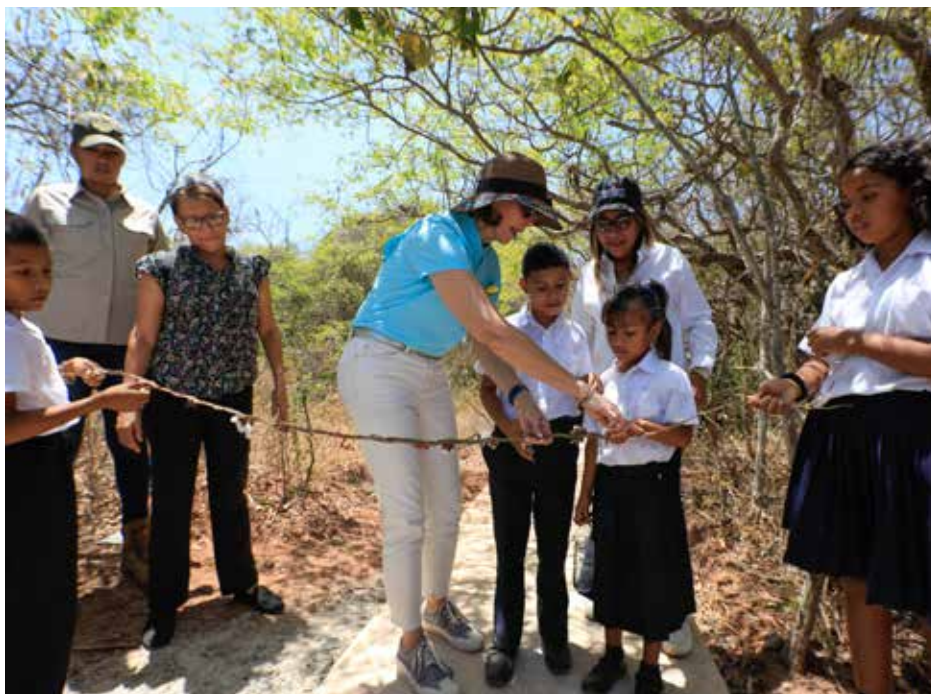
La primera dama participó en la apertura de la rehabilitación de una vereda para personas con discapacidad en el Parque Nacional Sarigua.