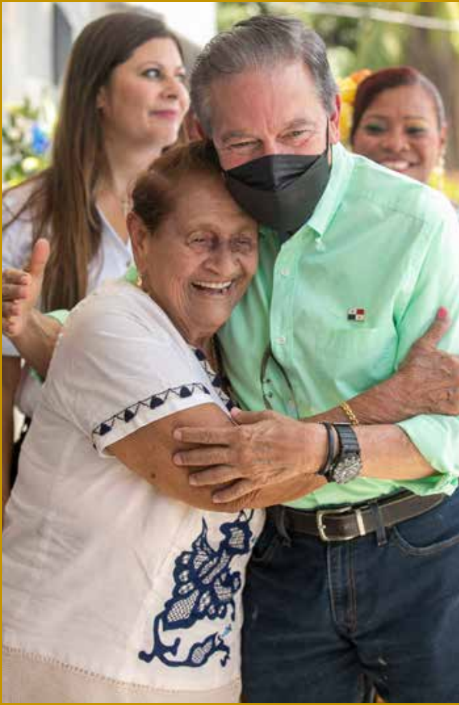
RESIDENTES DE SAMARIA RECIBIERON SUS ESCRITURAS.