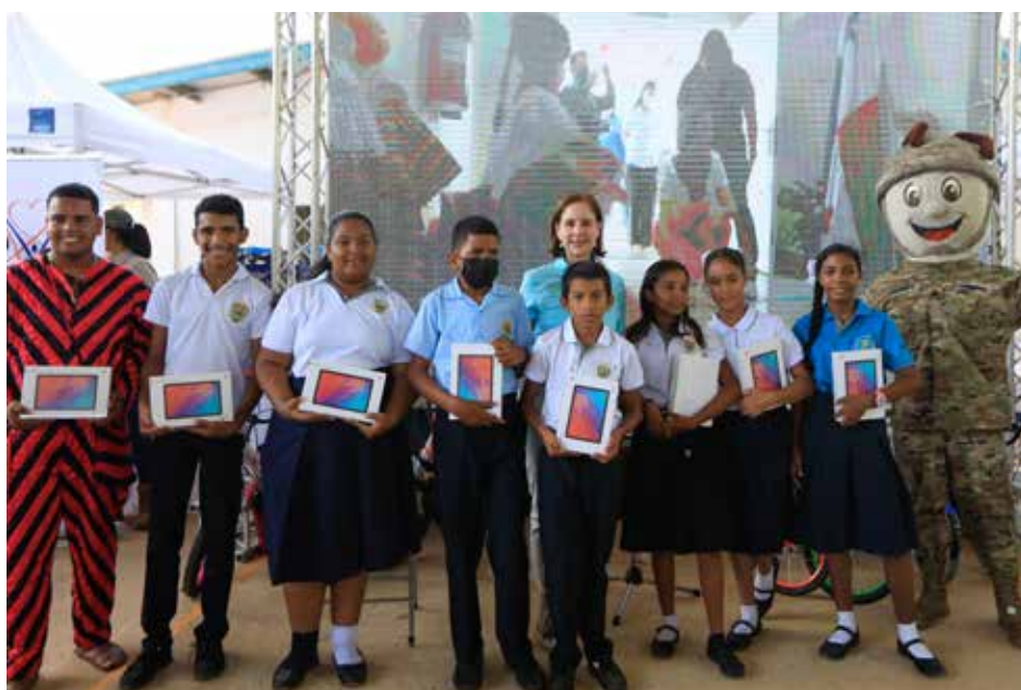
Estudiantes recibieron tabletas, útiles y uniformes escolares.

El Despacho de la Primera Dama de la República, liderado por Yazmín Colón de Cortizo, realizó la cuarta gira de asistencia social de este 2023, esta vez en el corregimiento de Parita, provincia de Herrera, beneficiando a más de 1,000 personas. La primera dama visitó el Centro de Atención Integral a la Primera Infancia (CAIPI) de Parita, que tiene una matrícula de 35 niños. En este centro se implementó la educación "STEAM" (ciencia, tecnología, ingeniería, arte y matemáticas) y la robótica, donde los estudiantes desarrollan la capacidad de pensamiento crítico, entre otros beneficios. Por otro lado, el Despacho de la Primera Dama realizó, en conjunto con autoridades locales, una feria interinstitucional en el Centro Educativo Bilingüe de Parita, donde se benefició a 190 familias con atención en salud, entrega de bolsas de comida, leche fortificada, sillas de ruedas, bastones y pañales; y a los estudiantes se les entregó tabletas, útiles y uniformes escolares. Colón de Cortizo participó también en la apertura de la rehabilitación de la vereda para personas con discapacidad en el Parque Nacional Sarigua. Se estima que, al año, unas 605 personas con discapacidad y adultos mayores de 60 años visitan este parque.