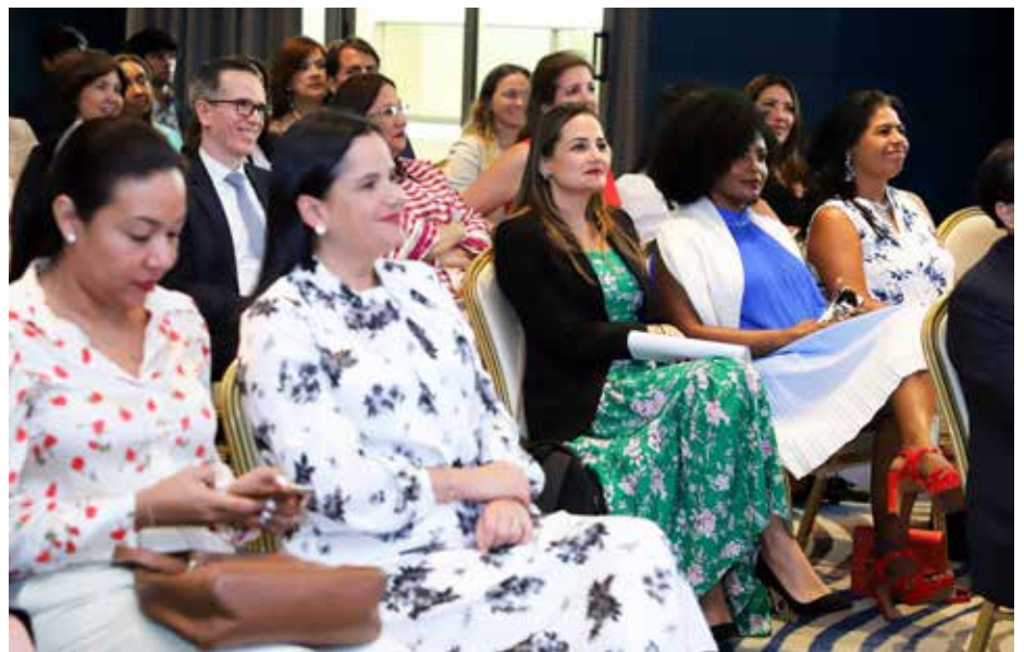
La Asociación de Directoras de Panamá concedió estos reconocimientos a la Ampyme.