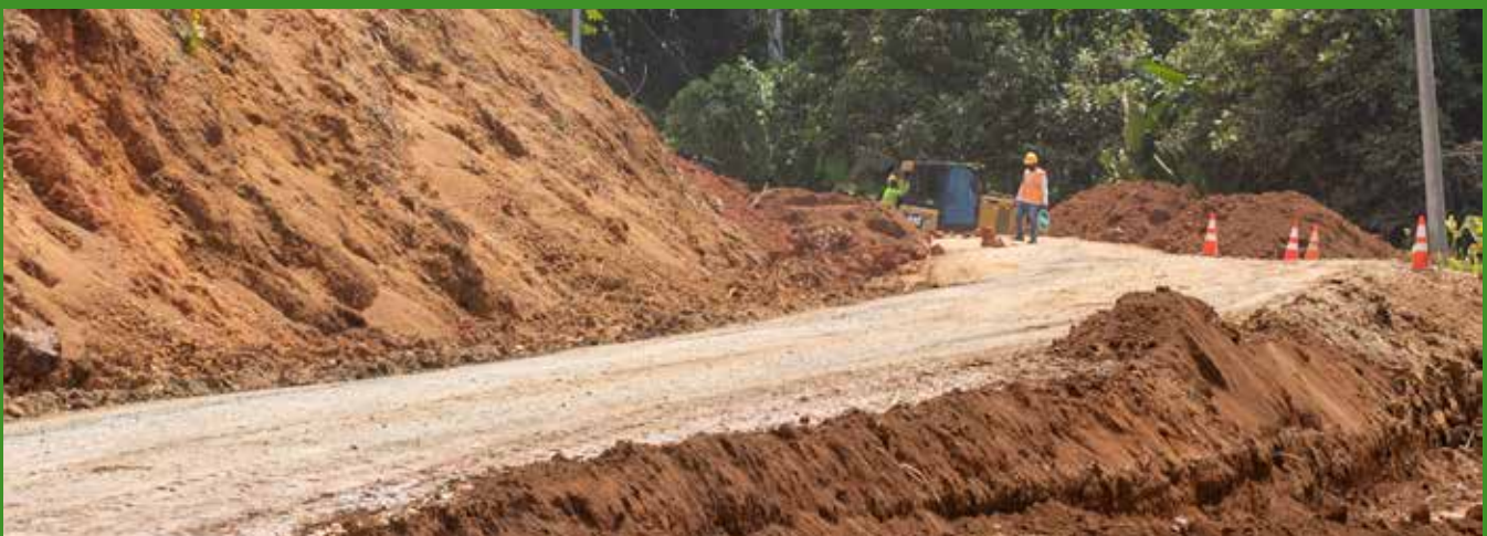
UNAS 7,155 PERSONAS SE BENEFICIARÁN CON LA REHABILITACIÓN DE CALLES EN BOCAS DEL TORO.