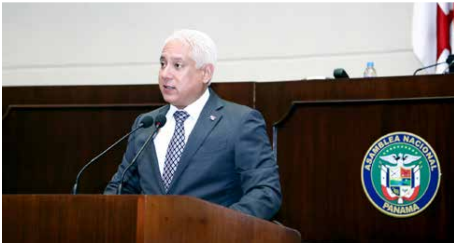
La nueva propuesta legal fue presentada a la Asamblea Nacional por el ministro de la Presidencia, José Simpson Polo.