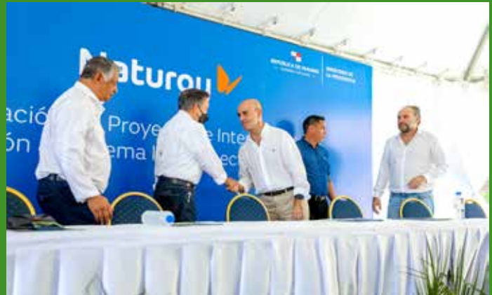
LA EMPRESA NATURGY FUE LA ENCARGADA DE RENOVAR EL SISTEMA ELÉCTRICO EN ISLA COLÓN.