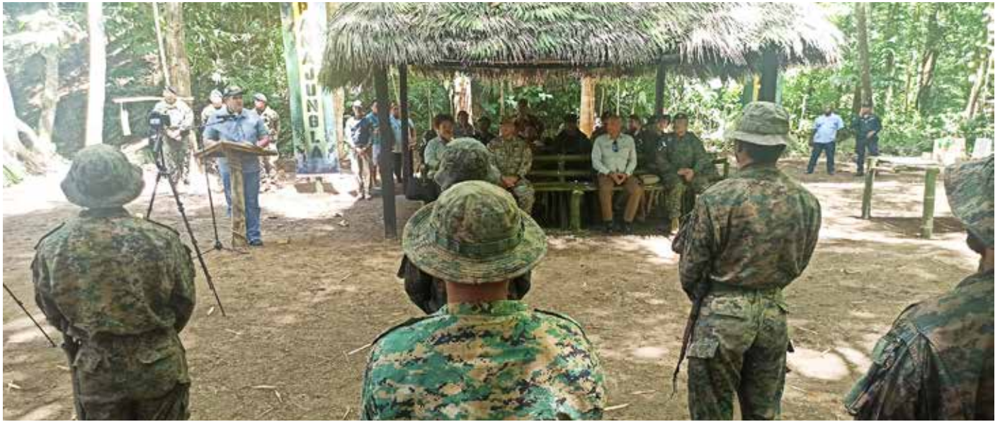
Panajungla incluye: fase de formación específica, clases de primeros auxilios, confección de nudos y anclajes, orientación y navegación terrestre.