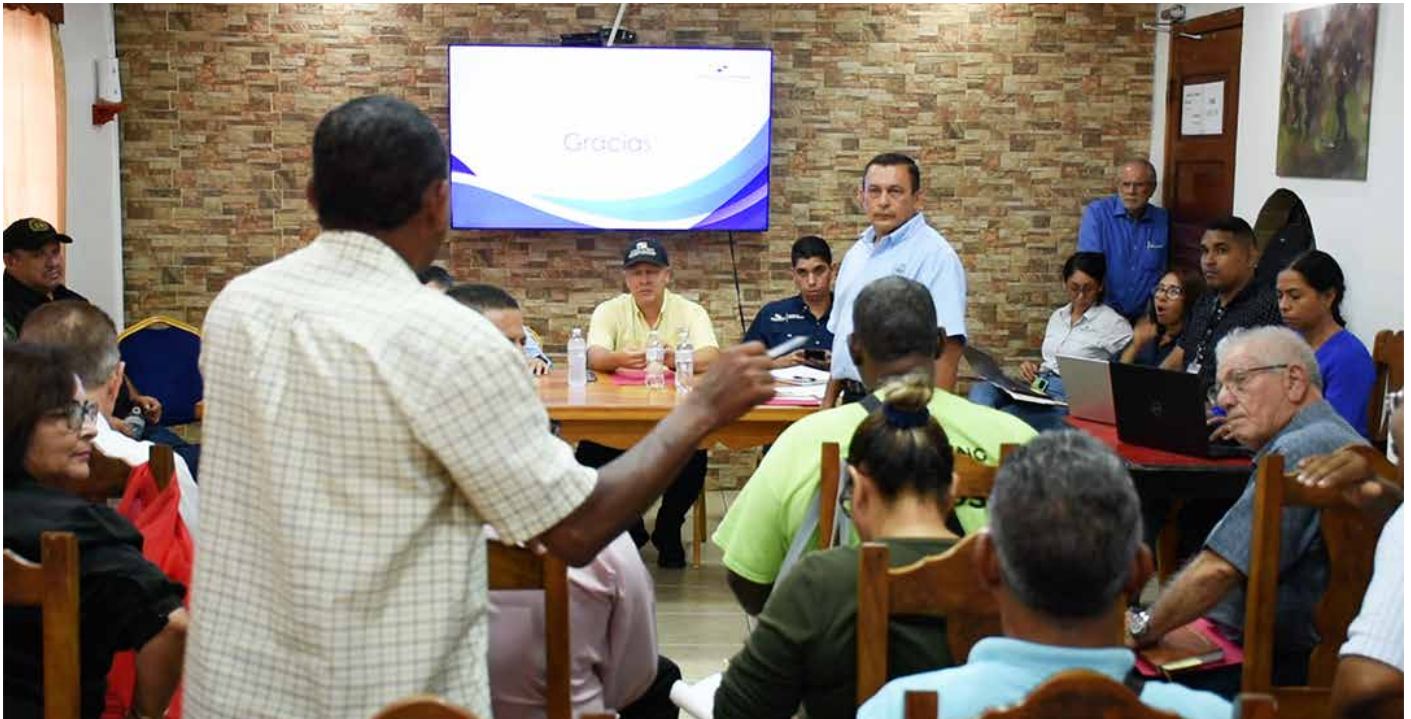
La CSS notificó a las primeras 15 personas para la revisión correspondiente.