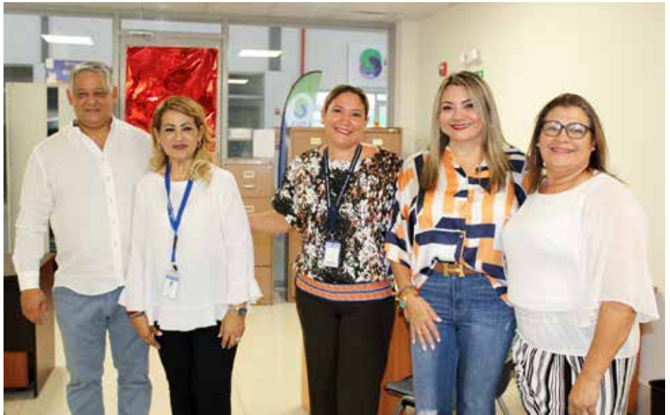
Las nuevas instalaciones están ubicadas en la Gran Terminal de Aguadulce.

La ministra de Trabajo y Desarrollo Laboral (Mitradel), Doris Zapata Acevedo, acompañada de las autoridades locales y del administrador general de la Autoridad de los Servicios Públicos (ASEP), Armando Fuentes, inauguró el jueves 20 de abril de 2023, las nuevas y modernas instalaciones de la Dirección Regional de Trabajo en la provincia de Coclé. La titular del Mitradel manifestó que las nuevas instalaciones forman parte de la hoja de ruta planteada por el Gobierno Nacional, de brindar un mejor servicio y espacios amigables tanto para las personas con discapacidad como para los agentes productivos del sector laboral. A través de la Regional de Trabajo en Coclé, el Mitradel impulsa programas y proyectos que promuevan la inserción laboral, tales como el Eje de Empleabilidad