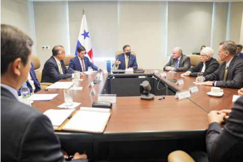
La empresa Open Blue maneja la mayor producción de cobia en un solo punto a través de las Sea Station.