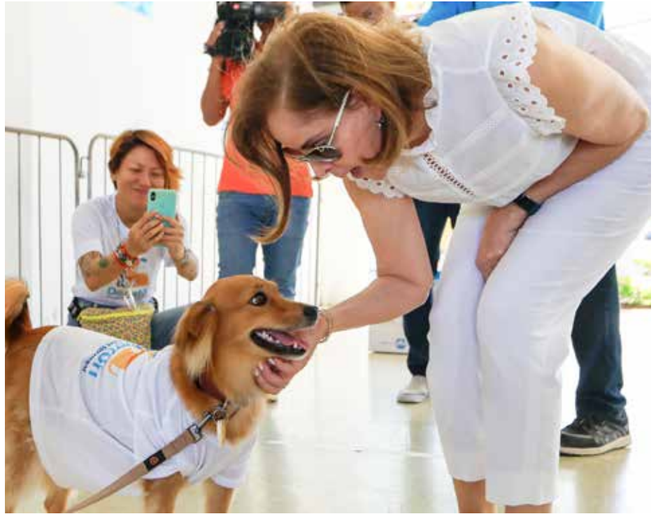
La primera dama, Yazmín Colón de Cortizo, participó en la cuarta "Donatón" por los animales sin hogar.

El 22 y 23 de abril, el Domo del Parque Omar fue uno de los centros de acopio de la 'Donatón' por los animales sin hogar 2023. La meta de este año era alcanzar 25,000 kilos de alimento para perros y gatos y 1,000 esterilizaciones. Esta cuarta edición fue organizada por la revista "Pets World Magazine", con el respaldo del Despacho de la Primera Dama de la República. Se trata de una iniciativa para apoyar a más de 150 rescatistas, organizaciones y fundaciones de todo el país que contribuyen a darles una mejor calidad de vida a animales en riesgo de muerte, y que necesitan todas las donaciones que puedan recibir de la ciudadanía, la empresa privada y el Gobierno Nacional. Miles de animales sin esterilizar y en situación de riesgo de calle no tienen comida, cada vez hay más abandono, maltrato