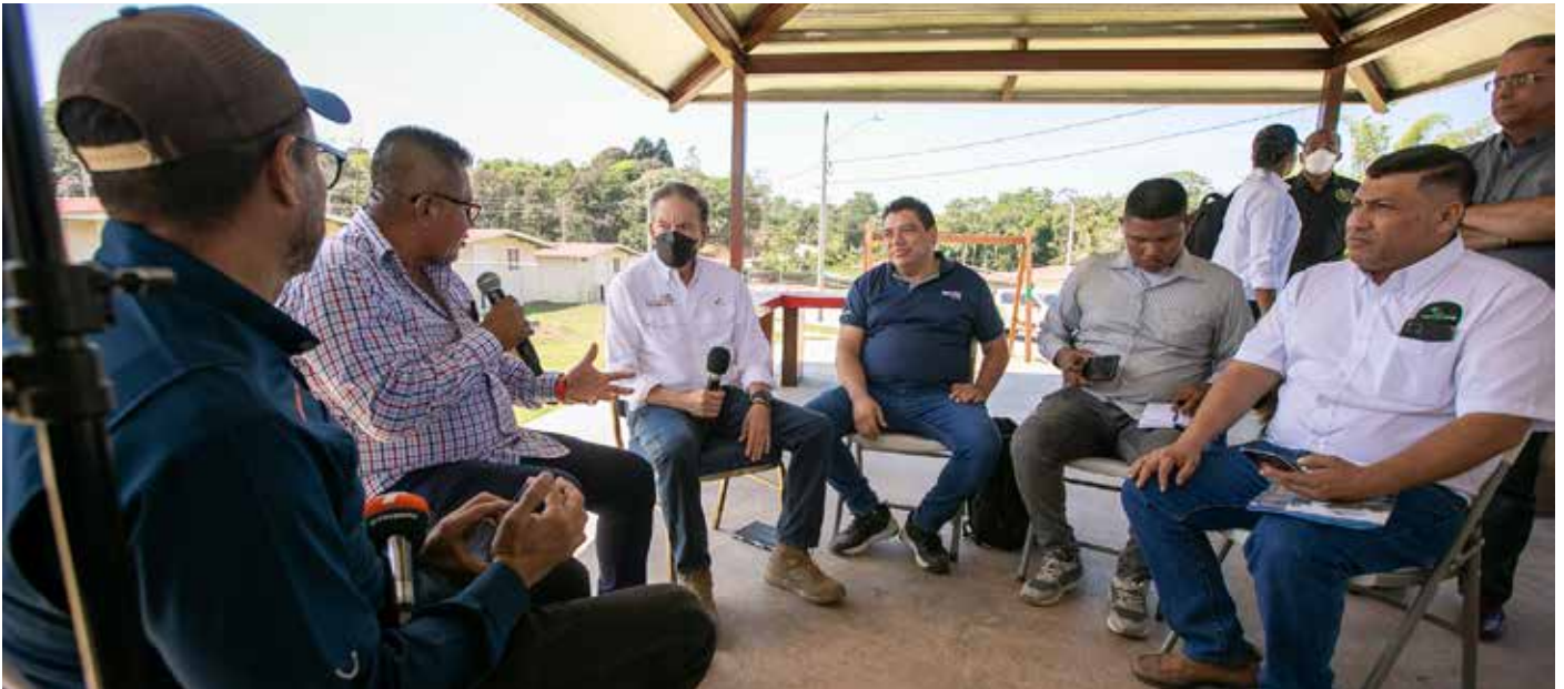
El mandatario Laurentino Cortizo Cohen habló de diversos temas en Bocas del Toro con representantes de medios de comunicación.