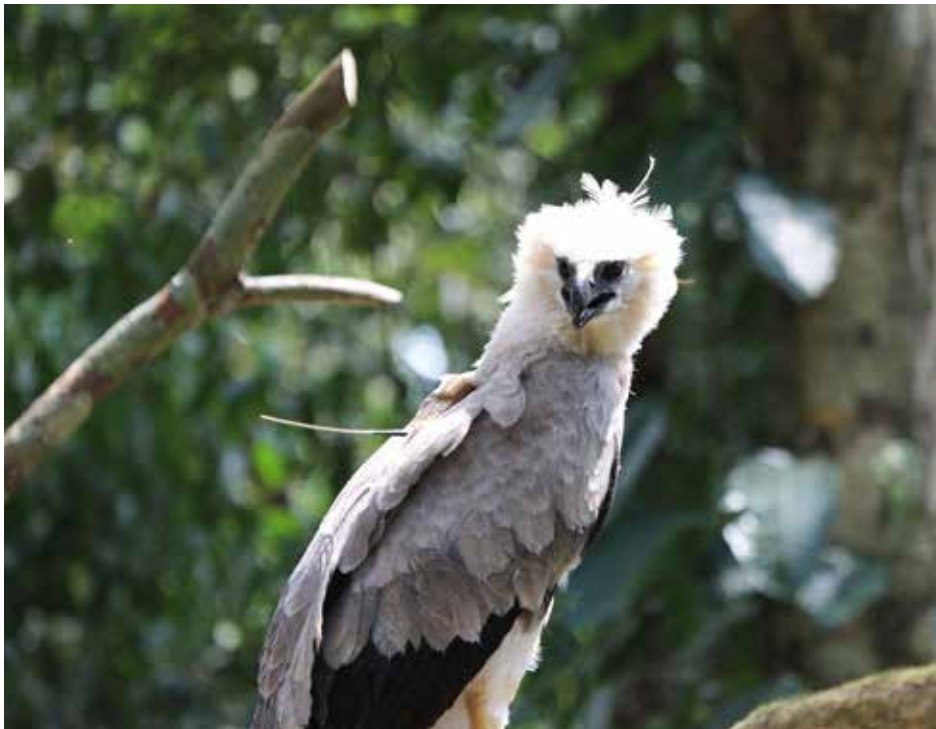
Al ave se le colocó un GPS en su espalda, con la finalidad de monitorear sus movimientos a corto y mediano plazo.