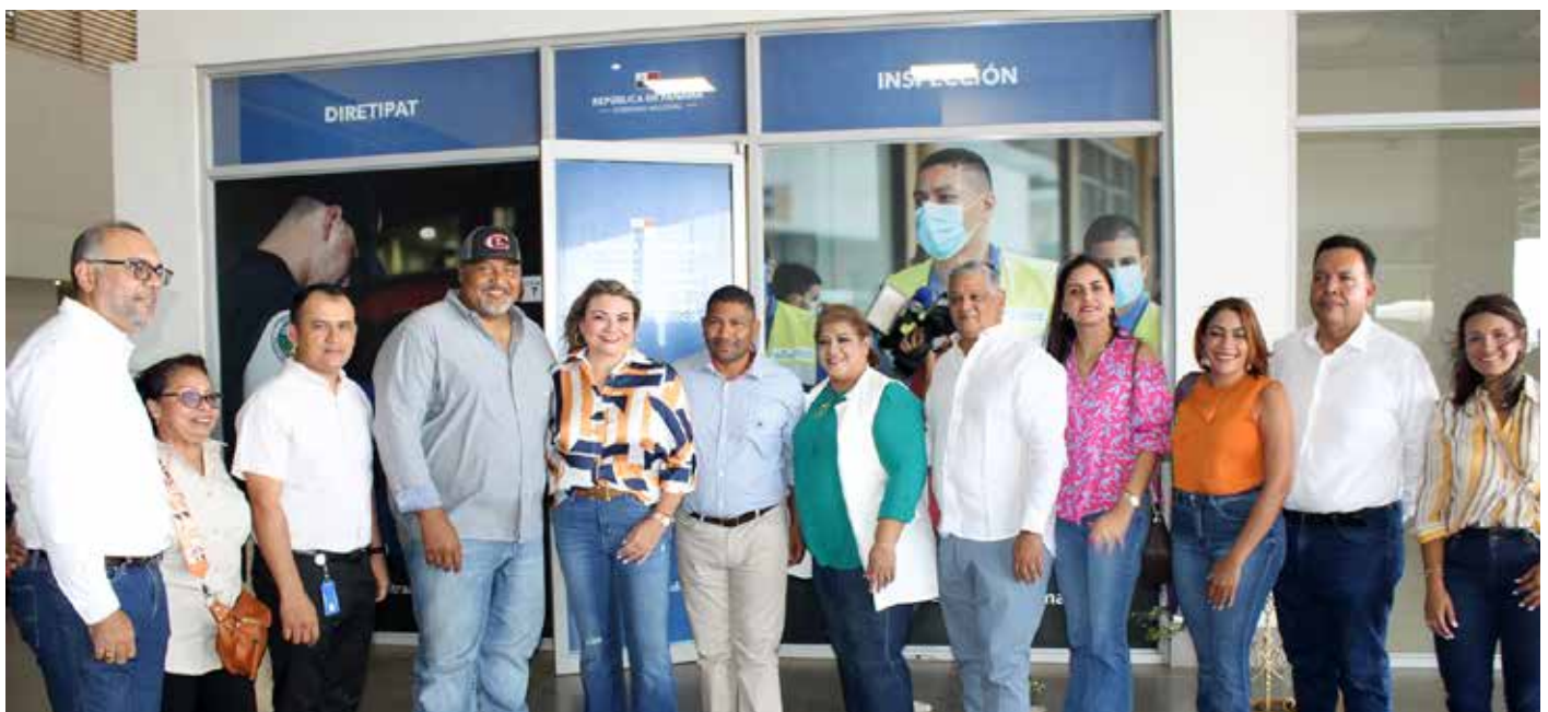
Se ofrecen espacios amigables, tanto para las personas con discapacidad como para los agentes del sector productivo.

entre otras. La nueva Regional de Trabajo de Coclé se encuentra en la Gran Terminal de Aguadulce, ubicada en la comunidad de Cerro Morado, distrito de Aguadulce.