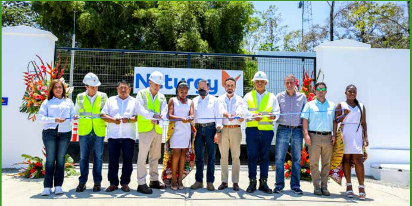
HISTÓRICA INAUGURACIÓN DE LA INTERCONEXIÓN DE ISLA COLÓN AL SISTEMA INTERCONECTADO NACIONAL.

Un total de B/.25,743,208.64 se invirtieron en las obras y proyectos entregados en la Gira de Trabajo Comunitario 134, que se desarrolló el viernes 28 de abril en la provincia de Bocas de Toro, liderada por el mandatario, Laurentino Cortizo Cohen. Se trata de obras de cuatro instituciones gubernamentales para beneficio de los distritos de Bocas del Toro, Almirante,