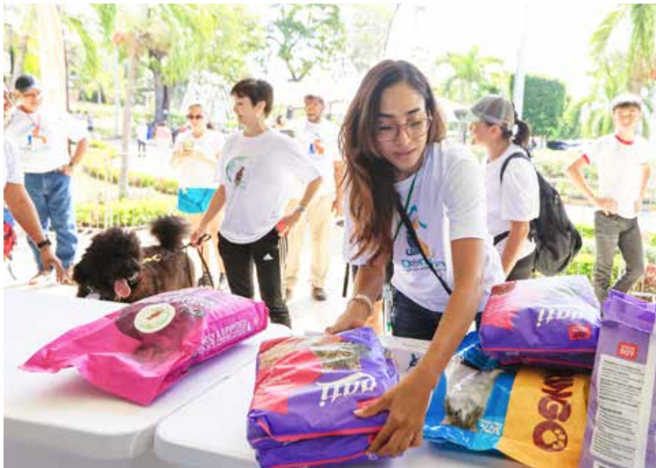
Cientos de personas llevaron su contribución al Domo del Parque Omar.

y la crueldad animal aumenta. El objetivo de este evento anual, que para este año se realizó en siete sedes oficiales (Parque Omar, Atrio Mall, Megamall, OnDgo Aguadulce, Mall Paseo Central - Chitré, Parque Domingo Médica - Boquete) es brindar apoyo a la mayor cantidad de perros y gatos. Los organizadores también habilitaron una cuenta bancaria para recaudar dinero para esterilizaciones de perros y gatos (Banco General, Cuenta de Ahorros, 04-79-97-218410-4, a nombre de Banco Nacional de Alimentos para Animales Rescatados-BANAPAR), en el directorio de Yappy buscar BANAPAR y en el directorio de Cuanto App, buscar donatonpanama.