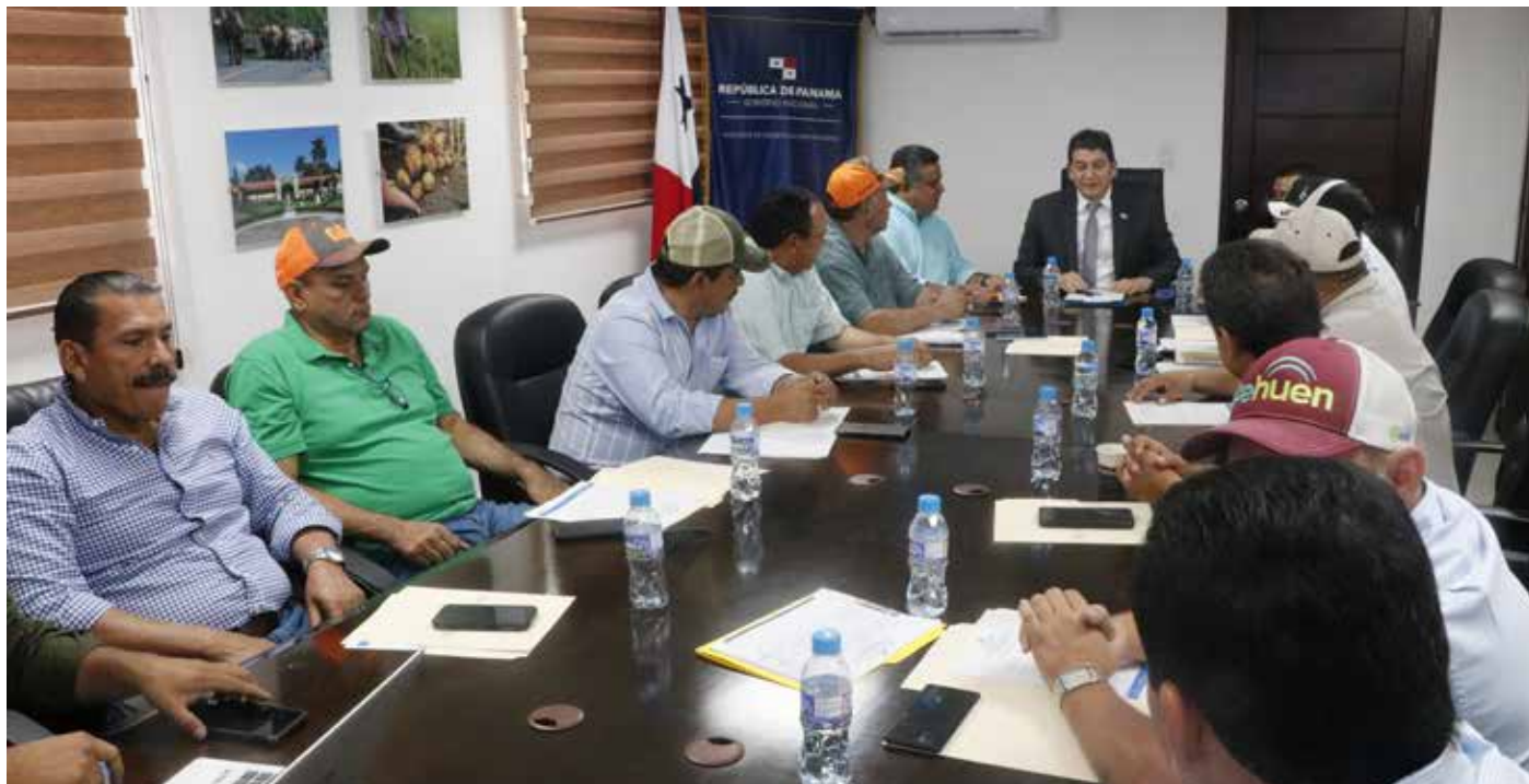
Productores, distribuidores de insumos, molineros e industriales participan en la Cadena Agroalimentaria de Arroz.

En cuanto a la cosecha del grano, se indicó que 1,552 productores reportan 86,315 hectáreas para una producción de 8,714,562 quintales.