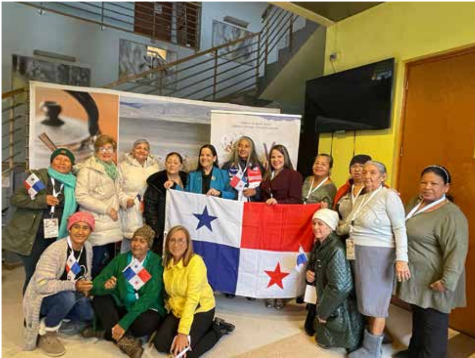
El Gobierno apoya a las mujeres rurales del país con financiamiento no reembolsable para que establezcan sus pequeños emprendimientos agropecuarios.

29 de abril de 2023. El Gobierno Nacional ha venido apoyando a las mujeres rurales del país con financiamiento no reembolsable para establecer sus pequeños emprendimientos agropecuarios en sus comunidades y generar ingresos para sus familias. A través de la Dirección de Desarrollo Rural del MIDA, las mujeres rurales emprendedoras organizadas en la Red Panameña de Mujeres Rurales (REPAMUR) reciben capacitaciones y acompañamiento en temas como género, liderazgo, formulación de sus planes de negocios rurales, agroindustria artesanal y buenas prácticas de preparación de alimentación. Por medio del trabajo conjunto del MIDA y REPAMUR con otras organizaciones de cooperación internacional, como PNUD, ONU-Mujeres e instituciones nacionales como el Ministerio de Desarrollo Social, se está impulsando la Declaración de la Década de las mujeres rurales a nivel mundial.