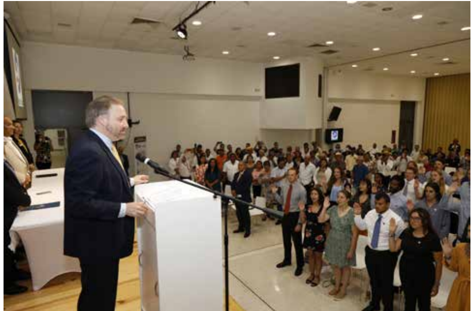
Los Cuerpos de Paz se han vinculado con la formación de líderes comunitarios o voluntarios ambientales por más de 50 años en el país.

Un grupo de 40 voluntarios, miembros del Cuerpo de Paz, fueron juramentados por el ministro consejero de la Embajada de los Estados Unidos en Panamá, Stewart Tuttle, para iniciar labores en comunidades rurales de las provincias de Coclé, Chiriquí, Herrera, Los Santos y Veraguas. Los voluntarios, que provienen de diferentes estados de la nación estadounidense, atenderán dos áreas de trabajo en su gestión en el país: sistemas agrícolas sostenibles y conservación ambiental comunitaria, enfocada en cambio climático,