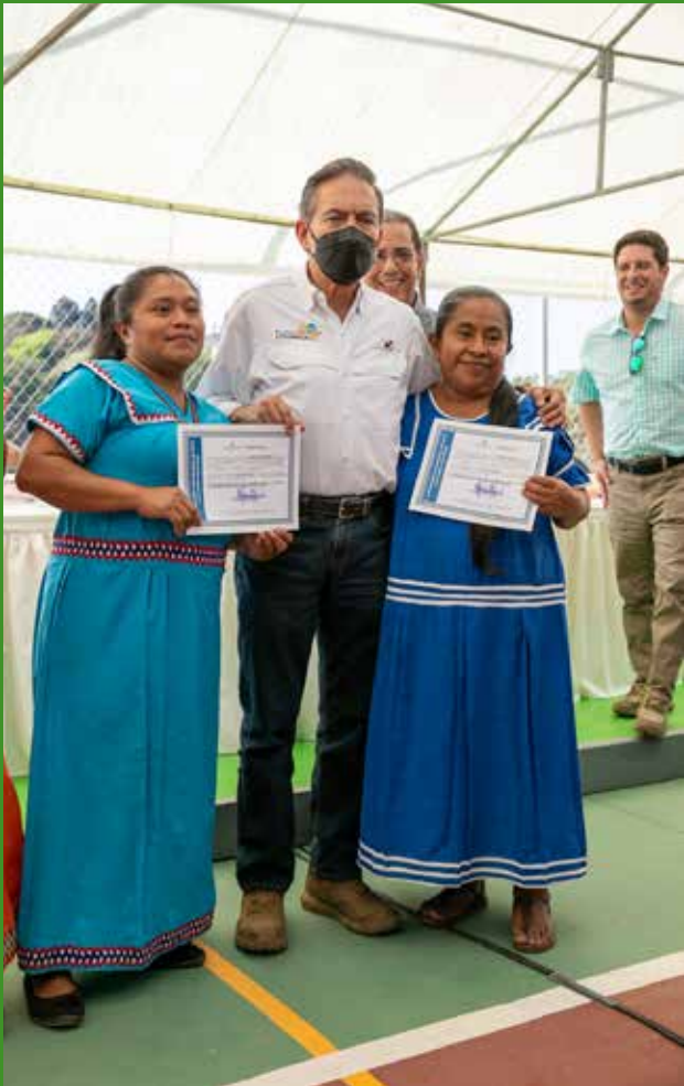
SE CONCEDIERON 574 CERTIFICADOS DE LOTES.