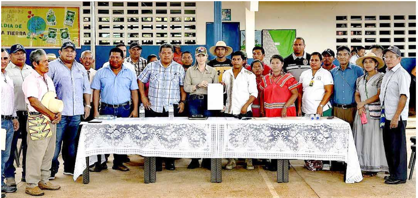
La obra será de beneficio para las comunidades de Guayabal, Las Nubes, Cerro Sombrero, Flor de Café, Quebrada Pita, Bajo Saldaña, Alto Saldaña, Alto Caballero, Cerro Mono, Alto Melón, Río Espeso, Buenos Aires, Quebrada de Oro y Rincón Moro.