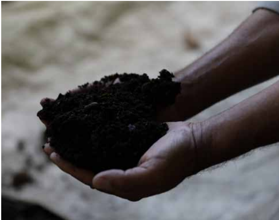
Las royas son hongos que afectan las plantaciones de este grano.

agrícola de conformidad con el Protocolo de Nagoya”, financiado por el Fondo para el Medio Ambiente Mundial. Actualmente, se encuentra en su fase final y ha brindado diversos resultados que tienen aplicación en la producción de esta planta, sobre todo en la región de Boquete y Renacimiento, provincia de Chiriquí. MiAmbiente, el Programa de las Naciones Unidas para el Desarrollo y el Instituto de Investigaciones Científicas y Servicios de Alta Tecnología son las entidades y organizaciones que lideran este proyecto, apoyando esta investigación científica nacional, al tiempo que se le da valor a la biodiversidad. Una de las principales razones por las que se escogió esta zona para la ejecución del proyecto es porque a lo largo de los años los lugareños se han dedicado a la producción del grano. El estar en un área de gran altitud y clima templado juega un papel importante para la producción cafetalera.