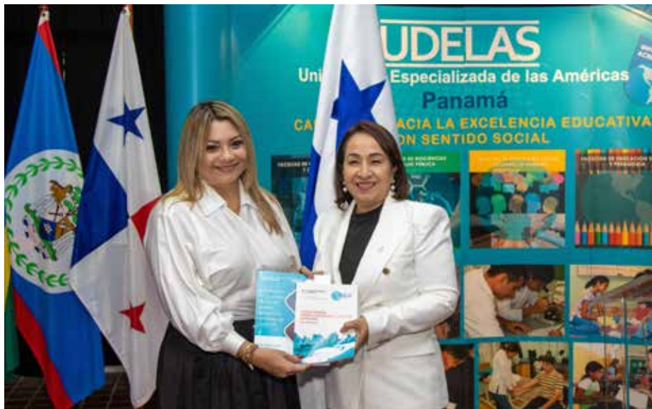
Primera reunión presencial en conmemoración de la Mesa Tripartita del Diálogo por la Economía y el Desarrollo Nacional.