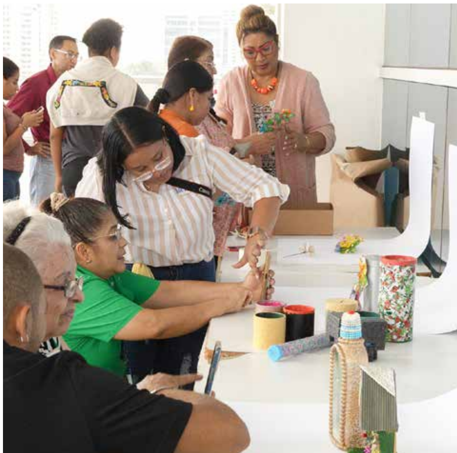
Se les enseña los principios básicos para captar sus mejores imágenes.

La Feria Nacional de Artesanías se realizará del 26 al 30 de julio en Atlapa.