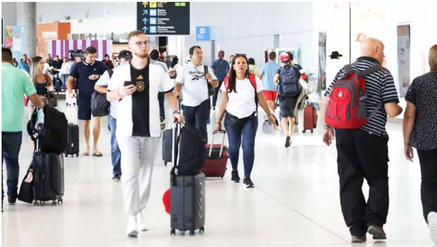
La terminal de carga movilizó 16,078 toneladas métricas de mercancía durante el cuarto mes del año 2023.