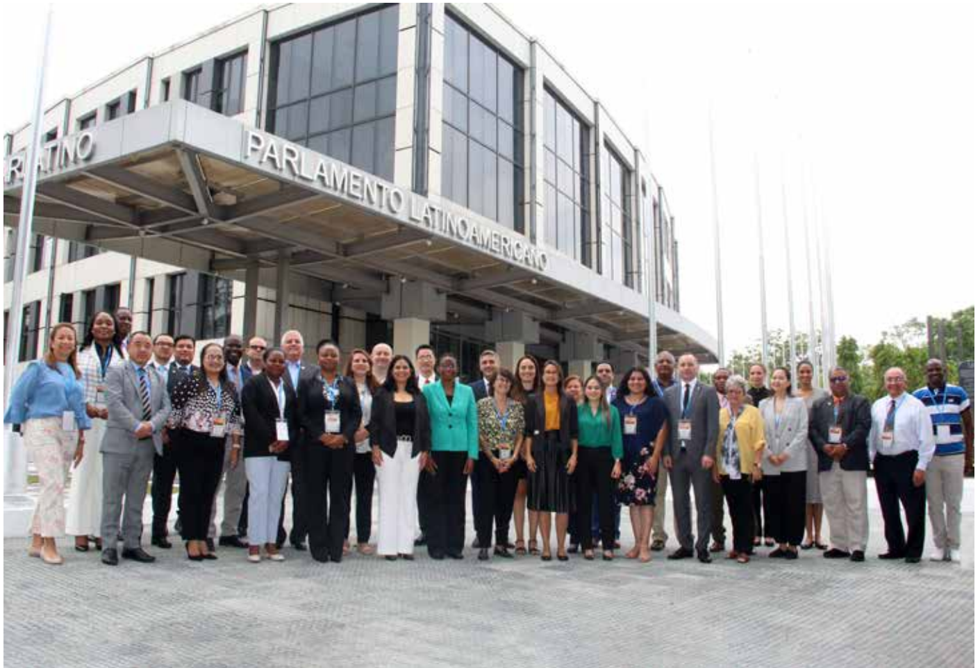
Miembros de las Aduanas de 32 países se reúnen en Panamá.