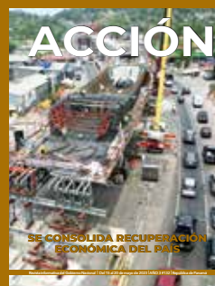
Foto de portada: Construcción del Corredor de Las Playas en Panamá Oeste.

Revista informativa del Gobierno Nacional Órgano informativo digital interinstitucional Teléfono (507) 527-9537