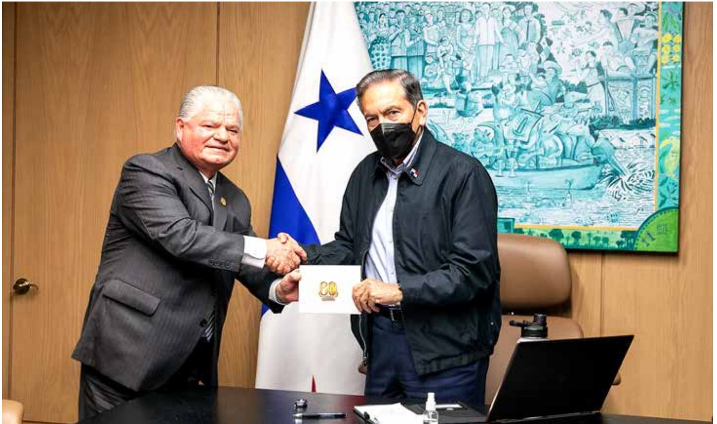
El presidente Laurentino Cortizo Cohen recibió de manos de un grupo de reverendos del Movimiento Misionero Mundial la invitación formal para participar en este evento internacional.