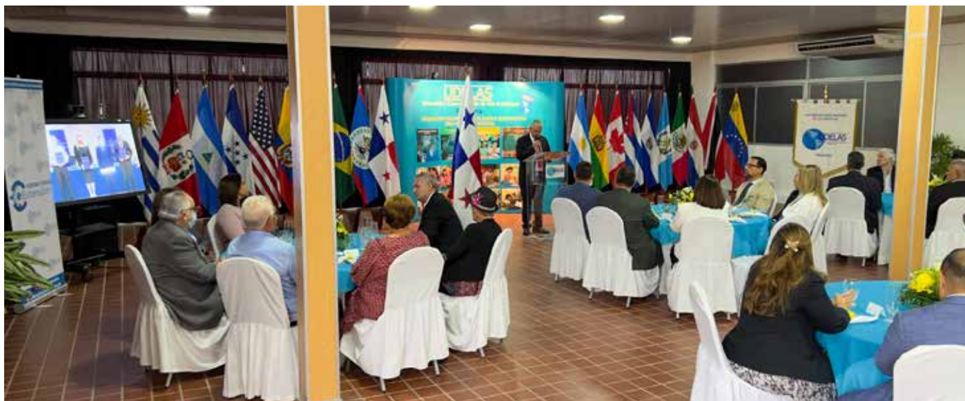
El diálogo tripartito permitió asegurar las fuentes de empleo y respetar los derechos laborales.

Como resultado de esta iniciativa, se logró minimizar los efectos laborales negativos como consecuencia de la pandemia de la Covid-19, a través del diálogo que permitió desarrollar algunas alternativas logrando 28 acuerdos que posteriormente fueron aprobados como decretos que velaban por el bienestar de los empleadores y trabajadores, y del país en general, manifestó la titular de Trabajo. La ministra Zapata aseguró que gracias a este diálogo tripartito se aseguraron las fuentes de empleo, mirando sobre todo a la pequeña y la mediana empresa, los derechos laborales como la estabilidad en el empleo, los derechos de maternidad, limitaciones razonables a la suspensión de los efectos de los contratos, así como medidas preventivas y de atención a los contagios en el ámbito laboral, todo ello a raíz del respeto permanente del Código de Trabajo y de la Mesa de Diálogo y sus acuerdos y orientaciones.