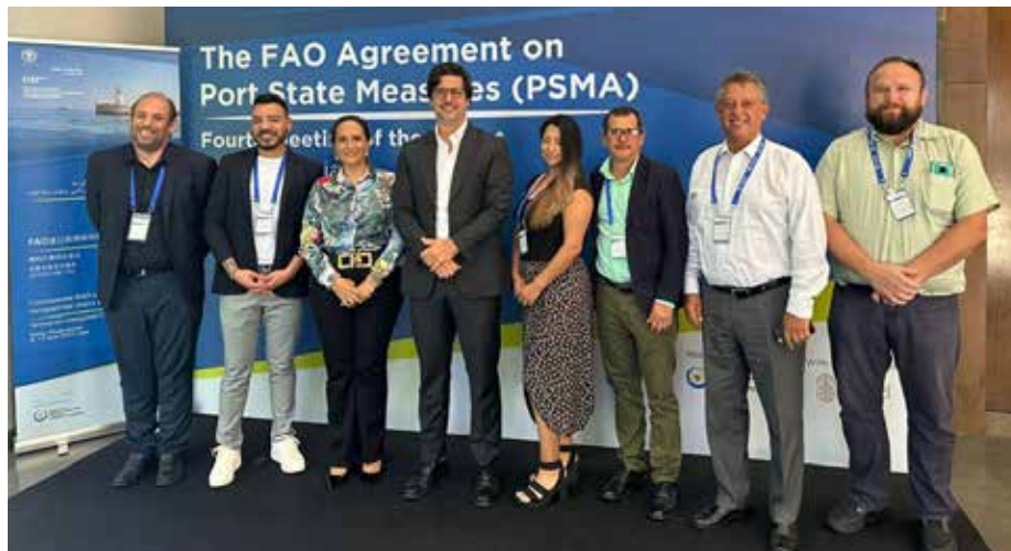
A nivel internacional la ARAP ha destacado su lucha en contra de la pesca ilegal.