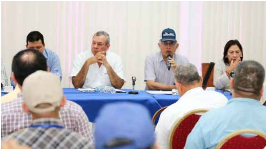
En la reunión participaron los gobernadores de Herrera y Los Santos, autoridades del sector agropecuario y del Instituto de Meteorología e Hidrología de Panamá.

Entre las acciones inmediatas para continuar impulsando la producción de alimentos, están la cosecha de agua, seguimiento a los cultivos, suplementación agropecuaria, pasto mejorado para el ganado, caminos y perforación de pozos, entre otros.