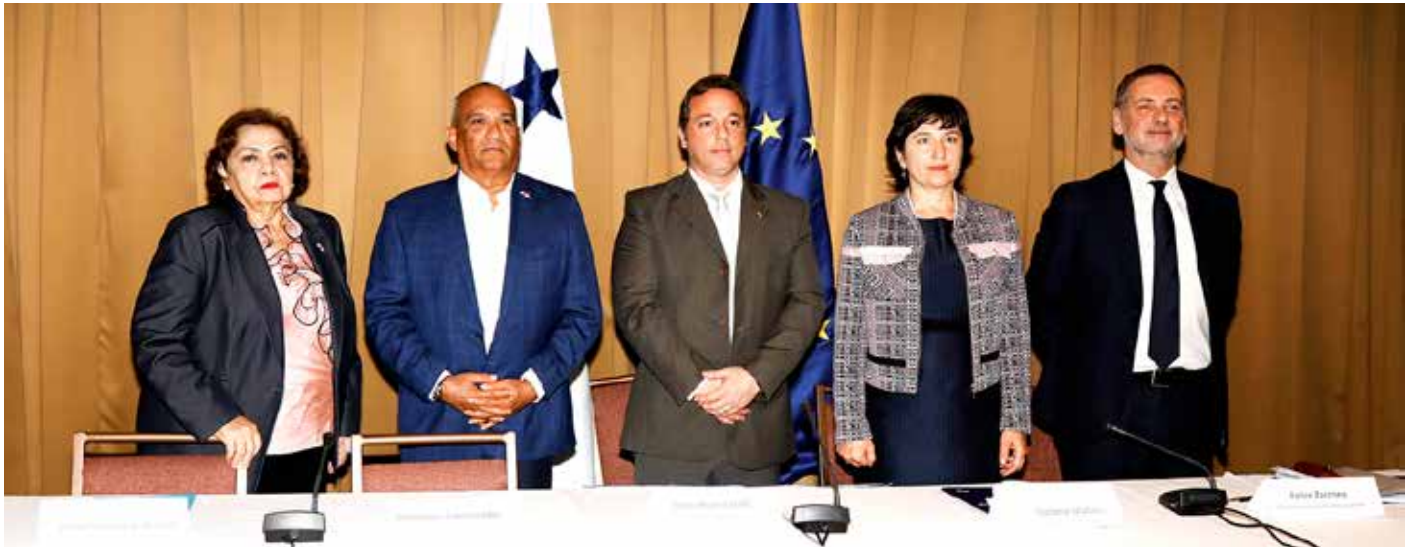
En los paneles participaron personalidades de alto nivel, tanto del sector público como privado de Panamá, América Latina y Europa.