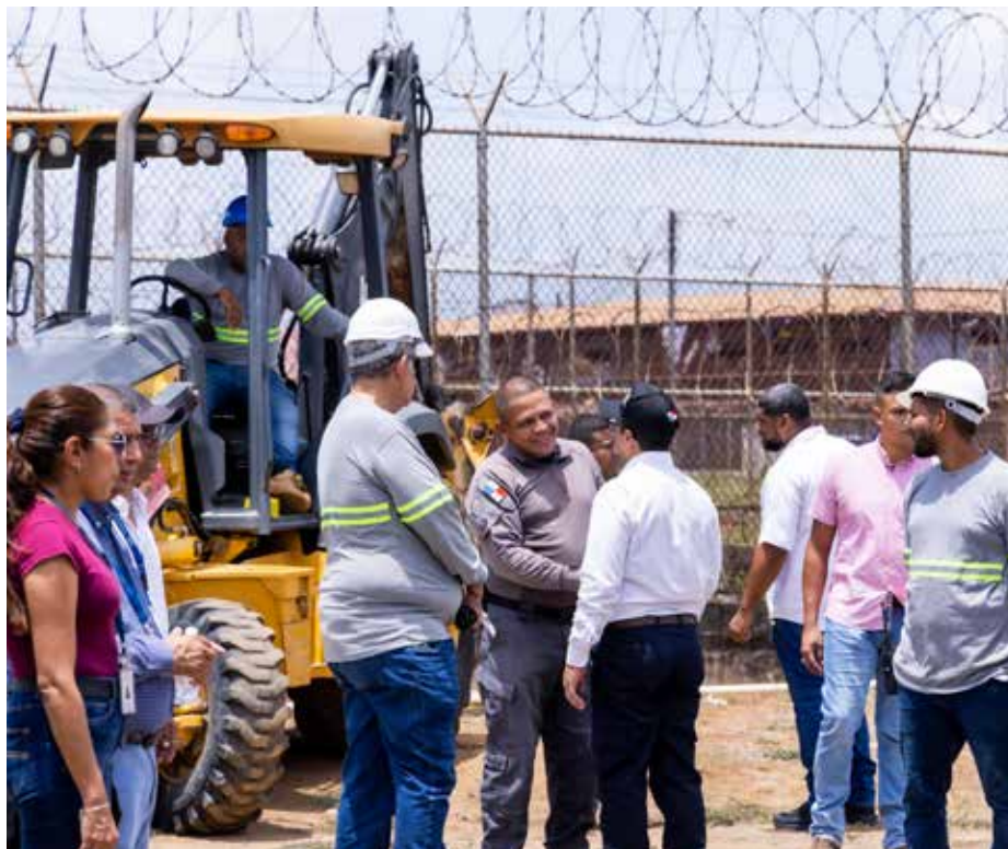
El contrato contempla la instalación de un moderno centro de monitoreo.

con nuevas herramientas de control y revisiones menos invasivas a los familiares de los privados de libertad. El ministro de Gobierno expresó que es el inicio de una transformación a nivel de seguridad para el Sistema Penitenciario. El sistema altamente tecnológico abarca la utilización de radares, bloqueadores de celulares, rayos X, escáneres, escaneo corporal, tecnología biométrica con sensores, actualizaciones de acuerdo con las innovaciones tecnológicas y cambios de equipos que resulten afectados por el vandalismo. Este nuevo paso en materia tecnológica permitirá garantizar la seguridad para los privados de libertad, custodios, personal administrativo y Policía Nacional; de la misma manera, la salvaguarda de los derechos humanos, tanto para los internos como de sus familiares, ya que los procedimientos de revisión dejarán de ser invasivos.