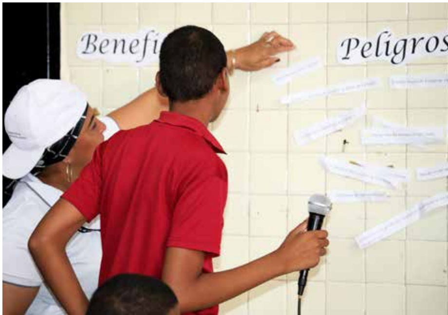
Los estudiantes de la Academia Bilingüe Juntos Podemos participaron atentos en la capacitación sobre el uso responsable de estas plataformas digitales.

La Oficina de Desarrollo Social Seguro (ODSS) utiliza el deporte y las artes como medios de aprendizaje y herramientas formativas.