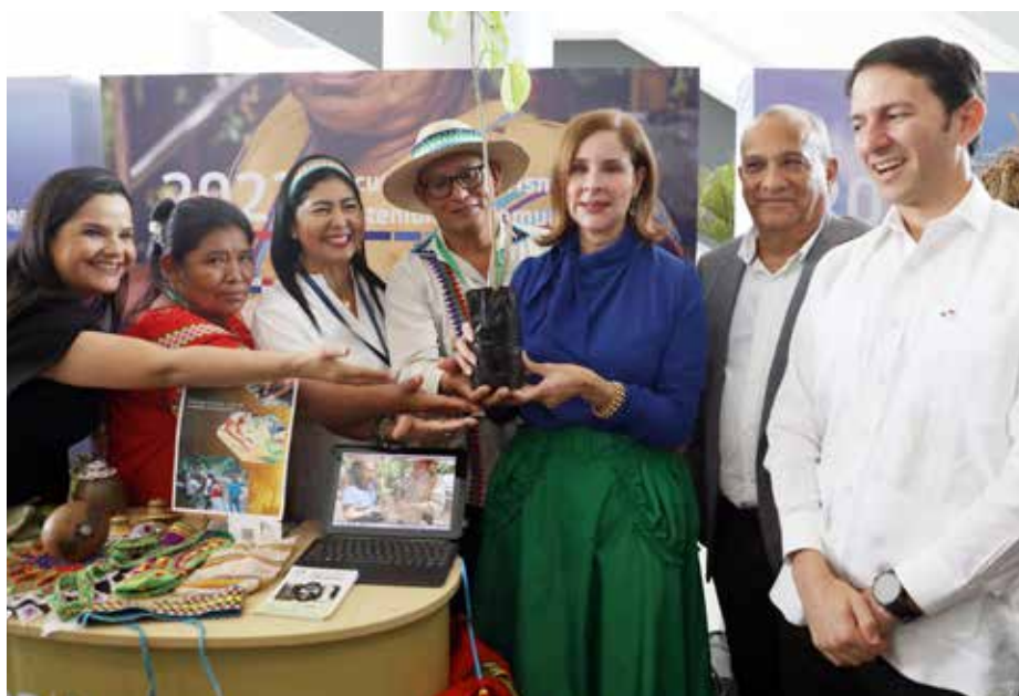
La primera dama hizo un recorrido por los 25 "stands" del Concurso de Experiencias Innovadoras.

La primera dama de la República, Yasmín Colón de Cortizo, participó en el Encuentro de Turismo Sostenible en Comunidades, donde escuchó ponencias magistrales y paneles de expertos del sector turístico, nacional e internacional, sobre la importancia de la sostenibilidad en el turismo. Colón de Cortizo también recorrió los "stands" del Concurso de Experiencias Innovadoras de Turismo Sostenible, plataforma que presenta 25 experiencias de distintas partes del país que desarrollan su potencial turístico de exportación, convirtiéndose en productos atractivos para miles de viajeros en el mundo. La primera dama agradeció la invitación e instó a cada uno de los concursantes a elevar aún más su potencial turístico.