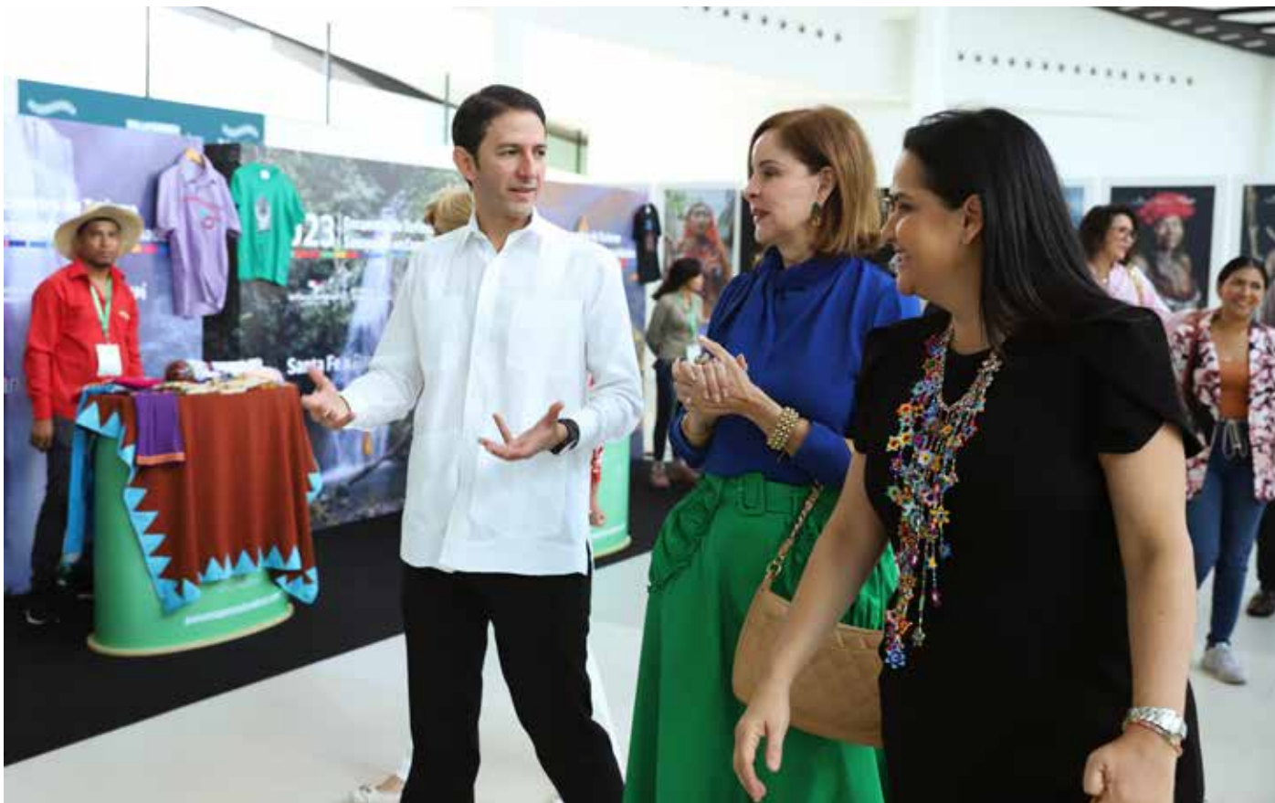
El ministro Iván Eskildsen explicó a la primera dama, Yasmín Colón de Cortizo, los componentes de la actividad.