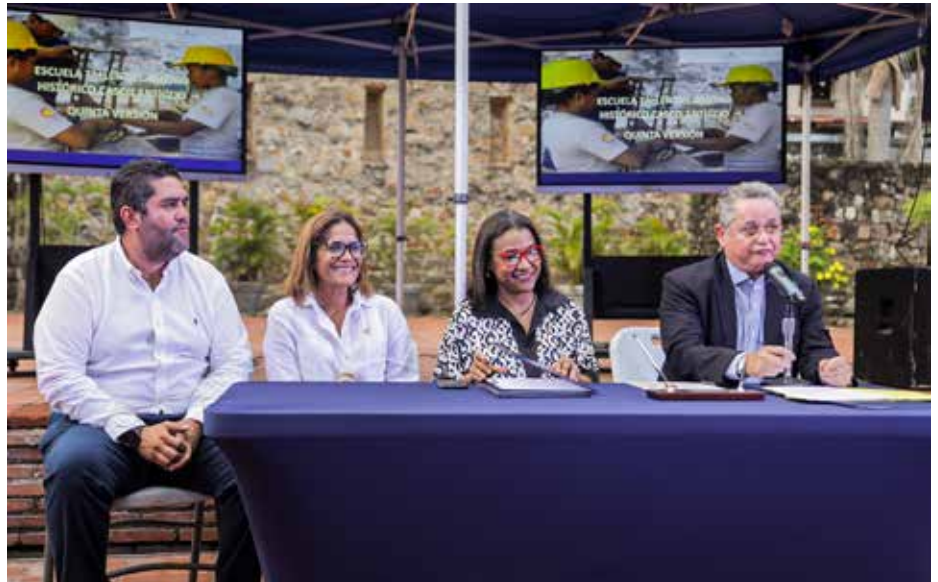
Representantes de los ministerios de la Presidencia, Cultura y Obras Públicas, así como de la Autoridad de Turismo de Panamá, del Municipio de Panamá y de otras entidades, participaron en un cabildo abierto para abordar el tema.

Con el objetivo de abordar temas de interés que impulsen el crecimiento del Centro Histórico de la Ciudad de Panamá, se llevó a cabo un cabildo abierto en el Casco Antiguo en donde se convocó a la sociedad civil, comercios y autoridades locales para informar acerca de los proyectos de inversión destinados a esta área, considerada uno de los destinos más visitados, tanto por locales como extranjeros. A través de la conformación de una mesa técnica, presidida por el Gabinete Turístico en conjunto con las instituciones del Gobierno Central y el Municipio de Panamá, se presentaron proyectos cuya inversión está por el orden de los B/.72 millones, que impactarán de manera positiva el acceso y movilidad de visitantes hacia el Centro Histórico de la Ciudad de Panamá. Entre los proyectos que se suman a la propuesta integral que desarrolla el Gobierno Nacional para mejorar la oferta turística del sector, está el Estudio, diseño, construcción y financiamiento de las calles del