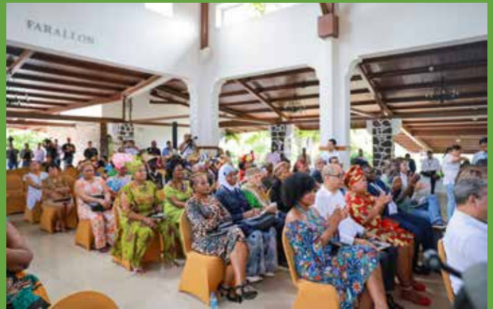
ORGANIZACIONES QUE TRABAJAN POR LOS DERECHOS DE LOS AFROPANAMEÑOS PARTICIPARON DE LA SANCIÓN DE LA NUEVA LEY.