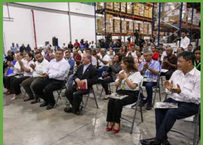
EL NUEVO ALMACÉN NACIONAL DE MEDICAMENTOS E INSUMOS SANITARIOS ESTÁ UBICADO EN RÍO ABAJO.