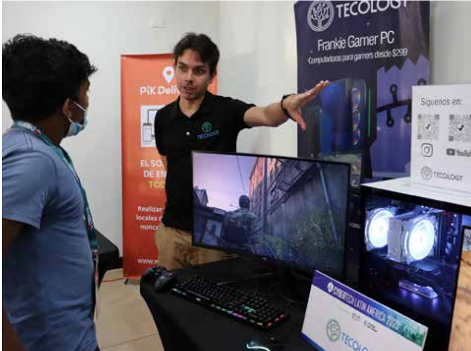
El secuestro de datos y oportunidades de negocios en la era de la conectividad fueron algunos de los temas abordados por expositores nacionales e internacionales.

El evento tecnológico Cybertech Latin America 2023, organizado por la Embajada de Israel en Panamá, con el apoyo de la