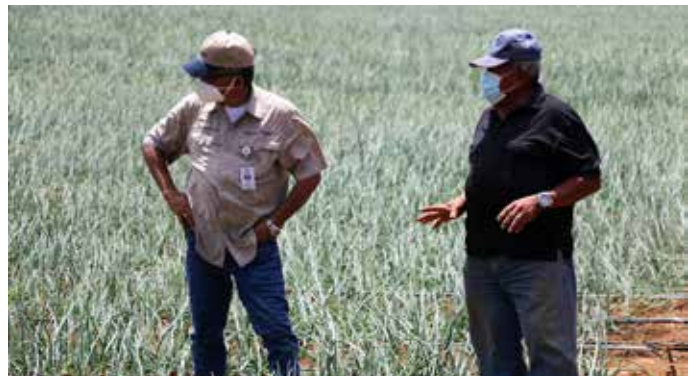
La institución financia proyectos de alta genética.

al 1% de interés con un plazo de hasta 25 años, los micros, pequeños y medianos productores de todo el país que se encuentren desarrollando la actividad agropecuaria y que, además, tengan la intención de implementar proyectos con tecnologías en pro de la mitigación al cambio climático. Las actividades que el BDA financiará con este programa comprenden la cosecha o captación de agua (compra de equipo y materiales), así como de instalaciones de bombas de agua, reservorios, pozos, geomembranas y otros de esta naturaleza.