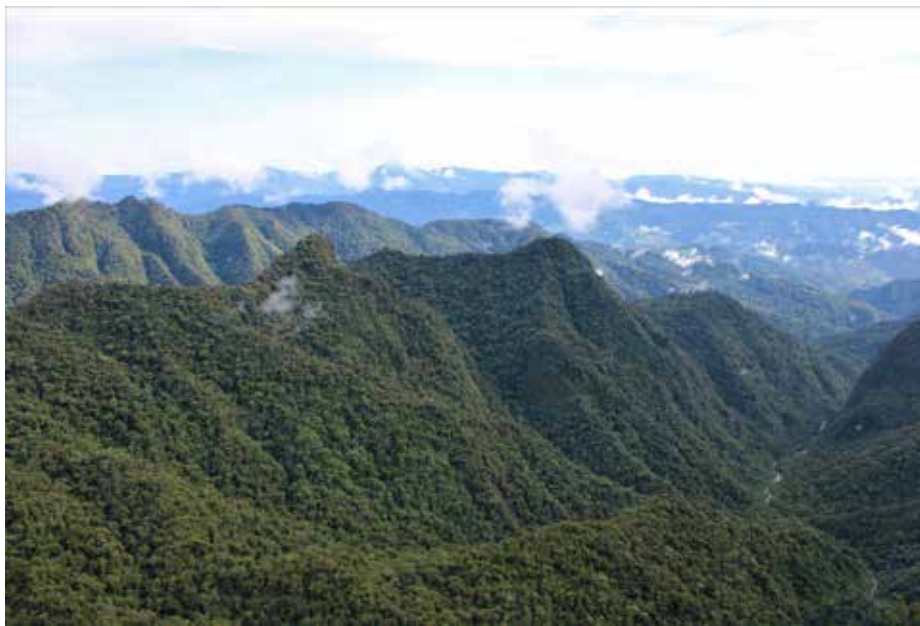
El PILA es el único parque del país compartido por dos naciones, Costa Rica y Panamá.

El Ministerio de Ambiente (MiAmbiente), a través de la Dirección de Información Ambiental (DIAM), la Dirección de Áreas Protegidas y Biodiversidad (DAPB) y la Dirección Regional en Chiriquí, concluyó los trabajos de saneamiento de los límites del Parque Internacional La Amistad (PILA), lado Pacífico. Para tal efecto, se contó con el financiamiento del Fideicomiso Ecológico de Panamá (Fideco) y el apoyo del Centro de Incidencia Ambiental (CIAM). Los trabajos realizados consistieron en sanear los límites; identificar espacialmente áreas con cobertura boscosa de interés para la conservación; realización de talleres participativos en las comunidades cercanas al PILA, en los que se informa a la población todos los aspectos que involucrarían el saneamiento y ampliación de los límites del parque. El Plan de Manejo del PILA, aprobado en 2004, determinó que esa área protegida contaba con 207,000 hectáreas. Luego de los trabajos de saneamiento, ampliación de los límites y concluidos los procesos establecidos en la Resolución AG No. 0916-2013, de 20 de diciembre de 2013 –para la actualización de límites de áreas protegidas– se aumentará el área de protección del parque más de 5,000 hectáreas. Como resultado final, el PILA contará con más de 212,000