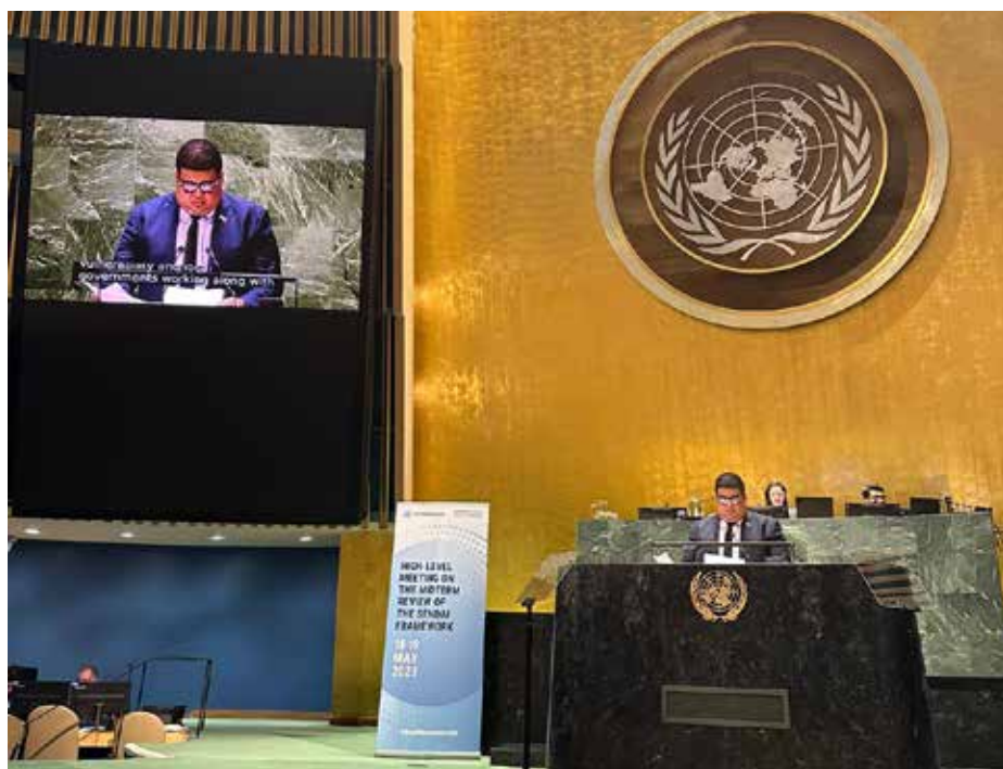
La Secretaría Técnica del Gabinete de Gestión Integral del Riesgo de Desastres diseñó una hoja de ruta para la elaboración de la nueva Política Nacional de esta temática para 2022-2030.