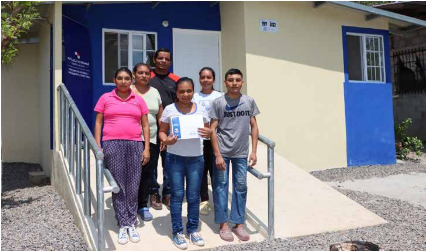
Los beneficiados residen en Nueva Gorgona, Cabuya, Sorá, Sajalices, Las Lajas y Bejuco.