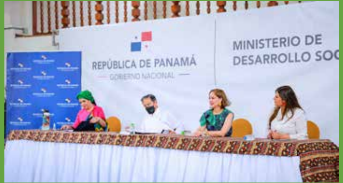
SANCIÓN DE LA LEY QUE CREA LA SECRETARÍA NACIONAL DE POLÍTICAS Y DESARROLLO PARA LOS AFROPANAMEÑOS.