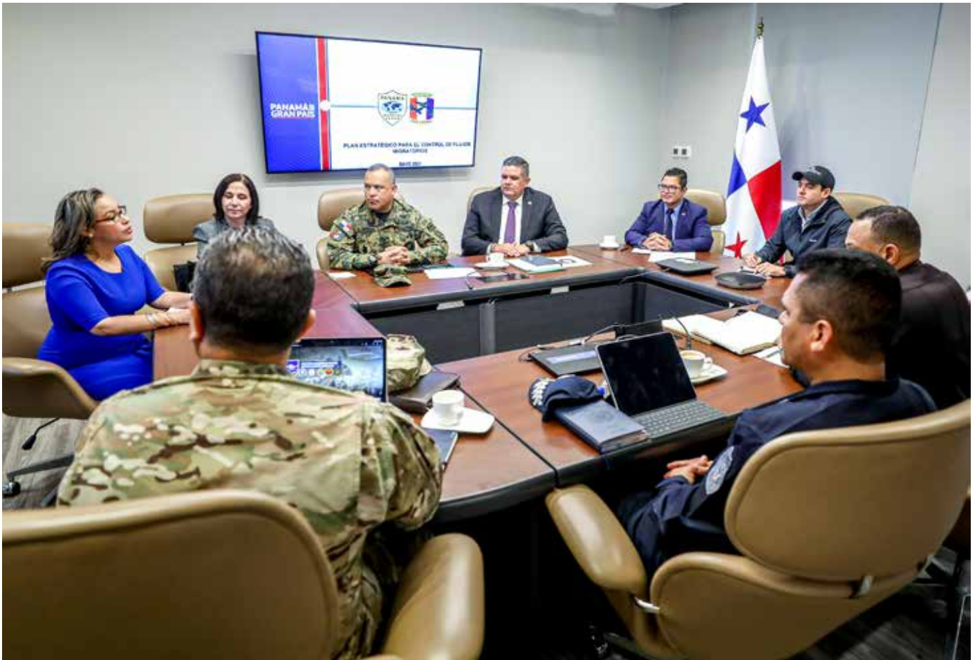
Los directores de los estamentos de seguridad presentan un informe semanal al Ejecutivo sobre temas de seguridad.