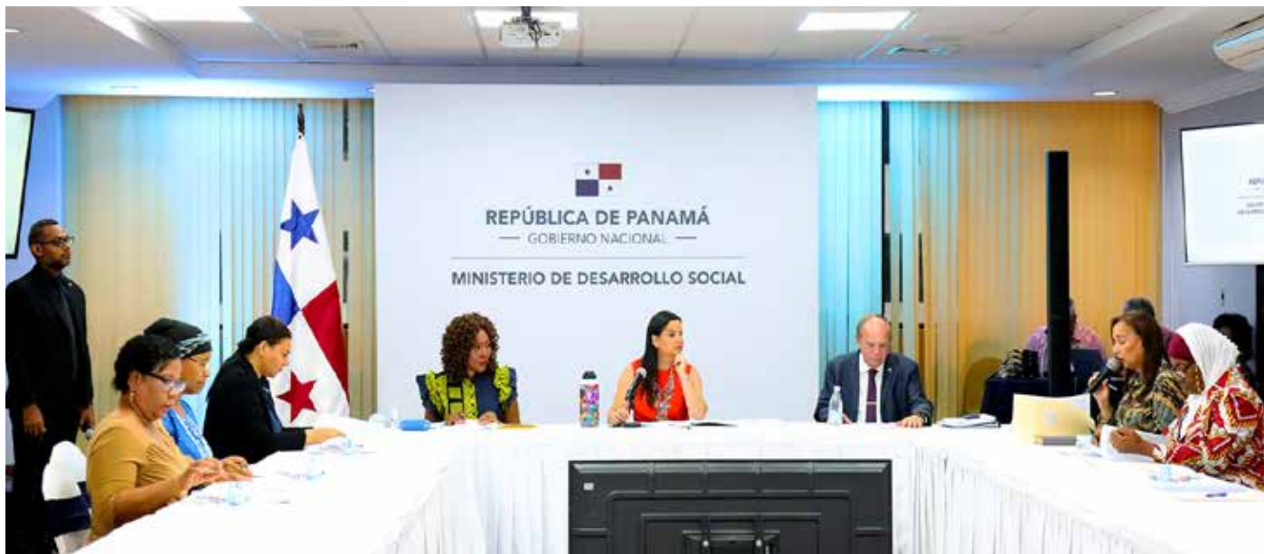
La titular del Mides, María Inés Castillo, sigue trabajando para visibilizar los aportes de la población afrodescendiente.