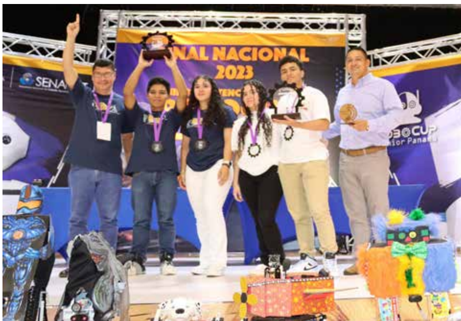
Los equipos Bender21, de Veraguas (izq.), y Roboencanto, de Chiriquí (der.), reciben el reconocimiento de manos de autoridades de la Senacyt, Meduca y CDS.