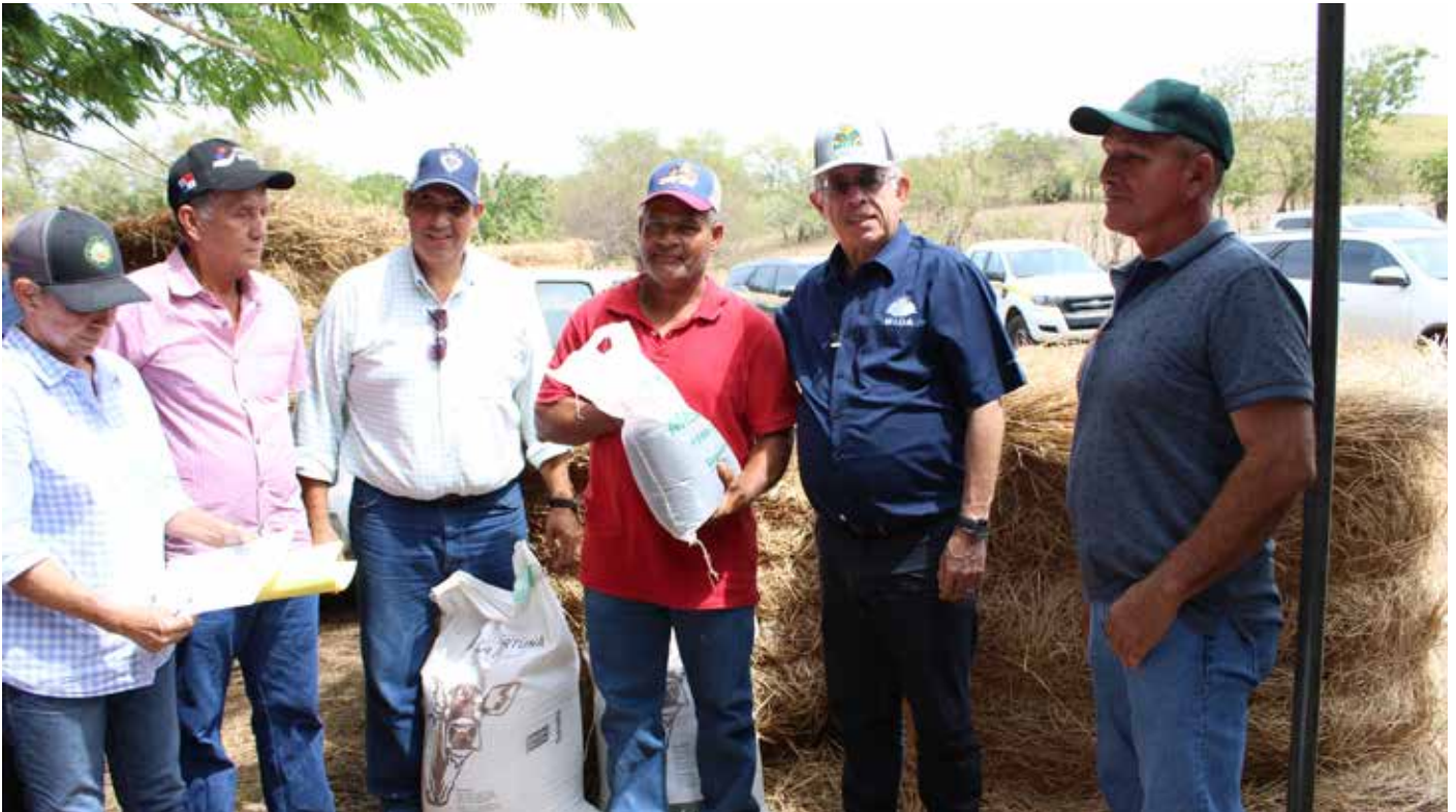
Pacas de forraje y melaza son algunos de los insumos que han recibido los ganaderos.