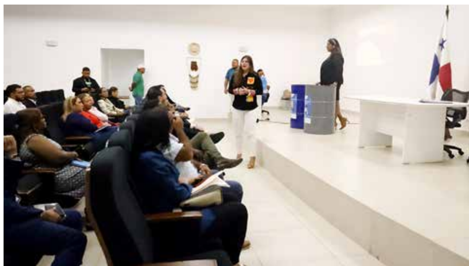
La AAUD recibió cortesía de sala en la reunión de la Junta Técnica, donde se explicó el Programa de Reciclaje Institucional.

A través de este programa institucional, en el cual trabajan ocho entidades y que se ha extendido a las escuelas José Agustín Arango y Manuel E. Amador, han sido recolectadas cuatro toneladas de desechos.