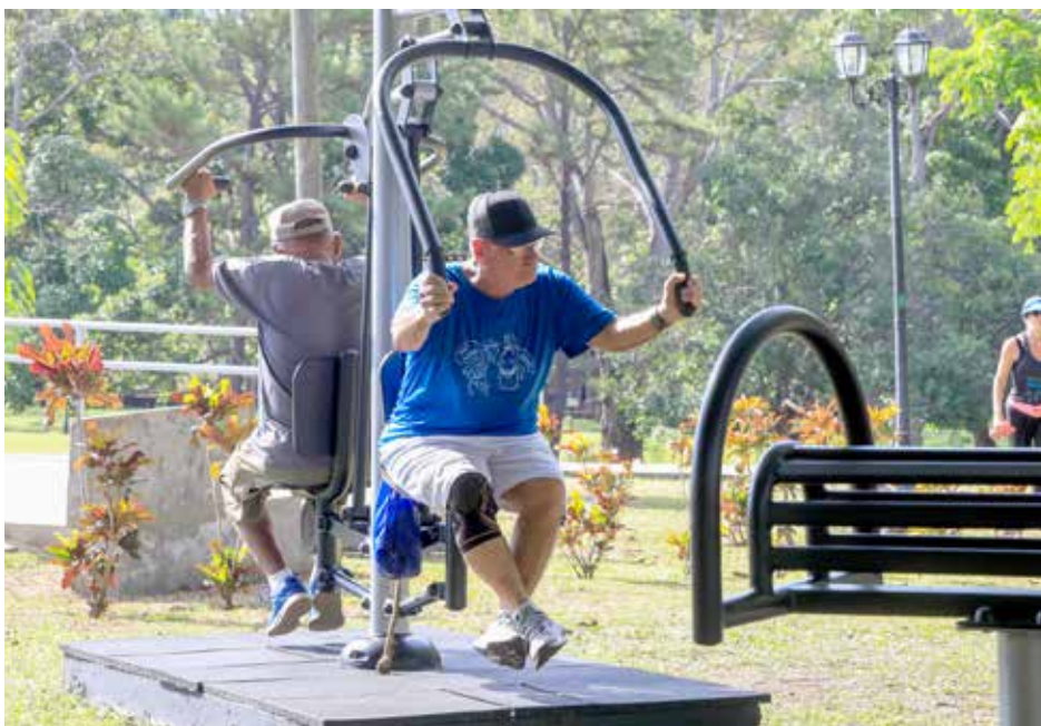
El nuevo equipo es de uso exclusivo para mayores de 18 años.

Esta semana, la primera dama de la República, Yazmín Colón de Cortizo, inauguró en el Parque Recreativo y Cultural Omar un conjunto de 20 máquinas biosaludables, una variedad de equipos para hacer ejercicios diseñados con el objetivo de mejorar la salud y el bienestar físico. Colón de Cortizo indicó que estas 20 máquinas se suman a las 14 existentes, con lo cual se ofrecen alternativas para que más usuarios tengan la oportunidad de ejercitarse. El Parque Omar es el pulmón de la ciudad y por ello se continúa realizando mejoras a las instalaciones. Bicicleta, prensa de pecho - hombros - horizontal y piernas, caminadora y caminadora aérea; banco de abdominales, extensión de piernas -bíceps y tríceps-, estiramiento para espalda y cadera, estiramiento de piernas, giro de cadera, remo, barras inclinadas, tabla de surf, elíptica, masajeador, rueda de hombro y tai chi hacen parte del conjunto biosaludable. Las máquinas han sido colocadas en una superficie de concreto debidamente amortiguada; además, el área cuenta con letreros sobre las normas de uso y de seguridad. El nuevo equipo es de uso exclusivo para mayores de 18 años; los usuarios deberán cuidar cada una de las máquinas, está prohibido comer sobre ellas, montarse varias personas, pararse sobre los asientos o bancos abdominales, entre otras normas de uso.