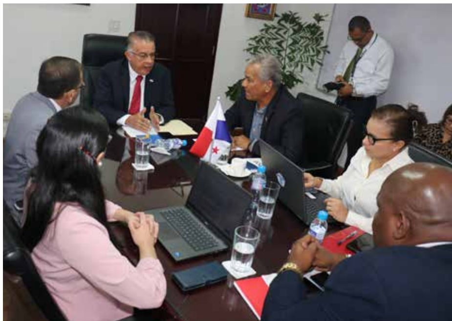
Los participantes se mostraron satisfechos por los avances logrados en las discusiones de cada uno de los temas.

La Autoridad de los Recursos Acuáticos de Panamá (ARAP) participó recientemente en la reunión de trabajo efectuada entre el Ministerio de Desarrollo Agropecuario (MIDA) y la Organización del Sector Pesquero y Acuícola del Istmo