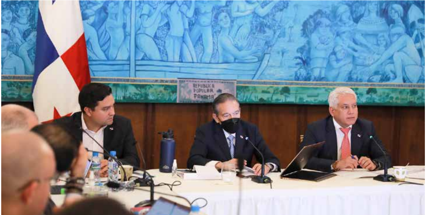
El Centro de Formación Integral (CEFI) Nuevo Emperador está terminado al 100%.