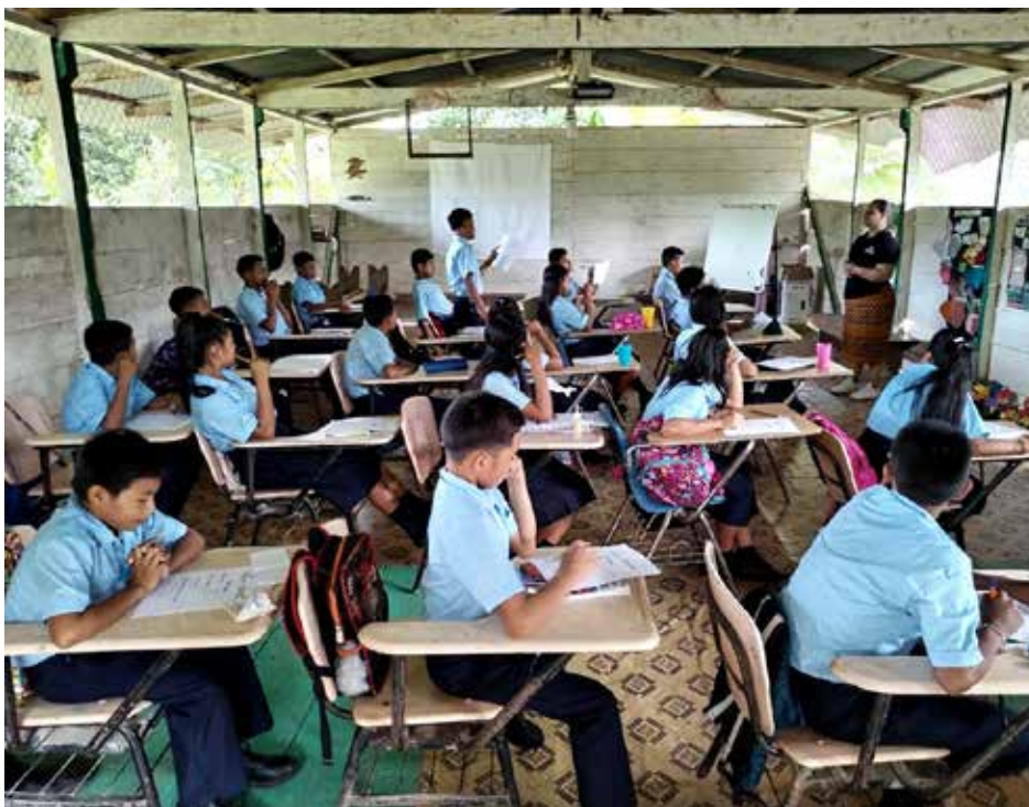
Se fortaleció a los jóvenes en habilidades socioemocionales y competencias.

Más de 100 estudiantes de séptimo, octavo y noveno grado de la Escuela de Púculo, en el distrito de Pinogana, provincia de Darién, recibieron orientación del personal técnico de la Dirección Regional de Trabajo en esta provincia, a través del Programa Orienta Panamá, sobre las herramientas necesarias para identificar las carreras con mayor ocupación en el mercado laboral actual. En la jornada de orientación se fortaleció a los estudiantes en habilidades socioemocionales y competencias; cómo confeccionar correctamente una hoja de vida, la vestimenta adecuada para una entrevista laboral; la importancia de la puntualidad y la responsabilidad, y el emprendimiento. Desde el mes de marzo de 2023 hasta la fecha, la Dirección de Empleo del Ministerio de Trabajo y Desarrollo Laboral ha orientado a más de 7 mil estudiantes de escuelas públicas en todo el territorio nacional. La iniciativa Orienta Panamá tiene como objetivo brindarles orientación a los estudiantes graduandos sobre las tendencias ocupacionales en el campo laboral, con el apoyo de universidades y empresas que promueven ofertas académicas.