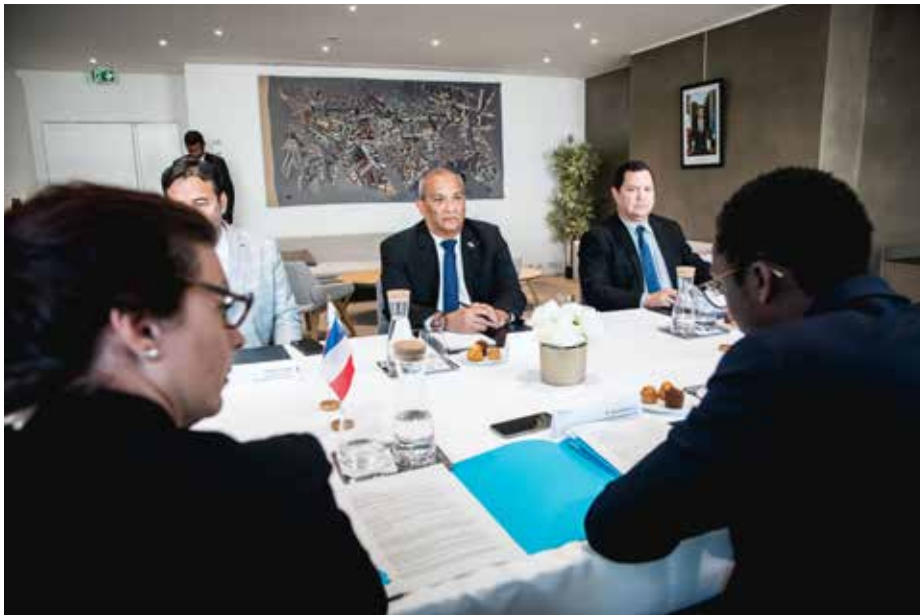
Esta reunión bilateral se llevó a cabo en la sede de la Unesco en París, Francia.

Ambos gobiernos manifestaron la intención de continuar trabajando de forma conjunta para establecer políticas fuertes en la lucha contra las actividades ilegales que afecten a los océanos.