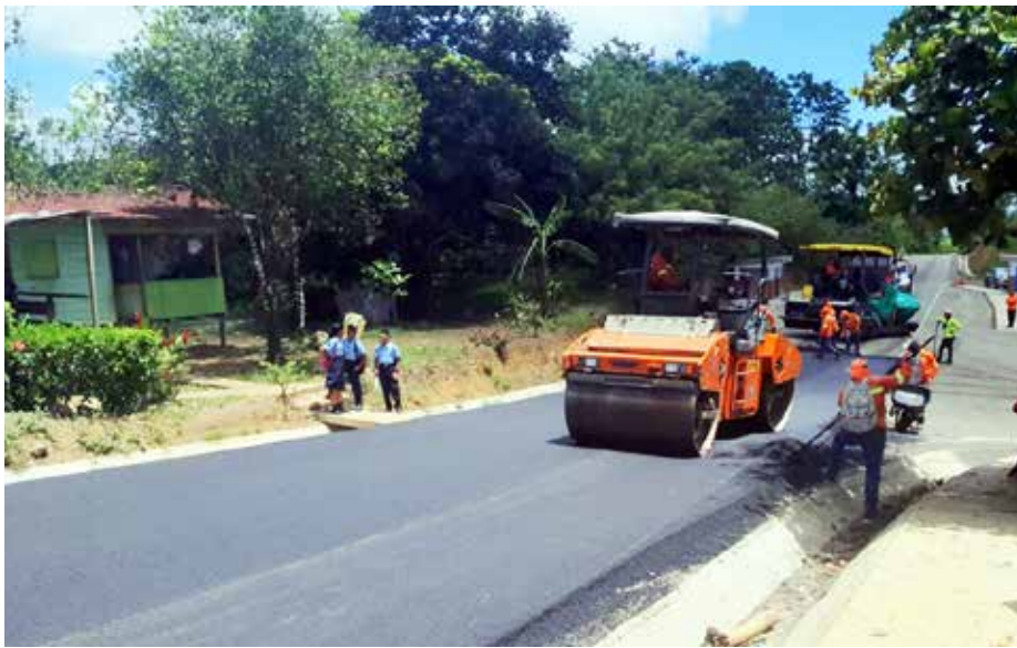
Colocación de carpeta asfáltica en Loma Estrella - Tierra Oscura, en Almirante, Bocas del Toro.

Este proyecto tiene como objetivo mejorar las condiciones de la red vial de la región, para facilitar el acceso a los servicios básicos a toda la población.