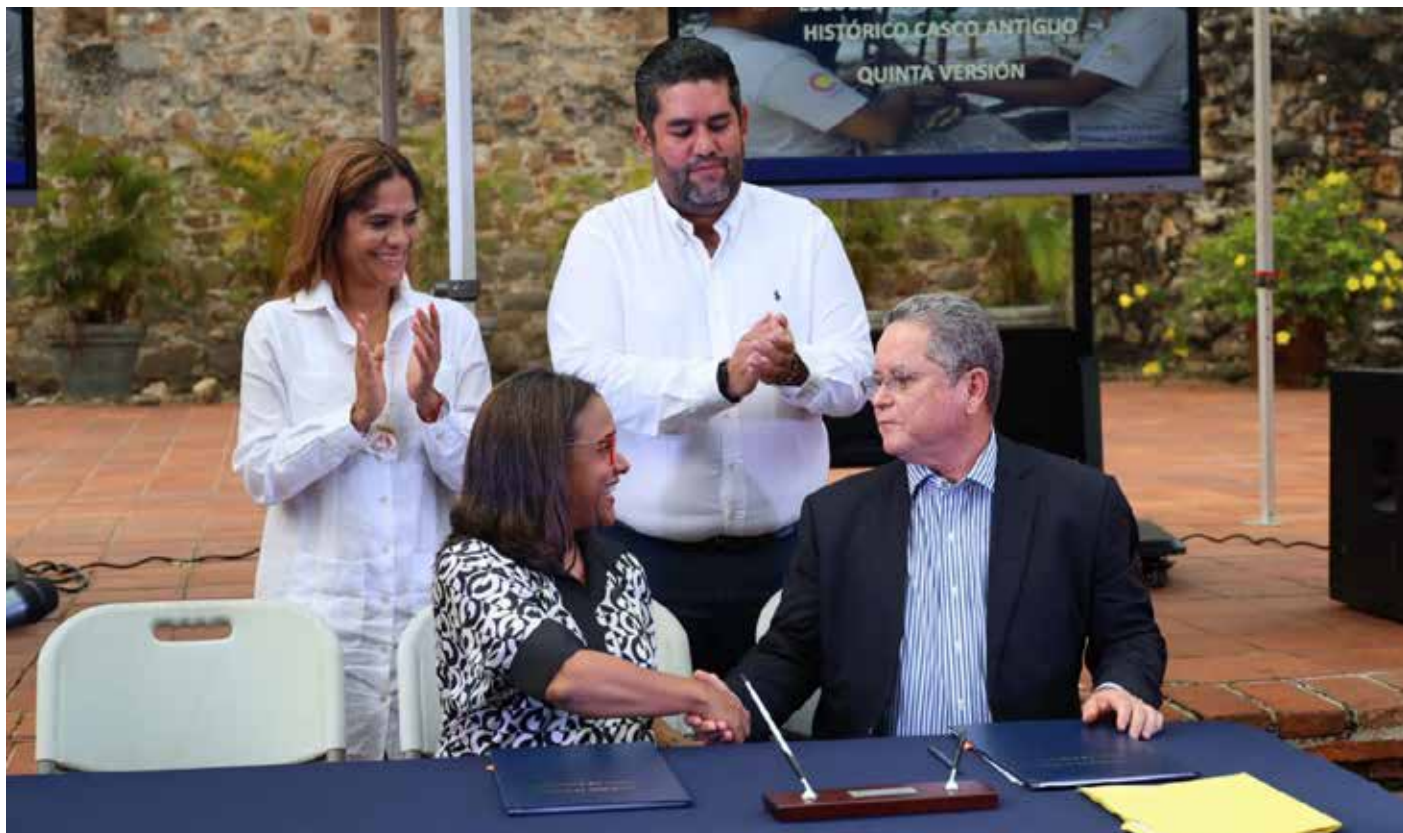
Giselle González Villarrué, ministra de Cultura, y Ovidio Díaz Espino, presidente de la Camtur, sellaron el compromiso.

Un Convenio Marco de Cooperación Cultural destinado a coordinar diversas acciones técnicas para la realización y desarrollo de proyectos que promuevan la concienciación de valores culturales y turísticos fue formalizado entre el Ministerio de Cultura (MiCultura) y la Cámara de Turismo de Panamá (Camtur). Entre los propósitos fundamentales de este acuerdo está fortalecer las diferentes actividades que realiza Camtur y los programas y proyectos culturales que promueve MiCultura desde los espacios culturales y generadores de identidad. Por otra parte, ambas entidades impulsarán proyectos en conjunto que contribuyan al mejoramiento y enriquecimiento de las tareas que desarrollan las partes y que favorezcan el ámbito cultural y turístico. Al mismo tiempo, intercambiarán experiencias, documentos, información y conocimientos que coadyuven al logro de los programas, planes y proyectos que cada uno lleve a cabo.