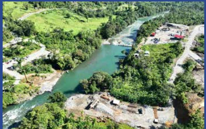
CON LA INVERSIÓN DE B/.71.9 MILLONES, SE EJECUTA EL PROYECTO DE ESTUDIO, DISEÑO, CONSTRUCCIÓN Y FINANCIAMIENTO DE LA CARRETERA COCLESIITO - KANKINTÚ.