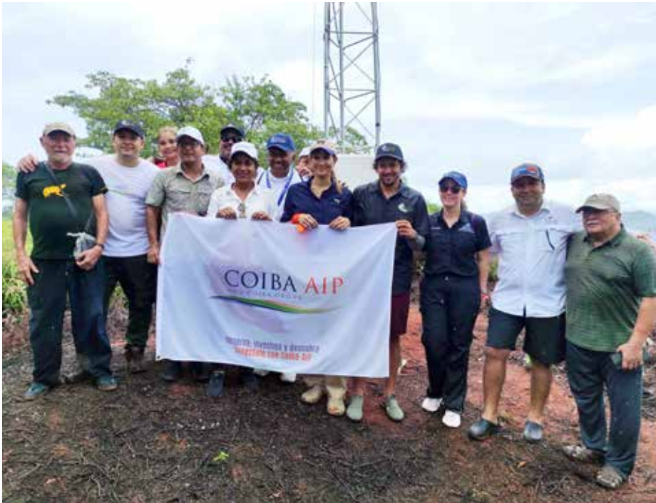
Autoridades de Coiba AIP, Senacyt, Ministerio de Relaciones Exteriores y Ministerio de Ambiente asistieron a la inauguración de la estación meteorológica y del sendero de la Estación Científica Coiba AIP.