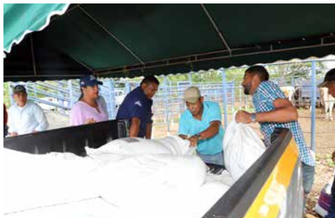
El apoyo del Gobierno Nacional, consistente en insumos agrícolas, ha sido entregado en Panamá Oeste, Coclé y Colón.