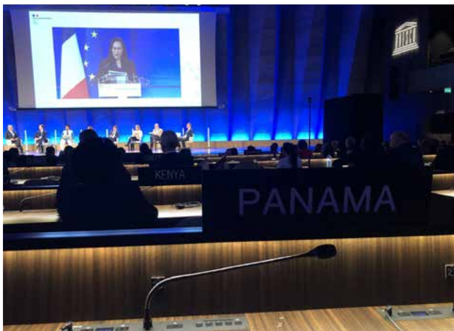
El proyecto será ejecutado por MiAmbiente como autoridad nacional designada con el apoyo de ONU Medio Ambiente, como socio en la implementación.