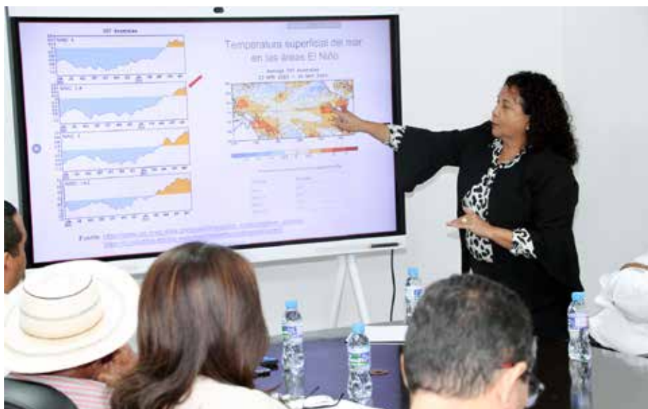
El MIDA entrega ensilajes, insumos agropecuarios, melaza, alimentos, sal mineralizada y pacas a los ganaderos de Los Santos, Herrera, Veraguas, Coclé y Panamá Oeste.

Para el próximo mes se convocó una reunión con el Instituto de Meteorología e Hidrología de Panamá y los gremios del sector para monitorear la evolución de las condiciones climáticas, las zonas y los cultivos.