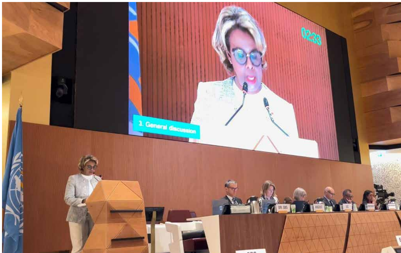
La viceministra de Salud, Ivette Berrío, durante la 76 Asamblea Mundial de la Salud, que se desarrolló del 21 al 30 de mayo en Ginebra, Suiza.