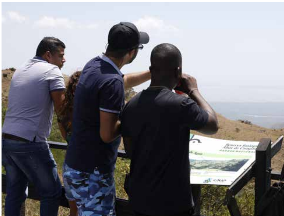
En el proyecto participarán actores locales de las comunidades de Chicá de Chame y El Limón de Campana.

Geoparque Puente de las Américas es una iniciativa para promover el patrimonio geológico de distintas comunidades a lo largo del país.