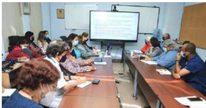
Reunión en Sala de Situación en la Dirección General de Salud del Minsa.

Los equipos regionales del Programa Ampliado de Inmunización (PAI) están vacunando en horario de lunes a viernes, de 7:00 a.m. a 2:00 p.m., en todos los centros, policentros y policlínicas del país.