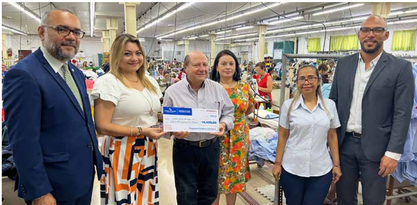
Confecciones Marggie, S.A. contrató a 16 mujeres a través de la estrategia Empleo Solidario.