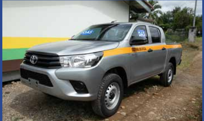
VEHÍCULO PARA LA DIRECCIÓN REGIONAL DEL MINISTERIO DE CULTURA EN LA COMARCA.