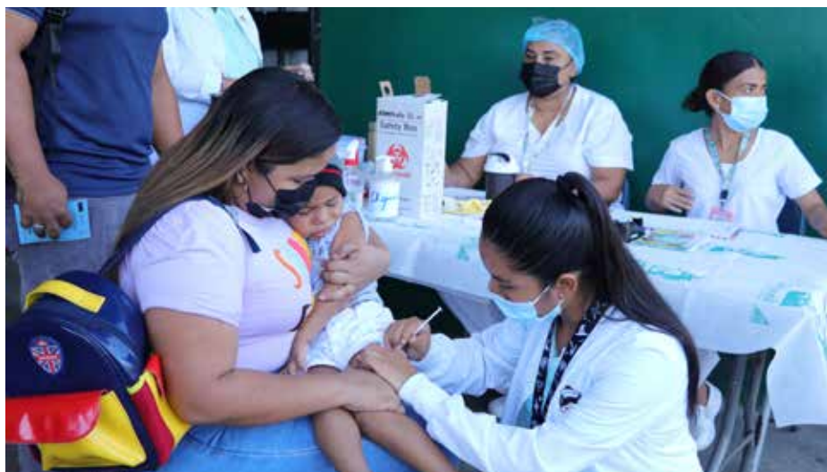
Vacunación contra la influenza en el Centro de Salud Amelia Denis de Icaza, en San Miguelito.

Ante el incremento en las últimas semanas de casos de influenza a nivel nacional, el equipo de la Dirección General de Salud del Ministerio de Salud (Minsa) y representantes de la Caja de Seguro Social (CSS) se reunieron en Sala de Situación para evaluar la realidad epidemiológica del virus y las acciones para