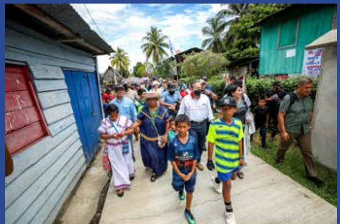
INAUGURACIÓN DE DOS AGRODISTRIBUIDORAS, EN KANKINTÚ Y PUEBLO NUEVO (DISTRITO DE JIRONDAI), POR UN MONTO TOTAL DE B/.242,572.38.