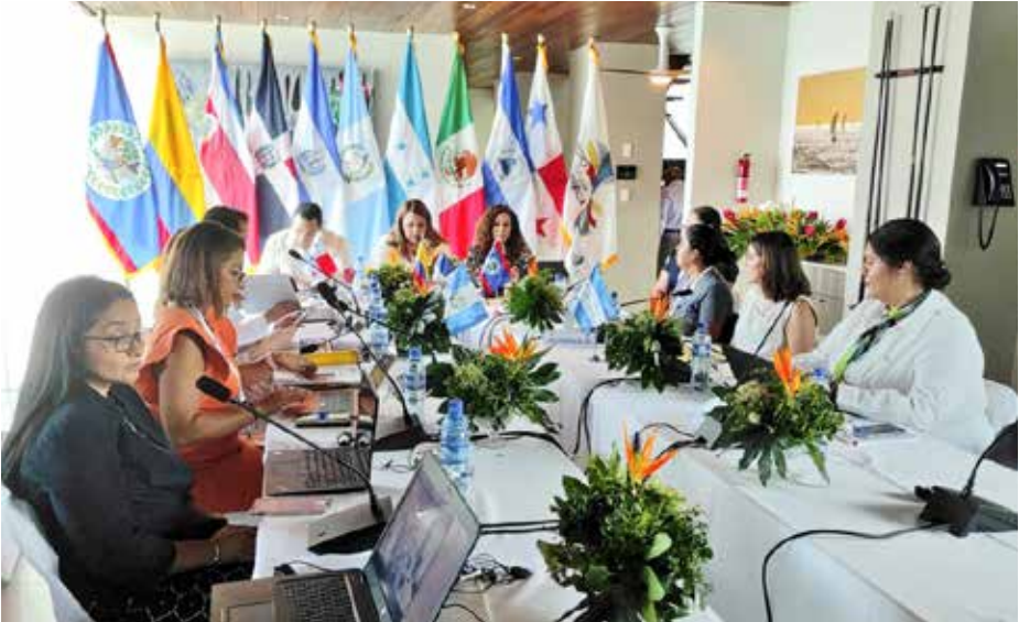
México y Panamá celebraron la II Reunión de la Comisión Ejecutiva 2023 del Proyecto Mesoamérica en Placencia, Belice.

En el marco de la Presidencia Conjunta México y Panamá para este primer semestre de 2023, comisionados presidenciales de los