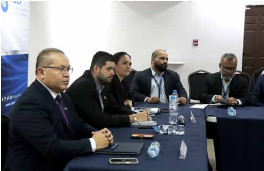
En la reunión participaron representantes de la ASEP, Ministerio de Seguridad, AIG y operadores de telefonía móvil.

Con este proceso, se trata de combatir la delincuencia organizada.