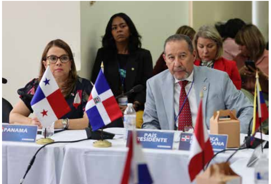
Panamá firmó acuerdos de cooperación, con el Convenio Andrés Bello de Integración Educativa, Científica y Cultural y con la Universidad Santa María La Antigua (USMA).

En la XXIX Reunión de Ministros de Educación del Convenio Andrés Bello (REMECAB), los jefes de carteras educativas de los 12 países miembros del organismo eligieron al nuevo país presidente, asumiendo Panamá la oportunidad de dirigir dicha organización hasta el año 2025. Entre los ministros de Educación que asistieron a esta cita del REMECAB figuran Bolivia, Chile, Cuba, Ecuador, España, México, Panamá, Paraguay, Perú y República Dominicana, mientras que Venezuela y Colombia participaron virtualmente. En el REMECAB se generan aportes e instrumentos para fortalecer las acciones en el sistema educativo y la cultura. Durante los últimos años, se logró actualizar la tabla de equivalencia, que son las disposiciones que generan oportunidad de educarse a los niños migrantes, debido a la gran movilidad humana en los países centroamericanos. En esta ocasión, la Secretaría Ejecutiva