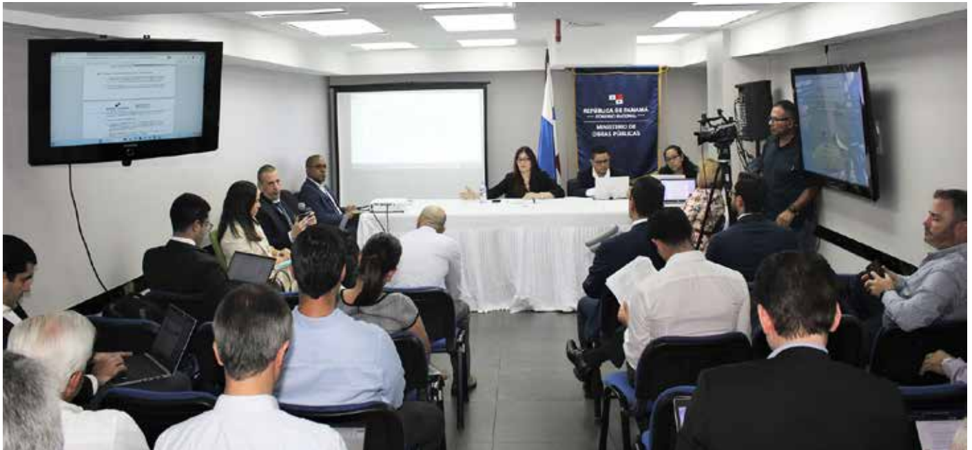
En la reunión se aclararon dudas y se recabaron consultas y observaciones sobre las bases de la precalificación para este contrato.