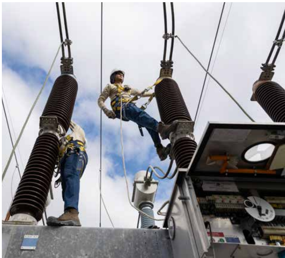
La cuarta línea forma parte de los proyectos del PESIN.

nuevas subestaciones eléctricas y líneas de transmisión que aseguran el soporte al crecimiento de la demanda y generación en el país. A corto plazo, el PESIN involucra el desarrollo y la construcción de al menos 30 proyectos que se encuentran avanzando "a buen ritmo, y ajustados al cronograma". Actualmente, tiene un total de 56% de avance en los proyectos de ejecución, un 64% de avance en los que están en proceso de licitación y un 59%, en los de fase de diseño, informó Mosquera Castillo.