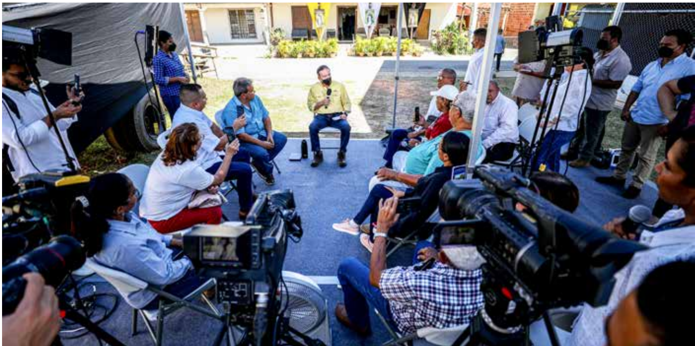
En conferencia con representantes de la prensa, el mandatario pidió a los panameños hacer un buen uso de la energía y del agua por la crisis climática que se vive.