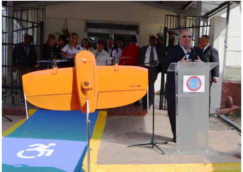
Autoridades de gobierno participaron del aniversario 77 de este instituto.

Entre las nuevas herramientas está el dron de mapeo Wingtra, que aporta una base de datos real y actualizada para los planes y proyectos del Gobierno Nacional.