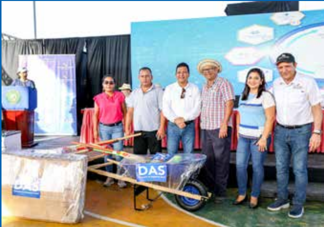
ENTREGA DE ESTUFAS, REFRIGERADORAS, KITS DE LIMPIEZA Y MÁS.