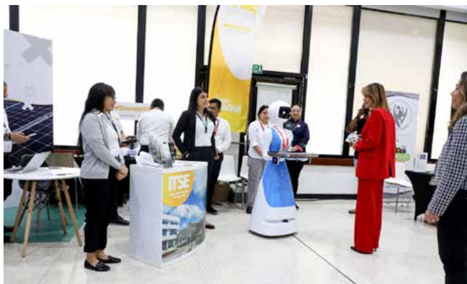
La viceministra Yill Otero, durante su intervención en el evento.

Avances en la concreción de los Objetivos de Desarrollo Sostenible (ODS).