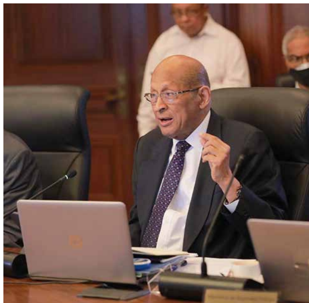
Héctor Alexander, ministro de Economía y Finanzas.

De los B/.32,754 millones, B/.14,421 millones (44%) estarán dirigidos al desarrollo de los servicios sociales, y B/.5,846 millones (18%) para servicio de la deuda pública, en su gran mayoría que proviene de gobiernos anteriores.