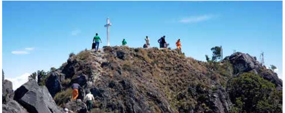
Boquete es un atractivo de alta demanda, tanto por nacionales como extranjeros.

Más de siete mil visitantes han sido guiados por guardaparques del Ministerio de Ambiente (MiAmbiente) en su recorrido por el Parque Nacional Volcán Barú (PNVB). Un gran número de visitantes nacionales y extranjeros atraídos por la naturaleza emprenden una aventura en este parque, con la atención y guía de los guardaparques del MiAmbiente, quienes conocen bien el área y pueden dar las orientaciones oportunas para disfrutar con éxito la excursión. En los primeros seis meses del año, se reportó la visita de 7,738 turistas, la mayoría nacionales. Entre las atracciones del Parque Nacional Volcán Barú, ubicado en la provincia de Chiriquí, se encuentra la vista de los océanos Atlántico y Pacífico al mismo tiempo; ecosistemas, senderos, diversidad de especies, el agradable clima, los paisajes y el trayecto para disfrutar de la naturaleza. En el PNVB, MiAmbiente desarrolla trabajos de mejoras como escaleras, puentes peatonales, señalética