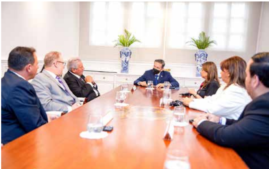
Maxwell Leadership Foundation patrocina el Movimiento de Transformación que se desarrollará en las escuelas.

El Meduca y la Fundación Panamá Lidera llevan el programa a 250 planteles impactando a 90 mil estudiantes.