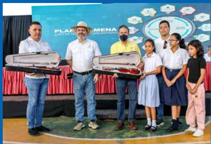
INSTRUMENTOS MUSICALES PARA ESTUDIANTES.