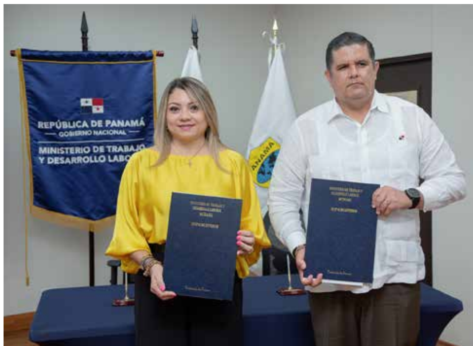
Convenio de Cooperación Interinstitucional entre el Mitradel y el Minseg.