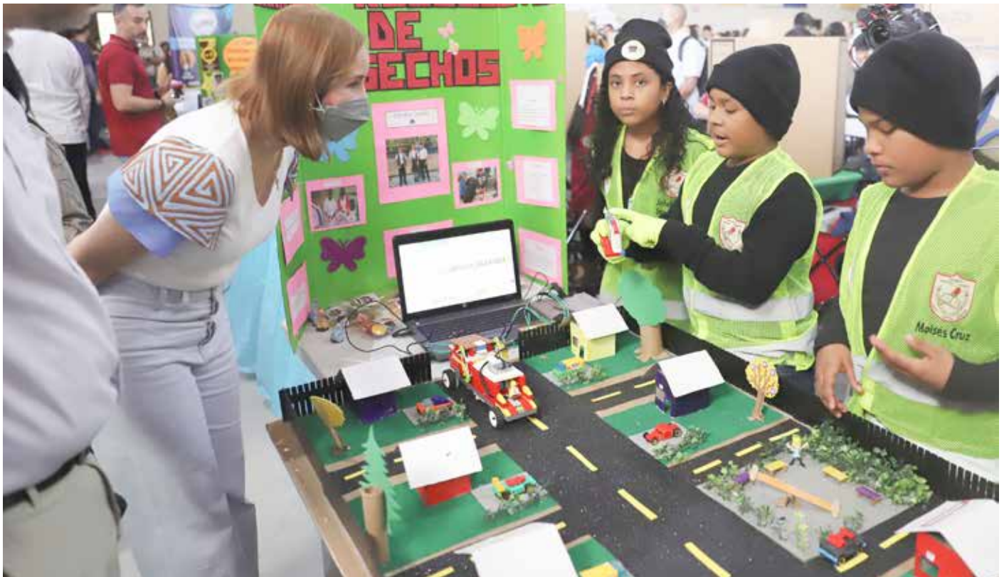
Participaron 122 equipos de Panamá Centro.