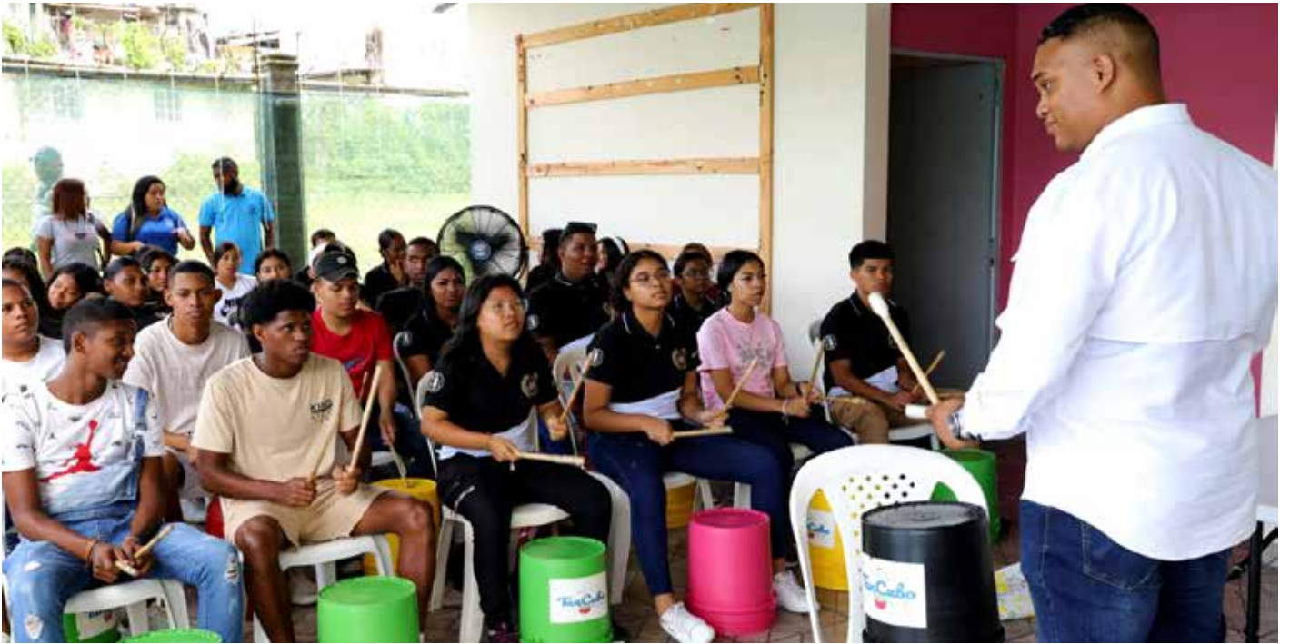
A los jóvenes se les entregó implementos deportivos como balones de baloncesto y de fútbol.