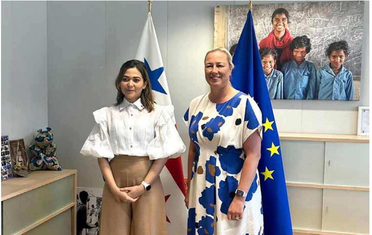
La canciller Janaina Tewaney Mencomo, junto a la comisaria Jutta Urpilainen.

Panamá reiteró a la comisaria europea de Asociaciones Internacionales la importancia del establecimiento del Centro Regional Copernicus en Panamá.