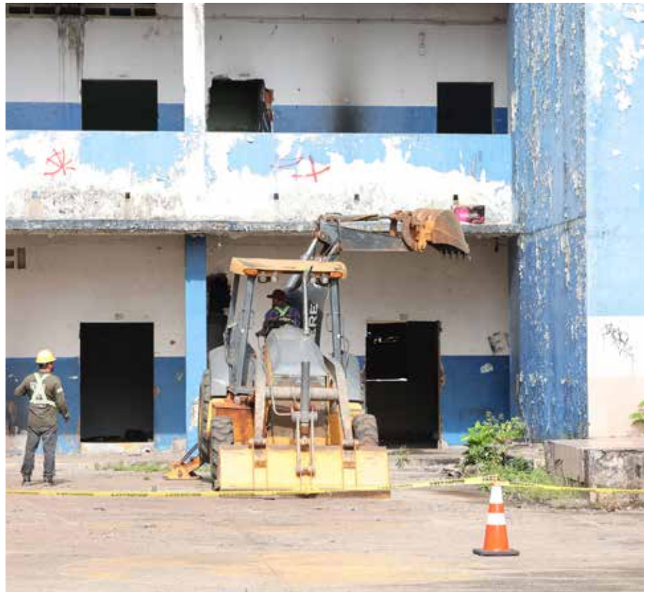
El Ministerio de Educación recibió por parte del contratista, los diseños de la obra.

El Ministerio de Educación (Meduca) iniciará la construcción de la Escuela República de Venezuela y el Instituto Comercial Bolívar, durante los primeros días de agosto, cuya inversión alcanza los B/.19.1 millones. El lugar donde estará situado el colegio está cercano al mar, por lo que fue necesario realizar evaluaciones técnicas para garantizar su construcción de una manera segura. El contratista tenía cuatro meses para entregar los diseños y ya fueron recibidos en el Meduca. Se analizaron las fundaciones y las estructuras, a fin de dar la instrucción para el inicio de labores. Las nuevas instalaciones de la Escuela República de Venezuela tendrán 28 aulas teóricas, seis laboratorios, biblioteca, aula máxima y área polideportiva. El Instituto Comercial Bolívar, que ocupa otra parte de la construcción, tendrá 24 aulas teóricas, ocho por cada nivel, 16 laboratorios, biblioteca, aula máxima, además de otras facilidades.