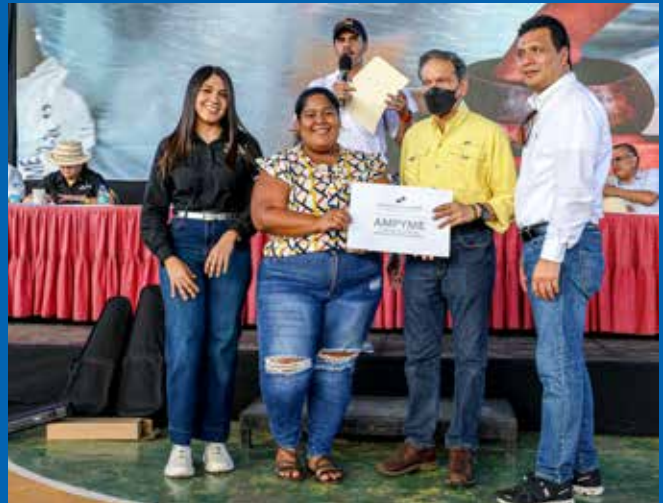
EMPRENDEDORES RECIBIERON CAPITAL SEMILLA.