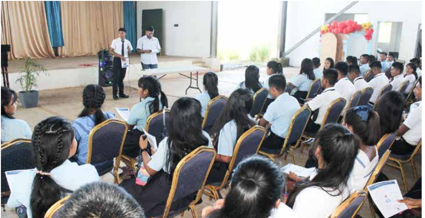
Estudiantes del Centro Educativo Bilingüe de Cerro Puerco recibieron orientación sobre las carreras que demanda el mercado laboral.