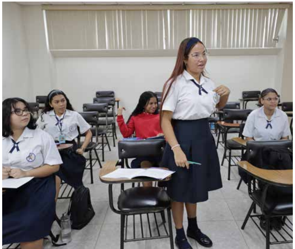
Las mesas de transformación, que organizan las fundaciones Panamá Lidera y Maxwell, en coordinación con el Meduca, permiten que los grupos creen una comunidad unida en la que se apoyen y animen unos a otros.

Más de 80 mil estudiantes de colegios secundarios del país participan en las mesas de transformación que organizan las fundaciones Panamá Lidera y Maxwell, en coordinación con el Ministerio de Educación, con el propósito de promover entre los alumnos los valores universales. Las mesas de transformación son métodos de enseñanza de valores y autoliderazgo, que convocan en espacios semanales a estudiantes