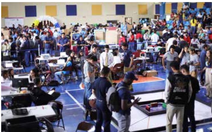
Esta fase concluye el 11 de agosto.

La decimoquinta competencia regional se desarrollará el jueves 3 de agosto en el Thomas Jefferson School, ubicado en Panamá Este.