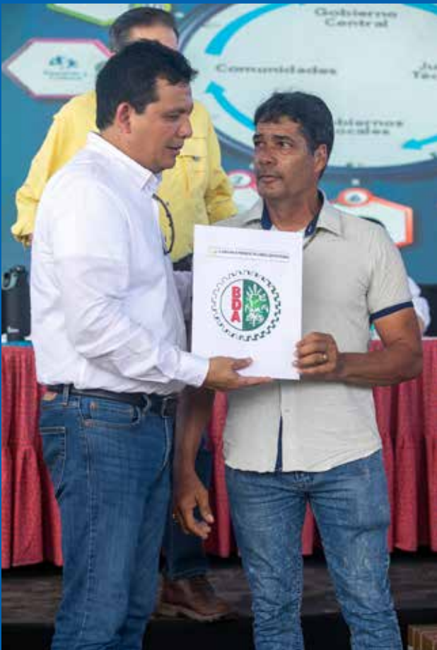
DEL PROGRAMA AGRO SOLIDARIO SE OTORGÓ BENEFICIOS POR B/.130,900.00.