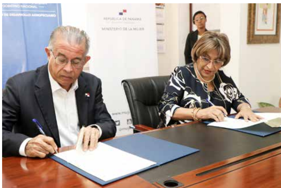
Correspondió al ministro Augusto Valderrama y a la ministra Juana Herrera rubricar su firma en el acuerdo.

Se coordinará el desarrollo de proyectos especiales, estrategias y acciones encaminadas a promover la formación y fortalecimiento de capacidades de las mujeres, con el fin de impulsar su autonomía económica y su integración al desarrollo del país.