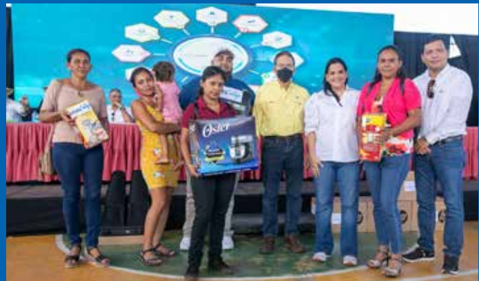
INSUMOS PARA MUJERES EMPRENDEDORAS.