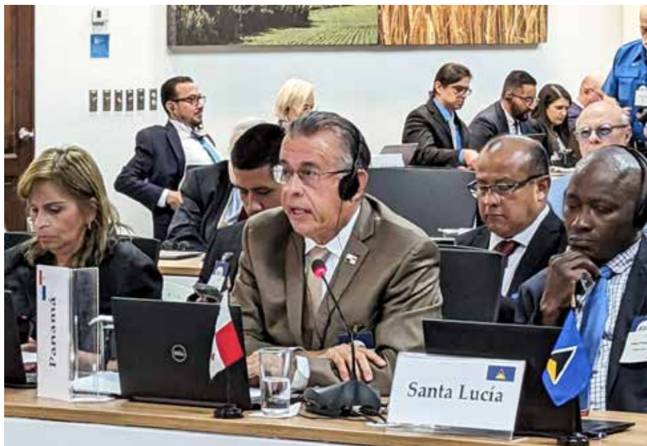
Panamá cuenta con el apoyo del IICA en la creación del Centro de Alta Tecnología para la Producción y Agricultura Controlada que tendrá tres sedes en el país.