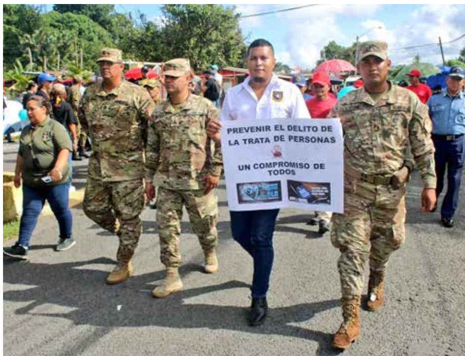
Las autoridades panameñas han rescatado este año a 13 víctimas de trata de personas.

Binacional, en conmemoración del Día Mundial contra la Trata de Personas, realizada en Paso Canoas, en el área fronteriza con Costa Rica. Las acciones de sensibilización que realiza la Comisión Permanente para la Protección y Asistencia a Migrantes en Condiciones de Vulnerabilidad está integrada por instituciones panameñas y costarricenses. La actividad empezó en el lado panameño y luego la delegación se movilizó hacia territorio costarricense, para recorrer un tramo de unos dos kilómetros. Como parte del evento, se desarrolló un acto protocolar con la participación de la subsecretaria general de la Comisión Nacional contra la Trata de Personas del Minseg, Auriela Martínez, quien habló en nombre del ministro de Seguridad Pública, Juan Manuel Pino, sobre el trabajo que realiza Panamá para combatir a las organizaciones criminales que se dedican a este flagelo. Martínez informó que, durante la actual administración del presidente de la República, Laurentino Cortizo Cohen, se ha rescatado a más de 60 víctimas de trata de personas, la mayoría, menores de edad.