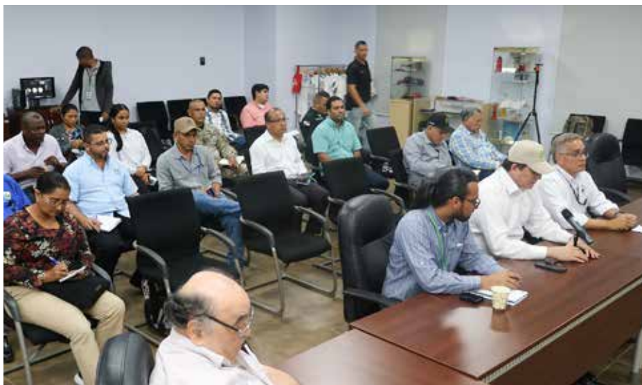
Aspectos de la reunión de coordinación en COPEG.