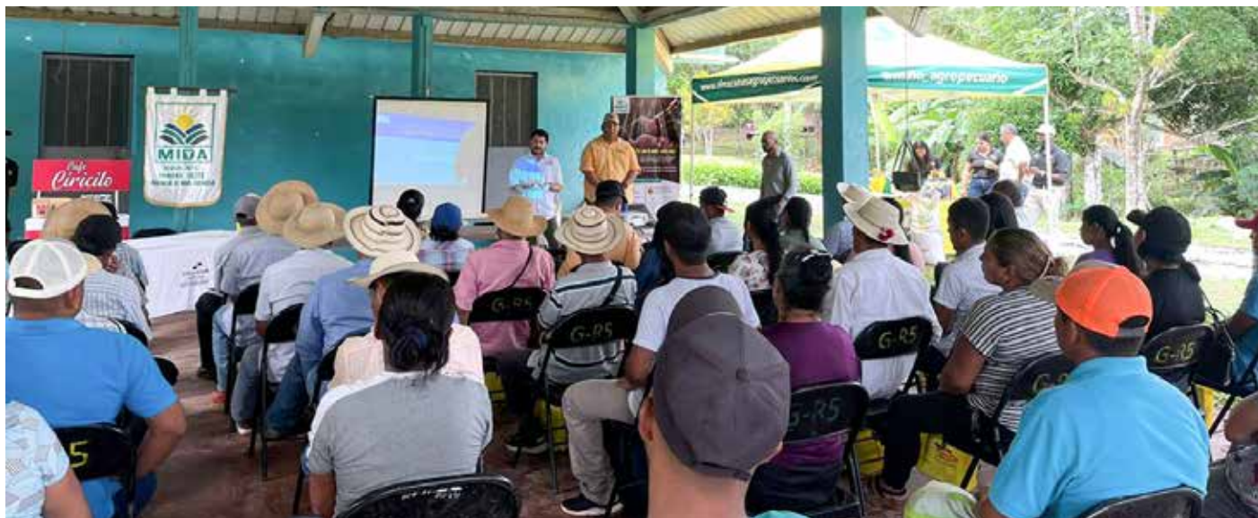
Acto de cierre de la jornada de capacitación realizado en las instalaciones del MIDA en Capira.