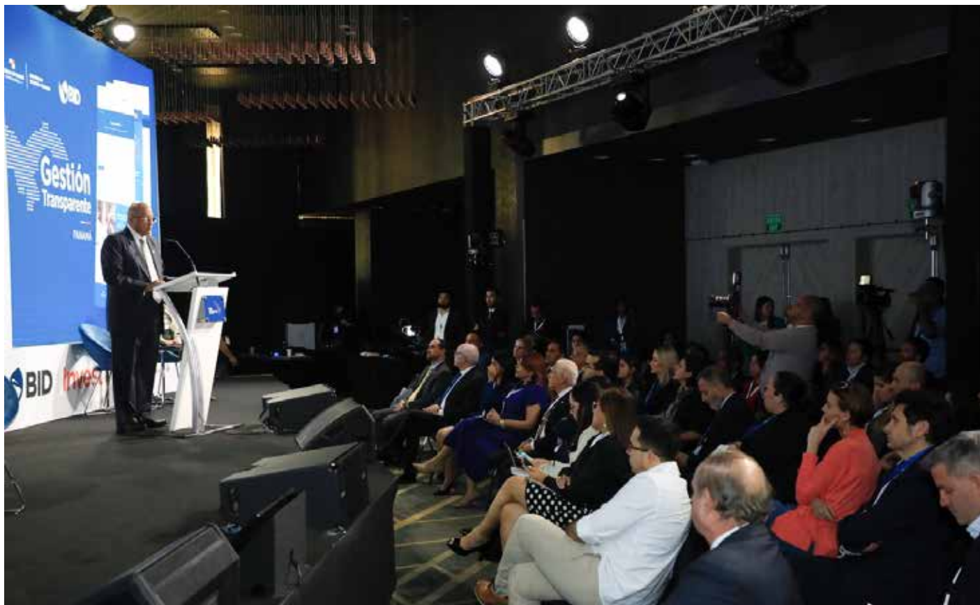
El ministro Héctor Alexander explica los beneficios que ofrece el Mapa de Inversiones.