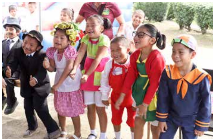
En Bonyic se desarrolló una feria interinstitucional con entrega de beneficios.