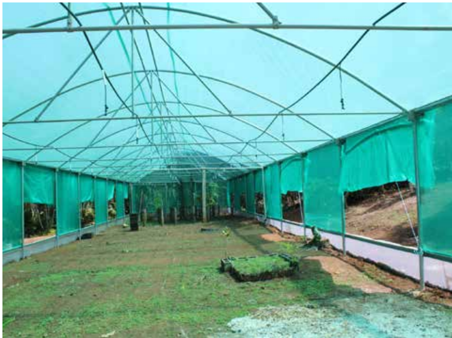
De esta manera, MiAmbiente contribuye al Programa Graduandos en Pro de la Reforestación en Panamá en el área oeste.