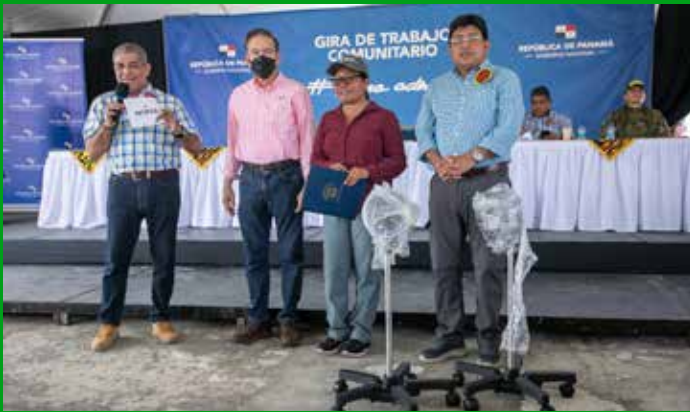
EQUIPOS DE DESINFECCIÓN, INSUMOS Y TUBERÍAS PARA ACUEDUCTOS RURALES.