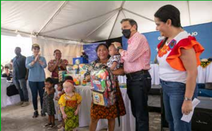
KITS PARA LA PRIMERA INFANCIA.