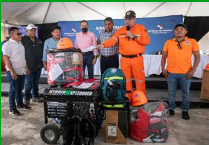
INSUMOS PARA PROTECCIÓN CIVIL.

COMUNIDADES: NARGANÁ, ALIGANDÍ Y MADUGANDÍ.