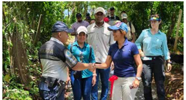
Autoridades y miembros de la comunidad recorrieron el sendero.

en atención a la Meta 2 del Plan Maestro, denominado "Por un Panamá más competitivo", específicamente la estrategia "Mejora de infraestructuras turísticas".