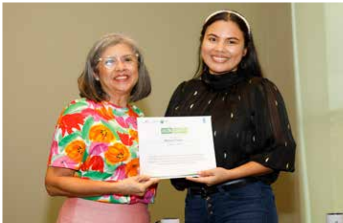
La octava versión de la Academia ya está en marcha.