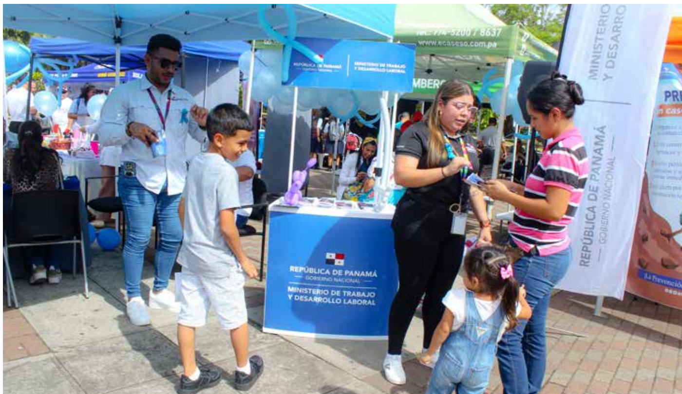
En conmemoración del día de la lucha contra este flagelo, el Mitradel brindó información sobre este grave delito.

El comercio de personas es una grave violación de los derechos humanos.