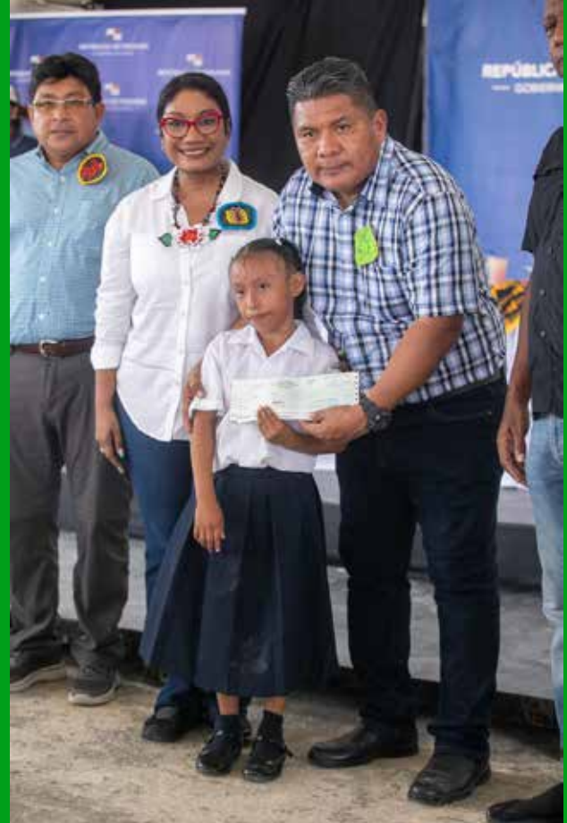
BECAS PARA ERRADICAR EL TRABAJO INFANTIL.