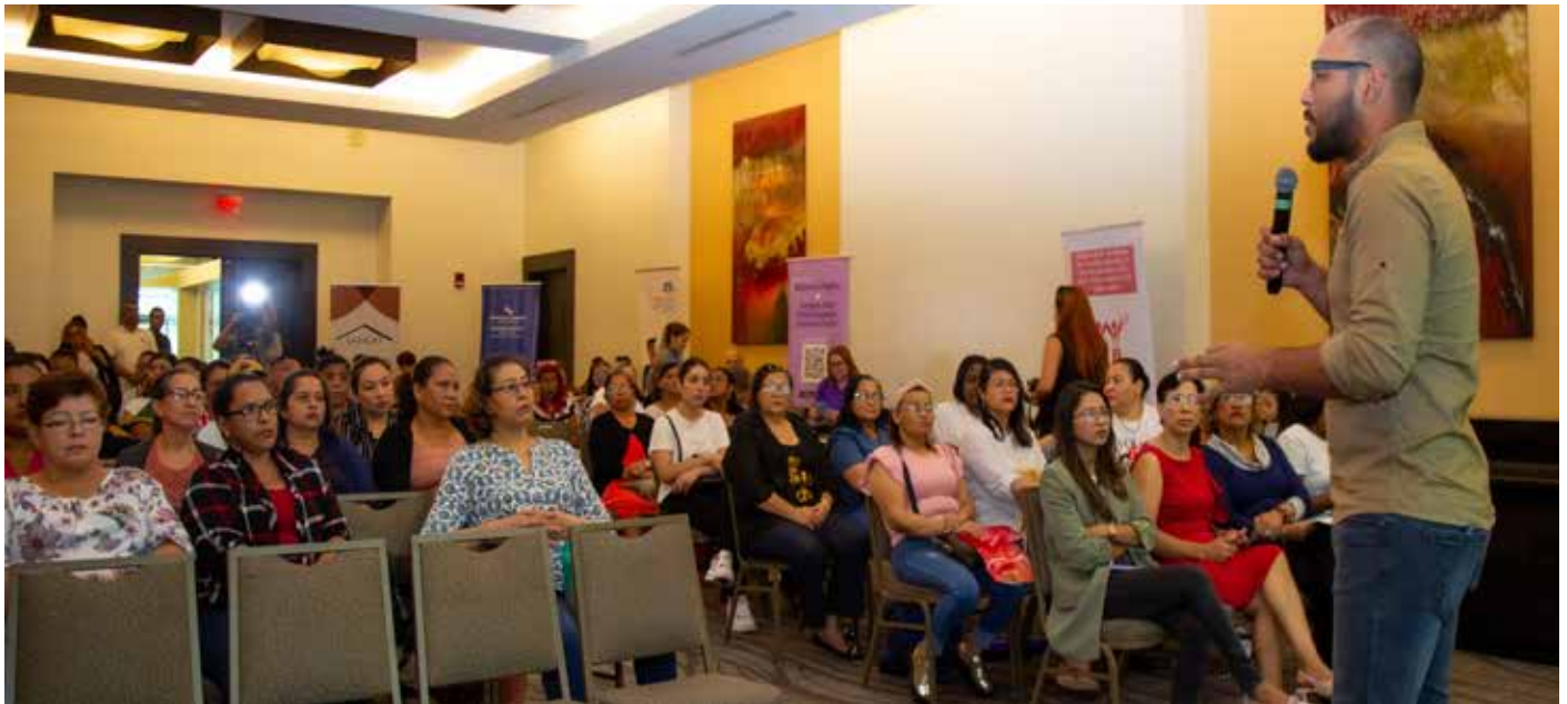
La Dirección de Empleo del Mitradel llevó a cabo un taller dirigido a trabajadores de este sector.

Durante el entrenamiento se abordaron temas como la comunicación efectiva, afiliación al seguro social, contratos de trabajo, cuidados en la limpieza y loncheras saludables.