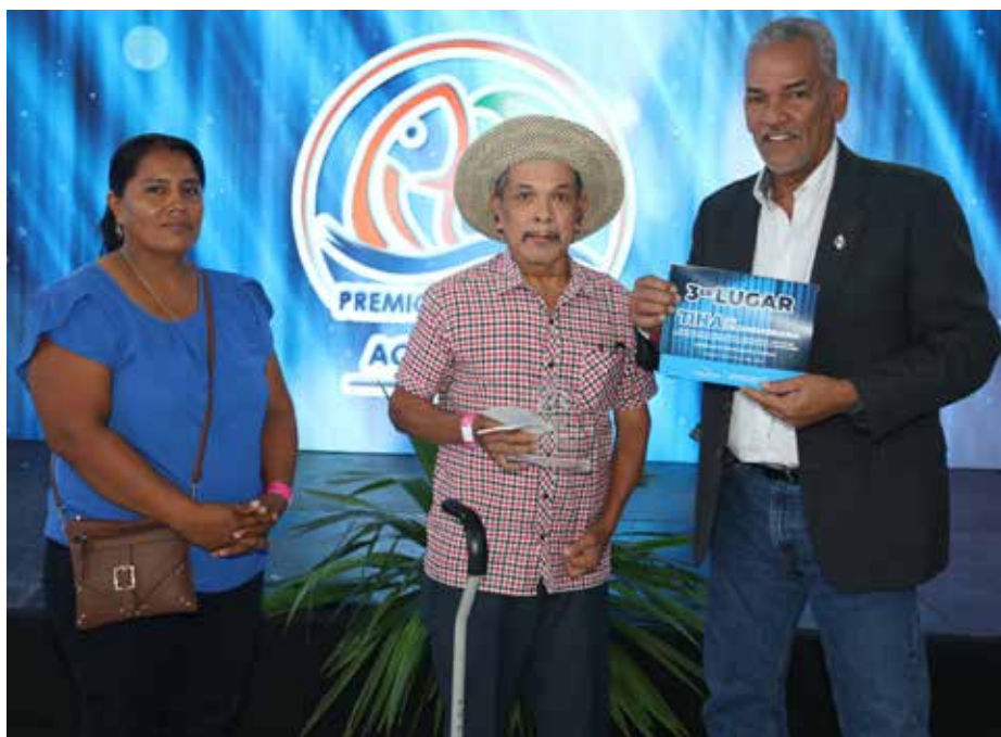
La ARAP entregó reconocimiento también al resto de los pescadores y acuicultores nominados.

El Día del Pescador se conmemoró el 16 de julio.