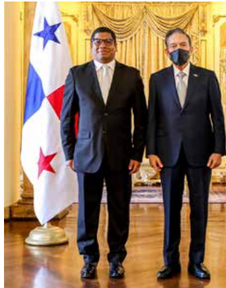
V́ctor Manuel Cairo Palomo, embajador de la Reṕblica de Cuba.