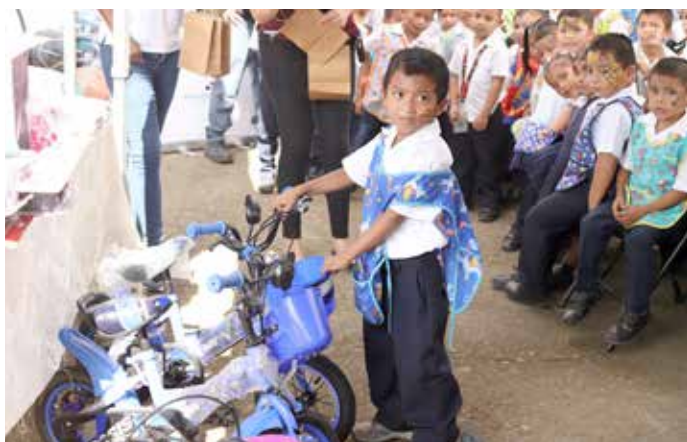
En la comunidad de San San se realizó una fiesta para más de 250 niños.

El objetivo es ir cerrando las brechas sociales y económicas de la pobreza y la desigualdad, en favor de las personas que viven en condiciones de pobreza multidimensional o en estado de vulnerabilidad social.