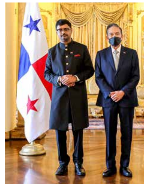
Sumit Seth, embajador de la Reṕblica de la India.