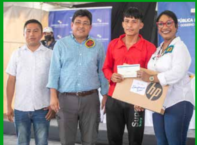
ENTREGA DE 'LAPTOPS', 'TABLETS' Y BECAS.