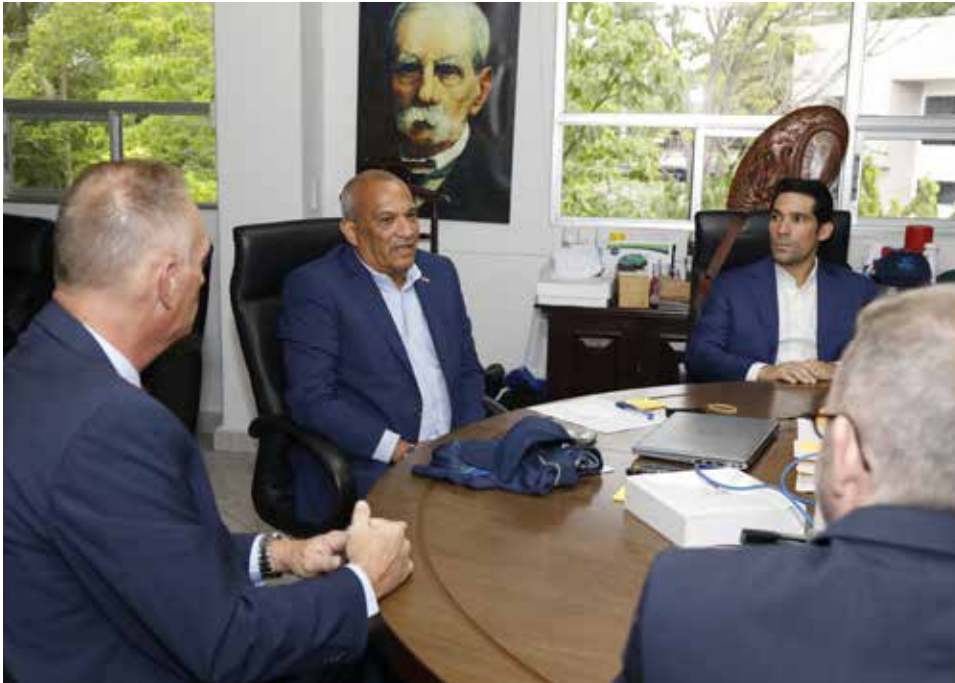
Naciones Unidas aprobó la celebración de cuatro reuniones en 2023, en preparación para la Cumbre de Cambio Climático (COP28), que será en Dubái.