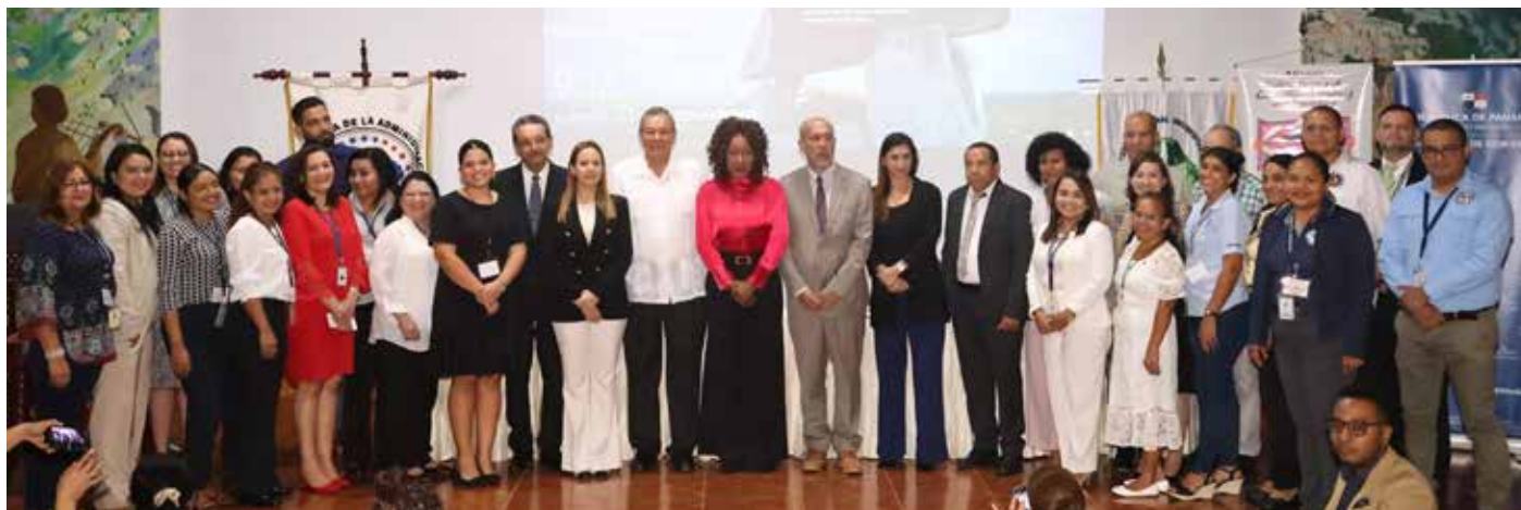
La jornada incluyó un taller de Aplicabilidad de los Círculos de Paz en la Resolución de Conflictos.