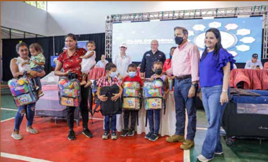
SE OTORGATON KIT CONTIGO EN LA PRIMERA INFANCIA POR B/. 6,720.00.