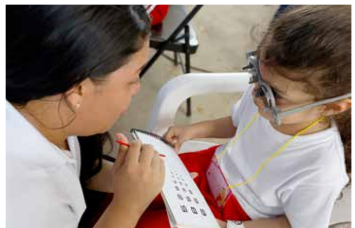
Las clínicas móviles Salud Sobre Ruedas brindaron atención especializada.