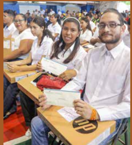
ESTUDIANTES OBTUVIERON BECAS, "LAPTOPS" Y TABLETAS.