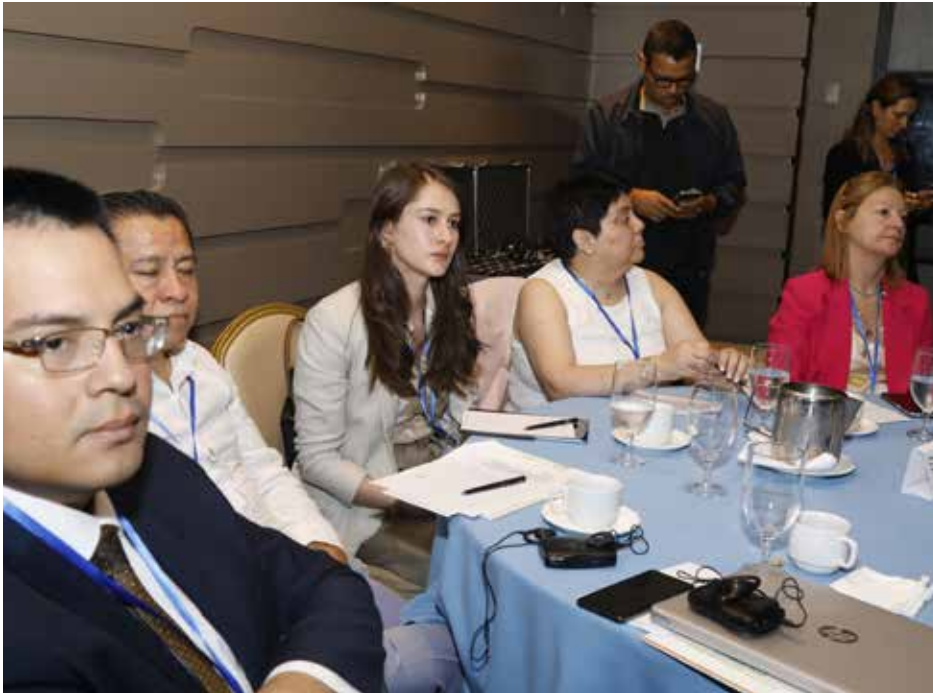
La Conferencia se desarrolló del 25 al 26 de septiembre de 2023, con la participación de representantes de derecho ambiental de América Latina y el Caribe.

las posibles acciones jurídicas, políticas y comunitarias para transformar los principios del derecho ambiental en práctica. De igual manera, se abordaron las vías para fortalecer el trabajo en colaboración y la creación de redes entre las partes interesadas, incluidas las clínicas de derecho ambiental y la creación de una plataforma regional de docentes de derecho ambiental. El ministro de Ambiente, Milciades Concepción, manifestó que es necesario prestar atención al derecho ambiental como la herramienta que va a garantizar la sostenibilidad del uso de los recursos, al contener las normas que regulan el comportamiento humano, y conocimientos que provienen de otras ciencias ambientales no jurídicas.