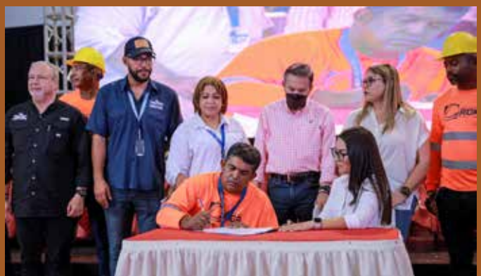
FIRMA DE CONTRATO PARA LA INSERCIÓN LABORAL.

COMUNIDADES: PENONOMÉ, ANTÓN, LA PINTADA, NATÁ Y OLÁ.