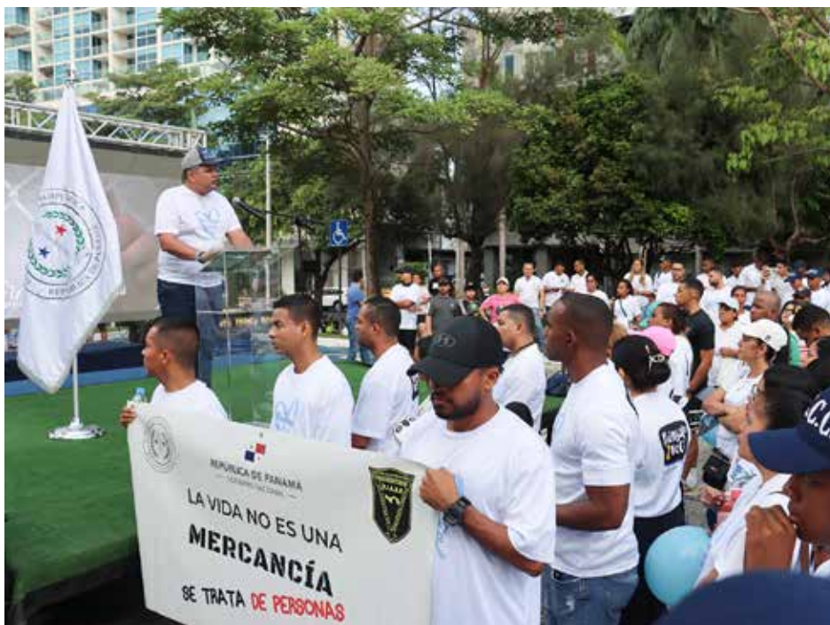
Los participantes portaban pancartas alusivas al combate de este delito, una acción que se une a otras de conciencia social que se realizaron durante el mes de septiembre.