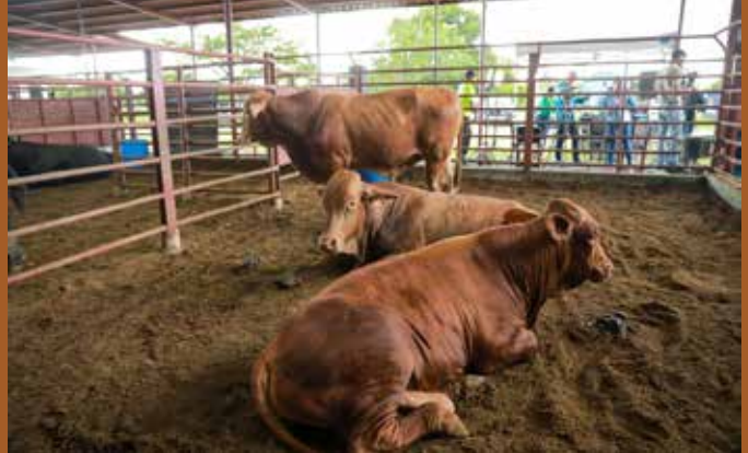
SE ENTREGARON 14 SEMENTALES A GANADEROS POR UN MONTO DE B/. 38,500.00.