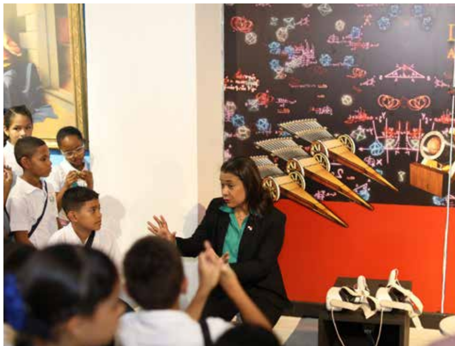
Los pequeños mostraron su regocijo por haber disfrutado de esta experiencia.

Cerca de 60 estudiantes de 5° y 6° grado de las escuelas primarias del Casco Antiguo fueron invitados por el Ministerio de Cultura (MiCultura) para conocer más sobre la vida de uno de los genios artísticos más imponentes de la historia del arte, en la exposición "Da Vinci: Il Genio", que estuvo en el centro comercial Albbrook Mall. Los alumnos, que pertenecen a las escuelas Simón Bolívar, Estados Unidos de América, República de México y Manuel José Hurtado, estuvieron fascinados con las impresionantes réplicas de las pinturas más emblemáticas del artista italiano, sus inventos y en especial la "Mona Lisa" y "La Última Cena". Los niños iniciaron el recorrido en una primera