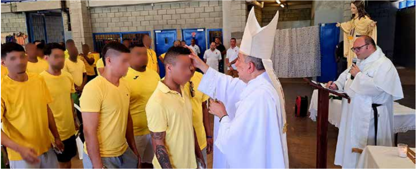
Los privados de libertad entregaron a monseñor José Domingo Ulloa artesanías confeccionadas con material reciclado.

Se bautizaron 14 privados de libertad; 56 hicieron su primera comunión y 64, la confirmación.