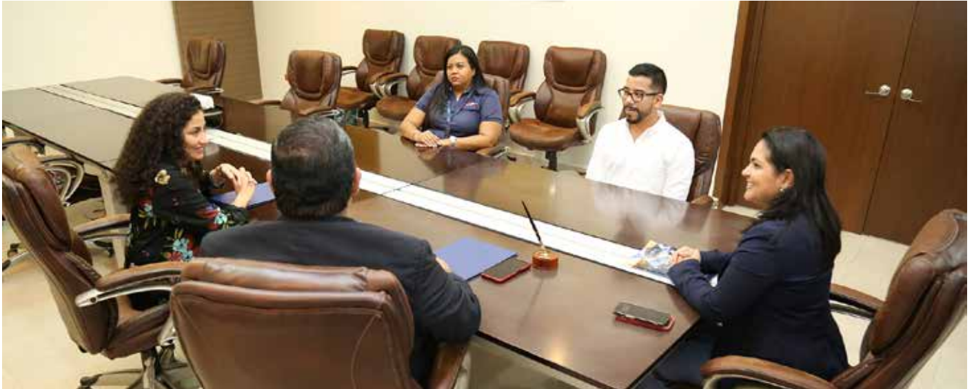
La directora de la Autoridad Nacional de Aduanas, Tayra Barsallo se reúne con equipos técnicos del programa operador económico autorizado (OEA).

Con miras a lograr la firma de un acuerdo de reconocimiento mutuo que permitirá establecer una cultura de seguridad en la cadena logística a través de la figura de operador