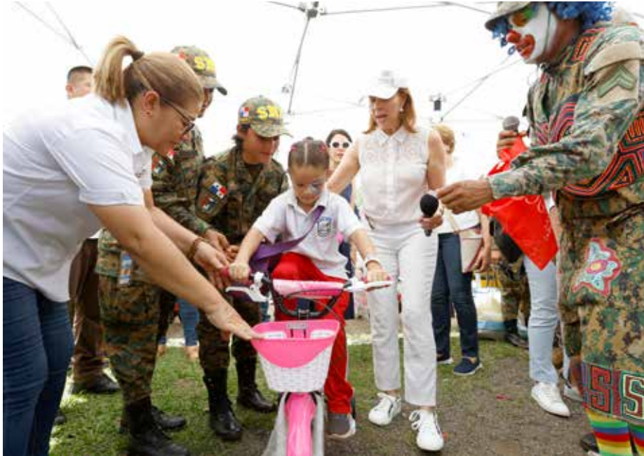
Unas 20 instituciones participaron en la feria integral

Es la sexta feria que realiza el Despacho de la Primera Dama en lo que va del año, para dar cobertura a 17 mil personas de Panamá Norte, San Miguelito, Chepo, La Chorrera, Darién y Santiago.