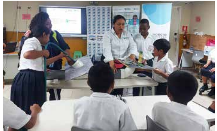
Estudiantes del CEBG El Limón y del Centro Educativo Koskuna participan en la capacitación.