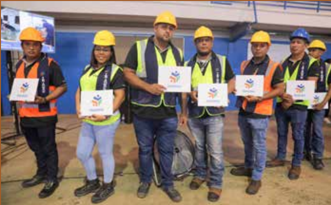
NUEVOS PROFESIONALES RECIBIERON CERTIFICACIÓN EN CARRERAS TÉCNICAS.