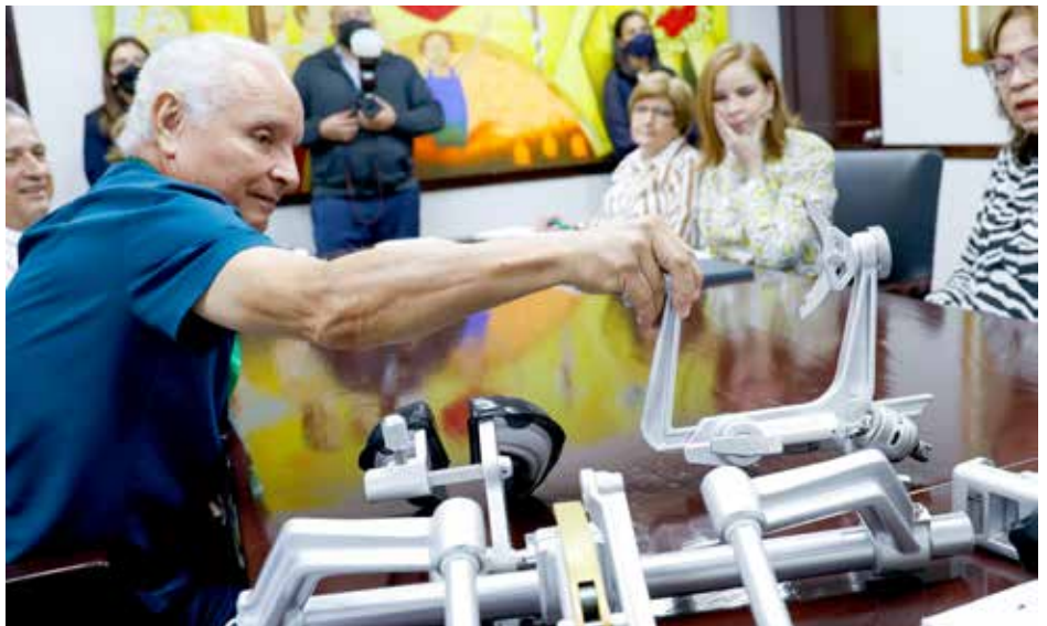
Este dispositivo garantiza precisión y seguridad en las cirugías cerebrales que se realizan en el Hospital del Niño.

El Ministerio de la Presidencia, a través del Despacho de la Primera Dama de la República de Panamá, liderado por Yazmín Colón de Cortizo, entregó al Hospital del Niño Dr. José Renán Esquivel un sistema de fijación craneal y retracción cerebral que puede mejorar significativamente la seguridad y la eficacia de las intervenciones neuroquirúrgicas en pacientes pediátricos. La primera dama destacó que, con esta donación, el Despacho sigue enfocado en ayudar a mejorar la seguridad y la calidad de la atención médica que brinda el servicio de neurocirugía del Hospital del Niño a los pacientes