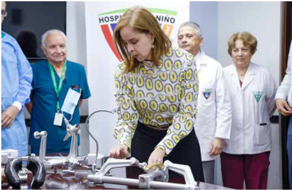
Se entregó un sistema de fijación craneal y retracción cerebral para intervenciones quirúrgicas.