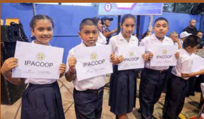
ASISTENCIA SOCIAL EDUCATIVA PARA HIJOS DE COOPERATIVISTAS.