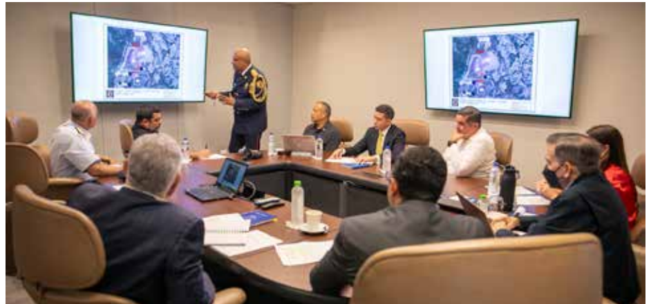
El presidente Cortizo Cohen instó al equipo a seguir trabajando sin bajar la guardia ni escatimar esfuerzo para el control total de este incendio.