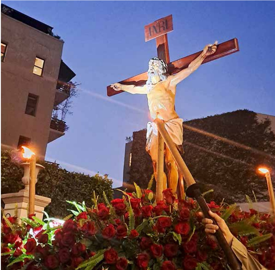
Las actividades se iniciaron el viernes 22 de marzo con el Viernes de Dolores y culminan el domingo 31 de marzo con la conmemoración de la Resurrección de Jesús.

Con el fin de que los nacionales y extranjeros vivan una gran experiencia cultural-religiosa durante la conmemoración de la Semana Santa 2024, en el Casco Antiguo, el ministerio de Cultura (MiCultura) a través de la Oficina del Casco Antiguo (OCA), estableció un comité integrado por la comisión de la Iglesia Católica encargada de las actividades y miembros de los estamentos de seguridad, para trazar una hoja de ruta que garantice la seguridad y el disfrute de los visitantes del Centro Histórico durante esta festividad. Uno de los aspectos a resaltar este año es el gran trabajo artesanal y artístico detrás de esta fiesta, la cual contempla la confección de las andas procesionales, la colocación de las flores, la decoración de los altares, la gastronomía, las técnicas y conocimientos para la indumentaria, la música de culto, músicos, florista y todo el ecosistema que hace de la Semana Santa, un evento de diversidad cultural, cohesión social que fortalece la identidad de las distintas regiones del país y destaca la cultura, identidad y patrimonio regional. El domingo de resurrección será dedicado a los niños con una procesión especialmente para ellos, con la participación en su mayoría de niños del corregimiento de San Felipe. Cabe señalar que la programación iniciará el 22 de marzo con el viernes de dolores, desde las 7:00 p.m., y culminará el domingo 31 de marzo en el que se conmemora la resurrección de Jesús.