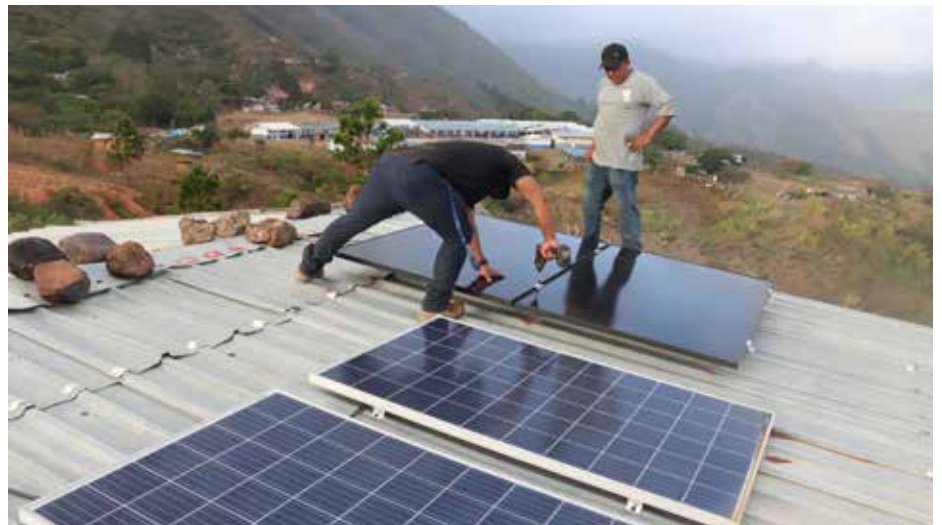
Técnicos de COOPEHGAS, R.L. trabajan en la instalación de paneles solares en la Cooperativa de Producción Productores de Café y Agricultura Orgánica, R.L. de la comarca Ngäbe Buglé.

En continuación con el proyecto de paneles solares que lleva adelante el Instituto Panameño Autónomo Cooperativo (IPACOOOP), en alianza con la Cooperativa de Servicios Múltiples Profesionales en Energía, Hidrocarburos y Gas de Panamá, R.L. (COOPEHGAS, R.L.) fueron instalados paneles solares en la Cooperativa César Pardo, R.L. y en la Cooperativa Raíces del Sombrero Pintado, R.L., en la provincia de Coclé y en la Cooperativa de Producción Productores de Café y Agricultura Orgánica, R.L. de la comarca Ngäbe Buglé. La cooperativa César Pardo, R.L. está ubicada en la comunidad de Boca de Tolú, en el corregimiento de Boca de Tocúe, distrito de Penonomé; la Cooperativa Raíces del Sombrero Pintado, R.L., tiene su centro de operaciones en la comunidad de Limón, corregimiento de Las Minas, distrito de Penonomé y la Cooperativa de Producción Productores de Café y Agricultura Orgánica, R.L. opera en el corregimiento de Guabito, distrito de Nürüm, comarca Ngäbe Buglé. Se trata de un proyecto que beneficiará a 10 cooperativas, localizadas en áreas de difícil acceso y donde no se cuenta con energía eléctrica. Estas cooperativas dispondrán de un congelador que les permitirá incursionar en nuevos negocios para generar ingresos, al igual que realizar trabajos y reuniones en horas de la noche, entre otras actividades. El director ejecutivo del IPACOOOP, Edwin Navarro, señaló que es