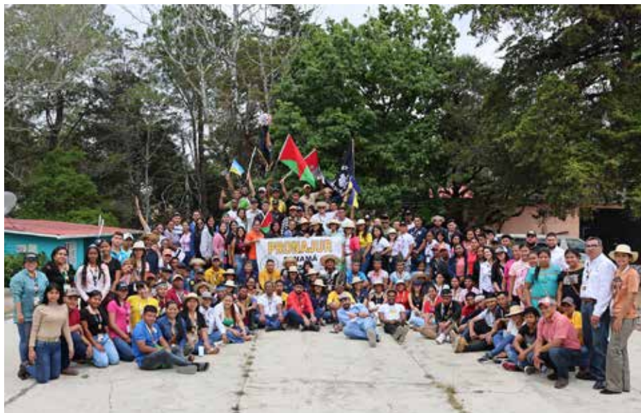
Jóvenes de todo el país participaron del Encuentro.

Con grandes retos y compromisos para lograr la sostenibilidad en el sector agropecuario y la mitigación del cambio climático con miras a fortalecer la producción de alimentos para garantizar la seguridad alimentaria del país, culminó el II Encuentro Nacional de Juventud Rural. El evento que reunió a 200 jóvenes de todo el país, incluyendo las comarcas, fue coordinado por el Programa Nacional de Juventud Rural (PRONAJUR) con la colaboración de la Unidad Agroambiental del MIDA. Entre los objetivos está continuar incentivando a los jóvenes a través del conocimiento. Además reiterarles que el sector agropecuario es más que sembrar y cultivar sino también preservar y cuidar el medio ambiente. Youssef Sayad, director nacional de PRONAJUR dijo que con estas actividades se busca desarrollar en cada uno de los líderes de la juventud rural esa visión nueva que tiene que tener el