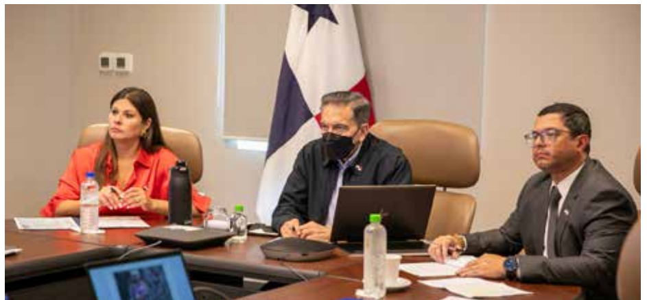
La Fuerza Aérea de Colombia envió dos aeronaves con 19 tripulantes para reforzar las operaciones de control del incendio.

esfuerzo para el control total de este incendio, además de que agradeció a Colombia por el apoyo brindado a Panamá en las tareas de extinción del fuego. El coronel De León indicó que el incendio comenzó el 11 de marzo pasado en cuatro puntos dentro del RSCP afectando un área de cerca de 10 hectáreas del vertedero. En tanto, el ministro