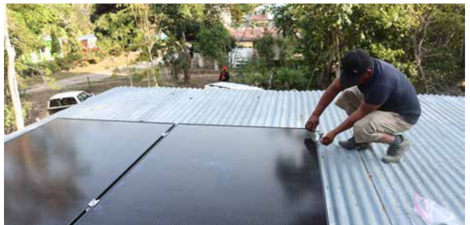
La Cooperativa César Pardo, R.L., ubicada en la comunidad de Boca de Tolú, en el corregimiento de Boca de Tocúe, distrito de Penonomé, es beneficiada con el proyecto de paneles solares.