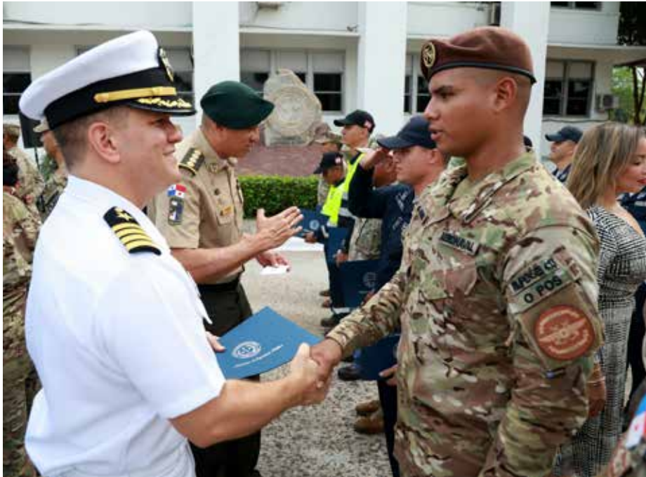
El Ministerio de Seguridad agradeció a Estados Unidos y a Colombia el apoyo ofrecido para la organización de estos entrenamientos y capacitaciones.

Este curso fortalece las operaciones y permite aplicar medidas adecuadas ante una emergencia marítima.