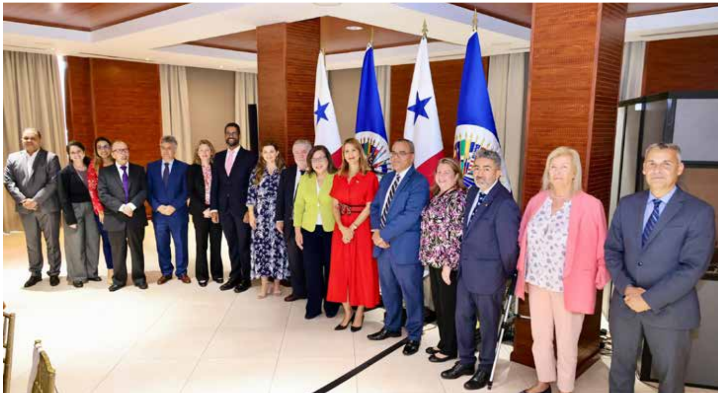
Participantes del 104° período ordinario de sesiones del Comité Jurídico Interamericano.