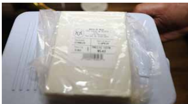
Queso de leche de búfalo

para la salud humana. Producto del esfuerzo de la organización bufalera y la entidad agropecuaria, ya se trajo por primera vez semen proveniente de Italia, lo que ayudará a mejorar la genéticamente del pie de cría. Por su parte, Hurtado, agradeció el apoyo del Ministerio de Desarrollo Agropecuario, para reforzar al crecimiento de la producción de búfalo en el país.