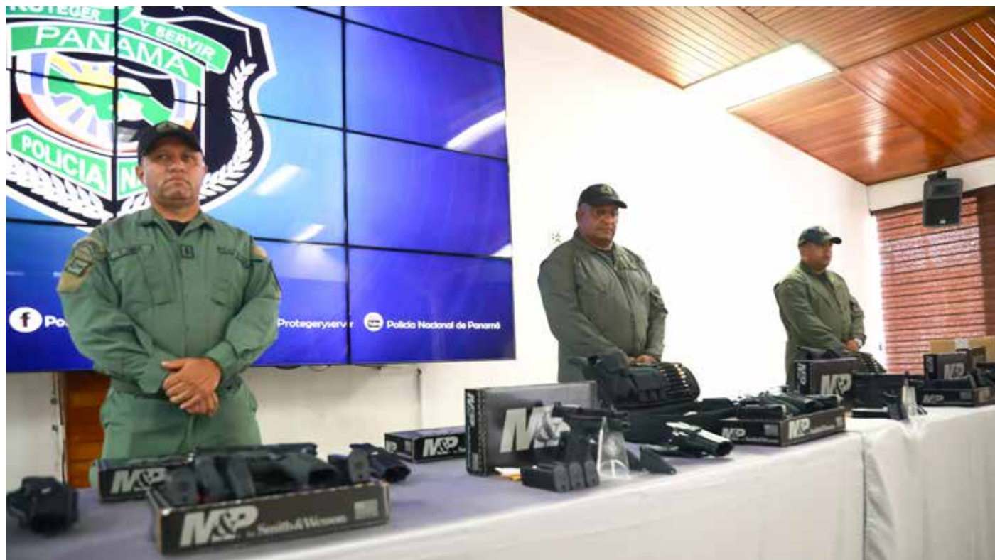
La entrega de las armas se realizó en la sede la Policía Nacional en Ancón.