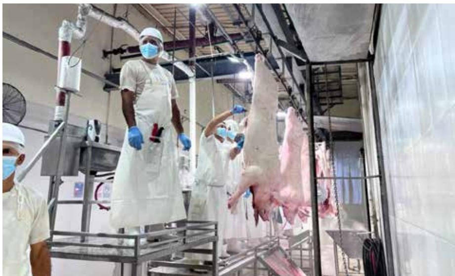
El sacrificio anual de cerdo es de 680,025 cabezas de animales con un rendimiento de 83.9 Kg por animal.

Con esta habilitación, Panamá suma durante esta administración diez plantas procesadoras aprobadas para exportar carne bovina, carne de pollo, productos acuáticos, aceite de pescado, harina de pescado y cerdo. La República de China dio el visto bueno a empresas panameñas para la exportación de productos tales como: carne bovina, carne