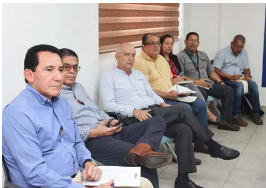
En la reunión participaron representantes de ANDIA, de Cuarentena Agropecuaria y del IDIAP.