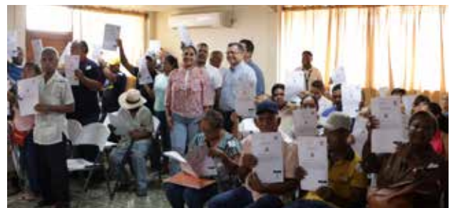
El subadministrador de la Anati presidió la jornada donde se entregaron las escrituras a 50 hogares.

destacó la titulación de ejidos municipales en todo el país, trabajando en conjunto con las autoridades locales en beneficio de panameños que han construido sus hogares en las tierras que finalmente reciben regularización. Las familias beneficiadas recalcaron la importancia de este día, con la obtención de sus títulos de propiedad que les brinda la seguridad sobre sus tierras y así proseguir este legado traspasando los terrenos a manos de sus herederos.