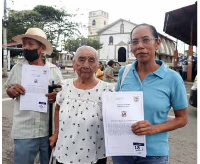
Las familias Vázquez y Santos, residentes en Chepo Cabecera, son oriundas del área.

En esta primera fase se midieron más de cien hectáreas de terreno, de los cuales el 50% no contaban con título de propiedad.