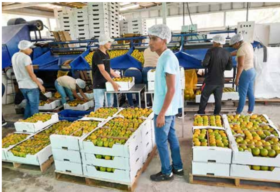
Los productores se encuentran muy motivados con el envío de las frutas coclesanas.

el cumplimiento de las normas fito y zoonosanitarias. Destacó que, para cumplir con las proyecciones de ocho contenedores mensuales de esta fruta, se cuenta con la asistencia que les brinda el Ministerio de Desarrollo Agropecuario (MIDA), a través de las direcciones de Sanidad Vegetal y de Agronegocios. Agro SI Consulting agradeció el apoyo crucial de la Dirección de Agronegocios con los clientes del agroexportador Caribowox, S.A.; y el productor de limones persas Tropical Fruit Growers, en Coclé. Dijeron que, a través de este apoyo, enviaron hacia la Unión Europea el pasado 25 de abril un contenedor con naranjas y 60 mil limones de la provincia de Coclé.