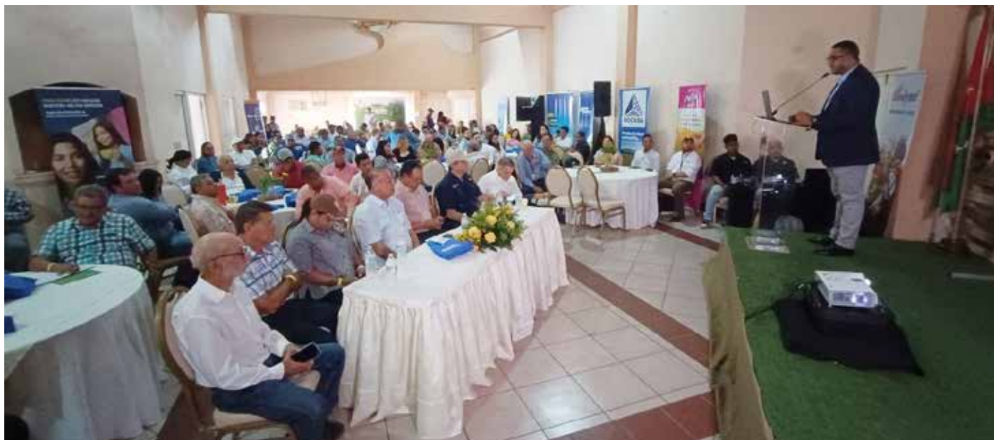
El titular del MIDA reiteró la importancia de la integración entre los actores del sector para lograr metas comunes.