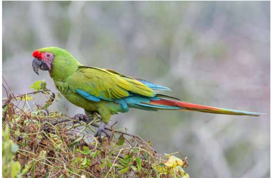
Esta especie está en peligro crítico de extinción y quedan menos de mil adultos en estado salvaje.

Más de 60 personas, entre estudiantes de la carrera de Biología del Centro Regional Universitario de Azuero (CRUA), voluntarios ambientales, funcionarios y docentes universitarios, participaron del conversatorio "Presencia del guacamayo verde en la península de Azuero". La gran guacamaya verde ("Ara ambiguus") es una de las especies de loros más reconocibles del mundo; son famosos por su belleza, inteligencia y carisma; sin embargo, debido a la reciente y rápida disminución de su número, necesitan ayuda. Al día de hoy, están clasificados como en peligro crítico de extinción y quedan menos de mil adultos en estado salvaje. El encuentro estuvo a cargo del doctor Luis Ureña, que a través del Proyecto Ara, centrado en la conservación de psitácidos neotropicales, ha trabajado con las comunidades locales en la sensibilización sobre la conservación de los bosques de Azuero para la sobrevivencia de esta especie. Ureña destacó la importancia de la conservación de árboles nativos, como cuipo, almendros de montaña y ceibos, utilizados en la anidación de las guacamayas que se encuentran en el Parque Nacional Cerro Hoya. El proyecto Ara incluye un programa de reforestación de estas especies,