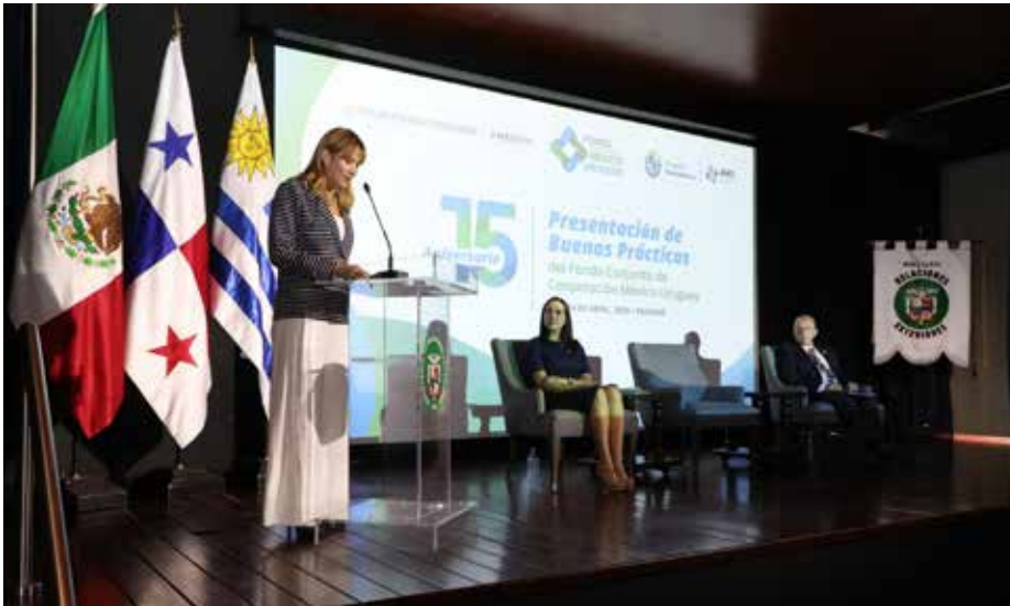
Participantes del evento “Presentación de Buenas Prácticas del Fondo Conjunto de Cooperación Uruguay - México”.

Se refuerza el rol del país como “hub de hubs”, esta vez como centro de la Cooperación Internacional, la Cooperación Triangular y la Cooperación Sur-Sur.