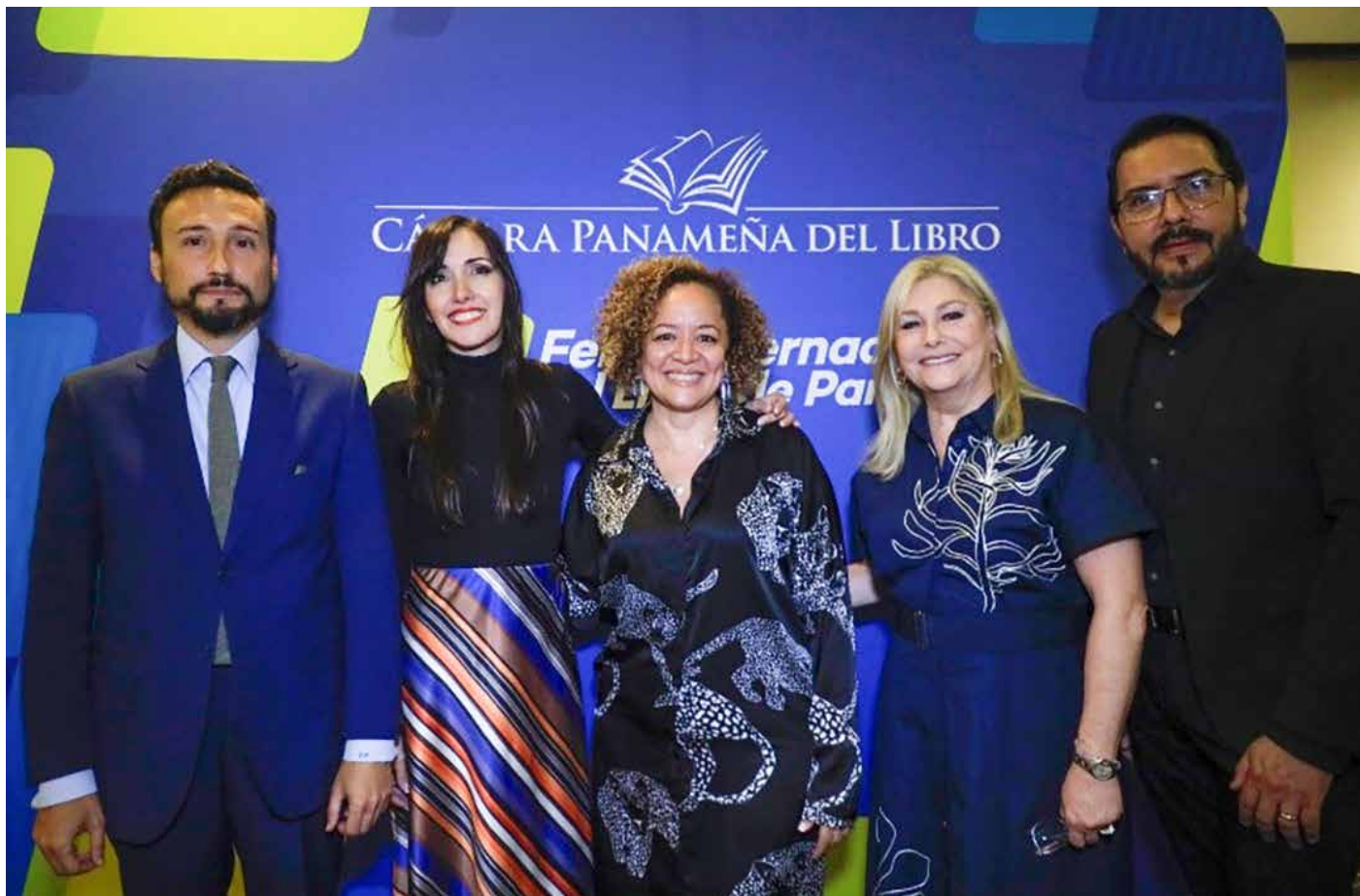
La edición de este año estará dedicada a España.