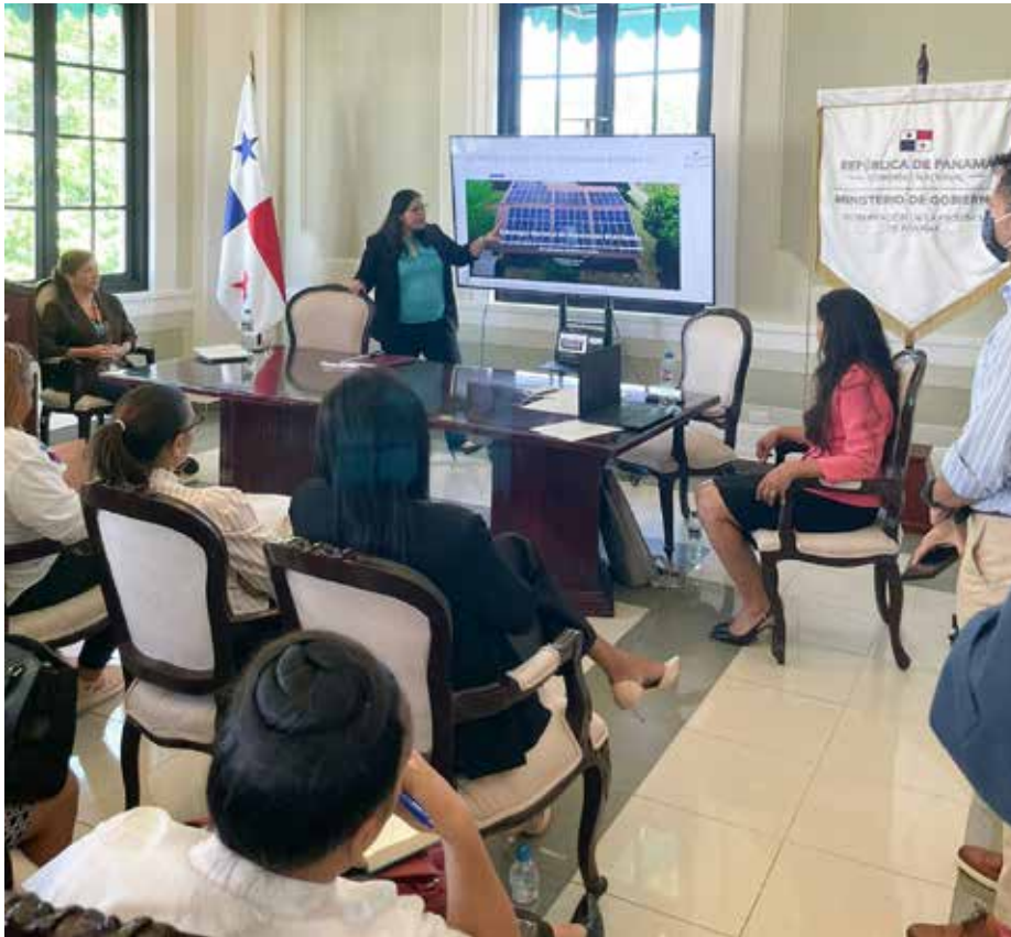
Se capacitó a 22 profesionales panameños del sector público y privado en la norma ISO 50002-06-15-46 y la Norma ISO 14067:2018 de huella de carbono.

Se actualizó la herramienta de aplicación del Reglamento de Edificación Sostenible, incorporando las nuevas medidas establecidas y en un formato más amigable.