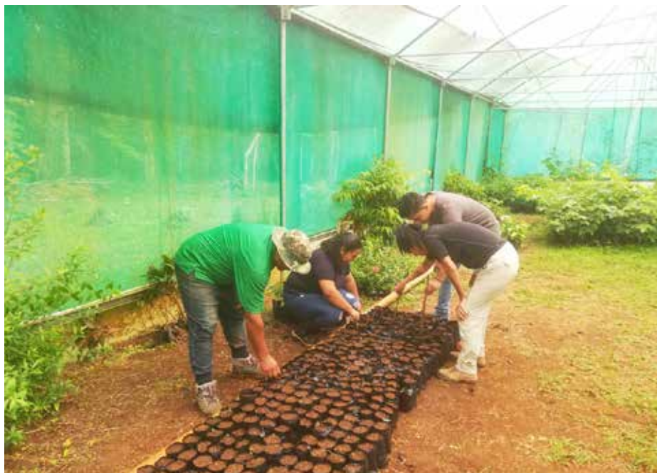
El cuidado en el vivero es vital para garantizar la supervivencia de los arbolitos.

Tras meses de arduo trabajo, el Ministerio de Ambiente (MiAmbiente), Regional de Panamá Oeste, está listo para iniciar las jornadas de reforestación una vez se regule la temporada de lluvia.