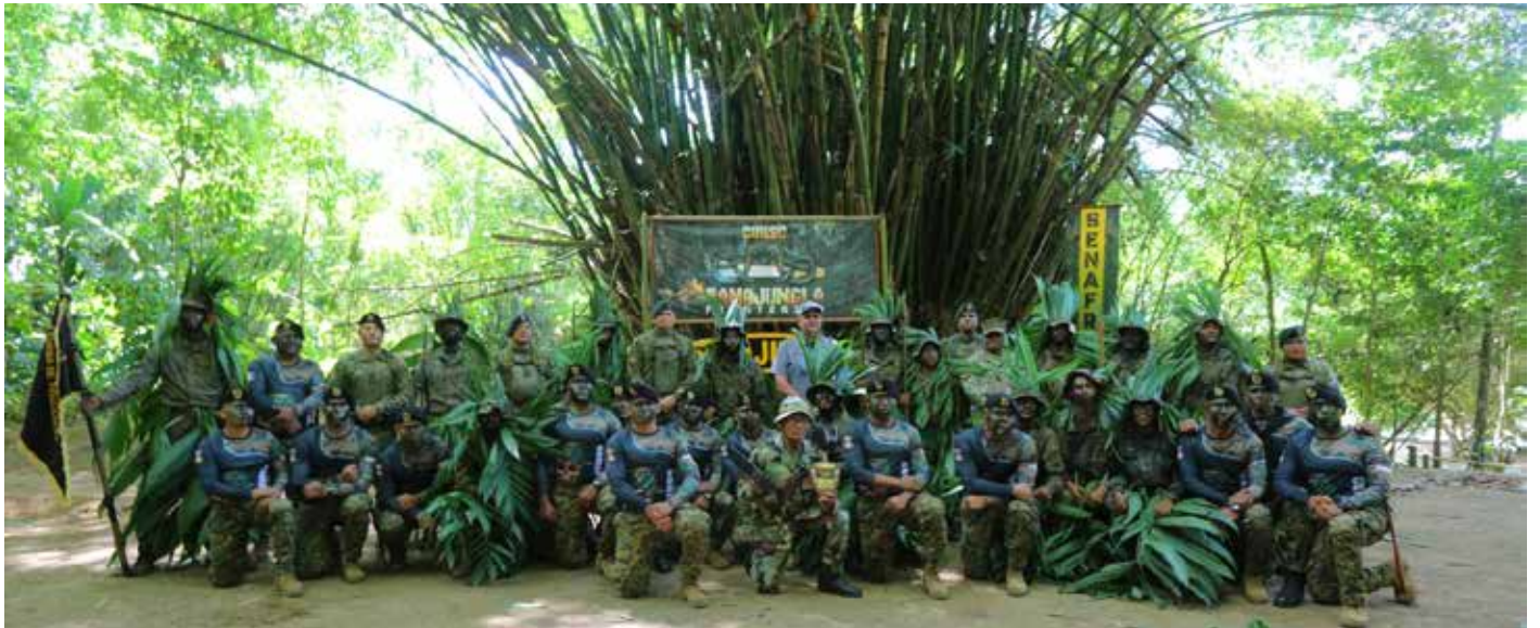
A los participantes se les entregó obsequios por su desempeño.